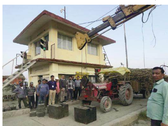
टांडा के त्रिवेणी चीनी मिल में मोबाइल वैन से कांटे की जांच कराते अधिकारी।