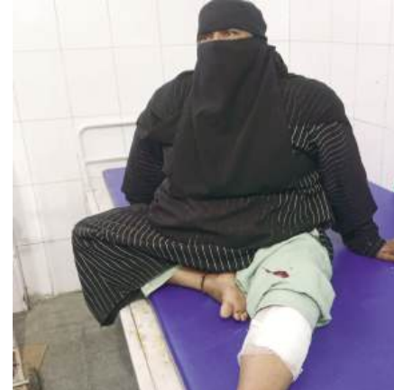
हादसे में घायल हुई महिला

हादसों में राहगीरों की भीड़ मौके पर जमा हो गई। जिसमें राहगीरों के द्वारा घायलों को उपचार के लिए सीएचसी शाहबाद भेजा गया। डॉक्टरों ने