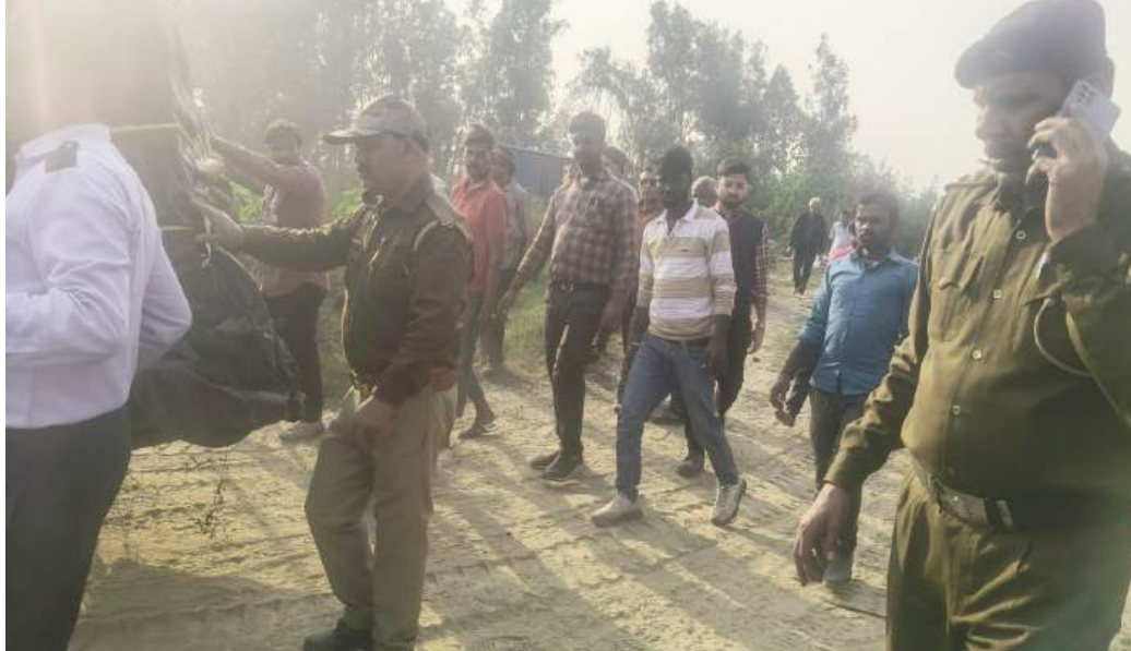
तेंदुआ को पकड़कर ले जाते कर्मचारी