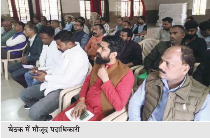
बैठक में मौजूद पदाधिकारी

हुई। जिलाधिकारी ने खंड विकास अधिकारी/कार्यक्रम अधिकारी, विकास खंड कोतवाली को निर्देश दिए हैं कि आरोपित ग्राम रोजगार सेवक के विरुद्ध फर्जी जांच कार्ड बनाने, अभिलेखों में कूटरचना, काल्पनिक नाम जोड़ने और सरकारी धन के गबन से संबंधित धाराओं में प्राथमिकी दर्ज कराना सुनिश्चित कराने का आदेश दिया। सहायक विकास अधिकारी (पंचायत) को निर्देशित किया गया है कि नियमानुसार ग्राम पंचायत की कार्यवाही कराकर आरोपी ग्राम रोजगार सेवक की सविदा समाप्त कराई जाए। जिला पंचायतराज अधिकारी को ग्राम पंचायत की बैठक शीघ्र आयोजित कराने के निर्देश दिए गए हैं। जिला कार्यक्रम अधिकारी को संबंधित आंगनवाड़ी सहायिका के विरुद्ध कठोर अनुशासनिक कार्रवाई तथा धनराशि की वसूली सुनिश्चित करने को कहा। जिलाधिकारी ने बताया कि यह प्रकरण गंभीर वित्तीय अनियमितता और पद के दुरुपयोग से संबंधित है। इसलिए सभी संबंधित अधिकारी तत्काल प्रभाव से नियमानुसार कार्रवाई सुनिश्चित करें।