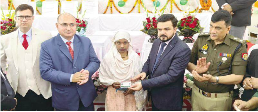
फोटो 16 महिला को आयुष्मान कार्ड देते डीएम