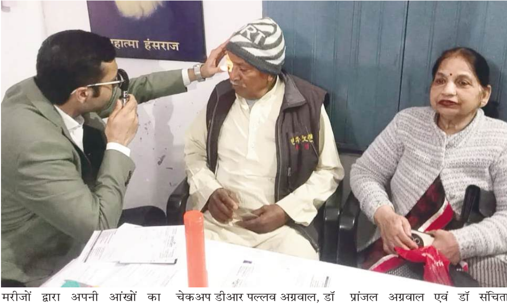
मरीजों द्वारा अपनी आंखों का चेकअप