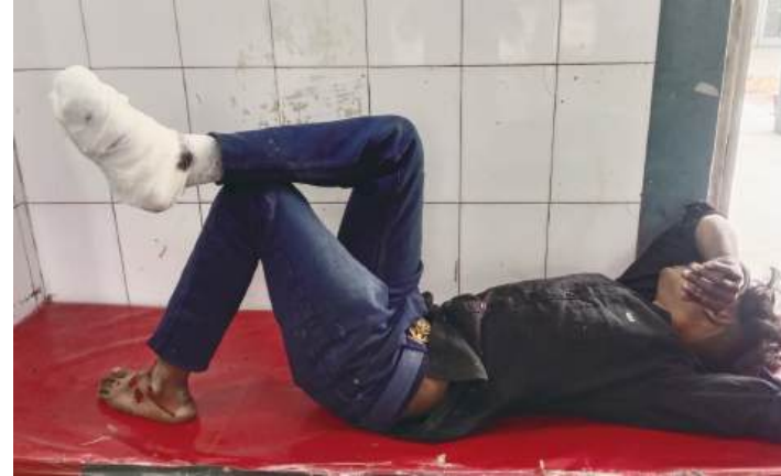
हादसे में घायल युवक अस्पताल में भर्ती