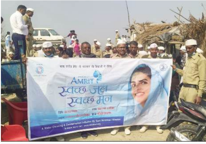
स्वच्छता अभियान में हिस्सा लेते पदाधिकारी