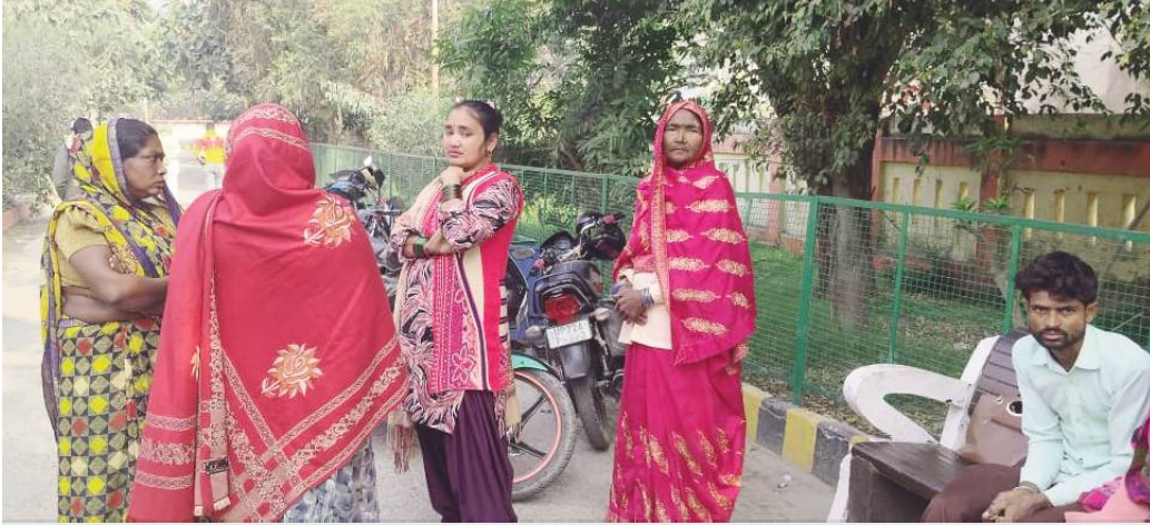
अस्पताल में बैठे परिजन

टक्कर इतनी भीषण थी कि ट्रैक्टर-ट्राली उसे कुछ दूरी तक रौंदते हुए ले गई। वारदात को अंजाम देने के बाद चालक ट्रैक्टर-ट्राली लेकर मौके से फरार हो गया। गंभीर रूप से