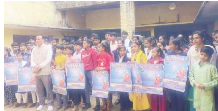
परीक्षा देने के बाद मौजूद छात्र-छात्राएं एवं पदाधिकारी।