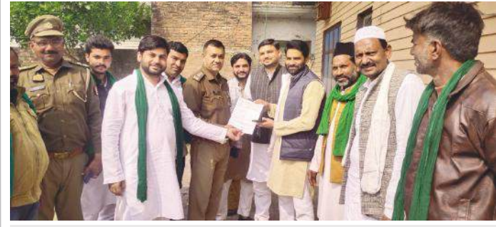
कोतवाल को ज्ञापन सौंपते भाकियू तोमर कार्यकर्ता