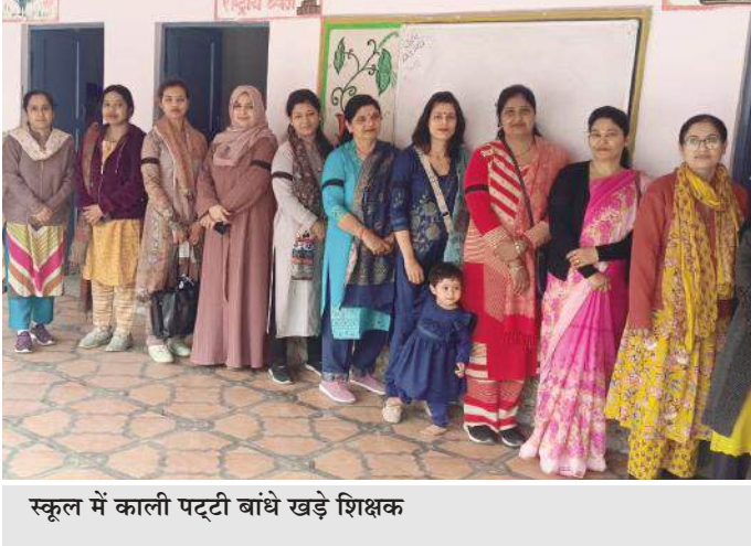
स्कूल में काली पट्टी बांधे खड़े शिक्षक