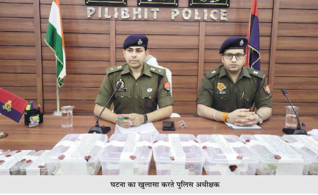
घटना का खुलासा करते पुलिस अधीक्षक