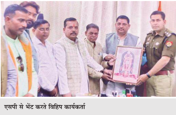
एसपी से भेंट करते विहिप कार्यकर्ता

उन्होंने विशेष रूप से कुछ केफे में बने बंद केबिनों तथा सामाजिक मर्यादाओं के विपरीत संभावित गतिविधियों पर चिंता व्यक्त की। उन्होंने कहा कि इस प्रकार की व्यवस्थाएं समाज के वातावरण को