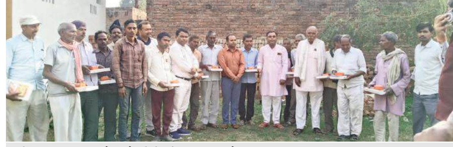
होली पर धमार बजाने वाले लोगों को पुरस्कृत करते हुए