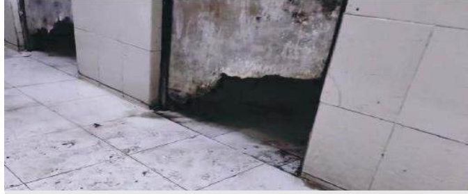
रैन बसेरा में महिला शौचालय के टूटे दरवाजे

मेडिकल कॉलेज की वास्तविक स्थिति और मरीजों को मिल रही सुविधाओं का जब जायजा लिया गया तो जो तस्वीरें सामने आईं वह बेहद ही शर्मनाक हैं। शासन की ओर से हर जिले के सरकारी अस्पताल में मरीजों के साथ आने वाले तीमारदारों के लिए रैन बसेरा बनवाए गए। तीमारदारों को टंड से बचाने और अस्पताल में अव्यवस्थाओं को रोकने की यह मंशा धरातल पर विफल है। मेडिकल कॉलेज की पुरुष विंग में बने शौचालय का तो यह हाल है कि वहां के महिला मंशा को मेडिकल कॉलेज के जिम्मेदार शौचालय के दरवाजे नीचे से आधे टूटे हुए