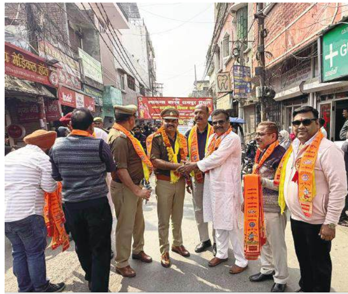
शहर कोतवाल को सम्मान देते रामपुर केमिस्ट एसोसिएशन के पदाधिकारी।

सामूहिक विवाह कार्यक्रम उत्सव पैलेस में आयोजित किया। जहां पूरे विधि-विधान के साथ कन्याओं का विवाह कराया गया। विवाह उत्सव में खुशी, भावुकता और अपनत्व का माहौल साफ झलक रहा था। कई परिवारों के लिए यह आयोजन एक सपने के साकार होने जैसा था। कार्यक्रम की खास बात यह रही कि 11 कन्याओं को सामूहिक बारात का भव्य स्वागत रामपुर केमिस्ट एसोसिएशन द्वारा किया गया। सुबह 11 बजे मिस्टन गंज स्थित गुरु नानक