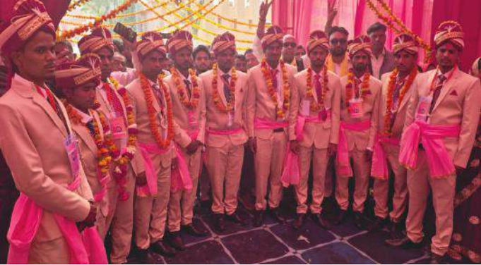
कोसी मंदिर स्थित उत्सव पैलेस में आयोजित कार्यक्रम में शामिल दुल्हा।

● विधायक ने नारियल फोड़कर बारात को किया रवाना