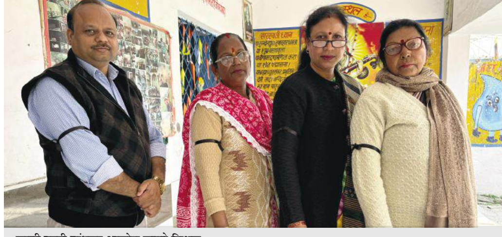
काली पट्टी बांधकर आक्रोश जताते शिक्षक

इस विरोध प्रदर्शन का एक हिस्सा कल एक्स पर भी दिखा, जब शिक्षकों ने अपना विरोध प्रदर्शन एक्स पर टॉप ट्रेडिंग में लाने के लिए एक अभियान चलाया। इस अभियान के तहत, शिक्षकों ने अपने विचार और विरोध व्यक्त करने के लिए एक्स पर पोस्ट किए, जिससे यह मुद्दा