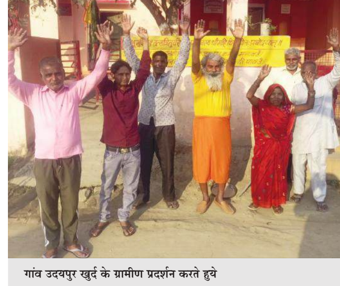
गांव उदयपुर खुर्द के ग्रामीण प्रदर्शन करते हुये

पूरनपुर। शुद्ध पेयजल की आपूर्ति और खोदी गई सड़कों की मरम्मत करने की मांग को लेकर गांव उदयपुर खुर्द के ग्रामीणों ने प्रदर्शन किया। आरोप है कि गांव में जल जीवन के तहत पानी की टंकी के निर्माण को पूरा करने में उदासीनता बरती जा रही है। कई बार तहसील प्रशासन को ज्ञापन भी दिया लेकिन सुनवाई नहीं हो रही है। इससे ग्रामीणों में रोष है। प्रदर्शनकारियों का कहना है कि करीब पांच साल पहले पानी की टंकी का निर्माण कार्य शुरू हुआ था जो अब तक अधूरा