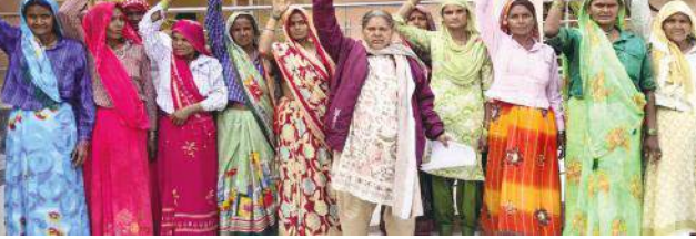
जागरण मोर्चा कार्यालय

हसनपुर। तहसील क्षेत्र के गांव में अवैध शराब और जुए के बढ़ते कारोबार से परेशान होकर दर्जनों महिलाओं ने तहसील परिसर में एसडीएम कार्यालय के सामने प्रदर्शन किया। महिलाओं ने उप जिलाधिकारी कार्यालय पहुंचकर पुलिस अधीक्षक के नाम संबोधित एक ज्ञापन सौंपा।