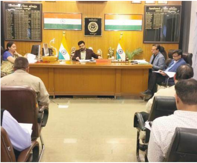
बैठक को संबोधित करते डीएम

जिलाधिकारी ने आयुष्मान कार्ड निर्माण में लक्ष्य के सापेक्ष प्रगति संतोषजनक न पाए जाने पर नाराजगी व्यक्त की। उन्होंने सभी चिकित्सा अधीक्षक, प्रभारी चिकित्सा अधिकारियों का वेतन बाधित करते हुए निर्देशित किया कि अपने अधीन संचालित प्रत्येक ऑपरेटर आईडी से प्रतिदिन न्यूनतम 5 आयुष्मान कार्ड बनवाना तय करें। डीपीसी आयुष्मान भारत योजना में डॉ. नरेन्द्र को कार्य में अपेक्षित सुधार न करने पर कारण बताओ नोटिस जारी करने