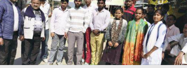
शिविर में उपस्थित छात्र-छात्राएं