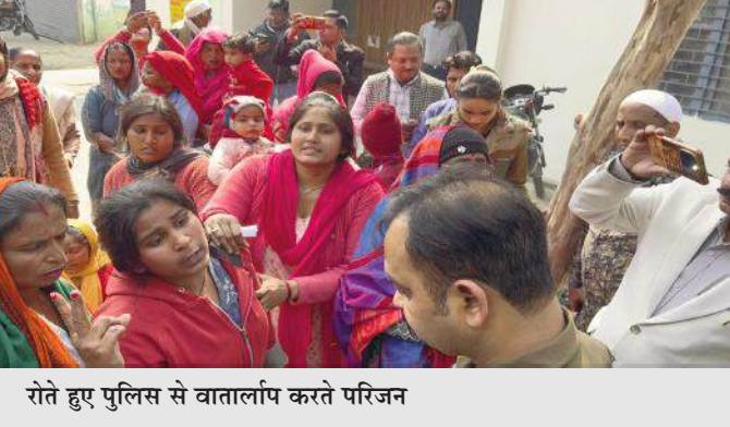
रोते हुए पुलिस से वार्तालाप करते परिजन

कि बैराज में जलस्तर अधिक होने और पानी के तेज बहाव के कारण रेस्क्यू ऑपरेशन में काफी दिक्कतें आ रही हैं। गोताखोरों की टीम संभावित स्थानों पर तलाश कर रही है, वहीं पुलिस भी आसपास के क्षेत्रों में निगरानी बनाए हुए है। प्रशासन का कहना है कि हर संभव प्रयास किए जा रहे हैं और अभियान लगातार जारी रहेगा। इधर युवक की बरामदगी न होने से आक्रोशित परिजन एसडीएम कार्यालय पहुंच गए और प्रदर्शन