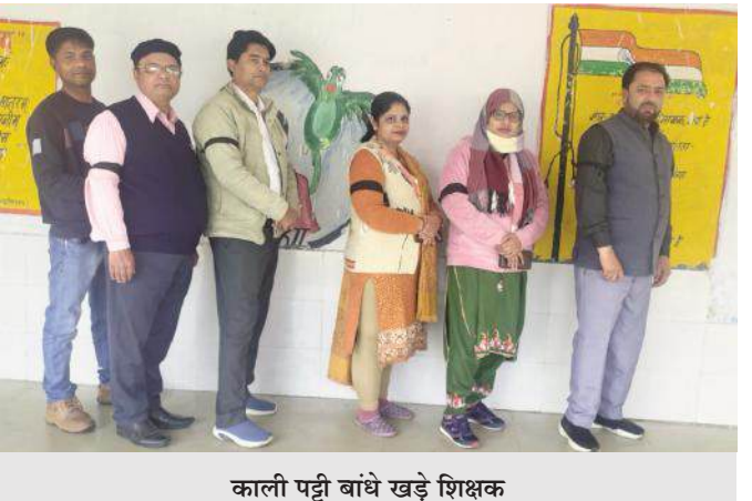
काली पट्टी बांधे खड़े शिक्षक

उत्तर प्रदेश जूनियर हाई स्कूल पूर्व माध्यमिक शिक्षक संघ ने अपने राष्ट्रीय, प्रदेश नेतृत्व के आदेशानुसार, आरटीई एक्ट लागू होने से पूर्व नियुक्त शिक्षकों के लिए टीईटी अनिवार्य किए जाने के विरोध में एक आंदोलन शुरू किया है। इसी के क्रम में फरवरी से द्वितीय दिन, जनपद के समस्त शिक्षकों ने दाहिनी भुजा पर काली पट्टी बांधकर शिक्षण कार्य किया, जिससे उनकी इस मुद्दे पर विरोध और असंतोष व्यक्त किया जा सके। इस विरोध प्रदर्शन का एक हिस्सा प्रसंगों को एक्स पर भी दिखा था। जब शिक्षकों ने अपना विरोध प्रदर्शन एक्स पर टॉप ट्रेडिंग में लाने के लिए एक अभियान