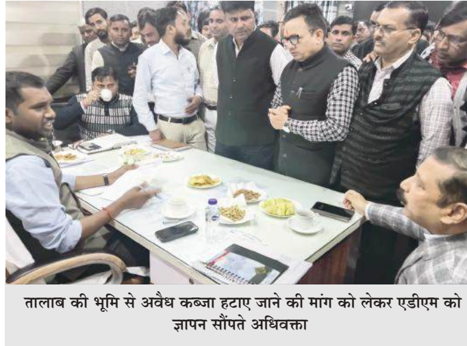
तालाब की भूमि से अवैध कब्जा हटाए जाने की मांग को लेकर एडीएम को ज्ञापन सौंपते अधिवक्ता