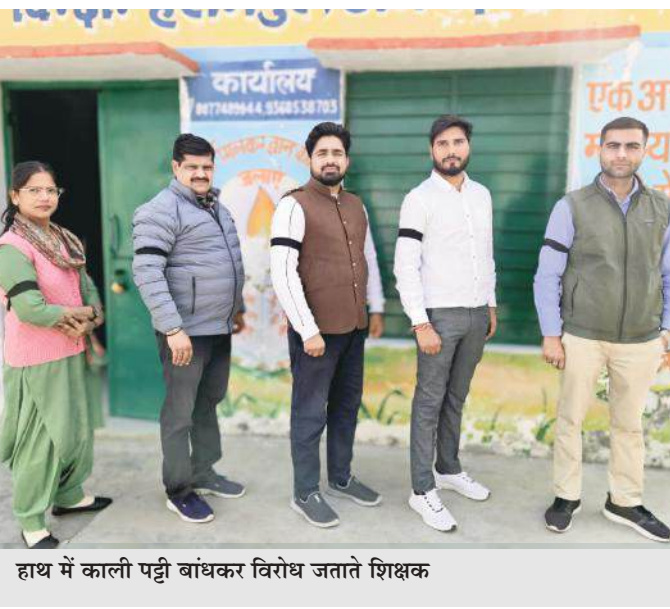
हाथ में काली पट्टी बांधकर विरोध जताने शिक्षक

हसनपुर। अनिवार्यता के विरोध में शिक्षकों द्वारा काली पट्टी बांधकर कार्य बहिष्कार किया। उत्तर प्रदेश में जुलाई 2011 से पूर्व नियुक्त शिक्षकों को सेवा में बने रहने हेतु टी ई टी उत्तीर्ण करना अनिवार्य कर दिया गया है। जिससे प्रदेश के शिक्षकों में रोष व्याप्त है, उत्तर प्रदेश के शिक्षक संगठन अपने-अपने बैनर तले अलग-अलग आंदोलन कर रहे थे, किंतु अब सभी मान्यता प्राप्त संगठन एक ही बैनर तले टीचर्स फेडरेशन ऑफ इंडिया के अंतर्गत अपना विरोध जता रहे हैं जिसमें सर्वसम्मति से संगठन ने यह निर्णय लिया कि 23 फरवरी से सभी शिक्षक काली पट्टी बांधकर शिक्षण कार्य करेंगे और 26 फरवरी को जिला बेसिक शिक्षा अधिकारी कार्यालय पर धरना देकर बी एस ए कार्यालय से जिला अधिकारी कार्यालय तक पैदल मार्च करते हुए जिला अधिकारी महोदय के माध्यम से माननीय प्रधानमंत्री भारत सरकार को ज्ञापन प्रेषित किया जाएगा। ब्लॉक क्षेत्र के गांव