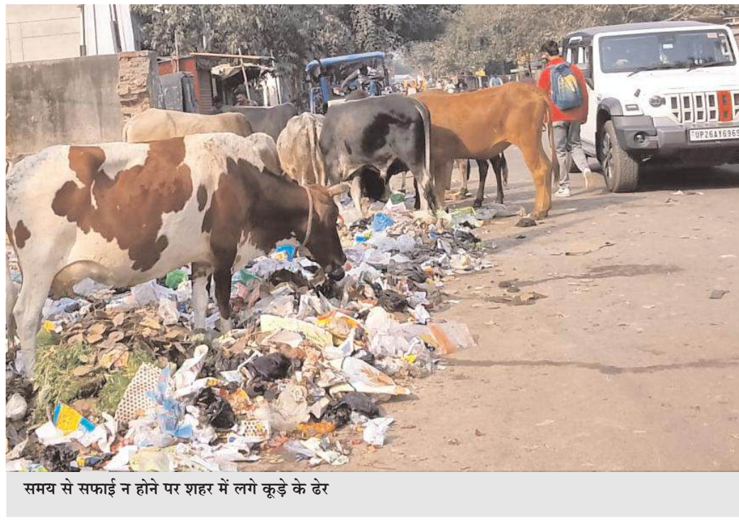
समय से सफाई न होने पर शहर में लगे कूड़े के ढेर