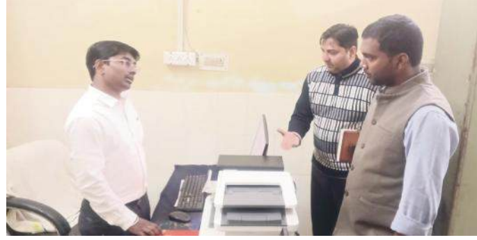
जागरण मोर्चा कार्यालय