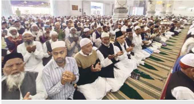
जामा मस्जिद में दूसरे जुमे पर नमाज अदा करने के बाद दुआ करते नमाजी।