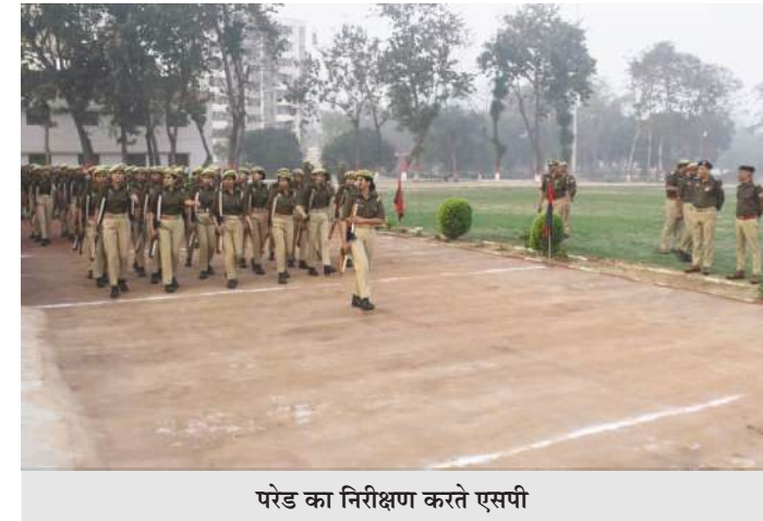
परेड का निरीक्षण करते एसपी