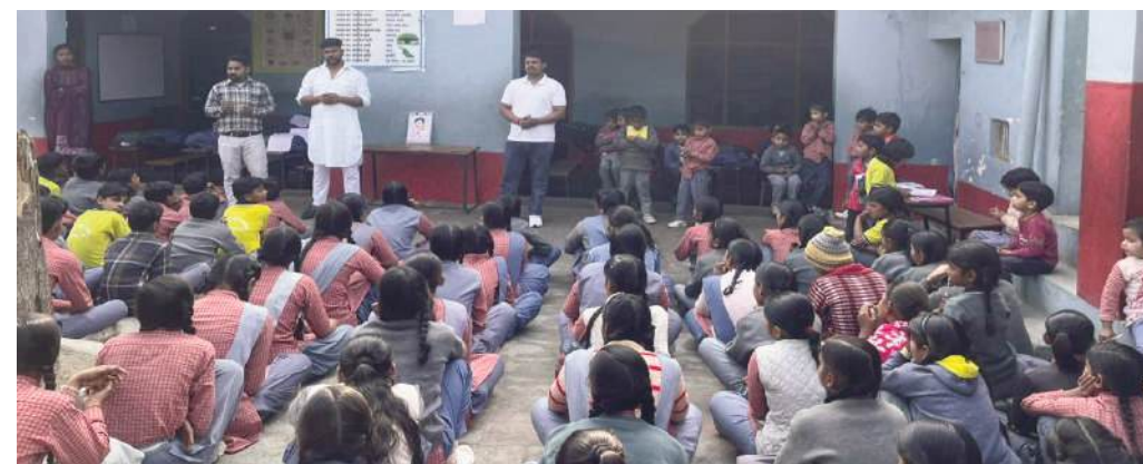
कार्यक्रम के दौरान मौजूद अतिथि एवं बच्चे