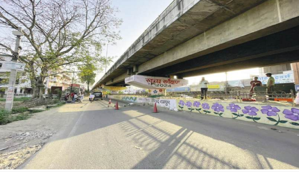
राम रहीम पुल के नीचे मरम्मत कार्य करते मजदूर।

जागरण मोर्चा कार्यालय रामपुर। रामपुर-शाहबाद मार्ग स्थित जर्जर राम रहीम पुल का मरम्मत, बेयरिंग बदलने का कार्य शुरुवार से शुरू हो गया है। कार्य के दौरान पुल पर भारी वाहनों की आवागमन पूर्ण रूप से बंद रहा। पुरानी बेयरिंग की जगह नई बेयरिंग लगनी है। यह कार्य दिनभर जारी रहा। लोक निर्माण विभाग की ओर से पुल की मरम्मत के लिए करीब 2.29 करोड़ रुपये खर्च किए जाएंगे।