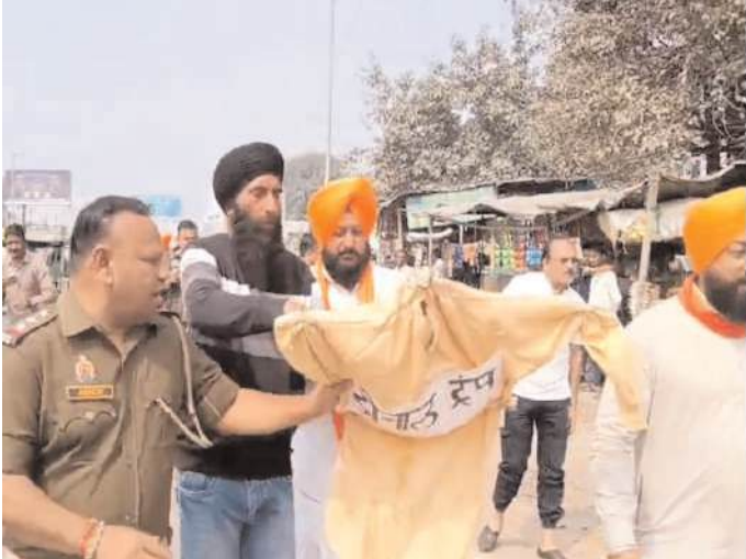
किसान यूनियन (चट्टनी) के कार्यकर्ताओं से डोनाल्ड ट्रंप का पुतला छीनती हुई