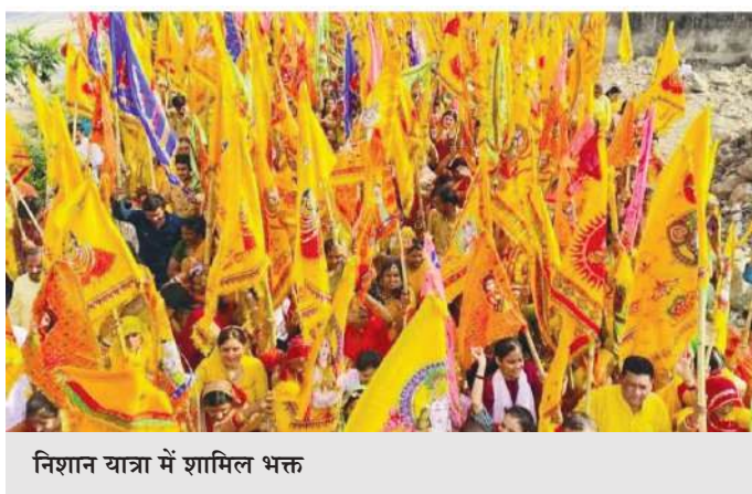
निशान यात्रा में शामिल भक्त

ढोल नगाड़ों और बैंड बाजों के साथ हुई आतिशबाजी