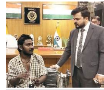
दिव्यांग को ट्राई साइकिल देते डीएम

रीडिंग रूम (लाइब्रेरी), कैटीन, मनोरंजन कक्ष, म्यूजियम, जिम, आरटीसी कार्यालय, केश कार्यालय, परिवहन शाखा, आरटीसी आदि की व्यवस्थाओं आदि का निरीक्षण कर पुलिस लाइन परिसर की साफ-सफाई आदि को चेक कर संबंधित को आवश्यक दिशा-निर्देश दिये। इस दौरान क्षेत्राधिकारी लाइन भी उपस्थित रहे।