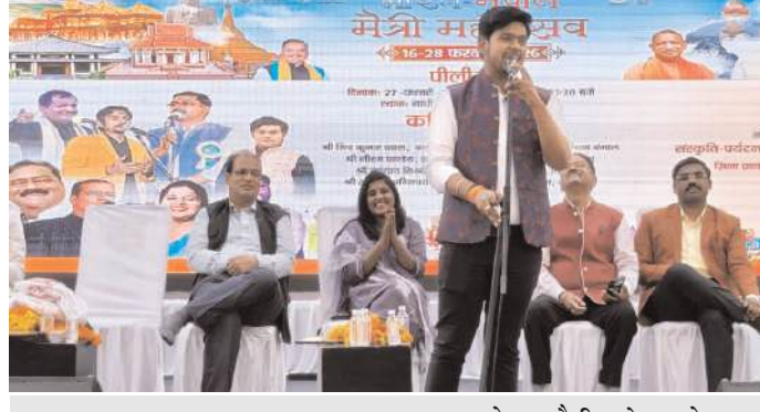
भारत-नेपाल मैत्री महोत्सव के भव्य आयोजन कार्यक्रम प्रस्तुत करते कलाकार