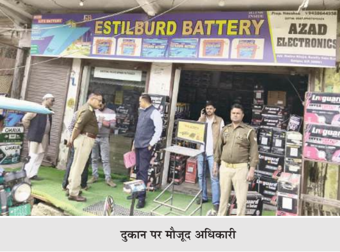
दुकान पर मौजूद अधिकारी