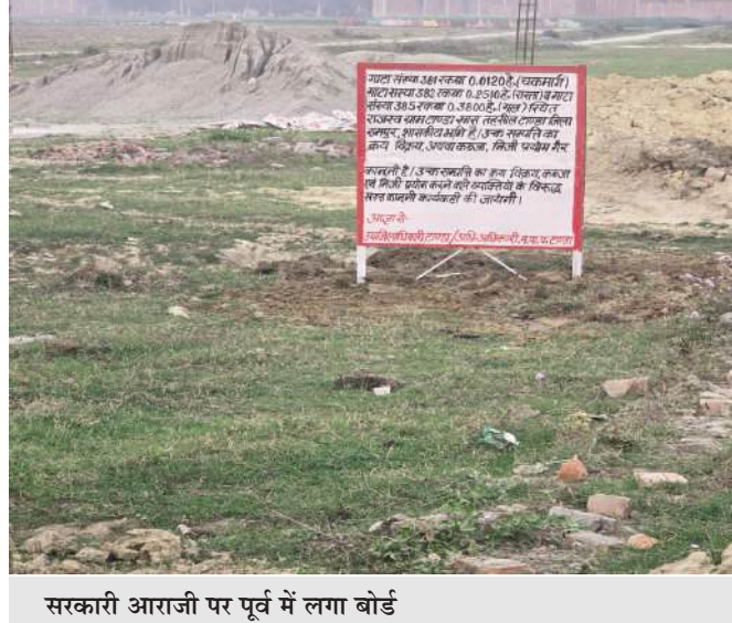
सरकारी आराजी पर पूर्व में लगा बोर्ड