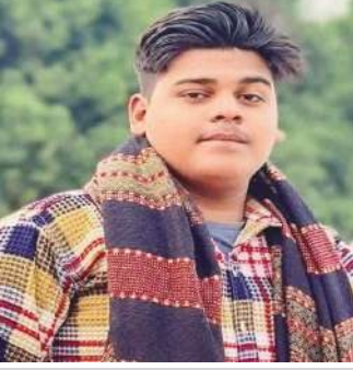
मृतक का फाइल फोटो

जागरण मोर्चा कार्यालय ..... शाहबाद। कान की दवाई लेने गए युवकों को वापस लौटते समय तेज रफ्तार रोडवेज ने टक्कर मार दी, हादसे में एक युवक की मौके पर ही मौत हो गई जबकि दूसरा युवक बुरी तरह जखमी हो गया। जिसको रामपुर के जिला अस्पताल में भर्ती कराया गया।