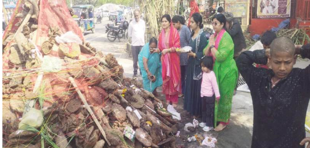
होली की पूजा करती महिलाएं