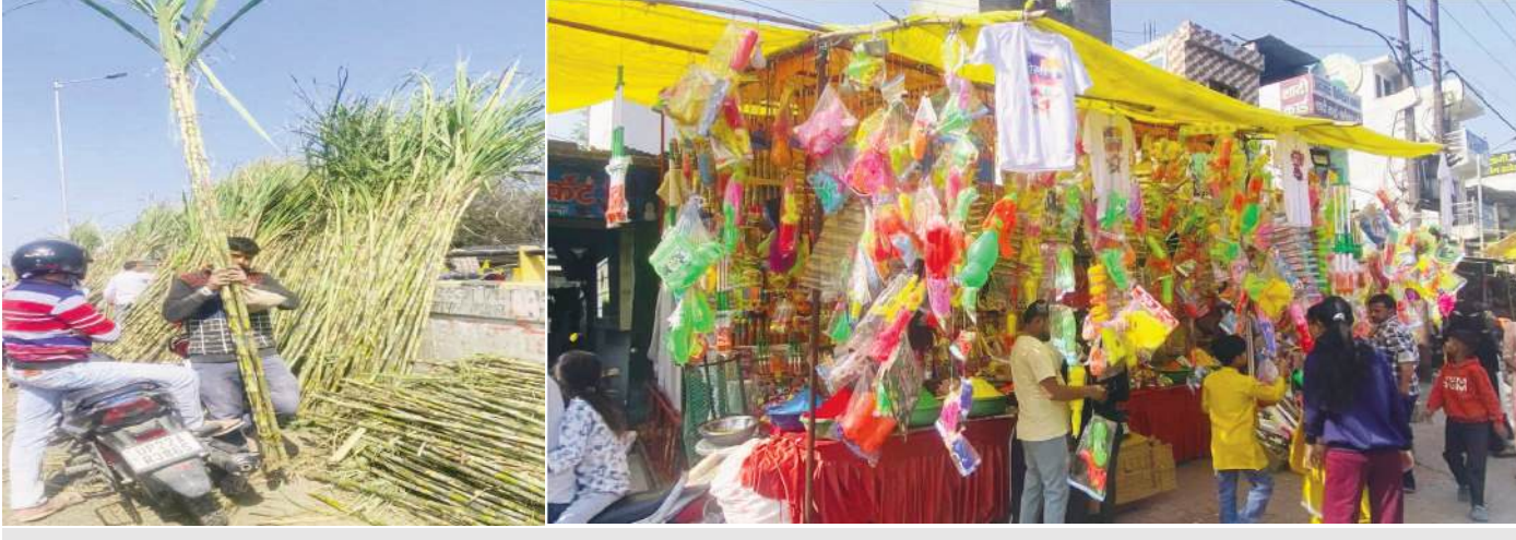
गन्ने खरीदते लोग, ज्वाला नगर में लगी दुकानों पर रंग गुलाल खरीदते लोग

● बच्चों ने पिचकारी से लेकर गुब्बारे तक जमकर खरीदें