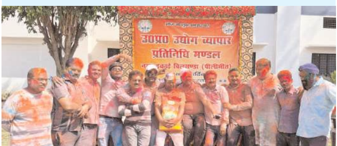
बिलसंडा में व्यापार मंडल के रंगोत्सव कार्यक्रम में होली खेलते तमाम व्यापारी