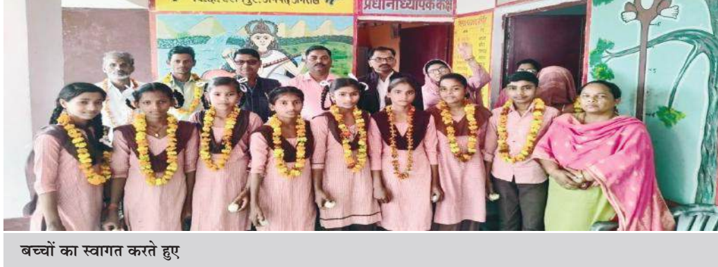
बच्चों का स्वागत करते हुए