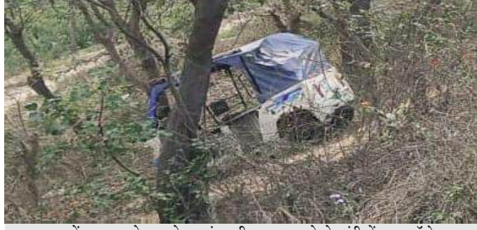
शाहबाद में बाजपुर स्टेट हाइवे पर डंपर की टक्कर लगने से खंडी में पड़ा ऑटो

● बरेली जनपद से होली मिलन समारोह में शामिल होने सम्भल जा रहा था परिवार