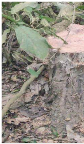
पीपली वन में काटे गए पेड़ों के निशान।

स्वार। तहसील क्षेत्र के थाना मिलक खानम स्थित पीपली वन में प्रतिबंधित पेड़ों की कटान थपने का नाम नहीं ले रही है। गुरुवार की रात वन तस्करो ने वन विभाग की कार्यप्रणाली को खुली चुनौती देते हुए फिलहाल युद्ध का स्थानीय बाजार पर कोई असर नहीं दिख रहा है। लोग महज अफवाहों के चलते पेट्रोल-डीजल का स्टॉक कर रहे हैं। जैसेसे आम ग्रहकों को परेशानी का सामना करना पड़ रहा है। लोगों ने प्रशासन से मांग की है कि पेट्रोल पम्पों का निर्यात निरीक्षण किया जाए और जानबूझकर ग्राहकों को परेशान करने वालों के खिलाफ कार्रवाई की जाए।