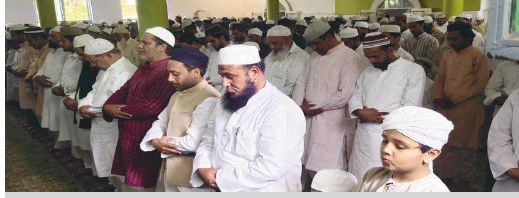
मस्जिद में नमाज अदा करते नमाजी