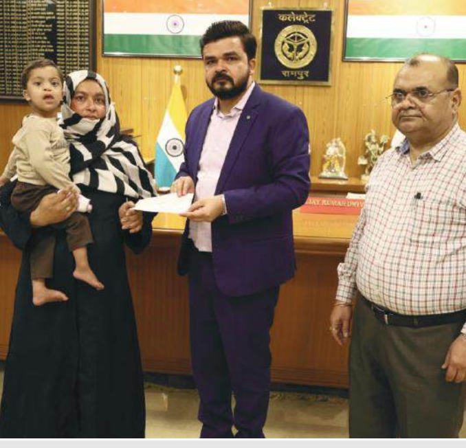
कलेक्ट्रेट सभागार में पीड़ित परिवार को चेक सौंपते जिलाधिकारी।

● दो मासूमों के इलाज के लिए बढ़ाए हाथ, जिलाधिकारी ने जनता दर्शन में सुनी पीड़ा