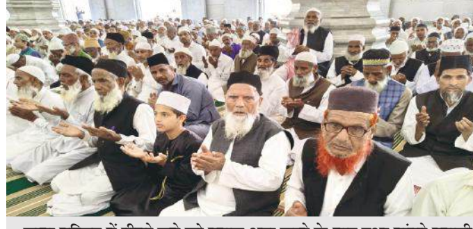
जामा मस्जिद में तीसरे जुमे को नमाज अदा करने के बाद दुआ मांगते नमाजी।

● रमजान के तीसरे जुमे पर मस्जिदों में उमड़ी नमाजियों की भीड़