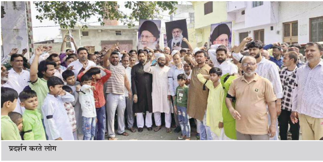
प्रदर्शन करते लोग