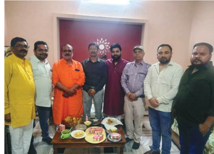
होली मिलन कार्यक्रम में मौजूद संगठन के पदाधिकारी