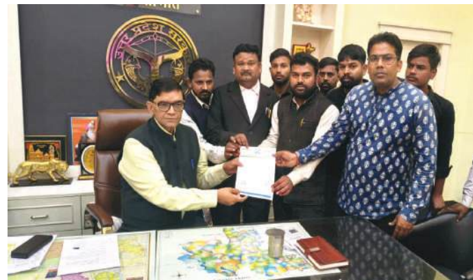
डीएम को ज्ञापन देते आप कार्यकर्ता

पीलीभीत। आम आदमी पार्टी ने जिलाधिकारी को ज्ञापन के माध्यम से अवगत कराया है कि जनपद के पूरनपुरझपीलीभीत, पूरनपुरझखटोमा, पीलीभीतझमाधोटांडा जनपद के अत्यंत महत्वपूर्ण संपर्क मार्ग हैं। ये मार्ग जनपद मुख्यालय को प्रदेश की राजधानी लखनऊ, नेपाल सीमा, उत्तराखंड की अंतरराज्यीय सीमा तथा प्रमुख पर्यटन स्थलों से जोड़ते हैं। इन्हीं मार्गों के माध्यम से पर्यटक शारदा डैम, टाइगर सफारी क्षेत्र, मुस्तफाबाद गेस्ट हाउस, अधिकतर रिसॉर्ट, होटल, माँ गोमती उदयग, बराही मन्दिर तथा उत्तराखंड स्थित प्रसिद्ध शक्तिपीठ माँ पूर्णागिरि मंदिर, नानकमत्ता गुरुद्वारा, रीठा साहिब, मायावती आश्रम एवं ओम पर्वत आदि स्थानों की यात्रा करते हैं। राष्ट्रीय बाघ संरक्षण प्राधिकरण