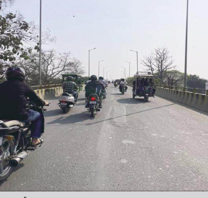
राम रहीम पुल।

जागरण मोर्चा कार्यालय रामपुर। जर्जर राम रहीम पुल का कार्य एक दो दिन में ही शुरू होने वाला है। इसको लेकर विभागीय अधिकारियों ने तैयारियां शुरू कर दी हैं। होली के पर्व को लेकर पुल की मरम्मत कार्य रोक दिया गया था। लेकिन अब जल्द ही चालू होना वाला है।