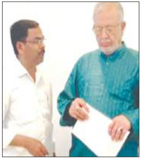
समारोह में मुख्य अतिथि के रूप में आमंत्रित किया था, जिसे उन्होंने स्वीकार कर लिया। उद्घाटन कार्यक्रम में सांसद