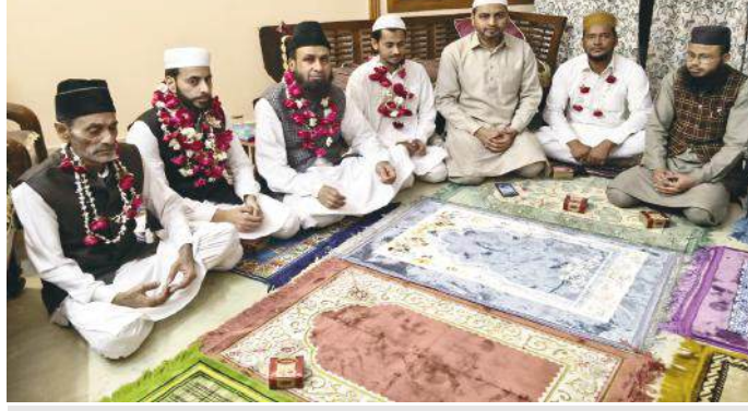
शहर के मोहल्ला पंजाबियान में कुरआन ए करीम मुकम्मल होने पर दुआ करते लोग

● मोहल्ला पंजाबियान में 16 वीं नमाज ए तरावीह को कुरआन ए करीम मुकम्मल