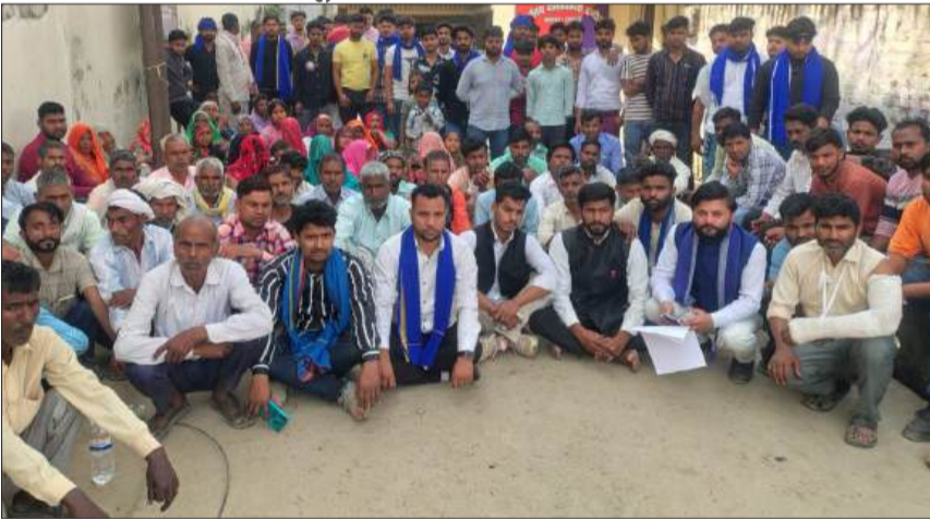
सीओ कार्यालय पर धरना-प्रदर्शन करते गांव गुरसरी के ग्रामीण।