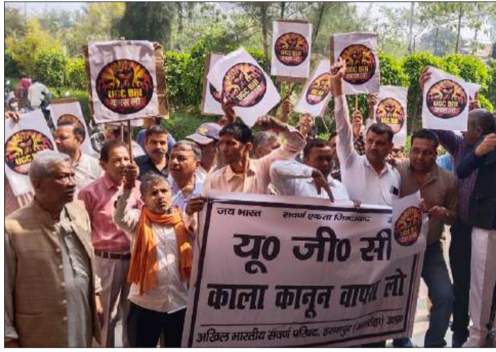
स्वर्ण परिषद यूजीसी कानून के विरोध में नारेबाजी करते हुए।