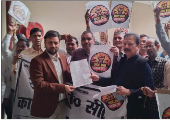
स्वर्ण परिषद यूजीसी कानून के विरोध में एसडीएम को सोपा ज्ञापन।