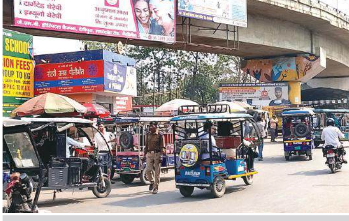
चौराहे पर जाम, नदारद पुलिस

वह यातायात पुलिस जिसको न सिर्फ आम जनता को यातायात नियमों का पाठ पढ़ाना चाहिए बल्कि यातायात व्यवस्था का सुधार भी करना चाहिए वह कुर्सियों पर काले चश्मों को आंखों पर सजाए दिखाई दी। बीते दिन पूर्व जब कार्यवाही करी गई तो 17 बुलेट धारियों के साइलेंसर भी खोले गए। नौगवां चौराहे पर जाम से जूझ रहे किसी व्यक्ति ने जब इसकी शिकायत ट्रैफिक प्रभारी से करी तो यह मुस्तेद भी हो गए। मामला शहर के उस नौगवां चौराहे का है जहां बीते दिनों पूर्व इन्होंने आव्यवस्थाओं के चलते