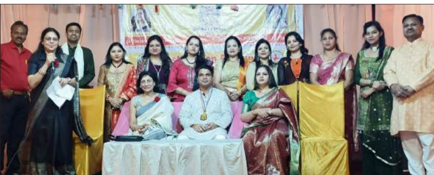
जायंट्स ग्रुप ऑफ सिटी के अधिष्ठापन समारोह में मौजूद पदाधिकारी।