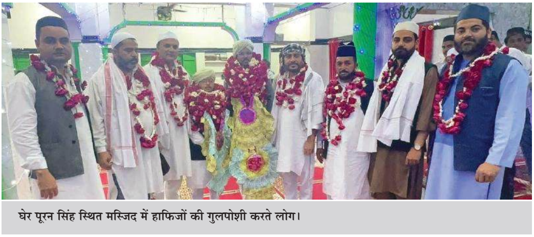
घेर पूरन सिंह स्थित मस्जिद में हाफिजों की गुलपोशी करते लोग।