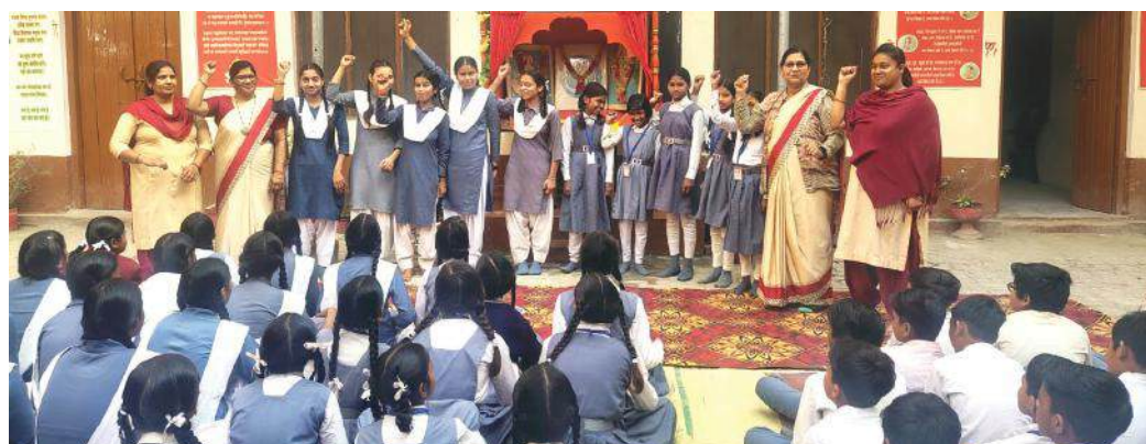
जागरण मोर्चा कार्यालय