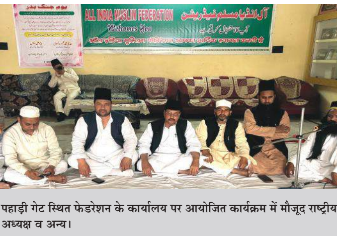
पहाड़ी गेट स्थित फेडरेशन के कार्यालय पर आयोजित कार्यक्रम में मौजूद राष्ट्रीय अध्यक्ष व अन्य।

मौलाना शादाब कदीरी ने किया मदीना के मुसलमानों पर हो रहे जुल्म और उन पर हो रहे बेवजह हमलों की मुखलाफत में मदीना से 80 मील दूर बदर के मैदान में 313 मुसलमानों और 1000 कुरैश के लोगों के बीच में जंग ए बदर की लड़ाई