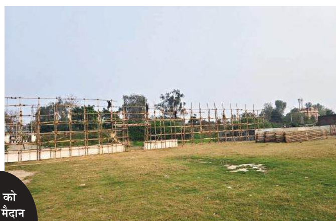
मेले को लेकर मैदान में चलती तैयारियां

कार्निवाल में फिश टर्नल, फुट कोर्ट, शॉपिंग बाजार, भूत बंगला, रंगारंग कार्यक्रम, ऊंट की सवारी बच्चों के मनोरंजन के लिए इंतजाम किए जा रहे हैं। शनिवार से यंग मैन हॉकी मैदान में जलपरी कार्निवाल की तैयारियां शुरू हो गई हैं। कार्निवाल में फिश टर्नल, फुट कोर्ट, शॉपिंग बाजार, भूत बंगला, रंगारंग कार्यक्रम, ऊंट की सवारी की बुकिंग के लिए ग्राउंड में संपर्क करें।