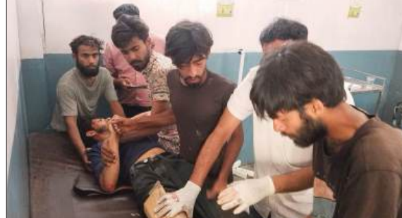
घायलों का उपचार करते चिकित्सक।