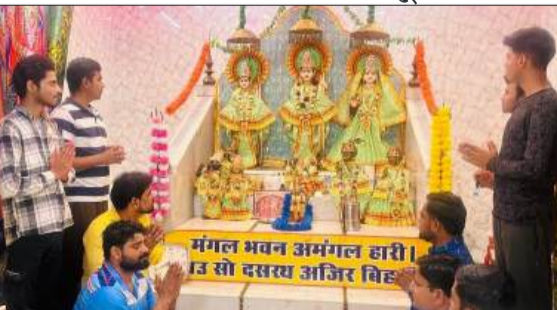
मंदिर में पूजा-अर्चना करते क्रिकेट प्रेमी।