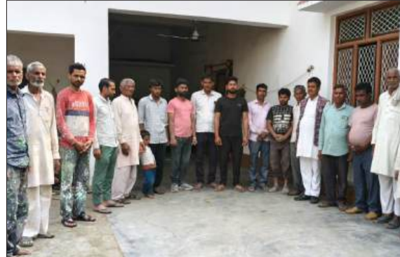
गोष्ठी में उपस्थित कार्यकर्ता।