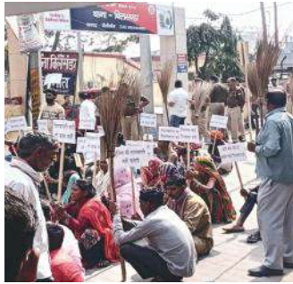
बिलसंडा थाना गेट पर प्रदर्शन करते हुए सफाई कर्मी