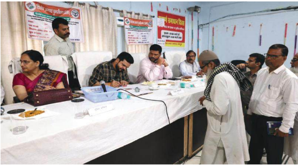
लोगों की समस्याएं सुनते डीएम

संपूर्ण समाधान दिवस में राजस्व, विद्युत, पुलिस, भूमि पैमाइश, आवास, राशन कार्ड से सम्बन्धित शिकायती प्रार्थना प्राप्त हुए। समाधान दिवस के दौरान शिकायतकर्ता द्वारा जिलाधिकारी को ग्राम पंचायत अलीनगर जागीर एवं ग्राम पंचायत रसूलपुर फरीदपुर में चक्रोड पर अवैध कब्जा के सम्बन्ध में शिकायती प्रार्थना पत्र प्रस्तुत किया। जिस पर जिलाधिकारी ने