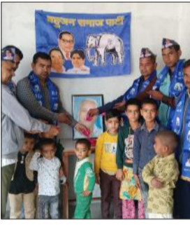
बसपा के संस्थापक के चित्र पर पुष्प चढ़ाते पदाधिकारी।