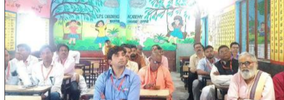
भाजपा के पंडित दीनदयाल उपाध्याय मंडल प्रशिक्षण वर्ग में मौजूद भाजपा कार्यकर्ता।