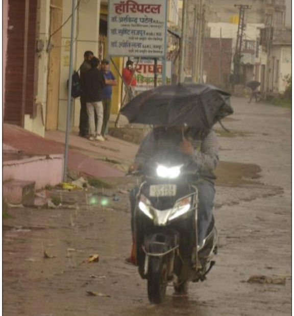
बूदाबादी के दौरान स्कूटी से छत्ता लेकर गुजरता युवक।

रविवार की सुबह 5 बजे से आसमान में काले बादल छाते व बिजली कड़कने लगी। सबको लगा कि भीषण बारिश होने वाली है। सुबह 6.30 बजे बूदाबादी शुरू हुई और आधा घंटे के बाद समाप्त हो गई। इसके बाद दोपहर एक बजे एक बार फिर मौसम बदला और आसमान में काले बादल कड़कने लगे। फिर से बूदाबादी शुरू हो गई। कुछ देर बाद रुक गई। आसमान में काले बादल आने व बूदाबादी से मौसम सुहावना हो गया। जिससे लोगों ने कई दिन से पड़ रही गर्मी से राहत महसूस की।