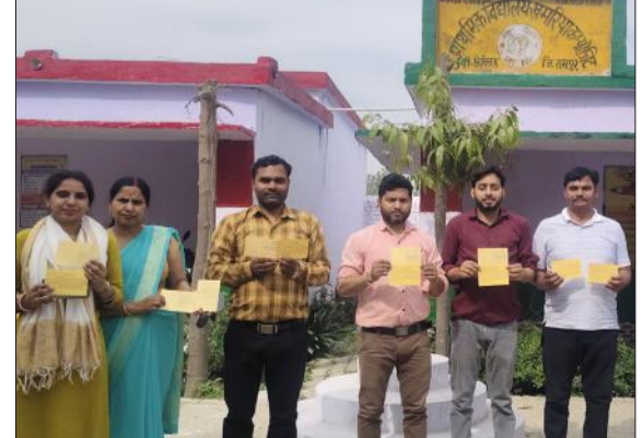
पोस्टकार्ड दिखाते शिक्षक। -जागरण मोर्चा

रामपुर: अखिल भारतीय संयुक्त शिक्षक महासंघ के आह्वान पर बेसिक शिक्षकों ने टीईटी थोपे जाने के विरोध में रविवार को भी पोस्टकार्ड अभियान चलाया। नव साक्षरता परीक्षा के कारण रविवार को विद्यालय खुले होने से शिक्षकों ने वहीं से पोस्टकार्ड लिखकर अपनी आपत्ति दर्ज कराई। शिक्षकों का कहना है कि 1 सितंबर को सुप्रीम कोर्ट ने सभी कार्यरत शिक्षकों को दो वर्ष के भीतर टीईटी उत्तीर्ण करने का आदेश दिया है। उनका आरोप है कि यह आदेश केंद्र सरकार द्वारा अक्टूबर 2017 में बनाए गए ऐसे नियम के आधार पर दिया गया है, जिसे उस समय सार्वजनिक नहीं किया गया था। शिक्षकों का कहना है कि उनकी नियुक्ति जिस समय