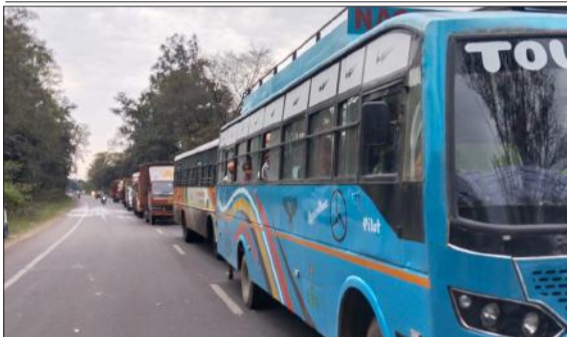
जाम लगने से मार्ग पर खड़े वाहन।