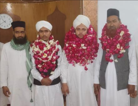
बरेली गेट स्थित मस्जिद उमर में कुरआन मुकम्मल होने पर खड़े लोग।