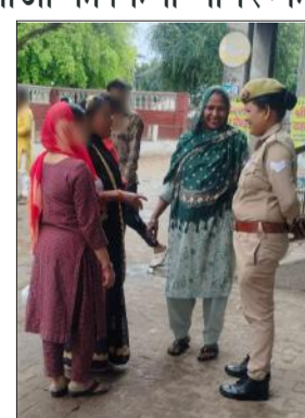
महिलाओं को जागरूक करती महिला पुलिस कर्मी।

जिसमें जागरूकता कार्यक्रम के मुख्य बिंदु महिला सुरक्षा एवं आत्मरक्षा से जुड़े आवश्यक उपाय, कानूनी अधिकार, नारी सम्मान से संबंधित प्रावधान एवं हेल्पलाइन सेवाओं 1090 महिला शक्ति हेल्पलाइन, 181 महिला हेल्पलाइन, 112 आपातकालीन सेवा, 1098 चाइल्ड हेल्पलाइन