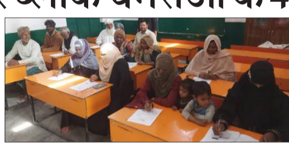
नव भारत साक्षरता कार्यक्रम के तहत परीक्षा देते असाक्षर।

खंड शिक्षा अधिकारी चमरौआ द्वारा बताया कि विकास खंड के 70 परीक्षा केंद्रों पर 401 असाक्षरों की परीक्षा की व्यवस्था की गई। सभी केंद्रों के प्रधान अध्यापक को निर्देशित किया कि सारे स्टाफ की उपस्थिति में प्राथमिकता के आधार पर भारत सरकार द्वारा दिए निर्देशों के अनुक्रम में योजनागत आयोजित होने वाली सर्वे ऐप के