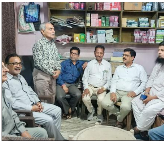
भारतीय हिंदू नववर्ष को लेकर बैठक करते व्यापारी।