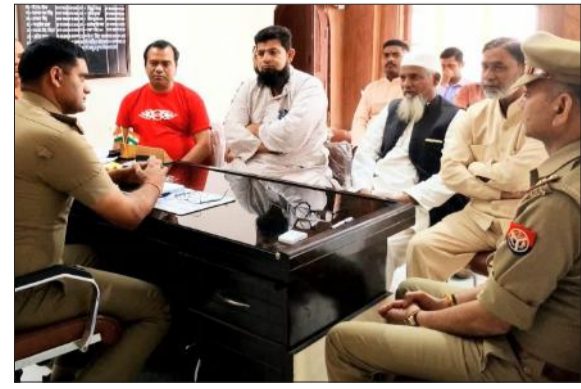
कोतवाली में व्यापारियों के साथ अमन कमेटी की बैठक करते प्रभारी निरीक्षक।

व्यापारियों ने कहा कि ईदगाह पर ईद वाले दिन नमाजियों के लिए पर्याप्त साफ-सफाई एवं पानी की व्यवस्थाओं का मुद्दा उठाया। साथ ही सभी से भाईचारे के साथ ईद का त्योहार मनाने की अपील की। कहा कि रामनवमी और नवरात्रि पर रामबारात निकाली जाती है तथा रामबाग पर मेला का आयोजन होता है। इसके लिए पुलिस, महिला