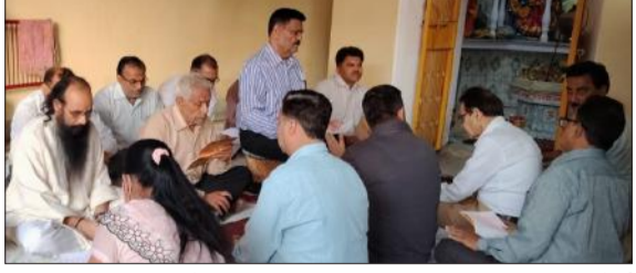
सुंदर काण्ड का पाठ करते श्रद्धालु।