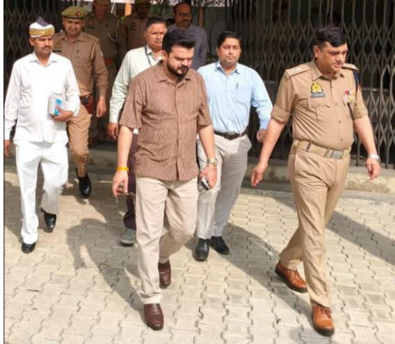
राजकीय पालिटैक्निक कालेज में बने परीक्षा केंद्र का निरीक्षण करते जिलाधिकारी, पुलिस अधीक्षक।

यूपी पुलिस की दरोगा भर्ती प्रवेश परीक्षा रविवार को 11 केंद्रों पर हुई। परीक्षा में 5280 परीक्षार्थी पंजीकृत हैं। परीक्षा दो पालियों में हुई। पहली पाली में 2640 के सापेक्ष 1878 ने परीक्षा दी। यानि 762 गैरहाजिर रहे। दूसरी पाली में 2640 के सापेक्ष 1910 ने परीक्षा दी। इसमें भी 730 अनुपस्थित रहे। यानि दोनों पालियों में 1492 अभ्यर्थी गैरहाजिर रहे। उत्तर प्रदेश पुलिस भर्ती एवं प्रोन्नति बोर्ड द्वारा आयोजित उप निरीक्षक नागरिक पुलिस एवं समकक्ष पदों पर सीधी भर्ती की लिखित परीक्षा