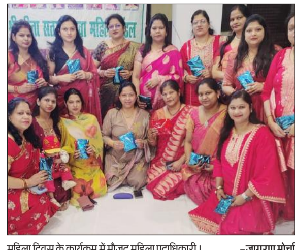
महिला दिवस के कार्यक्रम में मौजूद महिला पदाधिकारी।