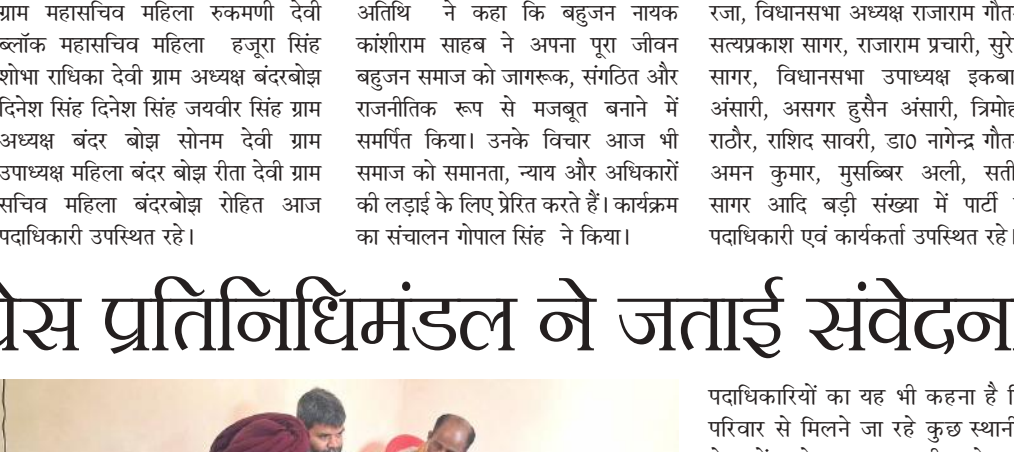
पीड़ित परिवार से वार्ता करते हुए कांग्रेस प्रतिनिधि मण्डल