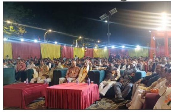
कार्यक्रम में मौजूद लोग।