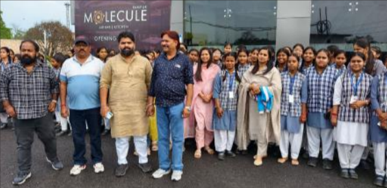
बरेली रोड स्थित सिनेपोलिस मोदी के बाहर खड़ी छात्राएं।