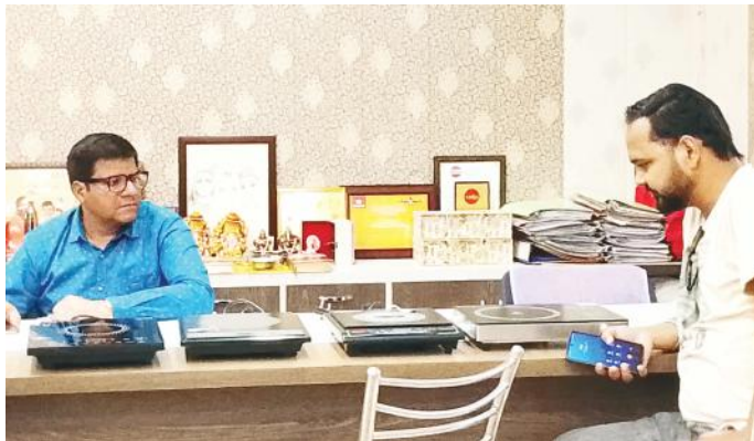
गैस सिलेंडर की किल्लत से त्रस्त जनता खरीद रही इंडेक्शन चूल्हा

पीलीभीत। घरेलू सिलेंडर की किल्लत पर अधिकारी भले ही कितनी सफाई दे दें पर जमीनी सच्चाई यह है कि जिन उपभोक्ताओं को गैस सिलेंडर की जरूरत है उन्हें बुकिंग के बाद भी सिलेंडर मिल नहीं पा रहा और वहीं दूसरी ओर गैस एजेंसी के कर्मचारी 930 रुपए में घरेलू सिलेंडर को खुलेआम 1500 रुपए में बेच रहे हैं। गैस सिलेंडर की किल्लत को देखते हुए लकड़ी मंडी के व्यापारियों ने भी लकड़ी के दाम दोगुने कर दिए हैं। आम जनता इंडेक्शन चूल्हे खरीदने के लिए बाजार में भटक रही है पर गैस सिलेंडर की किल्लत के चलते बाजार में इन चूल्हों की भी कमी पड़ गई है।