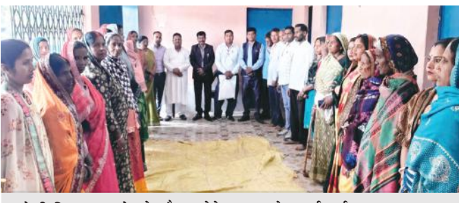
होली मिलन समारोह के दौरान जेकेएस एस के कार्यकर्ता