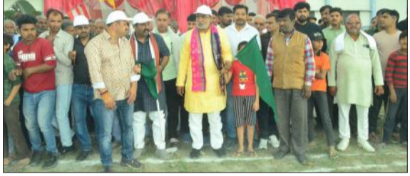
खेल प्रतियोगिताओं का आरंभ करते अतिथि।