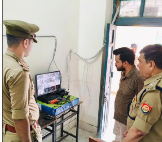
रजा राजकीय इंटर कॉलेज में कंट्रोल रूम में जानकारी लेते जिलाधिकारी।

जिलाधिकारी ने केंद्र व्यवस्थापकों एवं संबंधित अधिकारियों को निर्देशित करते हुए कहा कि परीक्षा को पूर्णतः निष्पक्ष, पारदर्शी एवं नकल-विहीन वातावरण में संपन्न कराया जाए। उन्होंने कहा कि