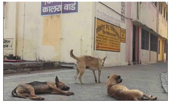
जिला अस्पताल के आइसोलेशन वार्ड के बाहर बैठे आवारा कुत्ते।

मरीजों और तीमारदारों का कहना है कि सुबह से लेकर रात तक कुत्तों का जमावड़ा लगा रहता है। रात में कुत्तों के लगातार भौंकने से मरीजों की नींद में खलल पड़ रहा है। कुत्तों का आतंक इमरजेंसी वार्ड के आसपास सबसे अधिक देखने