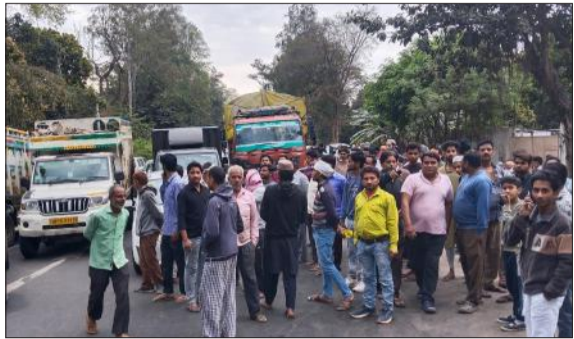
गैस की किल्लत को लेकर उपभोक्ताओं ने लगाया जाम।

लागता घरलू गैस की किल्लत के चलते उपभोक्ता परेशान हो रहे हैं वही प्रशासनिक अधिकारी गैस की कोई भी कमी ना होना बता रहे हैं। रविवार को प्रातः चार बजे से नगर के गजरौला मार्ग स्थित दिपपुर गेट के निकट गैस गोदाम पर उपभोक्ताओं की लाइन लगनी शुरू हो गई थी, 9 बजे तक गैस एजेंसी स्वामी द्वारा कोई भी जवाब