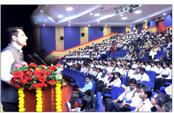
कार्यक्रम को संबोधित करते वक्ता।

● प्रोस्पेक्ट एंड चैलेंज फॉर अर्ली एंड एडवांस हेल्थकेयर रिसर्च पर हुई कॉन्फ्रेंस जागरण मोर्चा कार्यालय