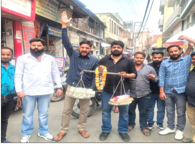
विद्यालयों की मनमानी के विरोध में प्रदर्शन करते व्यापारी।

शुक्रवार को कैथल गेट में व्यापार मंडल के पदाधिकारियों ने विरोध दर्ज कराते हुए किताबों व कापियों को तराजू पर रखकर रुपयों के साथ तोला। इस अनोखे प्रदर्शन के