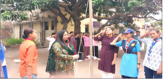
आयोजित प्रशिक्षण में खड़े प्रोफेसर व अन्य।