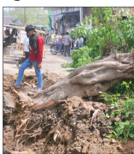
नाला निर्माण के दौरान गिरा पेड़।

हसनपुर। नगर में नाला निर्माण कार्य के दौरान शुक्रवार दोपहर एक बड़ा हादसा होते-होते टल गया। नगर के झकड़ी मार्ग पर नगरपालिका द्वारा जनसुविधा हेतु करवाए जा रहे नाला निर्माण के कार्य के बीच 40 वर्ष पुराना पिलखन का एक पेड़ अचानक धराशायी हो गया। पेड़ के गिरने से मार्ग पूरी तरह अवरुद्ध हो गया, जिससे आवागमन ठप हो गया। जनीमत रही कि किस्म समथ यह पेड़ गिरा, उस समय वहां से कोई