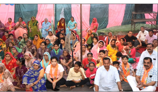
कथा में मौजूद श्रद्धालु।