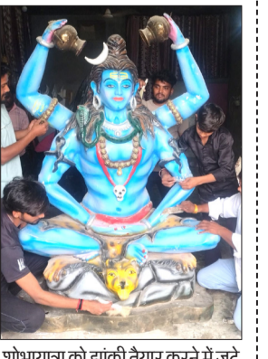
शोभायात्रा को झांकी तैयार करने में जुटे समिति पदाधिकारी।