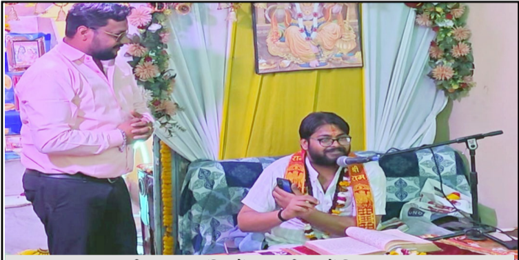
बालाजी महाराज मंदिर में चल रही छठवें दिन राम कथा