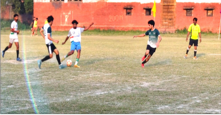
रामपुर-स्वार रोड स्थित महात्मा गांधी फिजिकल स्टेडियम में फुटबाल टूर्नामेंट में प्रतिभाग करते खिलाड़ी।

रामपुर। क्रीड़ा भारती एवं अंबेडकर क्लब के द्वारा आयोजित प्रदेश स्तरीय बाबा साहब भीमराव अंबेडकर फुटबॉल टूर्नामेंट के छठे दिन मुख्य अतिथि ने युवा खिलाड़ियों से परिचय प्राप्त कर और उनका उत्साहवर्धन किया। उनके उत्कृष्ट प्रदर्शन का आनंद लिया।