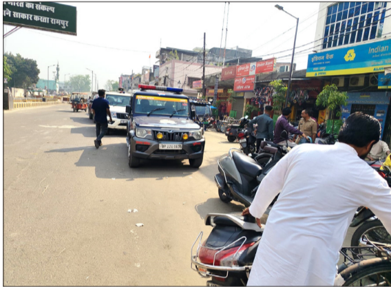
थेरेपी स्पा सेंटर के नीचे अधिकारियों की गाड़ियां।