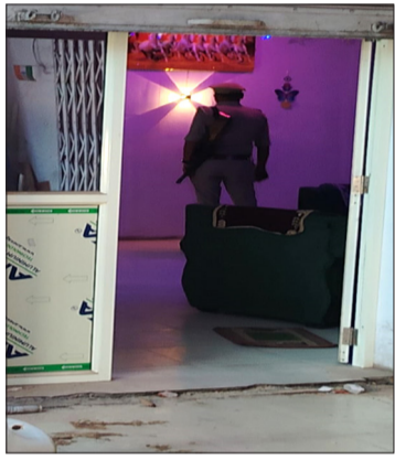
स्पा सेंटर में छापेमारी के दौरान खड़े पुलिसकर्मी।