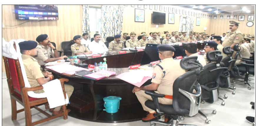
पुलिस लाइन में मीटिंग लेते एसपी।

रामपुर। पुलिस अधीक्षक, द्वारा अपर पुलिस अधीक्षक के साथ पुलिस लाइन में सभी क्षेत्राधिकारी एवं थाना प्रभारियों के साथ अपराध गोष्ठी आयोजित की गई। गोष्ठी के दौरान जनपद में अपराध नियंत्रण तथा शांति एवं कानून-व्यवस्था को सुदृढ़ बनाए रखने के दृष्टिगत उपस्थित अधिकारियों, कर्मचारियों को निम्नलिखित आवश्यक दिशा-निर्देश दिए गए। (लिबित विवेचनाओं का शीघ्र एवं गुणवत्तापूर्ण निस्तारण सुनिश्चित किया जाए। वांछित अभियुक्तों की शीघ्र गिरफ्तारी की जाए। समस्त थाना क्षेत्रों में नियमित गश्त की जाए तथा संवेदनशील स्थलों पर सतर्क दृष्टि बनाए रखी जाए। आमजन के साथ