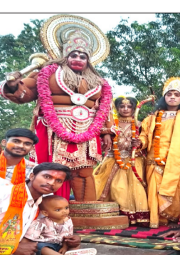
निकाली गई बालाजी की शोभायात्रा।