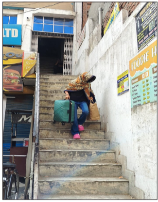
स्पा सेंटर से सामान लेकर जाती युवती।