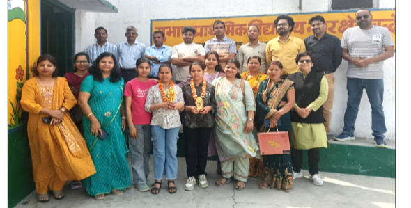
सम्मान समारोह में सम्मानित मेधावी बच्चों।