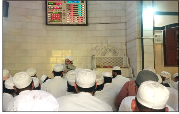
जामा मस्जिद में बयान करते मौलाना मोहम्मद सलमान बिजनौरी नक्शबंदी।