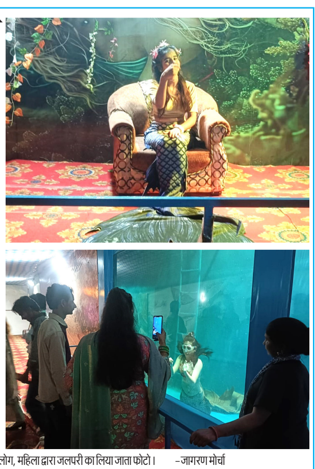
तोपखाना स्थित योग मैंग हॉल में मंदिर शांति कार्निवल में जलपरी देखते लोग, महिला द्वारा जलपरी का लिया जाता फोटो।