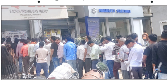
एजेंसी पर लगी भीड़।