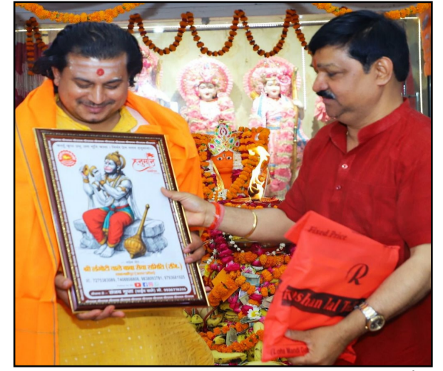
जी के चित्र भेंट कर सम्मानित किया गया। कार्यक्रम के अंत में उपस्थित श्रद्धालुओं को प्रसाद वितरित किया गया और इसी के साथ आयोजन का समापन हुआ।