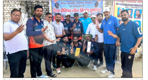
क्रिकेट टूर्नामेंट की विजेता टीम।