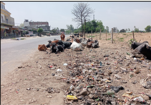
घुंघचाई में थाने के पास हाइवे किनारे बैठे छुट्टा गोवंश

जागरण मोर्चा कार्यालय पूरनपुर। ग्रामीण क्षेत्र में खेतों और सड़कों पर छुट्टा गोवंशों की भरमार है जबकि जिम्मेदारों द्वारा छुट्टा गोवंशों का गोशालाओं में संरक्षण मिलने का दावा किया जा रहा है। घुंघचाई और मोहनपुर जत्ती में गोशाला न होने से इन पशुओं को संरक्षण नहीं मिल पा रहा है। छुट्टा गोवंश के झुंड किसानों के खेतों में पहुंचकर फसल को नुकसान पहुंचाते हैं। क्षेत्र के लोगों ने गोशाला बनवाकर पशुओं का संरक्षण करने की मांग की है। पूरनपुर और कलीनगर तहसील क्षेत्र में इस वक्त बड़ी संख्या में आबारा गोवंश सड़क से लेकर खेतों में देखे जा रहे हैं। पशुओं का झुंड खेतों में पहुंचकर फसल को नुकसान पहुंचा रहे हैं। इससे किसान परेशान रहते हैं। मजबूरन