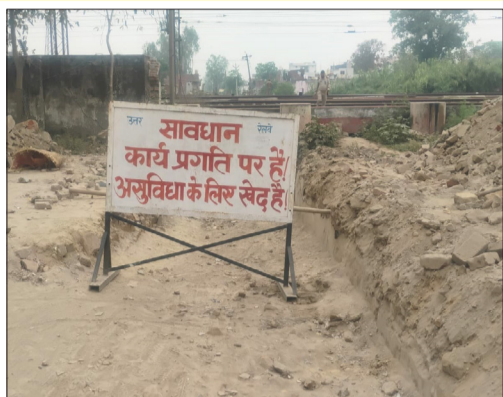
रोडवेज बस अड्डे के सामने बने अंडरपास के रास्ते को किया गया बंद।

रामपुर। राम रहीम पुल की मरम्मत के आवागमन बंद करने से उत्पन्न लोगों की परेशानी अभी तक दूर नहीं हो पाई है। रोडवेज बस अड्डे के सामने बने अंडरपास के हालत बदहाल है। पिछले कई रोज से साफ-सफाई का काम चल रहा है, जिस कारण से स्थिति जस की तस हो रही है। पनवड़िया वाला रेलवे क्रॉसिंग बंद होने के कारण इस भीषण गर्मी में घंटों लोग जाम में फंसे रहते हैं, लेकिन अभी तक कोई व्यवस्था नहीं की गई है। वैकल्पिक मार्ग अभी तक खराब होने के साथ-साथ जाम लग रहा है। जिससे लोगों को परेशान होना पड़ रहा है। कभी खराब रास्ते के कारण तो कभी