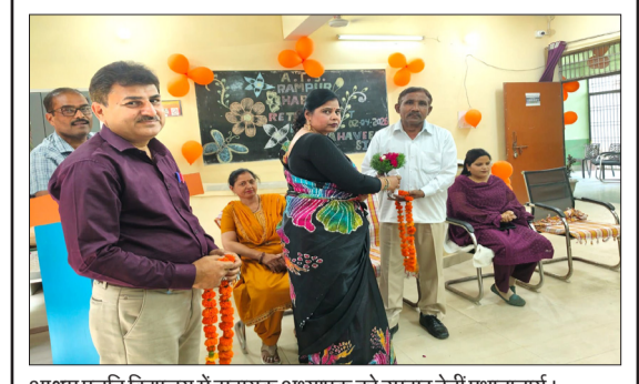
आश्रम पद्धति विद्यालय में सहायक अध्यापक को उपहार देती प्रधानाचार्य।