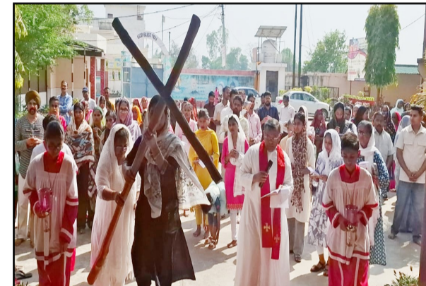
गुड फ्राइडे को क्रूस रास्ते में भाग लेते ईसाई समुदाय के लोग

जागरण मोर्चा कार्यालय पूरनपुर। नगर के चर्च में गुड फ्राइडे को विशेष प्रार्थना करण मनाया गया। ईसा मसीह के शहादत के दिन को मनाने के लिए बड़ी संख्या में एकत्रित ईसाई समुदाय के लोगों ने उनकी कुबानों को गमी के दिन के रूप में मनाया। पुरोहित ने क्रूस रास्ते का आयोजन कराया। ईसाई समुदाय के लोगों ने पुण्य शुरुवार को ईसा मसीह के शहादत के दिन के रूप में मनाया। नगर के एक मात्र सेंट जोसेफ चर्च में दुख भोग को मनाने के लिए बड़ी संख्या में नगर सहित आसपास के ग्रामीण क्षेत्रों से लोग विशेष प्रार्थना में शामिल होने के लिए आये। स्कूल प्रांगण के प्रभु ईसा मसीह के दुख भोग को दर्शन के लिए चैदह स्थानों को प्रतीक के रूप में चिह्नित किया गया था जहां पर क्रूस रास्ते का आयोजन किया