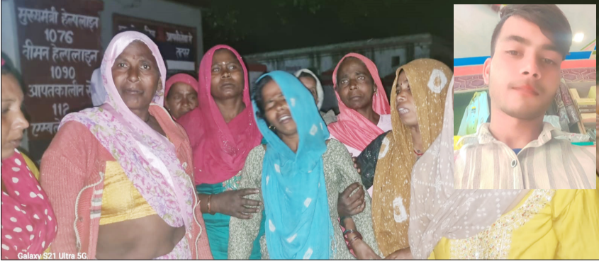
रोते मृतक के परिजन व इनसेटमें फाइल फोटो।

● गुरुवार देर शाम का मामला, बुआ के यहां रहकर बाइक मिस्त्री का काम सीख रहा था युवक जागरण मोर्चा कार्यालय