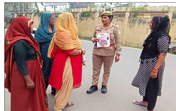
महिलाओं को जागरूक करती महिला पुलिसकर्मी।

रामपुर। मिशन शक्ति फेस - 5 अभियान के द्वितीय चरण अंतर्गत महिलाओं एवं बालिकाओं की सुरक्षा, सम्मान एवं सशक्तिकरण को सर्वोच्च प्राथमिकता देते हुए जनपद रामपुर के समस्त थाना क्षेत्रों में मिशन शक्ति केन्द्र की टीमों एवं जनपद स्तरीय टीम द्वारा व्यापक जागरूकता अभियान चलाया गया।