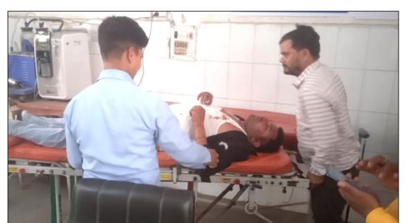
घायल श्रद्धालुओं को सीएचसी शाहबाद पर उपचार देते स्वास्थ्य कर्मी।