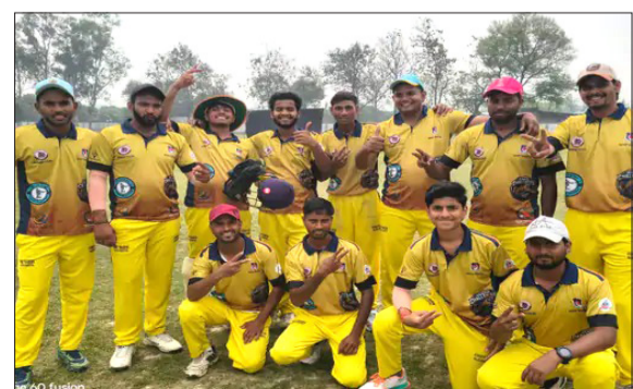
शहीद ए आजम स्पोर्ट्स स्टेडियम में खड़े विजयी टीम के खिलाड़ी।