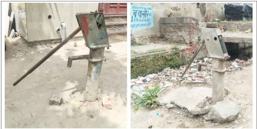
कैथल गेट पर खराब पड़ा हैंडपंप।