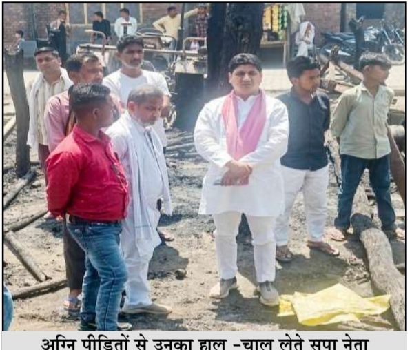
अग्नि पीड़ितों से उनका हाल-चाल लेते सपा नेता