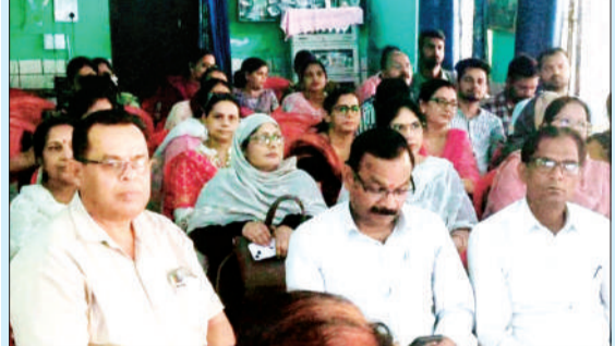
प्रशिक्षण प्राप्त करते प्रगणक।