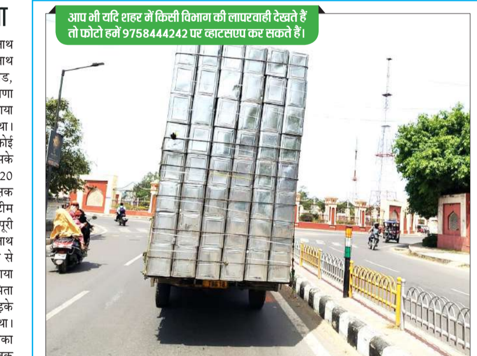
हद है लापरवाही की: चौराहों पर यातायात पुलिस ओवरलॉड वाहनों पर शिकंजा कसने को अभियान चला रही है। लेकिन इसके बाद भी शहर में ओवरलॉड वाहन घड़ल्ले से गुजर रहे हैं। -जागरण मोर्चा।

आप भी यदि शहर में किसी विभाग की लापरवाही देखते हैं तो फोटो हमें 9758442424 पर व्हाटसएप कर सकते हैं।