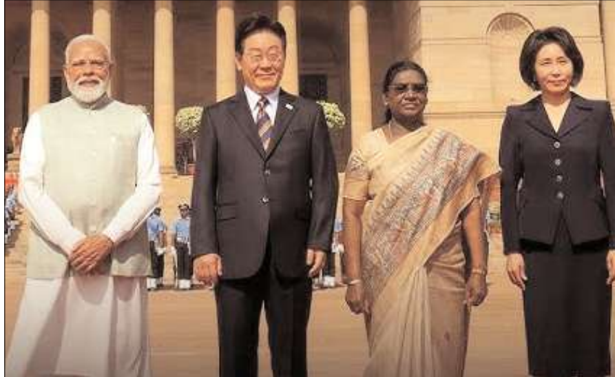
भारत और दक्षिण कोरिया के बीच बढ़ते रिश्तों को अब संस्कृति का मजबूत सहारा मिल रहा है। प्रधानमंत्री नरेंद्र मोदी ने साफ कहा है कि भारत में ड-पाँप और ड-ड्रामा तेजी से लोकप्रिय हो रहे हैं। इसी के साथ उन्होंने दोनों देशों के बीच सांस्कृतिक जुड़ाव को और मजबूत करने के लिए 2028 में भारत-कोरिया मैत्री महोत्सव आयोजित करने का बड़ा ऐलान किया है। इस कदम को दोनों देशों के रिश्तों में नई ऊर्जा के रूप में देखा जा रहा है।

आवश्यकता है और इस आवश्यकता को पूरा करना उन लोगों का कर्तव्य है जो स्वयं को भारतीय मानते हैं।" भागवत ने कहा कि इसके प्रचार-प्रसार के लिए प्रयास करने का आह्वान किया और राष्ट्र भाषाओं को जोड़ने वाली कड़ी क्या है? वह है संस्कृत।" भागवत ने संस्कृत भारती से देश में संस्कृत के व्यापक प्रचार-प्रसार के लिए प्रयास करने का आह्वान किया और