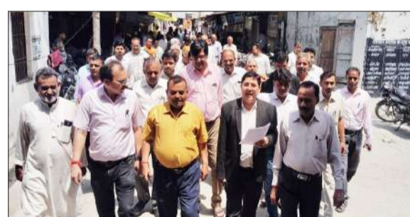
ज्ञापन देने जाते अधिवक्ता।

बार एसोसिएशन मिलक ने किया अनिश्चितकालीन कार्य बहिष्कार का ऐलान जागरण मोर्चा कार्यालय