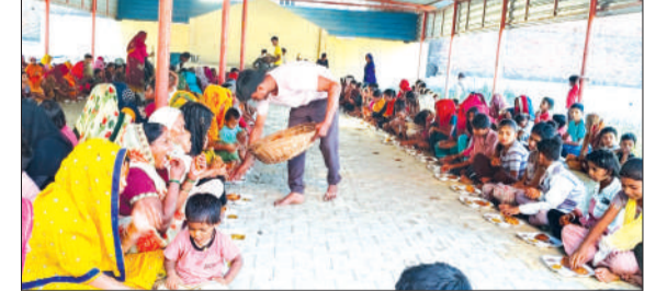
भंडारे में प्रसाद ग्रहण करते श्रद्धालु।