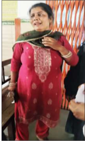
गार्ड से बातचीत करती पीड़ित जमना। घटनाएं सामने आ चुकी है। पहले अस्पताल में सुरक्षा के लिए

रामपुर। जिला अस्पताल में चिकित्सक को दिखाने आई महिला का पर्स छीन लिया। यह देख वह सीएमएस कक्ष पहुंची। जहां वह कक्ष में फूट-फूटकर रोने लगी। इसके बाद वह कक्ष के बाहर आ गई। इसी बीच उसने अस्पताल में तैनात गार्ड को जानकारी दी। वह गार्ड को लेकर कमरा नंबर 9 में जनरल सर्जन कक्ष में ले गई। इसके बाद उसने इसकी जानकारी चौकी पुलिस को दी।