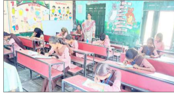
प्रतियोगिता में हिस्सा लेती छात्राएं।

सक्रिय सहभागिता अत्यंत सरहनीय रही। जिला विद्यालय निरीक्षक द्वारा