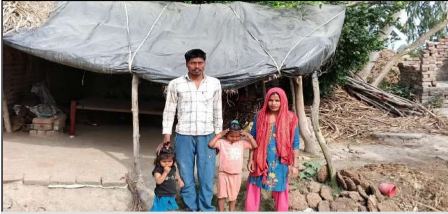
कलीनगर के लालपुर में दिव्यांग दंपति ने आवास दिलाने की गुहार लगाई

जागरण मोर्चा कार्यालय पूरनपुर। कलीनगर तहसील क्षेत्र के गांव लालपुर में एक ऐसा परिवार है। जिसमें पत्नी और पत्नी दोनों दिव्यांग हैं। उनके दो मासूम बच्चे भी हैं। रहने के लिए न पक्की छत है और न ही परिवार का भरण-पोषण करने के लिए जमीन। जैसे-तैसे दिव्यांग दंपति अपने परिवार की नैय्या चला रहे हैं। आवास के लिए वह पिछले कई साल से प्रधान, सचिव यहां तक कि खंड विकास कार्यालय के चक्कर काट रहे हैं लेकिन सुनवाई नहीं हो रही है। आवास योजना का लाभ न मिलने से दिव्यांग दंपति अपने दो बच्चों के साथ क्षतिग्रस्त छप्पर के ऊपर पन्नी तानकर गुजारा-बसर कर रहे हैं। बरसात के दिनों में खान-पाने आदि जरूरी सामान पानी में न भीगे उसे पड़ोसियों के यहां रखना पड़ता है। प्रदेश सरकार