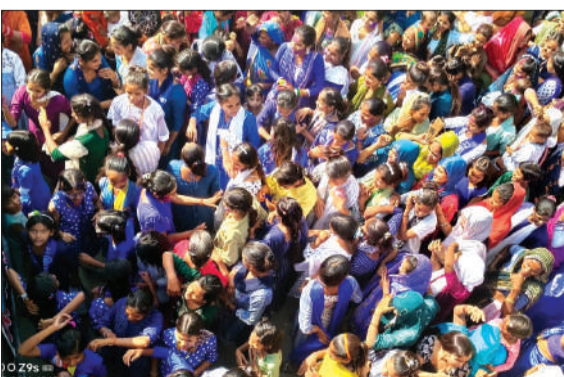
शोभायात्रा में शामिल जनसमूह।

जिससे शोभायात्रा की भव्यता बढ़ गई। शोभायात्रा के समापन पर जनसभा का आयोजित की गई। जिसमें वक्ताओं ने डा. आंबेडकर के जीवन दर्शन और समता के सिद्धांत पर जिन