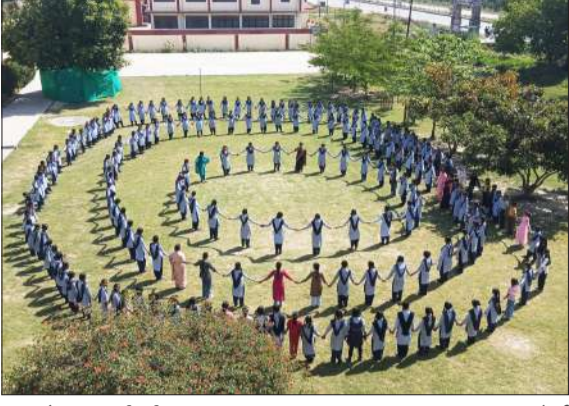
छात्राओं द्वारा बनाई गई मानव श्रृंखला।