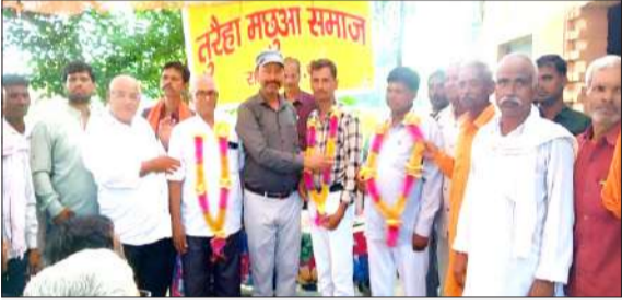
अधिकारियों का स्वागत करते जिलाध्यक्ष।

पिछड़ापन दूर करने के लिए समाज का एकजुट होना जरूरी जागरण मोर्चा कार्यालय