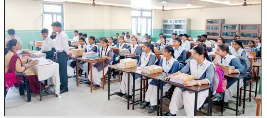
पूरनपुर के आरएसआरटीसी स्कूल में प्रतियोगिता में भाग लेते हुए बच्चे।