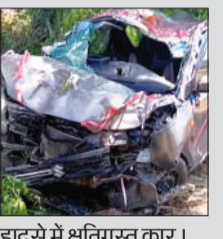
हादसे में क्षतिग्रस्त कार।