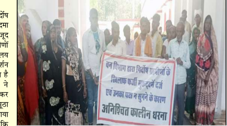
वन विभाग द्वारा ग्रामीणों के साथ की गई बूढ़े शोक की के खिलाफ अनिश्चितकालीन धरने पर बैठे ग्रामीण