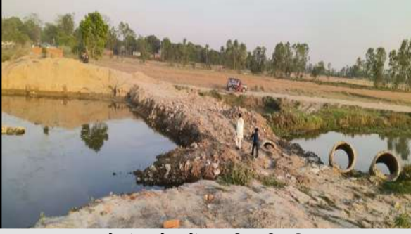
माधोटांडा क्षेत्र में अधूरी पड़ी पुलिया