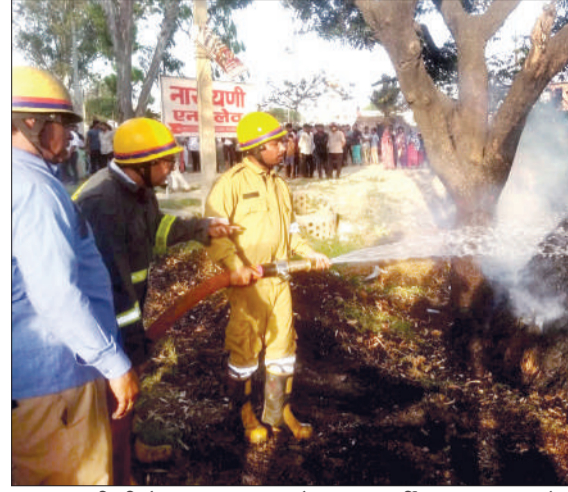
कार पर पानी की बौछार कर आग बुझाते दमकल कर्मी।