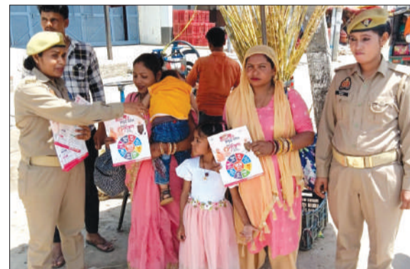
महिलाओं को जागरूक करती एंटी रोमियों की टीम। -जागरण मोर्चा

चन्दौसी। मिशन शक्ति अभियान के तहत महिलाओं व बालिकाओं को जागरूक किया जा रहा है। सोमवार को मिशन शक्ति टीम में शामिल महिला पुलिस कर्मियों द्वारा कार्यक्रम आयोजित कर बालिकाओं को जागरूक करने किया। इसके अलावा महिला संबंधित समस्याओं के निस्तारण कराने को चौपाल का आयोजन कर जागरूक किया गया। महिला एवं बालिकाओं के साथ जुड़कर उन्हें सशक्त एवं सुरक्षित वातावरण देने का प्रयास किया जा रहा है। द्वितीय चरण में मिशन शक्ति 5 अभियान के अंतर्गत जनपद की एंटी रोमियों टीम द्वारा प्रमुख बजारों, कस्बा, चौराहों, विद्यालयों, धार्मिक स्थलों