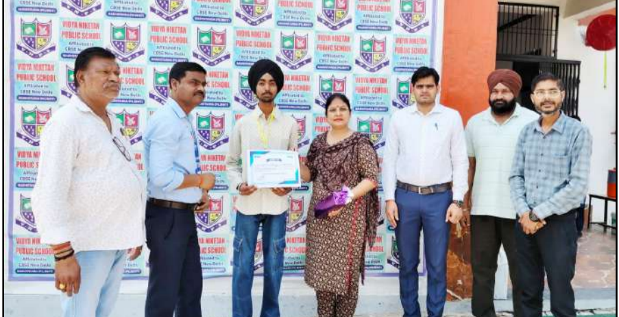
विद्या निकेतन पब्लिक स्कूल में मेधावी छात्रों को सम्मानित करते स्टेट बैंक आफ इंडिया की पदाधिकारी

ने विद्यार्थियों के उज्वल भविष्य की कामना करते हुए उन्हें आगे भी इसी प्रकार मेहनत और लगन के साथ सफलता की नई ऊंचाइयों को छूने के लिए प्रेरित किया। समारोह में भारतीय स्टेट बैंक के शाखा प्रबंधक ने अपने संबोधन में कहा कि शिक्षा ही वह माध्यम है, जो समाज और राष्ट्र को सशक्त बनाती है। उन्होंने छात्रों को निरंतर परिश्रम, अनुशासन और सकारात्मक सोच के साथ आगे बढ़ने का संदेश दिया। विद्यालय के संरक्षक एवं प्रबंधन समिति के सदस्यों ने भी