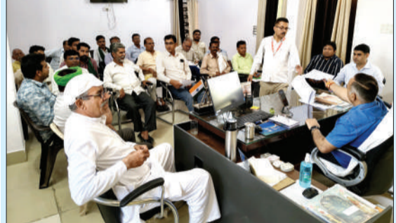
बैठक में मौजूद किसान, एसडीएम व अधिकारी।