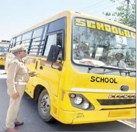
स्कूली बस के चालक से बातचीत करते उपनिरीक्षक।

रामपुर। यातायात पुलिस द्वारा जनपद में विशेष अभियान चलाकर स्कूली वाहनों की सघन चेकिंग की गई। इस दौरान वाहनों के फिटनेस प्रमाणपत्र, बीमा, रजिस्ट्रेशन, परमिट एवं अन्य आवश्यक प्रपत्रों का गहन निरीक्षण किया गया। चेकिंग के दौरान संबंधित वाहन चालकों एवं संचालकों को निर्देशित किया गया कि सभी आवश्यक दस्तावेज अद्यतन रखें तथा यातायात नियमों का पूर्णतः पालन करें। साथ ही स्कूली बच्चों की सुरक्षा को ध्यान में रखते हुए ओवर्लोडिंग न करने, वाहनों में निर्धारित सुरक्षा