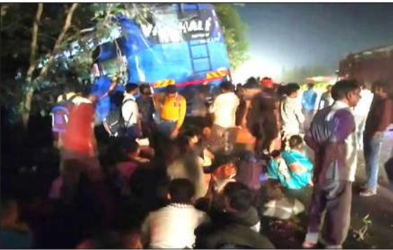
हादसे के बाद मौके पर लगी भीड़।

मिलक। बरेली हाईवे पर मिलक क्षेत्र में रविवार को बड़ा हादसा होते-होते टल गया। लुधियाना से जनपद गोंडा जा रही सवारियों से भरी डबल डेकर बस मोगा ढाबा के पास अनियंत्रित होकर हादसे का शिकार हो गई। बस में क्षमता से अधिक करीब 80 यात्री सवार थे। हादसे में कई यात्री घायल हुए हैं। जिनका उपचार कराया गया है। हादसे के बाद मौके पर चीख-पुकार मच गई। बताया जा रहा है कि यह बस डग्गामारी कर अवैध रूप से