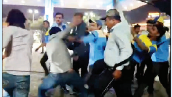
पेट्रोल पम्प पर आपस में भिड़ते सेल्समैन और युवक।