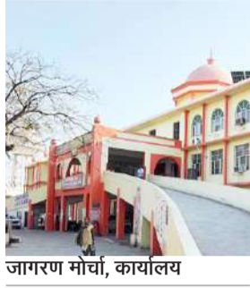
जागरण मोर्चा, कार्यालय

एक दिन बाद अस्पताल खुलते ही उमड़ी रोगियों की भीड़, सभी रोगियों को चिकित्सकों ने दिया परामर्श