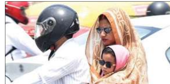
सोमवार को 44.4 डिग्री सेल्सियस अधिकतम तापमान के साथ प्रयागराज प्रदेश में सर्वाधिक गर्म रहा। वहीं 44 डिग्री के साथ वाराणसी प्रदेश में दूसरे नंबर पर रहा। वहीं हमीरपुर में 27.2 डिग्री

सोमभद्र, मिजापुर, चंदौली, वाराणसी, भदोही, जौनपुर, कासगंज, एटा, आगरा, फिरोजाबाद, मैनपुरी, इटावा, औरैया, शाहजहाँपुर, बदायूं, जालौन, हमीरपुर, महोबा, झांसी, ललितपुर व आसपास के इलाकों में लू की चेतावनी है। इन जिलों में है उष्ण रात्रि की संभावना सहारनपुर, शामली, मुजफ्फरनगर, बिजनौर, मुरादाबाद, रामपुर व आसपास के इलाकों में उष्ण रात्रि की संभावना है।