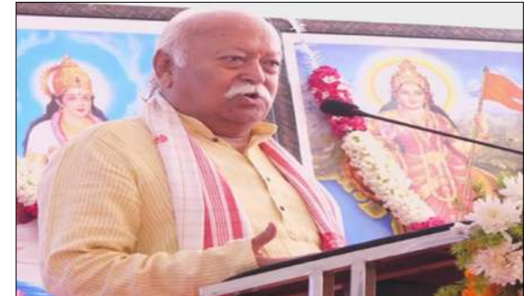
इसके 'ज्ञान की संपूर्ण संपदा' को भी समझना होगा, ताकि इसे जीवंत रखा जा सके और आगे बढ़ाया जा सके।" उन्होंने कहा, "यदि ये सब करना है, तो भारत को समझने के लिए संस्कृत को समझना अनिवार्य है। भारत में अनेक भाषाएं हैं। भारत की प्रत्येक भाषा अपने आप में एक राष्ट्र भाषा है। लेकिन इन विविध