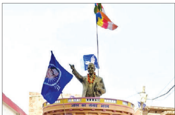
शोभायात्रा में शामिल डा. भीमराव आंबेडकर की झांकी।

चन्दौसी। नरौली क्षेत्र की ग्राम पंचायत मऊ अस्सू में डा. आंबेडकर पार्क में बाबा साहब की 135वीं जयंती पर गांव में शोभायात्रा के साथ जनसभा का आयोजन किया गया। बाबा साहब के चित्र पर पुष्प और माला अर्पित कर शोभायात्रा का शुभारंभ किया गया। यह शोभायात्रा आंबेडकर पार्क से शुरू होकर पूरे गांव में निकाली गई। शोभायात्रा में आर्कषक झांकियों ने सभी का मनमोह लिया। शोभायात्रा को देखने के लिए गांव की सड़कों के साथ घरों की छतों पर भारी भीड़ रही। शोभायात्रा में बैंड और डीजे पर युवा थिरकते हुए चल रहे थे। इसके साथ डा. भीमराव