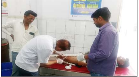
घायल युवक को उपचार करते स्वास्थ्य कर्मी।