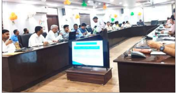
विकास भवन में सभागार में आयोजित बैठक में शामिल अधिकारी-कर्मचारी।