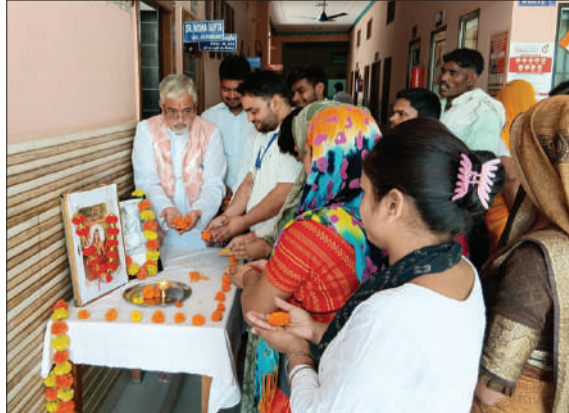
जयंती मनाते समिति पदाधिकारी।