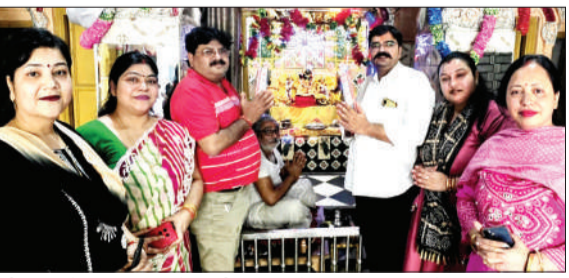
श्री मदनमोहन महाराज के प्राचीन मंदिर में पूजा अर्चना करते श्रद्धालु।