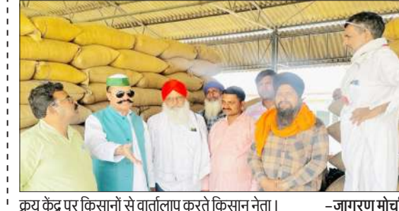
क्रय केंद्र पर किसानों से वार्तालाप करते किसान नेता।