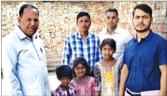
बच्चों को स्कूल भेजने के लिए अभिभावकों को जागरूक करते शिक्षक।

हसनपुर। प्रदेश सरकार के निर्देशानुसार चलाए जा रहे 'स्कूल चलो अभियान' के तहत मंगलवार को विकास क्षेत्र गंगेश्वरी के प्राथमिक विद्यालय गुलामपुर में विशेष जनसंपर्क अभियान चलाया गया। इस दौरान विद्यालय के शिक्षकों और स्कूल प्रबंध समिति के सदस्यों ने गांव की गलियों में घूमकर अभिभावकों को अपने बच्चों का स्कूलों में नवीन नामांकन कराने हेतु प्रेरित किया। अभियान का मुख्य फोकस उन परिवारों पर रहा, जिनके 6 से 14 वर्ष की आयु के बच्चे किन्हीं कारणों से अभी तक शिक्षा की मुख्यधारा से नहीं जुड़ पाए हैं। शिक्षकों ने घर-घर जाकर शिक्षा के महत्व को समझाया और सरकारी स्कूलों में मिलने वाली