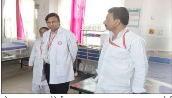
कोल्ड रूम का जायजा लेते सीएमएस।

हीट स्ट्रोक को देखते हुए तीसरी मंजिल पर बनाया गया है वार्ड