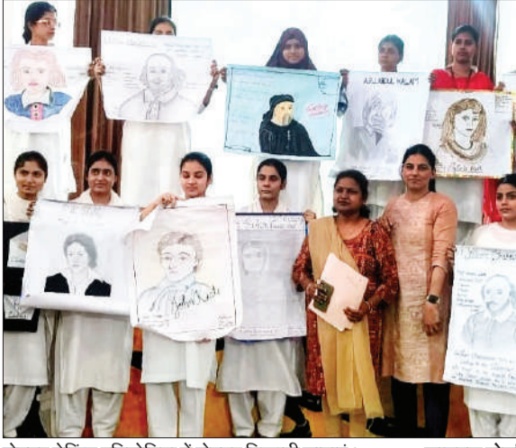
पोस्टर मेकिंग प्रतियोगिता में पोस्टर दिखाती छात्राएं।