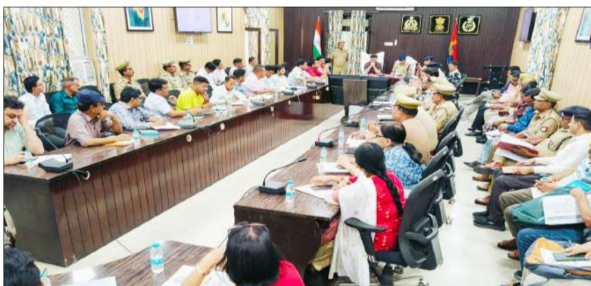
पुलिस लाइन में अधिकारियों के साथ बैठक करते डीएम और एसपी।