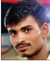
बंटी का फाइल फोटो।

चन्दौसी। बनियाठेर थाना क्षेत्र के पुराने बाईपास पर हादसे में युवक की मौत हो गई। घटना से परिवार में कोहराम मच गया। पुलिस ने शव पोस्टमार्टम के लिए भेजा है। मृतक युवक पांच बहनों में अकेला भाई था। हादसे के बाद से रहनों का बुरा हाल बना है।