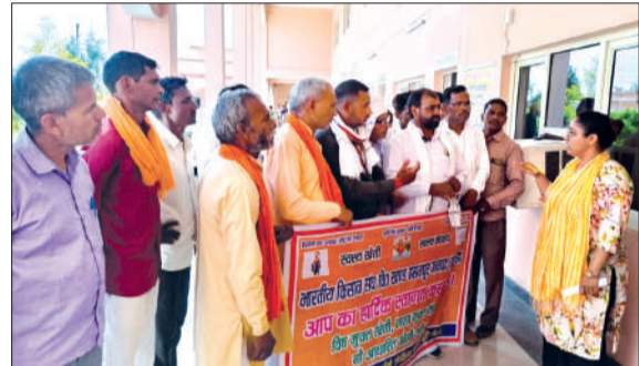
भारतीय किसान संघ तहसीलदार को ज्ञापन सौंपते हुए।

किसान नेताओं ने कहा कि उत्तर प्रदेश के अन्य जिलों में किसानों से मात्र 3% ब्याज लिया जा रहा है, जबकि इन तीन जिलों के किसानों के साथ भेदभाव करते हुए 7% ब्याज वसूला जा रहा है। संघ ने मांग की है कि वसूली को 3% किया जाए और अब तक वसूले गए अतिरिक्त 4% ब्याज