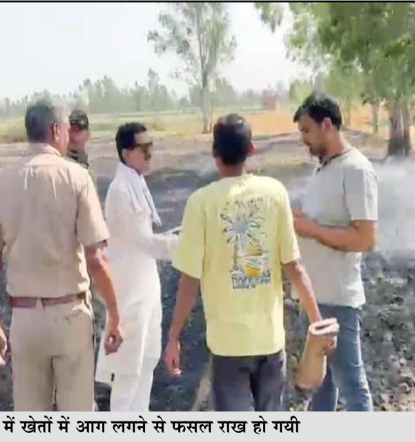
शेरपुर कला में खेतों में आग लगने से फसल राख हो गयी