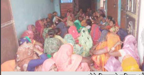
रोते विखलते परिजन और मौके पर मौजूद विधायक

संविदा कर्मचारी के पद पर तैनात था। गांव के बाहर उसका खेत है। सोमवार की रात करीब आठ बजे वह फसल की सिंचाई के लिए खेत पर गया था। बिजली मोटर खराब होने से वह उसको ठीक करने लगा। खेत गीला होने के चलते करंट दौड़ गया। जिससे संविदा कर्मचारी इसकी चपेट में आने से झुलस गया। इससे खलवली मच गई। कई लोग मौके पर एकत्र हो गए। सूचना पर