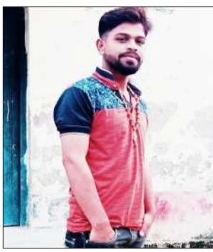
मृतक का फाइल फोटो।

काज में लगा हुआ था। आरोप है कि बरात चढ़ते के दौरान गांव के ही कुछ लोग उसको बुलाकर ले गए थे। जहां उसको लात घूसों से मारा। उसके बाद शराब में नशीला पदार्थ मिलाकर उसको पिलाया