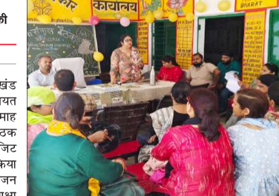
संकुल बैठक में बोली हुई शिक्षिका।

रामपुर। विकास खंड चमरोआ की न्याय पंचायत बकैनिया की अप्रैल माह की शिक्षक संकुल बैठक का आयोजन कंपोजिट विद्यालय हरदासपुर में किया गया। बैठक का आयोजन महानिदेशक स्कूल शिक्षा एवं राज्य परियोजना निदेशक के द्वारा निर्देशित एजेंडा के अनुसार किया। बताया कि सत्र के प्रारंभ में पहले 30 दिन विद्यालय की आनंदमय शिक्षक व प्रभावी शुरुआत के लिए योजना निर्माण, स्कूल रेंडिनेस फेस 2 आदि के बारे में बताया गया। स्कूल चलो अभियान के अंतर्गत कक्षा 1 व 6 में नवीन नामांकन अधिक से