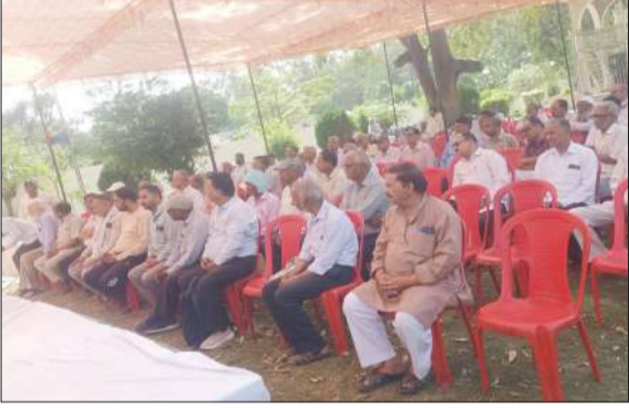
धरने में मौजूद पदाधिकारी।

देशभर के पेंशनरों में असंतोष का कारण उन्हें आठवें वेतन आयोग की सीमा में नहीं रखा गया : एनपी सिंह