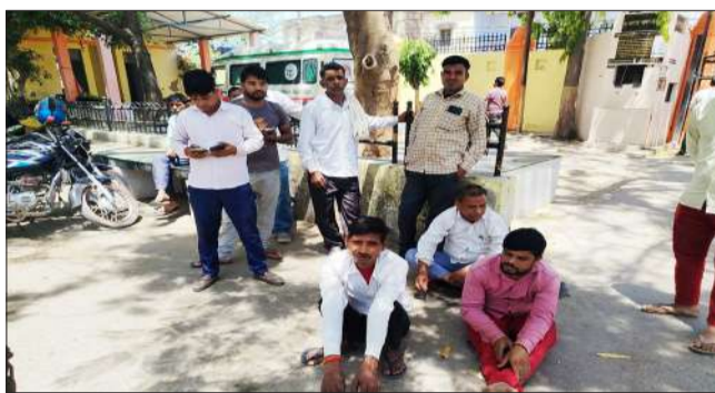
जिला अस्पताल में बैठे मृतक के परिजन।