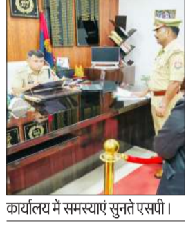
कार्यालय में समस्याएं सुनते एसपी।