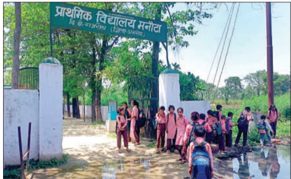
नाले के गंदे पानी में होकर स्कूल जाते बच्चे।