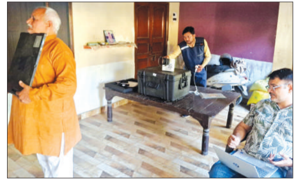
जांच करते ग्रामीण व मौजूद स्वास्थ्य टीम।

कांठ। तहसील क्षेत्र के ग्राम फत्तेपुर बिश्नोई व गोपालपुर नन्था नंगला में स्वास्थ्य विभाग द्वारा टीबी (क्षय रोग) की रोकथाम एवं समय पर पहचान के उद्देश्य से विशेष जांच कैंप का आयोजन किया गया। ग्राम फत्तेपुर बिश्नोई व गोपालपुर नन्था नंगला में आयोजित कैम्प में 37 महिलाओं व 49 पुरुषों सहित कुल 86 लोगों की स्क्रीनिंग की गई, जिनके चैस्ट एक्स-रे भी कराए गए। कैंप के दौरान स्वास्थ्य विभाग की टीम ने ग्रामीणों को टीबी के लक्षणों, इसके संक्रमण से बचाव तथा समय पर जांच और उपचार