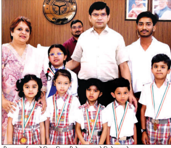
डीएम कार्यालय में जिलाधिकारी के साथ खड़े विजेता बच्चे।