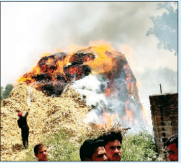
कोल्हू की खोई में लगी आग।

हसनपुर। कोतवाली क्षेत्र के एक गांव में आई बारात के स्वागत के दौरान हुई आतिशबाजी एक कोल्हू संचालक के लिए भारी पड़ गई। आतिशबाजी की चिंगारी से खोई के ढेर में भीषण आग लग गई, जिससे संचालक को लाखों रुपये की क्षति हुई है। जानकारी के अनुसार गांव मंगरीली निवासी कोल्हू की खोई में लगी आग।