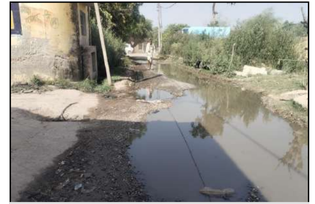
गांव उमरिया के पास बना तालाब ग्रामीणों को हो रही निकालने में दिक्कत

जागरण मोर्चा कार्यालय बीसलपुर। बरखेड़ा ब्लॉक क्षेत्र के गांव उमरिया का मुख्य मार्ग बदहाल होकर तालाब में तब्दील हो गया है। सड़क पर हर समय गंदा पानी भरा रहने से ग्रामीणों का आवागमन बेहद मुश्किल हो गया है। ग्रामीणों के अनुसार, यह मार्ग करीब 20 साल पहले पीडब्ल्यूडी द्वारा बनाया गया था, लेकिन तब से अब तक एक बार भी इसकी मरम्मत नहीं कराई गई। सड़क की जर्जर हालत के कारण पानी