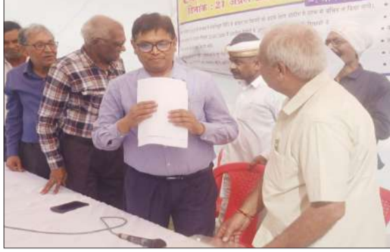
सिटी मजिस्ट्रेट को ज्ञापन देते पदाधिकारी।