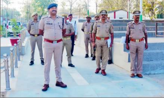
पुलिस लाइन का निरीक्षण करते एसपी।