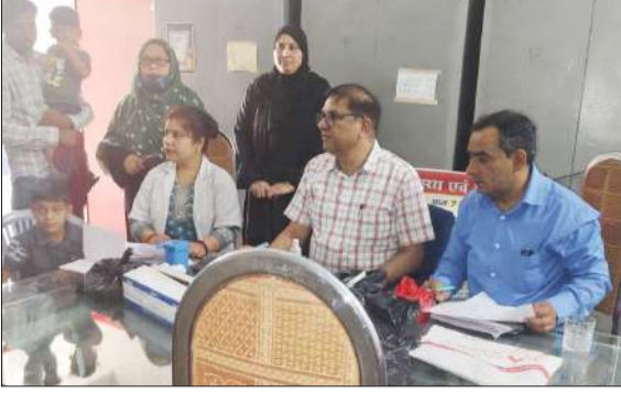
शाहबाद गेट स्थित सिंबोसिस स्कूल में बच्चों को टीका लगवाते अभिभावक।