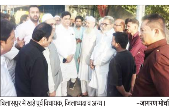
बिलासपुर में खड़े पूर्व विधायक, जिलाध्यक्ष व अन्य।

● जिलाधिकारी से मिला कांग्रेसियों का प्रतिनिधि मंडल