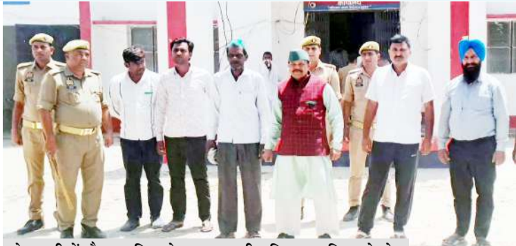
कोतवाली में मौजूद पुलिस के साथ भारतीय किसान यूनियन के नेता

जागरण मोर्चा कार्यालय सिंधौली, शाहजहांपुर। विकासखंड परिसर में कई दिनों से चल रहे भारतीय किसान यूनियन राष्ट्रीयतावादी गुट के धरना-प्रदर्शन पर सोमवार को प्रशासन ने सख्त रुख अपनाते हुए बड़ी कार्रवाई की। प्रदर्शनकारियों द्वारा ब्लॉक गेट पर ताला जड़ने और सीडीओ का पुतला दहन करने के बाद देर रात बीडीओ ने डेढ़ दर्जन से अधिक कार्यकर्ताओं के विरुद्ध प्राथमिकी पंजीकृत करायी। जिसके बाद पुलिस ने प्रांतीय उपाध्यक्ष सहित आधा दर्जन कार्यकर्ताओं को गिरफ्तार कर जेल भेजते हुए धरनास्थल पर लगा टेंट उखाड़कर फेंक दिया। भाकियू कार्यकर्ता पिछले कई दिनों से अपनी विभिन्न मांगों को लेकर ब्लॉक परिसर में धरना दे रहे थे। कार्यकर्ताओं की मांगें गेहूँ खरीद, बिजली विभाग तथा स्वास्थ्य और बाल विकास पुष्टाहार विभाग से जुड़ी थीं सोमवार को उस समय प्रदर्शन उग्र हो गया जब