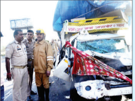
क्षतिग्रस्त वाहन को देखती पुलिस व अग्निशमन दल की टीम।