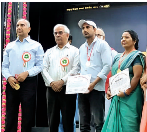
लखनऊ में सम्मानित होते अध्यापक।