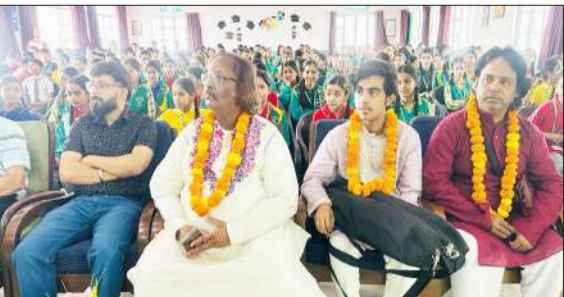
कार्यक्रम में मौजूद मुख्य अतिथि एवं बच्चे।