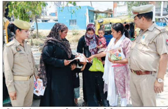
महिलाओं को जागरूक करती एण्टी रोमियो की टीम।

जिसमें महिलाओं एवं बालिकाओं के साथ जुड़ कर उन्हें सशक्त एवं सुरक्षित