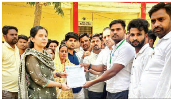
तहसील में एसडीएम को ज्ञापन सौंपते भाकियू टिकैत के पदाधिकारी।