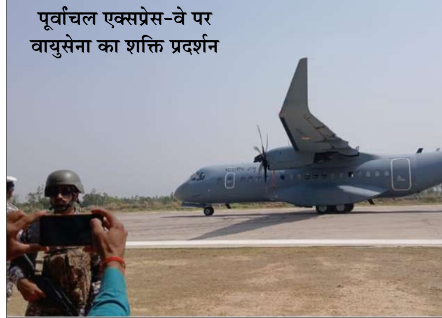
पूर्वांचल एक्सप्रेस-वे पर वायुसेना का शक्ति प्रदर्शन

विवाद की शुरुआत मंगलवार को चेन्नई में एक प्रेस कॉन्फ्रेंस के दौरान हुई। खरगे वहां अनाद्रमुक और भाजपा के गठबंधन की आलोचना कर रहे थे। उन्होंने पेरियार और सी.एन. अन्नादुराई को द्रविड़ विचारधारा का हवाला देते हुए सवाल उठाया कि अनाद्रमुक के लोग मोदी के साथ कैसे जा सकते हैं।