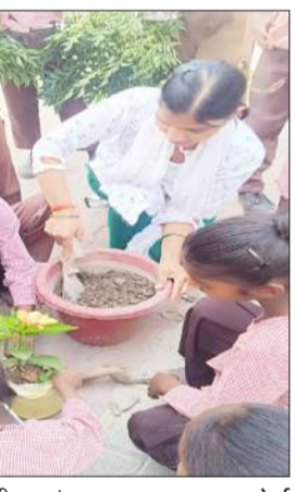
छात्राओं द्वारा रंगोली गमले में पौधा लगाती छात्राएं।

रामपुर। मॉडल प्राथमिक विद्यालय मुल्ला खेड़ा में पृथ्वी दिवस का आयोजन धूमधाम से किया गया। पेड़ बचाओ पर बच्चों द्वारा नाटक प्रस्तुत किया गया। चित्रकला प्रतियोगिता में कक्षा एक और दो के बच्चों द्वारा प्रतिभाग किया। पृथ्वी को बचाते हुए वलास 4 और पांच की