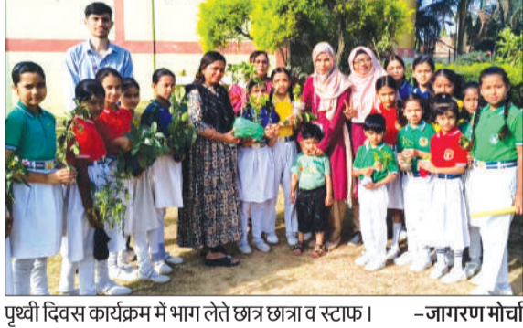
पृथ्वी दिवस कार्यक्रम में भाग लेते छात्र छात्रा व स्टाफ।

कांठ। द मिल्लत स्कूल, कांठ में बुधवार को पृथ्वी दिवस उत्साह एवं जागरूकता के साथ मनाया गया। कार्यक्रम के अंतर्गत विद्यालय परिसर में पौधरोपण भी किया गया। कार्यक्रम का शुभारंभ विद्यालय की प्रधानाचार्या एवं शिक्षकों द्वारा किया गया। इस अवसर पर पृथ्वी संरक्षण और पर्यावरण संतुलन को लेकर विभिन्न गतिविधियों का आयोजन किया गया। प्रधानाचार्या, शिक्षकों एवं विद्यार्थियों ने पृथ्वी दिवस के महत्त्व पर अपने विचार व्यक्त करते हुए पर्यावरण बचाने, जल संरक्षण करने तथा स्वच्छता बनाए रखने का संदेश दिया। विद्यार्थियों ने पृथ्वी बचाने से जुड़े प्रेरक