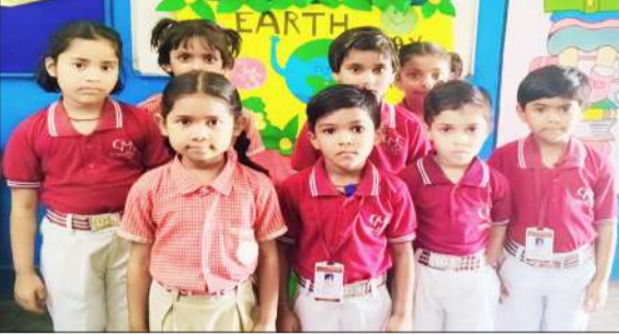
कार्यक्रम के दौरान मौजूद बच्चे।