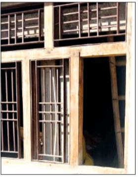
चोरों द्वारा तोड़ी गई खिड़की।

हसनपुर। बैटक की खिड़की तोड़कर मकान में दाखिल हुए चोरों ने 70 हजार की नकदी समेत लाखों रुपए के आभूषण व अन्य कीमती सामान चोरी कर लिया। गृह स्वामी के बेटे की 20 दिन पूर्व शादी हुई थी, जिसमें देहेज में मिला सभी समान भी चोर ले गए। बरामदे में सो रही गृह स्वामी व परिवार के अन्य लोगों को बुधवार सुबह घटना की जानकारी हुई। पुलिस ने मौका मुआयना किया है।