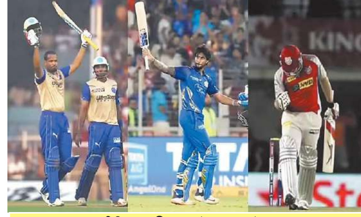
आईपीएल इतिहास में 5 नंबर के बाद

इस सीजन चेन्नई सुपर किंग्स की टीम ने 6 मुकाबले खेले हैं और इन 6 मुकाबलों में उन्हें सिर्फ 2 मैचों में ही जीत मिली है। वहीं चेन्नई सुपर किंग्स को लगातार झटके मिल रहे हैं। सीजन शुरू होने से पहले एमएस धोनी और नाथन एलिस चोटिल हो गए थे। इसके बाद चेन्नई सुपर किंग्स को बड़ा झटका तब लगा जब टीम के घातक तेज गेंदबाद खलिल अहमद भी इंजरी के कारण बाहर हो गए। अब इस लिस्ट में आयुष म्हात्रे का नाम भी शामिल हो गया है।