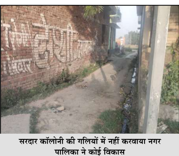
सरदार कॉलोनी की गलियों में नहीं करवाया नगर पालिका ने कोई विकास

जागरण मोर्चा कार्यालय बीसलपुर। नगर की सरदार कॉलोनी में वर्षों से खराब पड़ा रास्ता अब भी नहीं बन सका है। इस समस्या को लेकर पूर्व में अखबारों में प्रमुखता से खबरें प्रकाशित होने के बाद नगर पालिका कर्मचारियों ने मार्ग की नापत भी कर ली थी, लेकिन इसके बावजूद आज तक निर्माण कार्य शुरू नहीं हो पाया है। कॉलोनीवासियों का कहना है कि, जर्जर रास्ते के कारण योजना आवाजाही में भारी दिक्कत होती है। बरसात और अंधेरे के समय स्थिति और भी खराब हो जाती है, जिससे लोग फिसलकर गिर जाते हैं और चोटिल हो रहे हैं। स्थानीय लोगों ने आरोप लगाया कि नगर पालिका प्रशासन समस्या को नजरअंदाज कर रहा है। कई बार शिकायत के बावजूद कोई ठोस कार्रवाई नहीं हुई। कॉलोनीवासियों ने प्रशासन से जल्द से जल्द सड़क निर्माण कार्य शुरू कराने की मांग की है, ताकि उन्हें राहत मिल सके और हादसों से बचाव हो सके।