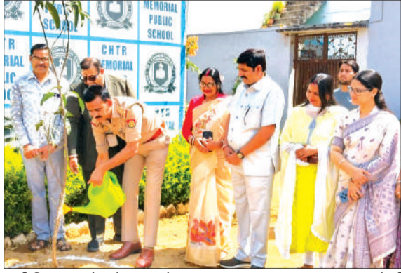
पृथ्वी दिवस पर पौधारोपण करते हुए।