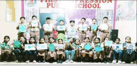
फर्स्ट इम्प्रेशन पब्लिक स्कूल में बनाए गए पोस्टर दिखाते बच्चे।