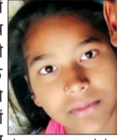
मौत का फाइल फोटो।

चन्दौसी। कोतवाली क्षेत्र के असालतपुर जारई रोड स्थित निजी हास्पिटल में 15 वर्षीय किशोरी की उपचार के दौरान मौत हो गई। परिजनों ने हास्पिटल स्टाफ पर उपचार में लापरवाही व मारपीट करने का आरोप लगाया। घटना की सूचना पर पुलिस मौके पर पहुंची और घटना की जानकारी। परिजनों की शिकायत पर पुलिस चिकित्सक व स्टाफ को हिरासत में लेकर