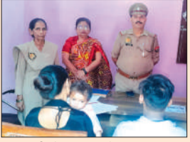
पति पत्नी से वार्ता करते काउंसलर।