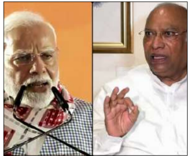
आतंकवादी कहे जाने पर गहरा संज्ञान लिया और मामले में नोटिस जारी किया। आयोग के

भारतीय चुनाव आयोग ने बुधवार को मल्लिकार्जुन खरगे द्वारा प्रधानमंत्री मोदी को