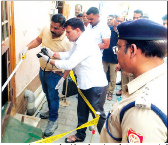
घटनास्थल से साक्ष्य जुटाती फारेसिक टीम व मौजूद सीओ।

गोली लगने से सेवानिवृत्त की मौत की सूचना मिली थी। घटना की जांच कराई जा रही है। फारेसिक टीम ने मौके पर पहुंच घटनास्थल से साक्ष्य जुटाए हैं।