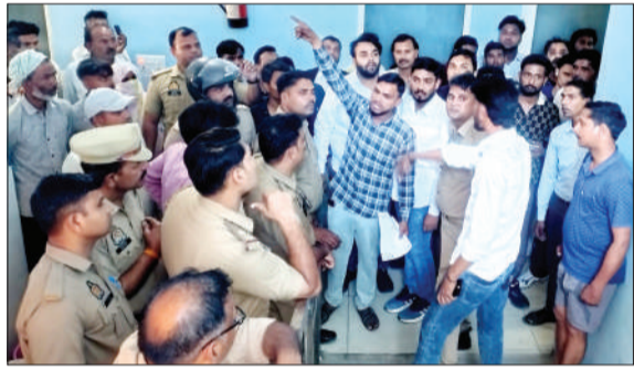
हास्पिटल में हंगामा करते परिजनों को रोकती पुलिस।