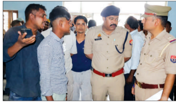
हास्पिटल में परिजनों से जानकारी करते सीओ।