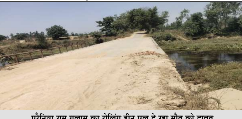
पूरैनिया राम गुलाम का रोलिंग हीन पुल दे रहा मौत का दाव

जागरण मोर्चा कार्यालय बीसलपुर। बरखेड़ा ब्लॉक क्षेत्र के ग्राम पूरैनिया रामगुलाम से गझेड़ी जाने वाले मार्ग पर बने पुल की रोलिंग न होने से सड़क की हालत बेहद खराब हो गई है। पुल और संपर्क मार्ग पर जगह-जगह दरारें पड़ गई हैं, जिससे आए दिन हादसे की आशंका बनी हुई है। ग्रामीणों का कहना है कि पुल निर्माण के बाद उचित रोलिंग और समतलीकरण कार्य नहीं कराया गया, जिसके चलते सड़क उखड़ने लगी है। दरारों के कारण दोपहिया और चारपहिया वाहनों के फिसलने का खतरा बना रहता है, खासकर रात के समय स्थिति और भी जोखिम भरी हो जाती है। स्थानीय लोगों ने