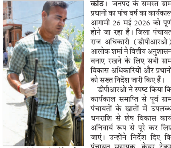
रायफल कब्जे लेकर जाते फारेसिक टीम।