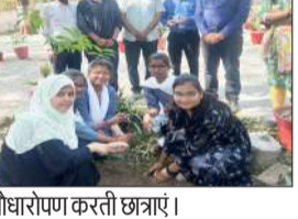
पौधारोपण करती छात्राएं।