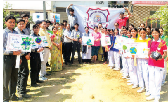
आवास विकास के पार्क में पौधरोपण के बाद संदेश पोस्टर के साथ बच्चे।