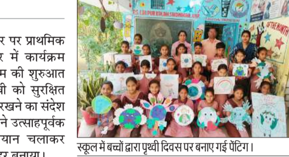
स्कूल में बच्चों द्वारा पृथ्वी दिवस पर बनाए गई पेंटिंग।

रामपुर। पृथ्वी दिवस के अवसर पर प्राथमिक विद्यालय लालपुर कला सदन में कार्यक्रम का आयोजन किया गया। कार्यक्रम की शुरुआत प्रार्थना सभा से हुई। जिसमें पृथ्वी को सुरक्षित रखने और स्वच्छ वातावरण बनाए रखने का संदेश दिया इसके पश्चात छात्र-छात्राओं ने उत्साहपूर्वक वृक्षारोपण किया। स्वच्छता अभियान चलाकर विद्यालय परिसर को स्वच्छ एवं सुंदर बनाया। विद्यालय के शिक्षकों ने बच्चों को पर्यावरण संरक्षण के महत्व के बारे में विस्तार से बताया। उन्होंने समझाया कि पेड़-पौधे हमारे जीवन का आधार हैं और इनके बिना स्वस्थ जीवन की कल्पना संभव नहीं है। साथ ही सभी से अधिक से अधिक पौधे लगाने और प्लास्टिक के उपयोग को कम करने की अपील की गई। कार्यक्रम के दौरान बच्चों ने रंग-बिरंगे पोस्टर बनाकर, प्रेरणादायक कविताएं सुनाकर और उत्साहपूर्ण नारों के माध्यम से पृथ्वी बचाओ का संदेश प्रभावी ढंग से प्रस्तुत किया। पूरे वातावरण में पर्यावरण संरक्षण के प्रति जागरूकता