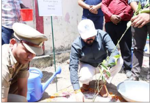
बमनपुरी स्टेडियम में पौधारोपण करते डीएम।

सरकारी, अर्द्धसरकारी स्कूलों में मनाया गया पृथ्वी दिवस, जिलाधिकारी के नेतृत्व में बमनपुरी स्टेडियम में पौधारोपण कार्यक्रम हुआ