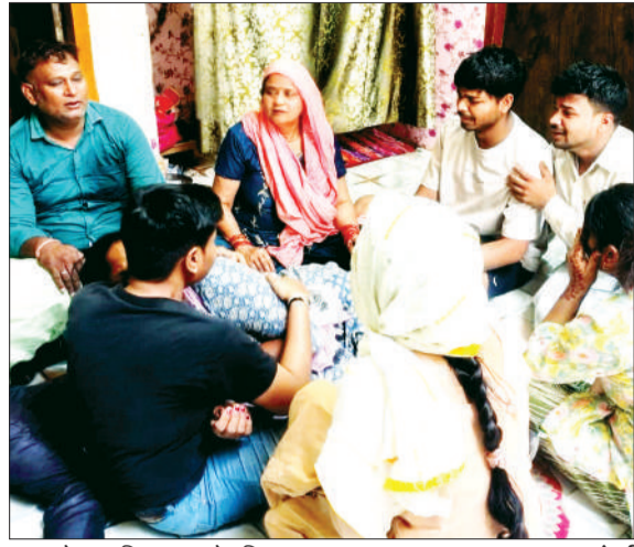
घटना के बाद विलाप करते परिजन।

रहते हैं। उन्होंने तीन वर्ष पहले अपने पद से वीआरएस ले लिया था। वह अक्सर बैठक में रहते थे और बैठक का घर में खुलने वाला दरवाजा बंद रखते हैं, जबकि बाहर खुलने वाला दरवाजा खुला रहता था। सुबह 10.45 बजे बैठक से गोली चलने की आवाज आई तो घर में मौजूद पत्नी, बच्चों के