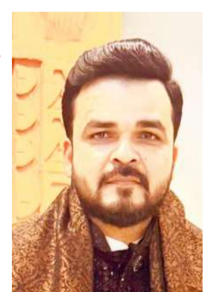
जिसमें आमजन का सहयोग अत्यंत आवश्यक है।