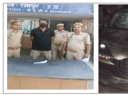
पुलिस द्वारा गिरफ्तार किया आरोपी व घटना में शामिल खडी रिक्वाट कार।

कालोनी थाना लिसाडीगेट जनपद मेरठ को रविवार दोपहर खजुआ खेड़ा रोड पर गैस एजेंसी के बराबर से एक अदद तमंचा 315 बोर मय एक अदद जिन्दा कारतूस के साथ गिरफ्तार कर लिया। कोतवाली पुलिस मामले की गहन जांच कर रही है और सभी पहलुओं पर तह तक पहुंचने का प्रयास कर रही है। आरोपी युवकों की पहचान हो चुकी है और उनकी तलाश जारी है। नगर में फैली चर्चा के अनुसार विवाद सोने के लेनदेन से जुड़ा बताया जा रहा है। पुलिस तहरीर में अंकित तथ्यों के साथ अन्य सभी पहलुओं पर बारीकी से जांच कर रही है।