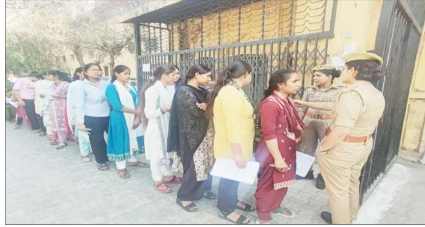
होमगार्ड की परीक्षा देने जाते परीक्षार्थी।