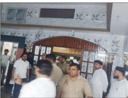
पीड़ित के घर पर मौजूद कोतवाली पुलिस।

टांडा। नगर के मोहल्ला काजीपुरा में शनिवार रात लगभग 8:40 बजे एक व्यक्ति के अपहरण के प्रयास एवं मारपीट का मामला सामने आया है। पीड़ित के अनुसार स्विकफ्ट कार में सवार चार युवकों ने लाठी-डंडों और तमंचों से लैस होकर उसके घर पर हमला बोल दिया। उन्होंने बताया कि वे अपहरण करने और फिरौती मांगने की प्लानिंग के साथ आए थे। पुलिस