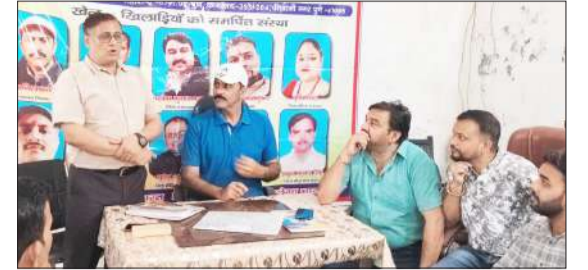
क्रोडा भारती की बैठक में बोले वक्ता।