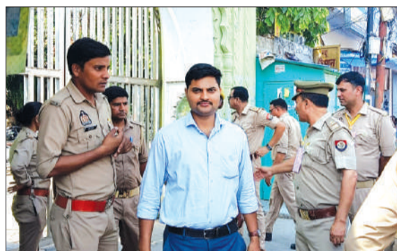
कड़ी सुरक्षा व्यवस्था के बीच पहले दिन परीक्षा केंद्रों पर मौजूद पुलिस बल।

बरेली। उत्तर प्रदेश होमगार्ड्स के पदों पर भर्ती के लिए लिखित परीक्षा शनिवार से जिले के 19 केंद्रों पर शुरू हो गई। कड़ी सुरक्षा व्यवस्था के बीच पहले दिन परीक्षा शांतिपूर्ण ढंग से संपन्न कराई गई। तीन दिन तक चलने वाली इस परीक्षा में कुल 52,416 अभ्यर्थी शामिल होंगे। होमगार्ड एनरोलमेंट-2025 की महार परीक्षा 25 से 27 अप्रैल तक दो-दो पालियों में आयोजित की जा रही है। पहली पाली सुबह 10 बजे से दोपहर 12 बजे तक, जबकि दूसरी पाली दोपहर 3 बजे से शाम 6 बजे तक होगी। हर पाली में 8,736 अभ्यर्थी पंजीकृत हैं, जिससे सभी केंद्रों पर भारी भीड़ रही। परीक्षा को निष्पक्ष और पारदर्शी बनाने के लिए