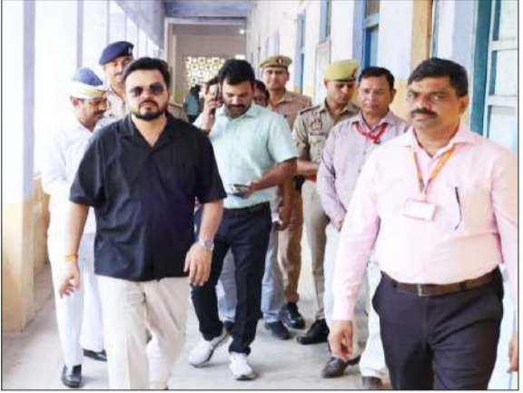
परीक्षा केंद्र का निरीक्षण करते डीएम।