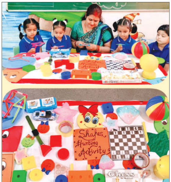
बेनहर स्कूल में बिट्स एंड बोर्ड व शोप्स हंटिंग गतिविधियों में भाग लेते बच्चे।