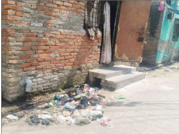
कालोनी में सड़क किनारे लगा कूड़े का ढेर।