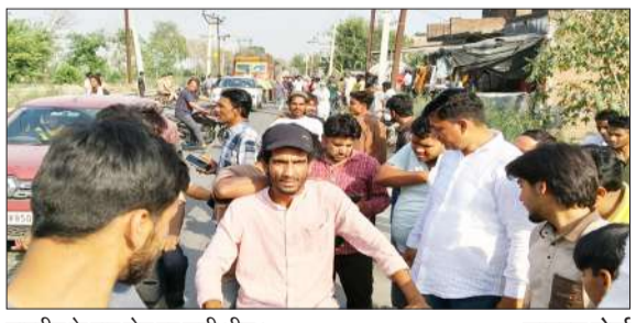
मारपीट के बाद रोड पर लगी भीड़।