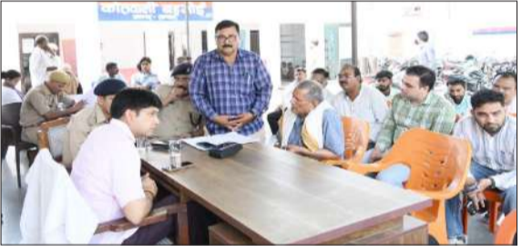
लोगों की शिकायतों का निस्तारण करते डीएम।