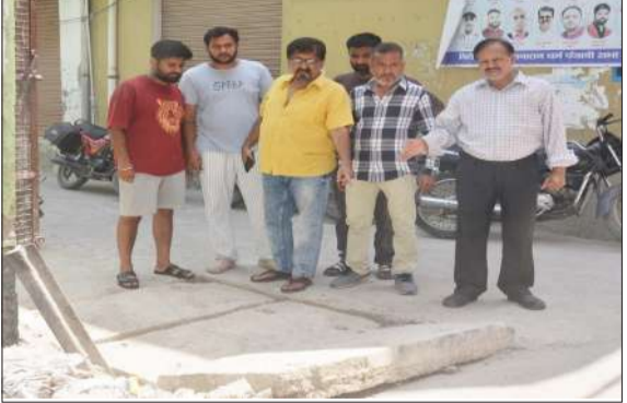
सड़क निर्माण के खामियां दिखाते स्थानीय लोग।

चन्दौसी। कागजी मोहल्ले में सड़क निर्माण मानक के अनुसार नहीं होने, कई त्रुटियां होने के विरोध में मोहल्लों के लोगों ने प्रदर्शन किया। साथ ही सड़क निर्माण के बाद सड़क पर पड़ा मलबे को नगर पालिका से हटाने की मांग की है। कागजी मोहल्ले में पंजाबी मंदिर से फव्वारा चौक स्थित गोविंद बल्लभ पंत विद्यालय तक सड़क का निर्माण 3 माह पहले किया था। शनिवार को मोहल्लों के लोगों ने सड़क मानक के अनुरूप नहीं डलने व कई त्रुटियों होने के विरोध में ठेकेदार के विरुद्ध प्रदर्शन किया। लोगों का कहना है कि सड़क निर्माण के बाद नाले के