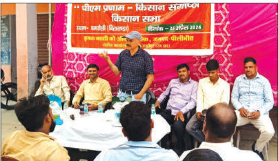
बिलसंडा के कस्बा बमरोली में आयोजित संगोष्ठी में कृषि से संबंधित जानकारी देते वैज्ञानिक।

पूरनपुर तहसील क्षेत्र के गांव चंदिया हजारों में करीब 415 विस्थापित परिवार हैं। वह आवंटित जमीन पर खेती कर अपने परिवार की नैय्या चला रहे हैं। विस्थापित परिवारों की भूमि पर किसान पंजीकरण नहीं होता है लेकिन गन्ना विभाग द्वारा