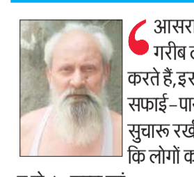
न हो। -शम्स खां

आसरा कॉलोनी में गरीब लोग निवास करते हैं, इस कॉलोनी में भी सफाई-पानी की व्यवस्था सुचारु रखी जाए, जिससे कि लोगों को कोई दिक्कत न हो। -शम्स खां