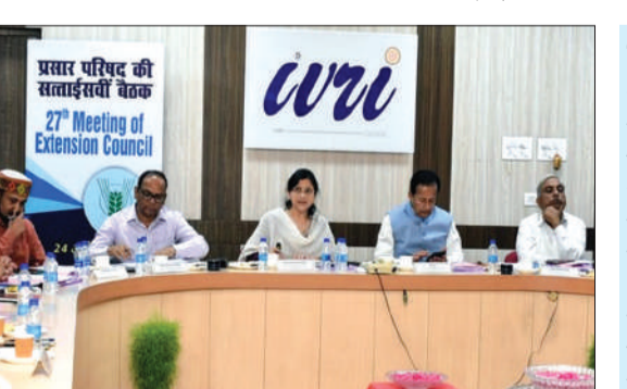
आईवीआरआई में आयोजित बैठक मौजूद अधिकारी।

के बेहतर प्रसार, प्रशिक्षण कार्यक्रमों को बढ़ाने और किसानों से मिले फीडबैक के आधार पर सुधार की जरूरत बताई। उन्होंने संस्थान की पहुंच बढ़ाने के लिए ओपन डे, लघु वीडियो और स्कूल-कॉलेजों से संवाद जैसे नवाचारों को अपनाने पर भी जोर दिया। सहायक महानिदेशक