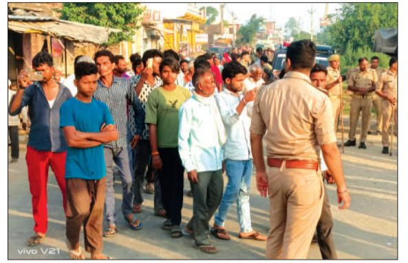
मौके पर मौजूद पुलिस व अधिकारी।

कांठ। थाना क्षेत्र के ग्राम मुजफ्फरपुर टांडा में बिना प्रशासनिक अनुमति के बाबा साहेब डॉ. भीमराव अंबेडकर की प्रतिमा स्थापित किए जाने की सूचना पर पुलिस प्रशासन में हड़कंप मच गया। मौके पर पहुंची पुलिस ने रात में ही प्रतिमा को हटाकर अपने कब्जे में ले लिया, जिससे अगले दिन ग्रामीणों में आक्रोश फैल गया।