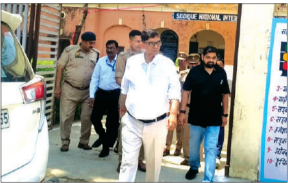
सिद्दी की नेशनल इंटर कॉलेज का जायजा लेते हुए डीएम व एसपी।