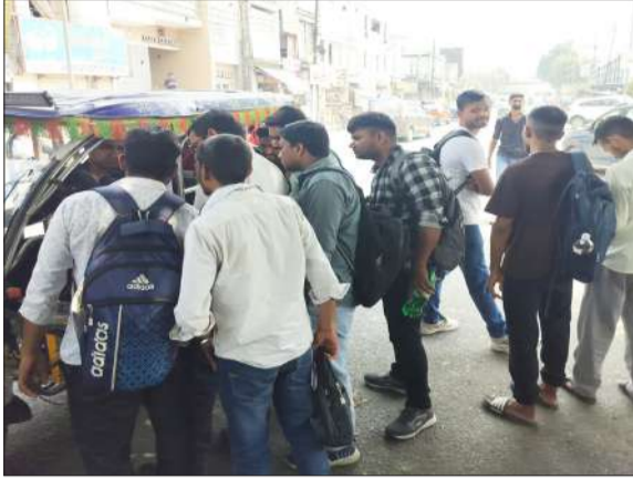
रोडवेज जाने के लिए ई रिक्शा करते परीक्षार्थी।