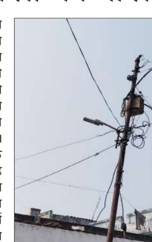
मोहल्ला नगरिया वार्ड नंबर 18 में जर्जर पोल।

10 से ज्यादा बार नगर पालिका और बिजली घर में शिकायत की, पर हर बार सिर्फ आश्वासन मिला। मोहल्ले की गली इतनी संकीरी है कि पोल गिरा तो सीधे घरों पर गिरेगा। स्कूल जाने वाले बच्चों और बुजुर्गों का इस रास्ते से निकलना दुःख हो गया है। महिलाएं बताती हैं कि बारिश के दिनों में करंट का डर और बढ़ जाता है। मोहल्ले वालों का आरोप है कि 2023 में आंधी से पोल टेढ़ा हुआ था। तब विभाग ने खानापूर्ति के लिए उसे तार से बांध दिया। तब से आज तक कोई सुध लेने नहीं आया। क्या प्रशासन किसी बड़ी घटना का इंतजार कर रहा है।