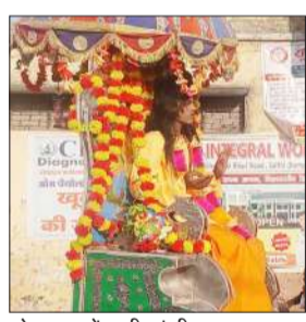
शोभायात्रा में सजी झांकी।