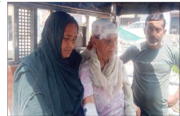
शाहबाद में बंदरों के हमले में बुजुर्ग महिला।

शाहबाद। शनिवार को शाहबाद नगर की एक बुजुर्ग महिला पर बंदरों के झुंड ने हमला बोल दिया, बंदरों के हमले में बुजुर्ग महिला गंभीर रूप से घायल हो गईं, जिनको उपचार के लिए परिजन शाहबाद के सामुदायिक स्वास्थ्य केंद्र पहुंचे जहां पर डॉक्टरों ने बुजुर्ग