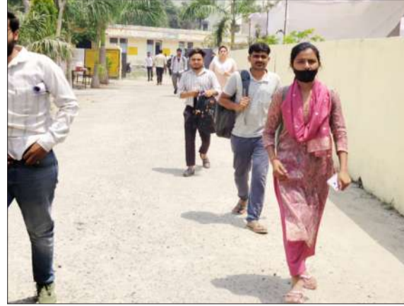
परीक्षा देकर बाहर निकलते परीक्षार्थी।