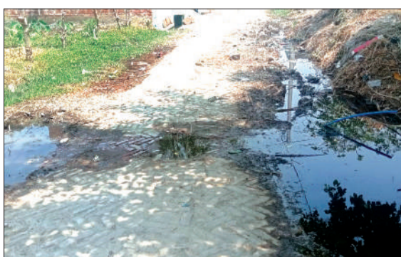
गांव नवविद्या प्यार में सड़क पर भारी गंदगी में पनप रहे मच्छर।

गांवों में सफाई व्यवस्था बेपटरी होने की वजह से जगह-जगह कूड़े के ढेर एवं चोक नालियों के कारण सड़क पर जलभराव होने से लोगों को आवागमन में भारी परेशानी उठानी पड़ रही है। लेकिन इसके बाद भी सफाई व्यवस्था सुदृढ़ कराने की दिशा में कोई प्रयास नहीं किया जा रहा है। इतना ही नहीं कई सफाई कर्मियों को अनाधिकृत रूप से एडीओ पंचायत कार्यालय में हर वक्त बाबू गीरी करते हुए भी देखा जा सकता है। इन सफाई कर्मियों को गांवों में सफाई