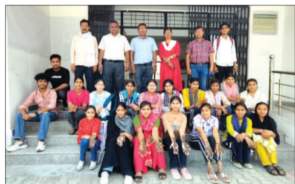
कार्यक्रम के समापन में उपस्थित छात्र छात्रा व स्टाफ।