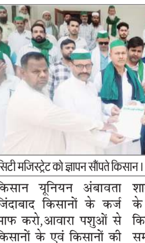
सिटी मजिस्ट्रेट को ज्ञापन सौंपते किसान।