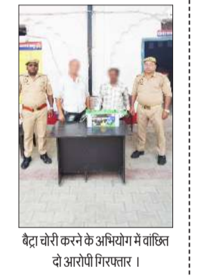
बेटा चोरी करने के अभियोग में वांछित दो आरोपी गिरफ्तार।