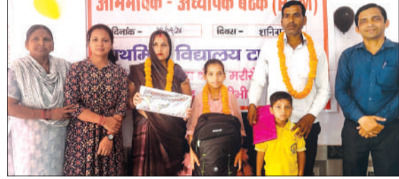
टाह पौटा के विद्यालय में पेट्टीएम में भाग लेते अभिभावक।