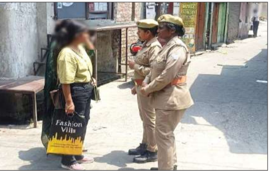
महिलाओं को जागरूक करती पुलिस कर्मी।

रामपुर। मिशन शक्ति फेस - 5.0 अभियान के द्वितीय चरण अंतर्गत महिलाओं एवं बालिकाओं को सुरक्षा, सम्मान एवं सशक्तिकरण को सर्वोच्च प्राथमिकता देते हुए को महिला सुरक्षा दल जनपद रामपुर द्वारा व्यापक जागरूकता अभियान चलाया गया। जिसमें महिला सुरक्षा एवं आत्मरक्षा से जुड़े आवश्यक उपाय, कानूनी अधिकार, नारी सम्मान से संबंधित प्रावधान एवं हेल्पलाइन सेवाओं 1090 महिला शक्ति हेल्पलाइन, 181 महिला हेल्पलाइन, 112 आपातकालीन सेवा, 1098 चाइल्ड हेल्पलाइन की कार्यप्रणाली एवं उपयोगिता तथा घरेलू हिंसा, छेड़छाड़, ऑनलाइन उत्पीड़न तथा इनके विरुद्ध त्वरित कार्रवाई की प्रक्रिया आदि मिशन शक्ति टीम द्वारा महिलाओं, बालिकाओं को पंपलेट, कॉमिक्स एवं जागरूकता सामग्री वितरित की। ताकि वे अपने अधिकारों एवं सुरक्षा उपायों को आसानी से समझ सकें। आवश्यकता पड़ने पर उनका प्रभावी उपयोग कर सकें।