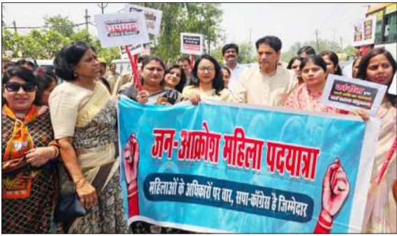
पैदल मार्च निकालती महिलाएं।