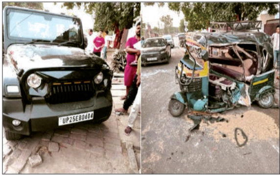
सड़क पर मौजूद थार की टक्कर से क्षतिग्रस्त टेंपो।

बरेली। कैट थाना क्षेत्र के गांव बधिया में शुक्रवार देर रात तेज रफतार और नशे का खौफनाक मेल एक बेगुनाह की जान ले गया। ग्रामीण बैंक के पास दौड़ रही थार गाड़ी ने सामने से आ रहे टेंपो को जोरदार टक्कर मार दी।