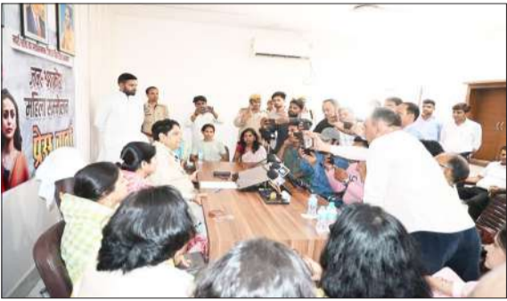
प्रेसवार्ता करते मुख्य अतिथि।

उन्होंने कहा कि नारी शक्ति वंदन अधिनियम और उससे जुड़े