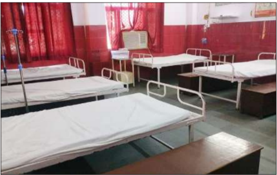
जिला महिला चिकित्सालय में बनाया गया कोल्ड रूम।

रामपुर। गर्मी का प्रकोप बढ़ने के साथ जिला महिला अस्पताल में छह बेडों का कोल्ड रूम बनाया गया है। हीट स्ट्रोक की चपेट में आने वाले मरीजों को अस्पताल में बने कोल्ड रूम में रखा जाएगा। जहां पर गर्मी के बजाय शीतलता का एहसास हो। कोल्ड रूम में रोगियों को जरूरी दवाई दी जाएगी। साथ ही वार्ड में रखे फ्रिज में आइस पैक भी रिजर्व किए गए हैं। यह पैक शरीर को