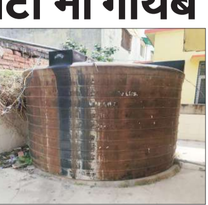
प्याऊ के पीछे रखा 5000 लीटर टैंक।