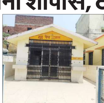
जिला अस्पताल में बना प्याऊ।