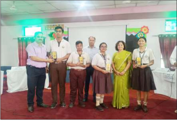
पुरस्कार के साथ मौजूद क्विज के छात्र-छात्राएं एवं मुख्य ग्रीनवुड स्कूल के प्रधानाचार्य।

रामपुर। शनिवार को ग्रीनवुड सीनियर सेकेंडरी स्कूल में साईंस क्विज का आयोजन किया गया। यह कार्यक्रम पृथ्वी दिवस के अवसर पर आयोजित किया गया। हर वर्ष की तरह इस वर्ष भी इस इस विज्ञान प्रश्नोत्तरी कार्यक्रम में मेजबान ग्रीनवुड स्कूल सहित सीबीएसई के 11 स्कूलों ने भाग लिया। इस साईंस क्विज प्रतियोगिता में ग्रीनवुड स्कूल के दोनों वर्गों कक्षा 6 से 8 तथा 9 से 12 की टीम ने खिताब पर कब्जा जमाया।