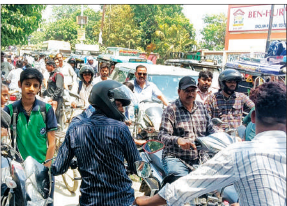
पीलीभीत में बेलगाम रोड पर स्कूलों की छुट्टी के बाद लगा हुआ जबरदस्त जाम।

पीलीभीत। शनिवार को बिलगवा रोड स्थित बेन-हर पब्लिक स्कूल के सामने की सड़क उस वक्त 'सड़क नहीं, बल्कि जंग का मैदान' बन गई, जब वहां भीषण जाम लग गया। एक तरफ आसमान से बरसती आग और 40 डिग्री सेल्सियस का टॉर्चर, तो दूसरी तरफ रेंगते वाहनों के धुएं ने आम जनता का जीना मुहाल कर दिया।