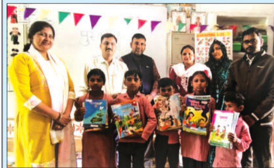
पाठ्य पुस्तकें लिये शिक्षकों के साथ खड़े बच्चे।