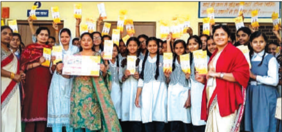
मिशन शक्ति अभियान कार्यक्रम में मौजूद शिक्षिकाएं।