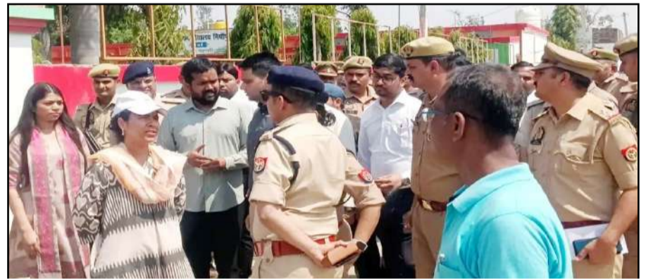
सीएम के आगमन को लेकर डीएम एसपी ने विधायक के साथ किया ग्राम मियांपुर का निरीक्षण