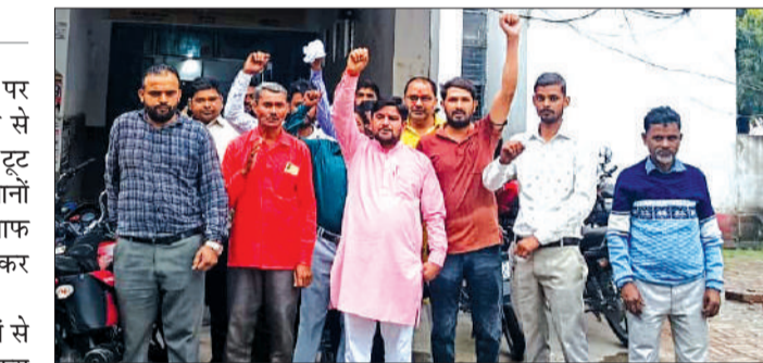
मिलक तहसील में प्रदर्शन करते किसान।

रामपुर। सरकारी गेहूं क्रय केंद्रों पर व्याप्त अव्यवस्थाओं और अनदेखी से नाराज किसानों का सब्र आखिरकार टूट गया। बारिश के बीच भीगते हुए किसानों ने प्रदर्शन कर प्रशासन के खिलाफ नारेबाजी की। अपनी मांगों को लेकर आवाज बुलंद की। बताया गया कि किसान कई दिनों से अपने गेहूं की तौल कराने के लिए क्रय केंद्रों के चक्कर काट रहे थे, लेकिन उन्हें बार-बार टाल दिया जा रहा था। सोमवार को जब किसान बड़ी संख्या में केंद्र पहुंचे, तभी अचानक बारिश शुरू हो गई, लेकिन इसके बावजूद किसान डटे रहे और प्रदर्शन शुरू कर दिया। प्रदर्शन कर रहे किसानों ने आरोप लगाया कि उनके गेहूं की तौल नहीं की जा रही। व्यापारियों को प्राथमिकता दी जा रही बारदाना और मशीन खराबी का बहाना बनाकर लौटाया जा रहा, बारिश में भी नहीं मिली राहत बारिश के दौरान किसानों को खड़े