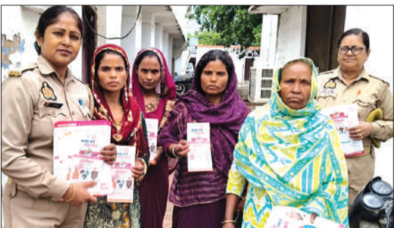
कोतवाली में महिलाओं को जागरूक करती एंटी रोमियो की टीम।

चन्दौसी। उत्तर प्रदेश शासन द्वारा महिलाओं एवं बालिकाओं के सुरक्षा व उनके स्वावलंबन के लिए जिले में मिशन शक्ति अभियान (फेज-5.0) चलाया जा रहा है। बुधवार को मिशन के तहत पुलिस अधीक्षक कृष्ण कुमार के निर्देशन एवं नोडल अधिकारी अपर पुलिस अधीक्षक महोदय (उत्तरी) कुलदीप सिंह, क्षेत्राधिकारी एवं सहायक नोडल मिशन शक्ति अभियान दीपक कुमार के नेतृत्व में मिशन शक्ति टीम में नियुक्त महिला पुलिसकर्मियों द्वारा थाना क्षेत्रान्तर्गत आयोजित कार्यक्रम में बालिकाओं को जागरूक करने के साथ ही महिला संबंधित समस्याओं के निस्तारण कराने के संबंध में चौपाल का आयोजन करके उनको जागरूक किया गया। इसके साथ ही मिशन शक्ति 5.0 (द्वितीय चरण) अभियान के अंतर्गत जनपद की