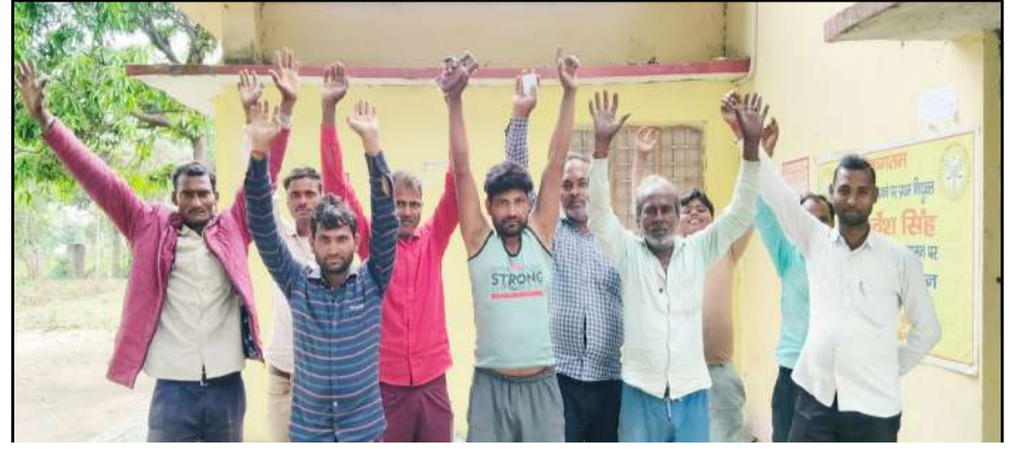
घुंघचाई बिजली उपकेन्द्र पर उपभोक्ताओं ने प्रदर्शन किया

जागरण मोर्चा कार्यालय पूरनपुर। स्मार्ट मीटर की समस्या को लेकर सब डिवीजन पहुंचे बिजली उपभोक्ताओं को कार्यालय पर अधिकारी नहीं मिले। कर्मचारियों ने भी सीधे तरीके से बात नहीं की। इससे आक्रोशित उपभोक्ताओं ने जिम्मेदारों के खिलाफ नारेबाजी कर प्रदर्शन किया। सब डिवीजन पर तैनात अधिकारी पर कार्रवाई और स्मार्ट मीटर से आ रही परेशानी को दूर करने की मांग की। जल्द समस्या का निराकरण न होने पर उग्र आंदोलन की चेतावनी दी गई है। पिछले कई दिन से नगर से लेकर ग्रामीण क्षेत्र के बिजली उपभोक्ता स्मार्ट मीटर से परेशान हैं। बकाया बिल जमा होने के बाद भी आपूर्ति चालू होने में कई-कई घंटे लग जाते हैं। बुधवार को गांव घुंघचाई,