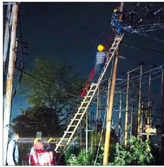
बिजली लाइन में आई खराबी को सही करते कर्मचारी।

एसडीओ एमवी सिंह ने बताया कि बिजली की लाइनों पर पेड़ गिर गए। इन्हें सही कराए जाने का कार्य पूर्ण होने के बाद बाधित आपूर्ति को सुचारू कराया गया।