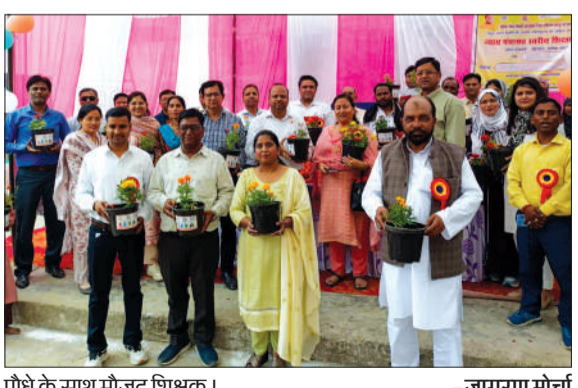
पौधे के साथ मौजूद शिक्षक।