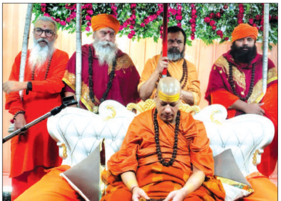
कार्यक्रम में मौजूद निरंजन पीठाधेश्वर डा. स्वामी कैलाशानंद गिरी महाराज।

चन्दौसी। बहजोई में श्रीराम कथा का आयोजन किया जा रहा है। जिसमें कथा वाचक निरंजन पीठाधीश्वर आचार्य महामंडलेश्वर डा. स्वामी कैलाशानंद गिरी महाराज कथा का वाचन किया जा रहा है। निरंजन पीठाधीश्वर आचार्य महामंडलेश्वर डा. स्वामी कैलाशानंद गिरी महाराज बुधवार की दोपहर रामस्वरूप रोड स्थित जैन पैलेस में पहुंचे। इसके पश्चात नरौरा राजघाट से आए ब्राह्मणों ने महाआरती का आयोजन किया गया। जिसमें सैकड़ों श्रद्धालु भी मौजूद रहे। आरती के उपरान्त निरंजन पीठाधीश्वर से बारी-बारी से अपने भक्तों