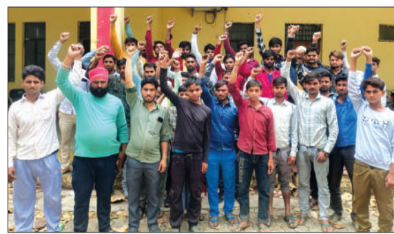
तहसील परिसर में प्रदर्शन करते अंबेडकर युवक संघ के पदाधिकारी।

चन्दौसी। कोतवाली क्षेत्र के गांव कैथल में आगामी 19 अप्रैल को आयोजित होने वाली डा. भीमराव अंबेडकर जयंती शोभायात्रा को लेकर ग्रामीणों में उत्साह देखने को मिल रहा है। इसी क्रम में बुधवार को अखिल भारतीय अंबेडकर युवक संघ के पदाधिकारियों और ग्रामीणों ने तहसील पहुंचकर उपजिलाधिकारी को ज्ञापन सौंपकर पिछले वर्ष की भांति ही शोभायात्रा के लिए अनुमति प्रदान की जाने की मांग की।