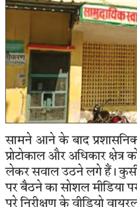
सामने आने के बाद प्रशासनिक प्रोटोकाल और अधिकार क्षेत्र को लेकर सवाल उठने लगे हैं।