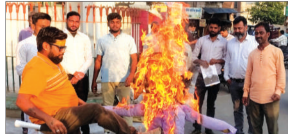
फव्वारा चौक पर पूतला फूंकते बजरंग दल के पदाधिकारी।