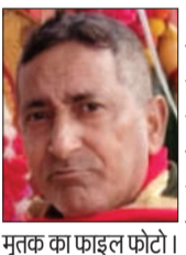
मुक्त का फाइल फोटो।

चन्दौसी। थाना बनियाठेर क्षेत्र के संभल-चन्दौसी मार्ग पर कार ने स्कूटी को टक्कर मार दी। हादसे में स्कूटी सवार की मौत हो गई। घटना से परिजनों में कोहराम मच गया। परिजनों ने पुलिस कार्रवाई से इंकार कर पुर दिया और शव घर ले गए। वहीं चालक कार लेकर फरार हो गया।