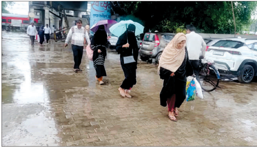
झमाझम बारिश में सड़क के पार करते लोग।

डूंगरपुर बिजलीघर की आपूर्ति तेज आंधी और बारिश होने की वजह से लड़खड़ा गई। बारिश रूकने के बाद बाधित आपूर्ति को सुचारू कराए जाने का कार्य शुरू कराया गया। कार्य के दौरान कर्मचारियों को बिजली की लाइनों पर पेड़ गिर हुए मिले। एक के बाद एक लाइनों पर गिरे हुए पेड़ों को हटाया गया। इसके बाद क्षतिग्रस्त तारों को सही