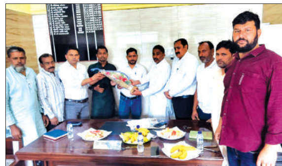
नामित सभासदों को सम्मानित करते अध्यक्ष।

सहसपुर बॉर्डर से छजलैट तक लगभग 12 किलोमीटर दूरी तक सड़क चौड़ीकरण का कार्य होना था। सड़क चौड़ीकरण का कार्य लगभग सात महा पूर्व शुरू हुआ था। इंदगाह नई बस्ती से कुमार फिलिंग स्टेशन कांट तक एवं रसूलपुर रेलवे क्रॉसिंग से छजलैट तक सड़क चौड़ीकरण का कार्य अधर में छूटा हुआ है। इंदगाह नई बस्ती से कुमार फिलिंग स्टेशन तक लगभग 200 मीटर सड़क चौड़ीकरण का कार्य पीडब्ल्यूडी विभाग द्वारा नहीं किया गया है। 200 मीटर की दूरी तक सड़क की एक साइड पीडब्ल्यूडी विभाग ने एक ओर बजरी डाल दी है। इस कारण से सड़क की एक साइड ऊंची नीची होने के कारण अनेक चार पहिया वाहन पलट चुके हैं और यात्री गुड्डों में ठोकरें खाकर चोटिल हो रहे हैं।