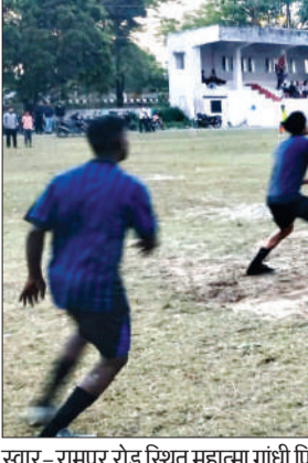
स्वार-रामपुर रोड स्थित महात्मा गांधी फुटबॉल मैदान में फुटबॉल खेलेते खिलाड़ी।