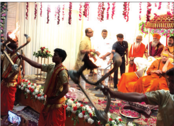
कार्यक्रम में महाआरती करते ब्राह्मण व मौजूद महाराज जी।

के भले के विषय में कार्य करना चाहिए। हमें किसी से इर्ष्या करने की जरूरत नहीं है। क्योंकि इर्ष्या करने वाला मनुष्य कभी पनपने नहीं देती। इसलिए सभी के साथ