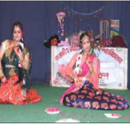
सांस्कृतिक कार्यक्रम प्रस्तुत करती छात्राएं।