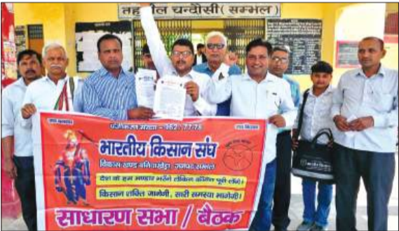
तहसील परिसर में प्रदर्शन करते भारतीय किसान संघ के पदाधिकारी।

गुरुवार को तहसील पहुंचे संघ के पदाधिकारियों ने ज्ञापन के माध्यम से अवगत कराया कि मंडी समिति कि अंतर्गत संचालित क्रय केंद्रों पर किसानों के गेहूँ की तोल नियमित रूप से नहीं की जा रही है। जबकि व्यापारियों का गेहूँ प्राथमिकता के आधार पर खरीदा जा रहा है। किसानों द्वारा तोल कराने का प्रयास करने पर क्रय केन्द्र प्रभारी विभिन्न कारण बताकर टाल देते हैं। उनके द्वारा बारदाना की कमी, मशीनों में तकनीकी खराबी आदि बताया जा