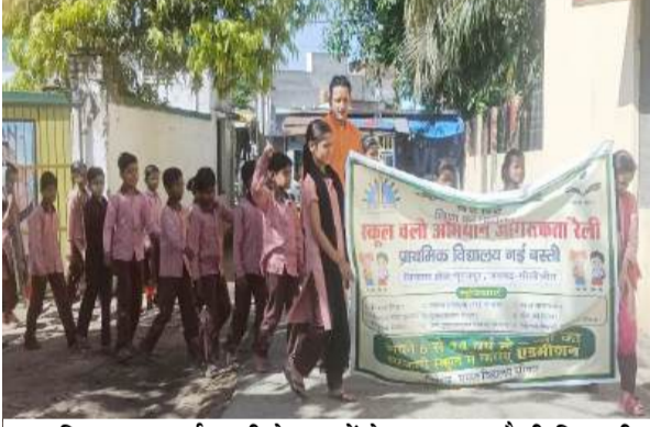
प्राथमिक स्कूल नई बस्ती के बच्चों ने जागरूकता रैली निकाली

जागरण मोर्चा कार्यालय पूरनपुर। एक अप्रैल से शुरू हुए नए शैक्षिक सत्र के बाद से लोगों को जागरूक कराने के उद्देश्य से परिषदीय स्कूलों द्वारा रैली निकाली जा रही है। गुरुवार को नगर के नई बस्ती के प्राथमिक विद्यालय में गुरुवार को स्कूल चलो अभियान के तहत जागरूकता रैली निकालकर अभिभावकों को नीतिहालों को रोजाना स्कूल भेजने के लिए प्रेरित किया। जागरूकता रैली का शुभारंभ झंडी दिखाकर किया गया। यह रैली पूरनपुर देहात क्षेत्र की गलियों में घूमि। रैली में शामिल छात्र-छात्राएं स्कूल चलो अभियान, पढ़ी-लिखी लड़की रोशनी घर की, आधी राटी खाएंगे, शिक्षा है अनमोल रतन पढ़ने का करें जतन आदि के