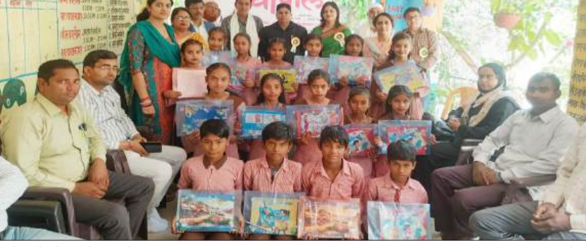
कार्यक्रम के दौरान मौजूद बच्चे।