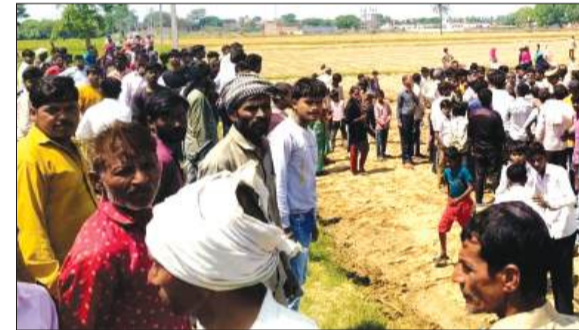
थाना बनियाटोर के गांव देवापुर में घटना के बाद लगी ग्रामीणों की भीड़।