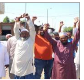
प्रदर्शन करते नगर वासी।

सैफनी। लंबे समय से बर्दाह पड़े नगर के अकबरपुर रोड का काम शुरू कर दिया गया है, लेकिन गुरुवार को नगर वासियों ने संबंधित लोगों पर मानकों के विपरीत काम कर धांधली करने का आरोप लगाते हुए प्रदर्शन किया है। प्रदर्शनकर्ताओं ने आरोप लगाया, कि अकबरपुर मार्ग कई गांवों को जोड़ता है। काफी लंबे समय से क्षतिग्रस्त पड़ा था जिससे यहां पानी जमा रहता है। नगर पंचायत की तरफ से रोड के कनारे नाले का निर्माण पहले ही कराया जा चुका है जो सड़क से काफी ऊंचा है। सड़क पर कार्य शुरू हो गया है