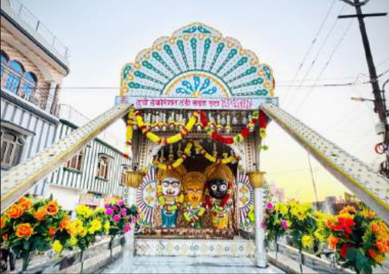
श्री बालाजी महाराज की सजी झांकी। -जागरण मोर्चा