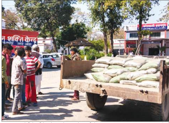
पकड़ा गया चोरी के सीमेंट से भरा ट्रैक्टर कोतवाली में खड़ा हुआ।