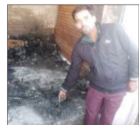
जला हुआ सामान दिखाता दुकानदार।

● लाखों का सामान जलकर राख, मचा हड़कंप जागरण मोर्चा, कार्यालय