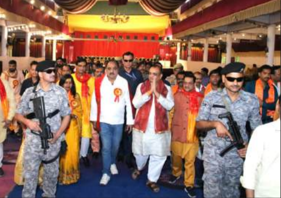
रामलीला उत्सव पैलेस में जाते विधायक व अन्य।