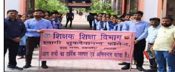
शैक्षिक भ्रमण के दौरान कॉलेज विद्यार्थी

जागरण मोर्चा कार्यालय शाहजहांपुर। स्वामी शुकदेवानंद कॉलेज के बी.एड. एवं एम.एड. के विद्यार्थियों ने बाल सुधार गृह का शैक्षिक भ्रमण किया। इस भ्रमण का उद्देश्य भावी शिक्षकों को किशोर-न्याय प्रणाली, बाल मनोविज्ञान और सुधार प्रक्रिया की जानकारी देना था। भ्रमण के दौरान बाल सुधार गृह के अधीक्षक ने विद्यार्थियों को केंद्र की कार्यप्रणाली, नियमों और यहां चल रहे शैक्षिक, व्यावसायिक एवं परामर्श कार्यक्रमों के बारे में बताया। उन्होंने कहा कि अनुशासन, देखभाल और सही मार्गदर्शन से बच्चों का सुधार संभव है और उन्हें-उन्हें सदा समाज में जोड़ा जा सकता है। विद्यार्थियों ने वहां की दिनचर्या, रहने की व्यवस्था और पढ़ाई की