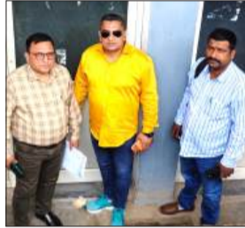
अल्ट्रासाउंड सेंटर को सील करने के बाद खड़े नोडल अधिकारी व अन्य।

स्वास्थ्य विभाग के अधिकारियों ने मांगा रजिस्ट्रेशन, कार्रवाई