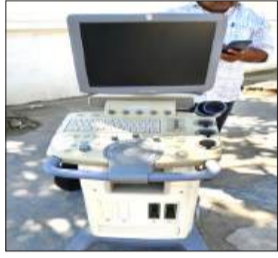
नर्सिंग होम के बाहर रखी अल्ट्रासाउंड मशीन।

रामपुर। शहजादनगर क्षेत्र गांव में बरा मिलक में नर्सिंग होम के बेसमेंट में अंपंजीकृत अल्ट्रासाउंड सेंटर मिला। मौके पर पहुंचे स्वास्थ्य विभाग के अधिकारियों ने