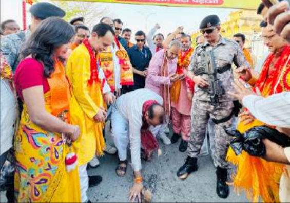
नारियल फोड़कर शुभारंभ करते विधायक।