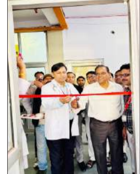
कक्ष का फीता काटकर शुभारंभ करते रेडियोलॉजिस्ट, सीएमएस।

● फीता काटकर किया रेडियोलॉजिस्ट ने कक्ष का उद्घाटन जागरण मोर्चा, कार्यालय