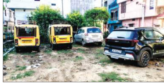
पार्क में खड़े वहान।

चन्दौसी। शहर के आवास विकास में बने पार्क इन दिनों अपनी बदहाली पर आंसू बहा रहे हैं। नगरपालिका द्वारा इन पार्कों में सौंदर्यीकरण पर पूर्व में लाखों रुपये खर्च किए जाने के बावजूद, देखरेख के अभाव में ये पार्क अब सुंदरता के बजाय गंदगी का केंद्र बनते जा रहे हैं। नगर पालिका की उदासीनता के चलते स्थिति दिन-व-दिन इनकी सूरत बिगड़ती जा रही है। शहर के आवास विकास में लगभग दो दर्जन से अधिक पार्क बने हैं, मौजूदा समय में पालिका की लेकिन अनदेखी के चलते अधिकांश पार्क बदहाल हो चुके हैं। अपनी पहचान भी खो चुके हैं। हरियाली के बीच सूकून के कुछ पल गुजारने के लिए लोगों को परेशानियों का सामना पड़ता है। स्थिति यह है कि कुछ पार्कों