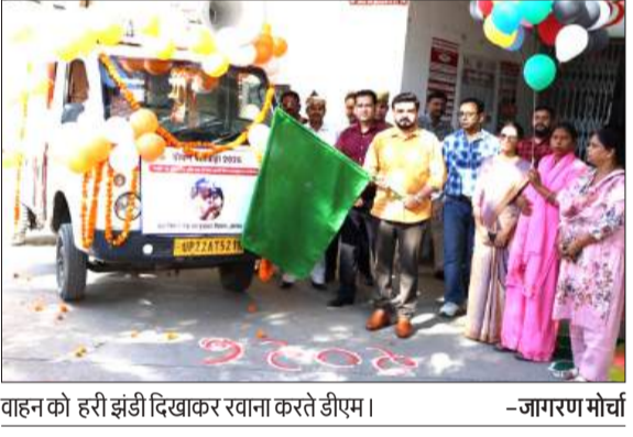
वाहन को हरी झंडी दिखाकर रवाना करते डीएम। -जागरण मोर्चा

जागरण मोर्चा कार्यालय जनसहभागिता आवश्यक है। पोषण सप्ताह के माध्यम से आमजन, विशेषकर गर्भवती महिलाओं, धात्री माताओं, किशोरियों एवं छोटे बच्चों को संतुलित आहार, स्वच्छता एवं स्वास्थ्य संबंधी महत्वपूर्ण जानकारी प्रदान की जाएगी। उन्होंने संबंधित अधिकारियों को निर्देशित किया कि अभियान के दौरान अधिक से अधिक लोगों तक पहुंच सुनिश्चित की जाए तथा प्रत्येक गतिविधि को प्रभावी एवं परिणामात्मक बनाया जाए। बताया कि प्रचार वाहन जनपद के ग्रामीण एवं शहरी क्षेत्रों में भ्रमण कर लोगों को कुपोषण के दुष्परिणाम, संतुलित आहार के महत्व, एनीमिया की रोकथाम, टीकाकरण एवं स्वच्छता के प्रति जागरूक करेगा। इसके साथ ही विभिन्न स्थानों पर गोप्टियों, रैलियों, स्वास्थ्य परीक्षण शिविरों एवं जागरूकता कार्यक्रमों का आयोजन भी किया जाएगा। कार्यक्रम के दौरान जिला कार्यक्रम अधिकारी, अन्य विभागों के अधिकारी एवं कर्मचारी उपस्थित रहे।