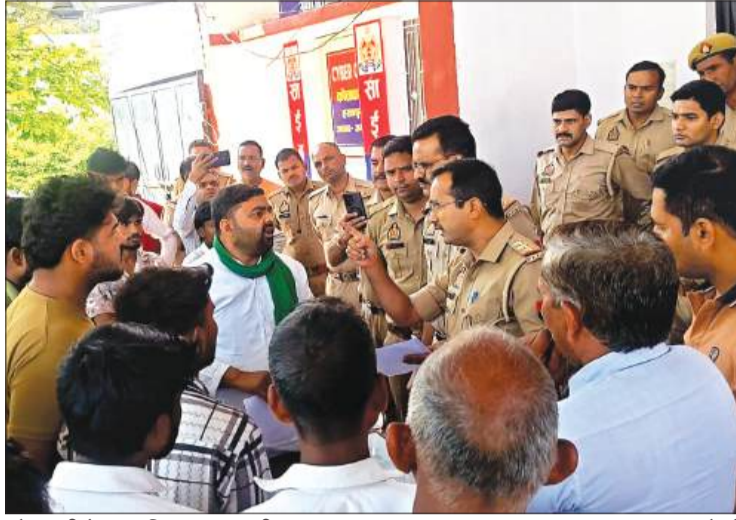
कोतवाली में एकत्र किसान एवं ग्रामीण।

गुरुवार सुबह करीब 7:30 बजे ग्रामीणों ने देखा कि पुल निर्माण के लिए आई सामग्री को चोरी-छिपे ले जाया जा रहा है। ग्रामीणों ने घेराबंदी कर ट्रैक्टर ट्रॉली में लदे 80 कट्टे सीमेंट पकड़ लिया। सूचना पर डायल 112 पुलिस भी मौके पर पहुंची और सीमेंट लदी ट्रैक्टर-ट्रॉली को कोतवाली ले आई। आरोप है कि ठेकेदार और जिम्मेदार