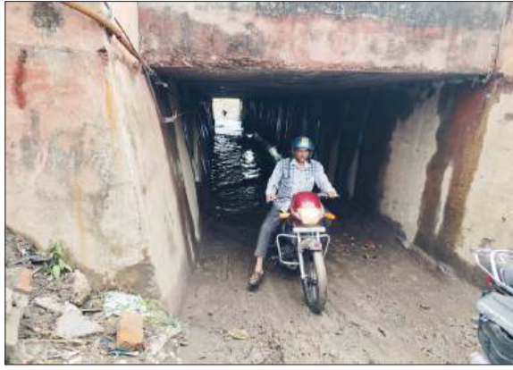
रोडवेज बस अड्डे के सामने बने अंडरपास में हुए जलभराव से गुजरते बाइक सवार।

रामपुर। बुधवार को हुई बारिश होने से रोडवेज बस अड्डे के सामने अंडरपास तालाब में तब्दील हो गया। जलभराव होने पर राहगीरों को आने-जाने में काफी दिक्कतों का सामना करना पड़ा। पूरे दिन लोगों को आवागमन में समस्या को झेलना पड़ा। लेकिन जिम्मेदारों को कारों पर जरा सी भी जूँ नहीं रेंगी। राम रहीम पुल की मरम्मत के कारण रोडवेज बस अड्डे के सामने बने अंडरपास को खोला गया है। जिससे कि लोगों को ज्वाला नगर आने-जाने में कोई दिक्कत न हो। यह रास्ता शमशाण रोड होते हुए किटप्लाई की ओर जा रहा है। लोग से यहां से आवाजाही