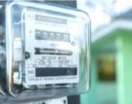
● उपभोक्ताओं से बिल के साथ जमा कराया जा रहा एडवांस