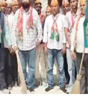
बीजेपी स्थापना दिवस के मौके पर मंदिर में सफाई करते भाजपाई