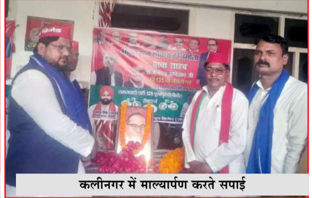
कलीनगर में माल्यार्पण करते सपाई