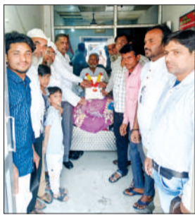
पुष्प अर्पित कर नमन करते कार्यकर्ता।