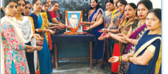
बाबा साहब की जयंती मनाती शिक्षिकाएं।