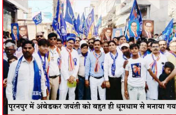
पूरनपुर में अंबेडकर जयंती को बहुत ही धूमधाम से मनाया गया