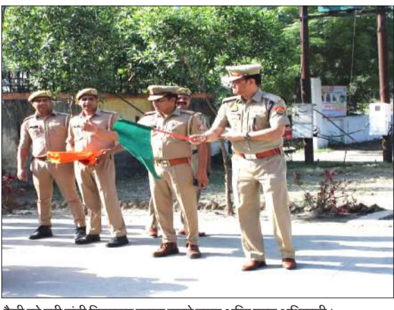
रैली को हरी झंडी दिखाकर रवाना करते मुख्य अग्नि शमन अधिकारी।

रामपुर। हरदोई में अग्निशमन सेवा स्मृति दिवस के अवसर पर शहीद अग्निशमन कर्मियों को हजरतपुर, बिलासपुर, मिलक, टांडा, स्वार्, शाहबाद पर दो मिनट का मौन धारण करने के साथ स्मृति दिवस परेड का आयोजन कर शहीदों को श्रद्धांजलि अर्पित की गयी। इसके पश्चात् पुलिस अधीक्षक ने सभ्रात व्यक्तियों को पिन फ्लैग लगाए गए। इसके अलावा शहर में आग से बचाव को लेकर जागरूकता रैली निकाली गई। अग्निशमन सेवा स्मृति दिवस के अवसर पर फायर विभाग द्वारा एक कार्यक्रम का आयोजन किया गया। कार्यक्रम का नेतृत्व मुख्य अग्निशमन अधिकारी