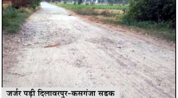
जर्जर पड़ी दिलावरपुर-कसगंजा सड़क

सड़क की नहीं कराई जा रही मरम्मत, राहगीर परेशान