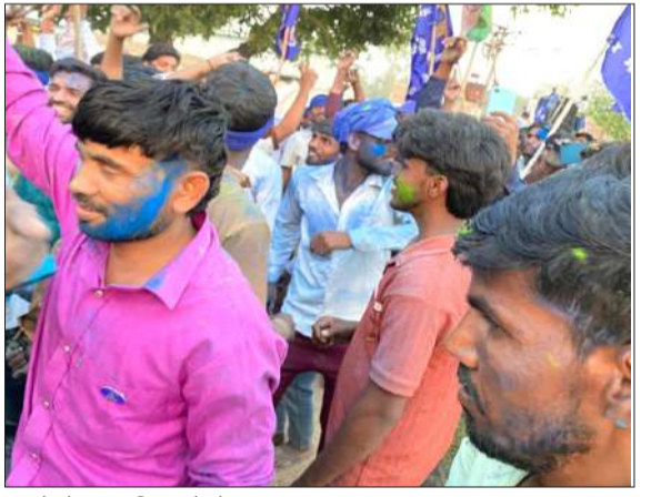
गांव में शोभायात्रा निकालते लोग।

देखते गांव के स्थानीय अम्बेडकर पार्क पर भारी भीड़ जमा हो गई। पुलिस-प्रशासन के खिलाफ नारेबाजी शुरू हो गई। स्थिति बिगड़ती देख इलाके में तनाव फैल गया और भारी पुलिस बल तैनात कर दिया गया। मामले की