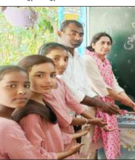
बाबा साहब के चित्र पर पुष्प अर्पित करती प्रधानाध्यापक व छात्र-छात्राएं।