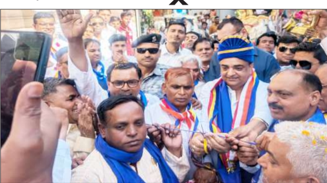
शोभायात्रा का फीता काटकर शुभारंभ करते शहर विधायक।