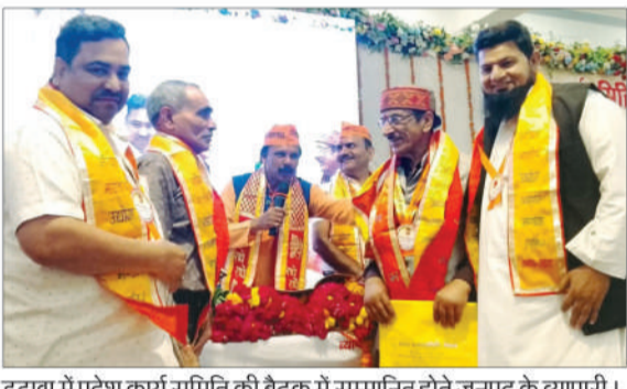
इटावा में प्रदेश कार्य समिति की बैठक में सम्मानित होते जनपद के व्यापारी।