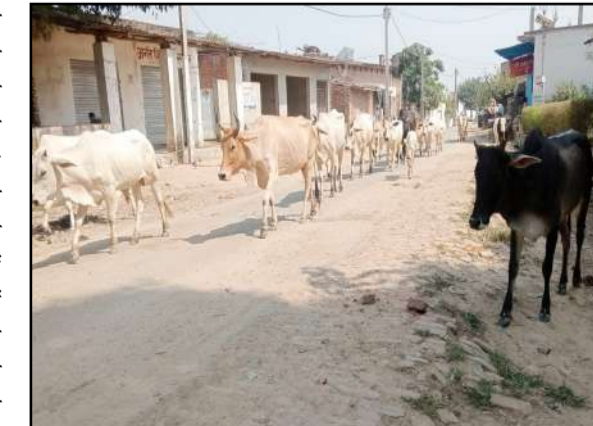
गांव की गलियों में छुड़ा घूमते हुए गोवंश