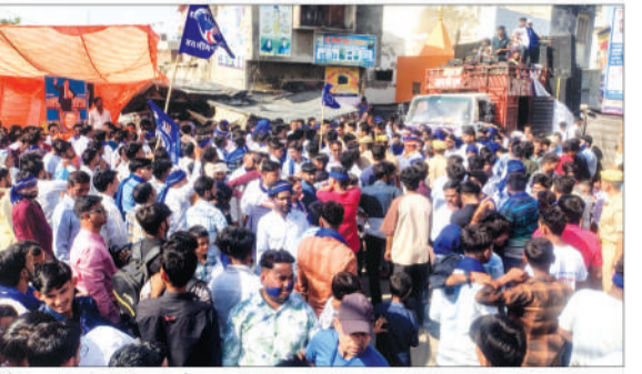
शोभायात्रा में शामिल लोग।