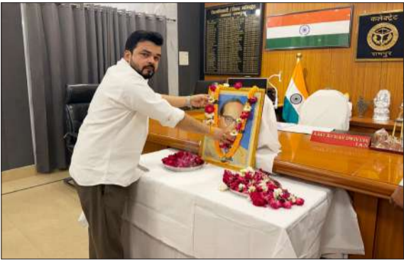
कलेक्ट्रेट सभागार में डॉ. भीमराव अंबेडकर के चित्र पर करते जिलाधिकारी।