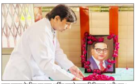
बाबा साहब के चित्र पर पुष्प अर्पित करते मुख्य चिकित्सा अधीक्षक।

साहब का जीवन समाज सुधार और शिक्षा के लिए समर्पित था और उनके बताए रास्ते पर चलकर ही हम एक सशक्त भारत का निर्माण कर सकते हैं। इस मौके पर चिकित्सालय में तैनात सभी कर्मचारी मौजूद रहे।