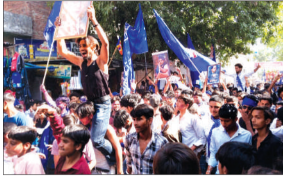
शोभा यात्रा में मौजूद युवा एवं महिलाएं।