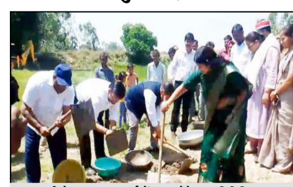
कटना नदी के पुनरुद्धार कार्य में भाग लेते जनप्रतिनिधि व अफसर