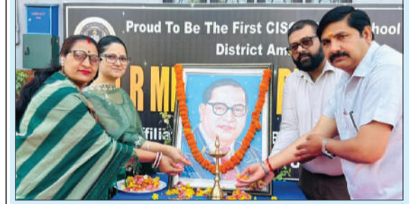
स्कूल प्रांगण में बाबा साहब को नमन करते हुए।