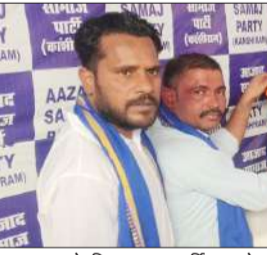
बाबा साहब के चित्र पर पुष्प अर्पित करते कार्यकर्ता।