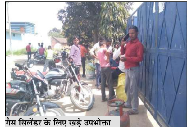
गैस सिलेंडर के लिए खड़े उपभोक्ता

जागरण मोर्चा, कार्यालय पूरनपुर। क्षेत्र में इन दिनों रसोई गैस की लगातार किल्लत से आमजन का जनजीवन प्रभावित हो रहा है। गैस एंजेंसियों पर सिलेंडर लेने के लिए लोगों की लंबी कतारें लग रही हैं, लेकिन घंटों इंतजार के बाद भी कई उपभोक्ताओं को खाली हाथ लौटना पड़ रहा है। इस समस्या से खासतौर पर गृहिणियों को भारी दिक्कतों का सामना करना पड़ रहा है। स्थानीय लोगों का कहना है कि पिछले कई दिनों से गैस की आपूर्ति बाधित चल रही है। कई उपभोक्ताओं ने समय से बचाने को मजबूर हैं, जिससे न केवल असुविधा बढ़ रही है बल्कि प्रदूषण और स्वास्थ्य संबंधी समस्याएं भी उत्पन्न हो रही हैं। त्योहारों और शादियों