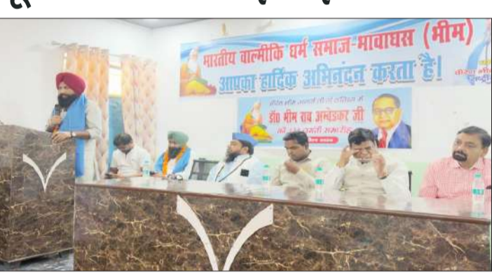
आयोजित कार्यक्रम में बोलते अतिथि।