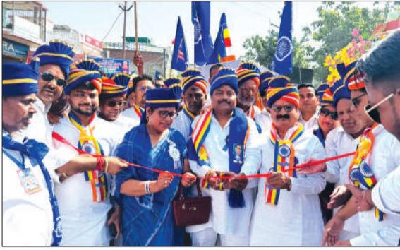
विधायक एवं चेयरमैन संयुक्त रूप से फीता काटकर शुभारंभ करते हुए।

समिति के पदाधिकारी द्वारा दोनों अतिथियों को बाबा भीमराव अंबेडकर का प्रतीक चिन्ह पटका एवं साफा पहनाकर सम्मानित किया गया। शोभा यात्रा में महात्मा बुद्ध, बाबा साहब व उनकी पत्नी रमाबाई, रानी लक्ष्मी बाई, भारत माता, बाबा साहब अंबेडकर की झांकियां प्रमुख थीं। शोभा यात्रा में नाग नागिन नृत्य, चना जोर गरम भारत