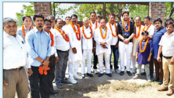
बाबा साहब का जन्म उत्सव मनाते हुए।