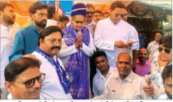
राज्यमंत्री गुलाब देवी को सम्मानित करते कमेटी के पदाधिकारी।

मार्ग, कैथल गेट, ब्रह्म बाजार, फड़याई बाजार, घंटाघर, संभल गेट, रामस्वरूप रोड, मालवीय चौक, स्टेशन रोड, फव्वारा चौक, आजाद रोड होते हुए