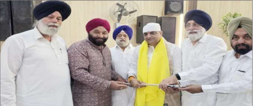
गुरुद्वारा श्री गुरु सिंह सभा में आयोजित कार्यक्रम में शहर विधायक को सिरोंपा भेंट करते।