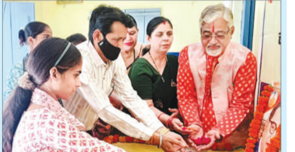
प्रशिक्षण केंद्र पर डाक्टर भीमराव अंबेडकर की जयंती मनाते अतिथि।