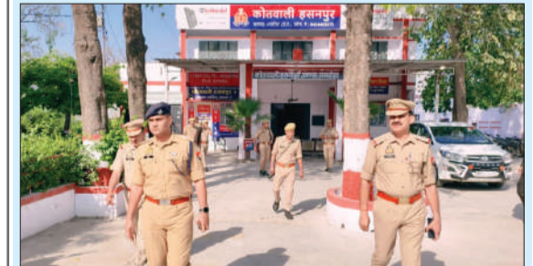
हसनपुर कोतवाली का निरीक्षण करते पुलिस अधीक्षक।