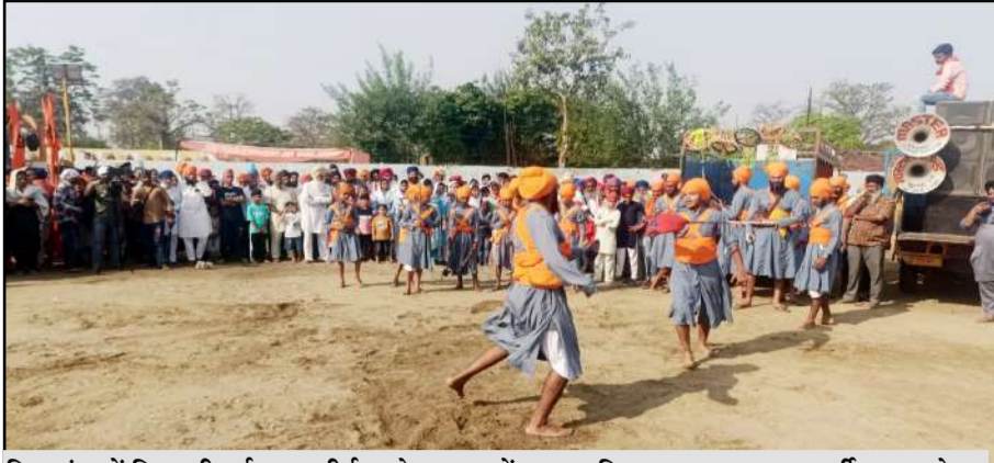
बिलसंडा में निकाली गई नगर कीर्तन शोभायात्रा में करतब दिखाता हुआ गतका पार्टी का जत्थेदार

जागरण मोर्चा कार्यालय बिलसंडा, पीलीभीत। बैसाखी का पर्व मंगलवार को नगर एवं क्षेत्र में सिख समुदाय के लोगों ने हर्षोल्लास के साथ मनाया। शाहजहांपुर क्षेत्र से विशाल नगर कीर्तन कस्बे में पहुंचा। जिसका जोरदार ढंग से स्वागत किया गया। नगर कीर्तन शोभा यात्रा में गुरु ग्रन्थ साहिब की पालकी के आगे पंच प्यारे चल रहे थे। संगत ने गुरु जी की पालकी को मत्था टेका। इस दौरान गतका पार्टी द्वारा हैरतअंगेज करतब भी दिखाए गए। बता दें कि आज के दिन सिख पंथ द्वारा वैशाखी का पर्व बड़ी धूमधाम से मनाया जाता है। हर साल की तरह इस साल भी पड़ोसी जिले शाहजहांपुर के गांव