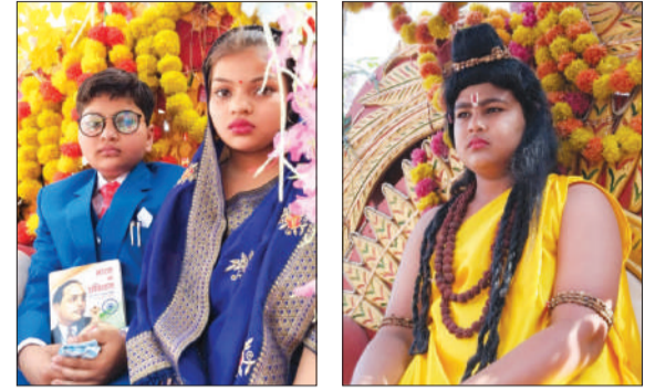
शोभा यात्रा में सम्मिलित झांकियां।