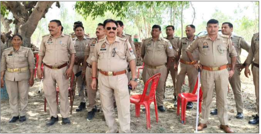
गांव दिव्यागला में सुरक्षा के मद्देनजर तैनात पुलिस बल।

सैफनी। थाना क्षेत्र के दिव्यागला गांव में मंगलवार को डॉ. भीमराव अंबेडकर जयंती के मौके पर पुलिस द्वारा अंतिम समय में अनुमति वापस लेने से गुस्साएं ग्रामीणों और प्रशासन के बीच तीखी नोकझोंक हुई। हालांकि, अधिकारियों की सूझबूझ और लंबी वार्ता के बाद शाम को सहमति बनी और कड़ी सुरक्षा के बीच शोभायात्रा निकाली गई। ग्रामीणों का आरोप है कि उन्होंने शोभायात्रा के लिए पहले ही प्रशासनिक अनुमति ली गई थी। 9 अप्रैल को सभी कागजी औपचारिकताएं पूरी होने के बाद प्रशासन ने अनुमति पत्र जारी भी कर दिया था। लेकिन, अचानक दो