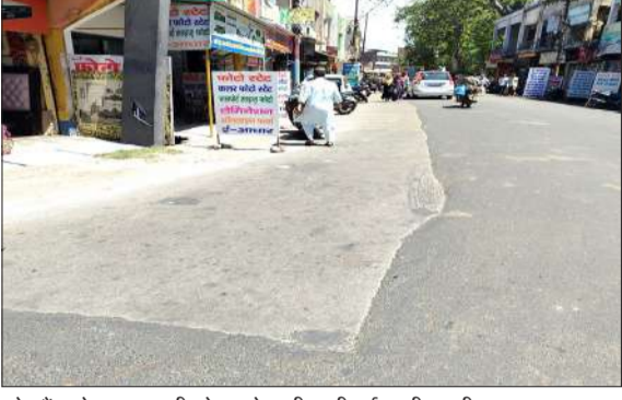
स्टेट बैंक से राजद्वारा की ओर जाने वाली डाली गई आधी अधूरी सड़क।

रामपुर। लोक निर्माण विभाग के अधिकारी आधी अधूरी सड़क डालकर मूल गए हैं। जिससे लोग आए दिन हादसों का शिकार हो रहे हैं। विभागीय अधिकारियों की लापरवाही का खामियाजा शहर की जनता को भुगतना पड़ रहा है। लेकिन विभागीय अधिकारियों को इसकी कोई सुध नहीं है। वर्ष 2025-26 वित्तीय वर्ष चालू होने पर लोक निर्माण विभाग द्वारा सड़क की सात सड़कों का नवीनीकरण कराया गया था। इन सड़कों की हालत काफी खस्ता थी। इन सड़कों