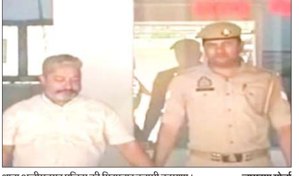
थाना अजीमनगर पुलिस की गिरफ्तार इनामी बदमाश।