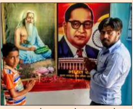
बाबा साहब को नमन करते संचालक सीरम।