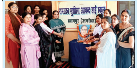
बाबा साहब को नमन करते हुए।