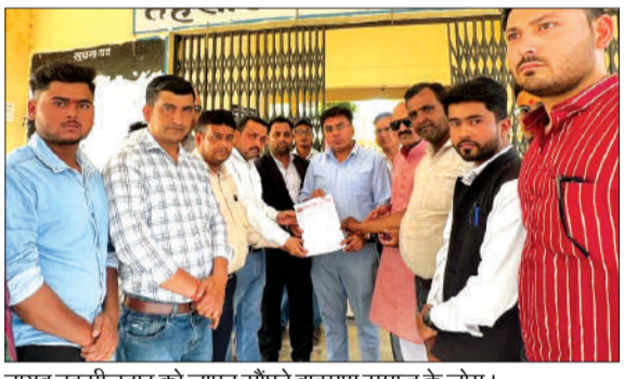
नाथब तहसीलदार को ज्ञापन सौंपते ब्राह्मण समाज के लोग।

चन्दौसी। आगरा के परशुराम चौक पर हुई कथित अश्लीलता के विरोध में नगर के ब्राह्मण समाज में आक्रोश देखने को मिला। बुधवार को ब्राह्मण शक्ति संघ के संकटों कार्यकर्ता एकत्रित होकर तहसील पहुंचे और तहसील के मुख्य गेट पर आगरा प्रशासन के खिलाफ जोरदार प्रदर्शन करते हुए नारेबाजी की। इसके बाद संगठन के पदाधिकारियों ने मुख्यमंत्री को संबोधित एक ज्ञापन नाथब तहसीलदार को सौंपा।