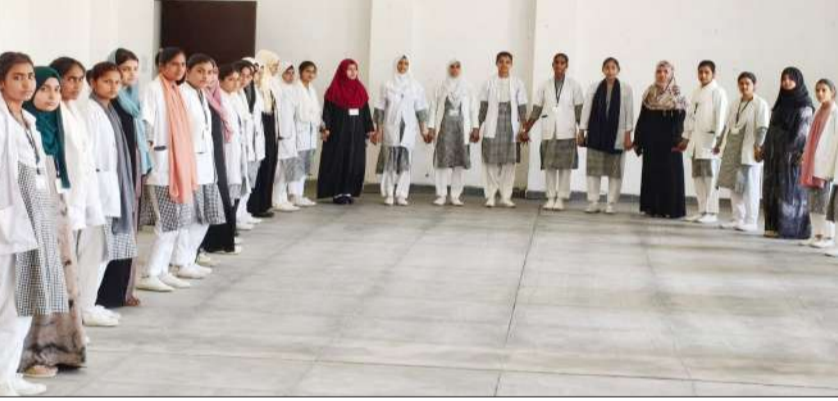
जौहर विश्वविद्यालय में महिला सशक्तिकरण के कार्यक्रम में खड़ी छात्राएं।