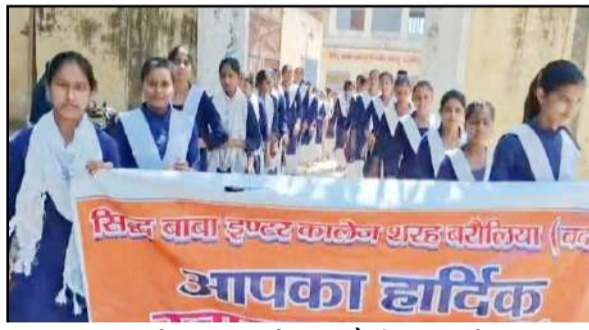
स्कूल चलो अभियान के तहत रैली निकालते छात्र

जागरण मोर्चा कार्यालय ओरछी, बदायूं। क्षेत्र के सिद्ध बाबा इंटर कालेज शहर बरौलिया में 'स्कूल चलो अभियान' के तहत एक जागरूकता रैली निकाली गई। बुधवार को आयोजित इस रैली का उद्देश्य 6 से 14 वर्ष आयु वर्ग के बच्चों का विद्यालयों में शत-प्रतिशत नामांकन सुनिश्चित करना था। शिक्षकों और छात्र-छात्राओं ने अभिभावकों को शिक्षा के प्रति जागरूक करने की अपील की। यह रैली कालेज परिसर से शुरू होकर गांव की गलियों से गुजरी और वापस विद्यालय पर समाप्त हुई। रैली के दौरान छात्र-छात्राओं ने 'स्कूल चलो अभियान शिक्षा है हम सब का उजियारा', 'स्कूल चले हम'