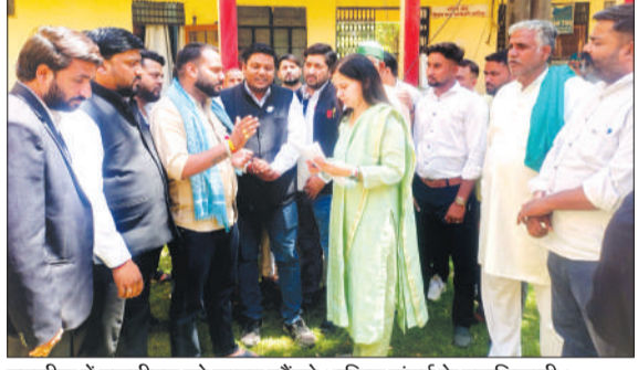
तहसील में एसडीएम को ज्ञापन सौंपते भाकियू संघर्ष के पदाधिकारी।