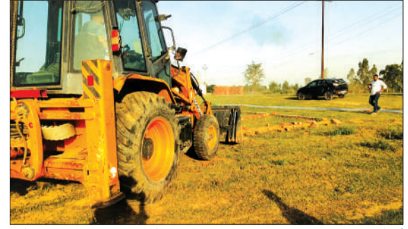
अवैध प्लांटिंग पर चला बुलडोजर।