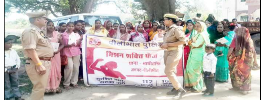
कलीनगर क्षेत्र में महिलाओं को जागरूक करती मिशन शक्ति की टीम

जागरण मोर्चा कार्यालय कलीनगर। मिशन शक्ति अभियान के तहत क्षेत्र में कार्यक्रम चलाकर महिलाओं और युवतियों को अपनी सुरक्षा के प्रति जागरूक किया गया। बुधवार को पुलिस ने मिशन शक्ति अभियान के तहत क्षेत्र में विशेष जागरूकता कार्यक्रम चलाकर महिलाओं और युवतियों को उनके अधिकारों और सुरक्षा उपायों के प्रति जागरूक किया। कार्यक्रम के दौरान पुलिस टीम ने महिलाओं को विभिन्न हेल्पलाइन नंबरों, महिला सुरक्षा कानूनों और आपातकालीन परिस्थितियों में उठाए जाने वाले कदमों की विस्तृत जानकारी दी। उन्हें