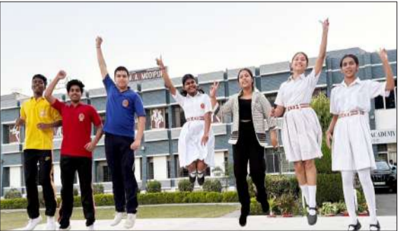
रिजल्ट आने पर खुशी जाहिर करती दयावती मोदी की छात्राएं।

जागरण मोर्चा, कार्यालय रामपुर। दयावती मोदी अकादमी में दसवीं में 90 प्रतिशत से अंक पाने वाले बच्चों की भरमार रही। इनमें कुल 56 बच्चे शामिल रहे। दसवीं में विद्यालय का रिजल्ट शत प्रतिशत रहा। सभी बच्चे अच्छे नंबरों से पास हुए हैं। 90 से ज्यादा की सूची