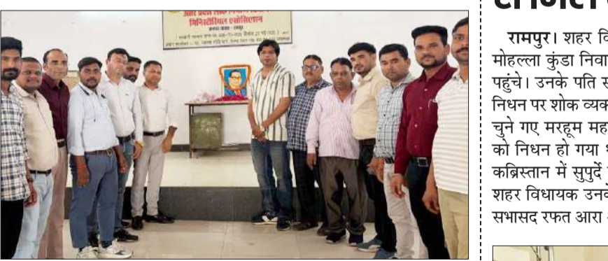
उत्तर प्रदेश लोक निर्माण विभाग मिनिस्ट्रियल के कार्यालय में खड़े पदाधिकारी। -जागरण मोर्चा

बाबा साहब के चित्र पर पुष्प अर्पित कर दी श्रद्धांजलि