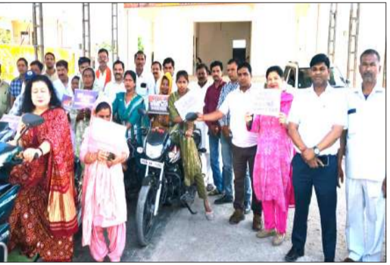
नारी शक्ति बंधन अभियान में रैली निकालती महिलाएं।