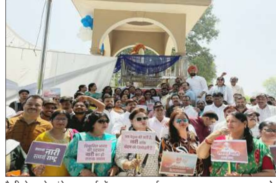
रैली से पहले अंबेडकर पार्क में एकत्र भाजपाई।

समावेशी बनाएगा। कार्यक्रम के दौरान महिलाओं ने नारी शक्ति दीवार पर हस्ताक्षर कर इस अभियान के प्रति अपना समर्थन जताया। एकजुटता का संदेश देने के लिए नारी श्रृंखला बनाकर महिला शक्ति का अद्भुत प्रदर्शन किया। वक्ताओं ने कहा कि यह रैली केवल एक आयोजन नहीं, बल्कि महिलाओं के अधिकार, सम्मान और समान भागीदारी की मजबूत आवाज है। इसने यह स्पष्ट कर दिया कि देश की नारी अब पीछे नहीं, बल्कि हर क्षेत्र में आगे बढ़ने के लिए तैयार है।