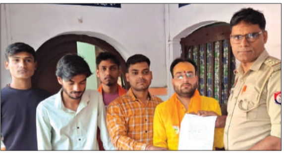
कोतवाली प्रभारी निरीक्षक को ज्ञापन सौंपते विश्व हिंदू परिषद के पदाधिकारी।