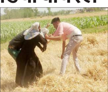
युवतियों को पीटा दबंग।