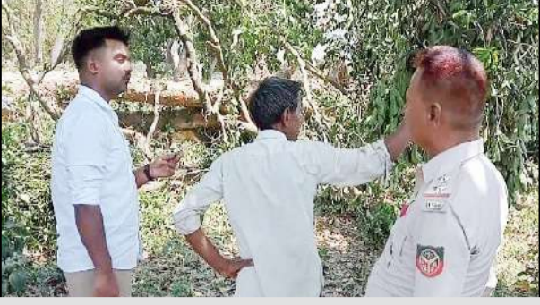
सामाजिक वानिकी की टीम ने पहुंचकर पेड़ स्वामी से जानकारी कर कटान रुकवा दिया

सामाजिक वानिकी की टीम ने पहुंचकर रुकवाया कटान, मची खलबली, दिन-दहाड़े पेड़ों का कटान होने से वन विभाग के जिम्मेदारों पर भी उठ रहे सवाल