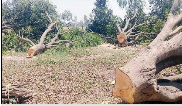
गांव कट्टेया कनपारा में वन विभाग की मिलीभगत से हरे-भरे पेड़ों का सफाया कर दिया गया

जागरण मोर्चा कार्यालय पूरनपुर, पीलीभीत। कलमी पेड़ों के पातन की परमिट की आड़ में लकड़कट्टे ने वन विभाग के जिम्मेदारों से मिलीभगत कर प्रतिबंधित प्रजाति के पेड़ों का भी सफाया कर दिया। दिन दहाड़े 20 आम के हरे-भरे पेड़ों के अलावा कटहल व रोहनी के पेड़ भी काट डाले। सूचना पर पहुंची सामाजिक वानिकी की टीम ने कटान रुकवा दिया और