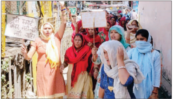
विद्युत विभाग के खिलाफ जुलूस निकलती महिलाएं।