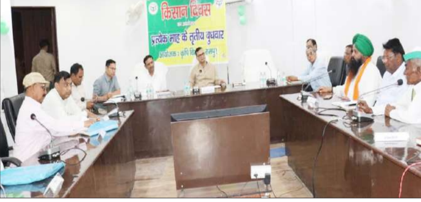
विकास भवन के सभागार में आयोजित किसान दिवस में मौजूद सीडीओ, उपकृषि निदेशक, जिला कृषि अधिकारी।