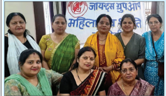
जायंट्स ग्रुप ऑफ महिला नव शक्ति के बैठक में महिला पदाधिकारी।