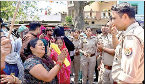
महिलाओं को समझाते हुए एसडीओ विद्युत।