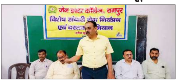
जैन इंटर कॉलेज में आयोजित संगोष्ठी में बोलते प्रभानाचार्य।