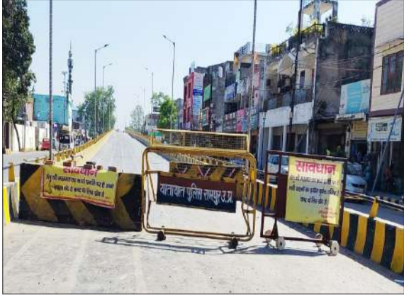
राम रहीम पुल।

रामपुर। एक माह बाद 20 अप्रैल से राम रहीम पुल पर वाहनों की आवाजाही शुरू हो जाएगी। जर्जर पुल की मरम्मत और सड़क को लोक निर्माण विभाग द्वारा सही करा दिया गया है। पुल पर कराए गए कार्यों का शहर विधायक भी जायजा ले चुके हैं। अब सिर्फ पुल के दोनों ओर बने डिवाइडरों पर रंग-रोगन होना है। विभागीय अधिकारियों के अनुसार राम रहीम पुल को 20 अप्रैल से पूर्ण रूप से खोल दिया जाएगा। ज्वालानगर रेलवे क्रॉसिंग पर