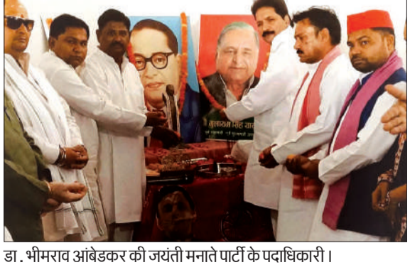
डा. भीमराव आंबेडकर की जयंती मनाते पार्टी के पदाधिकारी।