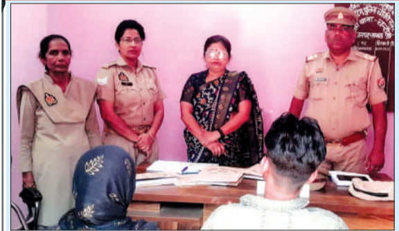
पुलिस परिवार परामर्श सुलह समझौता केंद्र पर विवादों का निस्तारण करती पुलिस।