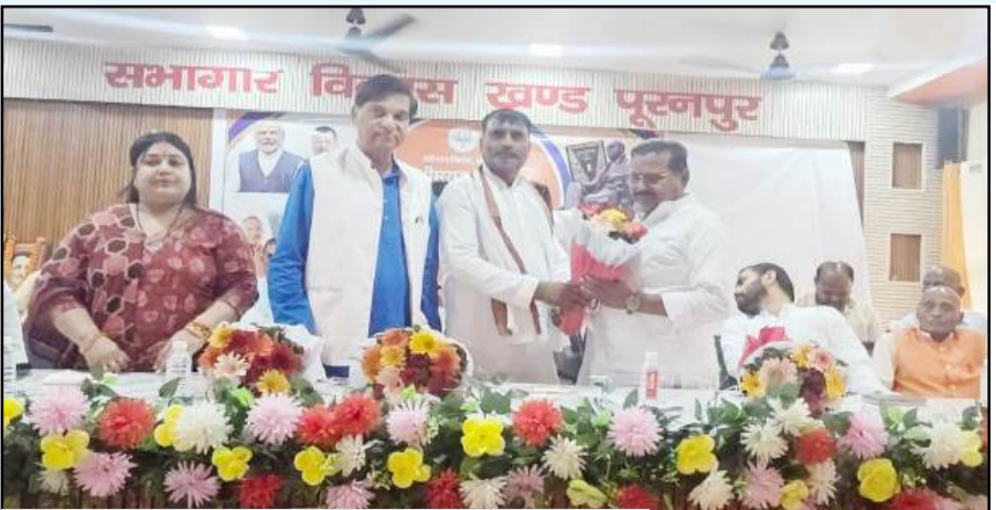
गोष्ठी में मौजूद विधायक, ब्लॉक प्रमुख