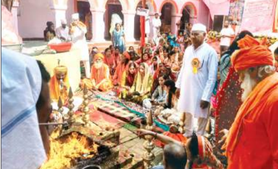
कथा के समापन पर हवन का आयोजन करते।