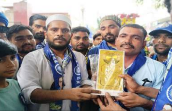
अंबेडकर शोभायात्रा के दौरान सम्मानित करते आजाद समाज पार्टी के नगर अध्यक्ष।