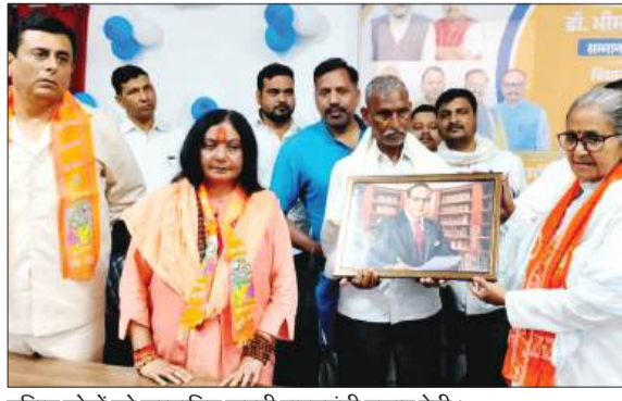
वरिष्ठ लोगों को सम्मानित करती राज्यमंत्री गुलाब देवी।

चन्दौसी। विधानसभा क्षेत्र में भाजपा कार्यकर्ताओं ने संविधान निर्माता भारत रत्न डा. भीमराव अंबेडकर के सम्मान में अंबेडकर सम्मान अभियान के अंतर्गत एक भव्य संगोष्ठी का आयोजन किया गया। कार्यक्रम का उद्देश्य बाबा साहेब के विचारों, उनके संघर्ष और भारतीय संविधान में उनके अतुलनीय योगदान को जान-जन तक पहुंचाना रहा। कार्यक्रम का शुभारंभ बाबा साहब के चित्र पर माल्यार्पण एवं पुष्प अर्पित कर किया गया। संगोष्ठी में माध्यमिक शिक्षा मंत्री गुलाब देवी ने डा. भीमराव अंबेडकर के जीवन संघर्ष, सामाजिक समरसता,