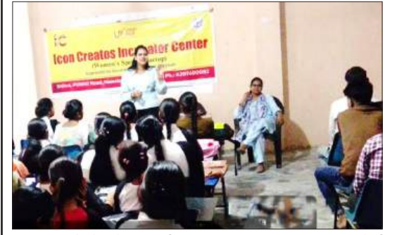
छात्र-छात्राओं को संबोधित करती वक्ता। -जागरण मोर्चा