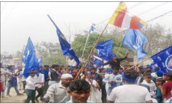
अंबेडकर शोभायात्रा के दौरान डीजे की धुन पर नाचते गाते युवा।

शाहबाद। अंबेडकर जयंती के उपलक्ष्य में शाहबाद नगर में भी डॉ. बीआर अंबेडकर शोभायात्रा निकाली गई। कार्यक्रम में मौजूद लोगों ने डॉक्टर भीमराव अंबेडकर के जीवन पर प्रकाश डालते हुए कहा कि अगर बाबा साहेब नहीं होते तो दलितों और गरीबों को उनका हक नहीं मिल पाता। बाबा साहेब के लिखे गए संविधान ने सभी को एक समान हक दिया है। कार्यक्रम का आयोजन जयतोली रोड स्थित अंबेडकर पार्क में किया गया, जहां मौजूद लोगों ने डॉ. भीमराव अंबेडकर की मूर्ति पर माल्यापर्ण