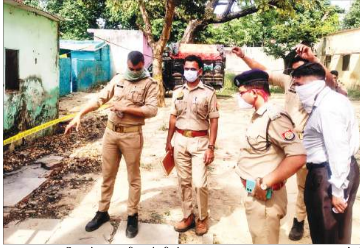
घटनास्थल पर पुलिस से जानकारी करते सीओ।