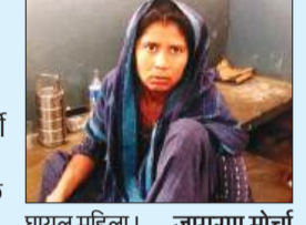
घायल महिला। -जागरण मोर्चा

हसनपुर। कोतवाली क्षेत्र से एक गांव निवासी महिला को जहरीले कीड़े के द्वारा काट लिया गया, जिससे उसकी हालत बिगड़ गई और परिजनों द्वारा उसे आनन फानन में सीएचसी में भर्ती कराया गया। जहां चिकित्सकों द्वारा उसका उपचार किया गया, उपचार के बाद महिला की हालत सही बताई जा रही है। कोतवाली क्षेत्र के गांव रुद्रपुर