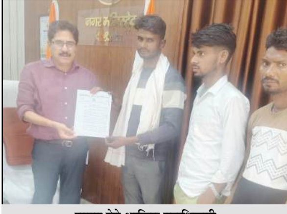
झापन देते भाकियू पदाधिकारी

हैं। आदृती व व्यापारी व नकली बीज तैयार करने वाले बीज संयंत्र और-पौने दामों पर किसानों से न्यूनतम समर्थन मूल्य से बहुत ही नीचे गेहूँ की खरीद कर रहे हैं जिससे जनपद का किसान विवश होकर अपनी मेहनत व खून पसीने व मंहगे कर्ज से तैयार फसल को औने-पौने दामों पर बेचने को मजबूर हैं गेहूँ खरीद से सम्बंधित जनपद के अधिकारी बेमौसमी बरसात से गेहूँ में लस्टर लॉस का हवाला देकर गेहूँ खरीद से पल्ला झाड़ रहे हैं गेहूँ किसानों की कोई जनप्रतिनिधि भी सुध लेने को तैयार नहीं है। जिलाध्यक्ष ने यह भी कहा कि रबी विपणन