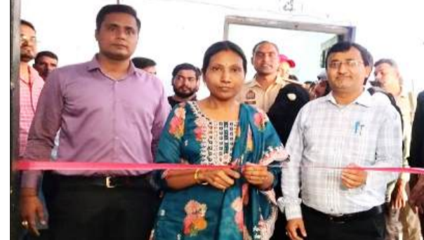
रजा इंटर कालेज में फीता काटकर शुभारंभ करती डीआईओएस।