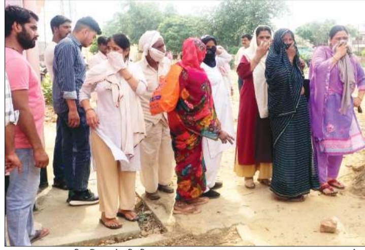
घटनास्थल पर लगी महिलाओं की भीड़।

सीएचसी परिसर में डेढ़ वर्ष से कमरे से फार्मेसिस्ट का शव मिला है। जिसे पोस्टमार्टम के लिए भेजा गया है। शव के पास से मिले दो मोबाइल को पुलिस ने कब्जे में लिया है। फिलहाल घटना की जांच कराई जा रही है। -दीपक तिवारी, सीओ, चन्दौसी