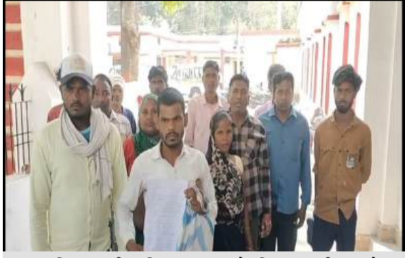
वन विभाग की कथित अभद्रता के खिलाफ डीएम को शिकायत लेकर पहुंचे लोग

जागरण मोर्चा कार्यालय न्यूरिया। क्षेत्र के ग्राम मरोरी के ग्रामीणों ने जिलाधिकारी को प्रार्थना पत्र देकर वन विभाग के कर्मचारियों पर मारपीट और अभद्रता के गंभीर आरोप लगाए हैं। ग्रामीणों का कहना है कि 3 मार्च 2026 की रात करीब 8:45 बजे गांव के कुछ बच्चे होलिका दहन के लिए जंगल के पास लकड़ियां एकत्र कर रहे थे, तभी वन दरोगा और फिरेस्ट गार्ड अपनी टीम के साथ मौके पर पहुंचे और बच्चों को पकड़ लिया। शिकायत के अनुसार, बच्चों के शोर मचाने पर गांव के लोग मौके पर पहुंचे तो वन विभाग की टीम ने ग्रामीणों के साथ भी मारपीट शुरू कर दी। आरोप है कि महिलाओं के साथ भी अभद्रता की गई और उनके कपड़े तक फाड़ दिए गए। इस दौरान कई लोग घायल हो गए। ग्रामीणों ने यह भी आरोप लगाया है कि वन विभाग के कर्मचारियों