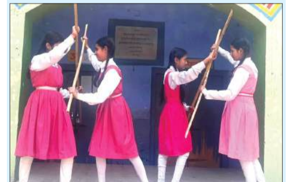
नारी शक्ति वंदन प्रतियोगिता में भाग लेती छात्राएं।

कर उनकी समस्याओं को सुना गया तथा उनके त्वरित निस्तारण हेतु आवश्यक मार्गदर्शन प्रदान किया गया। इस दौरान पुलिस टीम ने बालिकाओं को शिक्षा, आत्मरक्षा और आत्मविश्वास के महत्व के बारे में विस्तार से बताया। साथ ही यह भी समझाया गया कि किसी भी प्रकार की असहज स्थिति या उत्पीड़न की घटना होने पर तुरंत पुलिस