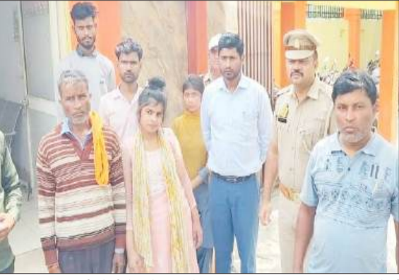
जिला अस्पताल की चौकी में खड़े मृतक के परिजन।

रामपुर। जिला अस्पताल के इमरजेंसी वार्ड में महिला की मौत पर गुस्साएं परिजनों ने हंगामा किया। गुस्साएं परिजनों ने सीधे अस्पताल प्रशासन पर आरोप लगाया कि उपचार में साफ तौर पर लापरवाही हुई जिसके कारण मौत हुई। हंगामा की सूचना मिलने पर सीएमएस, चौकी पुलिस भी आ गई। यह देख परिजनों का पारा और चढ़ गया। मामले को बढ़ता देख सीएमएस ने एएसपी को फोन लगाकर सूचना दी। आनन फानन में शहर कोतवाली भी मौके पर पहुंच गए। देर रात तक अस्पताल में अफरा तफरी का माहौल बना रहा। किसी तरह परिजनों को समझा बुझाकर शांत कराया।