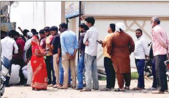
गैस एजेंसी पर लगी लाइन।

हसनपुर। घरेलू गैस की किल्लत के चलते उपभोक्ताओं को सिलेंडर के लिए काफी इंतजार करना पड़ रहा है और सिलेंडर लेने के लिए उन्हें भारी परेशानियों से गुजरना पड़ रहा है। वहीं नगर में स्थित एजेंसी पर उपभोक्ताओं की प्रातः से ही लाइन लगनी शुरू हो जाती है उपभोक्ता एजेंसी पर गैस बुकिंग और केवाईसी कराने के लिए लाइन में लग रहे हैं, वहीं उपभोक्ताओं की भीड़ को देखते हुए एजेंसियों पर पुलिस बल तैनात रहा। शुक्रवार को नगर स्थित तीनों गैस एजेंसियों पर गैस उपभोक्ताओं की काफी भीड़