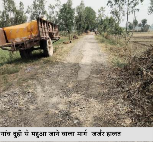
गांव दुही से महुआ जाने वाला मार्ग जर्जर हालत

जागरण मोर्चा कार्यालय बीसलपुर। ब्लॉक क्षेत्र के गांव दुही से महुआ जाने वाला मार्ग पिछले करीब पांच वर्षों से जर्जर हालत में पड़ा हुआ है। सड़क पर बड़े-बड़े गड्ढे और उखड़ी परत के कारण आवागमन बेहद कठिन हो गया है, जिससे रोजाना गुजरने वाले राहगीरों को भारी परेशानी का सामना करना पड़ रहा है। ग्रामीणों का कहना है कि कई बार लोक निर्माण विभाग से शिकायत की गई, लेकिन अब तक सड़क की मरम्मत नहीं कराई गई। बरसात के दिनों में स्थिति और भी खराब हो जाती है, जब सड़क पर पानी भरने से गड्ढे नजर नहीं आते