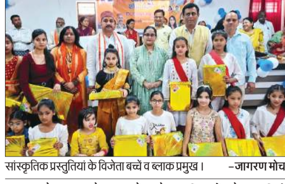
सांस्कृतिक प्रस्तुतियों के विजेता बच्चों व ब्लाक प्रमुख।

चन्दौसी। भारतीय जनता पार्टी विधानसभा द्वारा नारी शक्ति वंदन अभियान के अंतर्गत ब्लाक सभागार बनियाखेड़ा में एक भव्य कार्यक्रम का आयोजन किया गया। कार्यक्रम में महिलाओं के सम्मान, सशक्तिकरण एवं जागरूकता को लेकर विभिन्न गतिविधियां आयोजित की गईं। कार्यक्रम का शुभारंभ दीप प्रज्वलन के साथ किया गया। इसके उपरांत सांस्कृतिक कार्यक्रम प्रस्तुत किए गए। इन प्रस्तुतियों के माध्यम से नारी शक्ति, उनकी भूमिका एवं समाज में उनके योगदान को प्रभावी ढंग से प्रदर्शित किया गया। इस अवसर नारी शक्ति वंदन अभियान के अंतर्गत पद यात्रा भी निकाली गई, जिसमें बड़ी संख्या में महिलाओं, कार्यकर्ताओं एवं पदाधिकारियों ने भाग लिया।