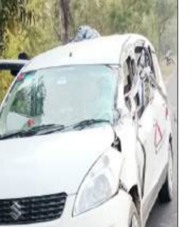
शाहबाद में सड़क पर खड़े डंपर में घुसने के बाद क्षतिग्रस्त एर्टिगा कार। में सवार लोगों को बाहर निकाला गया। हालांकि एर्टिगा कार में सवार चारों लोगों को मामूली चोटें आईं।

शुक्रवार सुबह 6 बजे शाहबाद क्षेत्र में एक बड़ा हादसा टल गया। जहां सड़क पर खड़े डंपर में आकर एर्टिगा कार घुस गई। गनीमत रही कि कार में सवार चार लोगों को मामूली चोटें आईं और कोई बड़ा हादसा नहीं हुआ। मिली जानकारी के अनुसार बरेली के शहजानपुर निवासी चार लोग सम्भल से दवाई लेने के लिए एर्टिगा कार में सवार होकर शाहबाद से गुजर रहे थे, इसी बीच शाहबाद-आंवला स्टेट हाइवे पर सड़क पर खड़े डंपर में एर्टिगा कार घुस गई। आसपास के लोगों और राहगीरों के द्वारा कार