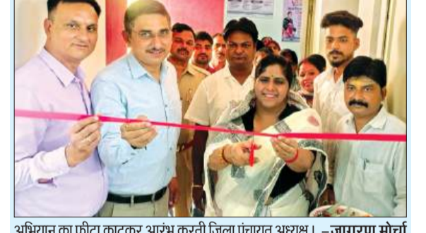
अभियान का फीटा काटकर आरंभ करती जिला पंचायत अध्यक्ष।

अधिकारियों ने बताया कि मोबाइल पर बात करना या मैसेज देखना चालक का ध्यान भटका देता है, जिससे दुर्घटना की संभावना कई गुना बढ़ जाती है। अभियान के दौरान सैफ ड्राइव, सेव लाइफ जैसे नारों के माध्यम से लोगों को जागरूक किया गया। कई स्थानों पर पंपलेट वितरित किए