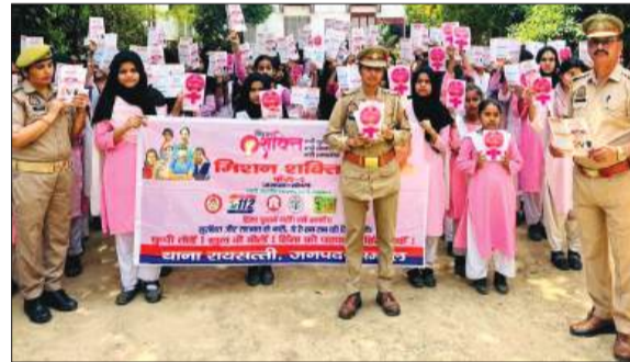
छात्राओं को जागरूक करती एण्टी रोमियो की टीम।

अभियान के अंतर्गत मिशन शक्ति टीम में नियुक्त महिला पुलिसकर्मियों द्वारा विभिन्न स्थानों पर चौपाल कार्यक्रम आयोजित किए गए, जहां बालिकाओं एवं महिलाओं को उनके अधिकारों, सुरक्षा उपायों और आत्मनिर्भर बनने के लिए प्रेरित किया गया। कार्यक्रमों में महिलाओं से सीधे संवाद स्थापित