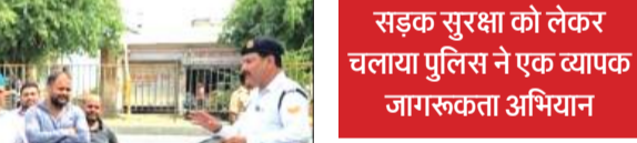
सड़क सुरक्षा को लेकर चलाया पुलिस ने एक व्यापक जागरूकता अभियान

गया कि हेलमेट दुर्घटना के समय जीवन रक्षक साबित होता है। वहीं चारपहिया वाहन चालकों को सीट बेल्ट के अनिवार्य प्रयोग के लिए प्रेरित किया गया। इसके अतिरिक्त वाहन चलाते समय मोबाइल फोन के उपयोग से होने वाले खतरों के बारे में भी लोगों को जागरूक किया गया। पुलिस