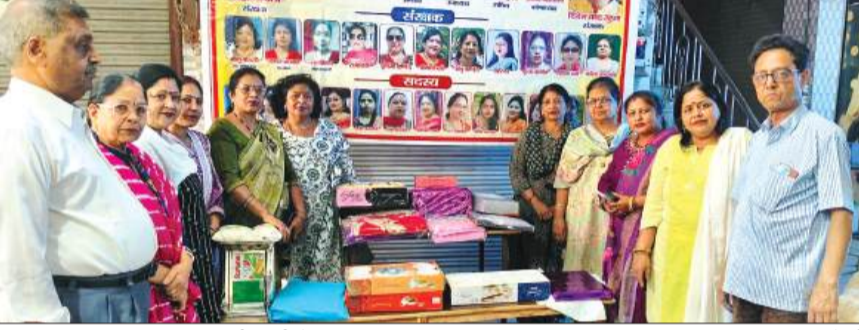
समिति द्वारा जरूरतमंद कन्या की शादी में दिया सामान।

सहायता लेना आवश्यक है। महिलाओं को यह बरोसा दिलाया गया कि पुलिस हर समय उनकी सुरक्षा के लिए तत्पर है। अभियान के अंतर्गत एंटी रोमियो टीम द्वारा भी प्रमुख बाजारों, कस्बों, चौराहों, स्कूलों, कालेजों, धार्मिक स्थलों तथा अन्य सार्वजनिक स्थानों पर भ्रमण कर महिलाओं एवं बालिकाओं को सुरक्षा के प्रति जागरूक किया।