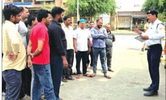
लोगों को सड़क सुरक्षा को लेकर जागरूक करती यातायात पुलिस।

अभियान के दौरान पुलिस टीम द्वारा वाहन चालकों को रोककर उन्हें सड़क सुरक्षा के महत्वपूर्ण नियमों के बारे में विस्तार से जानकारी दी गई। कार्यक्रम में दोपहिया वाहन चालकों को हेलमेट पहनने के महत्व को समझाते हुए बताया