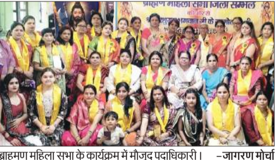
ब्राह्मण महिला सभा के कार्यक्रम में मौजूद पदाधिकारी।