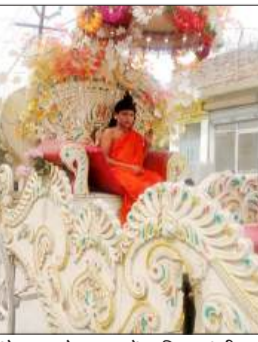
अंबेडकर शोभायात्रा में शामिल झांकी।

किया गया। जिसके बाद नगर में सुंदर झांकियों के साथ शोभायात्रा निकाली गई। शोभायात्रा नगर के जयतोली रोड स्थित अंबेडकर पार्क से शुरू होकर बिलारी बस स्टैंड, पशु चिकित्सालय, चंदौसी