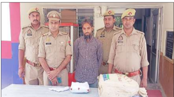
पुलिस द्वारा पकड़ा गया गोकशी।