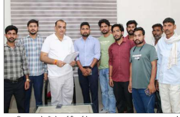
शहर विधायक को सौंपते आईटीआई के छात्र।