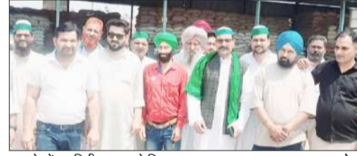
कृष्य केंद्रों का निरीक्षण करते किसान।