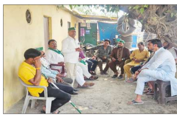
बिलासपुर गेट स्थित पंचायत को संबोधित करते जिलाध्यक्ष।

उन्होंने कहा किसानों की समस्याओं को लेकर पूर्व में जितने भी मांगों को लेकर ज्ञापन