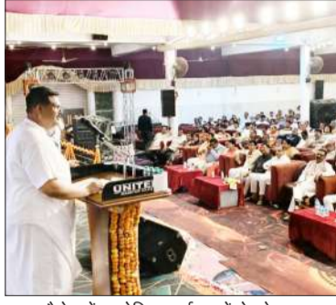
उत्सव पैलेस में आयोजित कार्यक्रम में बोलते वक्ता।