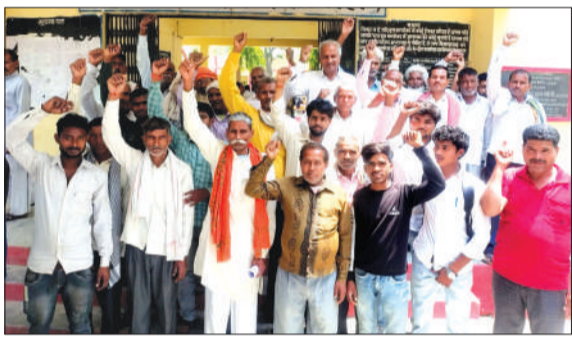
तहसील गेट पर प्रदर्शन करते ग्रामीण।