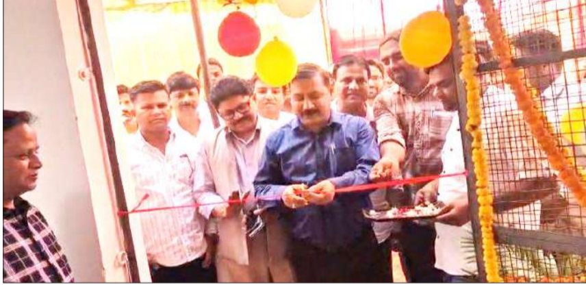
पत्रकार वेलफेयर एसोसिएशन के कार्यालय का फीता काटकर उद्घाटन करते मुख्य अतिथि, साथ में संगठन के पदाधिकारी।