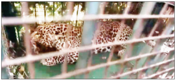
पिंजरे में कैद तेंदुआ।

मुरादाबाद। जनपद के ठाकुरद्वारा तहसील क्षेत्र के गांव तरफ दलपतपुर में शनिवार को वन विभाग को बड़ी सफलता मिली, जब एक तेंदुआ पिंजरे में कैद हो गया। पिछले कुछ दिनों से क्षेत्र में तेंदुए की दहशत बनी हुई थी और हाल ही में उसने एक ग्रामीण पर हमला भी किया था, जिसके बाद गांव में भय का माहौल था। ग्रामीणों की सुरक्षा को ध्यान में रखते हुए वन विभाग ने गांव में पिंजरा लगाकर तेंदुए को पकड़ने की योजना बनाई थी। शनिवार सुबह यह प्रयास सफल रहा और तेंदुआ पिंजरे में फंस गया। तेंदुए के पकड़े जाने की सूचना मिलते ही वन विभाग की टीम मौके पर पहुंच गई और आवश्यक कार्रवाई