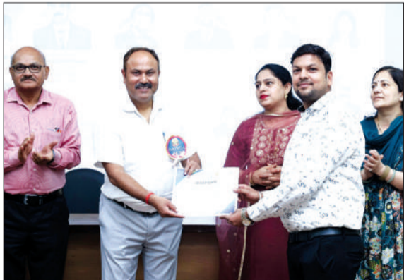
अरब, जॉर्डन, इजिप्ट सरीखे देशों के इलेक्ट्रॉनिक्स और कम्प्यूटर विशेषज्ञों ने तीर्थंकर महावीर यूनिवर्सिटी, मुरादाबाद के कॉलेज ऑफ इंजीनियरिंग में डिपार्टमेंट ऑफ कम्प्यूटर साइंस एंड इलेक्ट्रॉनिक्स एंड कम्प्युनिकेशन की ओर से हुई

मुरादाबाद। तीर्थंकर महावीर यूनिवर्सिटी के कॉलेज ऑफ इंजीनियरिंग में डिपार्टमेंट ऑफ कम्प्यूटर साइंस एंड इलेक्ट्रॉनिक्स एंड कम्प्युनिकेशन की मॉडर्न ट्रेड्स इन कम्प्यूटर्स एंड इलेक्ट्रॉनिक्स पर इंटरनेशनल कॉन्फ्रेंस- आईसीएमसीई 2026 के समापन में आर्टिफिशियल इंटेलिजेंस, मशीन लर्निंग, वीएलएसआई डिजाइन, सिग्नल एवं इमेज प्रोसेसिंग, एम्बेडेड सिस्टम, साइबर सुरक्षा, स्मार्ट इलेक्ट्रॉनिक्स, संचार नेटवर्क एवं दीगर उभरती प्रौद्योगिकियों सरीखे विषयों पर मंथन हुआ।