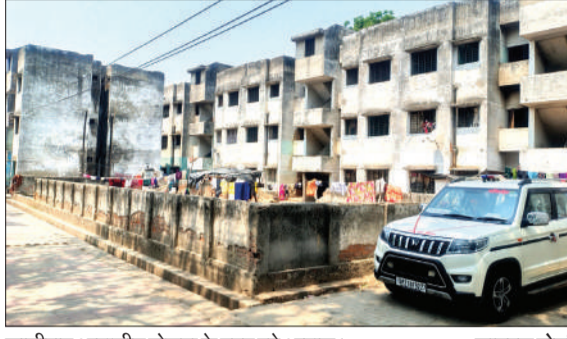
काशीराम आवासीय योजना के तहत बने आवास।