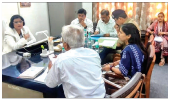
राष्ट्रीय लोक अदालत को लेकर अधिकारियों के साथ बैठक करती जनपद न्यायाधीश।

चन्दौसी। उत्तर प्रदेश राज्य विधिक सेवा प्राधिकरण द्वारा प्रस्तावित आगामी राष्ट्रीय लोक अदालत 9 मई को जिला न्यायालय में आयोजित की जाएगी।