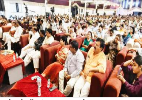
कार्यक्रम में शामिल मंडलायुक्त व भाजपाई।