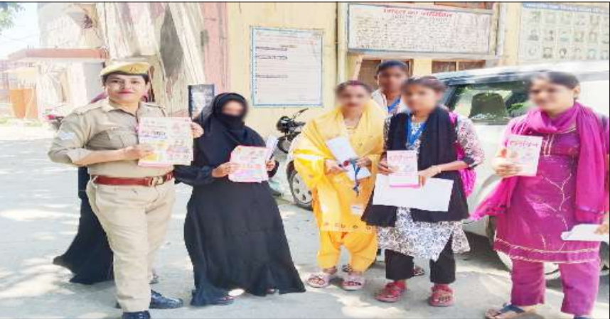
छात्राओं को जागरूक करती महिला सिपाही।