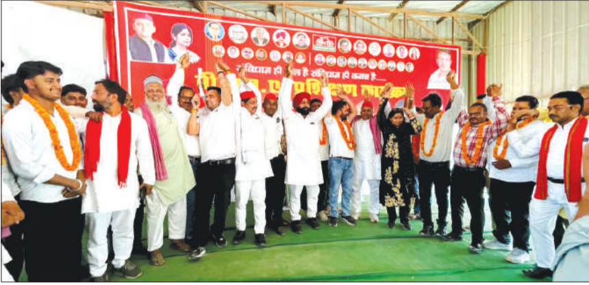
बैठक के दौरान मौजूद पदाधिकारी।

बैठक में राष्ट्रीय अध्यक्ष अखिलेश यादव के निर्देशानुसार प्रत्येक विधानसभा क्षेत्र में सेक्टर, जून एवं बूथ स्तर पर पीडीए कार्यक्रमों को तेज करने पर विशेष जोर दिया गया। जिला संगठन, फ्रंटल संगठनों, युवा इकाइयों एवं विभिन्न प्रकोष्ठों के पदाधिकारियों को बूथ स्तर तक संगठन मजबूत करने के निर्देश दिए गए। साथ ही प्रत्येक बूथ पर कम से कम 20 युवाओं को जोड़ने का लक्ष्य निर्धारित करते