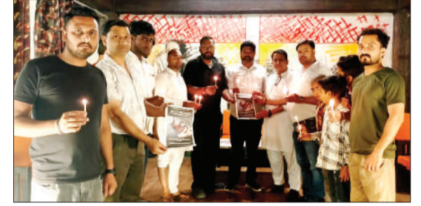
कैडल जलाकर श्रद्धांजलि देते व्यापारी।

ऐतिहासिक गांधी पार्क में आयोजित इस सभा में कई व्यापारी एकत्र हुए। सभी ने हाथों में जलती हुई कैडल लेकर दिवंगत आत्माओं की शांति के लिए ईश्वर से प्रार्थना की। दो मिनट का मौन रखकर मृतकों को श्रद्धांजलि दी गई। इस दौरान व्यापारियों ने जबलपुर प्रशासन से सुरक्षा मानकों में लापरवाही की जांच की भी मांग की। मांग के अंतिम बलिदान की चर्चा से माहौल भावुक हुआ शोक सभा के दौरान मीडिया प्रभारी