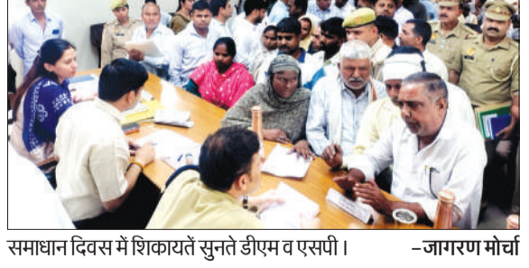
समाधान दिवस में शिकायतें सुनते डीएम व एसपी।