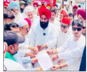
ज्ञापन देते सपाइय।