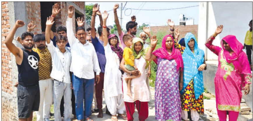
गंदगी व जर्जर सड़क से परेशान होकर प्रदर्शन करते ग्रामीण।

हसनपुर। नगर के एक मोहल्ले के निवासियों ने गंदगी और सड़क निर्माण की मांग को लेकर मोहल्ले में ही जोरदार प्रदर्शन किया। आक्रोशित महिला और पुरुषों ने नगर पालिका प्रशासन के खिलाफ जोरदार प्रदर्शन किया और ‘नगर पालिका हाय-हाय’ के नारे भी लगाए। नगर के मोहल्ला खेवान वासियों ने आरोप लगाया कि मोहल्ले में सफाई व्यवस्था पूरी तरह ध्वस्त है। नाले के किनारे गंदगी के ढेर लगे हुए हैं, जिससे हर समय बदबू और बीमारियों का खतरा बना रहता है। इसके साथ ही मोहल्ले की इंटरलॉकिंग सड़क जगह-जगह से उखड़ चुकी है, जिससे गहरे गड्ढे हो गए