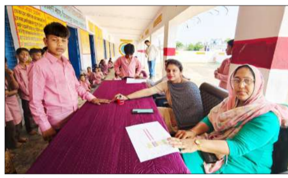
सुनौती प्रक्रिया में हिस्सा लेते बच्चे।

रामपुर। बिलासपुर के कंपोजिट उच्च प्राथमिक विद्यालय अलीपुर टेका में लोकतांत्रिक मूल्यों के विकास, नेतृत्व क्षमता के संवर्धन सामाजिक, सांस्कृतिक तथा विद्यार्थियों में जिम्मेदारी की भावना उत्पन्न करने के उद्देश्य से बाल संसद के गठन के लिए चुनाव प्रक्रिया की गई। चुनाव को वास्तविक लोकतांत्रिक चुनाव की भांति पारदर्शी, निष्पक्ष एवं सुव्यवस्थित ढंग से संपन्न कराया। विद्यालय में 13 अप्रैल को बाल संसद के चुनावी कार्यक्रम की घोषणा के साथ ही विद्यालय में आदर्श आचार संहिता जारी कर दी। बाल संसद प्रभारी ने बीस दिनों तक चलने वाली इस