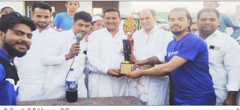
विजयी टीम को ट्रॉफी देते मुख्य अतिथि।