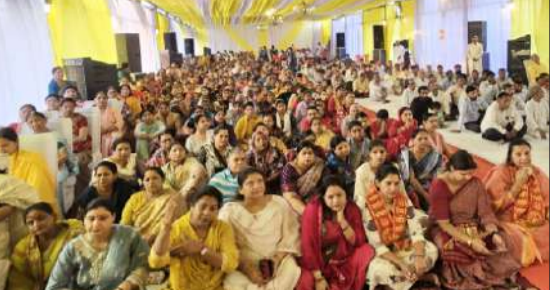
कार्यक्रम में मौजूद महिलाएं।