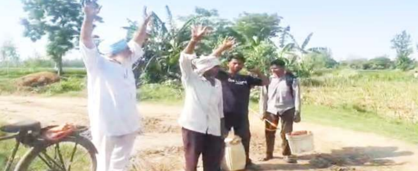
धर्मपुर मंसूरपुर संपर्क मार्ग का निर्माण न होने के विरोध में प्रदर्शन करते ग्रामीण।

मसवासी। चौकी क्षेत्र के ग्राम धर्मपुर उत्तरी और मंसूरपुर के ग्रामीणों का वर्षों पुराना आक्रोश शनिवार सुबह उस समय सामने आ गया। जब बदहाल पड़े रास्ते को लेकर लोगों ने खुलकर विरोध जताया। सुबह करीब नौ बजे बड़ी संख्या में ग्रामीण एकत्रित हुए। सड़क निर्माण की मांग को लेकर नाराजगी व्यक्त की। ग्रामीणों का कहना है कि धर्मपुर उत्तरी से मंसूरपुर को जोड़ने वाला यह रास्ता पिछले करीब 50 वर्षों से कच्चा पड़ा हुआ है। बारिश के दिनों में रास्ते में पानी भर जाता है और जगह-