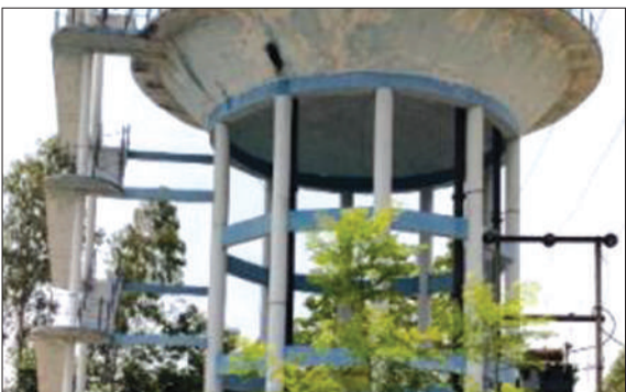
शेरपुरकलां का ओवरहेड टैंक बना शोपीस।

शेरपुर कलां। विकास के बड़े-बड़े दावों के बीच जमीनी हकीकत शेरपुर कलां में कुछ और ही कहानी बयां कर रही है। वर्ष 2007 में लाखों रुपये की लागत से बनी पानी की टंकी आज भी गांव वासियों के लिए महज एक ढांचा बनकर रह गई है।