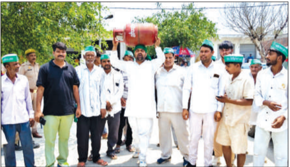
सिर पर सिलेंडर रखकर प्रदर्शन करते किसान।