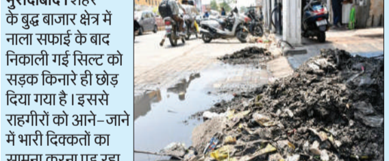
नाला सफाई के बाद सड़क किनारे पड़ी सिल्ट।

मुरादाबाद। शहर के बुढ़ बाजार क्षेत्र में नाला सफाई के बाद निकाली गई सिल्ट को सड़क किनारे ही छोड़ दिया गया है। इससे राहगीरों को आने-जाने में भारी दिक्कतों का सामना करना पड़ रहा है। स्थानीय दुकानदारों का कहना है कि नाले से निकली गंदगी लंबे समय से सड़क किनारे पड़ी है, जिससे बदबू और गंदगी का माहौल बना हुआ है। इसके चलते ग्राहक भी दुकानों तक आने से कतराने लगे हैं, जिससे व्यापार प्रभावित हो रहा है। क्षेत्रीय लोगों ने नगर निगम से जल्द से जल्द सिल्ट हटवाने की मांग की है, ताकि आमजन को राहत मिल सके और बाजार की स्थिति सामान्य हो सके।