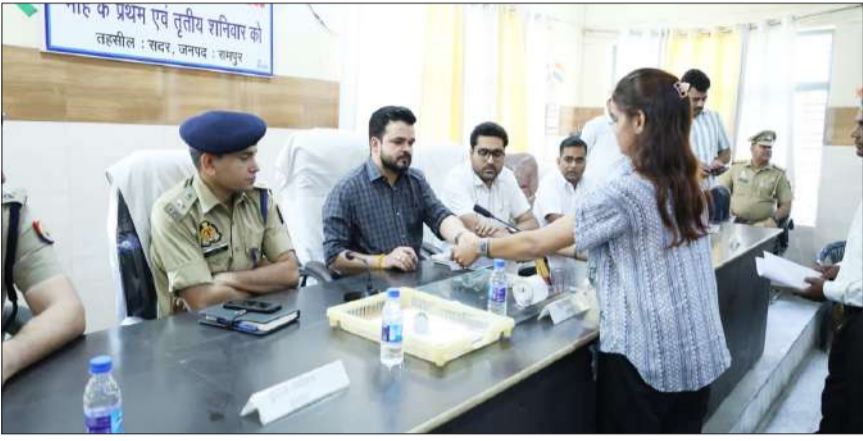
तहसील सदर सभागार में फरियादी की शिकायत सुनते डीएम-एसपी।

जिले के सभी तहसीलों में हुआ संपूर्ण समाधान दिवस का आयोजन, लगी रही भीड़