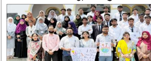
जौहर विवि में आयोजित कार्यक्रम में शामिल छात्र-छात्राएं।