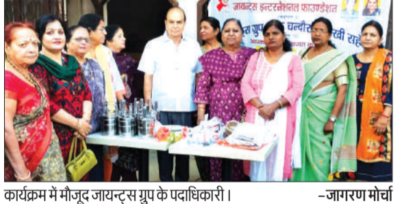
कार्यक्रम में मौजूद जायन्ट्स ग्रुप के पदाधिकारी।