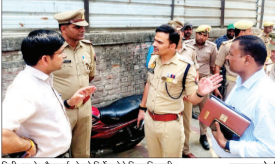
निरीक्षण के दौरान डीओ को निर्देश देते जिलाधिकारी।

मोहल्ला नखासा में काशीराम आवासीय योजना के तहत कई आवास बने हुए हैं। जिसमें भीख से सीख योजना के तहत 40 से 41 परिवार को प्रशासन ने बसाया है। जबकि अन्य आवासों को लोगों ने अवैध रूप से कब्जा कर लिया है। उक्त कब्जा धारी लोग