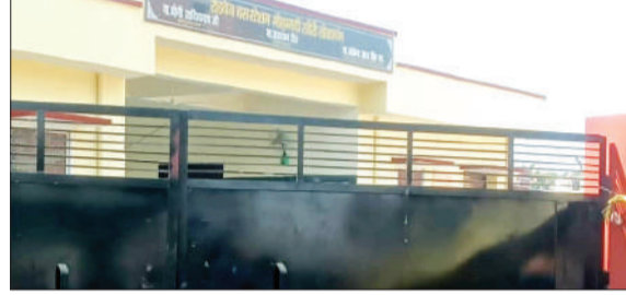
नवनिर्मित रोडवेज अड्डा।

से केवल और ट्र्यूबवेल स्टार्टर चोरी, तथा बाजार में जनरेटर्स से अल्टीनेटर चोरी की घटनाएं सामने आ चुकी हैं। लगातार हो रही इन वारदातों के बावजूद पुलिस की गश्त और कार्रवाई पर कोई ठोस असर नजर नहीं आ रहा। लोगों का आरोप है कि पुलिस सिर्फ घटनाओं के बाद औपचारिकता निभाने तक सीमित है, जबकि चोर बेखौफ होकर एक के बाद एक वारदात को अंजाम दे रहे हैं। ऐसे में सवाल उठना लाजिमी है कि आखिर क्षेत्र में कानून व्यवस्था की जिम्मेदारी कौन निभा रहा है। पीड़ित ने थाना फैजगंज बेहटा में तहरीर देकर अज्ञात युवकों के खिलाफ कार्रवाई की मांग की है। वहीं, ग्रामीणों ने चेतावनी दी है कि यदि जल्द ही चोरियों पर अंकुश नहीं लगाया गया तो वे उच्च अधिकारियों से शिकायत करने को मजबूर होंगे।