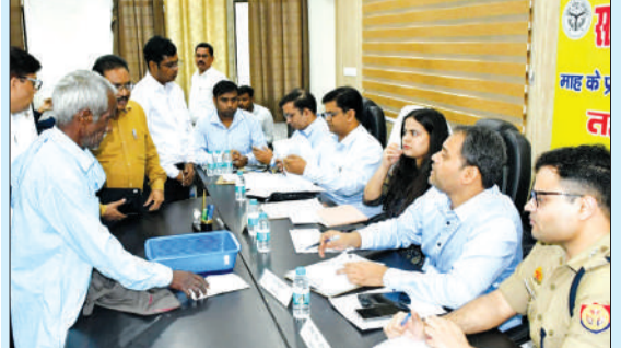
समाधान दिवस में लोगों की समस्याएं सुनते अधिकारीगण।