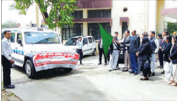
पीलीभीत में राष्ट्रीय लोक अदालत का प्रचार करते हुए प्रचार वाहन।

पीलीभीत। जनपद में 09 मई 2026 को राष्ट्रीय लोक अदालत का आयोजन किया जाएगा। यह लोक अदालत प्रातः 10:00 बजे से सायं 5:00 बजे तक दीवानी न्यायालय परिसर पीलीभीत, ग्राम न्यायालय पूरनपुर तथा बाह्य न्यायालय बीसलपुर में आयोजित होगी।