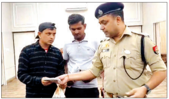
पीड़ित को खोया हुआ मोबाइल देते एसपी सिटी।

बरेली। खोए मोबाइल की तलाश में दर-दर भटक रहे लोगों के लिए बरेली पुलिस ने ऐसा काम कर दिखाया, जिसने पूरे जिले में सुखियां बटोर लीं। करीब 65 लाख रुपये कीमत के 342 मोबाइल फोन बरामद कर पुलिस ने न सिर्फ बड़ी सफलता हासिल की, बल्कि लोगों के चेहरों पर खोई मुस्कान भी वापस लौटा दी। पुलिस लाइन में आयोजित कार्यक्रम किसी उत्सव से कम नहीं दिखा, जहां अपने-अपने मोबाइल पाकर लोग खुशी से झूम उठे।