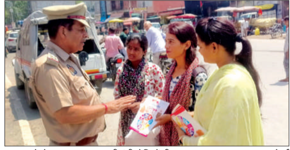
सुरक्षा को लेकर जागरूक करती एंटी रोमियों टीम।

चन्दौसी। उत्तर प्रदेश शासन द्वारा महिलाओं/बालिकाओं की सुरक्षा व स्वतंत्रता बचाने के लिए मिशन शक्ति अभियान (फेज-5.0) अभियान चलाया जा रहा है। इसी के तहत पुलिस अधीक्षक संभल कृष्ण कुमार के निर्देशन एवं क्षेत्राधिकारी एवं सहायक नोडल मिशन शक्ति अभियान दीपक कुमार के नेतृत्व में सोमवार को जनपद की मिशन शक्ति टीम में नियुक्त महिला पुलिसकर्मियों द्वारा थाना क्षेत्रांतर्गत आयोजित कार्यक्रम में बालिकाओं को जागरूक करने के साथ ही महिला संबंधित समस्याओं के निस्तारण कराने के संबंध में चौपाल का आयोजन करके उनको जागरूक किया गया। साथ ही मिशन शक्ति 5.0 (द्वितीय चरण)