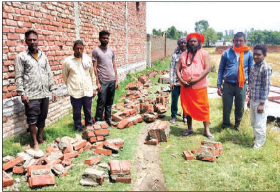
मंदिर परिसर में हुए नुकसान को दिखाते महंत व अन्य।

तूफान की तीव्रता इतनी अधिक थी कि मंदिर का टीन शोध, छत और अन्य सामान उखड़कर दूर खेतों तक जा गिरे। देखते ही देखते पूरा परिसर अस्त-व्यस्त हो गया। ग्रामीणों के अनुसार इस घटना में लाखों रुपये का नुकसान होने का अनुमान है। घटना की जानकारी मिलते ही