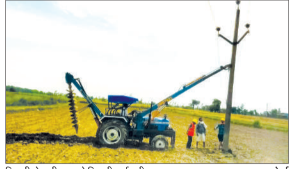
बिजली पोल ठीक करते बिजली कर्मचारी।

रविवार की रात आधी तेज आंधी के साथ बारिश ने लोगों को तो गर्मी से राहत मिली। लेकिन पोल गिरने व लाइनें टूट जाने से बिजली आपूर्ति को बाधित कर दिया। देहात क्षेत्र में पेड़ों के नीचे से गुजर रही लाइनें पेड़ों की टहनियों टूटने से टूट गईं जिसके चलते बिजली आपूर्ति बाधित रही। इसके चलते तहसील क्षेत्र से जुड़े गांवों की बिजली आपूर्ति बाधित हो गई। बिजली आपूर्ति न मिलने से लोगों को काफी परेशानियों का सामना करना पड़ रहा है। बिजली चालित उपकरण और बिजली से होने वाले कामकाज बाधित रहे। बिजली आपूर्ति न मिलने से लोगों को भारी परेशानियों का सामना करना पड़ा। हालांकि