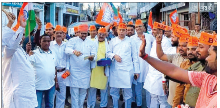
कई राज्यों में भाजपा सरकार बहुमत में आने पर जश्न मनाते भाजपा के कार्यकर्ता।