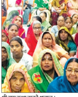
श्री राम कथा सुनते श्रद्धालु।

श्री राम को राजा बना देना चाहिए और गुरु वशिष्ठ से विचार-विमर्श किया। गुरु वशिष्ठ जानते थे कि यह शृष्य समय राम के राज्याभिषेक का नहीं है। उन्होंने कहा महाराज वही समय शृष्य होगा जिस समय भगवान राम राज सिंहासन पर विराजमान होंगे। परन्तु दशरथ इस ताल्यय को नहीं समझ पाए और घोषणा कर दी कि श्री राम का राज्याभिषेक होगा। माता सरस्वती के प्रभाव से