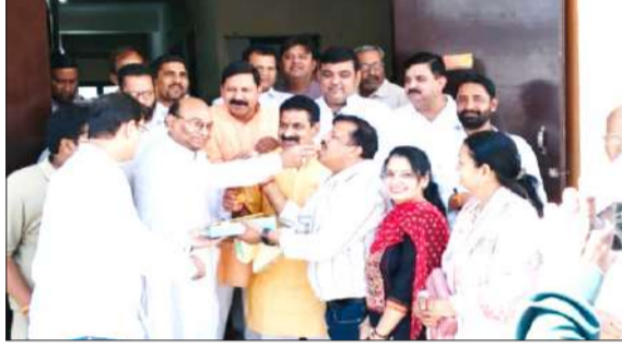
भाजपा कार्यालय पर जीत की खुशी में मिटाई खिलाते भाजपाई।