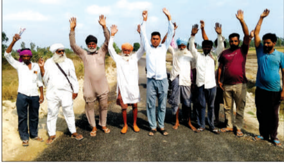
प्रदर्शन करते ग्रामीण।

पूरनपुर। टांडा होते हुए इकोतरनाथ को जोड़ने वाले लिंक रोड के निर्माण कार्य हाल ही में हुआ था। एक वीडियो सोशल मीडिया पर वायरल हुआ है। जिसमें सड़क पैर मारते ही उखड़ रही है। इससे नाराज ग्रामीणों ने विरोध प्रदर्शन कर नाराजगी जताई। तहसील क्षेत्र के गांव पुननापुर टांडा से लगा हुआ गांव नगरिया टांडा है। जो इकोतरनाथ मंदिर जाने वाले लिंक रोड को जोड़ता है। पांच किलोमीटर लंबी इस सड़क का निर्माण 20 दिन पहले कराया गया था। निर्माण कार्य पूरा हो चुका है। लेकिन ग्रामीणों का आरोप है कि मानक के तहत निर्माण नहीं कराया गया है। रविवार को वीडियो भी सोशल मीडिया पर वायरल हुआ है। जिसमें ग्रामीणों के पर