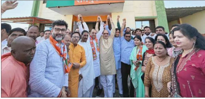
भाजपा कार्यालय पर जीत का जश्न मनाते भाजपाई।