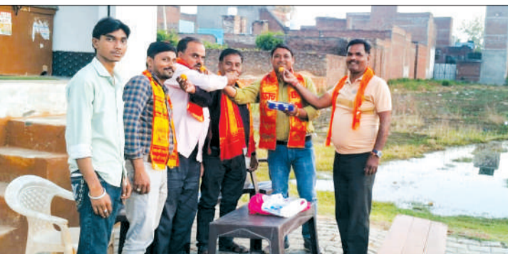
जश्न मनाते भाजपा के कार्यकर्ता।