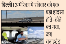
बड़ा हादसा होते-होते बच गया, जब यूनाइटेड एयरलाइंस का एक प्लेन लैडिंग के समय हाईवे पर एक लैंप पोस्ट (खंभा) और ट्रक से टकरा गया। जब प्लेन में यह दुर्घटना हुई तब उसमें 231 यात्री और क्रू मेंबर सवार थे। न्यूज एजेंसी AFP की रिपोर्ट के अनुसार फेडरल एविएशन एडमिनिस्ट्रेशन (FAA) ने बताया कि यह बोइंग 767 प्लेन इटली के वेनिस से आ रहा था और राहत की बात यह रही कि न्यूआर्क लिबर्टी इंटरनेशनल एयरपोर्ट पर सुरक्षित उतर गया। एजेंसी इस घटना की जांच करेगी। न्यू जर्सी स्टेट पुलिस की शुरुआती जांच में बताया गया कि जब प्लेन रनवे के पास उतरने वाला था, तभी उसके लैडिंग टायर और नीचे का हिस्सा एक खंभे और ट्रैक्टर-ट्रेलर (बड़ा ट्रक) से टकरा गया। पुलिस ने कहा कि इसके बाद वह खंभा एक जीप से भी टकरा गया, जो उसी हाईवे पर चल रही थी। पोर्ट ऑथोरिटी ऑफ न्यूयॉर्क एंड न्यू जर्सी के अनुसार, प्लेन में किसी को घोट नहीं आई। ट्रक ड्राइवर को हल्की घोट आई, उसे अस्पताल ले जाया गया और बाद में रिस्चार्ज कर दिया गया।