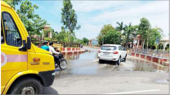
बारिश होने से गांधी समाधि पर जलभराव।