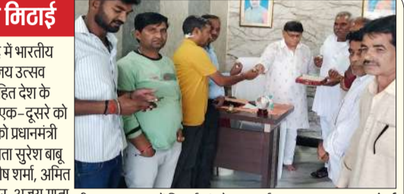
जीत पर शाहबाद में मिटाई बांटे भाजपाई।