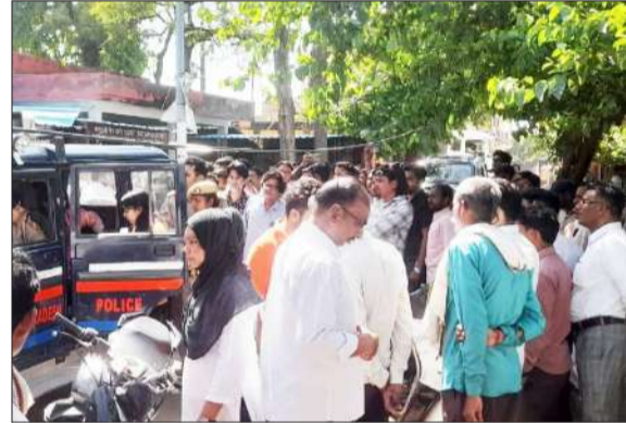
हंगामे के बाद महिलाओं को थाने लाती पुलिस।

और दोनों पक्षों को थाने ले आई। खबर लिखे जाने तक पुलिस जांच में जुटी हुई थी।