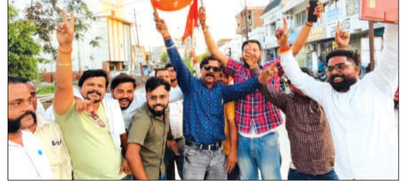
पश्चिम बंगाल में भाजपा की जबरदस्त जीत की खुशी मनाते भाजपाई।

युवती के बात बंद करने पर आरोपी ने फोटो वायरल करने की धमकी दी। जब पिता ने इसका विरोध किया, तो आरोपी ने उनके साथ गाली-गलौज कर जान से मारने की धमकी दी। पुलिस ने तहरीर के आधार पर युवक के खिलाफ संबंधित धाराओं में मुकदमा दर्ज कर लिया है और मामले की गहनता से जांच शुरू कर दी है।