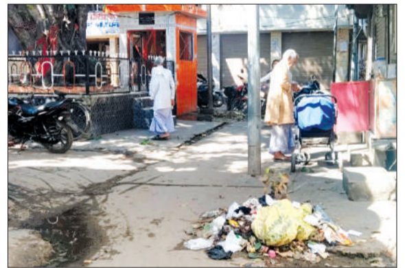
शिव मंदिर के पास गंदगी का ढेर।

नगर पालिका की अनदेखी के चलते नगर के कई स्थानों पर कूड़े के ढेर जमा हैं, जिससे लोगों में नाराजगी बढ़ती जा रही है। मंदिर के आसपास फैली गंदगी से दुर्गंध उठ रही है और चोटें से गुजरना तक मुश्किल हो गया है। सुबह-शाम पूजा-अर्चना के लिए आने वाले श्रद्धालुओं को सबसे ज्यादा दिक्कत झेलनी पड़ रही है। स्थानीय लोगों का कहना है कि कई बार शिकायत करने