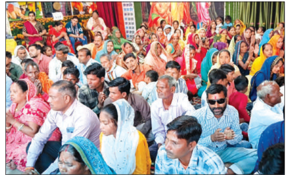
श्री बालाजी धाम में चतुर्थ वार्षिकोत्सव में उपस्थित श्रद्धालु।

आकर्षण का केंद्र रहा। भक्तों ने पूरे उत्साह के साथ पाठ में भाग लिया। इसके बाद बालाजी महाराज की भव्य महाआरती हुई, जिसमें श्रद्धालुओं की भीड़ उमड़ पड़ी और जयकारों से पूरा परिसर गुंज उठा। आयोजन समिति के अनुसार, वार्षिकोत्सव