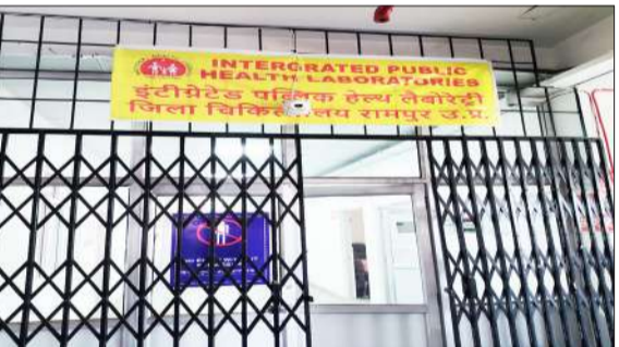
जिला अस्पताल की तीसरी मंजिल पर बनी लैब।