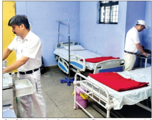
सीएचसी के कोल्ड रूम में कार्य करते स्वास्थ्य कर्मी।