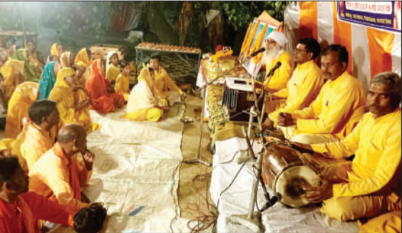
दीपयज्ञ आयोजन में भाग लेते श्रद्धालु।