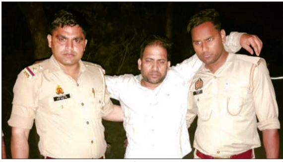
मुठभेड़ में घायल हुए बदमाश को ले जाती पुलिस।

4 मई की रात भोजीपुरा पुलिस टीम गश्त पर थी, तभी मुखबिर ने सूचना दी कि प्राथमिक विद्यालय दलपतपुर में हुई चोरी के आरोपी फिर से वारदात की फिराक में हैं। चोरी का माल ठिकाने लगाने निकल रहे हैं। सूचना मिलते ही पुलिस ने बासुधरन ढाल से दलपतपुर जाने वाले रास्ते पर घेराबंदी कर चेंकिंग