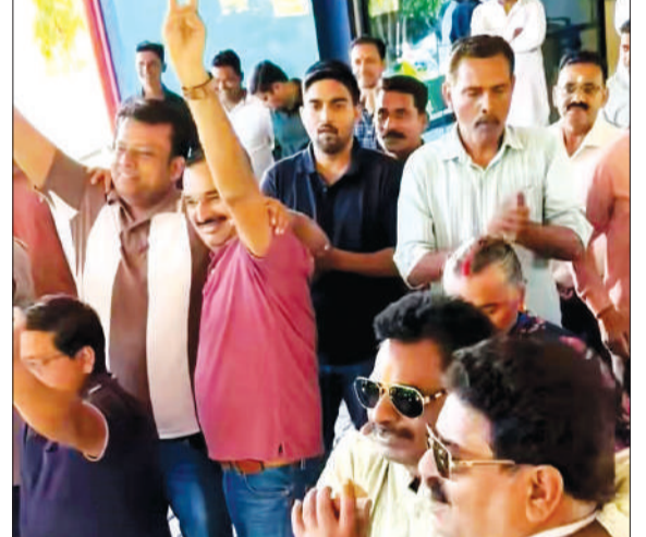
पश्चिम बंगाल में भाजपा की शानदार जीत पर खुशियां मनाते भाजपाई।

जीत की खुशी में कार्यकर्ताओं ने जमकर ढोल-नगाड़े बजाए और एक-दूसरे को मिठाई खिलाकर बधाई दी। पूरे परिसर में उत्साह का माहौल रहा और कार्यकर्ता गगनभेदी नारों के साथ जश्न मनाते नजर आए। कार्यकर्ताओं ने