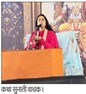
कथा सुनाती वाचक।