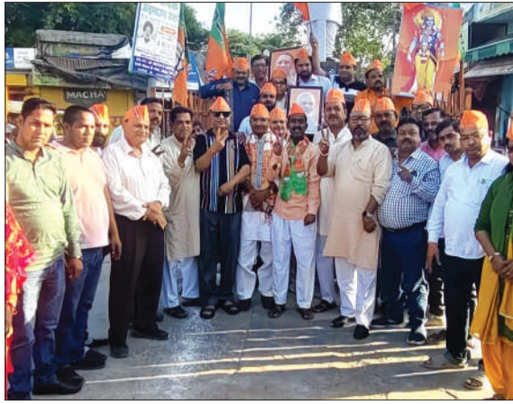
चुनाव परिणामों में भाजपा की जीत पर एक-दूसरे को मिटाई खिलाते भाजपाई।