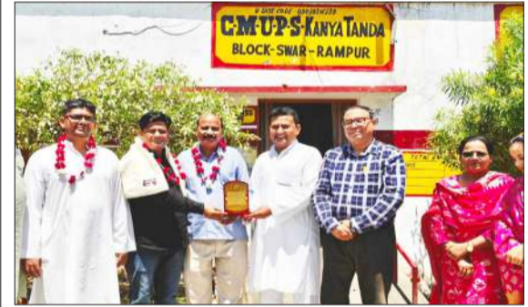
जिलाध्यक्ष चुने जाने पर स्वागत करते शिक्षक।