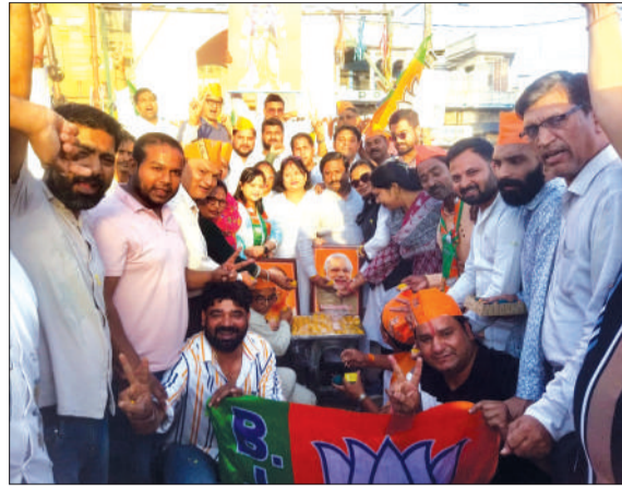
चुनाव परिणामों में भाजपा की जीत पर खुशी मनाते भाजपाई।