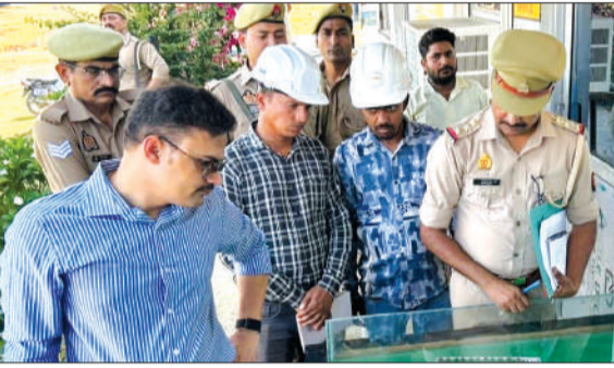
निर्माण कार्यों का निरीक्षण करते एसपी।