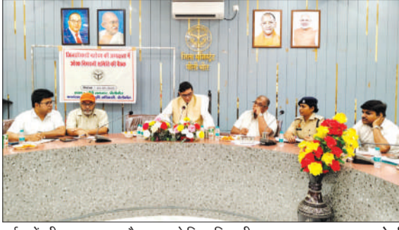
उर्वरकों की उपलब्धता पर बैठक करते जिलाधिकारी।

जिलाधिकारी ने कहा कि जनपद में उर्वरक की कोई कमी नहीं है तथा उन्होंने किसानों को उनकी आवश्यकतानुसार उर्वरकों का समानुपात में वितरण सुनिश्चित किए जाने के निर्देश दिए। उन्होंने निर्देशित किया कि वितरण व्यवस्था पारदर्शी एवं सूचारु बनी रहे, जिससे किसानों को किसी प्रकार की असुविधा न हो। इस अवसर पर उत्तर प्रदेश कृषि निर्यात नीति-2019 के अंतर्गत संचालित क्लस्टरों की