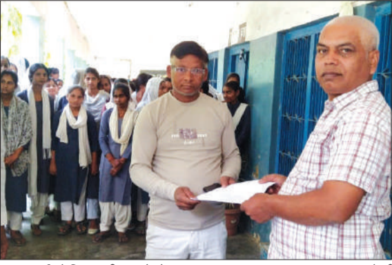
प्रधानाचार्य को शिकायती पत्र सौंपते।

मांग की। वहीं, छात्रों ने भी कड़ा रुख अपनाते हुए कहा कि जब तक सभी विषयों के शिक्षकों की व्यवस्था नहीं होती, तब तक वे फीस जमा नहीं करेंगे। उन्होंने आरोप लगाया कि कॉलेज प्रबंधन की लापरवाही से एक माह की पढ़ाई बर्बाद हुई है, इसलिए एक माह की फीस में छूट दी जाए। अभिभावकों और छात्रों ने निर्णय लिया कि