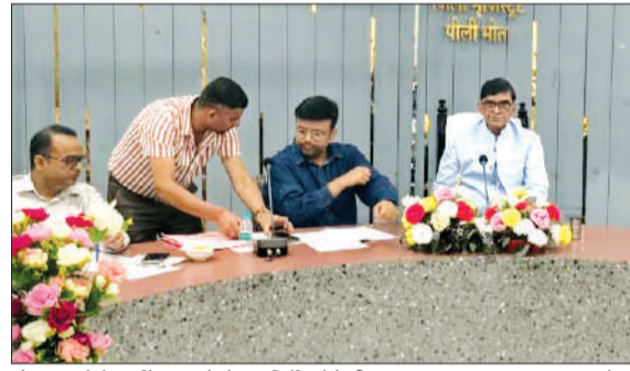
गौशालाओं के पर्यवेक्षण को लेकर निर्देश देते डीएम।