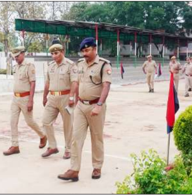
पुलिस लाइन का निरीक्षण करते एएसपी।