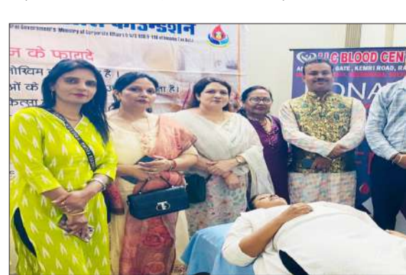
स्कूल में रक्तदान करती शिक्षिका।

रामपुर। मदद एक आस संस्था की ओर से व्हाइट हॉल पब्लिक स्कूल के प्ले ग्रुप में एक दिवसीय रक्तदान शिविर, डेंटल चेकअप एवं आई चेकअप शिविर का आयोजन किया। जिसका उद्देश्य समाज में स्वास्थ्य के प्रति जागरूकता बढ़ाना एवं जरूरतमंदों की सहायता करना था।