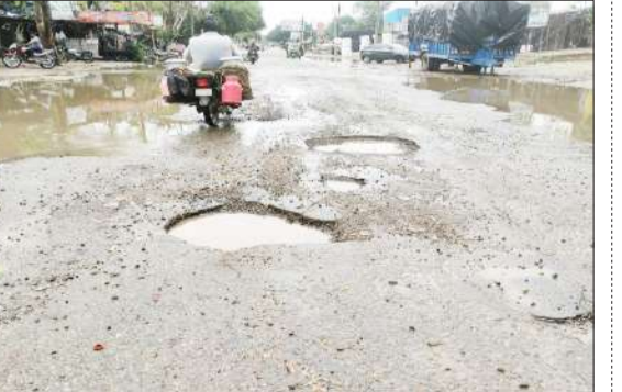
रामपुर-स्वार मार्ग में हुए गड्डे।

रामपुर। बारिश में रामपुर-स्वार रोड पर पैच कार्य उखड़ गए हैं और गिट्टियां भी बह गई हैं। पैच कार्य गायब है। कहीं ऊबड़-खाबड़ सड़क तो कहीं बिखरी गिट्टियां पर दो पहिया या अन्य हल्के वाहनों का संतुलित चलना संभव नहीं हो पा रहा है। जान जोखिम में डालकर ही सड़कों पर यात्रा करनी पड़ रही है। गड्डों में बिछाई गई गिट्टियां बारिश की वजह से बाहर आ गई हैं। स्वार-रामपुर मार्ग की स्थिति काफी बुरी से बदतर हो गई है। बारिश होने से पैच कार्य उखड़ गए हैं। जिस पर लोगों का चलना मुश्किल हो गया है। खासतौर पर खौद चौराहे से