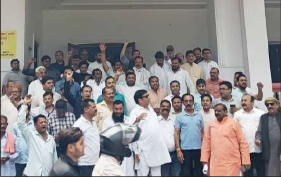
कलेक्ट्रेट में प्रदर्शन करते व्यापारी।