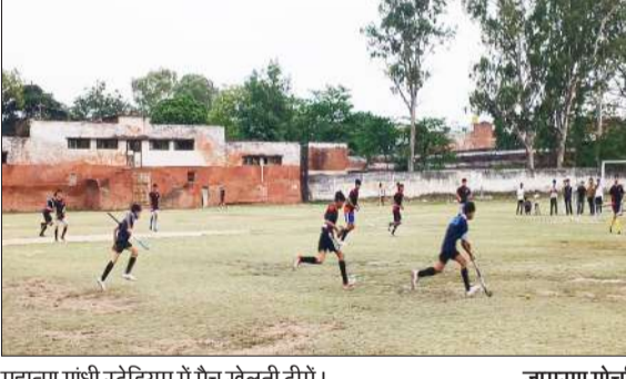
महात्मा गांधी स्टेडियम में मैच खेलती टीमें।