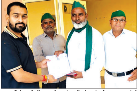
ज्ञापन सौंपते भारतीय किसान यूनियन लोक शक्ति के कार्यकर्ता।

हसनपुर। भारतीय किसान यूनियन लोक शक्ति के कार्यकर्ताओं व पदाधिकारियों ने मंगलवार को किसानों की समस्याओं को लेकर मुख्यमंत्री को संबोधित ज्ञापन उप जिलाधिकारी कार्यालय में सौंपते हुए कहा है कि जिला सहकारी बैंकों में किसानों से समिति द्वारा 7% ब्याज वसूला जा रहा है। जो गलत है किसानों से तीन प्रतिशत ब्याज लिया जाए और जिले में तीन प्रतिशत ब्याज लिया जा रहा है इन बैंकों को जिले से संबद्ध किया जाए। छुट्टा पशुओं से निजात दिलाई जाए। उन्हें पकड़वाकर गोशाला भिजवाया जाए। गंगा एक्सप्रेस