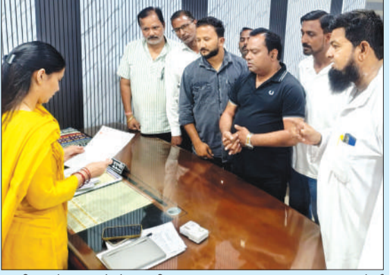
एसडीएम को ज्ञापन सौंपते व्यापारी।