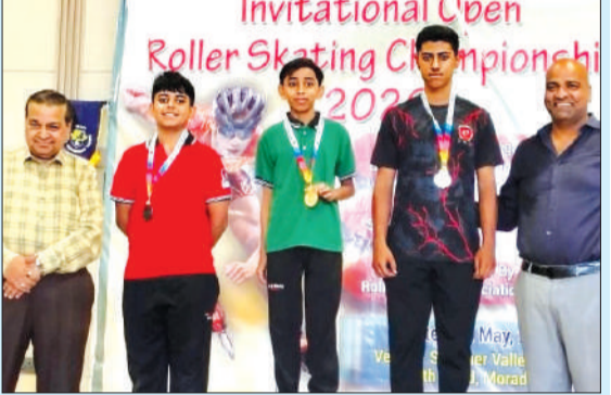
विजेता प्रतिभागियों को मेडल पहनाकर किया गया सम्मानित।