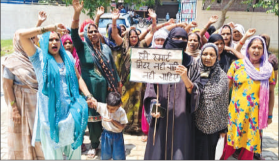
स्मार्ट मीटरों के विरोध में प्रदर्शन करती महिलाएं।

मंगलवार को स्मार्ट मीटरों के विरोध में महिलाओं ने 'स्मार्ट मीटर हाय-हाय' बिजली विभाग हाय हाय के नारे लगाते हुए एक्शाईन कार्यालय के गेट पर धरना देकर बैठ गईं। प्रदर्शनकारी महिलाओं का आरोप है कि स्मार्ट मीटर लगाने के बाद से उनके बिजली बिलों में बेतहाशा बढ़ोतरी हुई है, जिससे आम परिवारों का बजट बिगड़ गया है। स्मार्ट मीटरों के कारण बिल