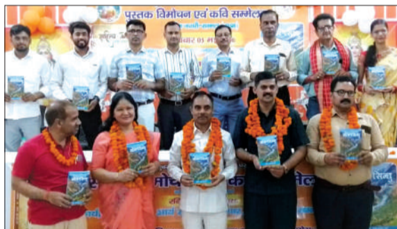
पुस्तक विमोचन व सम्मानित कवि एवं साहित्यकार।