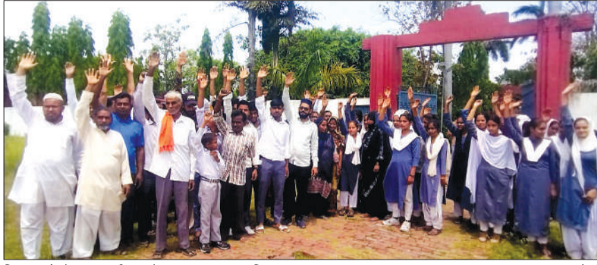
विद्यालय के गेट पर प्रदर्शन करते छात्र-छात्राएं एवं अभिभावक।

अभिभावकों का आरोप है कि विद्यालय में अध्यापन कार्य सुचारु रूप से नहीं चल रहा है। इंटरमीडिएट कक्षाओं में हिंदी और गणित को छोड़ अन्य विषयों की पढ़ाई ठप है, जबकि कक्षा 6 से 10 तक भी अंग्रेजी, चित्रकला, गृह विज्ञान समेत कई विषयों के पीरियड नियमित नहीं लग रहे। इससे बच्चों की