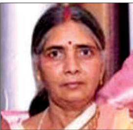
महिला का फाइल फोटो।

चौथा बेटा बनकर जीता भरोसा, मंदिर ले जाने के बहाने रच दी खौफनाक साजिश