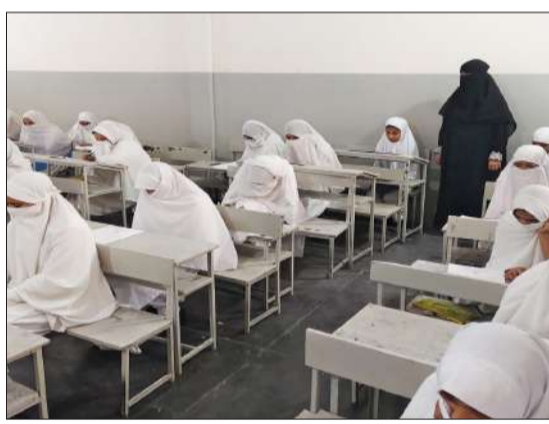
मदरसा फुरकानिया में परीक्षा देती छात्राएं।