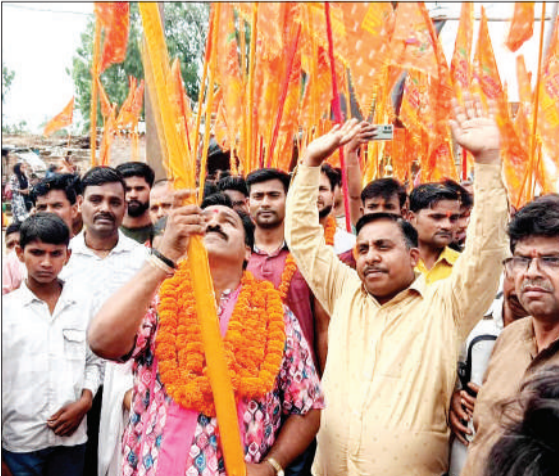
ध्वज यात्रा निकालते श्रद्धालु।

मंत्रोच्चार के बीच पूजा-अर्चना संपन्न हुई। शाम को सजे भव्य दिव्य दरबार में भजन-कीर्तन और संकीर्तन ने श्रद्धालुओं