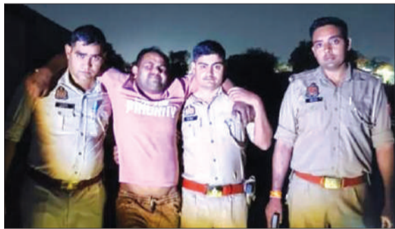
मुठभेड़ में घायल गोकश को ले जाती पुलिस।

बरेली। गौकशी की वारदातों पर लगातार कसने के लिए बरेली पुलिस का अभियान लगातार जारी है। इसी कड़ी में बारादरी पुलिस को बड़ी कामयाबी मिली। मंगलवार सुबह तड़के हारुनगला-भरतौल रोड स्थित एफसीआई गोदाम के पास वाहन चेकिंग के दौरान एक संदिग्ध युवक पुलिस को देखते ही सकपका गया और रास्ता बदलकर तेजी से निकलने लगा। उसकी हरकतों ने पुलिस का शक और गहरा कर दिया।