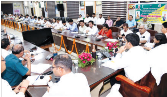
कलक्ट्रेट सभागार में अधिकारियों के साथ बैठक करते जिलाधिकारी।

जिसमें सर्वप्रथम नवागत जिलाधिकारी ने समस्त अधिकारियों से परिचय प्राप्त किया उसके उपरंत उन्होंने जनपद के विकास कार्यों के विषय में चर्चा की और उन्होंने कहा कि प्रत्येक विभाग अपने विभाग से संबंधित प्रमुख योजनाओं जिनकी शासन के द्वारा समीक्षा की जाती है उनकी पीपीटी तैयार करें विभाग से संबंधित जनपद की उपलब्धियां एवं विभाग से संबंधित लंबित समस्याएं