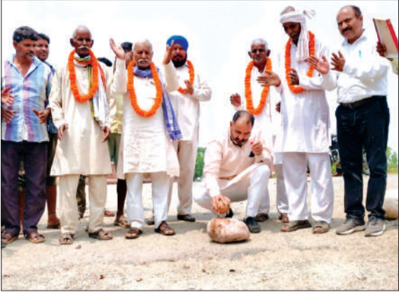
जिप अध्यक्ष के पति ने नारियल तोड़कर सड़क के निर्माण कार्य का शुभारंभ किया।

पूरनपुर। डूडा कालोनी को जाने वाली सड़क पर हरदोई ब्रांच नहर पुल के पास लंबे समय से खस्ताहाल सड़क के बहुरे का वक्त आ गया है। नहर की पूर्वी पक्की पट्टी से डूडा की तरफ करीब 105 मीटर सड़क का नवीनीकरण जिला पंचायत निधि से करीब आठ लाख रुपये की लागत से कराया जाएगा। जिप अध्यक्ष के पति ने निर्माण कार्य का शुभारंभ किया। काफी समय से खस्ताहाल यह सड़क बनने से लोगों को आवगमन में सहूलियत मिलेगी।