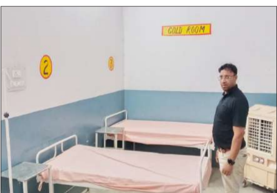
लू और हीट वेब से पीड़ित मरीजों की सुविधा के लिए शाहबाद सीएचसी पर बना कोल्ड रूम।