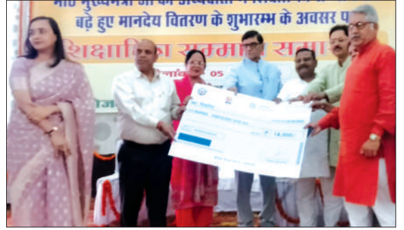
शिक्षामित्रों को 18 हजार रुपये बड़े मानदेय के डेमो चेक देते हुए डीएम व विधायक।