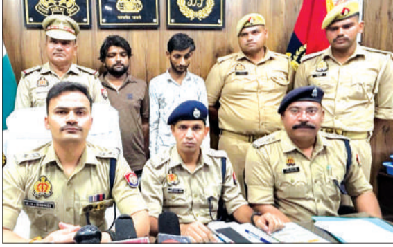
हाईटेनशन लाइन की चोरी का खुलासा करते एसपी।