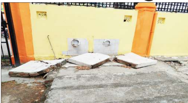
जिला अस्पताल में बने शौचालय की टूटी हुई सीटें।

रामपुर। जिला अस्पताल में बने पोस्टमार्टम हाउस के शौचालय पूरी तरह से जर्जर हो गया है साथ ही शौचालय की सीटें भी टूट गई हैं। आलम यह है कि यहां पर दुर्गंध उठ रही है साथ ही सांस लेना भी दुश्वार हो गया है। इसको लेकर स्वास्थ्य विभाग के अधिकारी कोई सुध नहीं ले रहे हैं। जिला अस्पताल में पोस्टमार्टम हाउस बना है। इसके सामने जिला क्षय रोग केंद्र भी है। यहां पर रोजाना सड़क हादसे में मृतकों के शव आते हैं। लेकिन पोस्टमार्टम हाउस शौचालय की हकीकत किसी से छिपी नहीं है।