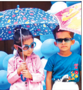
छात्रों के साथ आनंद लेते बच्चे।

के समग्र विकास में सहायक होती हैं। खेल-खेल में सीखने से बच्चे आत्मविश्वासी, सक्रिय और प्रसन्न बनते हैं, साथ ही उनमें सामाजिकता और टीम भावना का विकास होता है। इस सफल आयोजन में विद्यालय के समस्त शिक्षक एवं स्टाफ का विशेष योगदान रहा। अंत में बच्चों के चेहरे पर छाई मुस्कान ही कार्यक्रम की सफलता का प्रमाण बनी।