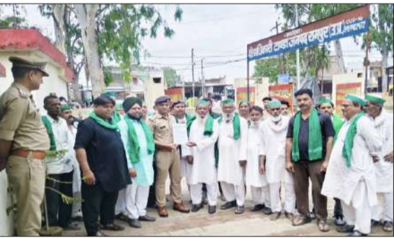
सीओ टांडा को ज्ञापन देते किसान नेता।

टांडा। भारतीय किसान यूनियन के पदाधिकारियों ने प्रभारी निरीक्षक पर अभद्र व्यवहार और उत्पीड़न के आरोप लगाते हुए क्षेत्राधिकारी टांडा को ज्ञापन सौंपा। ज्ञापन में आरोप लगाया गया कि किसान नेताओं के साथ थाने में सम्मानजनक व्यवहार नहीं किया जाता तथा यूनियन की टोपी और झंडे को लेकर आपत्तिजनक टिप्पणियों की जाती हैं। किसान नेताओं ने निष्पक्ष जांचकर कार्रवाई की मांग की है। किसान नेताओं का कहना है कि यदि उचित कार्रवाई नहीं हुई तो कोतवाली परिसर में