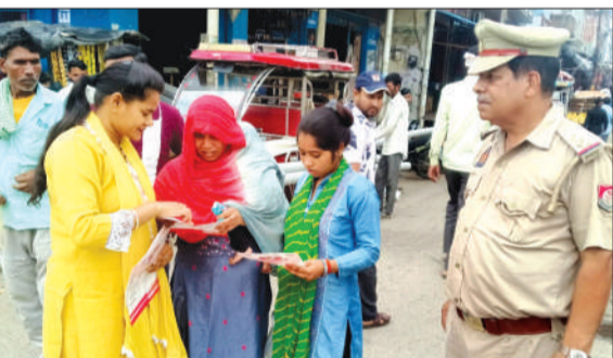
महिलाओं को जागरूक करती एण्टी रोमियो की टीम।

चन्दासी। उत्तर प्रदेश शासन द्वारा महिलाओं एवं बालिकाओं की सुरक्षा व स्वावलंबन के लिए मिशन शक्ति अभियान (फेज-5.0) चलाया जा रहा है। इसी के तहत पुलिस अधीक्षक कृष्ण कुमार के निर्देशन एवं क्षेत्राधिकारी चन्दासी /सहायक नोडल मिशन शक्ति अभियान दीपक कुमार के नेतृत्व में मंगलवार को जनपद की मिशन शक्ति टीम में नियुक्त महिला पुलिसकर्मियों द्वारा थाना क्षेत्रांतर्गत आयोजित कार्यक्रम में बालिकाओं को जागरूक करने के साथ ही महिला संबंधित समस्याओं के निस्तारण कराने के संबंध में चौपाल का आयोजन कर जागरूक किया गया। उन्होंने महिलाओं एवं बालिकाओं के साथ जुड़ कर उन्हें सशक्त एवं सुरक्षित वातावरण देने का प्रयास किया। साथ ही