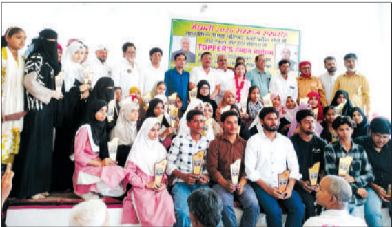
सम्मान समारोह में उपस्थित मेधावी छात्र-छात्राएं।