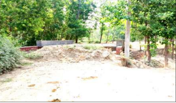
गांव किशनपुर-अटारिया रवन्ना मार्ग पर बनाई गई पुलिया।