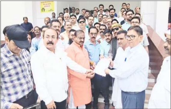
सिटी मजिस्ट्रेट को ज्ञापन सौंपते व्यापारी।

हामिद स्कूल के पास बनाए गए डिवाइडर को हटाना जरूरी, लगता है जाम