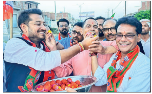
एक दूसरे को मिठाई खिलाकर जश्न मनाते भाजपा नेता व कार्यकर्ता।

कल्याण के लिए निरंतर कार्य कर रही हैं। उन्होंने दृढ़ विश्वास जताया कि आगामी चुनावों में भाजपा उत्तर प्रदेश में जीत की हैट्रिक लगाकर एक नया इतिहास रचेंगी। उन्होंने कहा कि बंगाल और असम में मिली इस प्रचंड जीत ने विपक्ष की नींव हिला दी है और विरोधियों में स्पष्ट