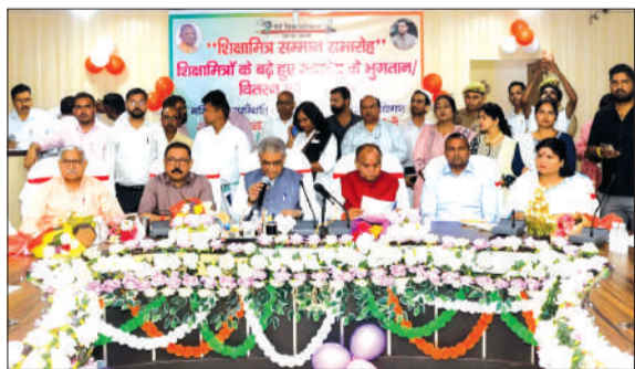
कार्यक्रम को संबोधित करते मुख्य अतिथि।