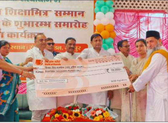
बढ़े मानदेय के शिक्षामित्रों को प्रतीकात्मकचेक देते विधायक एवं अन्य।