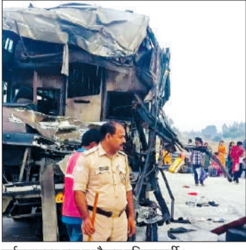
दुर्घटनाग्रस्त बस व मौजूद पुलिसकर्मी।

पुकार मच गई। हादसे के समय बस में बड़ी संख्या में यात्री सवार थे, जिनमें अधिकांश लोग लखनऊ और हरदोई के निवासी बताए जा रहे हैं। टक्कर लगते ही कई यात्री सीटों से उछलकर घायल हो गए, जबकि कुछ बस के अंदर ही फंस गए। मौके पर मौजूद ग्रामीणों ने तत्पराता दिखाते हुए राहत कार्य शुरू किया और बस में फंसे यात्रियों को बाहर निकाला। घटना की सूचना मिलते ही इस्लामनगर थाना पुलिस मौके पर पहुंच गई