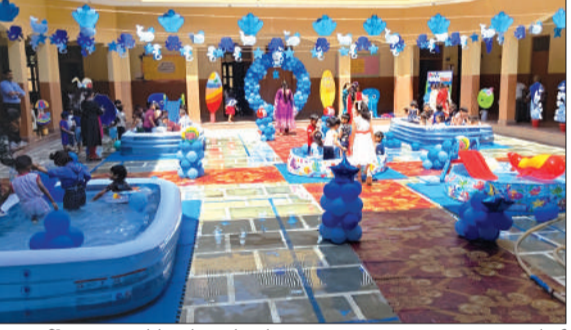
पूल पार्टी का आनंद लेते नन्हे-मुन्ने बच्चे।