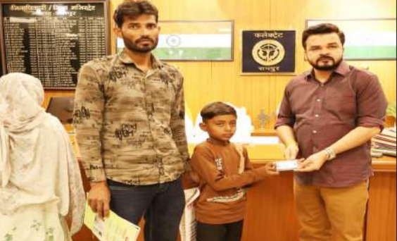
बालक को आयुष्मान कार्ड देते डीएम।