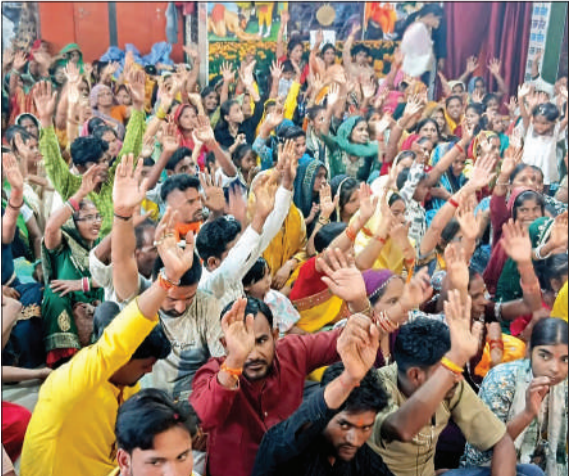
बालाजी धाम पर श्रद्धालुओं की जुटी भीड़।