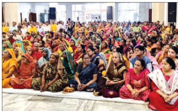
श्रीराम कथा सुनते श्रद्धालु।