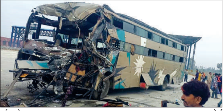
दुर्घटना के बाद बस।

बदायूं। पंजाब से हरदोई जा रही एक डबल डेकर बस मंगलवार सुबह इस्लामनगर थाना क्षेत्र में अनियंत्रित होकर गंगा एक्सप्रेसवे पर खराब खड़े ट्रक से जा टकराई। इस दर्दनाक हादसे में करीब 26 यात्री घायल हो गए, जिनमें कुछ की हालत गंभीर बताई जा रही है। हादसे के बाद मौके पर अफरा-तफरी मच गई और राहगीरों की मदद से घायलों को तत्काल अस्पताल पहुंचाया गया। जानकारी के अनुसार, यह हादसा मंगलवार सुबह करीब नौ बजे इस्लामनगर थाना क्षेत्र के गांव सिठोली के पास हुआ। तेज रफतार में आ रही डबल डेकर बस अचानक चालक के नियंत्रण से बाहर हो गई और सड़क किनारे खड़े एक ट्रक में पीछे से जोरदार टक्कर मार दी। टक्कर इतनी जबरदस्त थी कि बस का अगला हिस्सा बुरी तरह क्षतिग्रस्त हो गया और उसमें सवार यात्रियों में चीख-