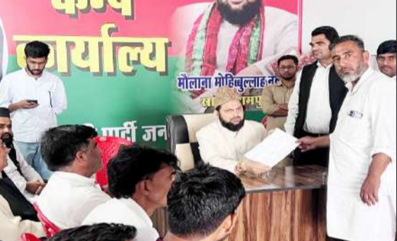
कैप कार्यालय पर ज्ञापन लेते सांसद।

रामपुर। सांसद मौलाना मोहिबुल्लाह नदवी ने जनता दरबार लगाकर जनता की समस्याओं को सुना। इस दौरान काफी लोग समाजवादी पार्टी में शामिल हुए। समाजवादी पार्टी के सांसद मौलाना मोहिबुल्लाह नदवी अपने लोकसभा क्षेत्र के तीन दिवसीय दौरे पर हैं। अपने दौरे के क्रम में सांसद प्रातः ग्राम धनपुर शाहदरा पहुंचे।