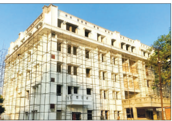
सीएचसी परिसर में निर्माणाधीन क्रिटिकल केयर यूनिट का भवन।

चन्दासी। जनपदवासियों को बहुत जल्द ही स्वास्थ्य सेवा में बहुत बड़ी उपलब्धि मिलने वाली है। क्योंकि पिछले डेढ़ वर्ष सीएचसी में 18 करोड़ की लागत से क्रिटिकल केयर यूनिट का निर्माण कार्य चल रहा है। जो अब अंतिम दौर में है। उक्त यूनिट में 50 बेड की पांच मंजिला इमारत के बेसमेंट व पूरे भवन के निर्माण पूरा हो चुका है। अब हादसे में हाथ-पैर टूटने वाले का प्लास्टर भी यूनिट में हुआ करेगा। खासतौर से यूनिट में अब गंभीर मरीजों को बेहतर उपचार मिलेगा। अभी तक जनपद में हादसों में घायलों को सीएचसी में प्राथमिक उपचार के बाद रेफर कर दिया जाता था। मगर अब ऐसा नहीं होगा, अब सीएचसी