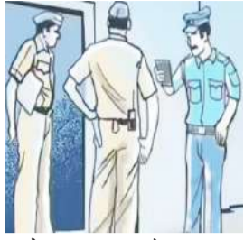
आरोपी बनाया है। मामला पुलिस महकमे में चर्चा का विषय बना हुआ था।

रामपुर। महिला सिपाही और उसकी बच्ची को कार में जलाकर मारने के मामले में गंज पुलिस ने विवेचना के बाद चार्जशीट दाखिल कर दी है। विवेचना के दौरान पुलिस ने छह लोगों को