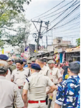
की जा चुकी हैं और 433 लोगों को विभिन्न मामलों में गिरफ्तार किया गया है। इसके साथ ही विभिन्न धाराओं में 1100 से ज्यादा लोगों को हिरासत में लिया गया है। डीजीपी के मुताबिक, इन कार्रवाइयों के बाद आज सुबह से किसी भी तरह की नई अप्रिय घटना सामने नहीं आई है और हालात अब शांत हैं।