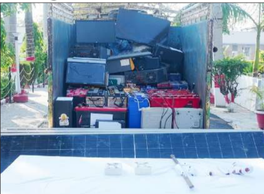
शातिर चोरों के पास से बरामद सामान।

घटना को अंजाम देने के बाद थाने पर अभियोग पंजीकृत किया गया। जिसके बाद एएसपी ने तीनों चोरियों का जल्द से जल्द खुलासे के निर्देश दिए। शाहबाद पुलिस ने एएसपी के निर्देश पर चोरी की घटनाओं का खुलासा करते हुए शाहबाद चंदौसी रोड स्थित किला गेट के पास से सम्भल