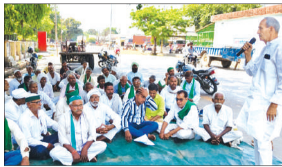
मासिक बैठक में उपस्थित भारतीय किसान यूनियन कार्यकर्ता। -जागरण मोर्चा

बैठक में बिजली विभाग के एसडीओ तथा नायब तहसीलदार द्वारा किसानों की समस्याओं को जल्द से जल्द निस्तारण करने का भरोसा दिलाया गया। आने वाली 15 मई तक समाधान कराए जाने के आश्वासन पर किसानों ने पंचायत को समाप्त किया। राष्ट्रीय सचिव चौधरी उम्मेद सिंह ने किसानों की सभी समस्याओं का निस्तारण जल्द से जल्द कराने की अधिकारियों