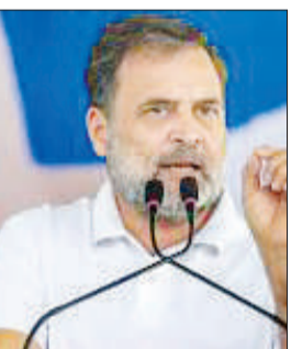
जाती हैं, कभी पूरी सरकार। लोकसभा के 240 BJP सांसदों में से, मोटे तौर पर हर छठा सांसद वोट चोरी से जीता है। पहचानना मुश्किल नहीं- क्या उन्हें BJP की भाषा में 'घुसपैठिए' कहें? और हरियाणा? वहां तो पूरी सरकार

नई दिल्ली। पश्चिम बंगाल चुनाव में भारतीय जनता पार्टी (BJP) को मिली बंपर जीत विपक्ष के ज्यादातर नेताओं के लिए नही उतर रही है। एक तरफ TMC चीफ और पश्चिम बंगाल की मुख्यमंत्री ममता बनर्जी हार के बाद भी इस्तीफा देने से इनकार कर चुकी हैं तो वहीं अब लोकसभा में विपक्ष के नेता और कांग्रेस लीडर राहुल गांधी ने बीजेपी पर निशाना साधा है। राहुल गांधी ने दावा किया है कि हर छठा सांसद (बीजेपी का) वोट चोरी से जीता है। उन्होंने कहा है कि अगर विपक्ष चुनाव होंगे तो बीजेपी 140 सीटें भी नहीं जीत पाएगी। वोट चोरी से कभी सीटें चुराई