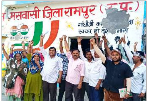
नगर पंचायत मसवासी में हाथ-हाथ के नारे लगाते सफाई कर्मचारी।