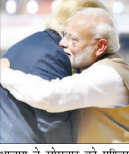
भाजपा ने सोमवार को पश्चिम बंगाल विधानसभा चुनाव में दो-तिहाई से अधिक बहुमत हासिल कर इतिहास रच दिया और मुख्यमंत्री ममता बनर्जी के 15 साल के शासन का अंत कर दिया। पार्टी ने असम में लगातार तीसरी बार सत्ता बरकरार रखी।

वाशिंगटन। अमेरिकी राष्ट्रपति डोनाल्ड ट्रंप ने प्रधानमंत्री नरेन्द्र मोदी को विधानसभा चुनावों में उनकी 'ऐतिहासिक और निर्णायक' जीत पर बधाई दी है। व्हाइट हाउस के एक प्रवक्ता ने मंगलवार को यह जानकारी दी। व्हाइट हाउस के प्रवक्ता कुश देशाई ने कहा, 'पिछले महीने ही फोन पर बातचीत में राष्ट्रपति ट्रंप ने प्रधानमंत्री मोदी की प्रशंसा की थी और कहा कि भारत कितना भाग्यशाली है कि उसे प्रधानमंत्री मोदी जैसा नेता मिला है।' उन्होंने कहा, 'राष्ट्रपति ने प्रधानमंत्री मोदी को (विधानसभा) चुनाव में ऐतिहासिक और निर्णायक जीत पर बधाई दी।'