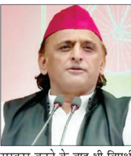
सरकार बनने के बाद भी विपक्षी दलों के साथ बेईमानी की गई। अखिलेश यादव ने चंडीगढ़ और कुंदरकी सहित विभिन्न स्थानों पर हुई कथित अनियमितताओं को लेकर भाजपा के '10 नम्बरी मॉडल' का जिक्र किया। आरोप लगाया कि भाजपा

लखनऊ : अखिलेश यादव ने भाजपा पर चुनाव में धांधली के गंभीर आरोप लगाए हैं। उन्होंने कहा कि कई जगहों पर अनियमितताएं हुईं और उनके पास इसके सबूत हैं। उपचुनाव को लेकर भी उन्होंने चुनावी प्रक्रिया पर सवाल उठाते हुए इसे लोकतंत्र के लिए चिंताजनक बताया। समाजवादी पार्टी अध्यक्ष और पूर्व मुख्यमंत्री अखिलेश यादव ने बुधवार को भाजपा पर गंभीर आरोप लगाया। उन्होंने कहा कि INDIA गठबंधन लोकसभा चुनाव में आखिरी वक्त तक मजबूती से खड़ा रहा और जीत हासिल की, लेकिन अल्पमत की