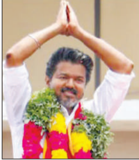
टीवीके को समर्थन देने का निर्णय लिया गया। मीडिया रिपोर्ट्स में दावा किया गया है कि एक्टर विजय ने खुद समर्थन मांगा था। कांग्रेस ने तमिलनाडु में टीवीके की अगुवाई वाली सरकार को समर्थन देने का फैसला किया है। टीवीके 108 सीटों के साथ सबसे बड़ी पार्टी बनकर उभरी है, लेकिन बहुमत (118) से 10 सीटें दूर है। कांग्रेस के 5 विधायकों के साथ आने से वह बहुमत के करीब पहुंच रही है। चर्चा है कि इस समर्थन के बदले कांग्रेस टीवीके के कैबिनेट में 2

नई दिल्ली। कांग्रेस ने तमिलनाडु विधानसभा चुनावों में सबसे बड़ी पार्टी बनकर उभरी टीवीके को समर्थन देने का फैसला किया है। कांग्रेस के साथ आने से टीवीके का संख्याबल अब 113 (टीवीके 108+ कांग्रेस 5) पहुंच गया है। कांग्रेस के टीवीके के साथ जाने पर डीएमके ने इसे गद्दारी बताया है। कांग्रेस ने टीवीके को समर्थन देने का ऐलान किया है, हालांकि कांग्रेस सरकार में शामिल होगी या फिर नहीं यह आने वाले दिनों में साफ होगा। दरअसल टीवीके की बड़ी जीत पर एक्टर विजय के पिता ने कांग्रेस से समर्थन की अपील की थी। उन्होंने कहा था कि कांग्रेस को टीवीके के साथ आने चाहिए। 234 सदस्यों वाली तमिलनाडु विधानसभा में बहुमत का आंकड़ा 118 सीटों का है।