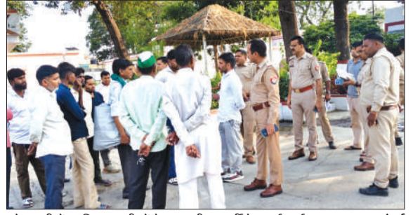
कोतवाली में उपस्थित ग्रामीणों के साथ भीम आर्मी के कार्यकर्ता।

बुधवार दोपहर वह दुकान की छत पर रखे लोहे के पाइप उतार रहा था, तभी पाइप ऊपर से गुजर रही हाई-वोल्टेज बिजली की लाइन से छू गया। करंट की चपेट में आते ही युवक अचेत होकर छत पर गिर पड़ा। स्थानीय लोग उसे तुरंत निजी अस्पताल और फिर सामुदायिक स्वास्थ्य केंद्र ले गए, जहाँ चिकित्सकों ने उसे मृत घोषित कर दिया। जवान बेटे की मौत की खबर मिलते ही परिवार में कोहराम मच गया और मोहल्ले में शोक की लहर दौड़ गई। पुलिस ने शव को पोस्टमार्टम के लिए भेजकर कानूनी कार्रवाई शुरू कर दी है।