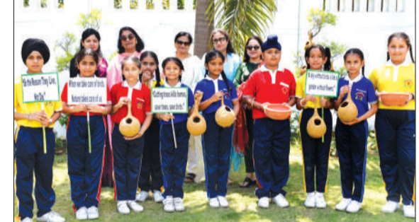
ज्ञान इंटरनेशनल स्कूल में जागरूकता कार्यक्रम में भाग लेते बच्चे।

पीलीभीत। पीलीभीत में जनगणना 2027 के प्रथम चरण (22 मई से 20 जून) के लिए जिला प्रशासन ने सुरक्षा निर्देश जारी किए हैं। जिलाधिकारी ने बताया कि लू और भीषण गर्मी से बचाव के लिए फील्ड कार्य का समय सुबह 8 बजे से पहले और शाम 4 बजे के बाद तय किया गया है। प्रगणकों और सुपरवाइजर्स को पर्याप्त पानी पीने, सिर ढकने और ओआरएस (ORS) साथ रखने की सलाह दी गई है। स्वास्थ्य विभाग को आपात स्थिति के लिए मुस्तैद रहने और प्राथमिक उपचार की व्यवस्था सुनिश्चित करने के निर्देश दिए गए हैं। प्रशासन ने स्पष्ट किया कि कार्यों के दौरान लापरवाही बर्दाश्त नहीं की जाएगी।