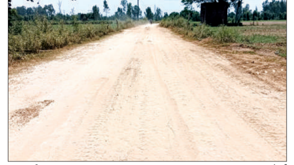
साफ हुई सड़क।