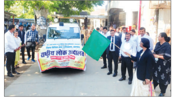
हरी झंडी दिखाकर प्रचार वाहन को रवाना करती जिला न्यायाधीश।

चन्दौसी। जिला न्यायालय परिसर में उत्तर प्रदेश राज्य विधिक सेवा प्राधिकरण के निर्देश पर 9 मई को राष्ट्रीय लोक अदालत का आयोजन किया जा रहा है। लोक अदालत के प्रचार-प्रसार के लिए जिला न्यायाधीश ने हरी झंडी दिखाकर बुधवार की सुबह 10 बजे जिला न्यायालय से प्रचार वाहन रवाना किया।