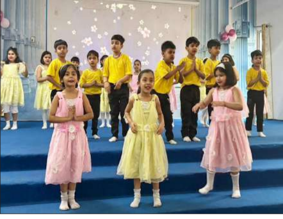
सांस्कृतिक कार्यक्रम प्रस्तुत करते बच्चे।