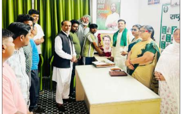
सिविल लाइंस स्थित कार्यालय पर मौजूद पदाधिकारी।

रामपुर। राष्ट्रीय लोक दल की ओर से सिविल लाइंस स्थित कार्यालय पर किसान मसीहा चौधरी अजीत सिंह की पुण्यतिथि पर श्रद्धांजलि सभा का आयोजन किया गया (सभा के प्रारंभ में उपस्थित सभी पदाधिकारियों एवं कार्यकर्ताओं ने चौधरी अजीत सिंह के चित्र पर माल्यार्पण कर उन्हें श्रद्धांजलि अर्पित की तथा उनके बताए मार्ग पर चलने का संकल्प लिया।