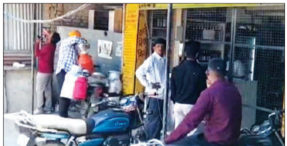
शराब की दुकान। -जागरण मोर्चा

पीलीभीत। जनपद में शराब की दुकानों के बाहर "यहां शराब पीना प्रतिबंधित है" जैसे चेतावनी बोर्ड तो लगे हैं, लेकिन जमीनी हकीकत इससे बिल्कुल उलट नजर आ रही है। शहर के आसाम चौराहा स्थित कंपोजिट विदेशी मदिरा की दुकान के बाहर खुलेआम शराब पीने का मामला सामने आया है, जिसका वीडियो सोशल मीडिया पर तेजी से वायरल हो रहा है।