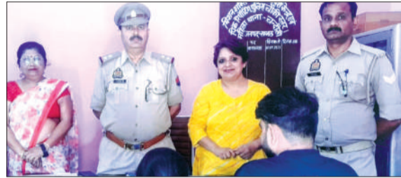
परिवार परामर्श सुलह समझौता केंद्र पर विवादों का निस्तारण करती पुलिस।