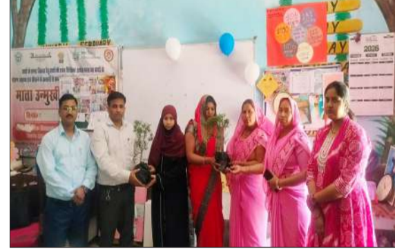
नवनिर्गुवत आंगनबाड़ी सहायिकाओं को सम्मानित करते अतिथि।