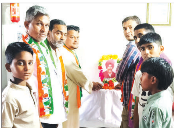
महाराज छत्रपति शाहूजी के महापरिनिर्वाण दिवस की पुण्यतिथि मनाते कार्यकर्ता।

ठाकुरद्वारा। ग्राम करनपुर में महान समाज सुधारक छत्रपति शाहू जी महाराज का महापरिनिर्वाण दिवस (पुण्यतिथि) श्रद्धा, सम्मान और सादगी के साथ मनाया गया। इस अवसर पर आयोजित कार्यक्रम में बड़ी संख्या में स्थानीय लोग, सामाजिक कार्यकर्ता और कांग्रेस पदाधिकारी उपस्थित रहे। कार्यक्रम की शुरुआत शाहू जी महाराज के चित्र पर माल्यार्पण एवं पुष्पांजलि अर्पित कर की गई।