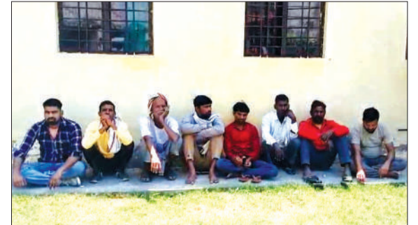
पोस्टमार्टम हॉउस पर गमगीन बैठे परिजन।