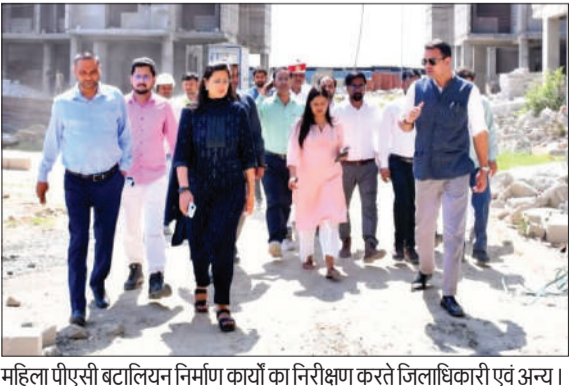
महिला पीएसी बटालियन निर्माण कार्यों का निरीक्षण करते जिलाधिकारी एवं अन्य।

बदायूं। निर्माणाधीन महिला पीएसी बटालियन के कार्यों का जिलाधिकारी अवनीश राय ने स्थलीय निरीक्षण कर प्रगति का जायजा लिया। उन्होंने अधिकारियों को निर्देश दिए कि सभी कार्य गुणवत्ता के साथ निर्धारित समय सीमा में पूर्ण किए जाएं, ताकि परियोजना का लाभ जल्द मिल सके।