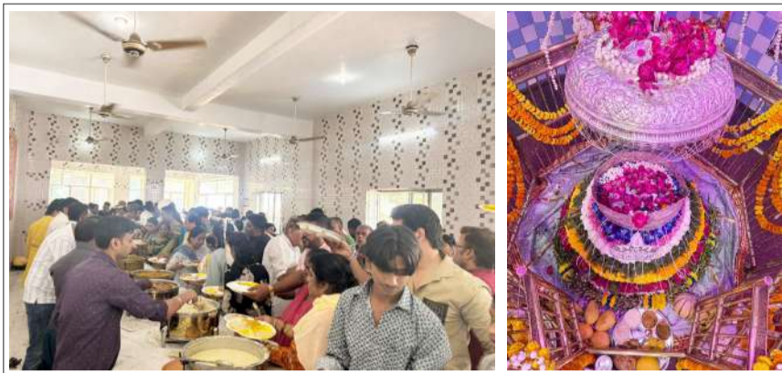
प्रसाद ग्रहण करते भक्त व बाबा को लगाया गया भोग।

कार्यक्रम का शुभारंभ भजन संध्या से हुआ। जिसमें सुप्रसिद्ध भजन गायकों द्वारा प्रस्तुत भजनों ने श्रद्धालुओं को भाव विभोर कर दिया। संपूर्ण परिसर बाबा के जयकारों, भक्ति संगीत एवं आध्यात्मिक वातावरण से गुंजायमान रहा। इसके बाद श्रृंगार दर्शन एवं विशेष आरती का आयोजन हुआ। जिसमें बड़ी संख्या में श्रद्धालुओं ने सहभागिता की दूसरे दिन प्रातःकालीन आरती के बाद प्रसाद वितरण का