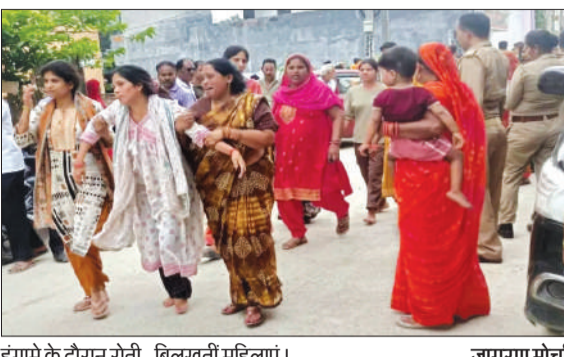
हंगामे के दौरान रोती-बिलखती महिलाएं।

बरेली। बारादरी थाना क्षेत्र के सम्राट अशोक नगर में युवक की मौत के बाद अंतिम संस्कार के दौरान ऐसा बवाल हुआ कि गाली-गलौज से शुरू होकर विवाद देखते ही देखते मारपीट और पथराव में बदल गया। दोनों पक्षों के कई लोग घायल हो गए, जबकि एक युवक के सिर में गंभीर चोट आई है। पुलिस ने दोनों पक्षों की तहरीर पर 17 नामजद समेत कई अज्ञात लोगों के खिलाफ मुकदमा दर्ज कर जांच शुरू कर दी है।