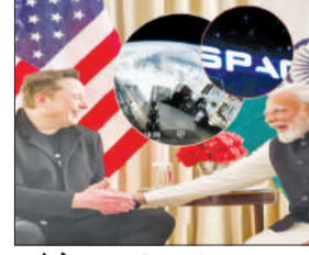
'गैलेक्सआई का मिशन दृष्टि हमारी अंतरिक्ष यात्रा में एक बड़ी उपलब्धि है। दुनिया के पहले ऑप्टोसार उपग्रह एवं भारत में निर्मित सबसे बड़े निजी उपग्रह का सफल प्रक्षेपण नवाचार और राष्ट्र निर्माण के प्रति हमारे युवाओं के जुनून का प्रमाण है।' यह उपग्रह स्पेसएक्स के फाल्कन 9 रॉकेट के जरिए रविवार को कैलिफोर्निया से प्रक्षेपित किया गया।

वाशिंगटन। स्पेसएक्स के संस्थापक एलन मस्क ने बेंगलुरु स्थित अंतरिक्ष स्टार्टअप गैलेक्सआई को 'मिशन दृष्टि' उपग्रह के सफल प्रक्षेपण पर बधाई दी। मस्क ने मंगलवार को सोशल मीडिया मंच 'एक्स' पर 'बधाई' लिखकर यह प्रतिक्रिया दी, जो प्रधानमंत्री नरेन्द्र मोदी के उस पोस्ट के जवाब में थी, जिसमें उन्होंने मिशन दृष्टि के प्रक्षेपण पर गैलेक्सआई को बधाई दी थी। प्रधानमंत्री नरेन्द्र मोदी ने रविवार को 'एक्स' पर एक पोस्ट में इस प्रक्षेपण को भारत की अंतरिक्ष यात्रा में एक बड़ी उपलब्धि बताया और इसे देश के बढ़ते नवाचार तंत्र का प्रतीक कहा था। मोदी ने कहा,