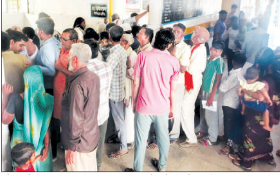
सीएचसी में चिकित्सक से उपचार कराने लगी मरीजों की कतारें।

चन्दौसी। बारिश व हल्की बूँदा-बाँदी होने से मौसम में काफी बदलाव आया है। मौसम में परिवर्तन आने से लोग काफी संख्या में बीमार पड़ रहे हैं। जिससे सीएचसी में रोजाना खांसी, जुखाम, एलर्जी, वायरल फीवर व टाइफाइड के लगभग 650 नए व 350 पुराने मरीज उपचार कराने पहुंच रहे हैं। जिसकी चिकित्सक द्वारा मरीजों की जांच कराने के साथ उपचार कर रहे हैं। चिकित्सक मरीजों से बदलते मौसम में एहतियात बरतने की सलाह दे रहे हैं। कुछ दिन से मौसम में काफी परिवर्तन हुआ है। क्योंकि पिछले दिनों भीषण गर्मी व लू चलने से लोग परेशान थे। तीन दिन पहले ओलावृष्टि के साथ बारिश व उसके बाद बूँदा-बाँदी