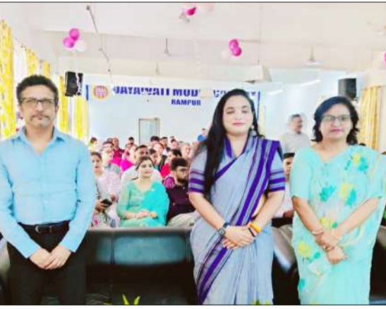
कार्यक्रम के दौरान मौजूद मुख्य अतिथि एवं स्कूल की प्रधानाचार्या।

महत्वपूर्ण सुझाव दिए। उन्होंने विशेष रूप से बच्चों के स्वास्थ्य का ध्यान रखने, उचित दिनचर्या अपनाने तथा मोबाइल फोन से दूरी बनाए रखने की सलाह दी। विद्यालय की प्रधानाचार्या डॉ.