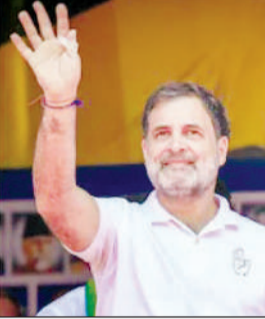
मंत्री पदों की मांग कर सकती है। TVK और तमिलनाडु कांग्रेस के बीच यह गठबंधन, आने वाले वर्षों और दशकों में 'पेरियार' के सामाजिक न्याय के आदर्शों और डॉ. बी.आर. अंबेडकर के संवैधानिक आदर्शों के प्रति मजबूत प्रतिबद्धता के साथ, तमिलनाडु में 'पेरुथलाइवर कामराज' के गौरवशाली दिनों को वापस लाने का प्रयास करेगा। यह गठबंधन न केवल इस सरकार के गठन के लिए है, बल्कि स्थानीय निकायों, लोकसभा और राज्यसभा के भविष्य के चुनावों के लिए भी है।

विजय और राहुल गांधी मिलकर तमिलनाडु की जनता के सपनों को पूरा करेंगे। तमिलनाडु में मौजूद विधानसभा का कार्यकाल 10 मई तक है। ऐसे में सरकार का गठन इससे पहले होना जरूरी है। कांग्रेस के समर्थन देने के ऐलान से टीवीके का संख्याबल 113 तक पहुंच गया है।