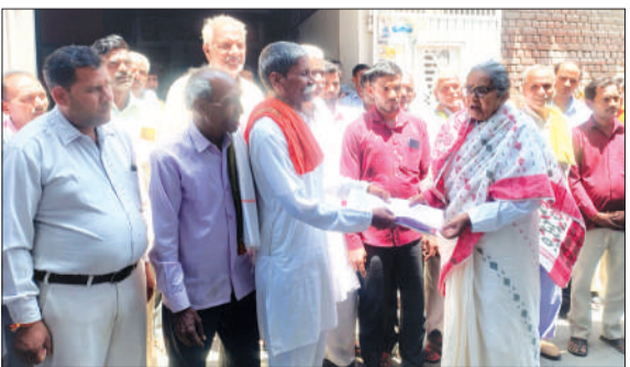
राज्यमंत्री गुलाब देवी को ज्ञापन सौंपते पुरा व जेरोई हयातनगर के ग्रामीण।

चन्दौसी। तहसील क्षेत्र के गांव पुरा व जेरोई हयातनगर के काफी संख्या में किसान राज्यमंत्री गुलाब देवी के आवास पर पहुंचे। यहां किसानों ने राज्यमंत्री को ज्ञापन देकर समस्या के समाधान की मांग की। किसानों ने बताया कि वह गांव पुरा व जेरोई हयातनगर के निवासी हैं, 26 अप्रैल को चोरो ने बिजली घर पुरा की मैनलाइन के 21 पोलो पर बंधे विद्युत तार चोरी कर लिए। जिससे दोनों गांवों के लगभग 50 नलकूप की विद्युत सप्लाई पूरी तरह ठप हो गई है। जिसकी सूचना किसान पहले ही विद्युत विभाग को दे चुकी है। इसके बाद भी समस्या का समाधान नहीं हो सका। किसानों ने राज्यमंत्री से