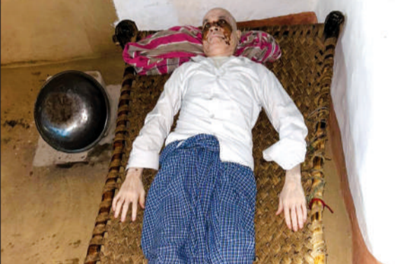
गरीब बेटी का घर व बीमार पिता।

बदायूं। उझानी क्षेत्र के गांव सिरसौली में एक गरीब बेटी की शादी जनसहयोग से भव्य आयोजन का रूप ले चुकी है। पिता के गंभीर बीमारी से जूझने के बीच समाजसेवियों व जनप्रतिनिधियों ने आगे आकर जिम्मेदारी संभाली, जिससे यह विवाह अब मिसाल बनता नजर आ रहा है। विकासखंड उझानी के गांव सिरसौली में एक गरीब बेटी का विवाह समारोह सामाजिक एकजुटता और मानवता की अनूठी मिसाल बन गया है। सात मई को होने वाले इस विवाह को लेकर गांव में उत्सव जैसा माहौल है। पूरे गांव को दुल्हन की तरह सजाया जा रहा है और रात्रि में शहनाई की गूंज के साथ भव्य आयोजन किया जाएगा। इस विवाह समारोह की खास बात यह है कि लड़की के