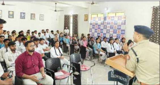
छात्र-छात्राओं को जागरूक करते सीओ स्वार।

कार्यक्रम के दौरान विद्यार्थियों को इंटरनेट एवं सोशल मीडिया के सुरक्षित उपयोग के बारे में जानकारी दी। साइबर अपराधों से बचाव के लिए सावधानियों से अवगत कराया। विद्यार्थियों को बताया कि वर्तमान डिजिटल युग में केवल स्मार्ट फोन रखना ही पर्याप्त नहीं है, बल्कि एक स्मार्ट यूजर बनना अधिक आवश्यक