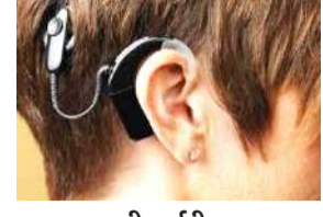
● 6 लाख की सर्जरी व 2 साल का इलाज बिल्कुल फ्री