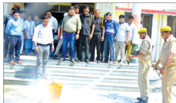
सरकारी अस्पताल में माँकड़िल करते दमकल कर्मी।