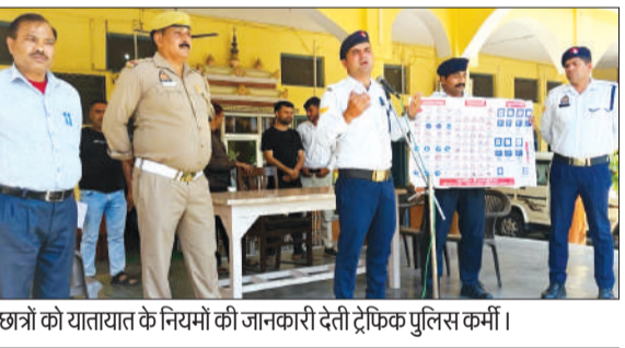
छात्रों को यातायात के नियमों की जानकारी देती ट्रेफिक पुलिस कर्मी।

और जानकारी की। मगर बच्ची कोई जवाब नहीं दे सकी। इसके बाद दुकानदार ने 112 पुलिस को सूचना दी। कुछ देर बाद पुलिस भी मौके पर पहुंच गई और दुकानदार से जानकारी करने लगी। तभी पिता का भी बच्ची को देखता हुआ दुकान पर पहुंच गया। यहां बच्ची देख पिता ने राहत महसूस की। पुलिस ने लिखा-पट्टी के बाद के बच्ची को पिता को सौंप दिया।