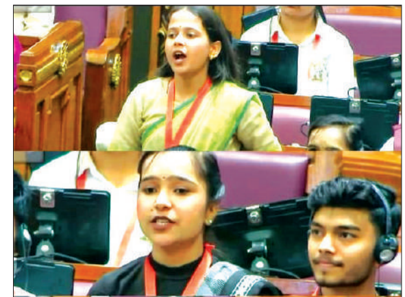
केन्द्रीय बजट 2026 पर विचार रखते प्रतिभागी।

लिए ठोस एवं प्रभावी कदम उठाए जाएं। पीलीभीत हर साल बाढ़ की समस्या से जूझता है, इसके बावजूद जिले को बाढ़ प्रभावित सूची में शामिल न करना प्रशासन की बड़ी लापरवाही है सरकार तत्काल इस पर संज्ञान लेकर पीलीभीत को सूची में शामिल करे, ताकि यहां के लोगों को राहत और सुरक्षा मिल सके।