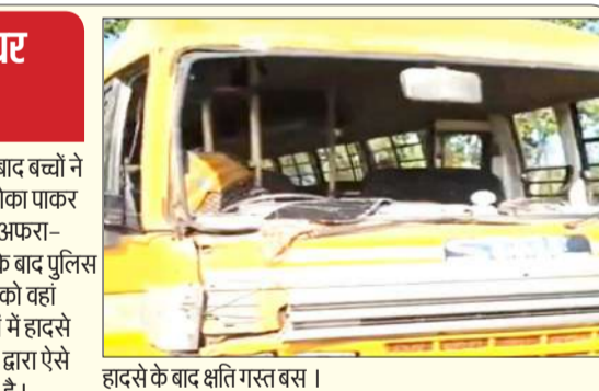
हादसे के बाद क्षतिग्रस्त बस।

अचानक से बस खंभे से टकरा जाने के बाद बच्चों ने चीख पुकार मचा दी। इस बीच चालक मौका पाकर फरार हो गया। काफी देर तक मौके पर अफरा-तफरी का माहौल बना रहा था। सूचना के बाद पुलिस आ गई। उसके बाद किसी तरह से भीड़ को वहां से हटवाया। इससे पहले भी स्कूली बसों में हादसे हो चुके हैं लेकिन उसके बाद एआरटीओ द्वारा ऐसे चालकों पर कोई कार्रवाई नहीं की जाती है। चकनाचूर हो गए। हादसे के बाद बस में सवार बच्चों में चीख-पुकार मच गई। आसपास के लोगों ने तुरंत बस के शीशे तोड़कर बच्चों को बाहर निकाला। गनीमत रही कि कोई बड़ा हादसा नहीं हुआ। दो बच्चों के हाथ-पैर में चोट आई है, जिन्हें प्राथमिक उपचार के बाद घर भेज दिया गया। हादसे का शिकार हुई बस