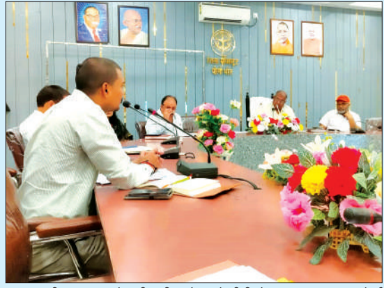
आधार पंजीकरण व अपडेट की समीक्षा बैठक में सीडीओ।