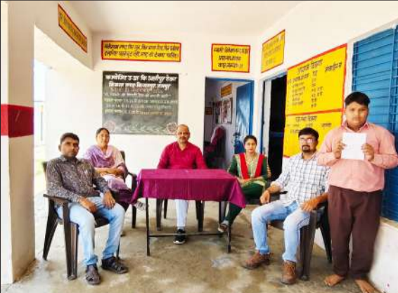
कार्यक्रम में मौजूद शिक्षक।

रामपुर। बच्चों को जनगणना के महत्व, प्रक्रिया एवं इससे जुड़े सामाजिक और राष्ट्रीय लाभों की जानकारी देने के उद्देश्य को लेकर बुधवार को बिलासपुर के कंपोजिट उच्च प्राथमिक विद्यालय अलीपुर ठेका में विद्यार्थियों को जनगणना के प्रति जागरूक करने के लिए कार्यक्रम का आयोजन किया।