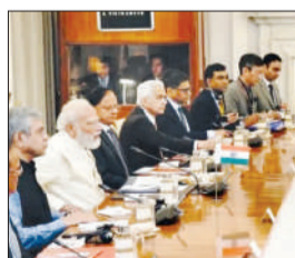
सहयोग बढ़ाने पर सहमति बनी है, विशेष रूप से, दुर्लभ खनिज (रेयर अर्थ एलिमेंट) के क्षेत्र में सहयोग को बढ़ावा देने के लिए एक अहम समझौता ज्ञापन पर हस्ताक्षर किये गये जो इलेक्ट्रॉनिक्स, नवीकरणीय ऊर्जा और रक्षा जैसे क्षेत्रों के लिए महत्वपूर्ण है। डिजिटल क्षेत्र में, सूचना प्रौद्योगिकी और उभरती तकनीकों में सहयोग को मजबूत करने पर भी सहमति बनी है। इसके साथ ही वित्तीय सहयोग को बढ़ाते हुए दोनों

दिल्ली। भारत और वियतनाम ने द्विपक्षीय संबंधों को और प्रगाढ़ बनाने के लिए दुर्लभ खनिज, रक्षा, नवीकरणीय ऊर्जा और सूचना प्रौद्योगिकी सहित 12 महत्वपूर्ण क्षेत्रों में समझौता ज्ञापनों पर हस्ताक्षर करने के साथ-साथ कई अहम घोषणाएं भी की हैं। प्रधानमंत्री नरेन्द्र मोदी और भारत की यात्रा पर आये वियतनाम के राष्ट्रपति तो लम के बीच बुधवार को यहां द्विपक्षीय वार्ता के बाद इन समझौतों पर हस्ताक्षर किये गये। दोनों देशों ने संबंधों को "एन्हांड कॉम्प्रेहेंसिव स्ट्रेटिजिक पार्टनरशिप" तक उन्नत करने का निर्णय लिया जो हिन्दू-प्रशांत क्षेत्र में बढ़ते सहयोग पर रणनीतिक सामंजस्य को बताता है। इन समझौतों के तहत कई क्षेत्रों में