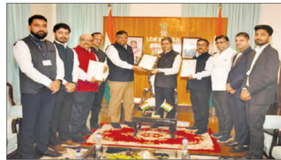
विधानसभा चुनाव में निर्वाचन आयोग की भूमिका समाप्त हो गई है। परिणामों की घोषणा के बाद राजपत्र अधिसूचना सौंपना एक अनिवार्य संवैधानिक प्रक्रिया है, जो राज्यपाल के लिए नई विधानसभा के गठन और सरकार बनाने की प्रक्रिया शुरू करने का मार्ग प्रशस्त करती है। पश्चिम बंगाल की 294 सदस्यीय विधानसभा में भाजपा ने 207 सीट पर जीत हासिल करके तृणमूल कांग्रेस के 15 साल के शासन का अंत कर दिया। तृणमूल कांग्रेस को केवल 80 सीट पर जीत मिली है। हालांकि, ममता बनर्जी ने अभी तक राज्यपाल को मुख्यमंत्री पद से अपना इस्तीफा नहीं सौंपा है।