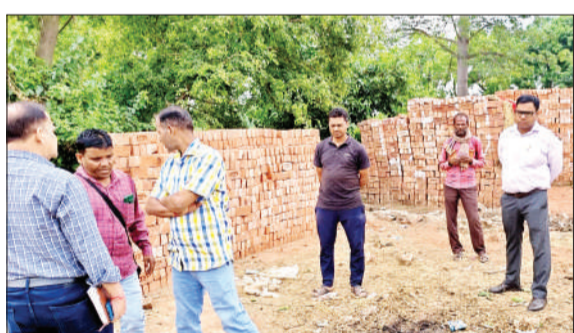
मौके पर पहुंचकर जांच करती टीम।