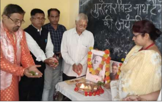
रविन्द्र नाथ टैगोर की जयंती मनाते समिति पदाधिकारी।