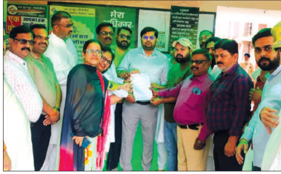
सिलेंडर के बढ़ते दामों और कालाबाजारी के खिलाफ एसडीएम को ज्ञापन देते व्यापारी।