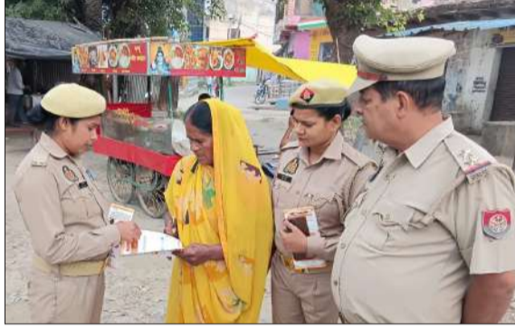
महिला को जागरूक करती एंटी रोमियों की टीम।

चन्दौसी। उत्तर प्रदेश शासन द्वारा महिलाओं एवं बालिकाओं के सुरक्षा व स्वावलंबन के लिए चलाये जा रहे मिशन शक्ति अभियान (फेज-5.0) के तहत पुलिस अधीक्षक कृष्ण कुमार के निर्देशन एवं क्षेत्राधिकारी व सहायक नोडल मिशन शक्ति अभियान दीपक कुमार के नेतृत्व में गुरुवार को जनपद सम्भल की मिशन शक्ति टीम में नियुक्त महिला पुलिसकर्मियों द्वारा थाना क्षेत्रांतर्गत आयोजित कार्यक्रम में बालिकाओं को जागरूक करने के साथ ही महिला संबंधित समस्याओं के निस्तारण कराने के संबंध में चौपाल का आयोजन कर जागरूक किया गया। साथ ही मिशन शक्ति 5.0" (द्वितीय चरण) अभियान के अंतर्गत जनपद की एंटी रोमियों टीम द्वारा