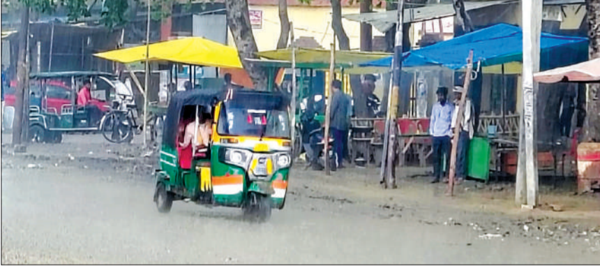
बारिश के चलते तिरपाल के नीचे खड़े लोग।