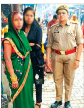
जागरूक करती पुलिसकर्मी।

जिसमें महिला सुरक्षा एवं आत्मरक्षा से जुड़े आवश्यक उपाय, कानूनी अधिकार, नारी सम्मान से संबंधित प्रावधान एवं हेल्पलाइन सेवाओं 1090 महिला शक्ति हेल्पलाइन, 181 महिला हेल्पलाइन, 112 आपातकालीन सेवा, 1098 चाइल्ड हेल्पलाइन की कार्यप्रणाली एवं उपयोगिता तथा घरेलू हिंसा, छेड़छाड़, ऑनलाइन उत्पीड़न तथा