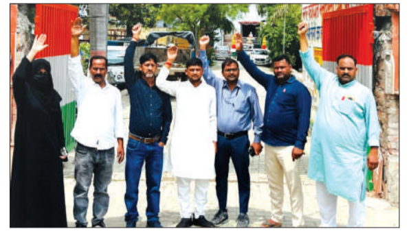
नगर पंचायत मसवासी में बोर्ड की बैठक का बहिष्कार करते सभासद।

मसवासी। नगर पंचायत मसवासी में विकास कार्यों को लेकर चल रहा विवाद थमने का नाम नहीं ले रहा है। गुरुवार को आयोजित नगर पंचायत बोर्ड बैठक एक बार फिर कोरम के अभाव में स्थगित करनी पड़ी। बैठक का बहिष्कार करते हुए सभासदों ने नगर पंचायत अध्यक्ष पर मनमानी, हठधर्मी और विकास कार्यों की अनदेखी का आरोप लगाया है। नाराज सभासदों ने मुख्यमंत्री को शिकायती पत्र भेजकर मामले की जांच और कार्रवाई की मांग की है।