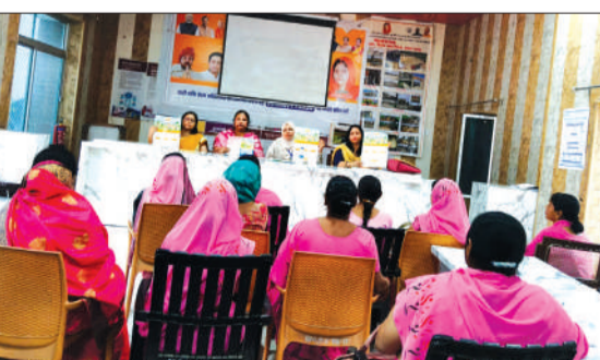
ट्रेनिंग में मौजूद आंगनबाड़ी कार्यकर्त्री।

सीडीपीओ यासमीन बेगम ने बताया कि ट्रेनिंग के बाद पहला आंगनबाड़ी मेला 11 से 16 मई के बीच और दूसरा मेला 22 से 27 जून के बीच आयोजित किया जाएगा। इन मेलों में आंगनबाड़ी केंद्रों पर पंजीकृत 3 से 6 साल के सभी बच्चे भाग लेंगे। मेलों में बच्चों की प्रगति जांची जाएगी और विभिन्न गतिविधियां कराई जाएंगी। प्रथम संस्था की प्रशिक्षक समीना