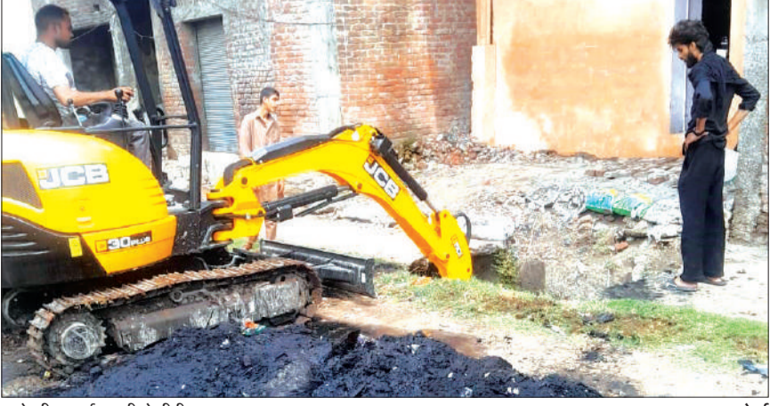
नालों की सफाई करती जैसीवी।

रामपुर। नगर पालिका परिषद ने शहर के नालों की सफाई कार्य शुरू करा दिया है। गुरुवार को हाथीखाना स्थित नालों की सफाई कराई जा रही है। इस कार्य को कराए जाने के लिए पालिका प्रशासन 60 लाख रुपये खर्च कर रहा है। बरसात से पहले शहर में बने नालों की सफाई कराए जाने के लिए पालिका प्रशासन सक्रिय हो गया है। जिससे कि जलभराव और गंदगी की समस्या को खत्म किया जा सके। साथ ही मच्छरों के प्रजनन को रोकने के लिए दवाइयों का छिड़काव भी कराया जाएगा। जिन क्षेत्रों में जल निकासी की समस्या से अधिक है वहाँ विशेष ध्यान