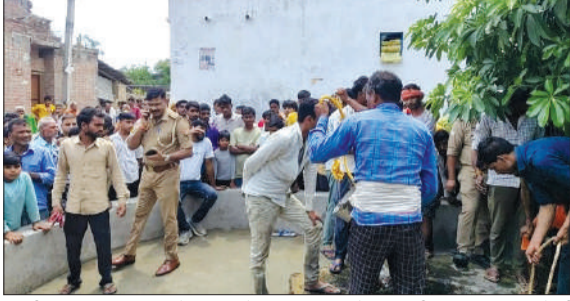
रस्सी डालकर बालिका को निकालने का प्रयास करते कर्मचारी।