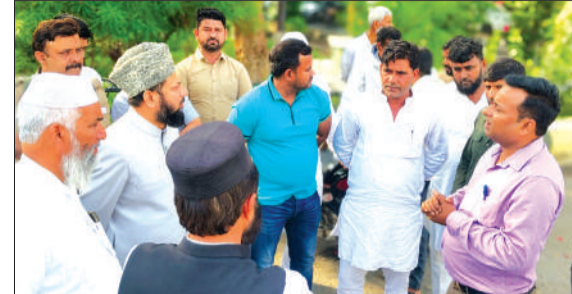
मृतक के परिजनों से मिलते सांसद।