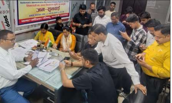
स्व-गणना कार्यक्रम में मौजूद नगर पालिका की टीम।