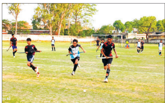
महात्मा गांधी स्टेडियम में आयोजित टूर्नामेंट में प्रतिभाग करते खिलाड़ी।

पहला मैच जिसके सनवे बालिका स्कूल और रामपुर हॉकी संघ के बीच खेला गया। मुख्य अतिथि ने सभी हॉकी खिलाड़ी से परिचय प्राप्त कर उनको अच्छे खेल के लिए बधाई दी। टूर्नामेंट में दो मैच खेले गए पहला