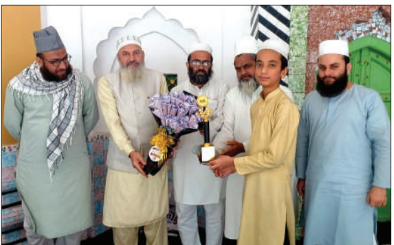
मदरसा जामे उल उलूम फुरकानिया में छात्र को इनाम देते।