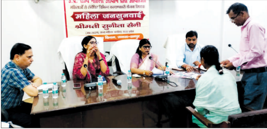
विकास भवन के सभागार में शिकायतें सुनीं राज्य महिला आयोग की सदस्य।

महिला जनसुनवाई के दौरान कुल 8 शिकायतें प्रार्थना पत्र प्राप्त हुए। जिनमें घरेलू विवाद, पारिवारिक उत्पीड़न तथा अन्य महिला संबंधित समस्याओं से जुड़े प्रकरण शामिल रहे। राज्य