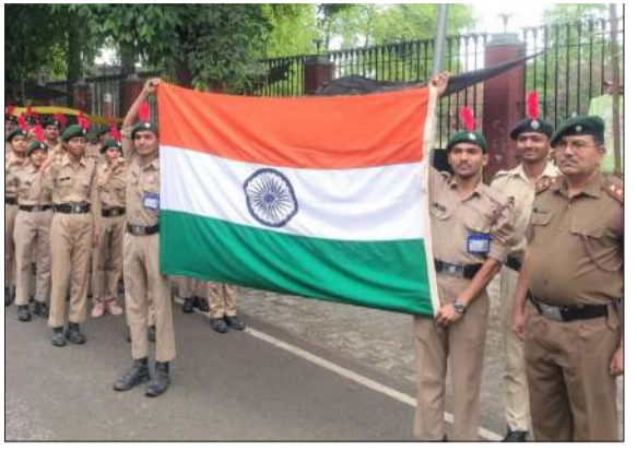
ऑपरेशन सिंदूर की वर्षगांठ पर रैली निकालते एनसीसी कैडेट्स।

चन्दौसी। आपरेशन सिंदूर की पहली वर्षगांठ के अवसर पर 24 यूपी बटालियन एनसीसी मुरादाबाद की ओर से एसएम इंटर कालेज व एसएम कालेज के एनसीसी कैडेट्स द्वारा फ्लैग होस्टिंग रैली का आयोजन किया गया। रैली का आरंभ एसएम इंटर कालेज से हुआ। बताया कि आपरेशन सिंदूर 6-7 मई 2005 की रात भारतीय सशस्त्र बलों द्वारा पाकिस्तान स्थित आतंकी ठिकानों के खिलाफ चलाया गया एक सफल, सटीक और तेज सर्जिकल स्ट्राइक था। आपरेशन सिंदूर का उद्देश्य पहलगाम हमले में 26 भारतीय पर्यटकों की मौत का बदला लेना और सीमा पार आतंकी बुनियादी ढांचे को नष्ट करना था। आपरेशन सिंदूर की प्रथम वर्षगांठ