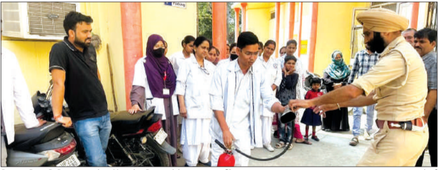
जिला महिला चिकित्सालय में स्टाफ को प्रशिक्षण देते दमकल कर्मी।