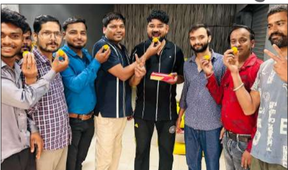
स्मार्ट प्रीपेड मीटरों को पोस्टपेड करने पर मिटाई खिलाकर खुशी मनाते व्यापारी।

चन्दौसी। अखिल भारतीय उद्योग व्यापार मंडल युवा इकाई ने उत्तर प्रदेश सरकार के स्मार्ट प्रीपेड मीटरों को पोस्टपेड व्यवस्था में बदलने के आदेश का जोरदार स्वागत किया है। व्यापारियों ने इसे आम उपभोक्ता और व्यापारी वर्ग की बड़ी जीत बताते हुए एक एक दूसरे को मिटाई खिला का खुशी जाहिर किया।