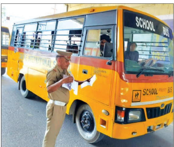
बसों के कागजों को चेक करते ट्रैफिक पुलिसकर्मी।

रामपुर। स्कूली बसों में बच्चों की सुरक्षा को लेकर संभागीय परिवहन प्रशासन गंभीर है। अधिकारियों के निर्देश के बाद प्रतिदिन चेंकिंग अभियान चलाया जा रहा है। इसके साथ ही संभागीय परिवहन विभाग की तरफ से बसों का डाटा ऑनलाइन किया जा रहा है। मगर फिर भी बस संचालक बच्चों की सुरक्षा के खिलवाड़ करते नजर आ रहे हैं। बिना परमिट के दौड़ रहे 17 विद्यालयों के संचालकों को नोटिस जारी किए गए हैं। नोटिस में चेतावनी दी है कि 8 मई के बाद भी बिना परमिट वाहन संचालित पाए जाते हैं तो ऐसे वाहनों को