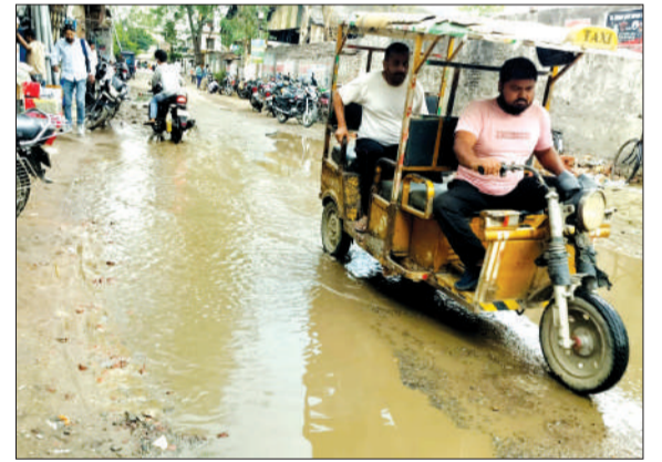
बारिश होने के कारण जलभराव से होकर गुजरते लोग।

रामपुर। गुरुवार की रात करीब 12:30 बजे तेज आंधी और बादलों की गड़गड़ाहट के बीच बारिश शुरू हो गई। बारिश होने से गर्मी लोगों को राहत मिली। सुबह से ही रूक-रूक कर हल्की बूँदाबांदी पूरे शहर में जारी रही।