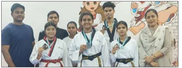
राज्यस्तरीय ताड़क्वांडो प्रतियोगिता के विजेता प्रतिभागी।