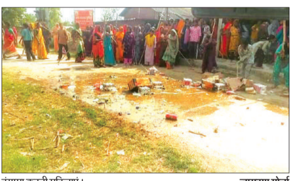
हंगामा करती महिलाएं।

कलीनगर तहसील क्षेत्र के गांव बूंदीभूड़ में आबादी और स्कूल के पास शराब की दुकान खोलने जाने का ग्रामीण और महिलाएं बीते 22 दिनों से शराब की भट्टी हटाने जाने को लेकर धरना प्रदर्शन कर रही हैं। उसके बावजूद शराब की भट्टी नहीं हटाई जा रही है। इसको लेकर