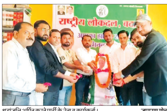
श्रद्धांजलि अर्पित करते पार्टी के नेता व कार्यकर्ता।