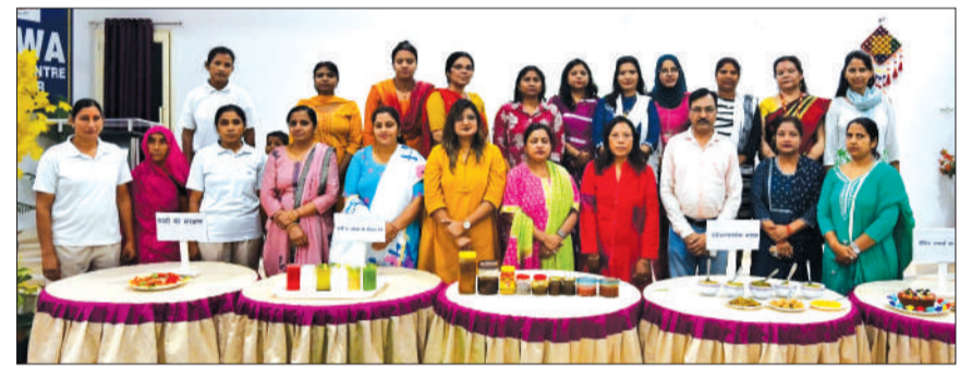
सीआरपीएफ में ग्रीष्मकालीन पोषण और कौशल-अप कार्यशाला के दौरान ग्रीष्मकालीन भोजन का प्रदर्शन करती महिलाएं।