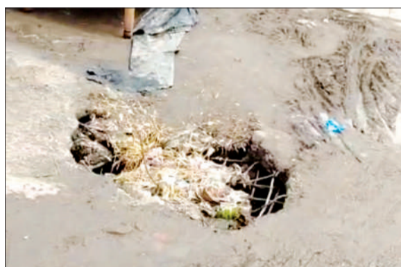
सहसवान में क्षतिग्रस्त नाले से बना हुआ है खतरा।