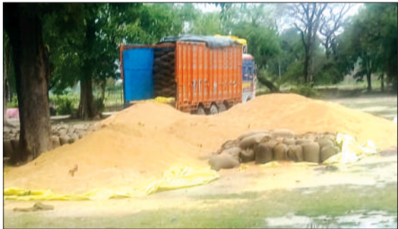
गेहूं लदे गोदाम के बाहर खड़े ट्रैक्टर-ट्राली।