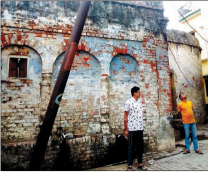
मोहल्ला घेर आजम खां में गिरा हुआ बिजली का पोल।

रामपुर। बिजली निगम के अधिकारियों की अनदेखी के चलते शहर के अधिकतर क्षेत्रों में जर्जर बिजली पोल लगे हुए हैं। जोकि लोगों के खतरनाक साबित हो रहे हैं। लेकिन जिम्मेदार इनको हटाने के नाम पर सिर्फ खानापूरी कर रहे हैं। इसका खामियाजा लोगों को भुगतना पड़ रहा है।