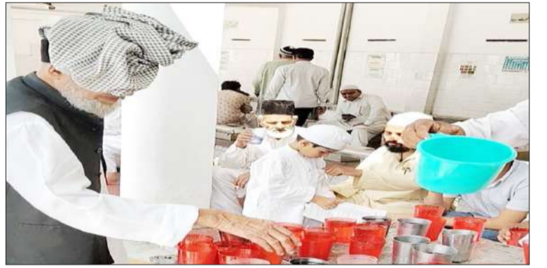
जामा मस्जिद में शरबत लेते नामाजी।