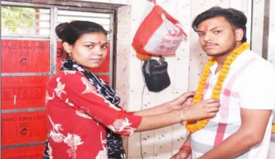
प्रेमी के गले में माला डालती प्रेमिका।