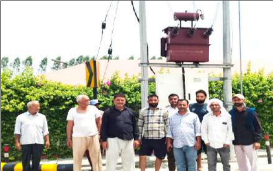
खराब ट्रांसफॉर्मर को लेकर नाराजगी जताते ग्रामीण।

ग्रामीणों का कहना है कि 100 केवीए का ट्रांसफॉर्मर कई बार शिकायत करने के बावजूद भी दुरुस्त नहीं कराया गया। इससे क्षेत्र की बिजली व्यवस्था प्रभावित हो रही है और लोगों को परेशानी का सामना करना पड़ रहा है। स्थानीय लोगों में विद्युत विभाग के प्रति नाराजगी देखी जा रही है। ग्रामीणों ने विभाग से