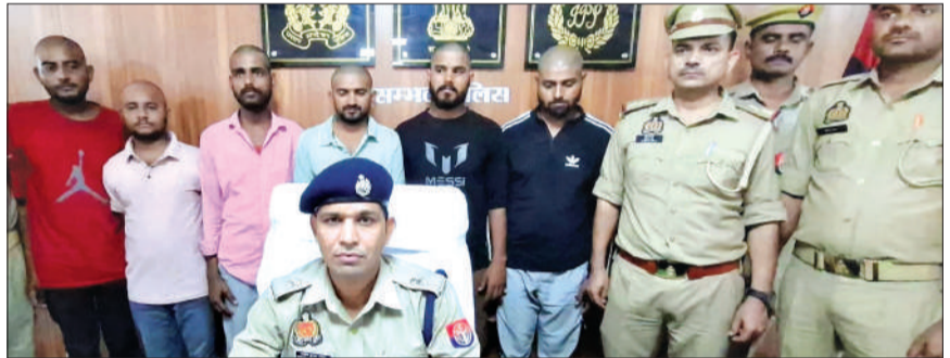
रंगदारी मांगने वाले आरोपियों का खुलासा करते एसपी।