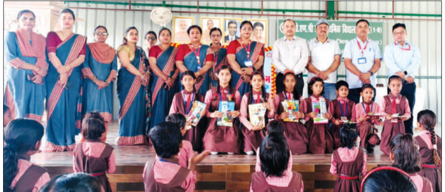
पीएम गुरु वंदन-छात्र अभिनंदन कार्यक्रम में छात्राओं को सम्मानित करते अतिथि।

चन्दौसी। पीएम श्री उच्च प्राथमिक विद्यालय आटा में गुरुवार को गुरु वंदन, छात्र अभिनंदन कार्यक्रम बड़े ही उत्साह, गरिमा एवं प्रेरणादायी वातावरण में आयोजित किया गया। कार्यक्रम का उद्देश्य शिक्षकों के उत्कृष्ट योगदान का सम्मान करना तथा विद्यार्थियों को प्रोत्साहित करना रहा।