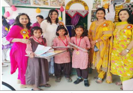
पुरस्कार के साथ मौजूद बच्चे और पदाधिकारी।