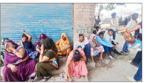
शाहबाद में विवाहिता की मौत के बाद थाने के बाहर बैठे गमजदा परिजन।