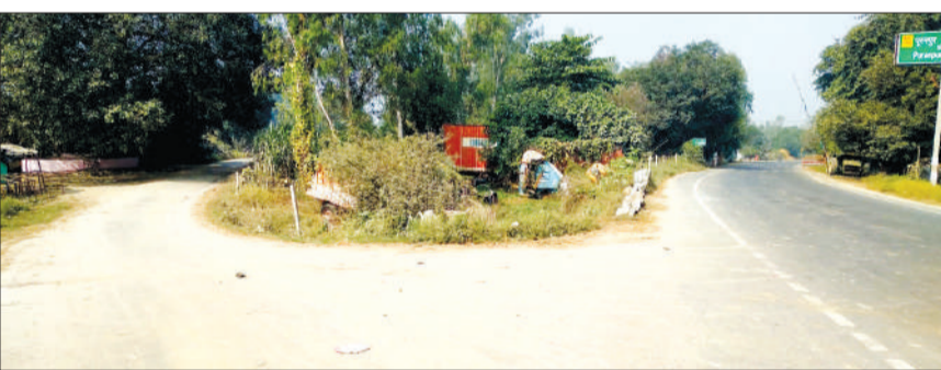
पूरनपुर-बंडा हाईवे पर वनी तीव्र मोड़ें।

पूरनपुर। पूरनपुर से घुंघचाई वाया बंडा हाईवे पर निर्माण के दौरान मोड़ बनाई गई थी। हालांकि उस समय लोगों ने तीव्र मोड़ों पर स्पीड ब्रेकर व संकेतिक बोर्ड को लगाने की मांग की थी। लेकिन संस्था की ओर से ध्यान नहीं दिया गया। जिसके चलते यह मोड़ लगातार हादसे का कारण बनती जा रही है।