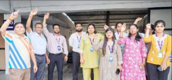
मांगों को लेकर प्रदर्शन करते कर्मचारी।

रामपुर। ऑल इंडिया एसबीआई स्टॉफ फेडरेशन से जुड़े स्टेट बैंक कर्मचारी संघर्ष की राह पर पिछले लम्बे समय से स्टेट बैंक प्रबंधन की ओर से कर्मचारी, अधीनस्थ वर्ग के हितों की लगातार अनदेखी की जा रही है। फेडरेशन स्तर पर लगातार हो रही वार्ताओं के बावजूद सभी मांगों या तो जान बूझ कर लंबित रखी जा रही हैं या कुछ मामलों में प्रबंधन ने लागू करने का आश्वासन देने के बावजूद अभी तक लागू नहीं किया। कुछ मामलों में द्विपक्षीय वार्ता नियमों का पालन न करते हुए प्रबंधन ने अधिकारी संवर्ग को ओआतिरिक्त मौद्रिक लाभ दिए।