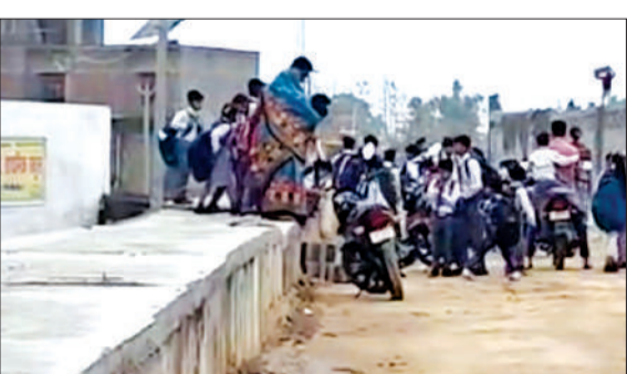
ऊंचे नाले से गुजरते बच्चे।

पीलीभीत। नेशनल हाईवे का निर्माण कर रही निर्माणाधीन कंपनी आरसीएल की कार्यशैली को लेकर क्षेत्रीय ग्रामीणों, किसानों और स्कूल प्रबंधन में भारी आक्रोश व्याप्त है। आरोप है कि कंपनी ने अपनी मनमानी करते हुए निर्माणाधीन हाईवे के दोनों ओर अत्यधिक ऊंचे नालों का निर्माण कर दिया है, जिससे सड़क किनारे बसे किसानों के खेत, मकान, प्रतिष्ठान और विद्यालय कई फीट नीचे चले गए हैं।