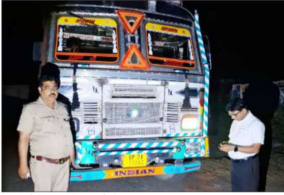
वाहनों की चेकिंग करते एआरटीओ।