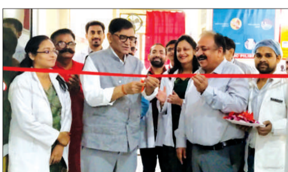
रक्तदान शिविर का फीता काटते जिला अधिकारी।

पीलीभीत। विश्व थैलेसीमिया दिवस एवं रेड क्रॉस दिवस के अवसर पर स्वशासी राज्य चिकित्सा महाविद्यालय के ब्लड सेंटर में विशेष स्वैच्छिक रक्तदान शिविर का आयोजन किया गया। इंडियन रेड क्रॉस सोसाइटी के सहयोग से आयोजित शिविर का शुभारंभ जिलाधिकारी ने किया। कार्यक्रम का उद्देश्य थैलेसीमिया जैसी गंभीर आनुवंशिक बीमारी के प्रति जागरूकता फैलाना और स्वैच्छिक रक्तदान को बढ़ावा देना रहा।