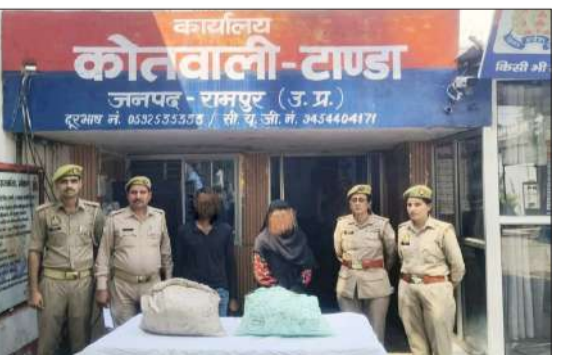
पुलिस की गिरफ्त में दो महिला तस्कर।

जागरण मोर्चा कार्यालय टांडा। टांडा पुलिस ने मादक पदार्थों के खिलाफ चलाए जा रहे अभियान के तहत बड़ी कार्रवाई करते हुए महिला समेत दो लोगों को 11 किलो गांजा के साथ गिरफ्तार किया है। पुलिस ने दोनों आरोपियों के खिलाफ