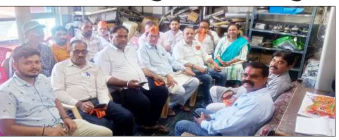
बैठक में मौजूद पदाधिकारी।