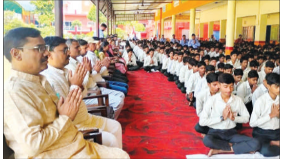
जगदीश शरण सराफ सरस्वती शिशु मंदिर इंटर कालेज में प्रार्थना करते छात्र।

चन्दौसी। नगर के हनुमानगढ़ी स्थित जगदीश शरण सराफ सरस्वती शिशु मंदिर इंटर कालेज में शुकुवार को सम्मान समारोह कार्यक्रम का आयोजित किया गया। जिसमें मेधावी छात्र छात्राओं को सम्मानित किया गया।