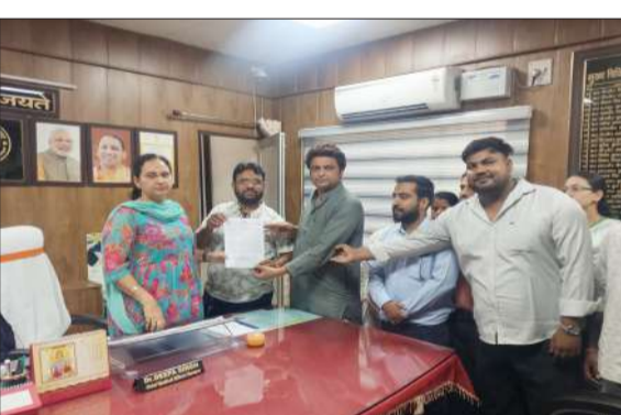
मुख्य चिकित्सा अधिकारी को ज्ञापन सौंपते कर्मचारी। -जागरण मोर्चा

कर्मचारी को नहीं मिला है। जिससे कर्मचारियों के सामने आर्थिक पारिवारिक की समस्या का संकट सामने हो गया है। जिला अध्यक्ष