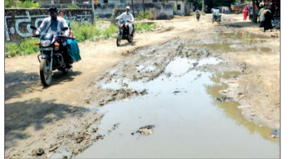
पावर हाउस कॉलोनी की जर्जर सड़क से गुजरते बाइक सवार।

चन्दौसी। नगर के पावर हाउस कालोनी में तहसील की ओर जा रही सड़क आधी अधूरी बना कर छोड़ दी है। अधुनी सड़क में गहरे गड्ढे होने से लोगों को आवागमन में परेशानियों का सामना करना पड़ रहा है। तहसील मुख्यालय की ओर जाने का ये आम रास्ता है।