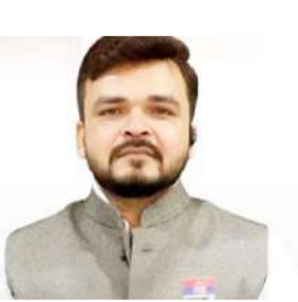
जागरण मोर्चा कार्यालय

रामपुर। प्रदेश में जन शिकायतों के त्वरित और गुणवत्तापूर्ण निस्तारण के मामले में जिले ने अपना डंका बजाते हुए लगातार चौथी बार प्रदेश में पहला स्थान हासिल किया है। शासन की ओर से जारी अप्रैल 2026 की मासिक रैंकिंग में रामपुर ने 140 में से 138 का शानदार स्कोर प्राप्त कर एक नया कीर्तिमान स्थापित किया