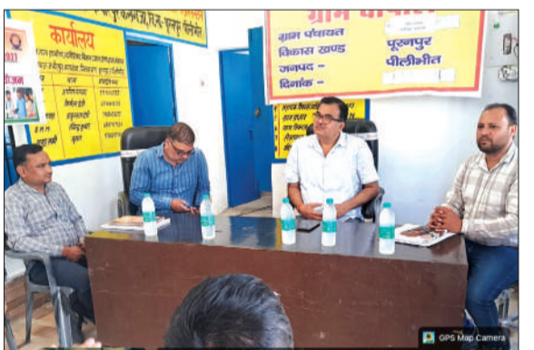
चौपाल में लोगों की समस्याओं को सुनती अधिकारी।

कार्यक्रम में आवास, राशन, पेंशन आदि की लोगों को जानकारी दी गई। ग्रामीणों को सरकार की योजनाओं की जानकारी देकर अधिक से अधिक लाभ लेने के लिए प्रेरित किया गया। इस दौरान कई ग्रामीणों ने अपनी अपनी समस्याओं को अधिकारियों के सामने रखा, इस पर लोगों को समस्याओं के निस्तारण कराने का आश्वासन दिया गया, अधिकारियों ने ग्रामीणों की शिकायतें गंभीरता से सुनते