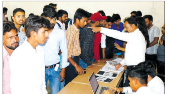
रोजगार मेले में पंजीकरण कराते युवक।

चन्दौसी। उत्तर प्रदेश सेवायोजन निदेशालय लखनऊ के द्वारा उत्तर प्रदेश रोजगार मिशन के तहत युवाओं को रोजगार से जोड़कर आत्मनिर्भर भारत अभियान को सफल बनाए जाने के लिए जिला सेवायोजन कार्यालय के तत्वावधान में गुरुवार को नगर के बदार्थू रोड स्थित राजकीय आईटीआई में एक दिवसीय रोजगार मेले का आयोजन किया गया।