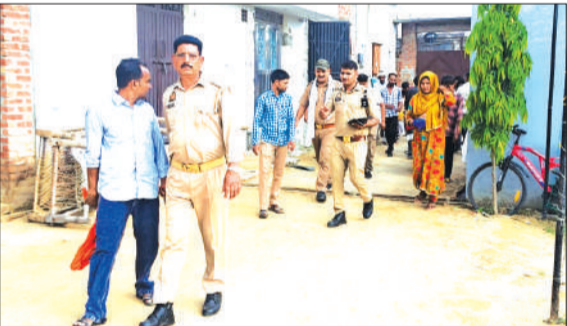
मौहल्ले में हंगामा होते हुए पुलिस मौके पर।

हसनपुर। नगर स्थित एक मंदिर के प्रांगण में शादी समारोह में उस समय हंगामा हो गया जब शादी कर रहे युवक की पत्नी मौके पर पहुंची और जमकर हंगामा करने लगी। हंगामे की सूचना पर डायल 112 व कोतवाली पुलिस मौके पर पहुंची और प्रेमी एवं प्रेमिका को कोतवाली ले आई।