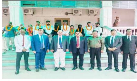
राष्ट्रीय लोक अदालत में सुलह से फिर बसे 5 परिवारों के साथ मौजूद न्यायिक अधिकारी।