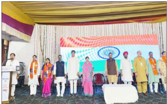
कार्यक्रम के दौरान मौजूद भाजपाई।

रामपुर। भारतीय जनता पार्टी द्वारा आयोजित पंडित दीनदयाल उपाध्याय प्रशिक्षण महाअभियान का द्वितीय दिवस का समापन अत्यंत उत्साह, अनुशासन, वैचारिक ऊर्जा एवं संगठनात्मक समर्पण के साथ संपन्न हुआ। पूरे प्रशिक्षण अभियान के दौरान कार्यकर्ताओं एवं पदाधिकारियों में अद्भुत जोश एवं उत्साह देखने को मिला। प्रत्येक सत्र में कार्यकर्ताओं ने गंभीरता, अनुशासन एवं संगठन के प्रति अपनी निष्ठा का परिचय दिया। प्रशिक्षण स्थल पर सुबह से लेकर समापन तक भारतीय जनता पार्टी की संगठनात्मक संस्कृति, कार्य पद्धति एवं राष्ट्रवादी विचारधारा की झलक स्पष्ट रूप से दिखाई दी। द्वितीय दिवस की शुरुआत प्रातः काल रात्रि विश्राम में रूके पदाधिकारियों एवं कार्यकर्ताओं द्वारा शाखा एवं योग कार्यक्रम के साथ हुई। शाखा में राष्ट्रभक्ति, अनुशासन एवं