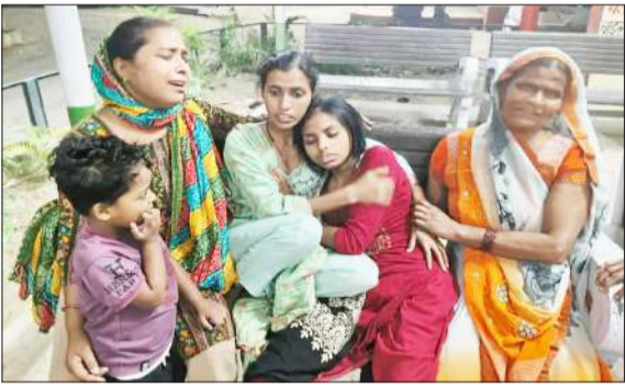
युवक की मौत के बाद रोते परिजन।

मौत के बाद परिजनों में मचा कोहराम, शव को पोस्टमार्टम के लिए भेजा जिला अस्पताल