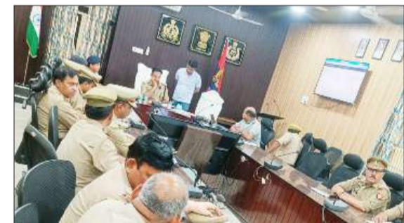
पुलिस लाइन में आयोजित बैठक में शामिल एएसपी व पुलिसकर्मी।

रामपुर। शनिवार को पुलिस लाइन में बैठक का आयोजन किया गया। जिसमें अपर पुलिस अधीक्षक अनुराग सिंह रिजव पुलिस लाइन स्थित सभागार कक्ष