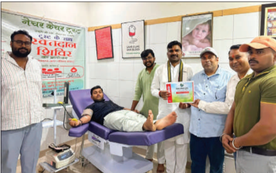
शिविर में रक्तदान करते युवा।

पीलीभीत। शहर के गांधी स्टेडियम रोड स्थित जीवन रेखा हॉस्पिटल में शनिवार को नेचर केयर ट्रस्ट के तत्वावधान में विशाल स्वेच्छिक रक्तदान शिविर का आयोजन किया गया। “रक्तदान महादान” और “रक्तदान जीवन दान” के संकल्प के साथ आयोजित इस शिविर में दर्जनों लोगों ने रक्तदान कर जरूरतमंदों की जिंदगी बचाने में योगदान दिया।