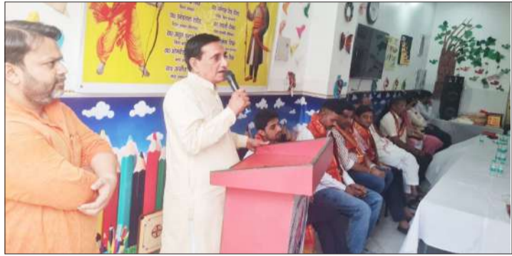
कार्यक्रम को संबोधित करते जिलाध्यक्ष।