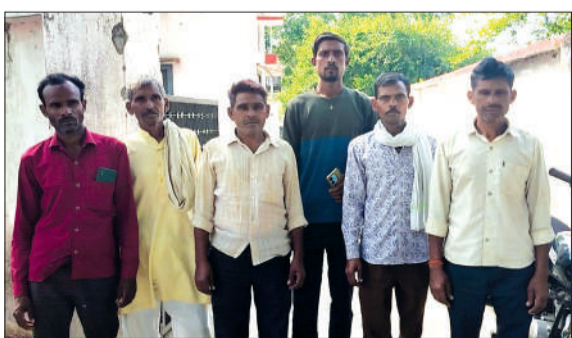
खडे मृतक के परिजन।