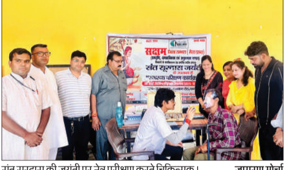
संत सूरदास की जयंती पर नेत्र परीक्षण करते चिकित्सक।