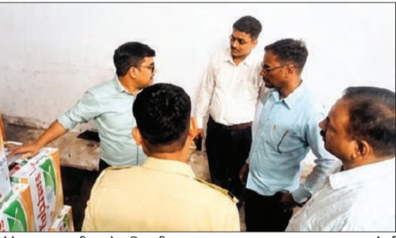
मौके पर जानकारी करते अधिकारी।

बरेली। फॉर्च्यून ब्रांड की हबू नकल कर बाजार में तेल बेचने के आरोप में नरियावल स्थित एक गोदाम पर शुक्रवार रात प्रशासन, पुलिस और फूड सेफ्टी विभाग की संयुक्त टीम ने ताबड़तोड़ छापेमारी की। कार्रवाई के दौरान 2052 लीटर संदिग्ध खाद्य तेल बरामद कर सीज कर दिया। मौके से फॉर्च्यून ब्रांड से मिलते-जुलते पैकिंग वाले 171 टिन बरामद हुए, जिन पर अलग-अलग नामों से मार्का लगाकर सफाई की जा रही थी। दूर से देखने पर फॉर्च्यून जैसा तेल दिख रहा था। अडानी समूह की लीगल सेल ने शिकायत दी थी। नरियावल क्षेत्र में फॉर्च्यून ब्रांड से मिलती जुलती पैकिंग में रिफाईंड तेल तैयार कर बाजार में उतारा जा रहा है। शिकायत में कहा गया कि पैकिंग और