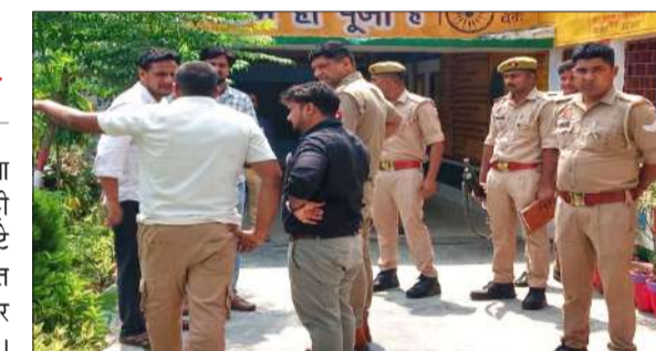
स्कूल में लोगों से जानकारी लेते पुलिस अधिकारी।

रामपुर। विकास खंड चमरौआ स्थित प्राथमिक विद्यालय पट्टी कल्याणपुर में एवं विद्यालय से सटे पंचायत भवन में वीती रात्रि अज्ञात चोरों द्वारा खिड़की के सरिए काटकर चोरी की घटना को अंजाम दिया गया। सूचना मिलने के बाद पुलिस मौके पर पहुंची। जानकारी लेने के बाद चली आई। चोर विद्यालय से एलईडी टीवी, गैस सिलेंडर एवं विद्यालय में उपयोग होने वाले बर्तन चोरी कर ले गए पंचायत भवन से इन्वर्टर, 2 बैटरियां एवं डीवीआर रिकॉर्डर चोरी कर लिया गया। सीसीटीवी कैमरे भी तोड़ दिए। चोरों ने विद्यालय में नुकसान भी किया। घटना की