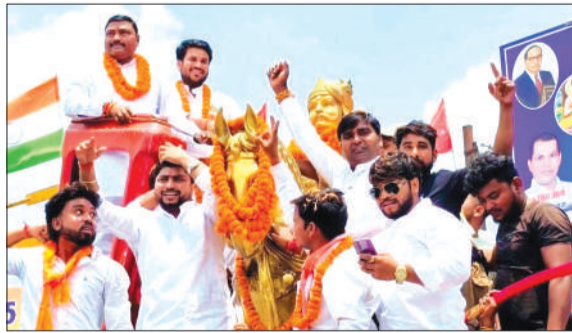
महाराणा प्रताप की प्रतिमा पर माल्यार्पण करते हुए।