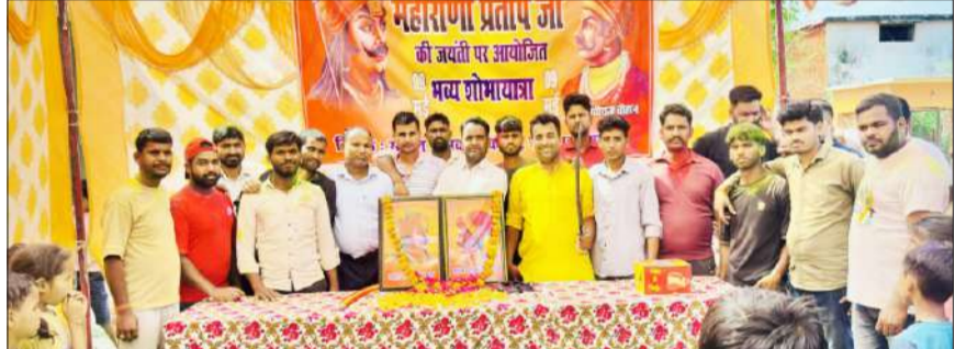
शाहबाद क्षेत्र में महाराणा प्रताप की जयंती मनाते ग्रामीण।