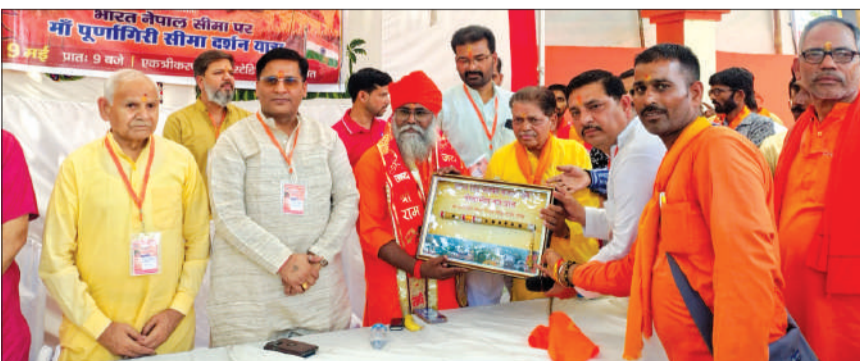
पूर्णागिरि सीमा यात्रा का शुभारंभ करते विहिप व बजरंग दल के लोग।