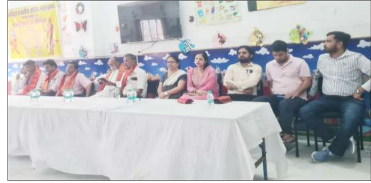
कार्यक्रम में मौजूद पदाधिकारी।