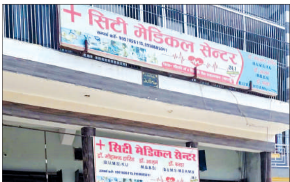
अवैध रूप से संचालित अस्पताल।

बदायूं जिले में अवैध अस्पतालों की बाढ़ है। गली मोहल्लों में यह अस्पताल संचालित हो रहे हैं। आज के दौर में इसका सबसे बड़ा हथ सहस्रान कम्पा बनाव हुआ है। यहाँ गली-कूचों में बिना किसी पंजीकरण और बिना डिग्री धारक डॉक्टरों के जच्चा-बच्चा केंद्र कुकुरमुत्तों की तरह संचालित हो रहे हैं, जो सीधे तौर पर मासूम नवजातों और प्रसूताओं की जिंदगी के साथ खिलवाड़ कर रहे हैं।