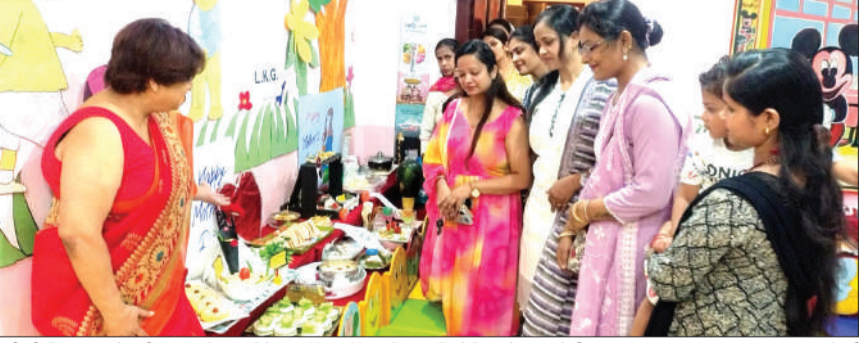
एबीसी किड्स मांटेसरी स्कूल में मदर्स डे पर नॉन स्टॉप कुकिंग प्रतियोगिता में भाग लेती माताएं।

चन्दौसी। एबीसी किड्स मांटेसरी स्कूल में शनिवार को मदर्स डे के उपलक्ष्य में बच्चों की माताओं के लिए यमी यमी नान स्टोव कुकिंग प्रतियोगिता का भव्य आयोजन किया गया। कार्यक्रम का उद्देश्य माताओं की प्रतिभा, रचनात्मकता एवं उनके स्नेहपूर्ण योगदान को सम्मान देना था। विद्यालय परिसर में आयोजित इस प्रतियोगिता में सभी माताओं ने अत्यंत उत्साह, उमंग और खुशी के साथ भाग लिया तथा बिना गैस या आग का उपयोग किए। प्रतियोगिता में माताओं द्वारा विभिन्न प्रकार के स्वादिष्ट एवं आकर्षक व्यंजन बर्गर, चना जेठ गारम, सैंडविच, भेलपुरी, आलू चाट, रूसी सलाद, अंकुरित चाट, अंकुरित सलाद, फ्रूट क्रोम, मटर चाट, ड्राई फ्रूट लड्डू, चना चाट,