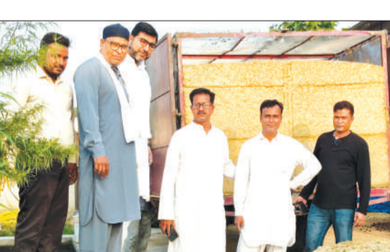
गौशाला में भूसे के साथ खड़े पदाधिकारी।

बहेड़ी। बरेली जिला खाद्य विपणन अधिकारी के आह्वान पर राइस मिल एसोसिएशन बहेड़ी ने कान्हा गौशालाओं में भूसे की व्यवस्था कराने के लिए सहयोग अभियान शुरू किया है। इसी क्रम में संगठन की ओर से 10 ट्राली भूसा उपलब्ध कराने का निर्णय लिया गया है। शनिवार को नई मकरू स्थित गौशाला में संगठन द्वारा दो ट्राली भूसा दान किया गया। दान किए गए भूसे की मात्रा करीब 25 कुंतल बताई गई है, जिसकी अनुमानित कीमत लगभग 10 हजार रुपये है। गौशाला प्रबंधन ने संगठन के