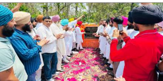
सड़कों का शिलान्यास करते राज्यमंत्री।