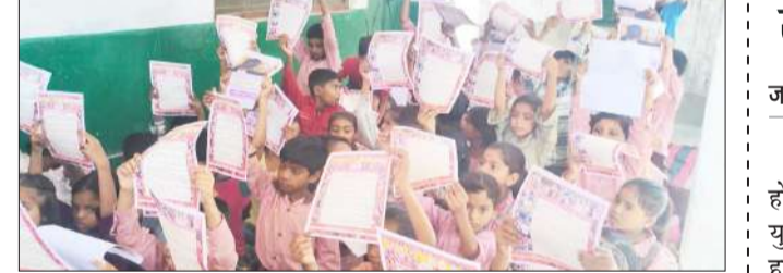
कार्यक्रम में मौजूद छात्र-छात्राएं।