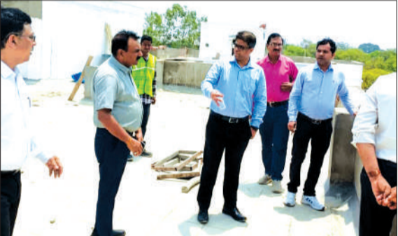
निरीक्षण करते अधिकारी। -जागरण मोर्चा

बरेली। परिवहन विभाग की कार्यशैली को तेज और सख्त बनाने के लिए शुक्रवार को उत्तर प्रदेश के परिवहन आयुक्त ने बरेली में ताबड़तोड़ निरीक्षण और समीक्षा बैठक की। परसाखेड़ा में बन रहे सारथी हॉल और कार्यालय भवन का जायजा लेने पहुंचे आयुक्त ने साफ शब्दों में कहा कि निर्माण कार्य किसी भी हालत में 31 मई 2026 तक पूरा होना चाहिए। निर्माण एजेंसी को गुणवत्ता से समझौता न करने की चेतावनी भी दी गई। परिवहन आयुक्त ने सबसे पहले परसाखेड़ा स्थित निर्माणाधीन सारथी हॉल और कार्यालय भवन का स्थलीय निरीक्षण किया। निरीक्षण के दौरान कार्यदायी संस्था के प्रबंधक ने बताया कि करीब 90