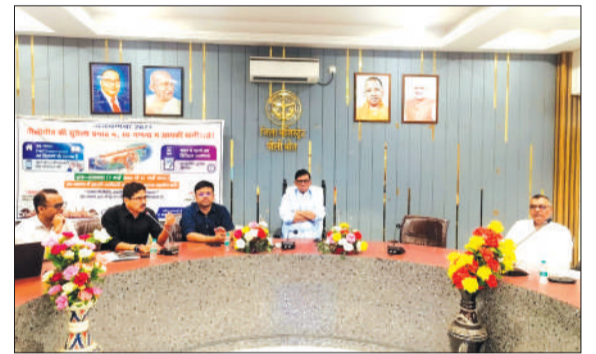
डीएम की मौजूदगी में व्यापारी व सूचना विभाग में फरकार स्वगणना फार्म भरते हुए।

पीलीभीत। जनगणना-2027 के तहत चल रहे स्व-गणना अभियान के तीसरे दिन गांधी सभागार और जिला सूचना कार्यालय में व्यापारियों एवं मीडिया कर्मियों ने उत्साहपूर्वक प्रतिभाग कर पोर्टल पर अपनी सूचनाएं दर्ज कराईं।