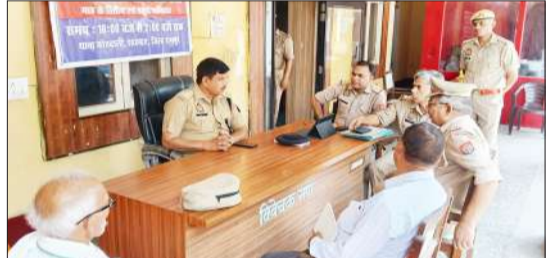
समाधान दिवस में लोगों की शिकायतें सुनते सीओ और कोतवाल।

छल नहीं समावेशी बल देश की प्राथमिकता है। देश सांप्रदायिक तृप्टीकरण वालों को रिजेक्ट और समावेशी सशक्तिकरण वालों को एलेक्ट कर रहा है। नरेंद्र मोदी और भाजपा के खिलाफ तमाम तरह की राजनीतिक असहिष्णुता और अराजकता से भरपूर अंतर्राष्ट्रीय घमासान और अंदरूनी व्यवधान को परास्त कर भाजपा बिना रुके-थके विजय साम्प्रदायिक सूरमाओं का सियासी सूपड़ा साफ कर स्पष्ट संदेश दिया है कि साम्प्रदायिक