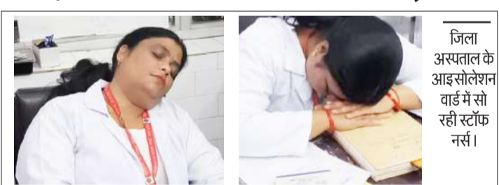
जिला अस्पताल के आइसोलेशन वार्ड में सो रही स्टाफ नर्स।

● आइसोलेशन वार्ड में स्टाफ नर्स का सोने का वीडियो वायरल