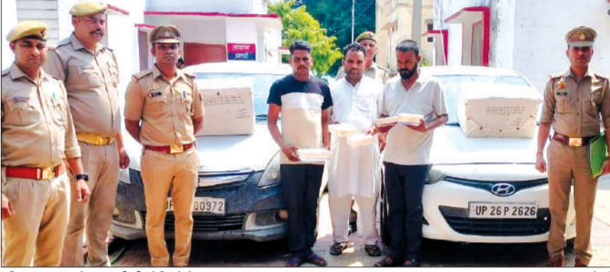
पुलिस द्वारा पकड़े गए नशीली गोलियों के तस्कर।

पीलीभीत। पुलिस ने नशीले पदार्थों की तस्करी के खिलाफ बड़ी कार्रवाई करते हुए करीब 12 लाख रुपये कीमत की प्रतिबंधित अलप्राजोलम गोलियों के साथ तीन तस्करों को गिरफ्तार किया है। पुलिस ने आरोपियों के कब्जे से भारी मात्रा में नशीली दवाएं, नकदी, मोबाइल फोन, एटीएम कार्ड और दो कारें बरामद की हैं।