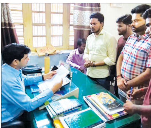
मामले की शिकायत करते छात्र।

बदायूं। सहस्रान के प्रमोद इंटर कॉलेज में बिना रसीद दिए बच्चों से 3500 रुपये वसूलने का मामला सामने आया है। स्कूल में पढ़ने वाले विद्यार्थियों से जब 3500 रुपये एडमिशन के नाम पर लिए गए तो यह एक सामान्य सी प्रक्रिया थी लेकिन जब उसके बदले कोई रसीद नहीं दी गई, इससे साफ हुआ कि दाल में कुछ काला है। जब यह मामला हाईलाइट हुआ तो इसपर छात्र राजनीति ने भी तूल पकड़ी और यह मामला शिक्षाधिकारियों तक भी पहुंचा। डीआईओएस ने इस पर जांच बैठाई है। जीआईसी के प्रधानाचार्य को इसकी जांच सौंपी है। इस अवैध फीस वसूली के विरोध में विद्यार्थी परिषद के