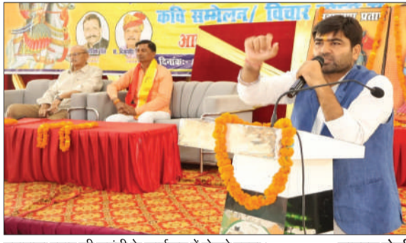
महाराणा प्रताप की जयंती के कार्यक्रम में बोलेते वक्ता।