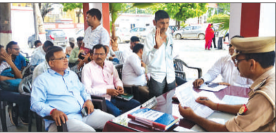
थाना समाधान दिवस में शिकायत सुनते अपराध निरीक्षक।