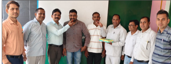
शिक्षामित्र एक दूसरे को मिठाई खिलाते हुए।