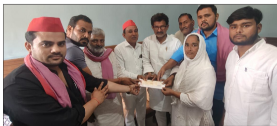
मृतक की पत्नी को चेक देते हुए सपा जिला अध्यक्ष एवं अन्य।