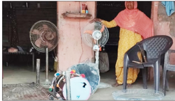
घर में हुई तोड़फोड़ को दिखाती महिला।

वता दे कि कुछ दिन पूर्व पीपली वन क्षेत्र में खैर की लकड़ी के पैसों के बंटवारे को लेकर एक तस्कर की गोली मारकर हत्या कर दी गई थी। मामले में पुलिस ने एक आरोपी को गिरफ्तार कर जेल भेज दिया था, जबकि दो अन्य आरोपी अभी फरार बताए जा रहे हैं। फरार आरोपियों की तलाश में पुलिस लगातार दबिश दे