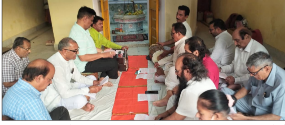
महामृत्युंजय मंदिर में सुंदरकांड का पाठ करते श्रद्धालु।