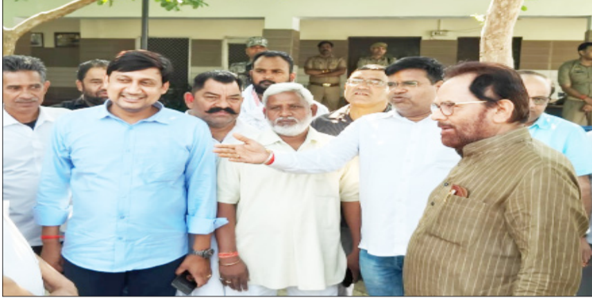
कार्यकर्ताओं से वार्तालाप करते मुख्तार अब्बास नकवी।

रामपुर। पूर्व केंद्रीय कैबिनेट मंत्री एवं वरिष्ठ भाजपा नेता मुख्तार अब्बास नकवी ने सुबह दिल्ली रवाना होने से पूर्व शंकरपुर स्थित अपने आवास पर कार्यकर्ताओं से मिलकर उनका हाल-चाल जाना और संगठन के महत्वपूर्ण विषयों पर चर्चा की। पश्चिम बंगाल को लेकर पत्रकारों के सवालों का जवाब देते हुए उन्होंने कहा कि जब से भारतीय जनता पार्टी का गठन हुआ है। तब से वह एक ही नारा लगाती थी जहां हुए बलिदान मुखर्जी, वह कश्मीर हमारा है। उसके बाद धारा 370 खत्म हुई और कश्मीर भारत का हिस्सा बन गया, उससे पहले भी कश्मीर भारत का हिस्सा था लेकिन आधा अधूरा था। और उसके बाद हम लोगों का संकल्प था कि जहां पश्चिम