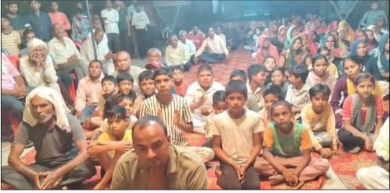
कथा सुनते हुए भक्त।