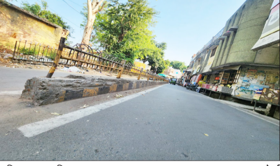
हामिद स्कूल का डिवाइडर।