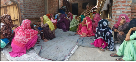
मृतक के परिजन विलाप करते हुए।