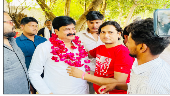
पूर्व मंत्री आबिद रजा का शेखपुर विधानसभा क्षेत्र में स्वागत करते लोग।

बदायूं। सपा के स्टार प्रचारक व राष्ट्रीय सचिव पूर्व मंत्री लगातार पूरे जनपद में पीडीए का प्रचार करके 2027 के चुनाव की तैयारी में जुटे हुए हैं। गांव-गांव जाकर जनसभा व ब्यान के माध्यम से पूर्व मंत्री आबिद रजा पूरे जिले की जनता में चर्चा का विषय बने हुए हैं। प्रत्याशी जनता से चुनाव लड़ाने का आग्रह करता है लेकिन यहां मामला पूरी तरह से उल्टा दिख रहा है। यहां जनता उनको क्षेत्र से चुनाव लड़ाने का आग्रह कर रही है। क्षेत्र के लोगों का आरोप है कि यहां अब तक जो भी चुनाव जीते उन्होंने लोटकर क्षेत्र के लोगों को नहीं देखा। जनता के साथ छलावा होता रहा है। लेकिन जनता अब किसी छलावे में आने वाली नहीं है। जनता ने पूरी तरह से मन