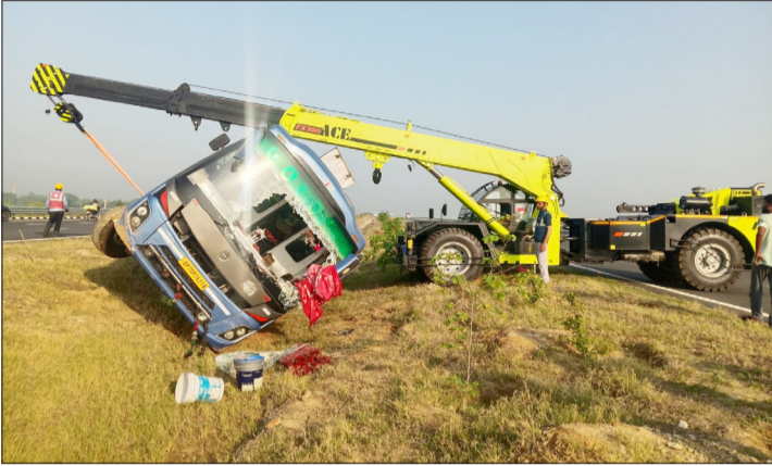
रलीपर बस को सीधा करती क्रैन।

चालक ने बताया कि वह रविवार की सुबह को हरिद्वार से करीब 40 यात्रियों को लेकर प्रयागराज के लिए रवाना हुआ था। बस जैसे ही बिसौली कोतवाली क्षेत्र के गांव फिरोजपुर के पास पहुंची कि अचानक नींद की