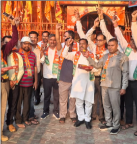
जागरण मोर्चा कार्यालय

मुरादाबाद। विश्व जागृति मिशन मुरादाबाद मंडल की नव-नियुक्त कार्यकारिणी की पहली बैठक आज मुरादाबाद स्थित दिव्य लोक आश्रम में आयोजित की गई। बैठक में सुधांशु जी महाराज के निर्देश पर गठित नई कार्यकारिणी के सभी पदाधिकारियों ने भाग लिया। बैठक का शुभारंभ मंगलाचरण और गुरुवंदना के साथ हुआ। बैठक में सेवा संकल्प अभियान को आगे बढ़ाने के लिये कार्यकारिणी ने धर्म, ज्ञान और सद्भाव के मार्ग पर चलते हुए समाज को जागृत करने हेतु चर्चा की गई। तो वहीं आश्रम, गौशाला, गुरुकुल, औषधालय को लेकर