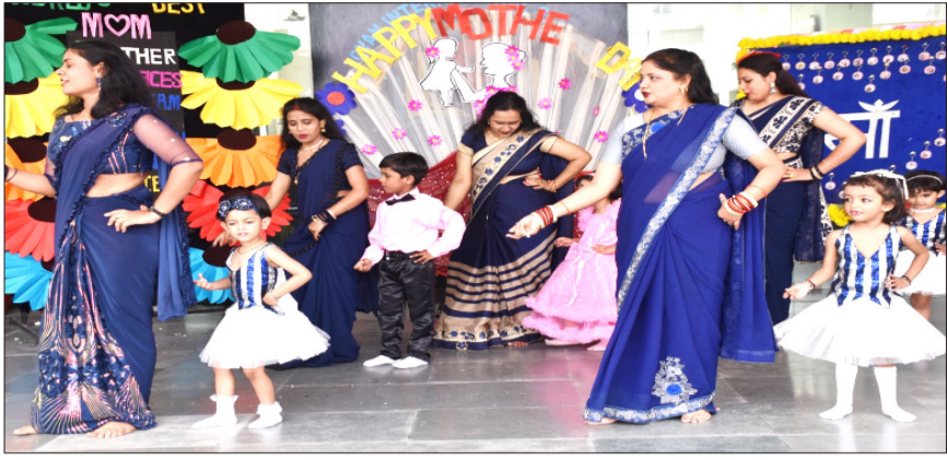
मातृ दिवस समारोह के कार्यक्रम में भाग लेते बच्चे।