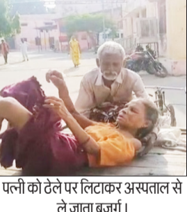
पत्नी को ठेले पर लिटाकर अस्पताल से ले जाता बुजुर्ग।

बरेली। जिला अस्पताल की इमरजेंसी से शनिवार को ऐसी तस्वीर सामने आई जिसने हर किसी को झकझोर दिया। एक बुजुर्ग अपनी बीमार पत्नी को ठेले पर लिटाकर अस्पताल से बाहर निकलता दिखा। चेहरे पर लाचारी, आंखों में गुस्सा और जुबान पर व्यवस्था के खिलाफ दर्द था। सोशल मीडिया पर वीडियो वायरल होते ही स्वास्थ्य विभाग की कार्यप्रणाली पर सवाल की बौछार शुरू हो गई।