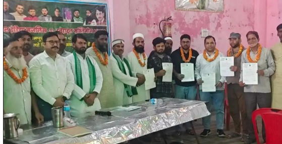
बैठक में उपस्थित कार्यकर्ता।