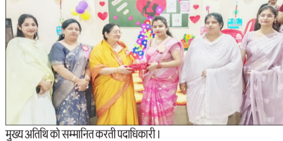
मुख्य अतिथि को सम्मानित करती पदाधिकारी।