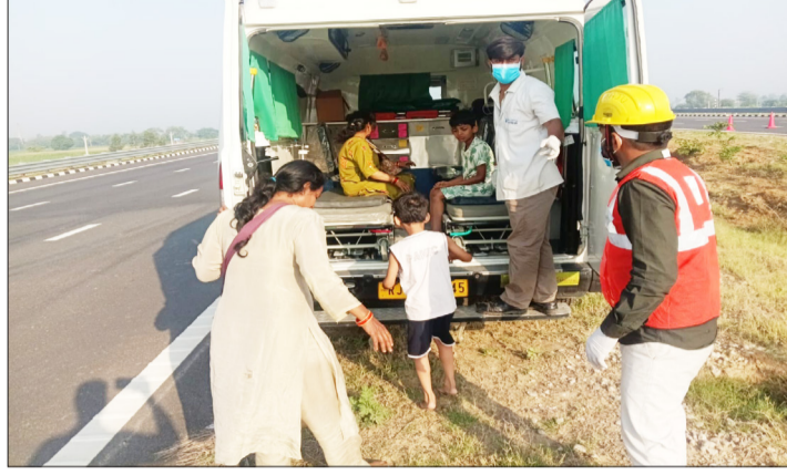
हादसे में घायलों को अस्पताल ले जाते स्वास्थ्य कर्मी।