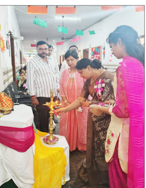
दीप जलाकर कार्यक्रम का आगाज करती मुख्य अतिथि।