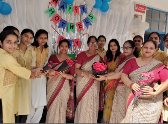
जागरण मोर्चा कार्यालय

गजरोला। नगर के कार्मेल पब्लिक स्कूल में मदर्स डे उत्सव धूमधाम से मनाया गया। कार्यक्रम में बच्चों ने अपनी प्रस्तुतियों के माध्यम से मां के निस्वार्थ प्रेम, बलिदान और त्याग को प्रदर्शित किया। शनिवार को आयोजित कार्यक्रम