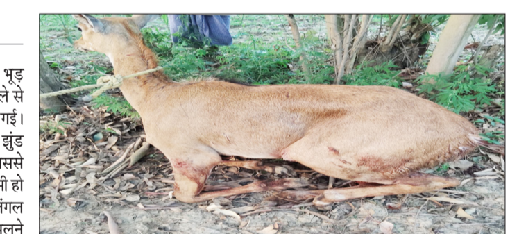
शाहबाद में कुत्तों के झुंड के हमले में जखमी नीलगाय।