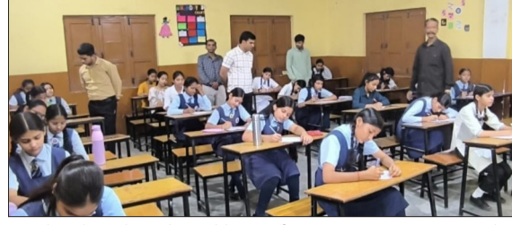
संघ को जानो प्रतियोगिता में भाग लेते प्रतिभागी।