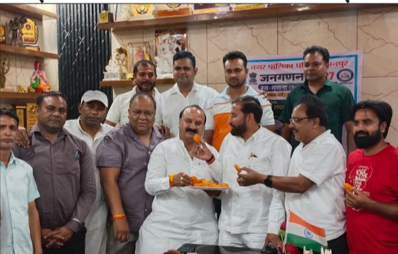
भाजपा कार्यकर्ता एक दूसरे को मिठाई खिलाते हुए।