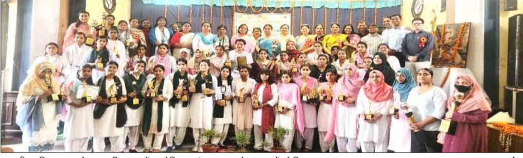
राजकीय महिला स्नातकोत्तर महाविद्यालय में आयोजित अलंकरण समारोह छात्राओं को दिए पुरस्कार।

राजकीय महिला स्नातकोत्तर महाविद्यालय में वार्षिकोत्सव एवं प्रतिभा अलंकरण समारोह