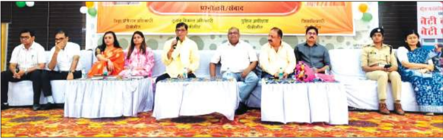
गांधी प्रेक्षा गृह में डीएम की पाठशाला कार्यक्रम के तहत बच्चों से रूबरू होते जिला अधिकारी।