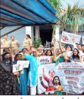
सपा कार्यालय पर धरना प्रदर्शन करते भाजपाई। मोर्चा

रामपुर। नारी शक्ति वंदन अधिनियम को पारित न होने दिए जाने के विरोध में दूसरे दिन स्वार विधानसभा क्षेत्र की महिलाओं ने समाजवादी पार्टी के सांघद मौलाना मोहिबुल्लाह नदवी के कार्यालय का घेराव कर जोरदार प्रदर्शन किया। महिलाओं ने एकजुट होकर नारी सम्मान, महिला अधिकारों एवं महिला सशक्तिकरण के समर्थन में अपनी आवाज बुलंद की। प्रदर्शन के दौरान महिलाओं ने कहा कि नारी शक्ति वंदन अधिनियम देश की महिलाओं के राजनीतिक भागीदारी एवं सम्मान दिलाने की दिशा में एक ऐतिहासिक कदम है, जिसका विरोध महिलाओं के अधिकारों