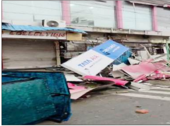
शाहबाद गेट स्थित सुपर मार्केट के गिरे हुए फ्लैक्स। -जागरण मोर्चा

मंगलवार की सुबह करीब नौ बजे मौसम का रूख बदल गया। अचानक से आसमान पर काले बादल धिर आए। स्थिति यह हो गई कि दिन में अंधेरा छा गया। इसके बाद झमाझम बारिश शुरू हो गई। बारिश के साथ तूफान भी आया। तूफान आने से दुकान-मकान के छज्जे उखड़कर गिर गए। वहीं दूसरी ओर बिजली के पोल भी क्षतिग्रस्त हो गए। पोलों के क्षतिग्रस्त होने से पूरे शहर की बिजली ठप हो गई। काफी देर तक बिजली नहीं आने लोगों ने नजदीकी बिजलीघर पर फोन करना शुरू कर दिए। कई मकानों लगे सोलर पैनल तक गिर गए। हालांकि कहीं पर भी किसी तरह के हाताहत होने की सूचना नहीं है।