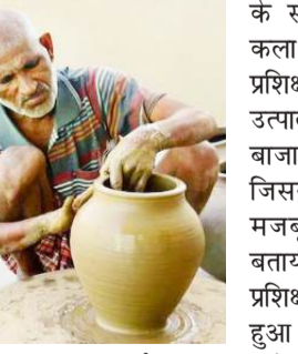
डिजाइन, गुणवत्तापूर्ण उत्पादन एवं विपणन का प्रशिक्षण दिया जाएगा।