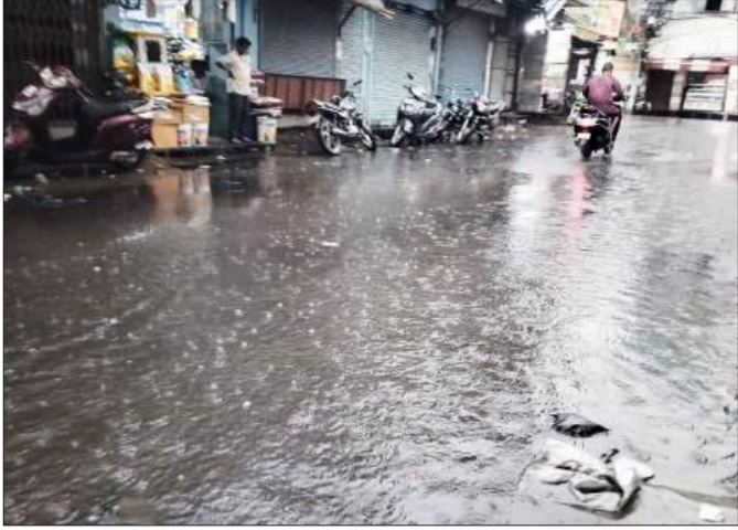
बारिश होने से बाजार नसरुल्लाह खां में जलभराव। -जागरण मोर्चा