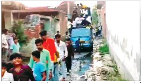
गंदगी एवं जल भराव में होकर गुजरती बारात। -जागरण मोर्चा

हसनपुर। हसनपुर विधानसभा क्षेत्र के एक गांव में हो रही गंदगी एवं जल भराव के बीच होकर बारात गुजरने का वीडियो सोशल मीडिया पर वायरल हो रहा है, जो क्षेत्र में चर्चा का विषय बना हुआ है। वही वीडियो वायरल होने से जन प्रतिनिधियों एवं अधिकारियों की पोल खोल नजर आ रही है।