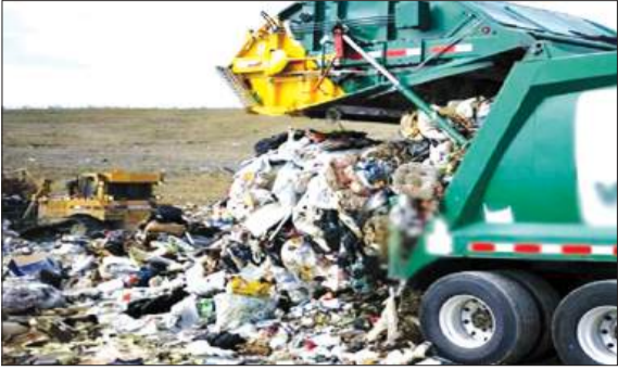
जागरण मोर्चा कार्यालय

सिटीज 2.0 के तहत शहर में बदलेगी सफाई व्यवस्था