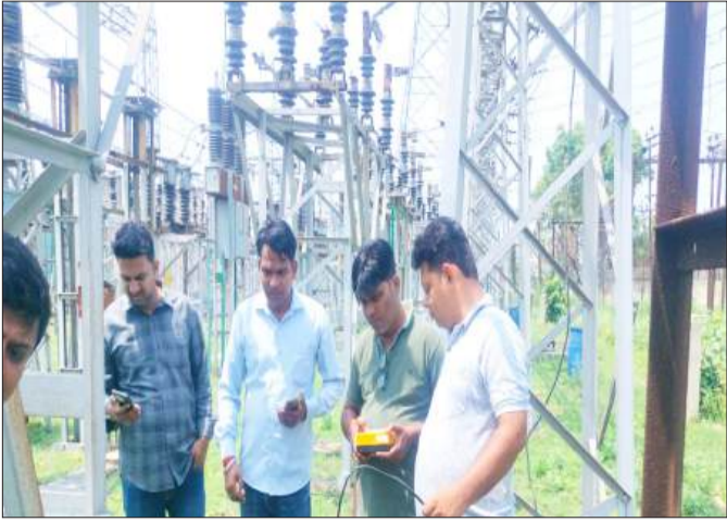
पहाड़ी गेट बिजलीघर के यार्ड में बिजली लाइनों को चेक करते जेई, कर्मचारी।