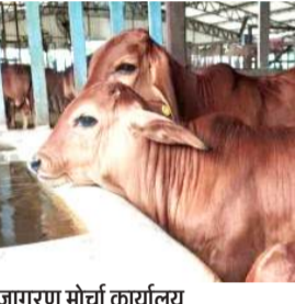
जागरण मोर्चा कार्यालय

4125 के लक्ष्य के सापेक्ष 7703 186.76 प्रतिशत गोवंशों की हुई सुपुर्दगी, रामपुर ने गोबर से कमाए 6.17 लाख रुपये