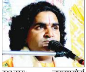
कथा व्यास। -जागरण मोर्चा