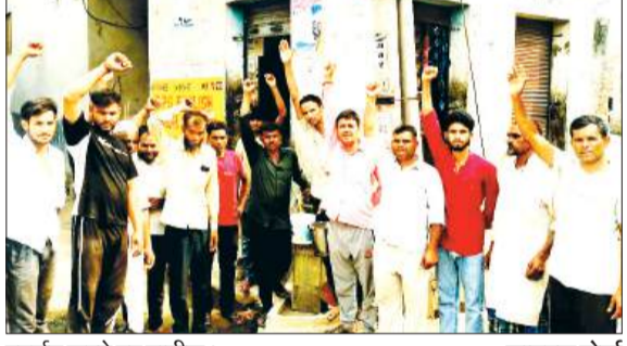
प्रदर्शन करते हुए ग्रामीण।

हसनपुर। ब्लाक क्षेत्र के गांव भदौरा में जल जीवन मिशन योजना के अंतर्गत जल आपूर्ति की जा रही थी। जिससे ग्रामवासियों और विशेष रूप से ऐसे गरीब लोगों को जिनके घरों में समर सेविल या विद्युत कनेक्शन नहीं है। पेय जल आपूर्ति का लाभ मिल रहा था। पहले ये लोग सरकारी नलों से पानी पीने का काम करते थे लेकिन अब सरकारी नलों की जरूरत न होने से वे ठप हो गए हैं। पिछले एक माह से जल आपूर्ति तकनीकी खराबी के कारण ठप पड़ी हुई है। जरूरत मंद गरीब लोगों को दूसरे लोगों के घरों से पानी मांगकर लाना पड़ रहा है। जिससे जंगल अंधे और आम आदमी