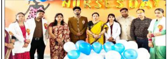
नीलावेणी कृष्णा स्कूल में आयोजित कार्यक्रम में शामिल प्राचार्य।