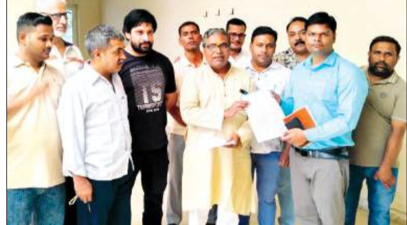
केमिस्ट एण्ड इंग्रिस्ट्स एसोसिएशन ज्ञापन सौंपते हुए।