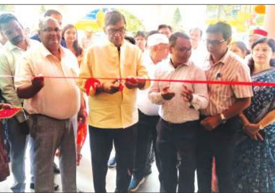
वाटर प्यूरीफायर स्टॉल का फीता काटकर उद्घाटन करते डीएम।