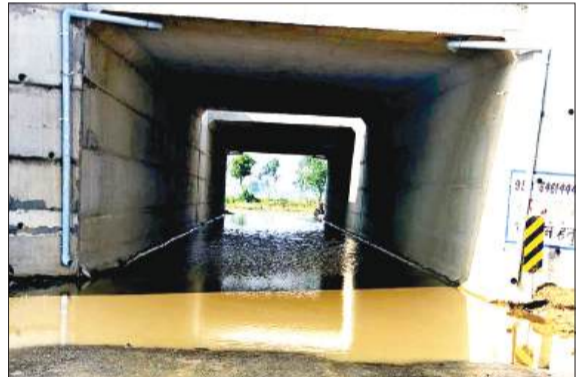
अंडरपास में जलभराव। -जागरण मोर्चा

हसनपुर। गंगा एक्सप्रेसवे के अंडरपास से जल निकासी की व्यवस्था न होने से जलभराव की समस्या बनी हुई है। किसानों के साथ ही ग्रामीणों को आवागमन में भारी परेशानी का सामना करना पड़ रहा है। बताया जा रहा है कि तहसील क्षेत्र के 25 गांवों से होकर गुजर रहे गंगा एक्सप्रेसवे का अंडरपास मंगरौला के नजदीक बना हुआ है। इस अंडरपास से मंगरौला व दौलतपुर कला के ग्रामीणों का आवागमन होता है। हल्की बूढ़ाबांढी में भी अंडरपास पानी से भर जाता है। इसकी वजह जल निकासी की व्यवस्था न होना बताया जा रहा है, जिसके चलते दोनों गांवों का संपर्क मार्ग अवरुद्ध हो जाता है। तमाम ग्रामीणों व किसानों को प्रतिदिन