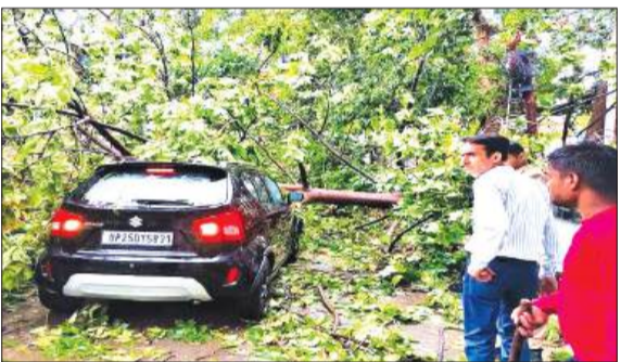
बरेली में आई आंधी से कार से ऊपर गिरा पेड़।

सुबह करीब साढ़े दस बजे आसमान में काले बादल छा गए और देखते ही देखते तेज हवाओं के साथ बारिश शुरू हो गई। मौसम विभाग ने पहले ही तेज बारिश और आंधी की संभावना जताई थी। आंधी इतनी तेज थी कि दामोदर स्वरूप पार्क