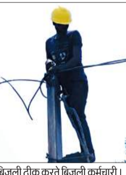
बिजली ठीक करते बिजली कर्मचारी।

पूरनपुर। नगर से लेकर देहात क्षेत्र के बिजली उपकेंद्रों से जुड़े दर्जनों गांवों में सोमवार रात बिजली आपूर्ति बंद हो गई। शाम से शुरू हुई कटौती पूरी रात तक चलती रही। जिससे लोगों को उमस भरी गर्मी में भारी परेशानियों का सामना करना पड़ा।