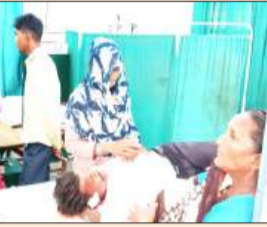
घायल बाइक सवार को उपचार देते स्वास्थ्य कर्मी।