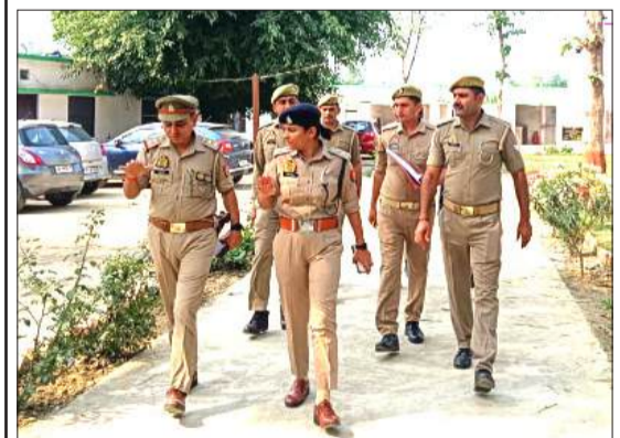
खजुरिया थाने का निरीक्षण करने जाती सीओ बिलासपुर