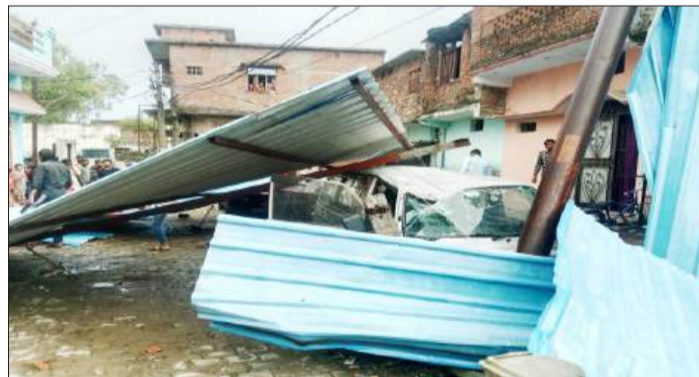
तूफान में मारुति वैन पर गिरा विद्युत पोल।

नगर के मोहल्ला क्रस्सवान में आंधी में उखड़े खंभे और टीन शेट मारुति वैन पर गिर पड़े, जिसके कारण मारुति वैन बुरी तरह क्षतिग्रस्त हो गई। साथ ही साथ कई जगहों पर टीन शेट उखड़कर सड़कों और गलियों में जा गिरा। तूफान के कारण आंवला चौराहे स्थित ढाबे का पूरा नक्शा ही बदल गया, पूरा ढाबा बुरी तरह क्षतिग्रस्त हो गया। अचानक आए आंधी तूफान ने जन जीवन को मुश्किल