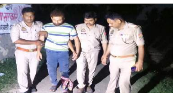
घायल को ले जाती पुलिस।