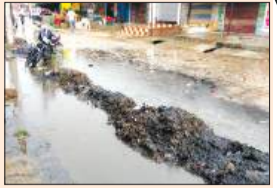
नाले की सफाई के बाद जमा गंदगी।

नाले से निकली गंदगी, सड़क के किनारे जमा सफ़नी। नगर में स्थित छिन्नी मार्ग पर नाले की सफाई के बाद निकली गंदगी लोगों के जी का जंजाल बन गई है। आसपास के व्यापारी एवं राहगीरों को परेशानी का सामना करना पड़ रहा है। पिछले तीन से नाले की सफाई का कार्य चल रहा है। सफाईकर्मी नाले की सफाई के दौरान निकला कीचड़ सड़क पर डाल रहे हैं, लेकिन उसे उठाने की कोई व्यवस्था नहीं की जा रही है। सड़क पर कीचड़ पड़ा होने के कारण आने-जानेवाहनों के पहियों से लिफ्टकर कीचड़ दूर तक फैल रही है। कई दिनों से फैल रही कीचड़ बार-बार पहियों से लिफ्टने के कारण धूल में परिवर्तित हो गई है। धूल व बदबू के कारण दुकानदारों और राहगीरों को परेशानी का सामना करना पड़ रहा है। बावजूद इसके बार-बार कहने पर भी सफाई कर्मचारियों से कूड़ा उठवाने को तैयार नहीं है।