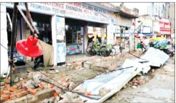
आंधी से दुकानों के गिरे बोर्ड।