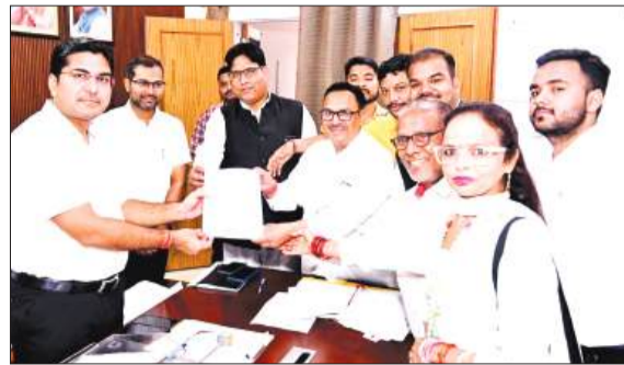
डीएम को ज्ञापन सौंपते अखिल भारतीय ग्राहक पंचायत के पदाधिकारी।

पंचायत उत्पादन लागत का मुद्रण, फर्स्ट सेल प्राइस, भ्रमित डिस्काउंट पर प्रतिबंध लगाने, एमआरपी मुद्रण के लिए ऊपरी सीमा निर्धारित करने वाला कानून बनाने को कार्य कर रही हैं। आज एमआरपी मुद्रण सबसे बड़ी समस्या है और यह पद्धति में पारदर्शिता की कमी, कमजोर प्रवर्तन और संरचनात्मक से उक्त हैं, व्यापारी मनमाना एमआरपी से लाभान्वित हो रहे हैं और