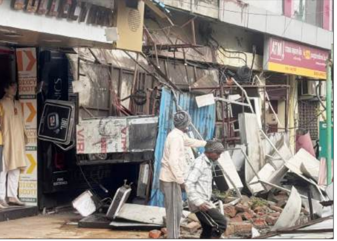
सुपर मार्केट में गिरे हुए फ्लैक्स को हटाते मजदूर।