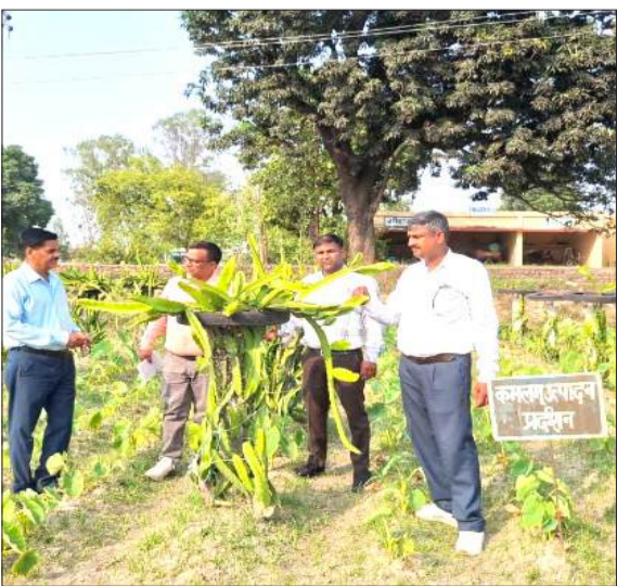
खेत में जानकारी लेते अधिकारी।