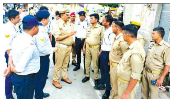
पुलिस कर्मियों को दिशा निर्देश देते यातायात प्रभारी निरीक्षक।