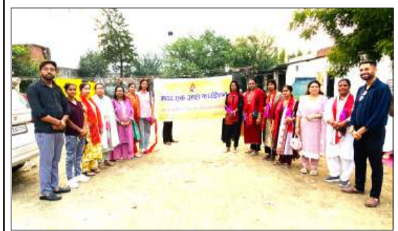
कार्यक्रम के दौरान मौजूद पदाधिकारी।