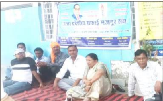
पालिका प्राणण में दूसरे दिन भी धरने पर बैठे कर्मचारी।