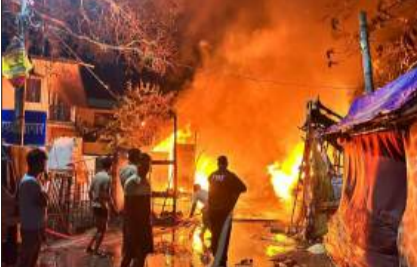
आग को बुझाते कर्मचारी।

टनकपुर। पूर्णागिरि मेला क्षेत्र टनकपुर पंचमुखी धर्मशाला के समीप उस समय अफरा-तफरी मच गई। अचानक लगी भीषण आग ने देखते ही देखते पांच अस्थाई दुकानों को अपनी चपेट में ले लिया। आग इतनी तेज थी कि कुछ ही मिनटों में दुकानों में रखा पूरा सामान जलकर राख हो गया। इस दर्दनाक हादसे में लाखों रुपये के नुकसान की आशंका जताई जा रही है। आग की लपटों के बीच अपनी मेहनत और उम्मीदों को राख होते देख पीड़ित व्यापारी फूट-फूटकर रो पड़े। पीड़ितों का कहना है कि उन्होंने बड़ी मुश्किल से पैसे जोड़कर दुकानें लगाई थीं ताकि