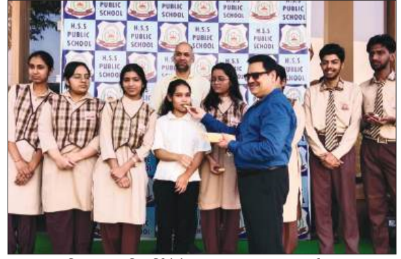
एचएसएस पब्लिक स्कूल विद्यार्थियों के साथ प्रबंधक एवं प्रधानाचार्य।