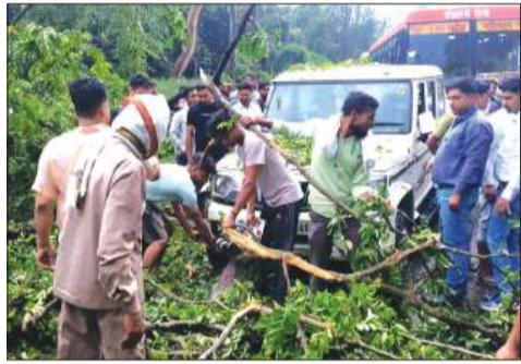
नगर के गजरौला मार्ग पर बोलेरो के ऊपर गिरा पेड़।

हसनपुर। आंधी व बारिश लोगों के लिए आफत बन गई। आंधी में कई जगह बिजली के खंभे और पेड़ जमींदोज हो गए। नगर से लेकर देहात तक बिजली आपूर्ति गुल हो गई। मुख्य मार्गों पर पेड़ गिरने से यातायात प्रभावित रहा।