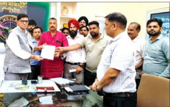
साप्ताहिक बंदी को सख्ती से लागू करने की मांग को लेकर ज्ञापन सौंपते व्यापारी।