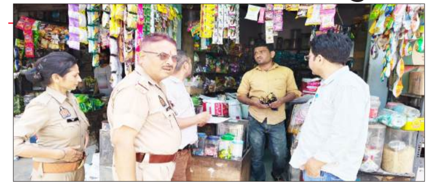
दुकानों पर चेकिंग करते अधिकारी।