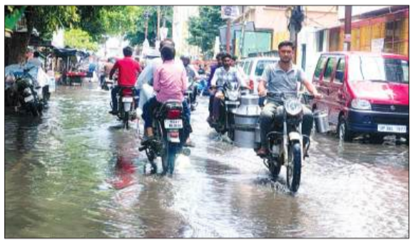
चंदौसी के मालवीय चौक पर जल भराव से होकर गुजरते वाहन।