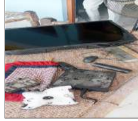
आकाशीय बिजली गिरने से खराब हुई एलईडी और विद्युत उपकरण।

शाहबाद। थाना क्षेत्र के मेहेवा गांव में एक मकान में आकाशीय बिजली गिरने से काफी नुकसान हो गया। बुधवार सुबह अचानक तेज गर्जन और चमक के साथ गिरी आकाशीय बिजली ने घर में लगे विद्युत उपकरणों को खराब कर दिया, जबकि मकान की दीवारों और लेंटर में दरार भी आ गई। हालांकि गनीमत रही कि उस समय विद्युत उपकरणों के पास घर का कोई सदस्य नहीं था, वरना कोई अनहोनी हो सकती