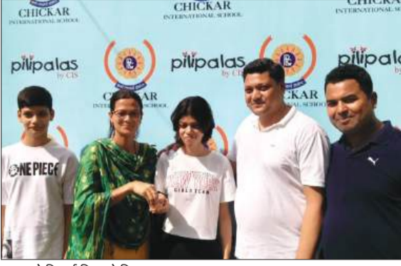
छात्रा को मिठाई खिलाते शिक्षक।