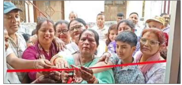
कार्यक्रम का उद्घाटन करती मुख्य अतिथि।