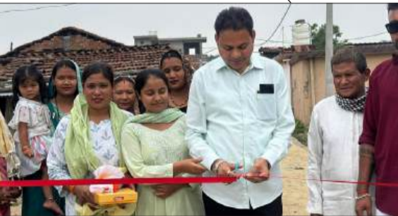
सड़क का फीता काटकर उद्घाटन करते मुख्य अतिथि।