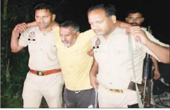
मुठभेड़ के बाद घायल हुए बदमाशों को ले जाती पुलिस।