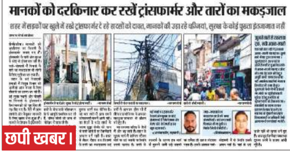
मानकों को दरकिनार कर रखें ट्रांसफार्मर और तारों का मकड़जाल

शहर में सड़कों पर खुले बने ट्रांसफार्मर और तारों का मकड़जाल... बिजली विभाग की लापरवाही और शहर में फैले तारों के जाल को लेकर प्रकाशित खबर का असर हुआ है।