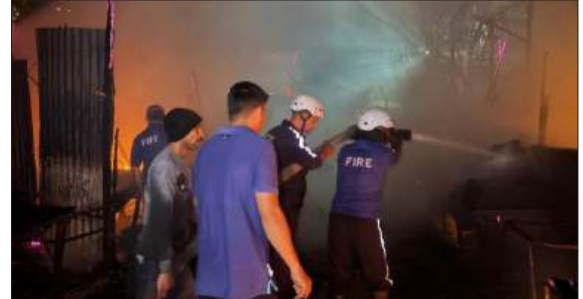
आग बुझाते फायर कर्मी।