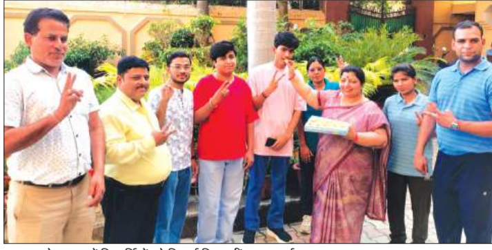
आरआरके स्कूल में विद्यार्थियों को मिठाई खिलाती प्रधानाचार्य।

शहर में सीबीएसई बोर्ड के ओपीजीएम स्कूल, एएम वर्ल्ड स्कूल, आरआरके स्कूल, जीके सिल्वर स्टोन स्कूल, सिल्वर स्टोन स्कूल तथा न्यू सत्यम अकादमी के विद्यालय हैं। बुधवार को सीबीएसई बोर्ड के इंटरमीडिएट का परीक्षा फल घोषित किया गया। अपना-अपना परीक्षा परिणाम इंटरनेट पर देने के बाद उत्तीर्ण हुए विद्यार्थियों में उत्साह नजर आया। विद्यार्थियों