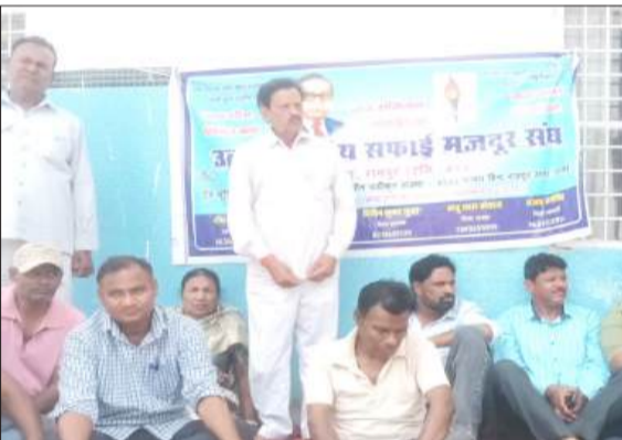
पालिका के प्रांगण में आयोजित धरने को संबोधित संघ के पदाधिकारी।

नगर पालिका में तीसरे दिन भी उत्तर प्रदेशीय सफाई मजदूर संघ