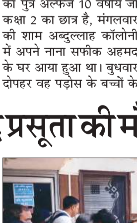
मृतका के परिजनों से जानकारी करते पुलिस।