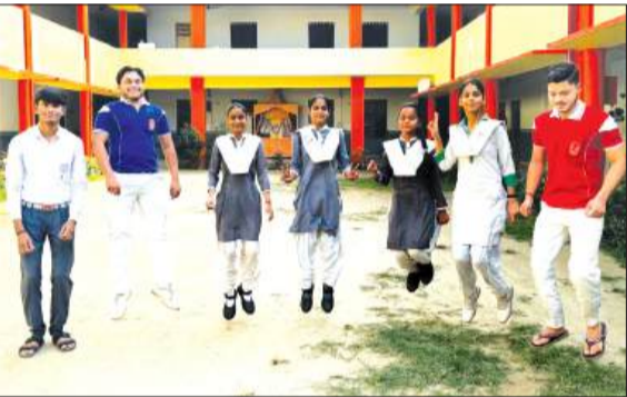
आरएसआरडी स्कूल में 12वीं के नतीजे के बाद खुशियां मनाते बच्चे।

पूरनपुर। केंद्रीय माध्यमिक शिक्षा बोर्ड (सीबीएसई) द्वारा घोषित 12वीं कक्षा के परीक्षा परिणाम में पूरनपुर क्षेत्र के विभिन्न विद्यालयों के विद्यार्थियों ने उत्कृष्ट प्रदर्शन कर सफलता के नए कीर्तिमान स्थापित किए हैं। कई विद्यालयों का परीक्षा परिणाम शत-प्रतिशत रहा, जबकि मेधावी विद्यार्थियों ने उच्च अंक प्राप्त कर विद्यालय एवं क्षेत्र का नाम रोशन किया। परिणाम घोषित होते ही स्कूल परिसरों में उत्सव जैसा माहौल रहा।