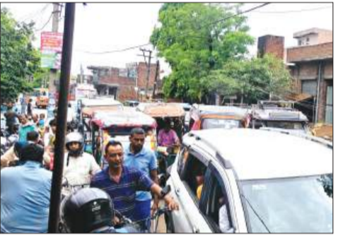
ग्राम शाहपुर एवं गजरौला मार्ग में गिरे पेड़ के कारण लगा जाम।