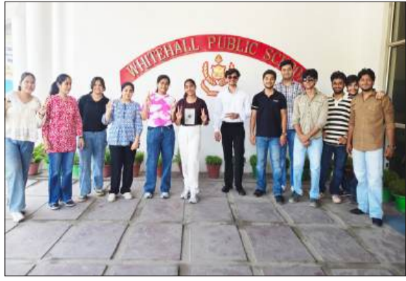
व्हाइटहॉल पब्लिक स्कूल में सर्वोच्च अंक लाने पर खुशी जाहिर करती छात्राएं।