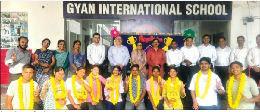
बेहतर रिजल्ट की खुशियां मनाते स्टाफ व बच्चे।