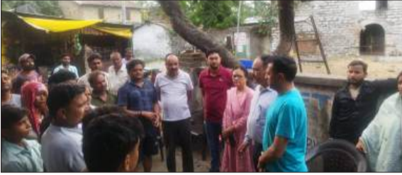
लोगों को जागरूक करते अधिकारी।