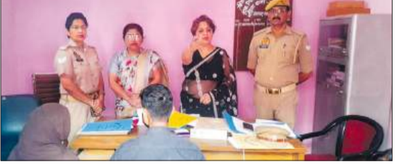
परामर्श केंद्र पर पति पत्नी को समझाते काउंसलर।