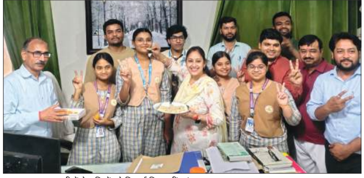
न्यू सत्यम अकादमी में मेधावियों को मिठाई खिलाती प्रबंधक व अन्य।

व शिक्षक-शिक्षिकाओं के साथ मिठाई खाई। बता दें कि सीबीएसई के हाईस्कूल परीक्षा परिणाम काफी पहले घोषित हो गया था। मगर इंटरमीडिएट का परीक्षा परिणाम के घोषित होने में देरी होने पर विद्यार्थियों में बेचैनी होने लगी थी। बुधवार को जैसी ही सीबीएसई के इंटरमीडिएट का परीक्षा परिणाम घोषित हुआ, वैसे ही छात्र-छात्राओं में उत्साह नजर आने लगा और अपना-अपना परीक्षा परिणाम देखने की उत्सुकता दिखाई दी।