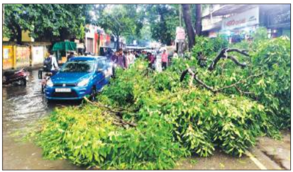
चंदौसी के रेलवे स्टेशन पर आंधी से गिरा पेड़।

चन्दौसी। बुधवार की सुबह अचानक बदले मौसम ने शहर का मिजाज पूरी तरह बदल दिया। करीब 10 बजे आसमान में काले घने बादल छा गए और तेज धूलभरी आंधी चलने लगी। आंधी इतनी तेज थी कि दिन में ही रात जैसा माहौल बन गया। सड़कों पर वाहन चालकों को लाइट जलाकर गुजरना पड़ा। तेज हवाओं के कारण लोगों को काफी दिक्कतों का सामना करना पड़ा और बाजारों में अफरा-तफरी का माहौल दिखाई दिया। आंधी के कुछ देर बाद शहर में झमाझम बारिश शुरू हो गई। बारिश भले ही ज्यादा देर तक नहीं चली, लेकिन तेज बरसात से शहर की प्रमुख सड़कों के