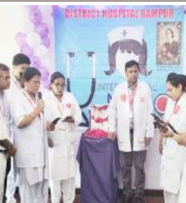
कार्यक्रम में मौजूद सीएमएस, स्टॉफ नर्स।