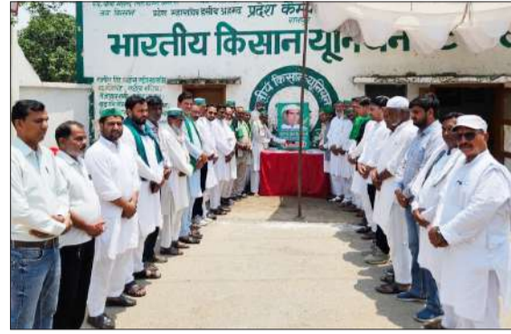
बाबा महेंद्र सिंह टिकैत के चित्र पर पुष्प चढ़ाते किसान।