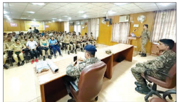
छात्र-छात्राओं को जागरूक करते सेना के अधिकारी।