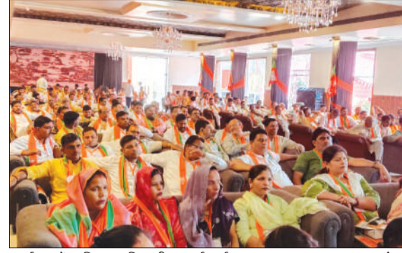
कार्यक्रम में शामिल पदाधिकारी व कार्यकर्ता।

समाज में बदलाव महसूस किया जाता है। संगठन का विस्तार केवल सत्ता प्राप्ति के लिए नहीं अपितु समाज में राष्ट्र चेतना जगाने के लिए है भारतीय जनता पार्टी सदैव उसके लिये प्रयत्न करती है। आज दुनिया में हमारी जय जयकार हो रही है, इसके लिए हमारे यशस्वी प्रधानमंत्री नरेंद्र मोदी के अथक प्रयासों का फल है। आज उन्होंने भारत माता को परम वैभव तक पहुंचाने का कार्य किया है। उन्होंने कहा कि में मुस्लिम भाइयों से