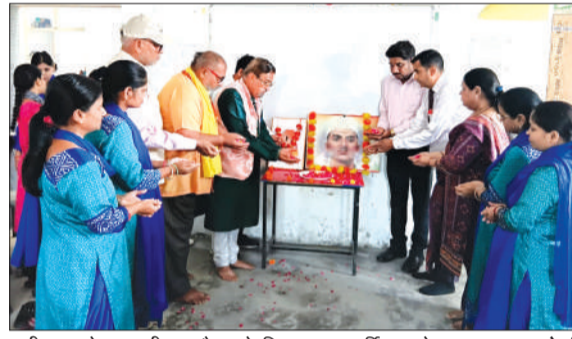
शहीद सुखदेव व पृथ्वीराज चौहान के चित्र पर पुष्प अर्पित करते।