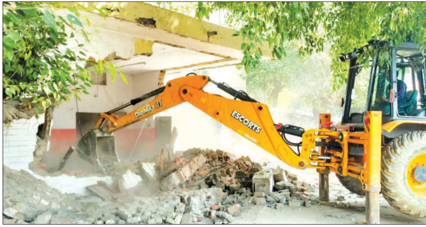
सपा कार्यालय पर बुलडोजर कार्रवाई।

जानकारी के अनुसार, यह भवन नगर पालिका परिषद का पुराना अधिशासी अधिकारी (ईओ) आवास था, जिस पर लंबे समय से समाजवादी पार्टी का कार्यालय संचालित हो रहा था। नगर पालिका ने कुछ समय पहले भवन को कब्जा मुक्त कराया था। भवन की हालत बेहद जर्जर बताई जा रही थी,