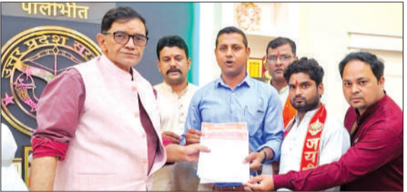
डीएम को ज्ञापन सौंपतेवैर राष्ट्रीय हनुमान दल के कार्यकर्ता।