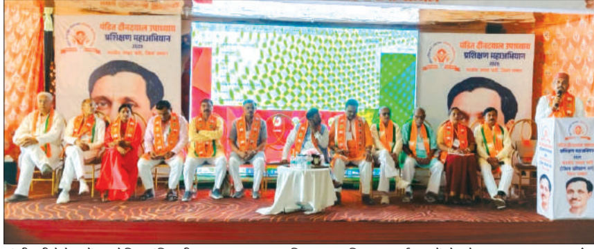
संजीवनी पैलेस में आयोजित पंडित दीनदयाल उपाध्याय प्रशिक्षण महाभियान कार्यक्रम में बोलते वक्ता।