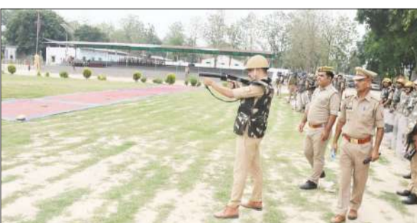
पुलिस लाइन में अभ्यास करते अधिकारी।

जागरण मोर्चा कार्यालय रामपुर। पुलिस अधीक्षक के निर्देशन में पुलिस लाइन ग्राउंड में दंगा नियंत्रण ड्रिल एवं बलवा ड्रिल का आयोजन किया। ड्रिल में जनपद के पुलिस बल द्वारा विभिन्न टीमों में विभाजित कर दंगा, बलवा नियंत्रण के दौरान अपनायी जाने वाली सभी विधिक कार्यवाहियों एवं टैक्टिकल उपयोग का क्रमबद्ध अभ्यास किया। ड्रिल के दौरान पुलिस बल को भीड़ नियंत्रण,