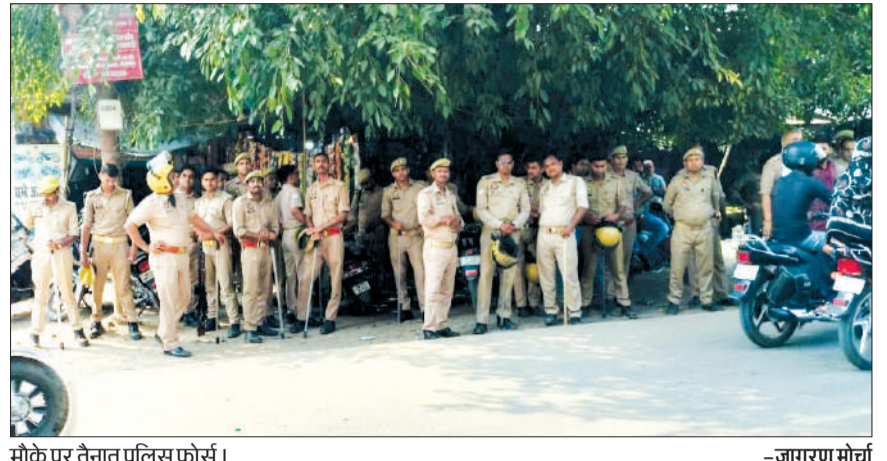
मौके पर तैनात पुलिस फोर्स।