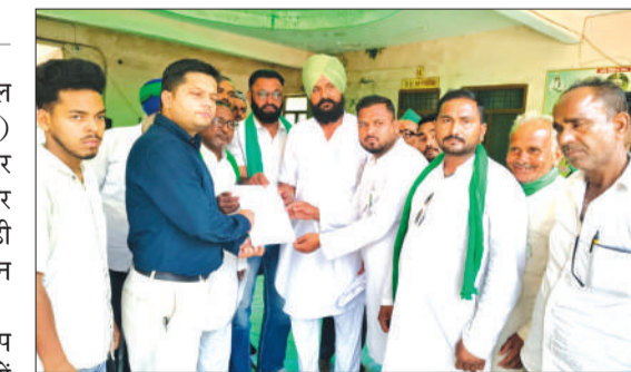
नायब तहसीलदार को विभिन्न समस्याओं को लेकर ज्ञापन देते हुए।

पूरनपुर। शुक्रवार को तहसील परिसर में भाकियू (टिकैट गुट) के नेताओं ने नायब तहसीलदार को विभिन्न समस्याओं को लेकर ज्ञापन सौंपा। इस दौरान बड़ी संख्या में किसान और संगठन के पदाधिकारी मौजूद रहे। भाकियू नेताओं ने आरोप लगाया कि क्षेत्र के किसानों को कई स्तरों पर परेशानियों का सामना करना पड़ रहा है। मुख्य रूप से गन्ना भुगतान में देरी, बिजली आपूर्ति की अनियमितता, और सिंचाई के साधनों की कमी जैसे मुद्दे ज्ञापन में उठाए गए। नेताओं ने कहा कि समय पर भुगतान न होने से किसानों की आर्थिक स्थिति लगातार कमजोर होती जा रही है। किसानों को समितियों पर खाम नही मिल रहा है। जिससे