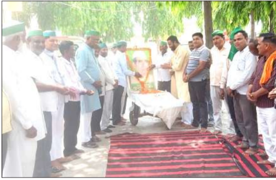
कार्यक्रम में मौजूद किसान।

इस मौके पर किसानों ने कहा कि बाबा महेंद्र सिंह टिकैत किसानों के सच्चे हितैषी थे। उन्होंने अपना पूरा जीवन किसानों के अधिकारों और उनकी समस्याओं के समाधान के लिए समर्पित कर दिया। उन्होंने बताया कि बाबा टिकैत की पुण्यतिथि प्रतिवर्ष 15 मई को मनाई जाती है। उनका निधन वर्ष 2011 में हुआ था, लेकिन आज भी किसान उनके संघर्ष और विचारों को याद करते हैं। उसके बाद शरबत की सबील लगाकर प्रसाद का वितरण राहगीरों को किया। कृषि राज्य मंत्री