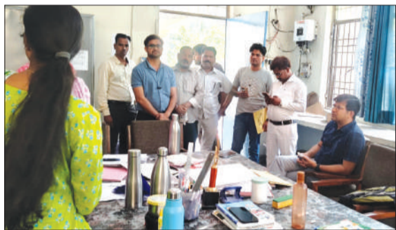
बरखेड़ा में जनगणना को लेकर की गई कार्यशाला में भाग लेते लोग।

15 दिवसीय स्व-गणना अभियान के नौवें दिन स्वयं सहायता समूहों, आंगनवाड़ी कार्यकर्त्रियों एवं सहायिकाओं, महिला संस्थाओं, ग्राम प्रधानों, कोटेदारों, पंचायत सहायकों, सचिव सहकारी समितियों, ग्राम पंचायत एवं विकास अधिकारियों, खाद विक्रेताओं,