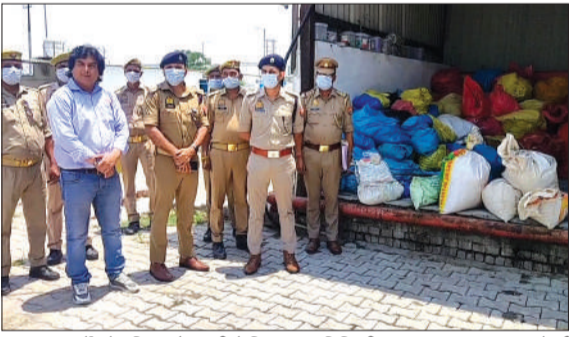
मादक पदार्थों को पुलिस मौजूदगी में किया गया विनिष्टीकरण। -जागरण मोर्चा

चन्द्रौसी। उत्तर प्रदेश शासन व पुलिस महानिदेशक निर्देश पर नया मुक्त समाज की परिकल्पना को साकार करने को जनपद में चलाए जा रहे ऑपरेशन दहन के तहत शुक्रवार को कार्रवाई की गई। जिसमें जनपद के थाना बहजौड़, चन्द्रौसी, नखासा व धारी से संबंधित 15 अभियोगों में न्यायालय के आदेशानुसार निस्तारित किए गए 91.280 किलोग्राम (अनुमानित मूल्य 9372500) अवैध मादक पदार्थों (डोडा, स्मैक आदि) का विनिष्टीकरण किया गया। पुलिस की ओर से विघातक पदार्थों के सुरक्षित निस्तारित को निर्धारित मानकों का पालन करते हुए चक्रण प्राइवेट लिमिटेड बबराला में संपन्न हुई। साथ ही पर्यावरण संरक्षण और सुरक्षा नियमों को ध्यान में रखते हुए उच्च क्षमता वाले ईंसीनरेटर