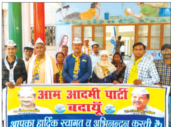
जनप्रतिनिधियों वाली समितियों की बैठक आयोजित नहीं की जा सकती। जिलाध्यक्ष ने कहा कि भारत सरकार का बजट सत्र 31 जनवरी 2025 से चार अप्रैल 2025 तक चला। इसके बावजूद 11 मार्च 2025 को नगर पालिका परिषद उद्घाटी में लगभग 52 करोड़ रुपये का बजट पास किया