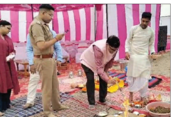
सीबीजी (कंप्रेसड बायोगैस) प्लांट का भूमि पूजन करते डीएम व एसपी।

अधिकारियों ने प्लांट मॉडल का अवलोकन किया। कंपनी प्रतिनिधियों ने बताया कि शुरुआती चरण में प्लांट की क्षमता 6 से 7 टन प्रतिदिन होगी, जिसे बाद में बढ़ाकर 9 से 10 टन प्रतिदिन किया जाएगा। करीब 40 से 42 करोड़ रुपये की लागत से पांच एकड़ भूमि