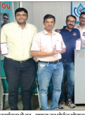
कार्यक्रम में स्व-गणना का पोर्टल मोबाइल में लोड कर दिखाते चिकित्सक।

जागरण मोर्चा कार्यालय चन्द्रौसी। आईएमए के पदाधिकारियों की ओर से स्टेशन रोड स्थित मोहन पैथोलॉजी एंड ब्लड बैंक में स्वास्थ्य दिवस का आयोजन किया गया। कार्यक्रम के मुख्य अतिथि सीएमओ डा. तरुण पाठक रहे। कार्यक्रम में मौजूद चिकित्सकों ने स्वास्थ्य