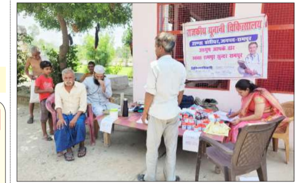
चिकित्सा शिविर में परीक्षण करते चिकित्सक।