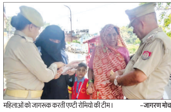
महिलाओं को जागरूक करती एंटी रोमियो की टीम। -जागरण मोर्चा

देने का प्रयास किया। साथ ही मिशन शक्ति 5.0 (द्वितीय चरण) अभियान के अंतर्गत जनपद की एंटी रोमियो टीम द्वारा प्रमुख बाजारों, कस्बा, चौराहों, स्कूलों कालेजों, धार्मिक स्थलों तथा अन्य महत्वपूर्ण स्थानों पर शासन व पुलिस विभाग द्वारा महिलाओं की सुरक्षा और सशक्तिकरण स्वावलंबन के लिए चलाई जा रही विभिन्न विभागों की योजनाओं तथा पुलिस विभाग