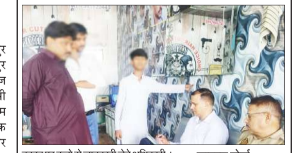
दुकान पर बच्चों से जानकारी लेते अधिकारी।

मिलक। नगर के बिलासपुर रोड पर स्थित डॉ. रामबहादुर सिंह मेमोरियल डिग्री कॉलेज ने बीए, बीएससी, बीएससी गृहविज्ञान चतुर्थ व षष्ठम सेमेस्टर की मुख्य प्रयोगात्मक परीक्षा की तिथियां घोषित कर दी हैं। कॉलेज प्रशासन द्वारा बताया परीक्षाएं 16 मई से शुरू होकर 21 मई तक चलेंगी। 16 मई को चित्रकला बीए 4 व 6 सेमेस्टर सुबह 9 बजे से, 19 मई को राजनीति शास्त्र बीए 6 सेमेस्टर, गृहविज्ञान बीए 4 व 6 सेमेस्टर, गृहविज्ञान बीएससी गृहविज्ञान 4 व 6 सेमेस्टर सुबह 9 बजे से 20 मई को वनस्पति विज्ञान बीएससी 4 व 6 सेमेस्टर सुबह 7 बजे से 21 मई को रसायन विज्ञान बीएससी 4 व 6 सेमेस्टर सुबह 9 बजे से कॉलेज प्रबंधन ने सभी छात्रों को निर्धारित तिथि और समय पर परीक्षा में उपस्थित होने के निर्देश दिए हैं।