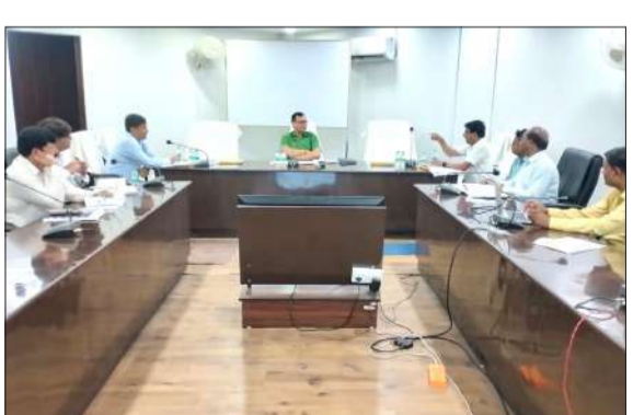
बैठक को संबोधित करते अधिकारी।