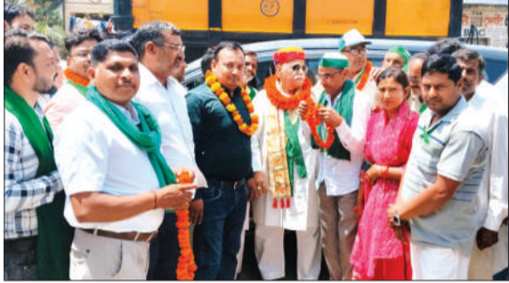
भाकियू भानू के राष्ट्रीय अध्यक्ष का स्वागत करते हुए।