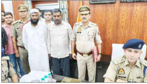
पुलिस आफिस में प्रेसवार्ता करते एएसपी और मौजूद आरोपी।