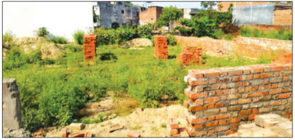
वह प्लॉट जिस पर कब्जा करने का आरोप है।

एलिम्को द्वारा विशेष शिविर का आयोजन किया गया, जिसमें बुजुर्गों का परीक्षण किया गया। शिविर में पात्र लोगों को शीघ्र ही सहायक उपकरण जैसे कान की मशीन, बैसाखी एवं अन्य उपकरण उपलब्ध कराए जाने की जानकारी दी गई। साथ ही सरकार द्वारा संचालित विभिन्न योजनाओं की जानकारी भी लोगों को दी गई। जिलाधिकारी