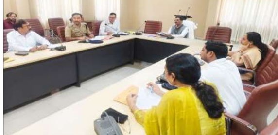
बैठक को संबोधित करते अधिकारी।

रामपुर। राज्य सूचना आयुक्त स्वतंत्र प्रकाश ने संत शिरोमणि सिकंदर हाउस सभागार में विभिन्न विभागों के जनसूचना अधिकारियों को सूचना का अधिकार अधिनियम-2005 के संबंध में जानकारी एवं आवश्यक दिशा-निर्देश प्रदान किए। उन्होंने कहा कि आवेदकों द्वारा मांगी गई सूचनाएं निर्धारित समयबद्धि में उपलब्ध कराना तय किया जाए। सूचना का अधिकार अधिनियम के तहत नागरिकों को दिधि अधिकारों का पूर्ण अनुपालन किया जाए। उन्होंने अधिकारियों को आरटीआई अधिनियम का गहन अध्ययन करें तथा सूचना का अधिकार को भी ऑनलाइन कर दिया गया है। राज्य सूचना आयुक्त ने निर्देश दिए कि यदि कोई सूचना आवेदन संबंधित कार्यालय से