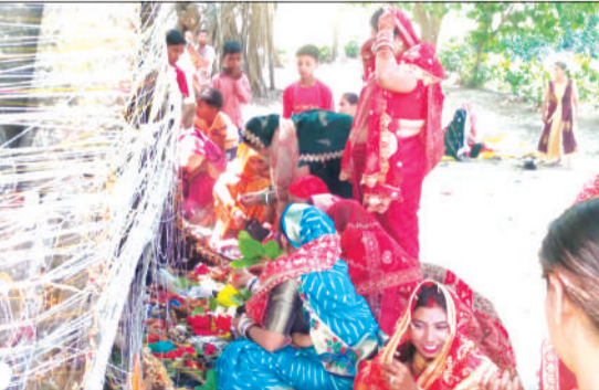
वट वृक्ष की पूजा अर्चना करती महिलाएं।

(बरगद) को देव वृक्ष माना जाता है, जिसमें ब्रह्मा, विष्णु, महेश और देवी सावित्री का वास होता है। पूजन के दौरान महिलाओं ने पारंपरिक वेशभूषा में सज-धजकर वट वृक्ष के चारों ओर कच्चा सूत लपेटकर परिक्रमा की। इसके साथ ही जल, फूल, रोली, भीगे चने व