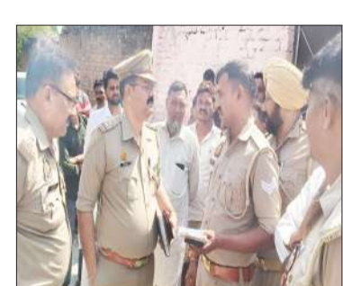
जानकारी हासिल करते अधिकारी।