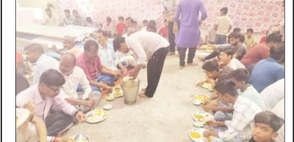
भंडारे में प्रसाद ग्रहण करते भक्त।