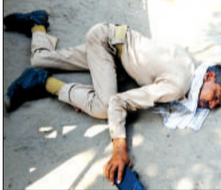
नशे में सड़क किनारे पड़ा होमगार्ड।

हसनपुर। नगर के एक अड्डे पर तैनात एक होमगार्ड ने जमकर उत्पाद मचाया। सूचना पर पहुंची पुलिस ने शराब के नशे में धुत होमगार्ड का मेडिकल परीक्षण कराया है। कोतवाली में तैनात होमगार्ड की ड्यूटी नगर के संभल अड्डे पर है।