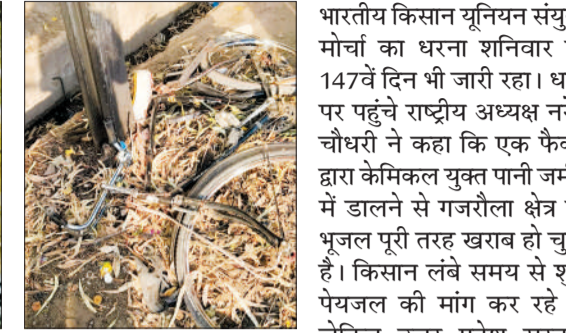
घटनास्थल पर पड़ी साइकिल।

उसके दोनों पैरों को कुचलता हुआ निकल गया। घटना के बाद मौके पर अफरा-तफरी मच गई। आसपास के लोगों की भारी भीड़ जमा हो गई और ठाकुरद्वारा-रतपुरा मार्ग पर दोनों ओर लंबा जाम लग गया। लोगों ने किसी तरह घायल युवक को सरकारी अस्पताल पहुंचाया, जहां चिकित्सकों ने प्राथमिक उपचार के बाद उसकी हालत गंभीर बताते हुए हायर सेंटर रेफर कर दिया। बताया जा रहा है कि युवक की स्थिति बेहद नाजुक बनी हुई है। हादसे के बाद गुस्साए लोगों ने प्रशासनिक व्यवस्था पर जमकर सवाल उठाए।