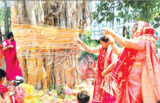
शहर में वट सावित्री व्रत के दौरान पूजा करती महिलाएं।

पीलीभीत। नगर के सुभाष नगर कॉलोनी स्थित श्री शनि देव मंदिर में आज वट सावित्री व्रत का पावन पर्व बेहद हर्षोल्लास और श्रद्धाभाव के साथ मनाया गया। हिंदू धर्म में विवाहित महिलाओं के लिए यह व्रत अखंड सौभाग्य का प्रतीक माना जाता है। इस अवसर पर क्षेत्र की बड़ी संख्या में सुहागिन महिलाओं ने पति की लंबी उम्र, सुख-समृद्धि और खुशहाल वैवाहिक जीवन के लिए निर्जला व्रत रखकर विशेष पूजा-अर्चना की। इस वर्ष वट सावित्री व्रत का महत्व कई गुना बढ़ गया, क्योंकि इस दिन शनि जयंती और शनिश्चरी आभासवत्या का अत्यंत दुर्लभ व शुभ संयोग बना। शनि देव मंदिर में यह त्रिवेणी संयोग