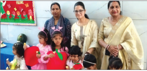
स्कूल में हुआ फ्रूट पार्टी का आयोजन।

हसनपुर। कोतवाली क्षेत्र के गांव में रिश्तों को धर्मसार करने वाला मामला सामने आया है। यहाँ एक कलथुगी ससुर द्वारा छोटी पुत्रवधु पर गलत नीयत रखने और विरोध करने पर पूरे परिवार को मारपीट कर घर से निकालने का संगीन आरोप लगा है। न्याय न मिलने पर पीड़िता ने प्रधानमंत्री को पत्र भेजकर सुरक्षा और कानूनी कार्रवाई की गुहार लगाई है। कोतवाली क्षेत्र के एक गांव निवासी पीड़िता ने बताया कि उसका पति अपनी छोटी पुत्रवधु पर बुरी नज़र रखता है। विरोध करने पर पति, बड़े बेटे और बड़ी बहू ने मिलकर पीड़िता, उसके छोटे बेटे, पुत्रवधु और अविवाहित पुत्री को लोहे की रॉड से पीटकर लहलुहान कर दिया और जान से मारने की धमकी देकर घर से निकाल दिया। 122 मार्च से पीड़ित परिवार अपनी जान बचाने के लिए गाँव से बाहर दर-दर की टोकरी खा रहा है। पीड़िता ने आरोपी पति, बड़े बेटे, वह बड़ी बहू के खिलाफ सख्त कानूनी कार्रवाई की मांग की है। पीड़िता का कहना है कि इससे पूर्व कोतवाली में एक तहरीर दी गई थी। जिस पर पुलिस ने कोई कानून कार्यवाही नहीं की। प्रधानमंत्री नरेंद्र मोदी को एक शिकायत पत्र भेजा है।