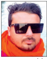
मृतक का फाइल फोटो।

पूरनपुर। बहन-बहनों के घरेलू विवाद में समझौता कराने गए युवक की लाठी डंडों से पीटकर हत्या कर दिए जाने का सनसनीखेज