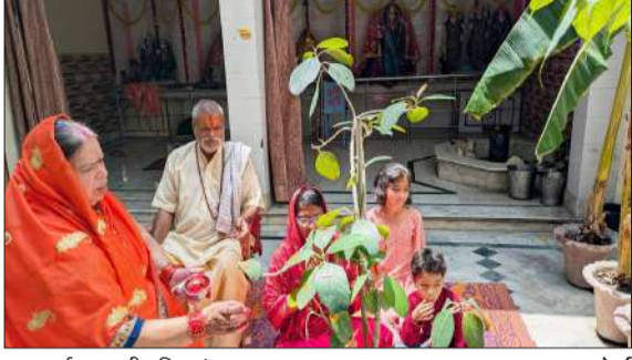
पूजा अर्चना करती महिलाएं।

पूजा कर महिलाओं ने पति की लंबी आयु की कामना की, वट अमावस्या का पर्व श्रद्धा और पारंपरिक उल्लास के साथ मनाया गया