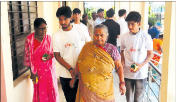
वृद्ध आश्रम में अनुभव आत्मक शिक्षण कार्यक्रम।

पीलीभीत। मेरा युवा भारत (मेरा भारत), के तहत 'वृद्धाश्रमों के साथ युवाओं की सहभागिता' विषय पर पांच दिवसीय अनुभववाचक शिक्षण कार्यक्रम का आयोजन 16 मई 2026 से 20 मई 2026 तक युवा कार्यक्रम एवं खेल मंत्रालय, भारत सरकार के तत्वावधान में वृद्ध सेवा संस्थान, बरहाम में किया जा रहा है।