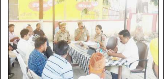
बैठक को संबोधित करती सीओ बिलासपुर।