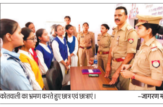
कोतवाली का भ्रमण करते हुए छात्र एवं छात्राएं।

1098 आदि की जानकारी दी। कहा कि कोतवाली में जो भी एफआईआर दर्ज होती है। उसका एक रिकॉर्ड तैयार किया जाता है। अपराधियों का एक अलग रजिस्टर होता है। उसमें अपराधियों के नाम और कितने मामले दर्ज हैं, सब अंकित किया जाता है। इस दौरान चौ. टीआर मेमोरियल पब्लिक स्कूल परिवार के द्वारा कोतवाली पुलिस को 25 पौधे भेंट किए गए।