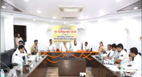
बैठक में बोलते सांसद।

रामपुर। जिला विकास एवं समन्वय समिति दिशा की बैठक विकास भवन सभागार में सपा सांसद मोहिबुल्लाह नदवी की अध्यक्षता में हुई बैठक में मनरेगा, प्रधानमंत्री सड़क योजना, प्रधानमंत्री ग्रामीण आवास योजना, स्वच्छ भारत मिशन, राष्ट्रीय ग्रामीण कार्यक्रम, प्रधानमंत्री कृषि सिंचाई योजना, प्रधानमंत्री फसल बीमा योजना, राष्ट्रीय खाद्य सुरक्षा योजना, किसान सम्मान निधि, राष्ट्रीय स्वास्थ्य मिशन, कौशल विकास मिशन एवं उद्यमिता सहित विभिन्न संचालित योजनाओं की समीक्षा की गई। सांसद ने सभी अधिकारियों को निर्देशित किया कि सरकार द्वारा संचालित योजनाओं का व्यापक प्रचार-प्रसार किया जाए। उनका जानकारी आम जनमानस तक