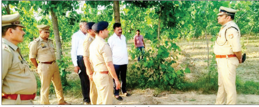
छात्रा का शव मिलने के मौके पर पहुंचकर जानकारी लेते अधिकारी।

बरेली। सीबीगंज थाना क्षेत्र में शनिवार दोपहर बाईपास के पास खेत में स्कूल ड्रेस पहने एक किशोरी का शव पड़ा मिला। खेतों की ओर गए ग्रामीणों ने जैसे ही किशोरी का शव देखा तो उनके होश उड़ गए। देखते ही देखते मौके पर लोगों की भीड़ जमा हो गई और पूरे इलाके में सनसनी फैल गई। सूचना मिलते ही सीबीगंज पुलिस मौके पर पहुंची और घटनास्थल को घेरकर जांच शुरू कर दी। मृत किशोरी की उम्र करीब 16 से 18 वर्ष बताई जा रही है। शव खेत में पड़ा था और उसके मुंह से खून बह रहा था। शरीर पर चोट के कई निशान भी मिले हैं। शुरुआती जांच में मामला हत्या का माना जा रहा है। आशंका जताई जा रही है कि किशोरी की कहीं और हत्या करने के बाद शव को सुनसान खेत में लाकर फेंका गया किशोरी ने स्कूल यूनिफॉर्म