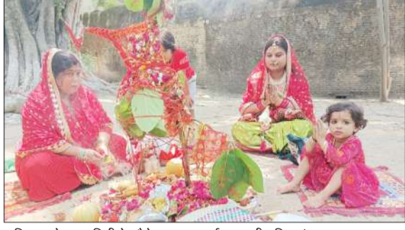
शनिवार को वट सवित्री के मौके पर पूजा अर्चना करती महिलाएं।

रामपुर। जिले भर में शनिवार को वट सवित्री पूजा का त्योहार धूमधाम से मनाया। महिलाओं ने पति की लंबी आयु के लिए वट सवित्री की पूजा की। शहर में स्थित मंदिर में वट वृक्ष की पूजा की गई। महिलाओं ने अपने पति की लंबी उम्र और सुखी जीवन की कामना की। महिलाओं ने बताया कि वे पति की लंबी आयु के लिए वट सवित्री की पूजा होती है। यह पूजा उनके लिए खास होती है। इस अवसर पर महिलाओं ने अपने पति के साथ मिलकर पूजा की।