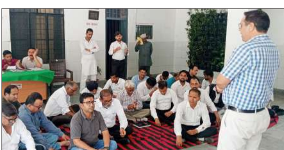
धरना देते कर्मचारी।