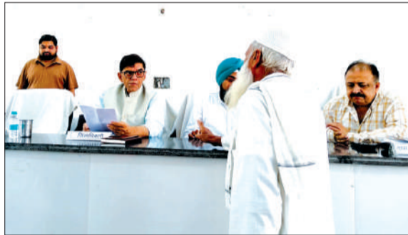
अमरिया में संपूर्ण समाधान दिवस पर शिकायत सुनते डीएम।