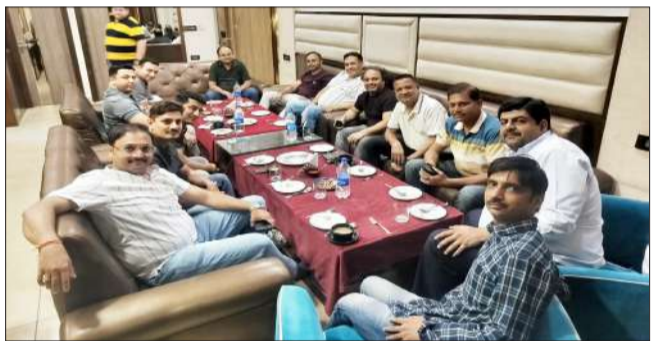
बैठक को संबोधित करते पदाधिकारी।

बैठक में कहा गया कि इस आवाह से लगभग 800 कारीगरों की रोजी रोटी प्रभावित हो सकती है। ज्वेलर्स की बैंक सी सी लिमिटेड प्रभावित होगी, सेल डाउन हो जाएगी, सेल डाउन होने से जी एस टी की अदायगी कम हो जाएगी इस से जीएस्टी विभाग के उत्पीड़न का भी अंदेशा है। सर्राफा व्यापार से लगभग 1000 परिवार जुड़े