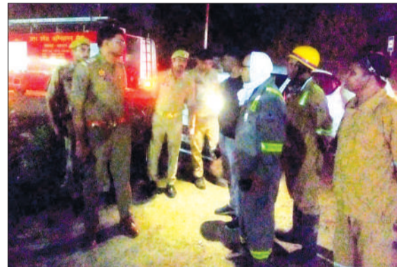
अमोनिया गैस रिसाव की सूचना पर मैथा फैक्ट्री पर पहुंची दमकल विभाग की टीम।

चन्द्रौसी। कोतवाली व बनियाठेर थाना क्षेत्रों में शुक्रवार की रात 10 बजे अमोनिया गैस रिसाव से लोगों में दहशत व्याप्त हो गई। सूचना पर प्रशासन अलर्ट हुआ और दमकल ने फैक्ट्रियों में पहुंच अमोनिया गैस की जानकारी ली। शिकायत पर एसडीएम ने भी प्रभावित क्षेत्रों का निरीक्षण किया। करीब दो घंटे तक लोग घरों से बाहर रहे। इसके बाद गैस का प्रभाव कम होने पर लोगों ने राहत महसूस की। कोतवाली क्षेत्र के प्रगति विहार, भगवती विहार, कृष्णा नगर व गांव अकबरपुर चितौरी व बनियाठेर क्षेत्र के अशोक नगर व गांव देवरखेड़ा में शुक्रवार की 10 बजे हड़कंप की स्थिति उत्पन्न हो गई।