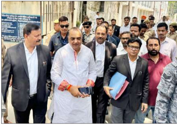
रमेशल एमपी-एमएलए न्यायालय से बाहर आते शहर विधायक।