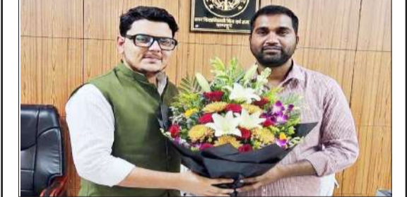
एडीएम को गुलदस्ता देते जिला प्रवक्ता।