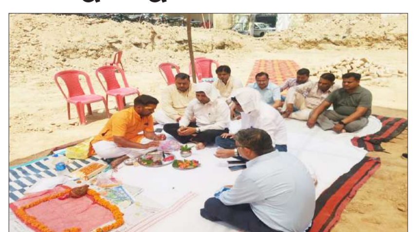
मिस्टन गंज स्थित भूमि-पूजन करते एक्सईएन।

रामपुर। शहर के बीच मिस्टनगंज में लोक निर्माण विभाग की खाली पड़ी जमीन पर कार्य शुरू करा दिया है। यहां पर लोक निर्माण विभाग प्रांतीय खंड 1000 गज जमीन पर कर्मचारियों के लिए 20 क्वार्टर (आवास) बनेंगे। इसके निर्माण पर करीब 1.80 करोड़ रुपये खर्च होंगे। नवाब के समय की इस जगह पर पहले लोक निर्माण विभाग का कार्यालय था। इसके बाद भारतीय स्टेट बैंक भी इस स्थान पर रही। बाद में यह जमीन खाली पड़ी है। खाली पड़ी जगह का अब उपयोग होगा। सबसे अहम बात यह है कि बीच शहर में खाली पड़ी खंडहर नुमा इस जगह के कारण गंदगी बढ़ रही