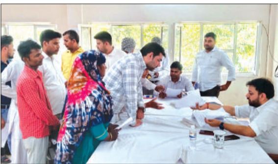
समाधान दिवस में शिकायतें सुनते अधिकारी।

हसनपुर। संपूर्ण समाधान दिवस में आए हुए फरियादियों की फरियाद उप जिलाधिकारी एवं पुलिस क्षेत्राधिकारी द्वारा सुनी गई। संपूर्ण समाधान दिवस में 27 शिकायतें दर्ज हुईं, जिसमें से तीन शिकायतों का मौके पर निस्तारण कर दिया गया तथा बाकी बची 24 शिकायतों को संबंधित विभाग के अधिकारियों को देकर जल्द निस्तारण करने के निर्देश दिए। शासन के निर्देश पर शनिवार को गांव कसनपुर माफी स्थित तहसील कार्यालय के सभागार में संपूर्ण समाधान दिवस का आयोजन किया गया। संपूर्ण समाधान दिवस में 27 उपाध्याय एवं पुलिस क्षेत्राधिकार पंकज त्यागी द्वारा