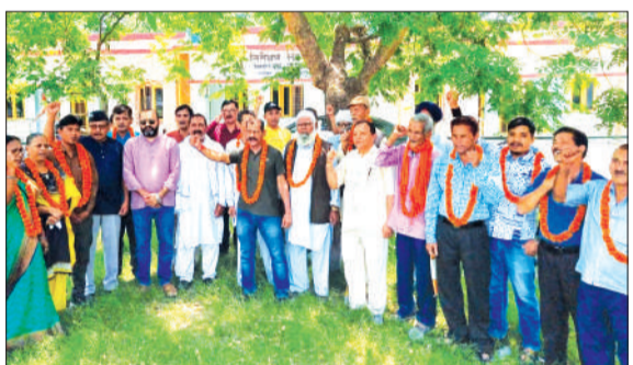
नवदिया बंकी की जमीन के मामले में किसानों ने किया प्रदर्शन।

पीलीभीत टाइगर रिजर्व (पीटीआर) की दिव्युरिया रेंज की नवदिया बंकी बीट जो शाहजहांपुर जिले में आती है। इसका 8.13 हैक्टर फलश शाहजहांपुर क्षेत्र में आता है। लेकिन देखरेख पीटीआर के अधीन है। इस भूमि पर कई लोगों ने अवैध कब्जा कर रखा है। भूमि पर फसलें भी उगाई जाती हैं। पीलीभीत टाइगर