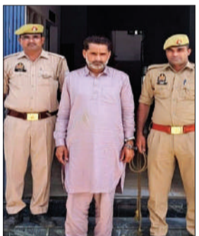
गिरफ्त में पूर्व ब्लाक प्रमुख का भाई।