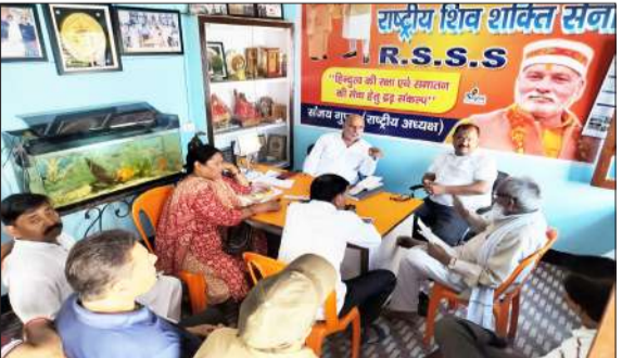
बैठक में बोलते राष्ट्रीय अध्यक्ष।