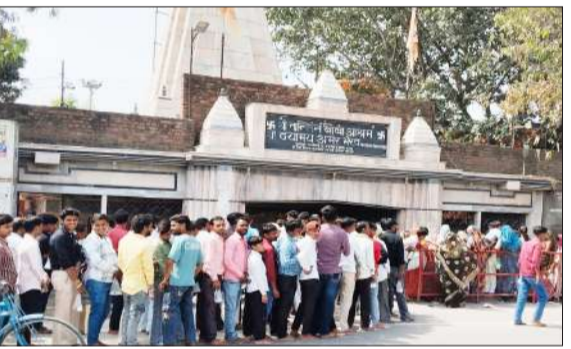
मंदिर में पूजा करने के लिए लम्बी भक्तों की भीड़।