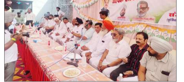
गांव गोदी में आयोजित जनसभा में शामिल अतिथि, वशिष्ठ अतिथि।