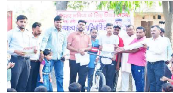
विजयी छात्र को पुरस्कार देते मुख्य अतिथि।