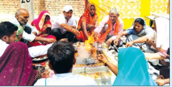
श्रीमद् भागवत कथा की समाप्ति पर हवन करते हुए।