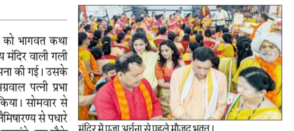
मंदिर में पूजा अर्चना से पहले मौजूद भक्त।