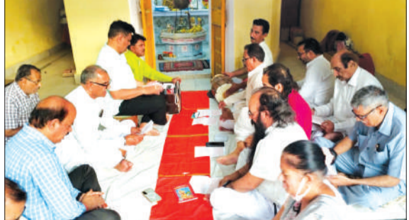
सुंदर कांड पाठ करते ट्रस्ट के पदाधिकारी।