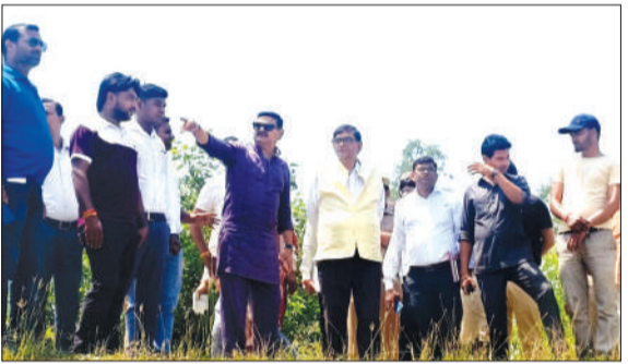
बाढ़ से हुए नुकसान का निरीक्षण करते हुए गन्ना मंत्री।