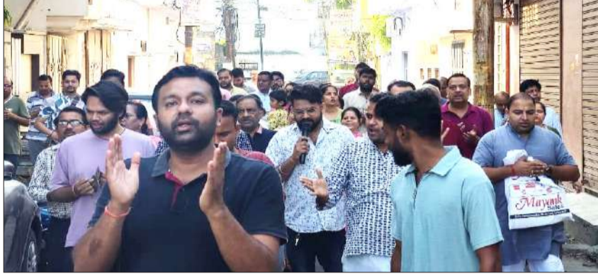
रविवार को प्रभात फेरी निकालते भक्त।

यह प्रभात फेरी आगामी श्रीनाथ जी रसकथा महोत्सव 18 से 21 जुलाई के निमंत्रण के लिए पूरे एक माह तक प्रतिदिन शहर की विभिन्न गलियों एवं मोहल्लों में निकाली जाएगी। यात्रा के माध्यम से शहर की हर गली में श्रीनाथ जी का नाम रस पहुंचाया जाएगा तथा घर-घर जाकर श्रद्धालुओं को श्रीनाथ जी रस कथा महोत्सव का निमंत्रण दिया जाएगा। प्रभात फेरी जोगी राम की बगिया मंदिर, तिलक