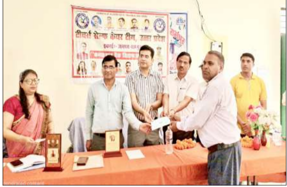
कन्यादान चेक प्रदान करते मुख्य अतिथि एवं विशिष्ट अतिथि। -जागरण मोर्चा

टीचर्स सेल्फ केयर टीम द्वारा दिवंगत शिक्षकों के परिवार को 55-55 लाख रूपए के सहयोग के अतिरिक्त कन्यादान के रूप में भी अपने वैध सदस्यों को आर्थिक सहयोग प्रदान किया जाता है। जिसमें जरूरत के मुताबिक टी एस सी टी के सदस्यों द्वारा स्वेच्छा से कन्या को मात्र 1 रूपये का आर्थिक सहयोग किया जाता है जो राशि एकत्रित होती है उसे कन्या के विवाह हेतु प्राप्त आवेदनों में सभी को बराबर बराबर बांट दिया