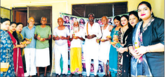
वृद्धजनों को खाद्य सामग्री वितरित करती मंडल की पदाधिकारी।