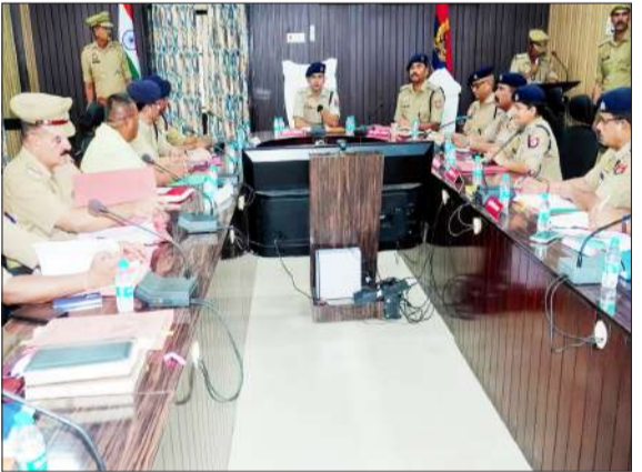
बैठक में बोलते एसपी।