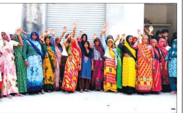
ग्रामीण महिलाएं प्रदर्शन करते हुए।

हसनपुर। कोतवाली क्षेत्र के गांव में महिलाओं द्वारा एकत्र होकर शराब की दुकान बंद कराने की मांग को लेकर महिलाओं ने नारेबाजी करते हुए प्रदर्शन किया और कहा कि जब से गांव में यह दुकान खुली है। घरों में रहना दुश्वार हो गया है। उन्होंने प्रशासन से जल्द से जल्द दुकान बंद कराने की मांग की है।