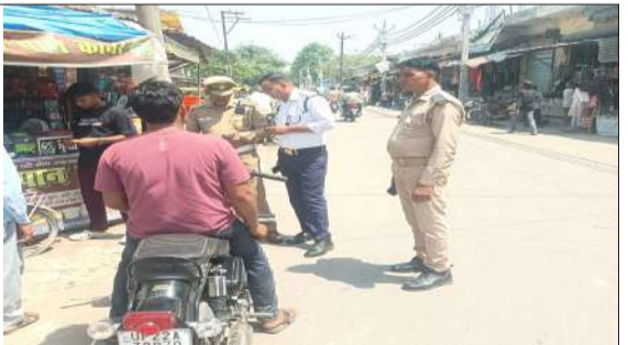
वाहनों को चेक करते ट्रैफिक पुलिसकर्मी।