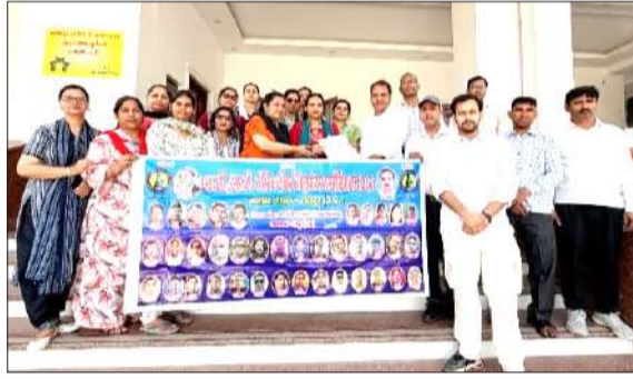
कलेक्ट्रेट में बैनर के साथ प्रदर्शन करते शिक्षक।

जनपद भेजा जाए। वरिष्ठता के आधार पर अनिवार्य लाभ दिया जाए। पति,पत्नी, दिव्यांग, गंभीर रोगियों के प्रकरणों का तत्काल निस्तारण हो। उच्च प्राथमिक विद्यालयों में कार्यरत प्रधानाध्यापक पिछले कई वर्षों से निष्ठापूर्वक शिक्षण कार्य कर रहे हैं। शासन के नियमानुसार 10 वर्ष की संतोषजनक सेवा पूर्ण करने पर शिक्षकों को चयन वेतनमान का लाभ देय है। खेद का विषय है कि चयन वेतनमान का लाभ नहीं मिलने से आर्थिक