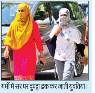
गर्मी में सर पर दुपट्टा ढक कर जाती युवतियां।

हसनपुर। नगर में बीते कुछ दिनों में बढ़ती हुई है, जिससे लोगों को दोपहर के समय तेज गर्मी और उमस का सामना करना पड़ा। मौसम में आए इस बदलाव ने लोगों की परेशानी बढ़ा दी है। खासकर दोपहर के समय सड़कों और बाजारों में आवाजाही कम दिखाई दी। सोमवार को सुबह से ही चिलचिलाती धूप ने लोगों को बेहाल कर दिया। दोपहर में गर्म हवाओं ने हालात और विकट बना दिए, जिसके चलते बाजारों और सड़कों पर लोगों की आवाजाही कम रही। लू के थपड़े से जनजीवन प्रभावित होने लगा है। दोपहर में लोग घरों के अंदर ही रहे और जरूरी काम होने पर ही लोग घरों से बाहर निकले। धूप से बचने के लिए लोग सिर पर टोपी लगाकर या छाता लगाकर घर से बाहर निकले। दोपहिया वाहन-पर सिर और भूख पर कपड़ा बांधकर जाते हुए नजर आए। पंखे व कूलर में भी लोगों को गर्मी से राहत नहीं मिली। मौसम के तेवर देखकर गर्मी और बढ़ने के आसार हैं।