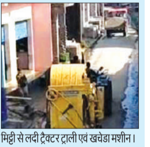
मिट्टी से लदी ट्रैक्टर ट्राली एवं खचेड़ा मशीन।