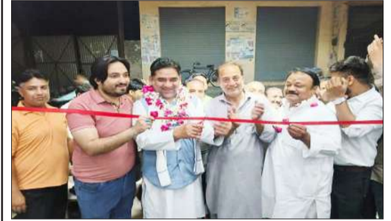
दोमहला रोड स्थित रेस्टोरेंट का फीता काटकर उद्घाटन करते समाजसेवी, सभासद।