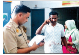
परिजनों से जानकारी करती पुलिस।

हसनपुर। गजरौला मार्ग पर रविवार रात अज्ञात वाहन की टक्कर से सफाईकर्मी की मौत हो गई। पुलिस ने शव कब्जे में लेकर पोस्टमार्टम को भेजा है। परिवार में कोहराम मचा हुआ है।