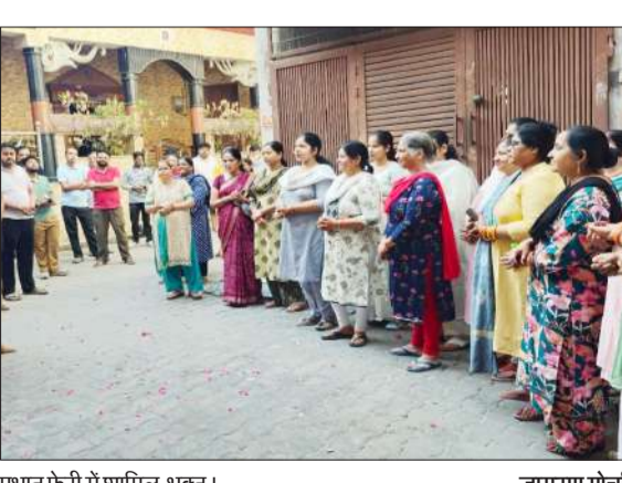
प्रभात फेरी में शामिल भक्त।

रामपुर। अधिक मास के पावन अवसर पर आगामी श्रीनाथ जी रसकथा महोत्सव के निमंत्रण स्वरूप शहर में प्रतिदिन प्रभात फेरी निकाली जा रही है। गौ सेवा परिवार एवं समस्त क्षेत्रवासियों के सहयोग से आयोजित इस प्रभात फेरी में श्रद्धालुओं का उत्साह लगातार बढ़ता जा रहा है। सोमवार प्रातः 6:30 बजे निकली प्रभात फेरी का विभिन्न मोहल्लों एवं गलियों में श्रद्धालुओं ने पुष्प वर्षा कर स्वागत किया। कई स्थानों पर महिलाओं, युवाओं एवं बुजुर्गों ने आरती उतारकर प्रभात फेरी का अभिनंदन किया। घर-घर जाकर श्रद्धालुओं को 18 से 21 जुलाई 2026 तक होने वाले श्रीनाथ जी रस कथा