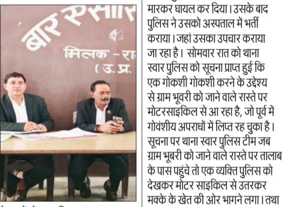
प्रशासनिक अधिकारी को ज्ञापन सौंपते अधिवक्ता।