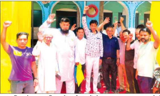
नगरपालिका के स्वास्थ्य विभाग में प्रदर्शन करते लोग।