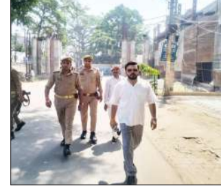
बचाने की एक सामान्य कवायद नहीं है, बल्कि आम जनमानस से लेकर पूरे प्रशासनिक अमले को ऊर्जा संरक्षण, पर्यावरण संतुलन और संसाधनों के संयमित उपयोग के प्रति जागरूक करने का एक बेहद सशक्त