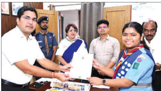
स्काउट एंड गाइड को राज्य पुरस्कार के प्रमाण पत्र देते डीएम।

उन्होंने सभी बच्चों का परिचय प्राप्त कर उन्हें बधाई दी और भविष्य में देश के सर्वोच्च राष्ट्रपति पुरस्कार को प्राप्त करने का लक्ष्य निर्धारित करने के लिए प्रेरित किया। जिलाधिकारी ने बच्चों का उत्साहवर्धन करते हुए कहा कि समाज और राष्ट्र निर्माण में स्काउट एंड गाइड की भूमिका अत्यंत महत्वपूर्ण है। उन्होंने जोर देकर कहा कि अनुशासन ही स्काउट्स और गाइड्स के जीवन की सबसे