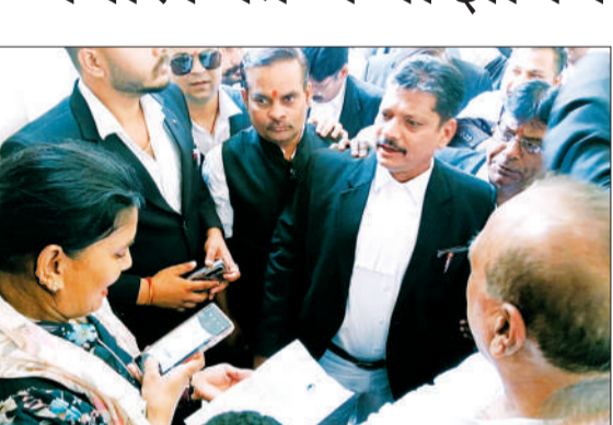
लखनऊ में हुए लाठी चार्ज के विरोध में ज्ञापन सौंपते वकील।