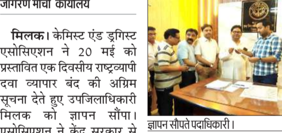
ज्ञापन सौंपते पदाधिकारी।

जागरण मोर्चा कार्यालय मिलक। केमिस्ट एंड ड्रगिस्ट एसोसिएशन ने 20 मई को प्रस्तावित एक दिवसीय राष्ट्रव्यापी दवा व्यापार बंद की अग्रिम सूचना देते हुए उपजिलाधिकारी मिलक को ज्ञापन सौंपा। एसोसिएशन ने केंद्र सरकार से हस्तक्षेप कर अवैध ई-फार्मों से संचालन पर रोक लगाने की मांग की है। ज्ञापन में कहा गया कि देशभर के लगभग 12.40 लाख केमिस्ट्स एवं वितरकों तथा उनसे जुड़े 4-5 करोड़ आश्रितों की आजीविका गंभीर संकट में है। अवैध ई-फार्मों से व अनियंत्रित मूल्य प्रतिस्पर्धा के कारण बिना पर्ची दवा विक्री, पर्ची का दुरुपयोग, एंटीबायोटिक्स का गलत उपयोग, नकली दवाएं