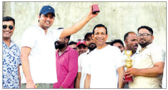
द वर्डेट स्कूल में क्रिकेट मैच में जीत की खुशी मनाते खिलाड़ी।

रहता है। लोगों ने रेलवे प्रशासन से सुरक्षा के पुख्ता इंतजाम कराने की मांग की है। थाना पुलिस ने बताया कि मामले की जांच की जा रही है। पोस्टमार्टम रिपोर्ट आने के बाद आगे की कार्रवाई की जाएगी। वहीं युवक की मौत से परिजनों का रो-रोकर बुरा हाल है। गांव में घटना के बाद शोक का माहौल बना हुआ है।