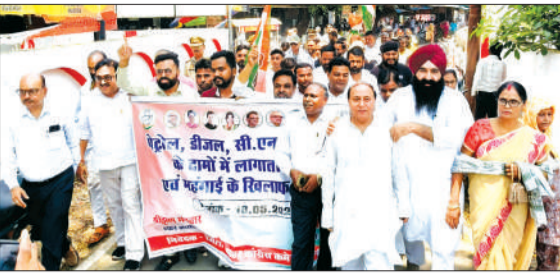
कमर तोड़ महंगाई के खिलाफ जुलूस निकालते कांग्रेसी।