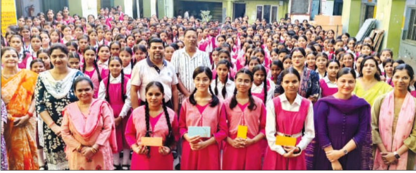
पुरस्कार पाकर खिले चेहरे के साथ सम्मानित छात्राएं एवं अन्य।