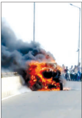
आग का गोला बनी कार।

घटना की सूचना मिलते ही दमकल विभाग की टीम मौके पर पहुंच गई। फायर कर्मियों ने आग बुझाने का काम शुरू कर दिया। पुल पर आग लगने की वजह से कुछ देर तक यातायात भी प्रभावित रहा। पुलिस ने मौके पर पहुंचकर लोगों को दूर हटाया और स्थिति को नियंत्रित किया। प्रारंभिक तौर पर कार में आग लगने की वजह शॉर्ट सर्किट यानी जा रही है। हालांकि दमकल विभाग और पुलिस पूरे मामले की जांच में जुटी है। गनीमत रही कि घटना में कोई जनहानि नहीं हुई।