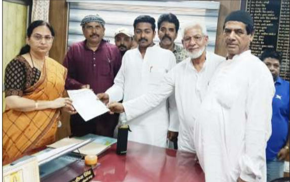
सीएमओ को ज्ञापन सौंपते व्यापारी।

रामपुर। सोमवार को उद्योग व्यापार प्रतिनिधि मंडल के युवा नेता पदाधिकारियों के साथ सीएमओ आफिस पहुंचे। उसके बाद मेडिकल कॉलेज की स्थापना को लेकर ज्ञापन सौंपा। व्यापारी कई सालों से इस मुद्दे को गंभीरता से उठा रहे हैं लेकिन उनकी सुनवाई पूरी नहीं हो रही है।