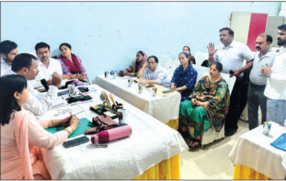
बोर्ड बैठक में ईओ से नोक झोंक करते सभासद।