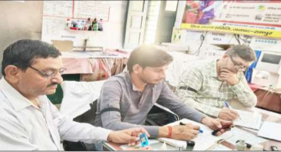
जिला क्षय रोग केंद्र में काली पट्टी बांधकर कार्य करते कर्मचारी।