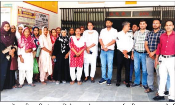
हाथ में काली पट्टी बांधकर विरोध जताते एनएचएम कर्मचारी।

हसनपुर। उत्तर प्रदेश राष्ट्रीय स्वास्थ्य मिशन संविदा कर्मचारी संघ के बैनर तले एनएचएम संविदा कर्मचारियों ने हाथ में काली पट्टी बांधकर सीएचसी गेट पर विरोध प्रदर्शन कर मार्च 2026 से लंबित मानदेय का भुगतान कराने की मांग की। 20 मई तक मानदेय नहीं मिलने पर कार्य बहिष्कार की चेतावनी दी।