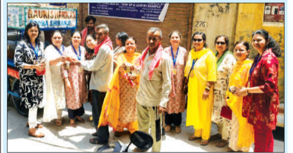
गन्ने का रस पिलाती इनर व्हील क्लब 'आस्था' की पदाधिकारी एवं सदस्याएं।

इनर व्हील क्लब ने राहगीरों को पिलाया गन्ने का रस, रिक्शा चालकों को बांटे अंगोछे