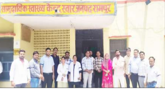
स्वार् सीएचसी में प्रदर्शन करते स्वास्थ्य कर्मी।

जिला अस्पताल समेत अन्य केंद्रों पर तैनात कर्मचारियों ने बांधी पट्टी जागरण मोर्चा, कार्यालय रामपुर। प्रदेश कार्यकारिणी के आह्वान पर एनएचएम कर्मचारियों ने पिछले तीन माह से मानदेय में मिलने पर काली पट्टी बांधकर विरोध जताया। यह विरोध प्रदर्शन 18, 19 और 20 तारीख तक