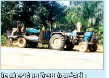
पेड़ को हटाने वन विभाग के कर्मचारी।