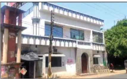
हाइवे पर अवैध रूप से बनी मस्जिद व मैरिज लॉन।