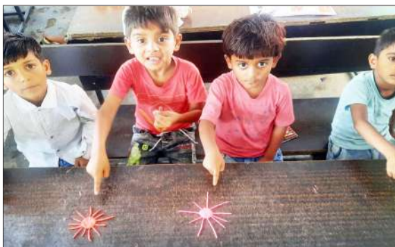
प्रतियोगिता में हिस्सा लेते छात्र-छात्राएं।

रामपुर। बच्चों में कलात्मक क्षमता का विकास और भारतीय भाषाओं के प्रति गौरव की भावना जागृत करने के उद्देश्य से मीना मंच के तत्वावधान में सोमवार को कंपोजिट उच्च प्राथमिक विद्यालय अलीपुर ठेका में प्राथमिक तथा उच्च प्राथमिक स्तर पर एक पोस्टर प्रतियोगिता का आयोजन किया। यह प्रतियोगिता वर्तमान में चल रहे भारतीय भाषा ग्रीष्मकालीन शिविर 2026 के आयोजित की। जिसमें विद्यालय के छात्र-छात्राओं ने पूरे उत्साह और ऊर्जा के साथ भाग लिया।