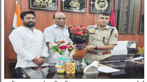
एसपी का स्वागत करते पदाधिकारी।

रामपुर। अपर पुलिस अधीक्षक अनुराग सिंह द्वारा मंगलवार को परेड की सलामी लेकर पुलिस लाइन का निरीक्षण किया। निरीक्षण के दौरान परेड में मौजूद कर्मचारियों का टर्नआउट आदि चेक कर पुलिस लाइन परिसर में स्थित भोजनालय, रीडिंग रूम (लाइब्रेरी), कैटीन, मनोरंजन कक्ष, म्यूजियम, जिम, आरटीसी कार्यालय, कैश कार्यालय, परिवहन शाखा की व्यवस्थाओं आदि का निरीक्षण कर पुलिस लाइन परिसर की साफ-सफाई आदि को चेक कर संबंधित को आवश्यक दिशा-निर्देश दिए। परेड के बाद अपर पुलिस अधीक्षक के नेतृत्व में दंगा नियंत्रण उपकरणों के साथ बलवा रोकथाम एवं कानून-व्यवस्था बनाए रखने के लिए विशेष रिहर्सल, ड्रिल का आयोजन कर सम्बन्धित को दिशा निर्देश दिए। इस दौरान क्षेत्राधिकारी लाइन, बिलासपुर मौजूद रहे।