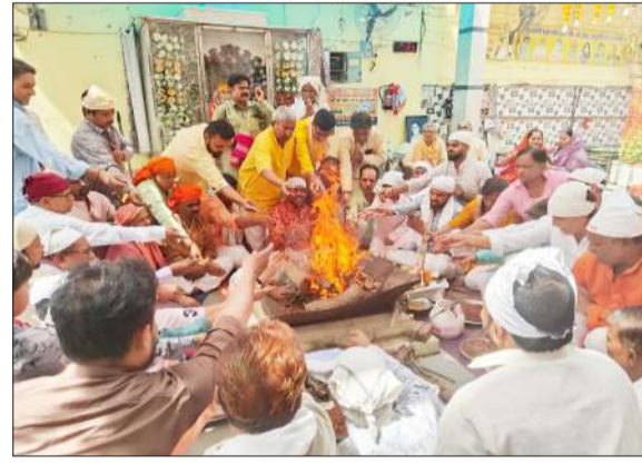
हवन में आहुति देते भक्त।

श्रद्धालुओं को भावविभोर कर दिया। श्री बालाजी म्यूजिकल ग्रुप द्वारा भी आकर्षक एवं मधुर प्रस्तुतियां दी गईं। मेरे संकट हर लो बालाजी, दरबार में तेरे आया हूं बालाजी, मेहंदापुर वाले दाता सुन लो पुकार, बालाजी का नाम बड़ा