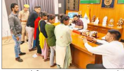
समस्याएं सुनते डीएम।