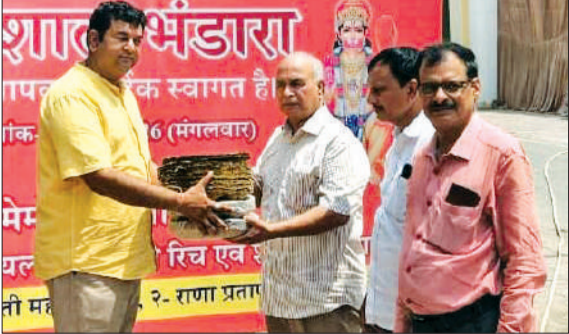
हरे पत्तल का वितरण करते संस्था के पदाधिकारी। -जागरण मोर्चा

बदायूं। धार्मिक आस्था के साथ पर्यावरण संरक्षण का संदेश देने वाली पंचतत्व संस्था ने बड़े मंगल के अवसर पर एक बार फिर समाज के सामने अनुकरणीय उदाहरण पेश किया। संस्था की ओर से इस बड़े मंगलवार को भी लखनऊ महानगर के विभिन्न क्षेत्रों में लगभग 25 हजार हरे पत्तलों और करीब 2000 पौधों का वितरण किया गया। संस्था की इस पहल का उद्देश्य बड़े मंगल के अवसर पर लगने वाले भंडारों को प्लास्टिक और थर्मोकॉल मुक्त बनाकर स्वच्छता, स्वास्थ्य और पर्यावरण संरक्षण के प्रति लोगों को जागरूक करना है।