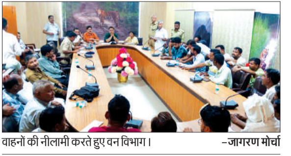
वाहनों की नीलामी करते हुए वन विभाग।