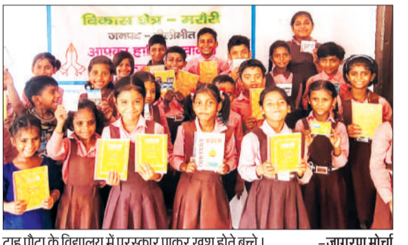
टाह पौटा के विद्यालय में पुरस्कार पाकर खुश होते बच्चे।

बैठक में निपुण भारत मिशन, विद्यार्थियों की पढ़ाई और ग्रीष्मकालीन अवकाश में घर पर नियमित अध्ययन को लेकर चर्चा हुई। अभिभावकों के मोबाइल में दीक्षा और रीड अलांग एप इंस्टॉल कर उनके उपयोग की जानकारी भी दी गई। विद्यालय की शैक्षणिक एवं भौतिक सुविधाओं पर भी