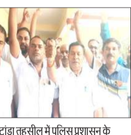
टांडा तहसील में पुलिस प्रशासन के खिलाफ नारे बाजी करते अधिवक्ता।