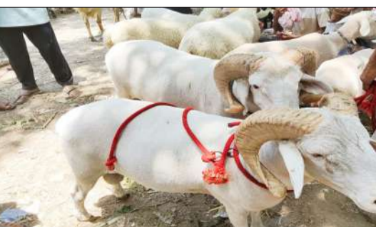
खौद की बाजार में कुर्बानी करने को खरीदारी करते लोग।

● बाजारों में बकरों की बिक रही कई नस्लों। जागरण मोर्चा, कार्यालय रामपुर। ईद उल अजहा का पर्व 28 मई को मनाया गया। रविवार की शाम चांद नजर आ गया। बकरेद पर मुस्लिम समुदाय द्वारा जानवरों की कुर्बानी दी जाती है जो हजरत इब्राहिम अलैहि अस्सलाम की सुन्नत है। इसको लेकर बाजारों में जानवरों की खरीदारी शुरू हो गई है। मंगलवार को खौद की बाजार में बकरों की खरीद फरोख्त में काफी उछाल देखने को मिला। बाजार में 15000 से सवा लाख रुपये का बकरे का मौजूद है। मंगलवार को चांद की पहली तारीख, और इस माह की 10 तारीख को ईद उल अजहा मनाई जाती है। इस बार जनपद में 28 को ईद उल अजहा मनाई जाएगी। बकरा और कटरा बाजारों में आ गए हैं। रविवार को पनवड़िया के बाजार में भी कुर्बानी करने वालों लोगों ने जानवरों की खरीदारी की। मंगलवार को खौद की बाजार में बकरों की खरीद फरोख्त हुई। जिसमें कई नस्लों के बकरे बाजार में मौजूद रहे। जिनको खरीदार देखकर आकर्षित हुए।