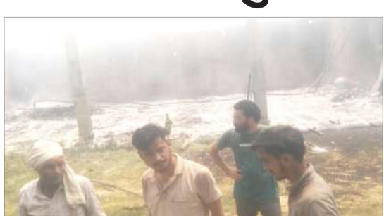
आग लगने के बाद मौके पर मौजूद लोग।