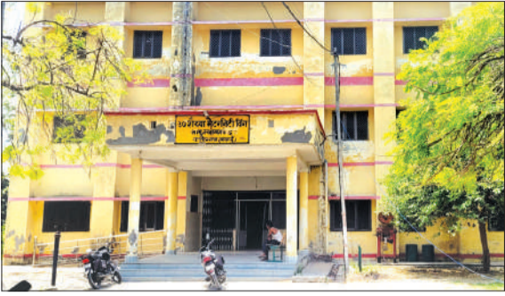
वजीरगंज सीएचसी परिसर में बनी मैटरनिटी विंग की इमारत।

वजीरगंज। दस वर्ष पूर्व लगभग डेढ़ करोड़ रुपये की लागत से सीएचसी परिसर में बना मैटरनिटी विंग महज शो पीस बनकर रह गया है, हॉस्पिटल में अभी तक न तो डॉक्टर और स्टाफ की तैनाती की गई है न ही मेडीकल उपकरण सहित कोई सामान ही आया है। खाली पड़ी इमारत में सीएचसी की एएनएम तथा नर्स महिलाओं को चिकित्सीय सुविधा उपलब्ध कराने की मात्र औपचारिकता ही निभा रही है जबकि उचित देखरेख के अभाव में तीन मंजिला इमारत कबाड़ होती जा रही है।