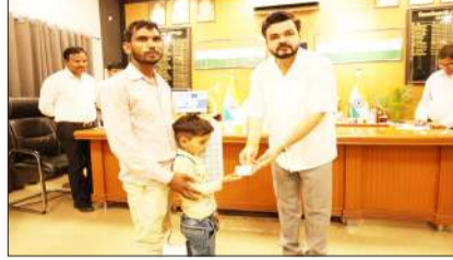
बालक को आयुष्मान कार्ड देते डीएम।

रामपुर। जनपद में जनसुनवाई अब सिर्फ शिकायतों की फाइलों तक सीमित नहीं है, बल्कि यह आर्थिक तंगी से जूझ रहे गरीबों के लिए जीवन रक्षक मंच बन चुकी है। जिलाधिकारी अजय कुमार द्विवेदी की अन्तुटी और संवेदनशील पहल के चलते कलेक्ट्रेट में फरियारियों को त्वरित समाधान के साथ 'आयुष्मान भारत प्रधानमंत्री जन आरोग्य योजना' का सीधा