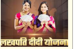
लखपति दीदी योजना

कार्यक्रम को परदर्शी और सुचारु रूप से चलाने में आजीविका सखियों (सीआरपी) की भूमिका सबसे अहम है। रिपोर्ट के मुताबिक, जिले में अब तक 567 आजीविका सीआरपी को सफलता के साथ ऑनबोर्ड किया जा चुका है। इनमें मिलक में सबसे ज्यादा 129, शाहबाद में 112 और बिलासपुर में 110 सीआरपी काम कर रही हैं। हालांकि, काम की तेज गति के बावजूद चौथी तिमाही जनवरी-मार्च के लिए निर्धारित शेष प्रविष्टियों को पूरा करने में अभी भी एक बड़ा अंतर दिखाई दे रहा है। आंकड़ों के अनुसार, कुल 25,951 संभावित दीदियों के विस्तृत डेटाबेस लगभग 88.15 प्रतिशत शेष डीएआर प्रविष्टियों को डिजिटल रजिस्टर में पूरी तरह से दर्ज करना अभी बाकी है। इस लक्ष्य को शत-प्रतिशत हासिल करने के लिए संबंधित अधिकारियों और कर्मचारियों को युद्धस्तर पर अभियान चलाकर काम करना होगा।