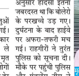
मृतक का फाइल फोटो।

में बोलरो चालक की मौत हो गई। के लिए भेज दिया पुलिस ने क्षतिग्रस्त जबकि कई यात्री मामूली रूप से घायल वाहनों को हाईवे से हटाकर यातायात हो गए प्रत्यक्षदर्शियों के अनुसार हादसा इतना जबरदस्त था कि बोलरो के परखच्चे उड़ गए। दुर्घटना के बाद हाईवे पर अफरा-तफरी मच गई। राहगीरों ने तुरंत पुलिस को सूचना दी। मौके पर पहुंची पुलिस और एंबुलेंस टीम ने घायलों को जिला अस्पताल पहुंचाया, जहां उनका उपचार कराया गया। बताया जा रहा है कि ट्रेवलर बस में सवार श्रद्धालु चारधाम यात्रा के लिए जा रहे थे। हादसे में बस सवार कई लोगों को हल्की चोट आई। मृतक की पहचान होने के बाद पुलिस ने शव को पोस्टमार्टम