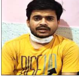
घायल प्रधानाचार्य।