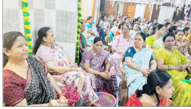
कथा में शामिल भक्त।