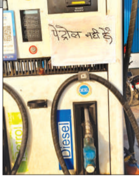
शिवशक्ति पेट्रोल पंप पर हुई तेल की खपत, नहीं मिल रहा है लोगों को तेल।

ऊपर से पेट्रोल ढूँढने के लिए एक पंप से दूसरे पंप के चक्कर काटने पड़ रहे हैं। कई जगह सिर्फ डीजल ही उपलब्ध है, जिससे पेट्रोल गाड़ियों वाले बीच रास्ते में फंसने को मजबूर हैं।