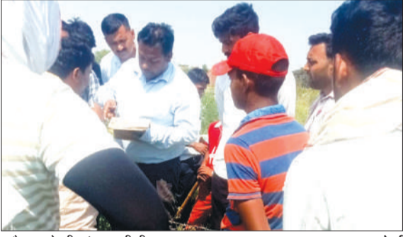
अवैध कब्जे की जांच करती टीम।