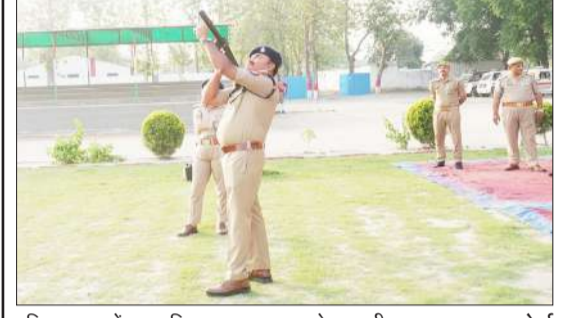
पुलिस लाइन में बलवा ड्रिल का अभ्यास करते एएसपी।