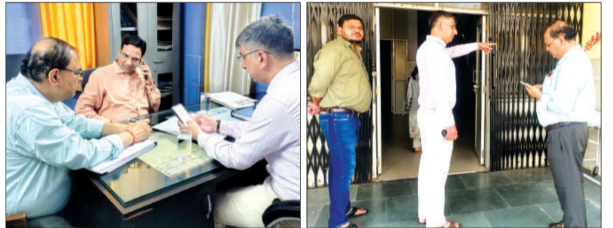
सीएचसी में चिकित्सकों से वार्ता करते एडीएम।

चन्द्रौसी। अपर जिलाधिकारी मंगलवार की सुबह 8 बजे सीएचसी का निरीक्षण करने पहुंचे। जिसमें उन्हें सीएचसी में ड्यूटी पर चिकित्सक मौजूद मिले। जबकि होम्योपैथिक चिकित्सालय बंद मिला। एडीएम ने सीएचसी में सभी वार्डों का निरीक्षण कर रजिस्ट्रों का निरीक्षण किया। इसके बाद दोपहर 2.20 बजे वह चले गए। एडीएम के निरीक्षण से चिकित्सकों के साथ-साथ समस्त स्टाफ में हड़कंप की स्थिति बनी है।