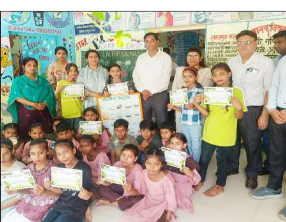
पुरस्कार के साथ मौजूद बच्चे मुख्य अतिथि और स्कूल का स्टॉफ। - जागरण मोर्चा

रामपुर। प्राथमिक विद्यालय लालपुर कला में 13 से 19 मई तक आयोजित सात दिवसीय भारतीय भाषा ग्रीष्मकालीन शिविर का समापन हुआ। शिविर का उद्देश्य बच्चों में भाषा कौशल, रचनात्मकता, सांस्कृतिक जागरूकता एवं सामाजिक व्यवहार का विकास करना था। प्रतिदिन दो घंटे संचालित इस शिविर में छात्र-छात्राओं ने बह-चढ़कर सहभागिता की। शिविर के दौरान बच्चों को खेल-खेल में शिक्षा प्रदान की गई। रोल प्ले, फ्लैश कार्ड, ऑडियो-विजुअल माध्यम, कठपुतली शो, नुक्कड़ नाटक, सामूहिक एवं एकल गायन, स्थानीय बाल गीत, चित्रकला, नृत्य