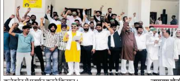
कलेक्ट्रेट में प्रदर्शन करते किसान।