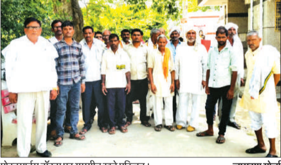
पोस्टमार्टम हॉटेल पर गमगीन खड़े परिजन। -जागरण मोर्चा

बदायूं। थाना फैजगंज बेहटा क्षेत्र के गांव महोरी में एक विवाहिता की संदिग्ध परिस्थितियों में मौत का मामला सामने आया है। घटना के बाद मृतका के मायके पक्ष ने ससुराल वालों पर मारपीट कर हत्या