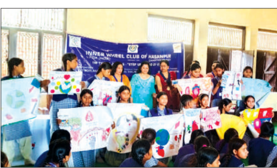
प्रतियोगिता के दौरान उपस्थित छात्राएं एवं क्लब पदाधिकारी।

हसनपुर। नगर स्थित एक विद्यालय में इनर व्हील क्लब ऑफ हसनपुर के द्वारा छात्राओं के बीच एक पोस्टर प्रतियोगिता का आयोजन कराया गया प्रतियोगिता में विजय छात्राओं को पुरस्कार भी दिए गए। मंगलवार को नगर के शिवाला मंदिर के सामने स्थित रामशरण दास परसोत्तम शरण बालिका इंटर कॉलेज की छात्राओं के बीच इनर व्हील क्लब ऑफ हसनपुर के द्वारा एक पोस्टर प्रतियोगिता का आयोजन कराया गया, पोस्टर प्रतियोगिता का विषय अंगदान था जिस पर सभी छात्राओं ने बहुत ही