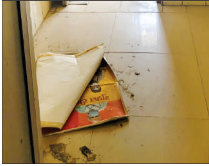
कमरों में जमा कूड़ा तथा कबाड़। -जागरण मोर्चा

आश्वासन भी दिया था, मगर उद्घाटन के दस वर्ष बाद भी इस विंग में अभी तक चिकित्सक और स्टाफ तो दूर आवश्यक मेडिकल उपकरण तक नहीं आये हैं, इस विंग में सीएचसी का जो स्टाफ कार्य कर भी रहा है उसके पास भी जरूरी उपकरण नहीं है, सीएचसी के पुराने बेड, गद्दे डालकर ही इलाज की औपचारिकता निभाई जा रही है, महिला चिकित्सक के अभाव में एएनएम तथा नर्सों द्वारा ही प्रसव कराया जाता है, कोई भी समस्या आने पर मरीज को तुरंत