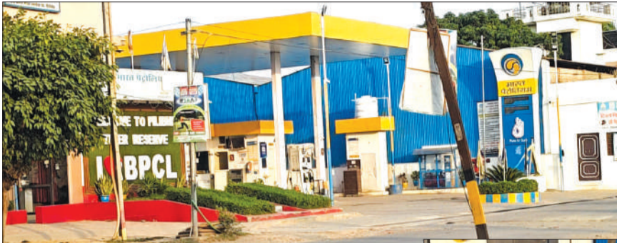
खाली पड़ा पेट्रोल पंप।

स्थानीय स्तर से सामने आई तस्वीरों में साफ देखा जा सकता है कि पेट्रोल पंप की मुख्य मशीनों पर हाथ से लिखा हुआ नोटिस "पेट्रोल नहीं है" चिपका दिया गया है। ऐसे में अपनी गाड़ियों में तेल भरवाने पहुंच रहे दुपहिया और चार पहिया वाहन चालकों को भारी निराशा का सामना करना पड़ रहा है। एक तो भीषण गर्मी