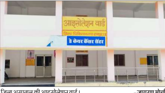
जिला अस्पताल की आइसोलेशन वार्ड।

जिले में अब कैंसर रोगियों को इलाज व दवाओं के लिए दूसरे जिले के चक्कर नहीं काटने होंगे। नेशनल हेल्थ मिशन की ओर से जल्द ही जिला अस्पताल में आठ बेड का कैंसर रोगियों के लिए डे-केयर सेंटर खुलेगा। यह