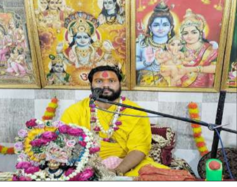
अग्रवाल धर्मशाला में आयोजित कथा सुनाते वाक।