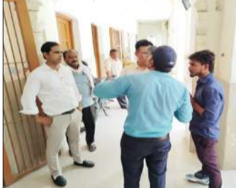
आईटीआई परिसर में छात्र से बातचीत करते शिक्षक।

रामपुर। आईटीआई (राजकीय औद्योगिक प्रशिक्षण संस्थान) में मंगलवार को छात्र का नाम काटने को लेकर हंगामा हुआ। संस्थान के परिसर में काफी देर तक चीख-पुकार मची रही। मौके पर मौजूद शिक्षकों ने छात्र को काफी समझाने का प्रयास किया। छात्र ने कहा कि आईटीआई प्रबंधन ने जानबूझकर