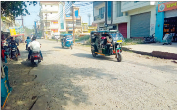
क्षतिग्रस्त मालगोदाम रोड से गुजरते वाहन।

चन्द्रौसी। माल गोदाम रोड की सड़क पूरी तरह क्षतिग्रस्त हो चुकी है। जिससे राहगीरों के साथ-साथ नागरिकों को आवागमन में परेशानी का सामना करना पड़ रहा है। सड़क क्षतिग्रस्त होने पर वाहनों में सवार लोगों को भी परेशानी उठानी पड़ती है। माल गोदाम रोड पर आंबेडकर प्रतिमा से सिपाही लाल पेट्रोल पंप तक सड़क सबसे ज्यादा खस्ता हाल है। नगर पालिका द्वारा उक्त सड़क का निर्माण कार्य शीघ्र प्रारंभ कराया जाएगा। मालगोदाम रोड की सड़क शहर से बाहर जाने वाले के लिए मैन सड़क है। इस मार्ग का इस्तेमाल लोग शहर से बाहर निकलने के लिए करते हैं। अगर