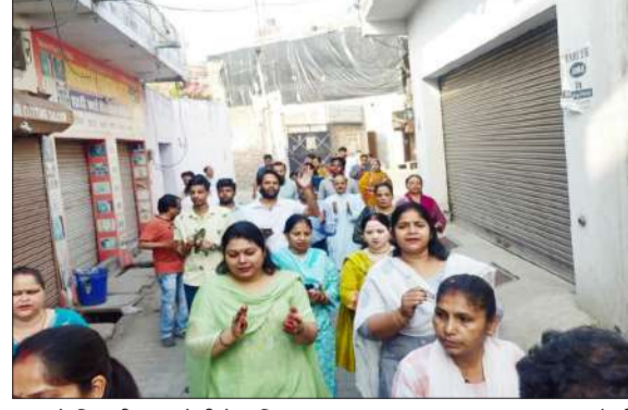
शहर में निकली प्रभात फेरी में शामिल भक्त।

रामपुर। अधिक मास के पावन अवसर पर आयोजित होने वाले श्रीनाथजी रसकथा महोत्सव के दौरान रोजाना निकाली जा रही मधुर यात्रा का मंगलवार को तीसरे दिन भी आयोजन हुआ। यात्रा रस्तोगी धर्मशाला से प्रारम्भ होकर विभिन्न मार्गों से होती हुई हनुमान मंदिर पर विश्राम हुई। प्रभात फेरी में भक्तों की श्रद्धा देखते ही बन रही थी। कोई नंगे पैर प्रभु की सेवा में चल रहा था तो कोई हाथों में पुष्प लेकर यात्रा के स्वागत के लिए दौड़ा चला आया। जगह-जगह श्रद्धालुओं ने पुष्प वर्षा कर यात्रा का स्वागत किया और श्रीनाथजी के जयकारों