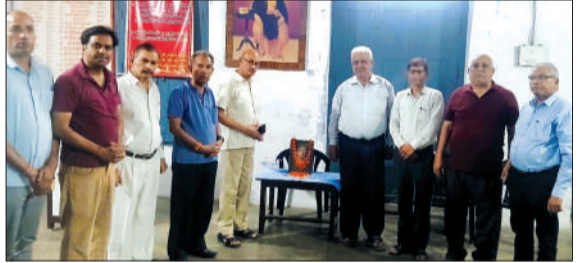
सनातन जागरण मंच की बैठक में उपस्थित पदाधिकारी।

को सम्मानित किया गया। इस मौके पर पीएचएफ विद्यापीठ के बच्चों को बैग, यूनिफॉर्म, जूते-मोजे और स्टडी किट वितरित की गई। साथ ही सदस्यों ने 25,000 का नकद राशि देकर पांच बच्चों की शिक्षा की जिम्मेदारी गोद ली।