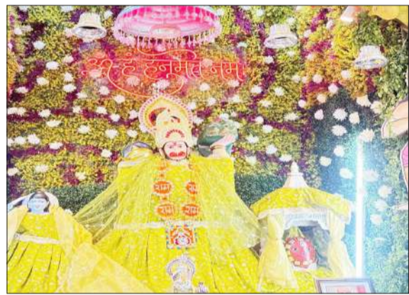
सजा बाला जी का दरबार।

रामपुर। मोहल्ला झंडा स्थित श्री बाला जी दरबार सेवा सदन में मंगलवार को श्रद्धा और भक्ति के साथ श्री बाला जी महाराज का धार्मिक आयोजन सम्पन्न हुआ। कार्यक्रम की शुरुआत प्रातः काल श्री बाला जी के विशेष स्नान एवं हवन, पूजन से हुई। वैदिक मंत्रोच्चारण के बीच ब्राह्मणों द्वारा विधि, विधान से पूजन कराया गया, जिससे पूरा वातावरण भक्तिमय हो उठा। बड़ी संख्या में श्रद्धालुओं ने पूजा, अर्चना में भाग लेकर सुख-समृद्धि की कामना की।