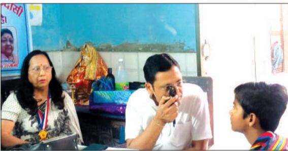
नेत्र प्रशिक्षण करते चिकित्सक।