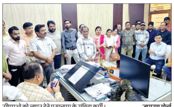
सीएमओ को ज्ञापन देते एनएचएम के संविदा कर्मी।

पीलीभीत। संयुक्त राष्ट्रीय स्वास्थ्य मिशन (एनएचएम) कर्मचारी संघ उत्तर प्रदेश ने मार्च 2026 से लंबित वेतन के तत्काल भुगतान की मांग को लेकर मुख्य चिकित्सा अधिकारी के माध्यम से मिशन निदेशक को ज्ञापन सौंपा है। कर्मचारियों ने चेतावनी दी है कि यदि 25 मई तक उनका बकाया मानदेय जारी नहीं किया गया, तो वे लखनऊ में उपमुख्यमंत्री व स्वास्थ्य मंत्री के आवास का शांतिपूर्ण घेराव करेंगे।