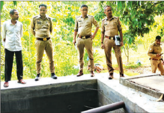
घटना के बाद पुलिस जानकारी करते हुए।