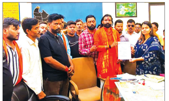
भूसे को बाहर भेजने पर रोक को लेकर मांग पत्र देते अखिल भारत हिन्दू महासभा के कार्यकर्ता।

पीलीभीत। अखिल भारत हिन्दू महासभा ने जनपद से बड़े पैमाने पर बाहरी जिलों में भेजे जा रहे भूसे पर चिंता जताते हुए जिलाधिकारी और पुलिस अधीक्षक को मांग पत्र सौंपकर तत्काल रोक लगाने की मांग की है। संगठन का कहना है कि यदि समय रहते नियंत्रण नहीं किया गया तो जिले की गौशालाओं में संरक्षित गोवंशों के सामने चारे का गंभीर संकट खड़ा हो सकता है। महासभा पदाधिकारियों के अनुसार गेहूँ कटाई के बाद बाहरी व्यापारी गांव-गांव जाकर किसानों से अधिक कीमत का लालच देकर भारी मात्रा में भूसा खरीद रहे हैं। आरोप है कि रात के समय बड़े ट्रालों के जरिए भूसा जिले से बाहर भेजा जा रहा