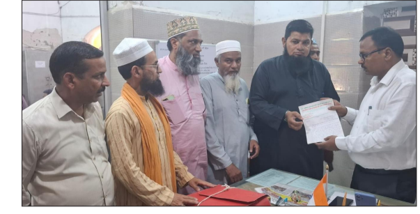
नगर पालिका के ईओ को ज्ञापन सौंपते मुस्लिम समाज के लोग।