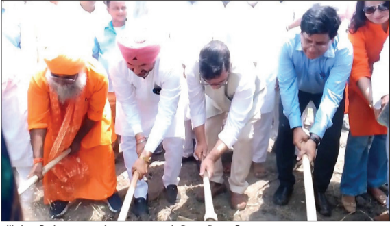
माँ गोमती सेवा यज्ञ में श्रमदान करते जिलाधिकारी व अन्य।