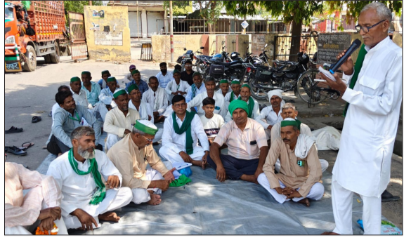
बैठक में उपस्थित किसानों को संबोधित करते किसान नेता।