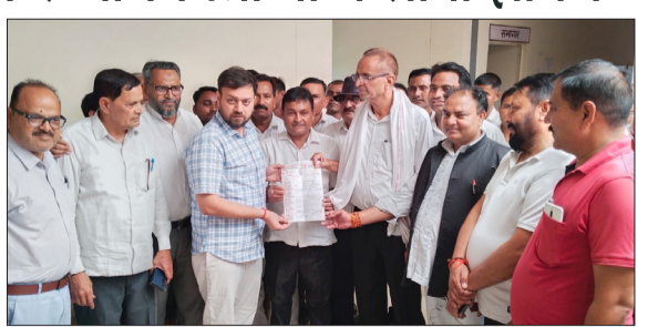
अपनी मांगों से संबंधित ज्ञापन सौंपते हुए अधिवक्ता।