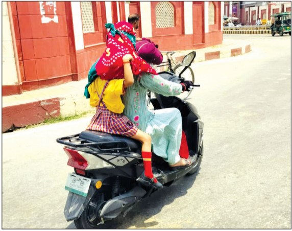
धूप से बचने को गांधी समाधि पर बच्चों को ढककर लेकर जाती मां।

रामपुर। जिले में धूप और लू के थपेड़ों से लोग दिनभर परेशान रहे। तेज धूप के कारण सड़कों पर सन्नाटा पसरा रहा। वहीं शाम पांच बजे के बाद जब धूप कम हुई। तब सड़कों पर चहल-पहल बढ़ी। बुधवार को अधिकतम तापमान 50 डिग्री सेल्सियस दर्ज किया। इस दौरान सरकारी कार्यालयों में भी आम लोगों की उपस्थिति कम रही। कर्मचारी कुलर के सहारे गर्मी से राहत पाने में जुटे रहे। तेज धूप और लू के थपेड़ों से बचने के लिए राहगीर