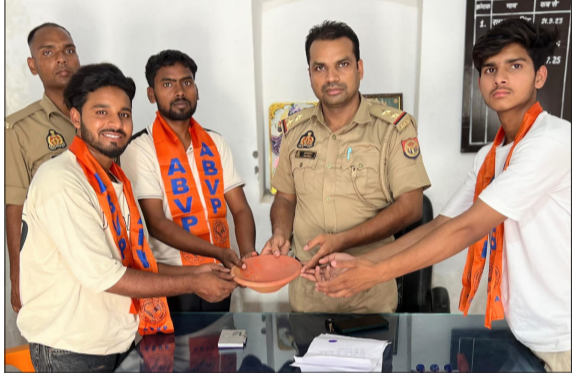
उपनिरीक्षक को सकोरा भरते अभाविक के कार्यकर्ता।

चन्दौसी। अखिल भारतीय विद्या परिषद की नगर इकाई की ओर से सकोरा अभियान चलाया गया। अभाविक के पदाधिकारियों ने विभिन्न स्थानों पर पहुंचते हुए धूप व गर्मी से व्याकृत पक्षियों के पानी पीने के लिए सकोरे वितरित किए। इस अभियान का उद्देश्य भीषण गर्मी के मौसम में पक्षियों को पानी उपलब्ध कराना व समाज में जीव-जन्तुओं के प्रति संवेदनशीलता का संदेश देना है। बताया गया कि विद्यार्थी परिषद प्रत्येक वर्ष ग्रीष्मकाल में यह अभियान संचालित करती है, जिसके माध्यम से विद्यार्थियों एवं आमजन को पक्षियों और पर्यावरण के प्रति जागरूक किया जाता है। कार्यकर्ताओं ने लोगों से अपने