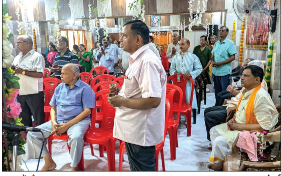
कथा में मौजूद भक्त।