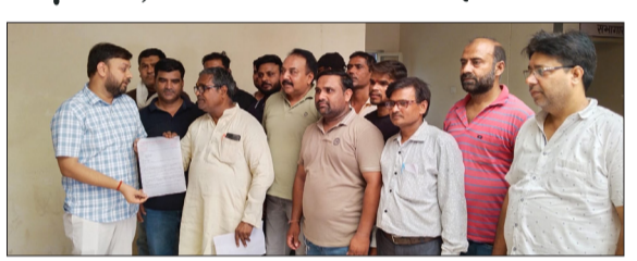
दवा बिक्रेता एसडीएम को ज्ञापन देते हुए।