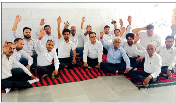
बिलासपुर में धरना देते अधिवक्ता। -जागरण मोर्चा

लायर्स वेल्फेयर एसोसिएशन से जुड़े अधिवक्ताओं ने बुधवार को भी सुबह करीब 11 बजे तहसील के मुख्य भवन में एसडीएम कार्यालय के बाहर दरी बिछाई और धरने पर बैठ गए। इसके उपरांत वकीलों ने नारेबाजी