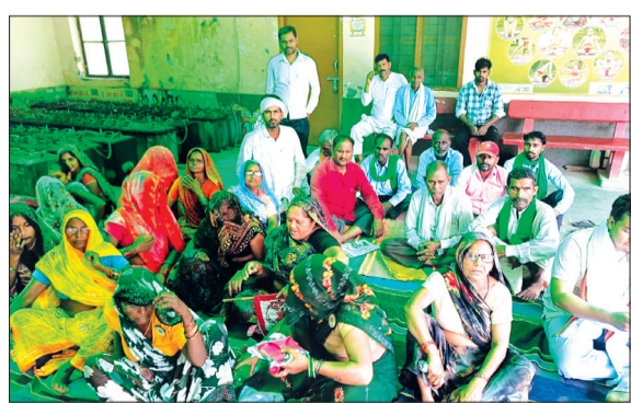
धरना देते भाकियू भानू गुट।

पूरनपुर। भारतीय किसान यूनियन (भानू गुट) के कार्यकर्ताओं ने बुधवार को पूरनपुर तहसील परिसर में घरेलू गैस सिलेंडर की बढ़ती कीमतों, देशव्यापी महंगाई और किसानों की विभिन्न जलंत समस्याओं को लेकर जोरदार धरना-प्रदर्शन किया। इस दौरान संगठन के पदाधिकारियों और कार्यकर्ताओं ने केंद्र व प्रदेश सरकार के खिलाफ जमकर नारेबाजी की। धरने को संबोधित करते हुए वक्ताओं ने कहा कि लगातार बढ़ती महंगाई ने आम जनता और किसानों का जीना दुश्वार कर दिया है। घरेलू रसोई गैस सिलेंडर के दाम आसमान छू रहे हैं, जिससे गरीब और मध्यमवर्गीय परिवारों का बजट