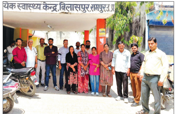
काली पट्टी बांधकर विरोध जताते संविदा कर्मी।

इसके पश्चात सभी कर्मचारियों ने अपने हाथों पर काली पट्टी बांधकर कार्य किया। आक्रोशित कर्मचारियों ने बताया कि उनका कई माह मानदेय लंबित पड़ा है, इसके