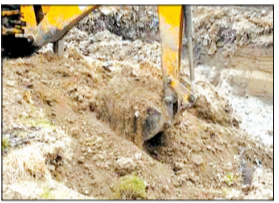
जेसीबी से कटी गैस पाइप लाइन।

पीलीभीत। निरंजन कुंज कॉलोनी में पिछले कई दिनों से चल रहे खुदाई कार्य के दौरान सोमवार को बड़ा हादसा होते-होते टल गया। कॉलोनी में जेसीबी मशीन से की जा रही खुदाई के दौरान वहां से गुजर रही चालू गैस पाइपलाइन कट गई, जिससे इलाके में गैस रिसाव का खतरा पैदा हो गया और लोगों में दहशत फैल गई। स्थानीय लोगों के अनुसार कॉलोनी में पिछले पांच-छह दिनों से बिना पर्याप्त सुरक्षा इंतजाम और रूट मीपिंग के लगातार गड्ढे खोदे जा रहे हैं। आरोप है कि संवेदनशील कार्य के बावजूद मौके पर गैस कंपनी का कोई तकनीकी कर्मचारी या सुरक्षा सुपरवाइजर मौजूद नहीं था। पाइपलाइन कटने के कार्पा देर