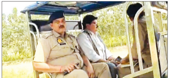
शाहबाद में ई रिक्शा में बैठकर ग्राम चौपाल में पहुंचे सीओ और बीडीओ।

शिकायत के बाद भी बिजली विभाग ट्रांसफार्मर बदलने की कोई सुध नहीं ले रहा है, जिससे ग्रामीणों में विभाग के प्रति भारी आक्रोश है। बुधवार को ग्रामीणों के सब्र का बांध टूट गया। दर्जनों की संख्या में ग्रामीण धमोरा बिजली घर पर एकत्र हुए और फूंके ट्रांसफार्मर को जल्द बदलने की मांग को लेकर बिजली विभाग के खिलाफ जोरदार हंगामा शुरू कर दिया। ग्रामीणों का आरोप है कि चार दिन से ट्रांसफार्मर फुंका पड़ा है, लेकिन विभागीय कर्मचारी शिकायत को लगातार अनदेखा कर रहे हैं। ग्रामीणों ने चेतावनी दी है कि यदि जल्द ही नया ट्रांसफार्मर नहीं लगाया गया, तो वे बड़े आंदोलन के लिए बाध्य होंगे।