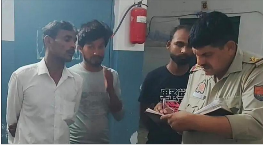
मृतक के परिजनों से जानकारी करती पुलिस।