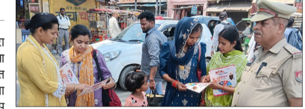
स्टेशन पर महिलाओं को जागरूक करती एंटी रोमियो टीम।