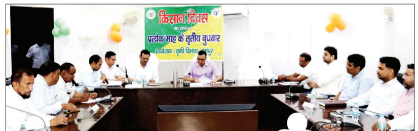
किसानों की समस्याएं सुनते सीडीओ।

मुख्य विकास अधिकारी ने किसान दिवस में किसानों की समस्याओं को सुना। संबंधित विभागीय अधिकारियों को उनके त्वरित एवं प्रभावी निस्तारण के निर्देश दिए। मुख्य विकास अधिकारी ने किसानों से अपील करते हुए कहा कि सभी किसान अपनी फैमिली आईडी एवं फार्मर रजिस्ट्री अनिवार्य रूप से बनवा लें, जिससे उन्हें शासन की विभिन्न कल्याणकारी योजनाओं का लाभ समय पर