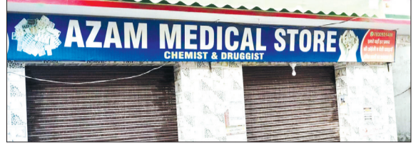
दवाखानों में केमिस्ट एसोसिएशन के आह्वान पर बंद पड़ा मेडिकल स्टोर।