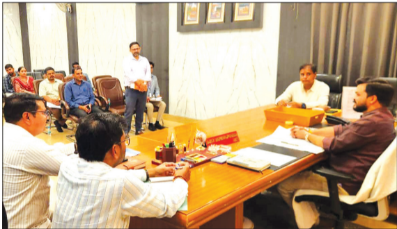
बिजली अधिकारियों के साथ बैठक करते डीएम।

बैठक के दौरान विद्युत आपूर्ति की वर्तमान स्थिति, उपभोक्ताओं को आ रही समस्याओं, ट्रांसफार्मरों की कार्यक्षमता, फाल्ट निस्तारण व्यवस्था, लाइन लॉस, उपकेंद्रों की कार्यप्रणाली तथा फील्ड स्तर पर संचालित व्यवस्थाओं की विस्तार से समीक्षा की गई। जिलाधिकारी ने निर्देशित किया कि जनपद में बिजली आपूर्ति व्यवस्था को हर स्थिति में सुचारू बनाए रखा जाए