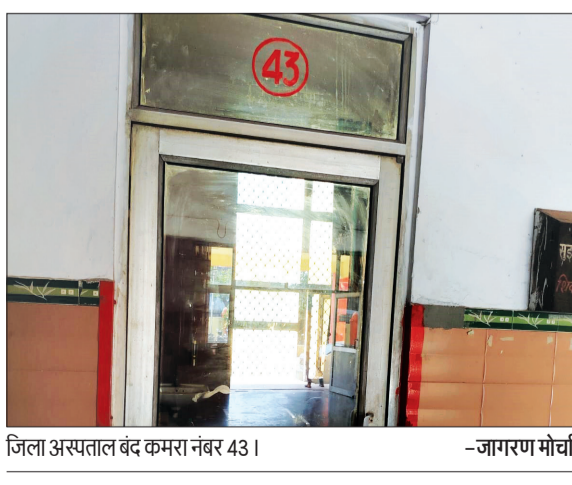
जिला अस्पताल बंद कमरा नंबर 43।

रामपुर। जिला अस्पताल में रोगियों की ईसीजी, ब्लड प्रेशर, शुगर की जांच कमरा नंबर 2 में नहीं, बल्कि 41 नंबर में होगी। जबकि 41 नंबर पहले रोगियों के एंटी रबीज के टीके लगते हैं। अब टीके कमरा नंबर 43 में लगेगा। यह परिवर्तन बुधवार से जिला अस्पताल प्रशासन से किया गया है। जबकि मौजूदा समय में अभी कमरा नंबर 2 पूर्ण रूप से खाली हो गया है यहां का सारा सामान 41 नंबर में शिफ्ट कर दिया गया है।