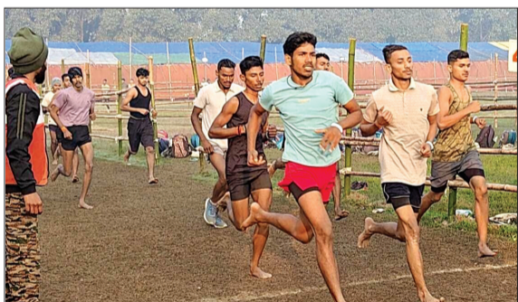
भर्ती के लिए दौड़ते युवक।

बरेली। सेना में भर्ती होकर देश सेवा का सपना देखने वाले युवा पहलवानों के लिए बड़ी खबर है। बरेली के जाट रेजिमेंट सेंटर स्थित आर्मी बॉयज स्पोर्ट्स कंपनी की ओर से देशभर के प्रतिभाशाली कुश्ती खिलाड़ियों के लिए विशेष भर्ती रैली आयोजित की जा रही है। यह भर्ती रैली चार जून से छह जून तक चलेगी, जिसमें ग्रीको रोमन और फ्री स्टाइल कुश्ती के होनहार खिलाड़ियों का चयन किया जाएगा। भर्ती प्रक्रिया में वही खिलाड़ी शामिल हो सकेंगे जिनकी आयु चार जून 2026 को आठ से 14 वर्ष के बीच होगी। विभाग की ओर से जारी जानकारी के अनुसार अभ्यर्थी का जन्म चार जून 2012 से छह जून 2018 के बीच होना चाहिए। सेना की इस स्पोर्ट्स कंपनी में चयन