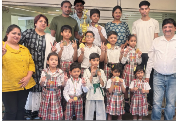
ताइक्वांडो खिलाड़ियों का उत्साहवर्धन करता विद्यालय स्टाफ।