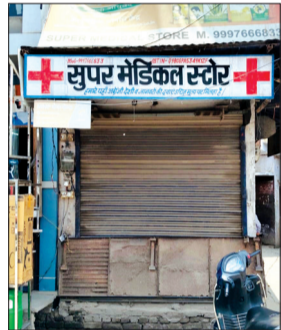
पीलीभीत में खुले हुए और बंद मेडिकल स्टोर।