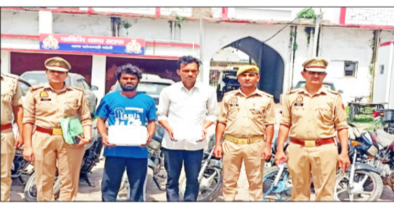
पुलिस की गिरफ्त में आरोपी।

बरेली। शहर में बाइक चोरी कर नंबर प्लेट बदलकर बेचने वाले दो शांति बदमाशों को कोतवाली पुलिस ने गिरफ्तार किया है। दोनों आरोपी चोरी की बाइक बेचने के लिए चौपाला की तरफ से स्टेशन रोड पहुंच रहे थे। पुलिस ने घेराबंदी कर उन्हें दबोच लिया। तलाशी में एक आरोपी के पास से अवैध तमंचा और कारतूस, जबकि दूसरे के पास से चाकू बरामद हुआ। पूछताछ के बाद पुलिस ने रेलवे स्टेशन के आगे झाड़ियों और खंडहरों में छिपाकर रखी गई सात मोटरसाइकिल और एक स्कूटी भी बरामद की है। पुलिस अब गिरोह के नेटवर्क और चोरी के वाहनों की खरीद-फरोख्त करने वालों की तलाश में जुटी है। शुक्रवार देर रात कोतवाली पुलिस जंक्शन रोड चौकी क्षेत्र में गश्त और सदिग्ध वाहनों की चेकिंग कर रही थी। इसी दौरान