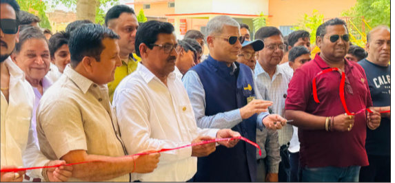
कंप्यूटर लैब का शुभारंभ करते हुए।

कार्यक्रम का शुभारंभ मुख्य अतिथियों एवं गणमान्य अतिथियों द्वारा दीप प्रज्वलन एवं फंता काटकर किया गया। इस अवसर पर विद्यालय के छात्र-छात्राओं द्वारा स्वागत गीत एवं सांस्कृतिक कार्यक्रम प्रस्तुत किए