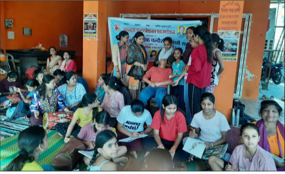
समर कैंप में बालिकाओं को फेशियल सिखाती प्रशिक्षिका।