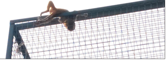
पानी की टंकी के जाल में फंसकर बंदर के बच्चे की हुई मौत।