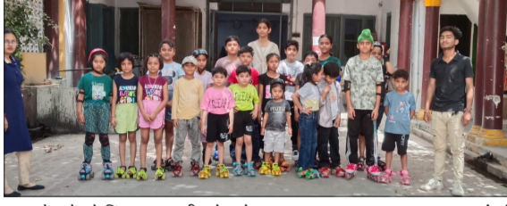
समर कैंप में स्केटिंग चलाना सीखते बच्चे।

चन्द्रौसी। एबीसी किड्स मांटेसरी स्कूल की ओर से समर कैंप का आयोजन किया जा रहा है। शनिवार को समर कैंप के तीसरे दिन बच्चों में सीखने, खेलने व नई गतिविधियों को अपनाने का अद्भुत उत्साह देखने को मिला। विद्यालय परिसर में बच्चों की मुस्कान, रचनात्मक व ऊर्जा के सराबोर दिखाई दिया। बच्चों ने पूरे आत्मविश्वास एवं जोश के साथ विभिन्न गतिविधियों में भाग लेकर अपनी प्रतिभा का प्रदर्शन किया। समर कैंप में अंतर्गत बच्चों को योगा, बॉलीवुड एवं हॉलीवुड डांस, आर्ट एवं क्रफ्ट, स्केचिंग, इनडोर गेम्स, क्ले एवं फेब्रिक पेंटिंग, बेस्ट आउट वेस्ट, हैंडराइटिंग एवं कैलिग्राफी, मेंटल मैथ्स, स्केटिंग, ताइक्वांडो तथा पर्सेनैलिटी डेवलपमेंट जैसी गतिविधियों का प्रशिक्षण दिया गया। डांस गतिविधि में बच्चों ने पिना-पिंगा एवं में निकला गड्डी लेके