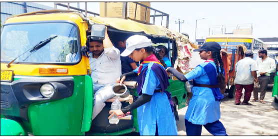
रोडवेज बस अड्डे पर यात्रियों को पानी पिलाते स्काउट गाइड। -जागरण मोर्चा