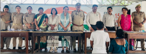
परिवार समझौता केंद्र में पति-पत्नी के बीच समझौता कराते काउंसलर।