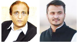
जागरण मोर्चा, कार्यालय

न्यायालय ने अब्दुल्ला आजम पर 3.50 लाख, आजम खां पर 5 लाख का डाला जुर्माना