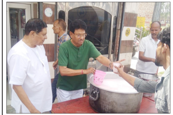
लोगों को शरबत वितरित पदाधिकारी।