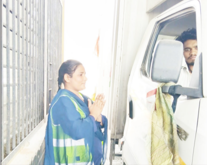
अंजलि मुद्रा में नमस्ते करते कोयला टोलकर्मि।