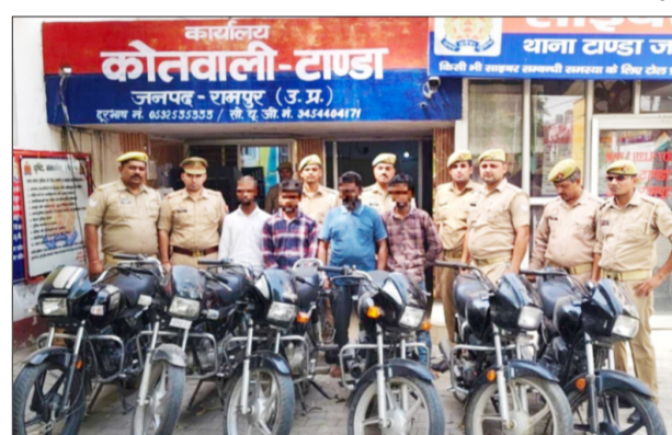
पुलिस की गिरफ्त में बाइक चोर।