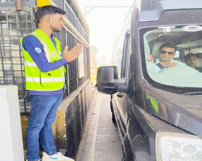
अंजलि मुद्रा में नमस्ते करते कोयला टोलकर्मि।