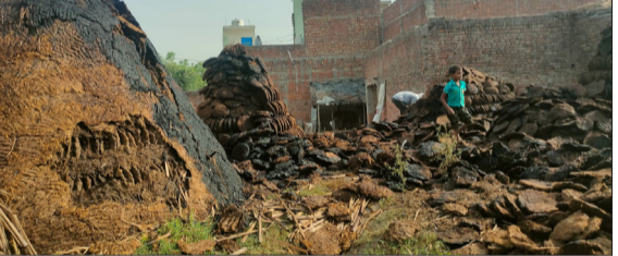
आग लगने से हुआ लाखों का नुकसान।