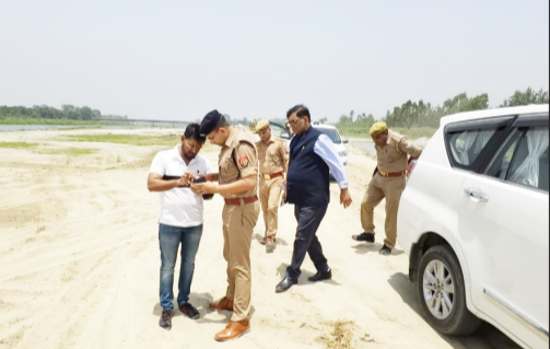
बालू पट्टा क्षेत्र का स्थलीय निरीक्षण करते डीएम व एसपी।

निरीक्षण में पाया गया कि पट्टा क्षेत्र में लगाए गए सभी सीमा स्तंभ अपने निर्धारित स्थानों पर स्थापित हैं। साथ ही बालू के परिवहन के लिए निर्धारित ई-एमएम-11 प्रपत्र के माध्यम से ही परिवहन कार्य किया जा रहा था। अधिकारियों को निरीक्षण के दौरान स्वीकृत