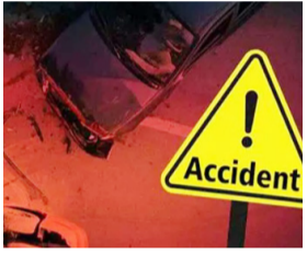
जागरण मोर्चा कार्यालय

मासूम समेत दो घायल, परिवार में मचा कोहराम