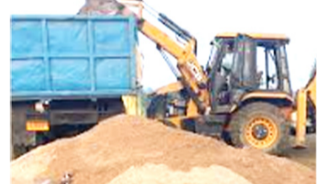
अवैध खनन से जुड़ा पाया गया है। आरोपी से खनन के स्रोत और संबंधित लोगों के बारे में पूछताछ की जा रही है।

घुंघचाई थाना क्षेत्र में मिट्टी का अवैध खनन फल फूल रहा है। परमीशन की आड में कई दिनों तक खनन किया जाता है। पुलिस को क्षेत्र में अवैध खनन की सूचना मिल रही थी। इसी आधार पर शनिवार को पुलिस टीम ने दक्षिण दी और मौके से एक युवक को खनन सामग्री ले जाते हुए दो ट्रैक्टर-ट्रालियों को पकड़ लिया। पुलिस ने चालकों से मिट्टी अवैध खनन करने के दस्तावेज मांगे तो चालक नहीं दिखा सके, पुलिस ने खनन को कब्जे में लेकर थाने लाकर पूछताछ शुरू कर दी है। थाना पुलिस के अनुसार, प्रारंभिक जांच में मामला