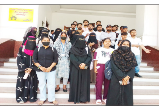
कलेक्ट्रेट में प्रदर्शन करती छात्राएं।

रामपुर। राजकीय रजा स्नातकोत्तर महाविद्यालय की छात्राओं ने कलेक्ट्रेट पहुंचकर प्रदर्शन किया। इसके बाद एक ज्ञापन एसडीएम को सौंपा। जिसमें छात्राओं का कहना है एबीसी आईडी के कारण परीक्षाफल खुल नहीं पा रहा है। पहले सेमेस्टर की परीक्षा होने के बाद तुरंत दूसरे सेमेस्टर के फार्म भरवा लिए हैं। जिसके कारण पूरी तरह से पढ़ाई के लिए समय नहीं मिल पा रहा है। शिक्षक और पाठ्यक्रम के अभाव के कारण अधिकतर छात्राओं की बैंक आई है क्योंकि इस भयंकर गर्मी