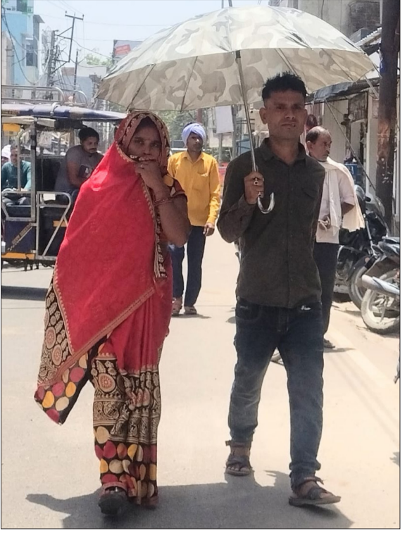
तेज धूप से बचने को छाता लेकर जाता युवक।

चन्द्रौसी। भीषण गर्मी में लोग त्राहि-त्राहि करने लगे हैं। सुबह 8 बजे से ही तेज धूप शुरू हो जाती है, जो शाम 5 बजे तक परेशान करती है। दोपहर को पारा 42 डिग्री व इससे अधिक पहुंच आग बरसाने शुरू कर देता है। भीषण गर्मी, तेज धूप से आमजन सहित पशु-पक्षी भी परेशान बने हैं। इस समय केवल पानी ही अमृत साबित हो रहा है।