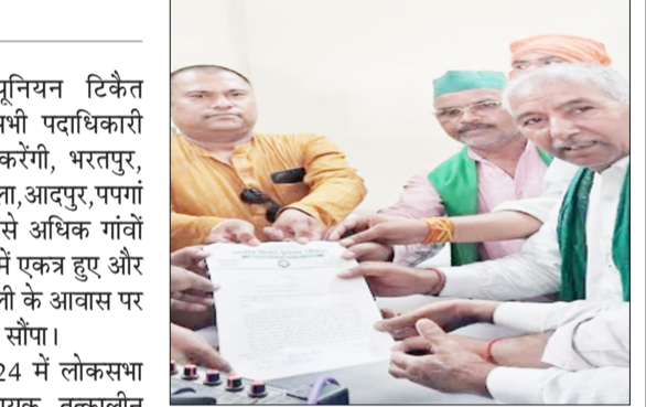
रोष पत्र सौंपा पदाधिकारी एवं किसान।