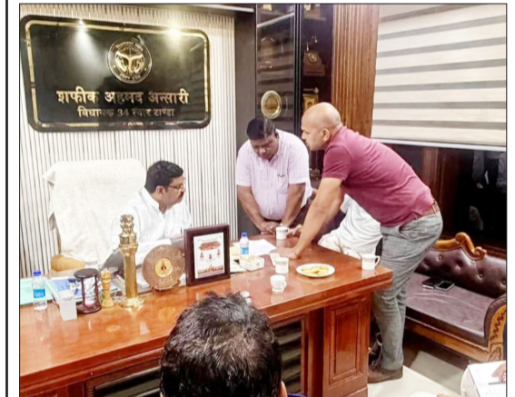
बिजली अधिकारियों के साथ बैठक करते स्वार विधायक।