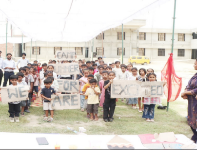
द वर्डेंट स्कूल में समर कैंप में भाग लेते बच्चे।

जागरण मोर्चा कार्यालय पूरनपुर। धनाराघाट रोड स्थित द वर्डेंट पब्लिक स्कूल में शनिवार को किडगराटन के बच्चों के लिए समर कैंप का भव्य आयोजन किया गया। कैंप में बच्चों ने उत्साहपूर्वक भाग लेते हुए विभिन्न मनोरंजक और शैक्षिक गतिविधियों का आनंद लिया। समर कैंप के दौरान बच्चों को मिकी माउस, जॉर्जिंग और चरखी जैसे शूलों का आनंद कराया गया।