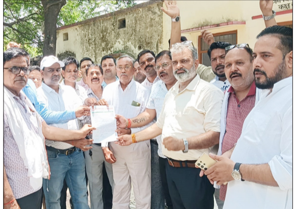
अधिशासी अभियंता को ज्ञापन देते हुए व्यापार मंडल के पदाधिकारी।

पुवायां। भीषण गर्मी के बीच नगर में लगातार हो रही विद्युत कटौती और लो वोल्टेज की समस्या को लेकर व्यापारियों में भारी नाराजगी देखने को मिली है। नगर उद्योग व्यापार मंडल ने अधिशासी अभियंता को ज्ञापन सौंपा। साथ ही इस बिजली कटौती की समस्या से निजात दिलाए जाने की मांग की।