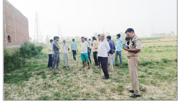
जांच पड़ताल करती पुलिस।