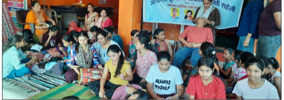
समर कैंप में शामिल बच्चे।