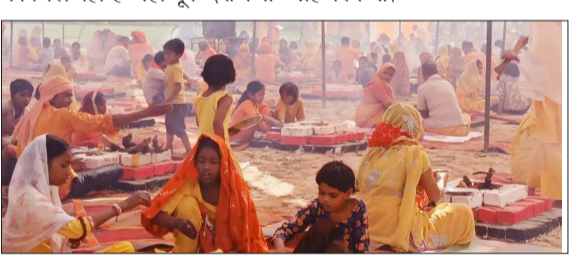
महायज्ञ में शामिल भक्त।