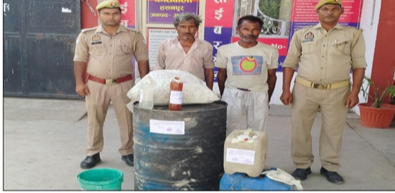
कच्ची शराब के साथ दो अभियुक्त को किया गिरफ्तार।