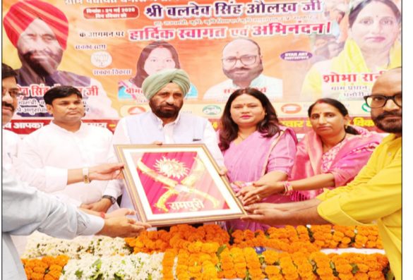
मुख्य अतिथि को रामपुरी चाकू भेंट करते भाजपाई।