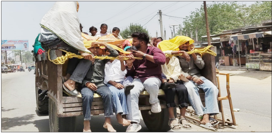
खौद चौराहे से सिर ढककर ट्राली में बैठकर जाते लोग।

सुबह से ही तेज धूप के साथ दोपहर में चल रही गर्म हवाएं, घरों में पंखे, कूलर भी नहीं दे रहे राहत