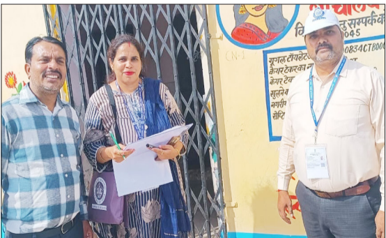
जनगणना कार्य के दौरान सार्वजनिक शौचालय परिसर पहुंचकर मकान सूचीकरण की प्रक्रिया पूरी करते प्रणाली और सुपरवाइजर।

फ़ैज़गंज बेहटा। नगर पंचायत फ़ैज़गंज बेहटा और आसपास के ग्रामीण इलाकों में भारत सरकार के निर्देशानुसार राष्ट्रीय जनगणना के प्रथम चरण का कार्य युद्ध स्तर पर शुरू हो गया है। इसके तहत कस्बे के विभिन्न वार्डों में मकान सूचीकरण और मकानों की गणना का काम पूरी सक्रियता से किया जा रहा है। भीषण गर्मी और तेज धूप की परवाह किए बिना प्रणाली और सुपरवाइजर घर-घर पहुंचकर आंकड़ों को जुटाते में लगे हैं। इस बार की जनगणना को पूरी तरह हाईटेक और डिजिटल रूप दिया गया है। मौके पर तैनात प्रणाली और पर्यवेक्षक अधिकारियों द्वारा जारी विशेष मोबाइल ऐप के माध्यम से सीधे मौके पर ही मकानों का नंबर डाल