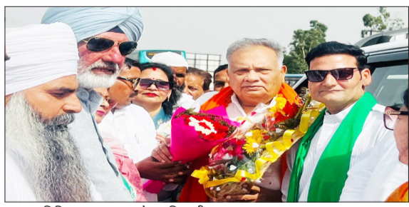
मुख्य अतिथि का स्वागत करते पदाधिकारी।