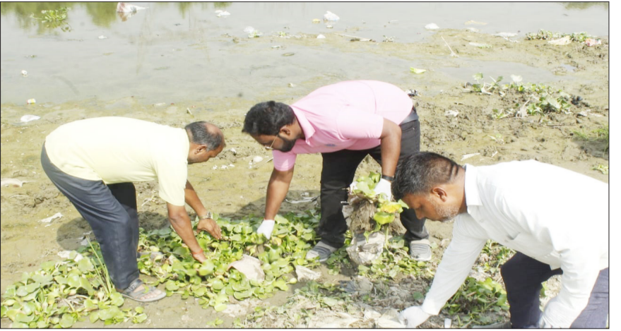
स्वच्छता अभियान में हिस्सा लेते पदाधिकारी।