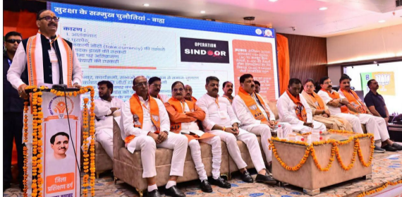
आयाम हासिल किए हैं

होता चला जा रहा था और गरीब और ज्यादा गरीब होता चला जा रहा था। वर्ष 2014 में प्रधानमंत्री नरेंद्र मोदी ने के केंद्र की सत्ता संभालने के बाद अमीरी और गरीबी की खाई पटती जा रही है। वर्ष 2014 के बाद देश में बहुत बड़ा बदलाव आना शुरू हुआ और वर्ष 2017 के बाद उत्तर प्रदेश में बड़े बदलाव की शुरुआत हुई। बृजेश पाठक ने कहा कि आज उत्तर प्रदेश में हवाई अड्डों की बात की जाए या सरकारी विश्वविद्यालय की बात की जाए तो यह प्रदेश सभी चीजों में अग्रणी है। वैकल्पिक ऊर्जा के रूप में भारत सोलर ऊर्जा की बात करें तो भारत दुनिया का नंबर वन देश बन चुका है वहीं सोलर एनर्जी में उत्तर प्रदेश भारत में नंबर वन है। प्रदेश में योगी नेतृत्व की सरकार आने के बाद बैसिक शिक्षा, माध्यमिक शिक्षा, कृषि, स्वास्थ्य, खाद्य आपूर्ति, सड़क, रेल, हवाई अड्डा, बिजली, पानी सभी ने नए