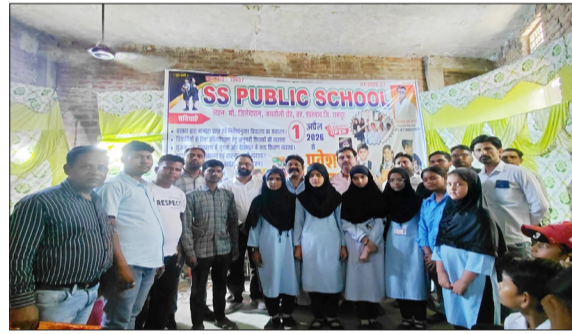
एसएस पब्लिक स्कूल के वार्षिक उत्सव के मौके पर मौजूद मुख्य अतिथि और स्कूली छात्र।

शाहबाद। रविवार को शाहबाद नगर के जयतोली रोड स्थित एसएस पब्लिक स्कूल में वार्षिक उत्सव एवं पुस्तक वितरण कार्यक्रम का आयोजन किया गया। कार्यक्रम में विभिन्न कक्षाओं में उत्कृष्ट प्रदर्शन करने वाले छात्र-छात्राओं को स्मृति चिन्ह एवं प्रशस्ति पत्र देकर सम्मानित किया गया। साथ ही विद्यार्थियों को वार्षिक परीक्षा परिणाम भी वितरित किए गए। सम्मान पाकर छात्र छात्राओं के चेहरे खिल उठे।