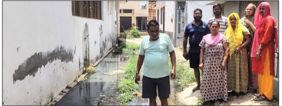
संगम विहार कालोनी में प्रदर्शन करते स्थानीय लोग।

चन्दौसी। नगर के समीप ग्राम पंचायत मौलागढ़ के अंतर्गत आने वाली संगम विहार कालोनी में इन दिनों नाली का गंदा पानी सड़क पर बहने से लोगों का जीना दूभर हो गया है। कालोनी की मुख्य सड़क पर जलभराव और गंदगी फैलने से राहगीरों, बच्चों और बुजुर्गों को भारी परेशानी का सामना करना पड़ रहा है। स्थानीय लोगों का कहना है कि कई बार शिकायत करने के बावजूद समस्या का समाधान नहीं किया गया, जिससे ग्रामीणों में नाराजगी बढ़ती जा रही है। कालोनीवासियों के अनुसार नालियों की निर्यामित सफाई न होने और जल निकासी की उचित व्यवस्था न होने के कारण गंदा पानी सड़कों पर फैल