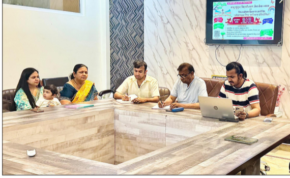
यह प्रतियोगिता 07 जून 2026 (रविवार) को आयोजित होगी।