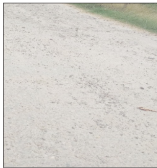
टूटा पडा हाईवे सिकरहाना लिंक रोड।

पूरनपुर। बंडा-घुघंचाई हाईवे से सिकरहाना तक बना सम्पर्क मार्ग जर्जर हालत में है। शिकायत के वावजूद अभी तक निर्माण शुरू नहीं हो सका है। जिससे उखड़ा रोड राहगीरों को दर्द दे रहा है। लोगों ने शीघ्र मार्ग का निर्माण कराने की मांग की है। घुघंचाई थाना क्षेत्र के बंडा हाईवे से सिकरहाना गांव तक जाने वाला सम्पर्क मार्ग कई साल से टूट कर गड्डे में तब्दील पडा हुआ है। मार्ग में बड़े बड़े गड्डे हो जाने से आवागमन में लोगों को भारी परेशानियों का सामना करना पड़ रहा है। आए दिन वाहन सड़क के गड्डों में फंसकर