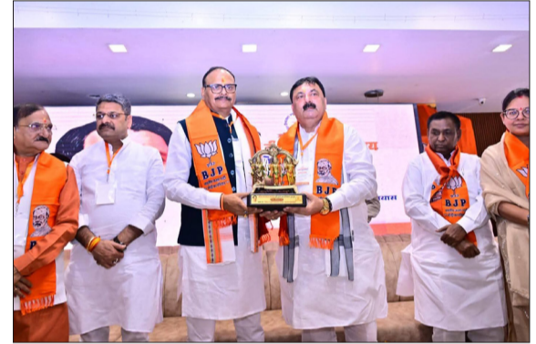
कोडीन कफसीरप मामले में चार्जशीट दाखिल मामले पर बोलते हुए कहा कि कानून अपना काम कर रहा है।

मुरादाबाद। कोडीन कफसीरप मामले में चार्जशीट दाखिल मामले पर बोलते हुए कहा कि कानून अपना काम कर रहा है। कानून के तहत सभी अपराधियों को कड़ी से कड़ी सजा मिले इस दिशा में UP सरकार काम कर रही है।