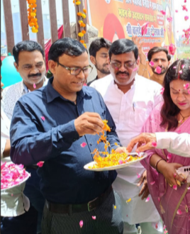
मुख्य अतिथि के ऊपर फूल डालकर स्वागत करते पदाधिकारी।