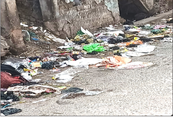
पीलीभीत के मोहल्ला कुंवरगढ़ में फैली गंदगी।

पीलीभीत। वार्ड नंबर 25 के मोहल्ला कुंवरगढ़ में फैली गंदगी और सड़ते कूड़े के ढेर लोगों के लिए बड़ी परेशानी बन गए हैं। होली चौराहे से लेकर लेखराज चौराहे तक जाने वाली मुख्य सड़क पर जगह-जगह जमा कूड़ा नगर पालिका की सफाई व्यवस्था की पोल खोल रहा है। भीषण गर्मी में कचरे से उठ रही तेज दुर्गंध के कारण स्थानीय लोगों और राहगीरों का निकलना मुश्किल हो गया है। क्षेत्र में मच्छरों और मक्खियों का प्रकोप