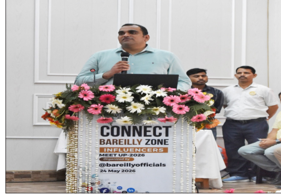
कार्यक्रम में बोलते अधिकारी।

बरेली। अब सोशल मीडिया सिर्फ रील, लाइक और फॉलोअर्स का खेल नहीं रहेगा। बरेली पुलिस लाइन स्थित रविन्द्रालय में रविवार को ऐसा मंच सजा, जहां डिजिटल दुनिया के असर, जिम्मेदारी और कानून की खुलकर चर्चा हुई। कनेक्ट बरेली जोन इन्फ्लुएंसर्स मीट यूपी-2026 में बरेली जोन के नौ जिलों से पहुंचे सोशल मीडिया इन्फ्लुएंसर्स, कंटेंट क्रिएटर्स और डिजिटल वॉलंटियर्स को साफ संदेश दिया गया कि एक वायरल पोस्ट समाज में आग भी लगा सकती है और जागरूकता की मशाल भी बन सकती है। सम्मेलन में साइबर अपराध, फेक न्यूज, डिजिटल अरेस्ट, महिला सुरक्षा, ट्रैफिक नियम और जिम्मेदार डिजिटल नागरिकता जैसे मुद्दों पर गहन मंथन हुआ। मंच पर पुलिस अफसरों ने सोशल मीडिया की ताकत को डिजिटल हथियार बताते हुए कहा कि इसका इस्तेमाल समाज सुधार