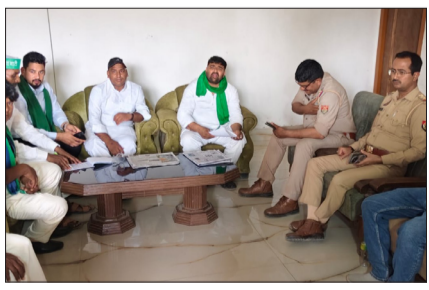
भाकियू बीआर अंबेडकर के कार्यकर्ताओं को नजर बंद करती पुलिस।