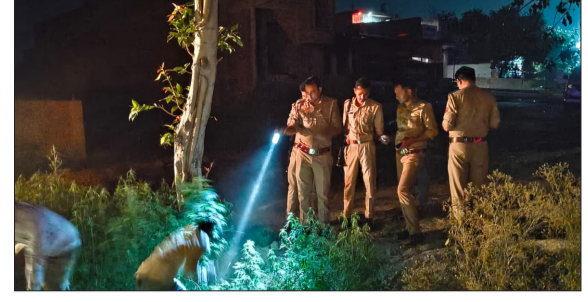
घटना के बाद मीके पर पुलिस।