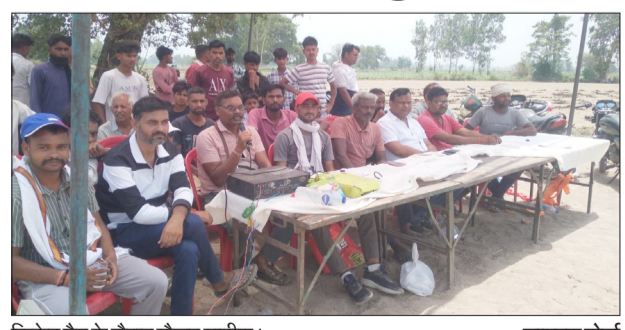
क्रिकेट मैच के दौरान मौजूद ग्रामीण।