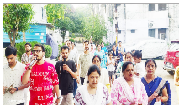
भजन गाते हुए चलते भक्त।

रामपुर। अधिक मास के पावन अवसर पर श्रीनाथ जी रसकथा महोत्सव के निमित्त निकाली जा रही प्रभात फेरी इन दिनों पूरे शहर में भक्ति, समरसता और सनातन एकता का संदेश दे रही है। प्रतिदिन प्रातः निकलने वाली यह निमंत्रण यात्रा केवल कथा का आमंत्रण नहीं, बल्कि समाज के हर वर्ग, हर वर्ग और हर तबके को एक सूत्र में जोड़ने का माध्यम बनती जा रही है।