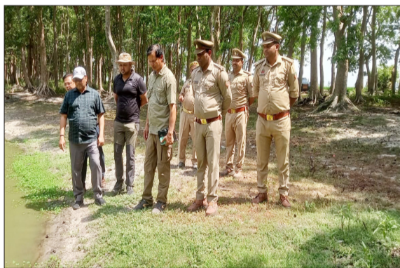
निरीक्षण करती वन विभाग की टीम।