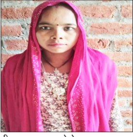
नीलम का फाइल फोटो।

बदायूं/संभल। प्रेम प्रसंग में अंधे एक युवक ने अपनी पत्नी की बेरहमी से हत्या कर दी। आरोप है कि युवक ने अपने दोस्त के साथ मिलकर पहले शराब पार्टी की और फिर पत्नी का गला दबाकर उसे मौत के घाट उतार दिया। घटना के बाद इलाके में सनसनी फैल गई। सूचना मिलने पर पहुंची पुलिस ने शव को कब्जे में लेकर पोस्टमार्टम के लिए भेज दिया तथा आरोपी पति को हिरासत में लेकर जांच शुरू कर दी है।