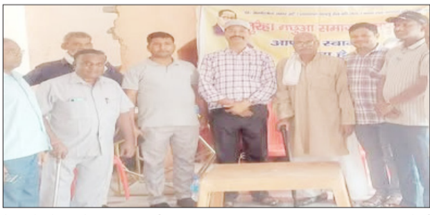
बैठक के दौरान मौजूद पदाधिकारी।

विश्वविद्यालय तक प्राइवेट खुले हैं। ऐसे में सरकारी नौकरियां मात्र रह गईं। उद्योग फैक्ट्रियां यह प्राइवेट स्कूल कॉलेज विश्वविद्यालय में एससी एसटी को आरक्षण मिलना चाहिए था लेकिन नहीं मिल पा रहा है। बतया कि न्याय पंचायत स्तर पर संगठन को खड़ा किया जा रहा है और हम इसको 50 प्रतिशत पूरा कर चुके हैं। समाज की पिछड़ापन और बेरोजगारी का मुख्य कारण शिक्षा का अभाव है। आगामी पंचायत चुनाव की तैयारी के लिए समाज के लोगों को आगे आने की जरूरत है। उन्होंने कहा कि 7 जून रविवार को मेधामी छात्र-छात्राओं को जिला पंचायत के हाल में सम्मानित किया जाएगा जिसमें