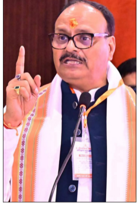
गौशाला और जल व्यवस्था का निरीक्षण करेंगे।

गजरौला। 25 मई को डिप्टी सीएम ब्रजेश पाठक के आगमन को लेकर सरकारी विभागों में हलचल मची हुई है। नगर के सामुदायिक स्वास्थ्य केन्द्र और गौशाला में रंगाई पुताई का काम चल रहा है। बता दें कि 24 मई को डिप्टी सीएम शाम के समय अमरोहा स्थित भाजपा कार्यालय में कार्यक्रमों की बैठक लेगे तो वहीं हाईवे स्थित एक औद्योगिक इकाई के अतिथिगृह में रात्रि विश्राम के बाद 25 मई की सुबह नगर के सामुदायिक स्वास्थ्य केन्द्र, कान्हा