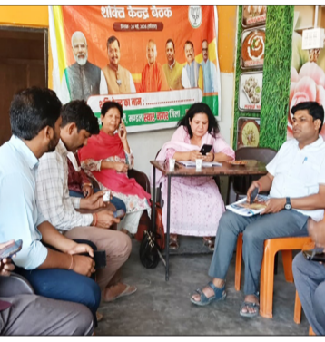
बैठक को संबोधित करते मुख्य अतिथि।