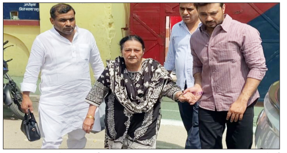
जिला कारागार से बाहर आती पूर्व सांसद।