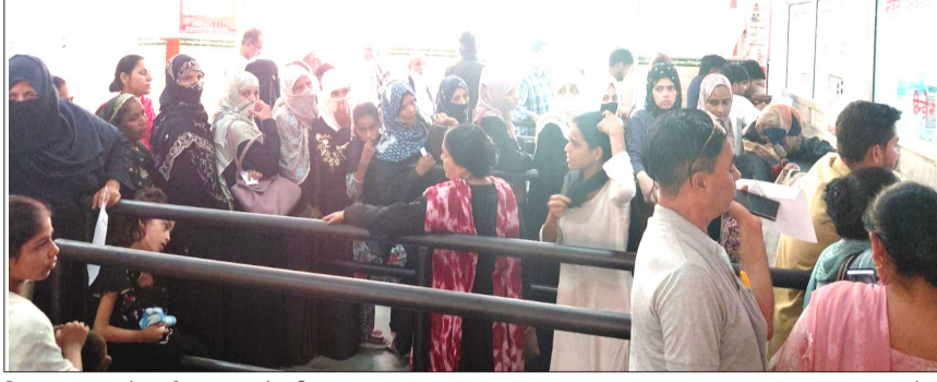
जिला अस्पताल के पर्चा काउंटर खड़े मरीज।

भीषण गर्मी के कारण जिला अस्पताल में सुबह 8 बजे से ही ओपीडी में मरीजों की लंबी कतारें लग जाती हैं। पंजीकरण काउंटरों पर कार्यरत कर्मचारियों ने बताया कि इन दिनों उन पर काफी काम