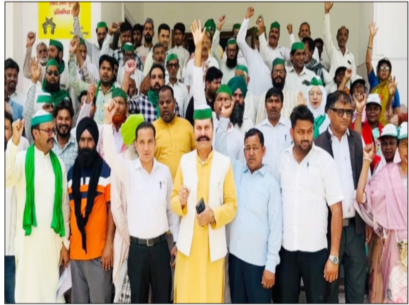
कलेक्ट्रेट में प्रदर्शन करते किसान।