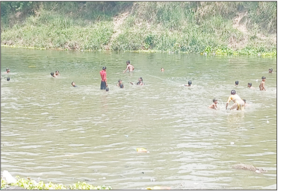
गंगा में आस्था की डुबकी लगाते भक्त।