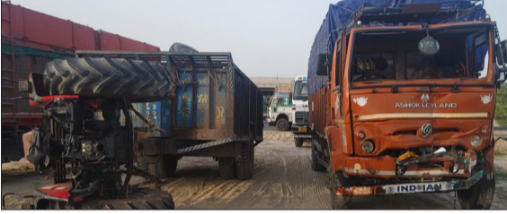
सड़क हादसे के बाद क्षतिग्रस्त डीसीएम एवं ट्रैक्टर ट्रॉली।