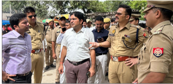
राजघाट स्थित गंगा घाट पर सुरक्षा व्यवस्था को निरीक्षण करने पहुंचे डीएम व एसपी।

साथ ट्रेक्टर-ट्राली में बैठकर गंगा घाट पहुंचने लगा। सुबह 6 बजे से ही गंगा घाट पर काफी संख्या में श्रद्धालु पहुंच गए और गंगा में स्नान करने आरंभ कर दिया। गंगा घाट पर जगह-जगह महिलाएं बच्चों के साथ गंगा में स्नान करते नजर आईं। वहीं पुरुष व युवाओं ने गंगा में स्नान कर पुण्य लाभ कमाया। गंगा में स्नान करने का क्रम देर शाम तक