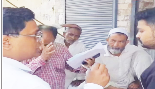
दोमभला रोड स्थित दुकानदार से बातचीत करते खाद्य सुरक्षा अधिकारी।