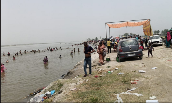
गंगा स्नान करते श्रद्धालु।