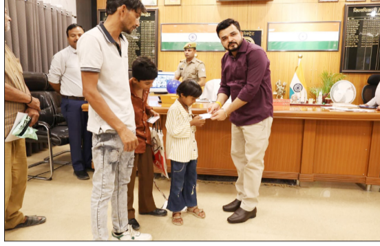
बालक को आयुष्मान कार्ड देते डीएम।