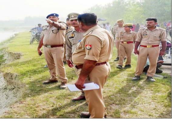
पटवाई में घाट का निरीक्षण करते एएसपी।