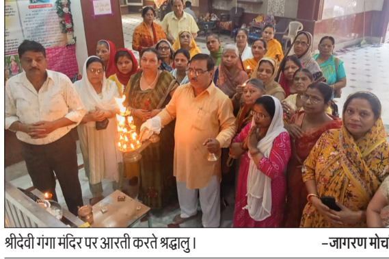
श्रीदेवी गंगा मंदिर पर आरती करते श्रद्धालु।