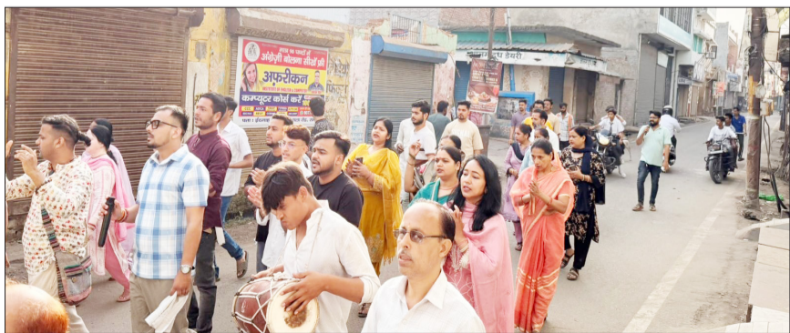
प्रभात फेरी में भजन गाते हुए चलते भक्त।

रामपुर। अधिक मास के पावन अवसर पर नगर में निकाली जा रही मधुर यात्रा अब केवल एक धार्मिक यात्रा न रहकर सनातन संस्कृति को जोड़ने वाला एक विराट जन आंदोलन बनती जा रही है।