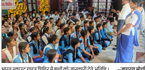
भारत स्काउट गाइड शिविर में बच्चों को जानकारी देते अतिथि।