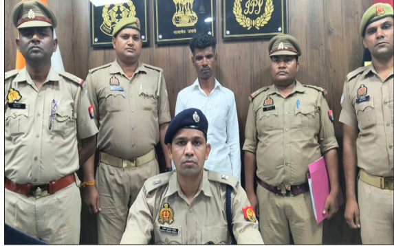
घटना का खुलासा करते एसपी।