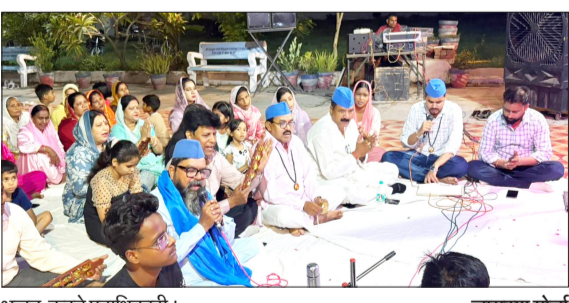
भजन करते पदाधिकारी।

रामपुर। वाल्मीकि समाज में शिक्षा और संगठन का रास्ता भगवान वाल्मीकि महाराज की उपासना से ही संभव है। इसलिए ज्यादा से ज्यादा लोग भगवान वाल्मीकि के उपासक बनें और रामायण का गंभीरता से अध्ययन करें।