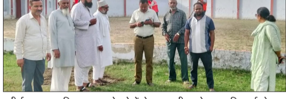
बड़ी ईदगाह पर मुस्लिम समाज के लोगों से जानकारी करते नगरपालिका ईओ।