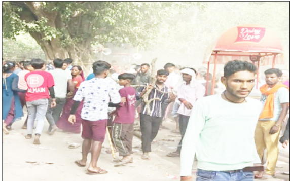
मेला में होता विवाद।

पूरनपुर। इकोतरनाथ मंदिर पर जूस के रुपए मांगने पर युवक को मारपीट कर घायल कर दिया। धारदार हथियार से हमला कर उसको घायल कर दिया। बचाने आए पिता मां और भाई को भी पीटा गया। पुलिस ने दो को हिरासत में लिया है।