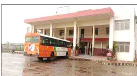
पूरनपुर रोडवेज बस अड्डा।