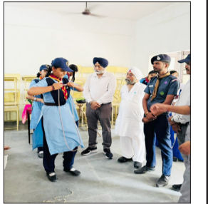
शिविर में हिस्सा लेते छात्र-छात्राएं।