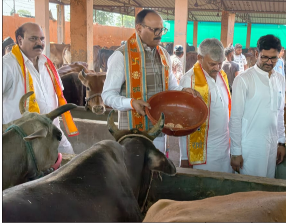
डिप्टी सीएम ने यहां पर गौपूजा की और गायों को गुड़ भी खिलाया।