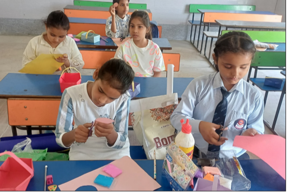
जागरण मोर्चा कार्यालय

भगतपुर। जे आर एस एम कॉन्वेंट स्कूल, सिरसवां हरचंद पो मानपुर जिला मुरादाबाद में आज समर कैंप के प्रथम दिन का उत्साहपूर्वक आयोजन किया गया। कैंप में बच्चों ने संगीत, मेहेंदी, गैस-लेस कुकिंग, योग, क्राफ्ट, चार्ट मैकिंग एवं डांस जैसी गतिविधियों में बढ़-चढ़कर भाग लिया।