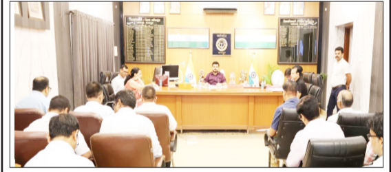
बैठक को संबोधित करते जिलाधिकारी।