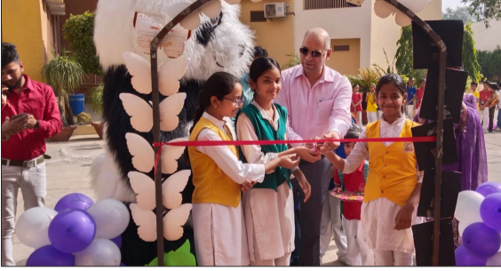
समर कैंप का फीता काट कर शुभारंभ करती छात्राएं। -जागरण मोर्चा

हसनपुर। नगर के प्रतिष्ठित विद्यालय एच.एस.एस. पब्लिक स्कूल में कक्षा एक से कक्षा आठ तक के बच्चों के लिए चार दिवसीय समर कैंप का शुभारंभ बड़े उत्साह के साथ किया गया। इसका उद्देश्य बच्चों में रचनात्मकता, आत्मविश्वास, भाषा कौशल और शारीरिक दक्षता का विकास करना है। कैंप के प्रथम दिन बच्चों ने मेहेंदी, कैलीग्राफी, इंग्लिश स्पीकिंग, डांस, नेल आर्ट, ताइक्वांडो, क्ले पॉन्टरी, स्केटिंग, आर्ट एंड क्राफ्ट स्टोन पॉन्टिंग तथा कुकिंग विडाउट फायर जैसी विविध गतिविधियों में सक्रिय भागीदारी की। बच्चों के मनोरंजन के लिए विशेष रूप से आया 'पांडा' मुख्य आकर्षण