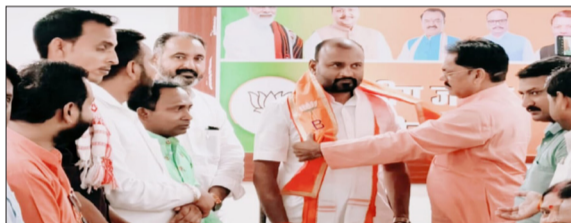
पंडित दीनदयाल उपाध्याय प्रशिक्षण महाभियान की तैयारी की बैठक।