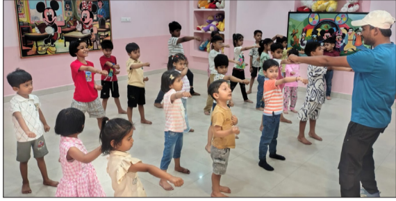
एबीसी किड्स मांटेसरी स्कूल पर समर कैंप में ताइक्वांडो सीखते बच्चों।

चन्द्रौसी। एबीसी किड्स मांटेसरी स्कूल में समर कैंप का आयोजन किया जा रहा है। सोमवार को समर कैंप के पांचवें दिन बच्चों को योगा, बॉलीवुड एवं फ्री स्टाइल डांस, आर्ट एंड क्राफ्ट, स्केचिंग, इनडोर गेम्स, क्ले आर्ट, फेब्रिक पेंटिंग, बेस्ट आउट ऑफ वेस्ट, मेंटल मैथ्स, स्केटिंग, ताइक्वांडो, पर्सनैलिटी डेवलपमेंट, टेबल मैनस तथा हेंडराइटिंग जैसी अनेक रचनात्मक गतिविधियों का प्रशिक्षण दिया गया। योगा सत्र में बच्चों को स्वस्थ जीवनशैली, नियमित व्यायाम एवं फिटनेस के महत्व के बारे में जानकारी दी गई तथा विभिन्न योगासन एवं ध्यान अभ्यास कराए गए। योग अभ्यास से बच्चों में अनुशासन, एकाग्रता एवं मानसिक शांति का विकास देखने को मिला। आर्ट एवं क्राफ्ट गतिविधि में बच्चों ने रंग-बिरंगी सजावटी वस्तुएं एवं रचनात्मक