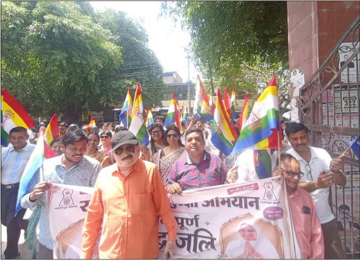
जागरण मोर्चा कार्यालय

आर्यिका माताओं के देवलोक गमन पर किया गया श्रद्धांजलि सभा का आयोजन, प्रदर्शन भी किया