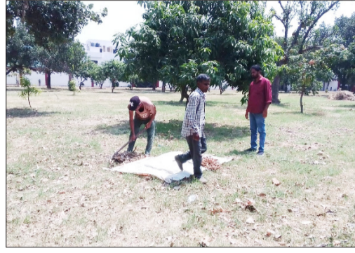
माला रोड स्थित ईदगाह में साफ-सफाई करते पालिका कर्मी।

रामपुर। ईद उल अजहा को लेकर पालिका प्रशासन ने माला रोड स्थित ईदगाह में साफ-सफाई और घास कटाई का कार्य कराया गया। साफ-सफाई के लिए 12 कर्मियों को लगाया गया है। कर्मियों को ईदगाह में साफ-सफाई, धुलाई, घासों की कटाई कराने के बाद नमाज अदा करने के लिए सफे बनाई गई है। 28 मई को जनपद में ईद उल अजहा का पर्व है। इसको