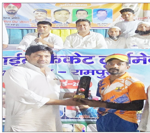
खिलाड़ी को पुरस्कार देकर सम्मानित करते अतिथि।