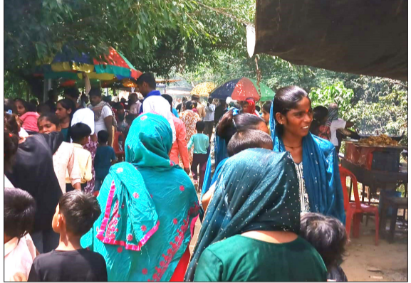
मेले में खरीदारी करती महिलाएं।