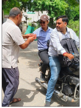
शरबत का वितरण करते लोग।

चन्द्रौसी। ज्येष्ठ दशहरा पर्व के अवसर पर सोमवार को शहर पूरी तरह भक्तिमय रंग में रंगा नजर आया। सुबह से ही मंदिरों में श्रद्धालुओं की भीड़ रही और लोगों ने विधि-विधान के साथ पूजा-अर्चना कर परिवार की सुख-समृद्धि एवं खुशहाली की कामना की। शहर के प्रमुख मंदिरों में विशेष धार्मिक कार्यक्रम आयोजित किए गए, जहां विशेष पूजा, हवन, आरती एवं भजन-कीर्तन का आयोजन किया गया। जिसमें बड़ी संख्या में श्रद्धालु शामिल हुए। इसके साथ शहर के विभिन्न चौक-चौराहों और मुख्य मार्गों पर सामाजिक संगठनों, व्यापारियों एवं युवाओं द्वारा सेवा शिविर लगाकर राहगीरों को ठंडा शरबत वितरित किया गया। इन