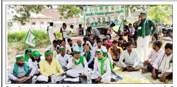
बिजली घर पर प्रदर्शन करते किसान।

बिसौली। नगर के मई फीडर क्षेत्र में बिजली संकट को लेकर लोगों का आक्रोश सोमवार को खुलकर सामने आ गया। पिछले करीब 20 दिनों से बिजली आपूर्ति टप होने से परेशान ग्रामीणों ने बिजली विभाग के खिलाफ जवाहर प्रदर्शन किया। आरोप है कि शिकायत करने पर संबंधित जूनियर इंजीनियर (जेई) और लाइनमैन उपभोक्ताओं के साथ अमद्र व्यवहार करते हैं और समस्या समाधान के नाम पर रुपये की मांग करते हैं। ग्रामीणों का कहना है कि मई फीडर से जुड़े पूरे मोहल्ले में बीते 20 दिनों से अंधेरा पसरा हुआ है। लगातार शिकायतों के बावजूद विभागीय अधिकारी कोई ठोस कार्रवाई नहीं कर रहे हैं। भीषण गर्मी के इस दौर में बिजली न होने से लोगों का जनजीवन पूरी तरह प्रभावित हो गया है। पानी की समस्या भी विकलराहती जा रही है, क्योंकि अधिकांश घरों में पानी की सप्लाई बिजली पर ही निर्भर है। सोमवार को गुस्साग्रामीणों ने एकत्र होकर बिजली विभाग के खिलाफ नारेबाजी की और जमकर हंगामा किया। प्रदर्शनकारियों का आरोप है कि जब वे अपनी समस्या लेकर जेई और लाइनमैन के पास जाते हैं तो उनसे अमद्रता की जाती है। कई ग्रामीणों ने आरोप लगाया कि लाइन टांक करने या बिजली बहाल करने के नाम पर उनसे अंधेरे रूप से पैसे मांगे जाते हैं। पैसा न देने पर उनकी शिकायतों को अनसुना कर दिया जाता है। अब देखना होगा कि प्रशासन इस मामले में क्या कदम उठाता है और कब तक क्षेत्रवासियों को इस संकट से राहत मिलती है।