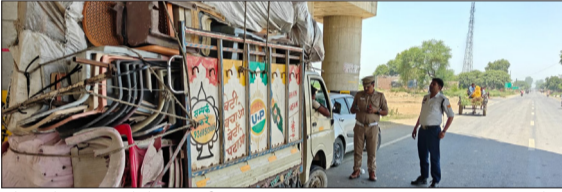
ओवरलोड वाहन को चेक करती यातायात पुलिस।