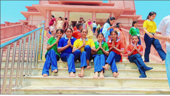
रामनगर मसाई माड़ा वाटर पार्क में शामिल छात्र-छात्राएं।

विद्यार्थियों ने मसाई माड़ा में स्थित विभिन्न राइड्स वाटर पार्क में खूब समय बिताया।