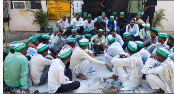
बिजली घर में धरने पर बैठे किसान।

विद्युत आपूर्ति दी जाए। ब्लॉक क्षेत्र के गांव लुहारी खादर में चार दिन से विद्युत आपूर्ति की स्थिति काफी खराब है, ग्रामीणों का कहना है की चार दिन में मात्र चार घंटे भी विद्युत आपूर्ति प्राप्त नहीं हुई है। जिससे किसानों की फसले बर्बादी की कगार पर पहुंच चुकी है। मंगलवार को विद्युत विभाग के खिलाफ ग्रामीणों का गुस्सा फूट