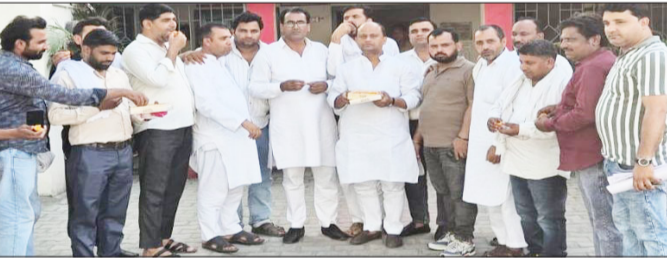
चमरौआ ब्लॉक पर मिठाई बांटकर खुशी जाहिर करते ग्राम प्रधान।