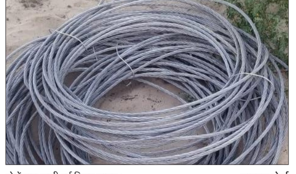
चोरों द्वारा काटी गई विद्युत लाइन।

हसनपुर। कोतवाली क्षेत्र के एक बिजली घर से जा रही लाइन का अज्ञात चोरों ने लगभग 1500 मी का तार काट लिया। एविडेंस की सूचना पर मौके से गुजर रही डायल 112 पुलिस को देखकर कर तार को सड़क पर छोड़कर फरार हो गए। कोतवाली क्षेत्र के गांव तहारपुर बिजली घर से चकोरी के लिए हाई टेंशन विद्युत लाइन जा रही है। सोमवार की देर रात अज्ञात चोरों ने गांव को जा रही हाई टेंशन विद्युत लाइन का 1500 मीटर तार काटकर सड़क पर रख लिया और अपने साथी के वाहन की का इंतजार करने लगे। साथी का वाहन पहुंचने से पूर्व ही सूचना पर जा रही डायल 112 पुलिस को देखकर कर सड़क पर ही तार का बंडल छोड़कर अंधेरे