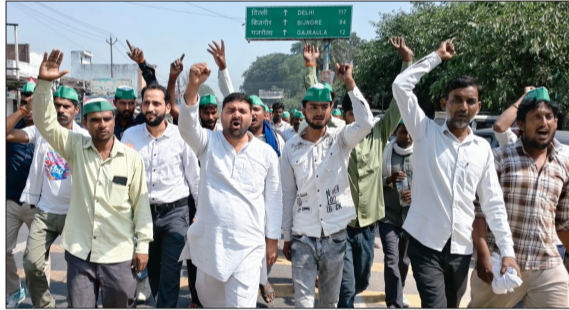
विद्युत विभाग के खिलाफ प्रदर्शन करते किसान।