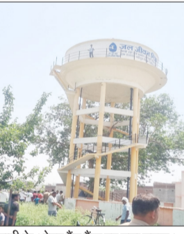
पानी के ओवर हैड टैंक पर चढ़ा युवक।

बदायूं। वजीरगंज ब्लॉक के बरीपुरा गांव में संपत्ति विवाद से परेशान होकर एक 16 वर्षीय नाबालिग युवक पानी की टंकी पर चढ़ गया। पीड़ित युवक का अपने ताऊ से पिछले कई दिनों से जमीन को लेकर विवाद चल रहा था, जिसमें पुलिस से मदद न मिलने पर उसने यह आत्मघाती कदम उठाया। सूचना पर डायल 100 मौके पर पहुंची। जिसके बाद पुलिस मौके पर पहुंच गई। जैसे तैसे किशोर को आशवासन देकर उतार लिया गया। आरोपी के खिलाफ