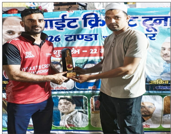
मैन ऑफ द मैच का पुरस्कार देते मुख्य अतिथि।