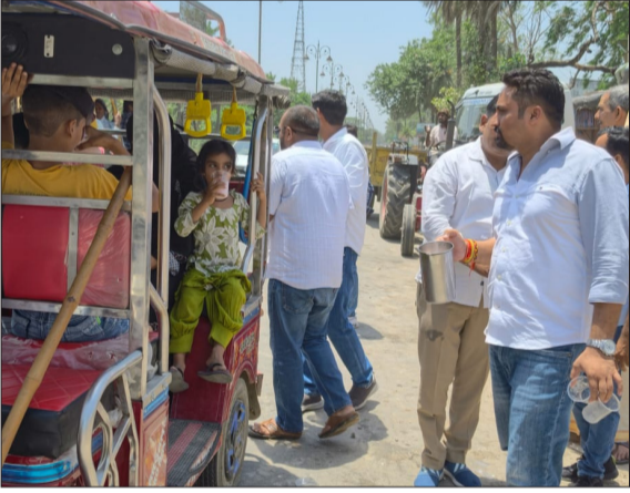
शरबत बांटते लोग।