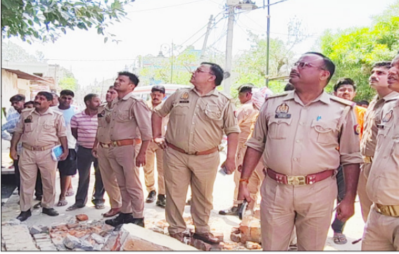
मौके पर जानकारी करते हुए पुलिसकर्मी।

अचानक टूट गया। उसके टूटते ही लेंटर खोलने को नीचे खड़े श्रमिकों के ऊपर से गिरे शटरिंग के मलबे में दब गए। और चीख पुकार मच गई। आसपास के लोग जब तक मौके पर एकत्र होकर लेंटर का मलबा हटाकर