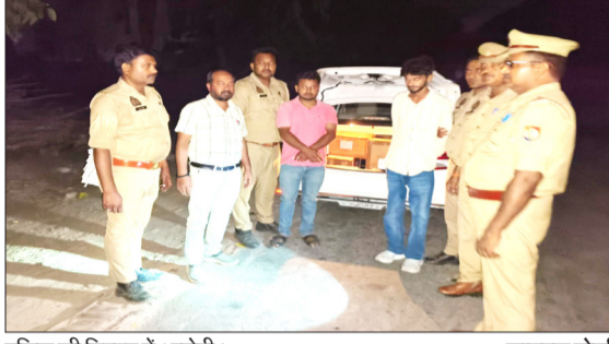
पुलिस की गिरफ्तार में आरोपी।