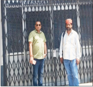
सील किया गया नर्सिंग होम का फाइल फोटो। रिपोर्ट दर्ज कराई है।

स्वार। नाज हॉस्पिटल में किशोरी के प्रसव कराए जाने के मामले में स्वास्थ्य विभाग द्वारा हॉस्पिटल को सील कर दिया गया था। लेकिन संचालक द्वारा सील को तोड़कर फिर से हॉस्पिटल शुरू कर दिया गया। जिसके चलते स्वास्थ्य विभाग में हॉस्पिटल संचालक को नोटिस जारी कर जवाब तलब किया है। अन्यथा अग्रिम कार्यवाही की चेतावनी दी है। लेकिन समय अवधि बीत जाने के बाद भी अस्पताल के संचालक द्वारा जवाब न दिए जाने पर नोडल अधिकारी ने पुलिस को तहरीर देकर संचालक चिकित्सक के खिलाफ