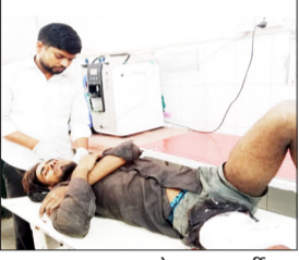
घायल का उपचार करते स्वास्थ्य कर्मी।