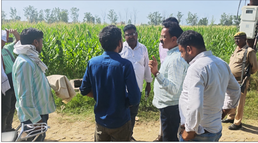
ग्रामीणों से जानकारी करती राजस्व विभाग की टीम।

राजस्व अभिलेखों के अनुसार गाटा संख्या 813, रकबा 0.024 हेक्टेयर भूमि को बागभारती तीर्थ के रूप में दर्ज बताया गया है। वहीं गाटा संख्या 815, रकबा 0.009 हेक्टेयर भूमि नाला, गाटा संख्या 817, रकबा 0.017 हेक्टेयर भूमि सकरमथा तथा गाटा संख्या