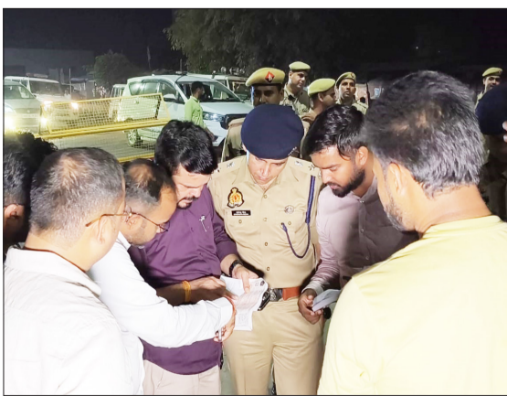
सोमवार रात को वाहनों की चेकिंग करते डीएम और एसपी।