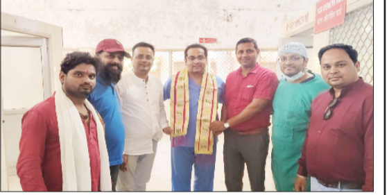
डॉक्टर को सम्मानित करते राष्ट्रीय हनुमान दल के सदस्य।