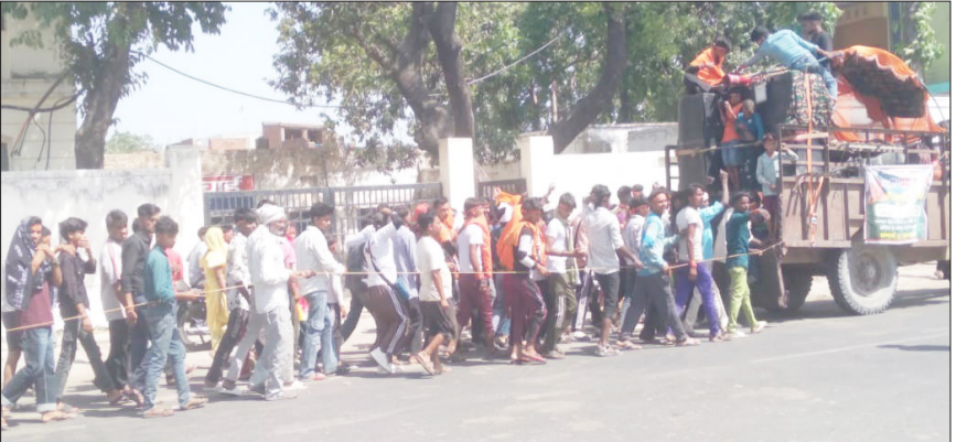
सिमरिया में वापस लौटता मातारानी का जत्था।

पूरनपुर। माता रानी का पैदल गया जत्था गाजेवाजे व भक्ति गीतों के बीच गांव वापस पहुंचा। जत्थे के गांव पहुंचते ही ग्रामीणों ने फूल-मालाओं और पुष्पवर्षा कर श्रद्धालुओं का जोरदार स्वागत किया। घुंघराई थाना क्षेत्र के गांव सिमरिया ता.अजीतपुर बिल्हा से 22 मई को बड़ी संख्या में श्रद्धालुओं का पैदल जत्था माता पूर्णांगिरि के लिए ढोल नगाड़ों के साथ रवाना हुआ था। मंगलवार को गाजेवाजे के साथ श्रद्धालुओं का जत्था गांव में पहुंचा, ढोल-नगाड़ों और बँडबाजों की धुन पर ग्रामीण झूम उठे। महिलाओं ने आरती इत्तम कर का स्वागत किया, जबकि बच्चों