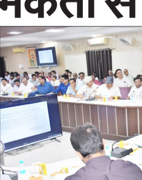
उद्योग बंधु की बैठक में निर्देश देते अधिकारी।

बदायूं। जिलाधिकारी अरुण शर्मा ने मंगलवार को जिला उद्योग बंधु की बैठक की अध्यक्षता करते हुए अधिकारियों को उद्यमियों व व्यापारियों की समस्याओं का प्राथमिकता पर निस्तारण सुनिश्चित करने के लिए कहा। उन्होंने सभी बैंकर्स से कहा कि वह शासकीय योजनाओं के क्रियान्वयन में पूर्ण सहयोग प्रदान करें तथा उत्तर प्रदेश सरकार के शासनदेशों का अनुपालन कराना सुनिश्चित करें, ऐसा न करने पर संबंधित बैंकर्स के विरुद्ध प्राथमिक दर्ज कराई जाएगी। कलेक्ट्रेट स्थित अटल बिहारी वाजपेयी सभागार में आहूत बैठक की अध्यक्षता करते हुए जिलाधिकारी ने उपस्थित बैंकर्स से कहा कि वह विभिन्न शासकीय योजनाओं के आवेदकों के प्रति आदर का भाव रखें तथा उन्हें प्रोत्साहित करें। आवेदन को बिना ठोस आधार के निरस्त न