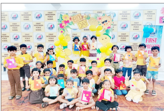
समर कैंप में बच्चों द्वारा बनाए गए कार्ड।

रामपुर। ज्वाला नगर स्थित फर्स्ट इम्प्रेशन पब्लिक स्कूल में बच्चों के सर्वांगीण विकास के लिए समर कैंप का हर्षोल्लास के साथ समापन हुआ। इस वर्ष विद्यालय ने नन्हें कदम, बड़ी उड़ान थीम के माध्यम से बच्चों की रचनात्मकता, कौशल और छिपी हुई प्रतिभा को निखारने का अनूठा प्रयास किया। इस समर कैंप को दो अलग-अलग चरणों में आयोजित किया गया था। कैंप के पहले चरण में जूनियर ग्रुप के लिए 18 मई से 23 मई तक विशेष सत्र चला। इसकी शुरुआत पहले दिन बेहतरीन क्राफ्ट वर्क गतिविधियों के साथ हुई। इस कैंप के दौरान बच्चों के लिए तीन अलग-अलग दिनों के अनुसर रेट, ब्लू और येलो ड्रेस को डिजाइन किया गया था जिससे पूरा परिसर रंग-बिरंगा और आकर्षक नजर