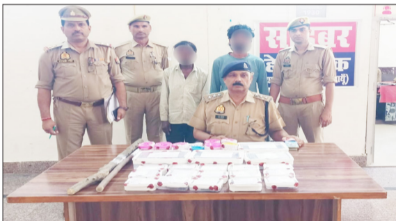
पुलिस की गिरफ्त में आरोपी व बरामद सामान।

19मई की रात को मोहल्ला हाता में हुई थी घटना, खुलासे में चार टीमों को लगाया