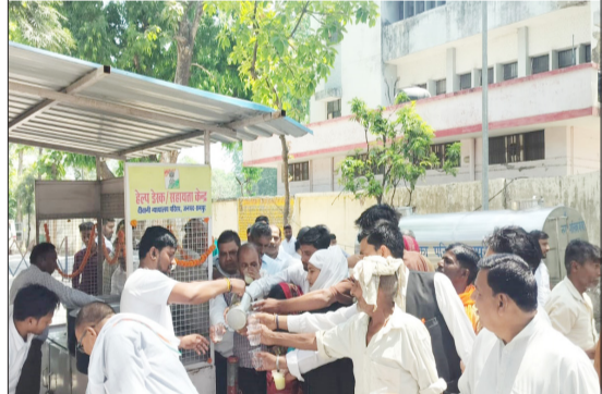
कचहरी परिसर में लोगों को शर्बत वितरित करते अधिवक्ता।

रामपुर। मोहम्मद अली जौहर विश्वविद्यालय के कृषि संकाय एवं प्रशिक्षण एवं रोजगार स्थापना प्रकोष्ठ द्वारा राजकीय फल संरक्षण एवं प्रशिक्षण केंद्र के सहयोग से 15 दिवसीय फल प्रसंस्करण प्रशिक्षण कार्यक्रम का समापन हुआ। यह प्रशिक्षण 11 से 25 मई तक आरंभ रहा। कार्यक्रम का मुख्य उद्देश्य छात्रों और स्थानीय युवाओं को फल प्रसंस्करण की वैज्ञानिक विधियों से जोड़कर उन्हें स्वरोजगार के लिए तैयार करना था। प्रशिक्षण के दौरान प्रतिभागियों को आम, अमरुद, पीपल, संतरा और अन्य मौसमी फलों से जैम, जेली, स्कवैश, नेक्टर, चटनी और ड्राई फ्रूट उत्पाद तैयार करने की व्यावहारिक विधियां सिखाई गईं।