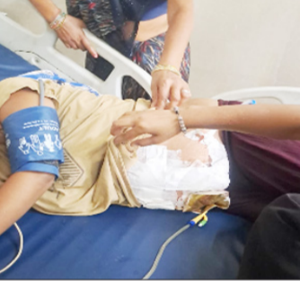
मेडिकल कॉलेज में भर्ती मरीज।

है अब दुबारा ऑपरेशन नहीं हो सकता। दिल के डॉक्टर से परामर्श कराने के बाद ही ऑपरेशन हो सकेगा। परिजनों कि मिन्नत पर आनन-फानन में महिला का दोबारा ऑपरेशन कर दिया, जिससे उसकी स्थिति और ज्यादा क्रिटिकल हो गई इसी बात पर पीड़ित परिवार ने डॉक्टरों पर अवैध वसूली का भी गंभीर आरोप लगा दिया। उनका कहना है कि सरकारी अस्पताल होने के बावजूद डॉक्टरों ने निजी क्लिनिक की तरह बेहतर इलाज का झांसा देकर मोटी