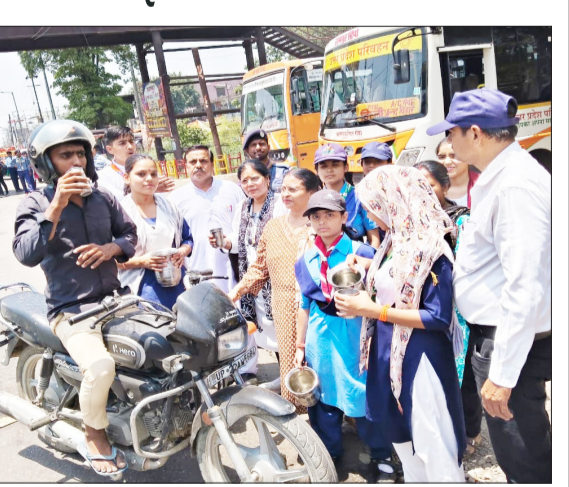
रोडवेज बस अड्डे पर राहगीरों को पानी पिलाते स्काउट गाइड।