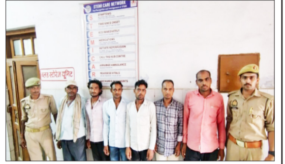
पुलिस अभिरक्षा में मौजूद आरोपी।