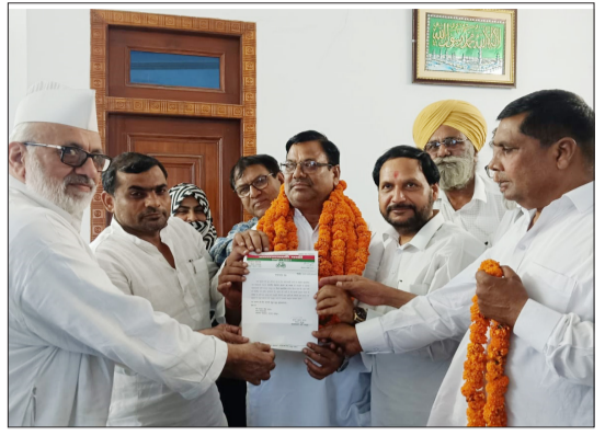
महासचिव को मनोनयन पत्र सौंपते सपा जिलाध्यक्ष।