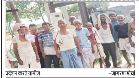
प्रदर्शन करते ग्रामीण।

प्रतिष्ठान पर बच्चों से काम कराने वालों पर होगी कार्रवाई बदायूं। जिलाधिकारी अरुण शर्मा ने कलेक्ट्रेट स्थित सभागार में जिला श्रम बन्धु समिति की बैठक की अध्यक्षता करते हुए जगदद वासियों उद्यमी या व्यापारियों से आवाहन किया कि वह नाबालिकों से कोई भी कार्य न कराए, 10 दिन बाद वैकल्पिक अभियान चलाया जाएगा पकड़े जाने पर विधिक कार्रवाई की जाएगी। सहायक श्रमायुक्त ने बताया कि जिले में लगभग 247000 निर्माण श्रमिक पंजीकृत हैं। प्रधानमंत्री विकसित भारत रोजगार योजना में 254 प्रतिष्ठान ईपीएफ में पंजीकृत हैं। इस अवसर पर सहायक श्रमायुक्त श्वेता गर्ग सहित अन्य संबंधित विभागीय अधिकारी मौजूद रहे।