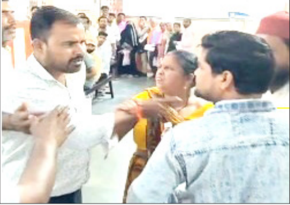
जिला अस्पताल में कक्ष के बाहर आपस में भिड़ते रोगी।