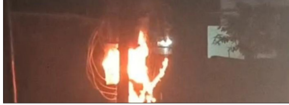
शॉर्ट सर्किट के चलते ट्रांसफॉर्मर लगी आग।