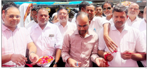
तहसील के गेट पर शिविर का फीता काटते एसडीएम।