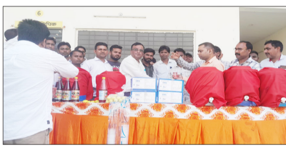
प्याऊ लगाने के दौरान मौजूद अधिकारी।