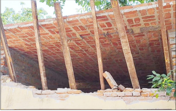
गिरे पड़े लेंटर के गर्डर।