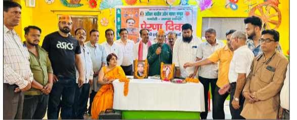
व्यापार मंडल के कार्यक्रम में मौजूद व्यापारी।