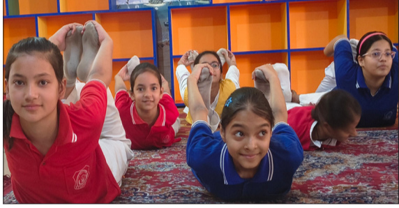
समर कैम्प के दौरान योग करते बच्चे।

हसनपुर। नगर में स्थित एच.एस.एस. पब्लिक स्कूल में आयोजित चार दिवसीय समर कैम्प के दूसरे दिन मंगलवार को बच्चों ने विभिन्न रचनात्मक और मनोरंजक गतिविधियों में बह-चढ़कर भाग लिया। दूसरे दिन का मुख्य आकर्षण योग सत्र रहा, जिसमें बच्चों को शारीरिक संतुलन, स्वस्थ जीवनशैली और मानसिक एकाग्रता के लिए प्रेरित करते हुए विभिन्न योगासन सिखाए गए। कैम्प के दौरान बच्चों ने 'क्ले पॉटरी' में मिट्टी से सुंदर गिलास व फूलदान बनाए, जबकि 'कुकिंग विदाउट फायर' में स्वादिष्ट कटोरी चाट बनाकर अपनी पाक-कला