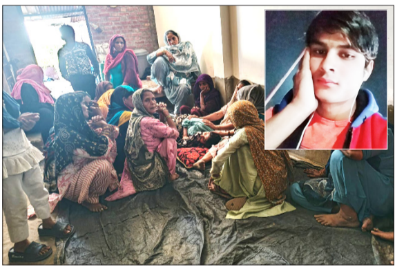
संचालक की मौत पर रोते-पीटते परिजन व इनसेट में मृतक का फाइल फोटो।