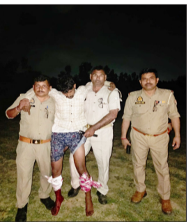
आरोपियों को ले जाती पुलिस।