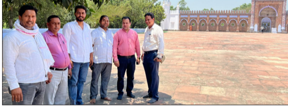
ईदगाह का निरीक्षण करते अधिशासी अधिकारी एवं सभासद।