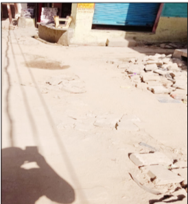
पाइपलाइन डालने के बाद जल निगम की लापरवाही से टूटी पड़ी सड़क।

शाहबाद। नगर में कई करोड़ रुपए से पानी की टंकियों का निर्माण किया जा रहा है, जिसके साथ लगभग 65 किलोमीटर पानी की पाइप लाइन भी बिछाई जा रही है। जल निगम ने कई मोहल्लों में पानी की पाइपलाइन डालने के बाद सड़कों को बदहाल हालत में छोड़ दिया है। जिसके चलते ईद उल अजहा की नमाज के लिए ईदगाह को जाने वाले नमाजी टूटी सड़कों से होकर गुजरेंगे, साथ ही साथ काफी समय से टूटी सड़कों से आने जाने वाले लोगों को रोजमर्रा बेशुमार परेशानी