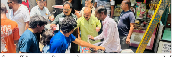
भीषण गर्मी में शरबत का वितरण करते हुए। -जागरण मोर्चा