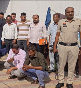
टीम के द्वारा पकड़ी गई पोर्टेबल मशीन।