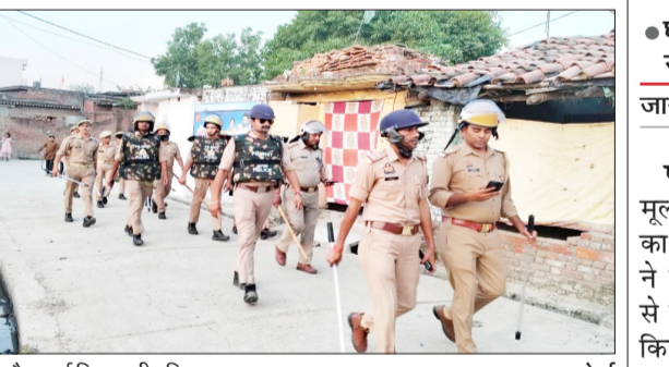
पुलेग मार्च निकालती पुलिस।

पूरनपुर। आगामी त्योहार ईद-उल-जुहा (बकरीद) आज है। इसको सकुशल, शांतिपूर्ण एवं सौहार्दपूर्ण वातावरण में संपन्न कराने के उद्देश्य से पुलिस पूरी तरह अलर्ट नजर आ रही है, पुलिस ने भारी पुलिस बल के साथ फ्लैग मार्च निकाला।