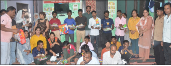
प्रशिक्षण केंद्र में खाद्य सामग्री का आनंद लेते।

चन्दौसी। आकांक्षा सोसाइटी द्वारा निराश्रित दिव्यांगन एवं दिव्यांग बच्चों के लिए सेवा एवं सहयोग कार्यक्रम का आयोजन किया गया। जिसमें संस्था के सदस्यों ने प्रशिक्षण केंद्र पहुंचकर दिव्यांग बच्चों एवं जरूरतमंद लोगों के साथ समय बिताया और उन्हें विभिन्न उपयोगी वस्तुएं वितरित की। कार्यक्रम का उद्देश्य दिव्यांग बच्चों के जीवन में खुशी, आत्मविश्वास की भावना को बढ़ावा देना रहा। कार्यक्रम में बच्चों के साथ विभिन्न मनोरंजक एवं खेल गतिविधियों का भी आयोजन किया गया। जिसमें बच्चों ने उत्साहपूर्वक भाग लिया। खेलकूद गतिविधियों ने बच्चों में नई ऊर्जा एवं