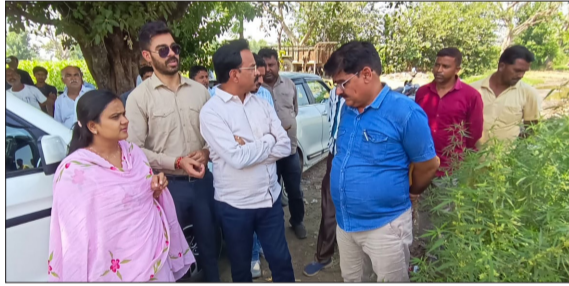
ब्रह्मव्रत तीर्थ का निरीक्षण करती एसडीएम, तहसीलदार व राजस्व टीम।

संभल। तीर्थ नगरी संभल में प्रशासन द्वारा प्राचीन धार्मिक स्थलों, तीर्थों और तालाबों की खोज, पैमाइश और अतिक्रमण हटाने का अभियान लगातार चलाया जा रहा है। 24 नवंबर के बाद शुरू हुए इस अभियान के तहत बुधवार को हयातनगर थाना क्षेत्र के मुजाहिदपुर सराय स्थित प्राचीन ब्रह्मव्रत तीर्थ पर प्रशासनिक और राजस्व विभाग की टीम पहुंची। प्रशासनिक अधिकारियों के निरीक्षण के दौरान जो तस्वीर सामने आई, उसने प्रशासनिक दावों की पोल खोल दी। सदियों पुराने इस धार्मिक तीर्थ का पवित्र तालाब नगर पालिका के गंदे नाले के पानी से पूरी तरह भरा मिला, जिससे ग्रामीणों