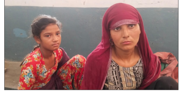
घायल।