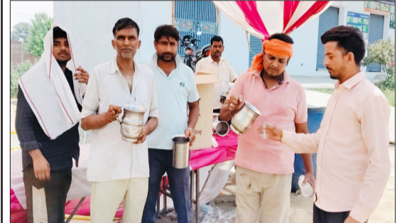
गांव हशमतगंज में राहगीरों को शर्वत वितरित करते लोग।