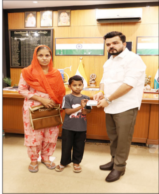
बालक को आयुष्मान कार्ड देते जिलाधिकारी।