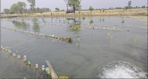
पलर्स फार्मिंग के जरिए सीपों में मोती की खेती करते किसान।