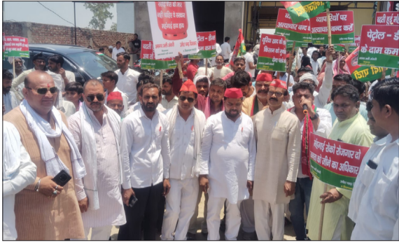
महंगाई के विरोध में प्रदर्शन करते सपा कार्यकर्ता।

ज्ञापन में कहा गया कि पेट्रोल-डीजल, रसोई गैस, खाद्य तेल, दालें और अन्य दैनिक जरूरत की वस्तुओं के दाम लगातार बढ़ रहे हैं, जिससे किसान, मजदूर, मध्यम वर्ग और गरीब परिवारों के सामने गंभीर आर्थिक संकट खड़ा हो गया है। प्रदर्शनकारियों ने केंद्र और प्रदेश सरकार पर महंगाई रोकने में विफल रहने का आरोप लगाया। राज्यसभा सांसद जावेद अली खान ने कहा कि पेट्रोल-डीजल पर लगाए गए भारी टैक्स के कारण परिवहन महंगा हो रहा है, जिसका सीधा असर हर वस्तु की कीमत पर पड़ रहा है। उन्होंने सरकार से तेल पर टैक्स कम करने और आवश्यक