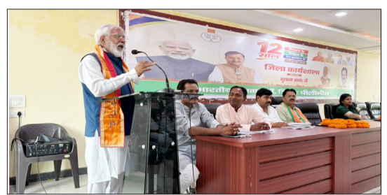
मोदी सरकार के 12 साल पूरे होने पर कार्यशाला में भाग लेते भाजपाई।