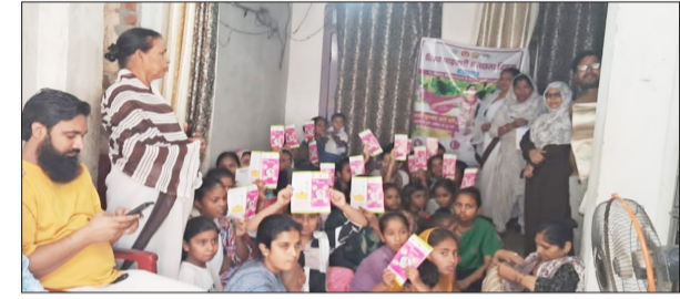
माहवारी स्वच्छता दिवस पर किशोरियों को जानकारी देते स्वास्थ्य कर्मी।

अमरिया। विश्व माहवारी स्वच्छता दिवस के अवसर पर अमरिया में किशोरियों को जागरूक करने हेतु विशेष कार्यक्रम आयोजित किया गया। कार्यक्रम में माहवारी से जुड़ी समस्याओं, स्वच्छता और स्वास्थ्य संबंधी जरूरी जानकारी साझा की गई। कार्यक्रम के दौरान किशोरावस्था में होने वाले शारीरिक एवं मानसिक बदलावों के बारे में विस्तार से जानकारी दी गई। विशेषज्ञों ने बताया कि इस उम्र में हार्मोनल बदलाव के कारण लड़कियों और लड़कों के शरीर में कई परिवर्तन होते हैं, जिनकी सही जानकारी होना जरूरी है ताकि किशोर-किशोरियां किसी प्रकार की घबराहट का शिकार न हों। किशोरियों को माहवारी स्वच्छता