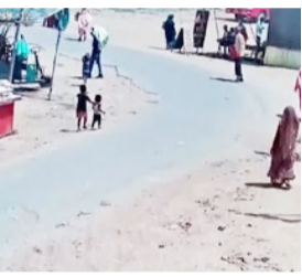
जागरण मोर्चा कार्यालय