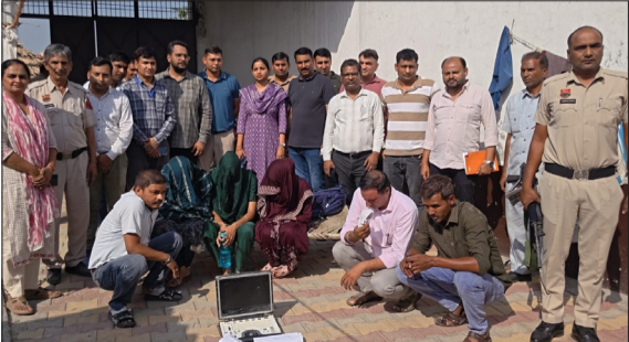
स्वास्थ्य टीम के द्वारा पकड़े गए आरोपी एवं पोर्टेबल मशीन।