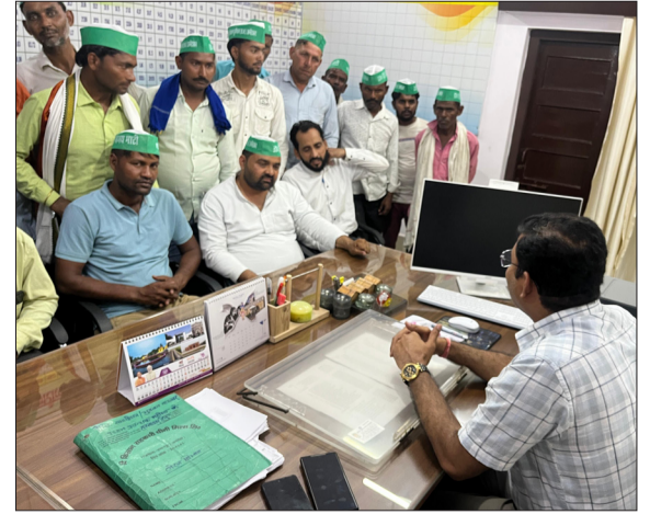
चीनी मिल जीएम से वार्ता करते हुए भाकियू बीआर अंबेडकर के पदाधिकारी।

हसनपुर। भारतीय किसान यूनियन बीआर अंबेडकर ने कालाखेड़ा चीनी मिल के मुख्य गन्ना अधिकारी पर करोड़ों रुपये के गबन और किसानों के उरलीडन का गंभीर आरोप लगाया है। संगठन ने मिल मैनेजर को पत्र भेजकर सीसीओ को तत्काल पद से हटाने और मुकदमा दर्ज कराने की मांग की है। यूनियन का आरोप है कि सीसीओ ने पर्वी वितरण और भुगतान में धांधली कर हजारों किसानों को आर्थिक नुकसान पहुंचाया है। संगठन ने चेतावनी दी है कि यदि जल्द कार्रवाई नहीं हुई तो वे उग्र आंदोलन करेंगे। भाकियू नेताओं ने निष्पक्ष उच्चस्तरीय