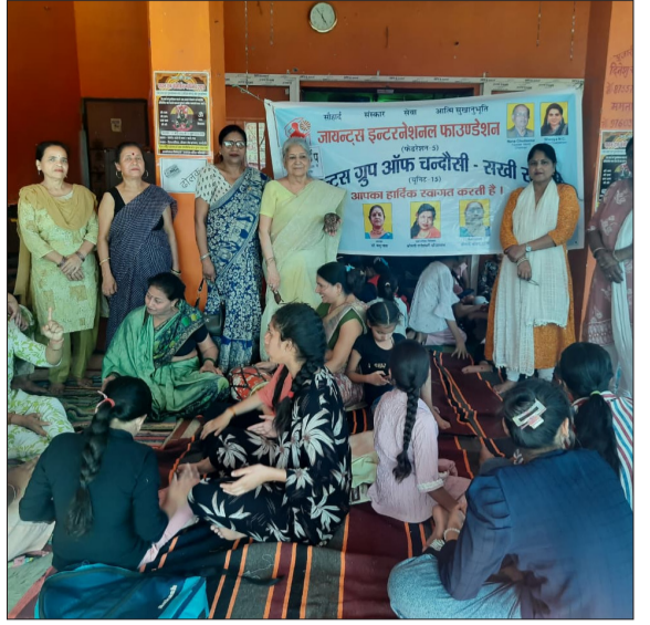
समर कैंप में विभिन्न कलाएं सीखती बालिकाएं।