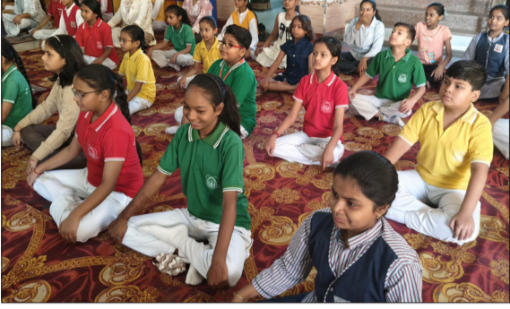
समर कैंप के दौरान प्राणायाम आसन करते हुए।

बच्चों ने संगीत की धुन पर थिरकते हुए दिया फिटनेस और टीम भावना का संदेश