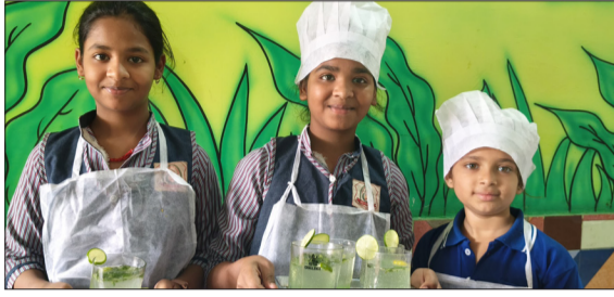
समर कैंप के दौरान अन्य गतिविधियां करते बच्चे।