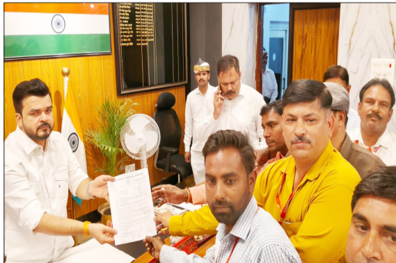
डीएम को ज्ञापन देते पदाधिकारी।