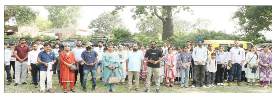
दुधवा नेशनल पार्क का भ्रमण करते वर्डेंट स्कूल के बच्चे।

जागरण मोर्चा कार्यालय पूरनपुर। द वर्डेंट पब्लिक स्कूल के विद्यार्थियों ने दुधवा नेशनल पार्क के अंतर्गत आने वाले किशनपुर वन्यजीव अभयारण्य का शैक्षिक भ्रमण किया। विद्यार्थियों ने सफारी के माध्यम से जंगल भ्रमण कर प्रकृति, वन्यजीवों और पर्यावरण के बारे में जानकारी प्राप्त की।