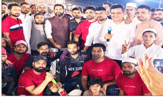
विजयी टीम के साथ मौजूद मुख्य अतिथि।