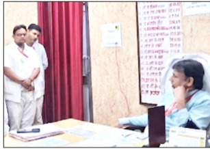
सीएमएस से वार्ता करते नर्सिंग स्टाफ।