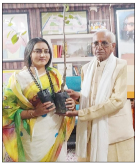
पौधों का रोपण होने जा रहा है।

● 13000 किलोमीटर की पर्यावरण संरक्षण यात्रा से प्रकृति संरक्षण का संदेश जागरण मोर्चा कार्यालय