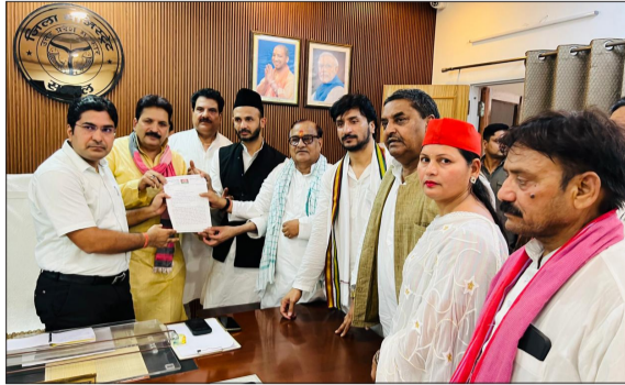
जिलाधिकारी को ज्ञापन सौंपते समाजवादी पार्टी के पदाधिकारी।