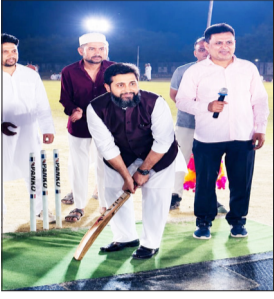
बॉल खेलकर मैच की शुरुआत करते मुख्य अतिथि।