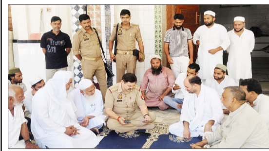
लोगों से वार्तालाप करते कोतवाल।