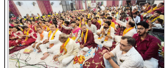
कार्यक्रम में मौजूद श्रद्धालु।