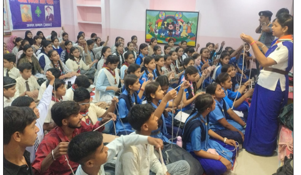
स्काउट गाइड के प्रशिक्षण में बच्चों को गांधी बांधना सिखाती प्रशिक्षक।