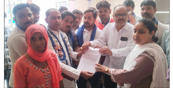
आजाद समाज पार्टी तहसीलदार को ज्ञापन सौंपते हुए।

बच्चों को कितानों से हटकर छिपी प्रतिभा को निखारने का बेहतरीन अवसर देता है। अंत में विद्यालय परिवार ने सभी प्रशिक्षकों और शिक्षकों का आभार जताया।