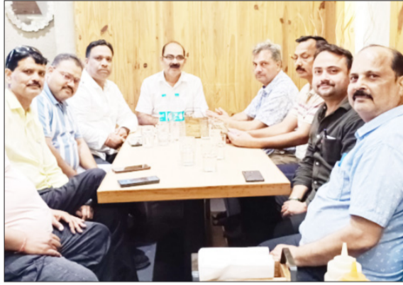
बैठक के दौरान मौजूद पदाधिकारी।