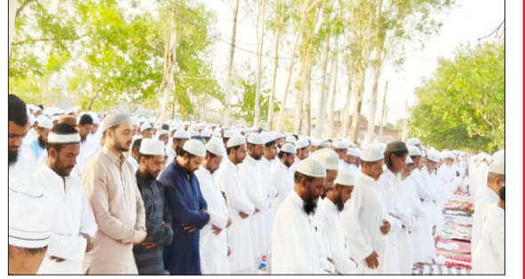
ईद गाह में ईदुल अजहा की नमाज अदा करते नमाजी।