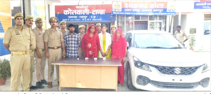
थाना टांडा में पुलिस की गिरफ्तार में आरोपी।

टांडा पुलिस ने किया खुलासा, कोर्ट में पेश करने के बाद भेजा जेल