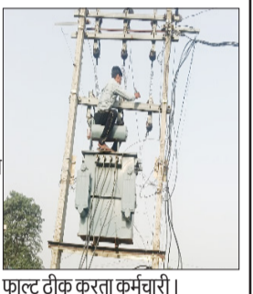
फाल्ट ठीक करता कर्मचारी।

पूरनपुर। नगर से लेकर देहात तक बिजली आपूर्ति बार-बार बाधित होने से लोगों को भारी परेशानी का सामना करना पड़ रहा है। रात भर बिजली आने-जाने का सिलसिला चलता रहता है। जिससे उपभोक्ताओं की नींद खराब हो रही है। इससे भरी गर्मी के बीच बिजली कटौती से छूटे बच्चों, बुजुर्गों और मरीजों को सबसे अधिक दिक्कत उठानी पड़ रही है। क्षेत्र के लोगों ने बताया कि शाम होते ही नगर से लेकर देहात तक बिजली आपूर्ति में व्यवधान शुरू हो जाता है।