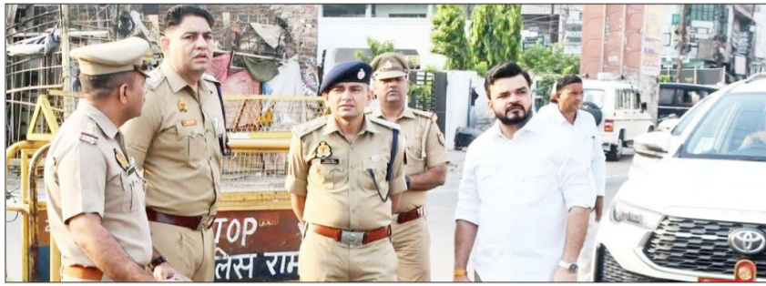
नमाज के दौरान ईदगाह चौराहे पर मौजूद डीएम और एसपी।