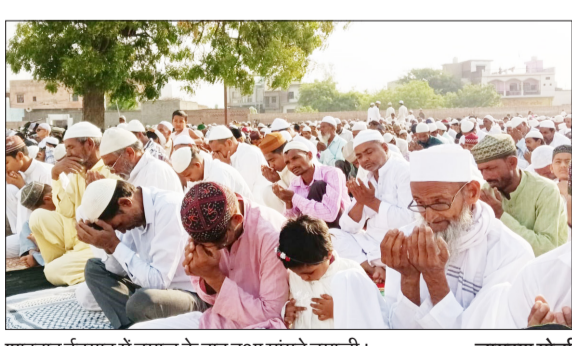
शाहबाद ईदगाह में नमाज के बाद दुआ मांगते नमाजी।