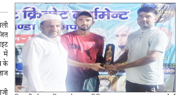
खिलाड़ी को सम्मानित करते मुख्य अतिथि।