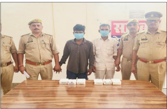
पुलिस की गिरफ्त में आरोपी।

पुलिस के अनुसार, 16/17 मई की रात ग्राम सुंदरनगर में लूट हुई थी। अज्ञात बदमाशों के खिलाफ मामला दर्ज किया गया था। पुलिस लगातार बदमाशों की तलाश में जुटी थी। बुधवार देर रात पुलिस