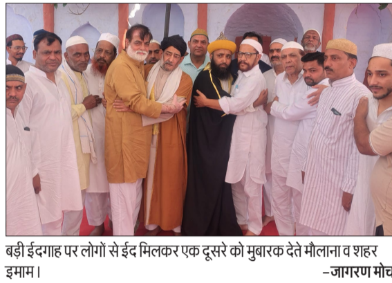
बड़ी ईदगाह पर लोगों से ईद मिलकर एक दूसरे को मुबारक देते मौलाना व शहर इमाम।