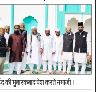
ईद की मुबारकबाद पेश करते नमाजी।

मसवासी। नगर मसवासी सहित आसपास के ग्रामीण क्षेत्रों में ईद-उल-अजहा गुरुवार को पूरे हर्षोल्लास, अकीदत और भाईचारे के माहौल में मनाया गया। सुबह से ही मस्जिदों और ईदगाहों में नमाजियों की भारी भीड़ उमड़ पड़ी। लोगों ने नए कपड़े पहनकर अल्लाह की बारगाह में सजदा किया और