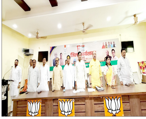
कार्यक्रम के दौरान मंच पर मौजूद मुख्य अतिथि, जिलाध्यक्ष।

की वैश्विक प्रतिष्ठा को नई ऊंचाइयों तक पहुंचाने का कार्य मोदी सरकार ने किया है। पार्टी कार्यकर्ताओं का दायित्व है कि