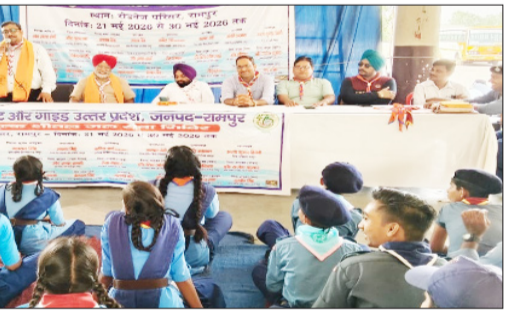
कार्यक्रम में बोलते मुख्य अतिथि।