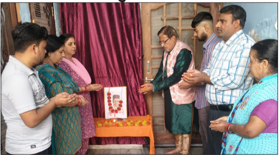
विनायक दामोदर सावरकर की जयंती मनाते पदाधिकारी।