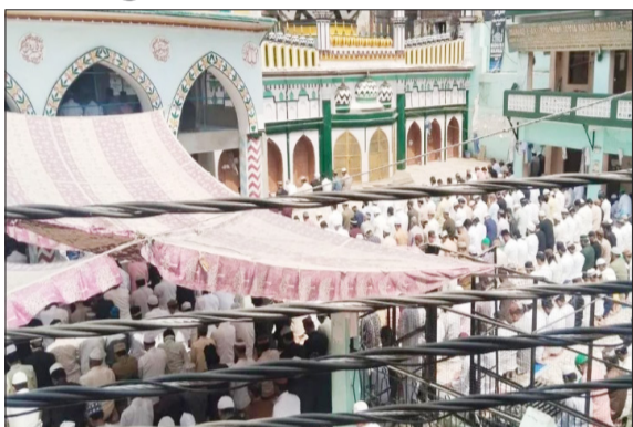
नमाज अदा करते नमाजी।

बरेली। शहर भर में ईद-उल-अजहा का त्योहार गुरुवार को पूरी अकीदत, अमन-ओ-सुकून और धार्मिक उत्साह के साथ मनाया गया। सुबह होते ही ईदगाह समेत शहर की छोटी-बड़ी मस्जिदों में नमाजियों की भारी भीड़ उमड़ पड़ी। नमाज के बाद लोगों ने एक-दूसरे से गले मिलकर ईद की मुबारकबाद दी, जबकि मुल्क में अमन, खुशहाली और भाईचारे के लिए खास दुआएं मांगी गईं। इसके साथ ही सुन्नेत इब्राहीमी यानी कुर्बानी का सिलसिला भी शुरू हो गया, जो 30 मई की शाम तक जारी रहेगा।