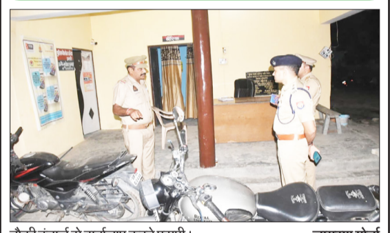
चौकी ईचार्ज से वार्तालाप करते एसपी।