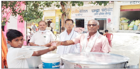
राहगीरों को शरबत देते ग्रामीण।