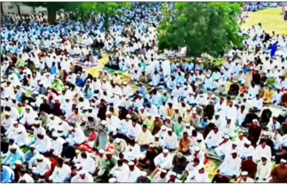
ईदगाह में नमाज अदा करते नमाजी।

हजरत इब्राहिम, हजरत इस्माइल और हजरत हाजरा की कुर्बानी को मुसलमान यादें रखे