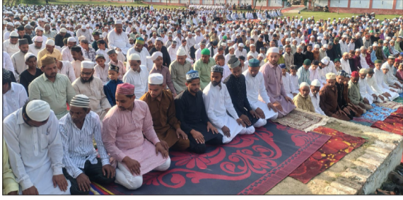
नमाज अदा करते मुस्लिम समाज के लोग।