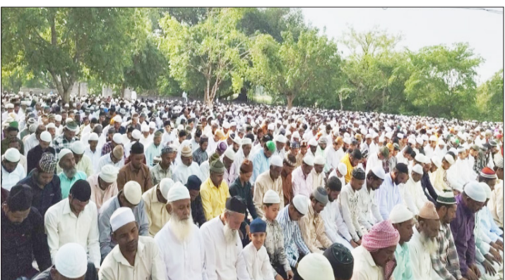
बिसौली में नमाज अदा करते मुस्लिम समुदाय के लोग।