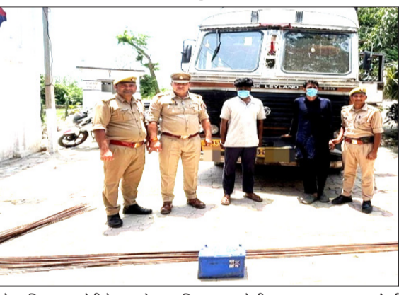
भोट पुलिस द्वारा चोरी के माल के साथ गिरफ्तार आरोपी।