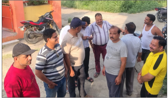
अक्रूरजी पुरम कालोनी में घटना के बाद आपस में वार्ता करते कालोनीवासी।