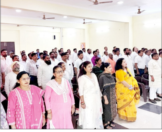
कार्यक्रम में मौजूद भाजपाई।