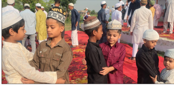
एक दूसरे को ईद मिलकर बधाई देते बच्चे।