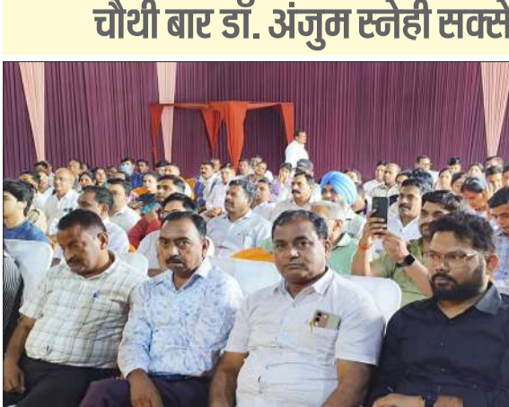
कार्यक्रम में मौजूद शिक्षक नेता।