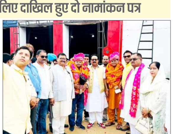
मुख्य अतिथियों के साथ मौजूद जिलाध्यक्ष एवं महामंत्री।