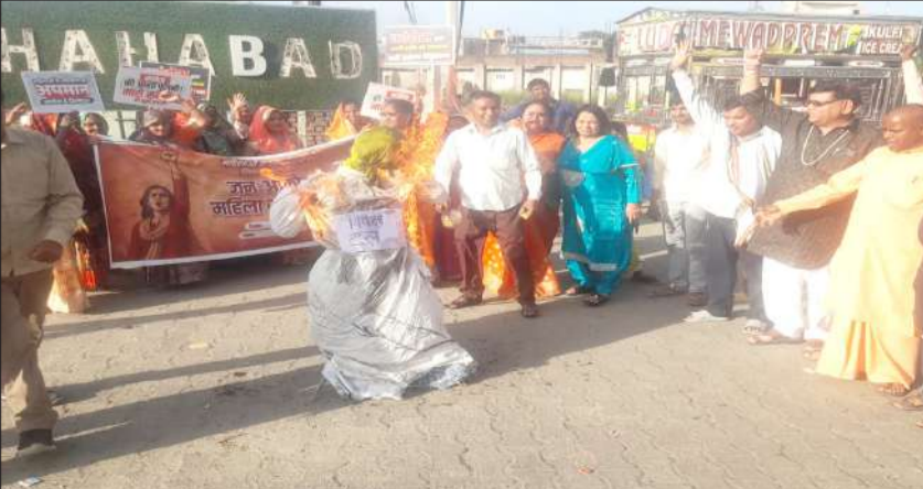
शाहबाद में विपक्ष का पुतला फूँकती भाजपा महिला मोर्चा की कार्यकर्ता।