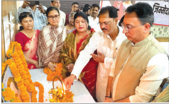
गांधी प्रेक्षा गृह में जन आक्रोश सम्मेलन में भाग लेते जितिन प्रसाद।