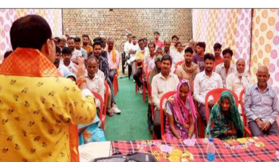
बैठक को संबोधित करते वकता।

रामपुर। भारतीय किसान संघ की बैठक मिलक खंड के ग्राम बंकराबाद में आयोजित की। बैठक में बड़ी संख्या में किसानों ने मिलक प्रशासन पर गंभीर आरोप लगाए। किसानों ने जिलाध्यक्ष से शिकायत करते हुए बताया कि उनके खेतों में जबरन सड़क डाली जा रही है, जबकि एक दबंग व्यक्ति के खेत में प्रस्तावित सड़क की पैमाइश पिछले एक वर्ष से तहसील प्रशासन द्वारा लगातार टाली जा रही है। इसके बावजूद आज तक कोई कार्रवाई नहीं की गई है। बैठक में किसानों ने डैचा (हरित खाद) बीजा का मुद्दा भी प्रमुखता से उठाया। किसानों ने बताया कि उन्हें बीज उपलब्ध नहीं हो रहा है,