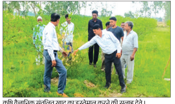
कृषि वैज्ञानिक संतुलित खाद का इस्तेमाल करने की सलाह देते।

ठाकुरद्वारा। कृषि विज्ञान केंद्र द्वारा मृदा स्वास्थ्य सुधार और कृषि उत्पादकता बढ़ाने के उद्देश्य से विकास खंड ठाकुरद्वारा के ग्राम प्रतापपुर में “संतुलित उर्वरक उपयोग” विषय पर जागरूकता कार्यक्रम आयोजित किया गया। कार्यक्रम में क्षेत्र के किसानों ने बह-चढ़कर भाग लिया और उर्वरकों के संतुलित प्रयोग व सही सतह पर उपयोग की जानकारी प्राप्त की।