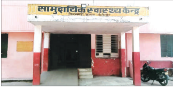
बिलसंडा का सामुदायिक स्वास्थ्य केंद्र। -जागरण मोर्चा

बिलसंडा। स्वास्थ्य विभाग की अनदेखी के चलते आखिर प्रसूताओं की जिंदगी से खिलवाड़ कब तक होता रहेगा। आधी आबादी के स्वास्थ्य के प्रति दुलमुल रवैया ही कहा जाएगा, जो कई वर्षों से नगर के सीएचसी पर महिला चिकित्सक की तैनाती ही नहीं हुई। सीएचसी पर समुचित व्यवस्था न होने की वजह से प्रसूताओं को झोलाछापों की शरण में जाना पड़ रहा है। उधर गत वर्ष एएनएम द्वारा किए गए ऑपरेशन के कारण एक प्रसूता की जान भी चली गई थी। बावजूद इसके सीएचसी पर आज तक महिला चिकित्सक की तैनाती नहीं हुई। बता दें कि नगर स्थित सीएचसी पर कहने को तो