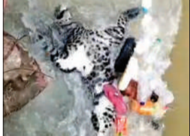
को ध्यान में रखते हुए मामले की गंभीरता से जांच की जा रही है। पोस्टमार्टम रिपोर्ट आने के बाद ही वास्तविक कारण सामने आ सकेगा। घटना के बाद वन विभाग ने आसपास के गांवों में अलर्ट जारी कर दिया है। ग्रामीणों को सतर्क रहने, अकेले खेतों में न जाने और किसी भी संदिग्ध गतिविधि की सूचना तुरंत देने की सलाह दी गई है। साथ ही यह भी जांच की जा रही है कि तेंदुआ स्थानीय क्षेत्र का था या पानी के बहाव के साथ कहीं और से बहकर यहां पहुंचा।

पीलीभीत। सराय सुंदरपुर क्षेत्र के नारायण टेर गांव के पास नहर में एक तेंदुआ का शव मिलने से इलाके में हड़कंप मच गया। जैसे ही ग्रामीणों ने नहर में बहता शव देखा, मौके पर भारी भीड़ जमा हो गई और दहशत का माहौल बन गया।