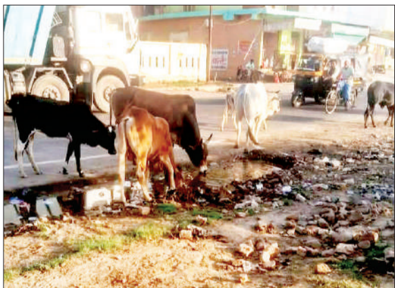
हाईवे पर घूम रहे आवारा पशु। -जागरण मोर्चा

पूरनपुर। पूरनपुर-बंडा हाईवे पर ये बेसहारा पशु लोगों की परेशानी का सबब बने हुए हैं। इन पशुओं की वजह से हादसे की आशंका बनी रहती है। झुंड में घूमते ये पशु अचानक वाहन चालकों के सामने आ जाते हैं। स्थिति यह है कि बेसहारा गाय, बैल और सांड बीच सड़क पर बैठे रहते हैं, जिससे लोगों को आवागमन में काफी परेशानी होती है। पूरनपुर- बंडा हाईवे पर आवारा पशुओं कि भरमार है। आवारा पशुओं से हो रही परेशानी की शिकायत कई लोग अधिकारियों से भी कर चुके हैं। लेकिन फिर भी समस्या का समाधान नहीं हो पा रहा है। मुख्य जगहों पर