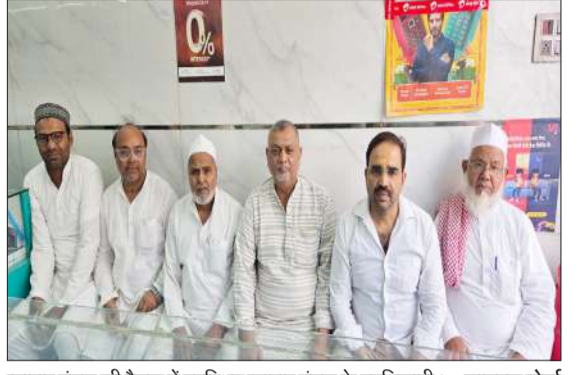
व्यापार मंडल की बैठक में उपस्थित व्यापार मंडल के पदधिकारी।