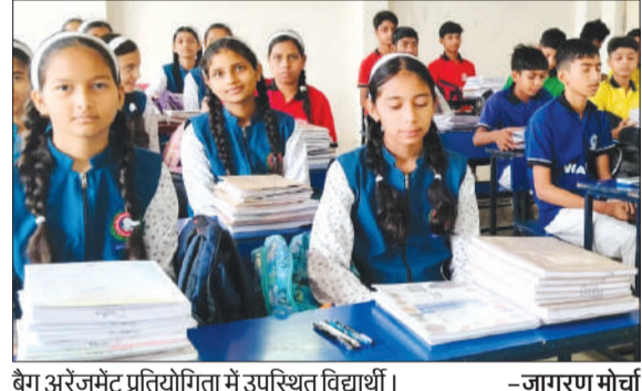
बैग अरेजमेंट प्रतियोगिता में उपस्थित विद्यार्थी।

कोतवाली देहात। के एस चिल्ड्रन्स एकेडमी में कक्षा 1 से 8 तक के विद्यार्थियों के लिए “बैग अरेजमेंट प्रतियोगिता” का भव्य आयोजन किया गया। प्रतियोगिता का मुख्य उद्देश्य विद्यार्थियों में स्वच्छता, अनुशासन, समय प्रबंधन तथा पुस्तकों एवं कॉपियों को व्यवस्थित रखने की आदत विकसित करना था। प्रतियोगिता के दौरान सभी कक्षा अध्यापकों ने विद्यार्थियों के स्कूल बैग की जांच की तथा बैग की स्वच्छता, पुस्तकों की उचित व्यवस्था, कवर एवं टाइम-टेबल के अनुसार सामग्री को ध्यान में रखते हुए प्रत्येक कक्षा से प्रथम, द्वितीय एवं तृतीय स्थान प्राप्त करने वाले विद्यार्थियों का चयन किया। विद्यार्थियों ने पूरे उत्साह एवं लगन के साथ प्रतियोगिता में भाग लिया और अपने