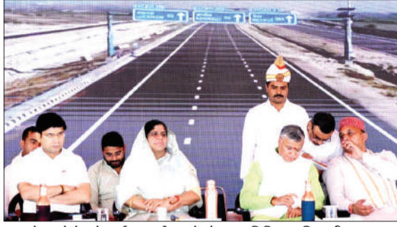
एक्सप्रेस-वे के लोकार्पण कार्यक्रम में मौजूद अतिथि व अधिकारीगण।

चन्द्रौसी। मेरठ से प्रयागराज तक 594 किलोमीटर लंबे गंगा एक्सप्रेस-वे का उद्घाटन हरदोई में प्रधानमंत्री नरेंद्र मोदी द्वारा किया गया। उक्त कार्यक्रम का सजीव प्रसारण तथा जनपद स्तरीय कार्यक्रम का आयोजन में विकासखंड बहजोई के ग्राम लहरावन गंगा एक्सप्रेस-वे इंटरचेंज के पास किया गया।