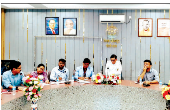
जिला स्तरीय उद्योग बंधु एवं व्यापार बंधु की बैठक में भाग लेते डीएम।

पीलीभीत। जिलाधिकारी ज्ञानेन्द्र सिंह की अध्यक्षता में गांधी सभागार में जिला स्तरीय उद्योग बंधु एवं व्यापार बंधु की बैठक आयोजित हुई, जिसमें निवेश मित्र पोर्टल की विभागावार समीक्षा की गई। समीक्षा में कृषि, राजस्व, एमएसएमई, प्रदूषण नियंत्रण बोर्ड, विद्युत व औद्योगिक विकास विभाग के कई आवेदन लंबित पाए गए, जिस पर जिलाधिकारी ने सभी संबंधित अधिकारियों को शीघ्र निस्तारण के निर्देश दिए। बैठक में भरा पचपेड़ा औद्योगिक क्षेत्र के निर्माण कार्यों की प्रगति, उद्यमियों की