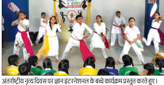
अंतर्राष्ट्रीय नृत्य दिवस पर ज्ञान इंटरनेशनल के बच्चे कार्यक्रम प्रस्तुत करते हुए।

की गाड़ी के सामने महिलाएं खड़ी होकर उनकी गाड़ियों को घेर लिया। उनका आरोप है कि भट्टी के कारण गांव का माहौल खराब हो रहा है, घरेलू कलह बढ़ रही है और युवाओं पर बुरा असर पड़ रहा है। उन्होंने प्रशासन के खिलाफ जमकर नारेबाजी की और भट्टी को तत्काल बंद कराने की मांग की। मौके पर मौजूद सीओ और तहसीलदार ने महिलाओं को काफी समझाया। लेकिन महिलाएं शराब की भट्टी को हटाने की मांग पर अड़ी रहीं। उनका कहना है कि यदि जल्द ही भट्टी पर कार्रवाई नहीं हुई, तो आंदोलन और तेज किया जाएगा। इसके बाद दोनों अधिकारी वापस लौट गए। काफी देर तक मामला चलता रहा। इस दौरान बड़ी संख्या में महिलाएं मौके पर मौजूद रहीं।