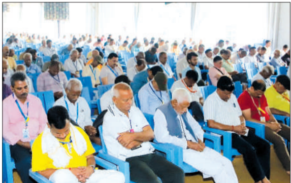
कार्यक्रम में मौजूद पदाधिकारी।