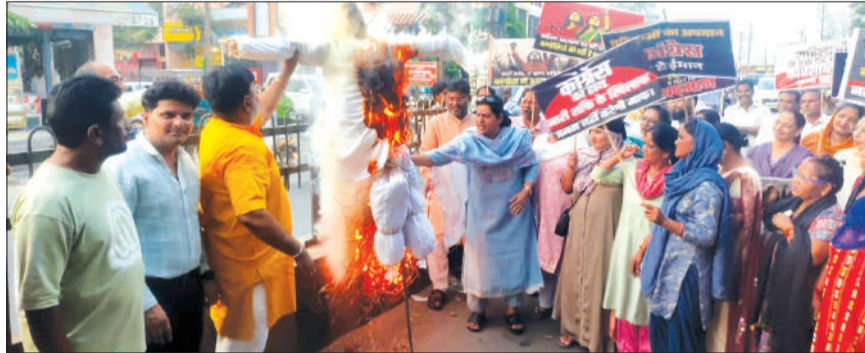
विपक्ष का पुतला फूंकते भाजपा कार्यकर्ता।

किरतपुर। किरतपुर नगर मंडल में मंगलवार को भारतीय जनता पार्टी द्वारा जनआक्रोश महिला पदयात्रा निकाली गई, जिसमें बड़ी संख्या में महिलाओं और भाजपा कार्यकर्ताओं ने भाग लिया। पदयात्रा के दौरान कार्यकर्ताओं ने विपक्ष के खिलाफ जमकर नारेबाजी की और पुतला फूंककर अपना विरोध दर्ज कराया।