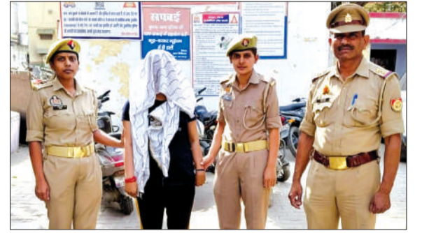
पुलिस की गिरफ्त में महिला आरोपी।

पति और उसकी प्रेमिका की प्रताड़ना से तंग आकर महिला ने की थी आत्महत्या