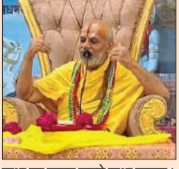
कथा का वाचन करते कथा वाचक।