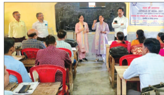
भारत की जनगणना का प्रशिक्षण लेते प्रशिक्षु।

चन्द्रौसी। भारत की जनगणना 2027 को लेकर प्रगणकों व पर्यवेक्षकों के तीन दिवसीय प्रशिक्षण दूसरे दिन भी दिया गया। जिसमें प्रथम चरण में मकान सूचीकरण एवं मकानों की गणना के अंतर्गत प्रगणकों व पर्यवेक्षकों को आयोजित तीन दिवसीय प्रशिक्षण कार्यक्रम के दूसरे दिन 34 बैचों को संपन्न किया।