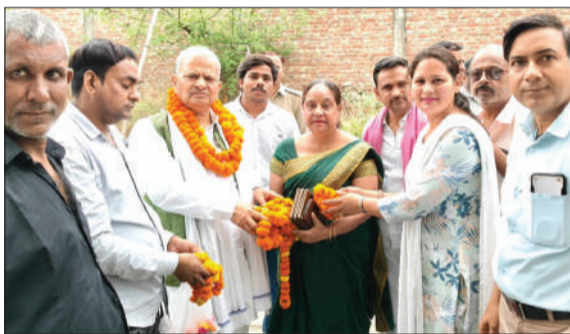
सपा के कार्यक्रम में मुख्य अतिथि नरेश उत्तम पटेल का स्वागत करते पदाधिकारी।

चन्द्रौसी। समाजवादी पार्टी की पीडीए पंचायत कार्यक्रम का आयोजन गांव देवरखेड़ा में किया गया। कार्यक्रम के मुख्य अतिथि सपा के संस्थापक सदस्य, फतेहपुर लोकसभा से सांसद एवं पूर्व प्रदेश अध्यक्ष नरेश उत्तम पटेल मौजूद रहे। कार्यक्रम में मुख्य अतिथि नरेश उत्तम पटेल ने कहा कि भाजपा देश के संविधान को धीरे-धीरे कमजोर करने व बदलने की दिशा में कार्य कर रही है। उन्होंने कहा कि महिला आरक्षण बिल के नाम पर भाजपा परिसीमन के जरिए राजनीतिक भ्रम फैलाना चाहती थी। लेकिन जब उसकी मंशा सफल नहीं हुई तो विपक्ष को महिला विरोधी बताकर झूठा प्रचार-प्रसार शुरू कर दिया