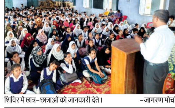
शिविर में छात्र-छात्राओं को जानकारी देते।

चन्द्रौसी। उत्तर प्रदेश राज्य विधिक सेवा प्राधिकरण लखनऊ एवं जनपद न्यायाधीश/अध्यक्ष जिला विधिक सेवा प्राधिकरण के आदेश तथा जिला विधिक सेवा प्राधिकरण के सचिव के नेतृत्व में एफआर इंटर कालेज में विधिक साक्षरता एवं जागरूकता शिविर का आयोजन किया गया।