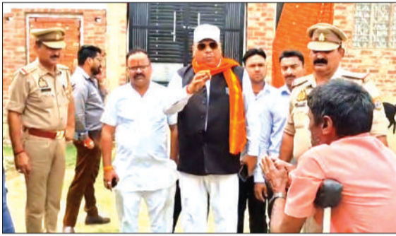
पीड़ित परिवार से मिलते हिंदू युवा संगठन के प्रदेशाध्यक्ष।