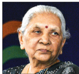
राज्यपाल आनंदीबेन पटेल।

बरेली। उत्तर प्रदेश की राज्यपाल आनंदीबेन पटेल का बरेली दौरा कल तय है। गुरुवार को वह शहर में शिक्षा, बाल संरक्षण और संस्थागत व्यवस्थाओं का जायजा लेंगी। उनके दौरे को लेकर जिला प्रशासन पूरी तरह अलर्ट मोड में है और तैयारियां अंतिम चरण में पहुंच चुकी हैं। निर्धारित कार्यक्रम के मुताबिक राज्यपाल सुबह 10:45 बजे चौधरी चरण सिंह अंतरराष्ट्रीय हवाई अड्डा लखनऊ से रवाना होंगी 11:20 बजे बरेली के त्रिशूल हवाई अड्डे पहुंचेंगी। यहां से सीधे दिशा इंटर कॉलेज जाएंगी, जहां 11:25 से 12:30 बजे तक स्कूल की व्यवस्थाओं, शिक्षण गुणवत्ता और संसाधनों की हकीकत