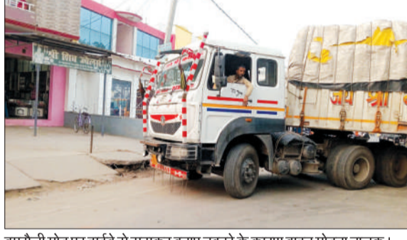
बमरोली मोड़ पर हाईवे से सटाकर बनाए चबूतरे के कारण वाहन मोड़ता चलक।

बिलसंडा। नगर के बमरोली तिराहे पर एक व्यवसायी द्वारा हाईवे से सटाकर चबूतरा बनाया गया है। जिस कारण से हर रोज जाम की स्थिति होने के बावजूद भी जिम्मेदार मौन साधे हुए हैं। यह अलग बात है कि पीडब्ल्यूडी द्वारा अतिक्रमण हटवाने के लिए नाप जोख भी कराई जा चुकी है, परंतु चबूतरा आज तक हटवाने की जरूरत नहीं समझी गई, जबकि चबूतरे की वजह से भारी वाहनों को मोड़ने में चालकों को खासी कठिनाई का सामना करना पड़ता है। किसी दिन भी बड़ा हादसा हो सकता है।