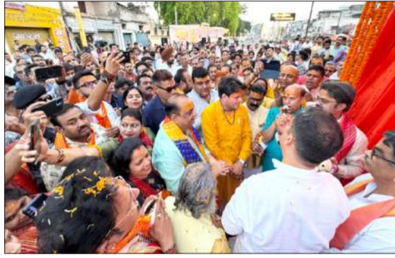
जूजा अर्चना करते पंडित।

परंपरा जीवंत रहे। ज्वालानगर में बने भव्य श्रीराम चौक के बाद अब सिविल लाइंस में भगवान परशुराम चौक का निर्माण कराया गया है। नगर पालिका की ओर से करीब आठ लाख रुपये की