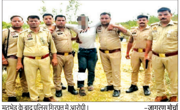
मुठभेड़ के बाद पुलिस गिरफ्त में आरोपी।

बिजनौर। जनपद के चांदपुर थाना क्षेत्र में गोवध से जुड़े मामले में पुलिस को बड़ी सफलता मिली है। बीते दिनों दर्ज मामले में कार्रवाई करते हुए पुलिस ने एक आरोपी को मुठभेड़ के बाद गिरफ्तार कर लिया, जबकि उसका एक साथी मौके से फरार हो गया।