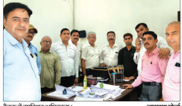
बैठक में उपस्थित अधिवक्ता।

कांठ। बिश्नोई समाज के वरिष्ठ अधिवक्ताओं द्वारा हुई बैठक में राज्यसभा सांसद रेखा शर्मा द्वारा बिश्नोई रत्न चौधरी भजन लाल बिश्नोई के प्रति की गई अमर्यादित एवं अशोभनीय टिप्पणी पर कड़ा विरोध प्रकट करते हुए उनके विरुद्ध कार्यवाही नहीं होने पर अधिवक्ताओं ने लोक लोकतांत्रिक स्तर पर विधिक कार्यवाही करने चेतावनी दी है। बुधवार को तहसील में बिश्नोई समाज के अधिवक्ताओं की एक महत्वपूर्ण बैठक आहूत की गई, जिसमें राज्यसभा सांसद रेखा शर्मा द्वारा बिश्नोई रत्न, हरियाणा के पूर्व मुख्यमंत्री चौधरी भजन लाल बिश्नोई के प्रति की गई अमर्यादित एवं अशोभनीय टिप्पणी को घोर निंदा एवं कड़ा विरोध किया गया। बैठक में उपस्थित अधिवक्ताओं