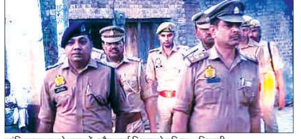
शांति व्यवस्था को नार में फ्लैग मार्च निकालते पुलिस अधिकारी।

कांठ। तहसील क्षेत्र में तेंदुओं के बढ़ते हमलों के बावजूद प्रशासन लापरवाह बना हुआ है। ग्राम रमपुरा उर्फ रामनगर स्थित गौशाला की दीवार लंबे समय से टूटी पड़ी है, जिससे यहाँ संरक्षित लगभग 220 पशुओं पर खतरा मंडरा रहा है। क्षेत्र में पिछले 40 दिनों में तेंदुआ सात लोगों को शिकार बना चुका है, जिससे ग्रामीणों में भारी दहशत है। सुरक्षा के नाम पर गिरी हुई दीवार की जगह कम ऊँचाई की टीनों खड़ी की गई हैं, जिसे तेंदुआ आसानी से फाँद सकता है। पूर्व में भी यहाँ एक गौवंश पर हमला हो चुका है। गौ सेवकों और ग्रामीणों ने चेतावनी दी है कि यदि दीवार को जल्द पक्का नहीं कराया गया, तो कोई बड़ी अनहोनी हो सकती है। फिलहाल, खौफ के साये में कर्मचारी और पशु दोनों ही असुरक्षित महसूस कर रहे हैं।