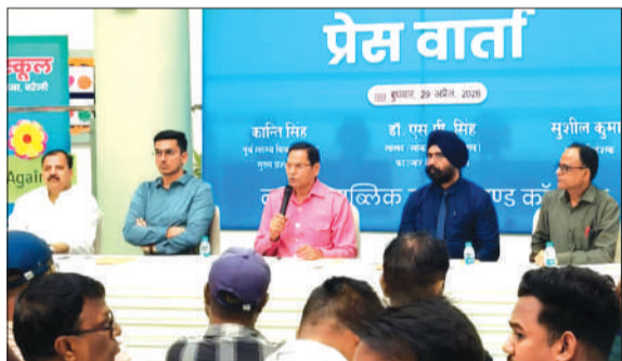
नए खुलने वाले लखनऊ पब्लिक स्कूल के बारे में जानकारी देते स्कूल प्रशासनिक अधिकारी।

बरेली। शिक्षा क्षेत्र में एक और बड़ा विस्तार करते हुए लखनऊ पब्लिक स्कूल्स एंड कॉलेजेस समूह अपनी 16वां शाखा का शुभारंभ बरेली में करने जा रहा है। सेक्टर-3, रामगंगा नगर आवासीय योजना में निर्मित इस नए विद्यालय का उद्घाटन 30 अप्रैल 2026 को अपराह्न 4 बजे उत्तर प्रदेश की राज्यपाल आनंदीबेन पटेल द्वारा किया जाएगा। कार्यक्रम में झारखंड के राज्यपाल संतोष गंगवार सहित कई जनप्रतिनिधि और गणमान्य अतिथि शामिल होंगे। संस्थान के अनुसार, वर्ष 1983 में स्थापित यह समूह आज गुणवत्ता, अनुशासन और