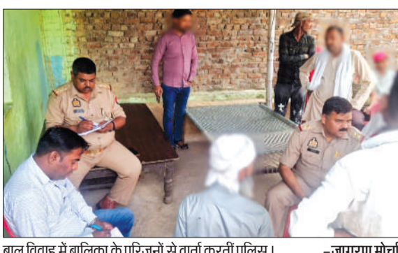
बाल विवाह में बालिका के परिजनों से वार्ता करती पुलिस।