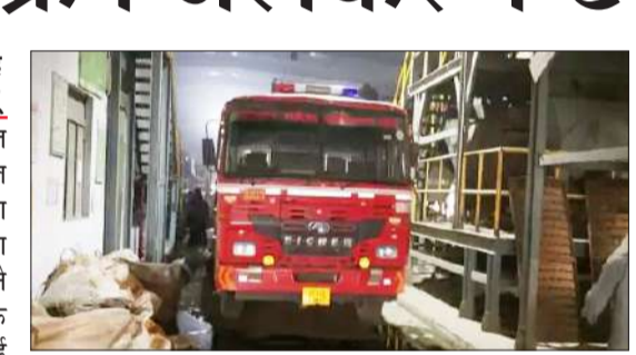
नेशनल हाईवे स्थित फैक्ट्री में खड़ी फायर ब्रिगेड।

रामपुर। नेशनल हाईवे स्थित गणेश पॉल्टेक्स लिमिटेड जीपीएल फैक्ट्री के एक हिस्से में आग लग गई। प्लास्टिक स्क्रेप में लगी आग पर दमकल की दो गाड़ियों ने करीब ढाई घंटे की मशकत के बाद काबू पाया। घटना में कोई जनहानि नहीं हुई है। बुधवार सुबह करीब पांच बजे फैक्ट्री के अंदर स्क्रेप और वांशिंग लाइन वाले हिस्से में अचानक आग की लपटें उठने लगीं। प्लास्टिक स्क्रेप होने के कारण आग तेजी से फैली, जिससे हड़कंध मच गया। कर्मचारियों ने खुद आग बुझाने का