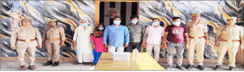
पटवाई पुलिस की गिरफ्त में आरोपी।