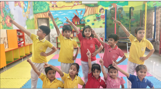
समर कैंप के दौरान बच्चे प्रतिभाग करते हुए।

हसनपुर। नगर के प्रतिष्ठित विद्यालय एच.एस.एस. पब्लिक स्कूल में चल रहे चार दिवसीय समर कैंप का शुक्रवार को बड़े ही धूमधाम, हपोल्लास एवं उत्साह के साथ समापन हुआ। कैंप में विद्यार्थियों ने रचनात्मक, शारीरिक और मनोरंजक गतिविधियों में उत्साहपूर्वक भाग लेकर बच्चों द्वारा अपनी प्रतिभा का बहुत ही सुंदर तरीके से प्रदर्शन किया। समर कैंप में कक्षा 1 से लेकर कक्षा 8 तक के विद्यार्थियों ने प्रतिभाग किया। समर कैंप की शुरुआत योग सत्र से हुई, जहाँ बच्चों ने योग प्रशिक्षकों के मार्गदर्शन में स्वस्थ जीवन शैली के महत्व को समझा और शारीरिक एवं मानसिक संतुलन बनाए रखने के उपाय भी सीखे। इसके बाद 'क्ले पॉटर' में बच्चों ने सुंदर फ्लायर पॉट बनाए