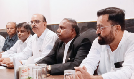
प्रेस वार्ता में पत्रकारों से संवाद करते कांग्रेसी।