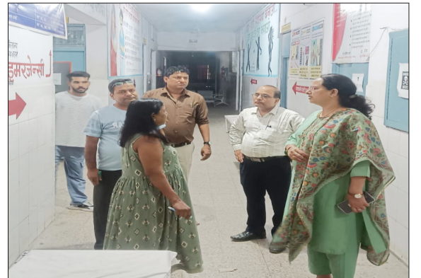
मिलक सीएचसी का निरीक्षण करती सीएमओ।