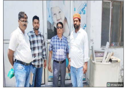
अस्पताल को सील करने पहुंची स्वास्थ्य विभाग की टीम।

टांडा। नगर के भगतपुर मोड़ स्थित एक निजी अस्पताल में डिलीवरी के दौरान मासूम बच्चे की जान चली गई। आरोप है कि एम के नाम से संचालित अस्पताल में नॉर्मल डिलीवरी के नाम पर गुरुवार शाम भर्ती की गई। गर्भवती महिला के शुक्रवार सुबह 6 बजे डिलीवरी के दौरान नवजात की मौत हो गई। सूचना के बाद पहुंचे परिजनों और रिश्तेदारों ने अस्पताल में जमकर हंगामा काटा। परिजनों ने अस्पताल स्टॉफ पर बदसलूकी एवं मारपीट करने का आरोप लगाया है। मौके पर पहुंची पुलिस ने मामले