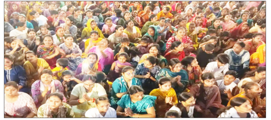
कार्यक्रम में मौजूद भक्त।