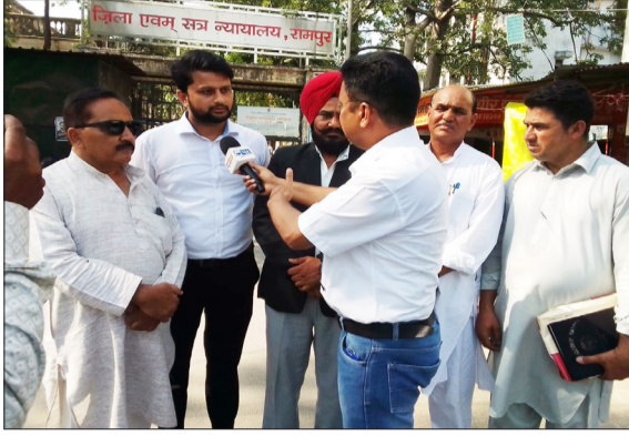
कचहरी परिसर में मीडिया से बातचीत करते सपा समर्थक।