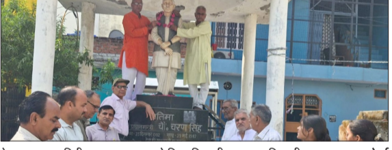
वेयरहाउस का निरीक्षण कर बाहर आते जिलाधिकारी व अन्य अधिकारी।