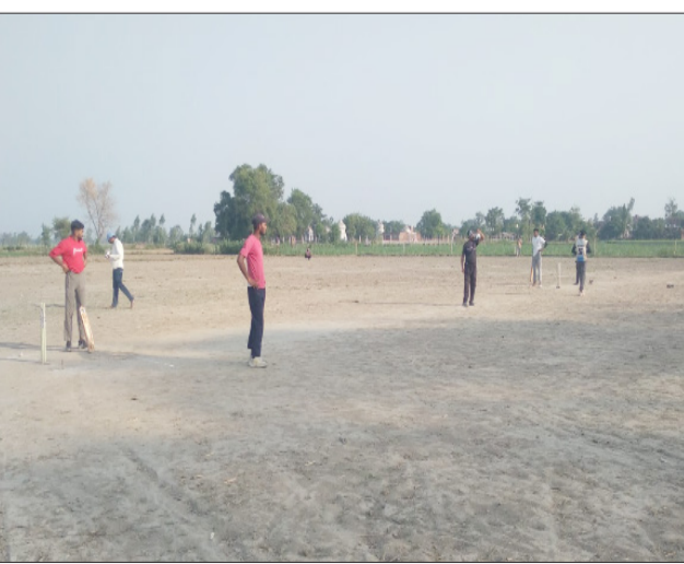
घुंघुचाई में मैच खेलते खिलाड़ी।

पूरनपुर/घुंघुचाई। घुंघुचाई कस्बा में चल रहे क्रिकेट टूर्नामेंट में घुंघुचाई ने खानपुर चुकटिहाई को 36 रनों से हराकर मैच जीत लिया। इस दौरान बड़ी संख्या में दर्शक मौजूद रहे। कस्बा घुंघुचाई में चल रहे क्रिकेट टूर्नामेंट में शुक्रवार को घुंघुचाई और खानपुर चुकटिहाई के बीच मैच खेला गया। घुंघुचाई ने टॉस जीतने के बाद पहले बल्लेबाजी करने का फैसला लिया। शुरुआत में बल्लेबाजों ने संभलकर खेलते हुए रन गति बढ़ाने का प्रयास किया। घुंघुचाई ने निर्धारित 14 ओवरों में 115 रन बनाए, लक्ष्य का पीछा करने उतरी खानपुर चुकटिहाई की शुरुआत ठीक नहीं रही। एक एक कर विकेट गिरते रहे। खानपुर चुकटिहाई की पूरी टीम 79 रन पर ऑल आउट हो गई। घुंघुचाई ने 36 रनों से मैच जीत लिया। मैदान पर लगे शानदार चौकों और लंबे छवकों ने दर्शकों को रोमांचित कर दिया।