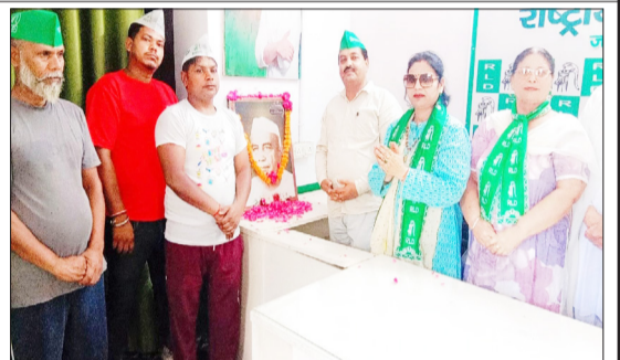
कार्यक्रम के दौरान मौजूद पदाधिकारी। -जागरण मोर्चा