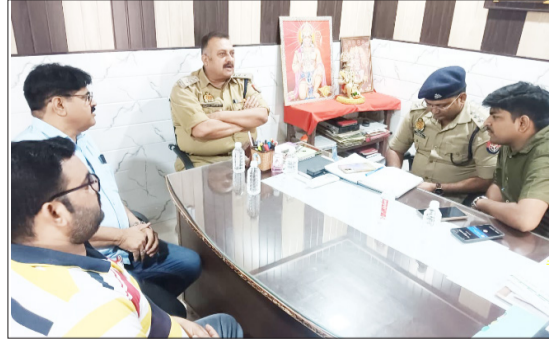
पुलिस अधिकारियों से वार्ता करते हुए व्यापार मंडल के पदाधिकारी।