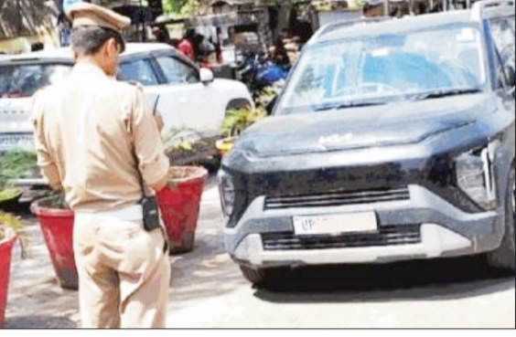
ने लगातार नियम तोड़ने वाले वाहन स्वामियों के खिलाफ 36,868 डीएल और आरसी सस्पेंशन की रिपोर्ट परिवहन विभाग को भेजी। इनमें 20,303 मामले वर्ष 2024 और 16,565 मामले वर्ष 2025 के हैं। पुलिस का दावा है कि इतनी बड़ी संख्या में रिपोर्ट भेजने के बावजूद अब तक अपेक्षित स्तर पर कार्रवाई नहीं हो सकी। ट्रैफिक पुलिस ने लगातार उल्लंघन करने वाले 48 वाहनों को 'वाहन पोर्टल' पर ब्लैकलिस्ट कर दिया है। इन वाहनों का न तो पीयूसी बन सकेगा, न बीमा और न ही ट्रांसफर हो पाएंगे। कई मामलों में चालान 90 दिन से

बरेली। ट्रैफिक नियम तोड़ने वालों पर बरेली ट्रैफिक पुलिस ने पिछले दो वर्षों में रिकॉर्ड कार्रवाई की, लेकिन परिवहन विभाग की धीमी रफ्तार के कारण नियम तोड़ने वालों के हौसले अब भी बुलंद हैं। हालात यह हैं कि जिले में एक ही वाहन पर 158 तक चालान दर्ज हैं, जबकि 48 ऐसे वाहन चिह्नित हुए हैं जिन पर कुल 5,602 चालान लंबित हैं। इसके बावजूद बड़ी संख्या में वाहन स्वामियों के खिलाफ लाइसेंस और आरसी निलंबन की कार्रवाई फाइलों में अटकती हुई है। ट्रैफिक पुलिस के आंकड़ों