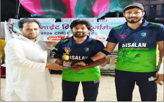
खिलाड़ियों को पुरस्कार देकर सम्मानित करते मुख्य अतिथि।