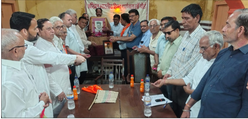
वीर सावरकर की जयंती मनाते बोर्ड के पदाधिकारी।