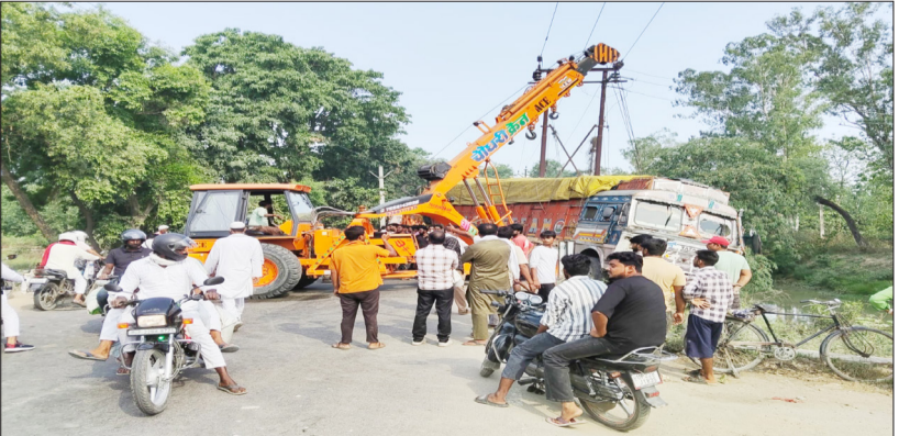
हकीमगंज मार्ग स्थित फंसे ट्रक को निकालती हाइड्रा

रामपुर/सैदनगर। अजीमनगर थाना क्षेत्र के अंतर्गत खोद लालपुर रोड पर हकीम गंज के सामने एक दर्दनाक सड़क हादसा सामने आया है। यहां एक कैंटर द्वारा अचानक ब्रेक लगाने के कारण पीछे से आ रहा ट्रक वेकावू होकर सड़क किनारे नहर की तरफ बने डिवाइडर में जा फंसा। हादसे के बाद रोड पर दोनों तरफ लंबा जाम लग गया, जिससे राहगीरों को भारी परेशानी का सामना करना पड़ा।