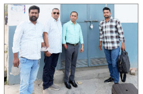
नर्सिंग होम को सील करती स्वास्थ्य विभाग की टीम।

रामपुर। थाना टोंडा क्षेत्र में नवजात की मौत के बाद स्वास्थ्य विभाग के आंखों पर बंधी पट्टी खुल गई है। स्वास्थ्य विभाग की टीम ने टोंडा क्षेत्र में चार क्लीनिकों पर सील लगा दी है। साथ ही समस्त संचालकों के खिलाफ थाना में एफआईआर दर्ज कराए जाने को तहरीर भी सौंप दी है।