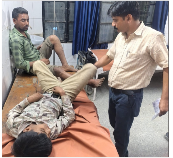
सीएचसी में घायल का उपचार करते चिकित्सा कर्मी।

चन्दौसी। कोतवाली क्षेत्र के बदायूं रोड स्थित पेट्रोल पंप के कार सवारों ने तीन बाइकों व एक ई-रिक्शा में टक्कर मार दी। हादसे में 6 लोग घायल हो गए। जिन्हें उपचार के लिए सीएचसी में भर्ती कराया। जहां हालत गंभीर होने पर चिकित्सक सभी को हायर सेंटर रेफर कर दिया। हादसे में घायल हुए युवक के पिता ने कोतवाली में तहरीर दी है। जिसमें आरोप है कि कार सवार उनके पुत्र की हत्या करने आए थे। पुलिस घटना की जांच में जुटी है।