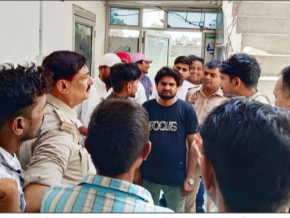
नवजात की मौत के बाद हुए हंगामे की सूचना पर पहुंची पुलिस।