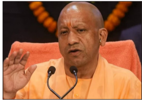
सीएम योगी ने हमीरपुर हादसे पर शोक व्यक्त किया।

लखनऊ। हमीरपुर हादसे पर सीएम योगी ने शोक जताया। उन्होंने मृतकों के परिजनों को 5-5 लाख रुपये आर्थिक मदद देने की घोषणा की। साथ ही घायलों को 50-50 हजार रुपये की आर्थिक मदद का एलान किया।