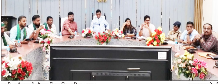
समीक्षा बैठक में मौजूद जिलाधिकारी व अन्य।