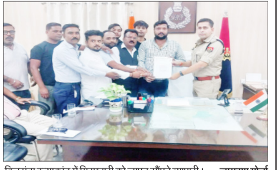
बिलसंडा हत्याकांड में गिरफ्तारी को ज्ञापन सौंपते व्यापारी।

पूरनपुर। एक विवाहिता ने ससुरालियों पर माता पिता को पीटने का आरोप लगाया है। शिकायत पुलिस से की गई है थाना क्षेत्र के गांव सिमरिया ता. अजीतापुर बिल्दा निवासी युवती ने बताया कि उसकी शादी तीन साल पहले दिव्युरियाकला थाना क्षेत्र के गांव मधवापुर निवासी युवक के साथ की थी। आए दिन उसका पति और ससुराली आए दिन मारपीट कर प्रताड़ित करते हैं। कई बार घर से निकाल चुके हैं। 26 मई को ससुरालियों ने गाली गलौज शुरू कर दी। विरोध करने पर उसको मारपीट कर घर से भगा दिया, जानकारी लगने पर उसके पिता और मां पुत्री को लेकर उसकी ससुराल पहुंचे और ससुरालियों का समझने का प्रयास किया। आरोप है कि विवाहिता और उसके माता-पिता के साथ गाली गलौज की, मना करने पर मारा पीटा जिससे बह घायल हो गया इसके बाद सभी को घर से भगा दिया। वापस आने पर जान से मारने की धमकी दी। आरोप है कि कई बार उसके साथ मारपीट कर चुके हैं। कर्मरों में बंद कर भी पीटा गया। गाली मारकर जान लेने की धमकी दी। शिकायत दिव्युरियाकला पुलिस से की गई है। पुलिस मामले की जांच कर रही है।