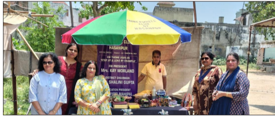
इनर व्हील क्लब हसनपुर के द्वारा दिया गया दुकानदार को बड़ा छूटा।