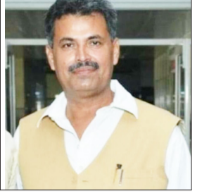
जागरण मोर्चा, कार्यालय

● धोखाधड़ी मामले में न्यायालय से जमानत मंजूर