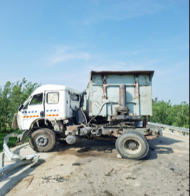
सड़क हादसे में क्षतिग्रस्त डंपर।

शाहबाद। तहसील क्षेत्र के जयतोली मदारपुर मार्ग पर भीषण सड़क हादसा हो गया, जब डंपर के आगे चल रहे वाहन ने अचानक ब्रेक लेकर वाहन रोक दिया, जिसके चलते डंपर का अगला हिस्सा उस वाहन में जा घुसा, गनीमत रही कि कोई जनहानि नहीं हुई। हालांकि जानकारी मिली है कि डंपर का अगला हिस्सा पूरी तरह डूबेज हो गया।