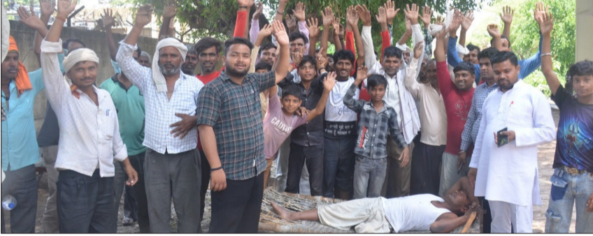
अधीक्षण अभियंता के बाहर धरना प्रदर्शन करते ग्रामीण।

चन्दौसी। तहसील क्षेत्र के गांव रामनगर में पिछले 15 दिन से विद्युत आपूर्ति ठप बनी हुई है। शुक्रवार की बड़ी संख्या ग्रामीण चारपाई लेकर विद्युत वितरण स्थित अधीक्षण अभियंता कार्यालय पहुंचे। जहां ग्रामीणों ने धरना प्रदर्शन के साथ नारेबाजी की। उपखंड अधिकारी ग्रामीण के आशवासन के बाद ग्रामीण शांत हुए और वापस अपने गांव लौट गए। तहसील क्षेत्र के गांव कैथल के मजरा रामनगर में पिछले 15 मई से आंधी बारिश के चलते गांव में लगा 63 केवीए का ट्रांसफार्मर खराब हो गया था। गांव में दो विद्युत पोल भी गिर गए थे। जिससे ग्रामीणों के नलकूप की सप्लाई बंद हो गई। समय से सिंचाई नहीं होने से खेतों