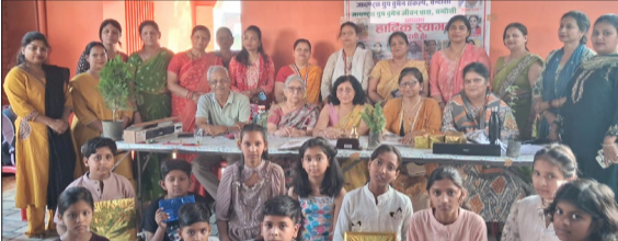
समर कैंप के समापन पर मौजूद वलब पदाधिकारी व पुरस्कृत बच्चे।