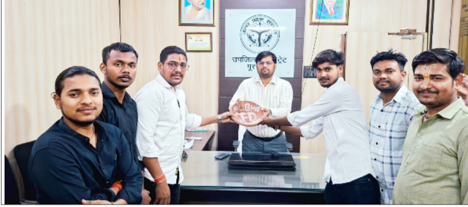
एसडीएम को मिट्टी का कटोरा देते कार्यकर्ता।

कार्यकर्ता तहसील परिसर पहुंचे और नारेबाजी करते हुए प्रशासन के खिलाफ रोष व्यक्त किया। उनका कहना था कि क्षेत्र में छात्र-छात्राओं और युवाओं से जुड़ी कई समस्याएं लंबे समय से बनी हुई हैं, लेकिन जिम्मेदार अधिकारी ध्यान नहीं दे रहे हैं। इसी के विरोध में परिषद कार्यकर्ताओं ने अनोखे तरीके से प्रदर्शन करते हुए एसडीएम को मिट्टी का कटोरा सौंपा। परिषद पदाधिकारियों ने कहा कि शिक्षा