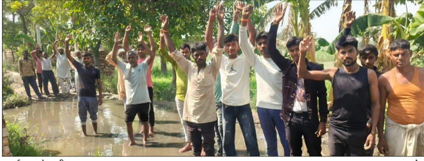
प्रदर्शन करते ग्रामीण।

हसनपुर। गंगेश्वरी विकास खंड के गांव भावली में मुख्य मार्ग पर जलभराव से स्थानीय संग्रह अन्य गांवों के लोग प्रभावित हैं। राहगीरों को आवागमन में भारी परेशानी का सामना करना पड़ रहा है। आरोप है कि लंबे समय से बनी समस्या से निजात दिलाने के लिए अफसर व जन प्रतिनिधि गंभीर नहीं हैं। गंगा तट बंध को जोड़ने वाले मार्ग पर जलभराव से सीधे तौर पर छह हजार से अधिक लोगों के प्रभावित होने की बात कही जा रही है। जानकारी के मुताबिक गांव में करीब डेढ़ सौ मीटर रास्ते पर जल भराव की समस्या बनी है। समस्या की मुख्य वजह नाले गंदगी से अटा होना बताया जा रहा है। नाले अटे होने से घरों के पानी की निकासी नहीं हो पाती। बरसात के दिनों में यहां काफी पानी एकत्र हो जाता है। इस