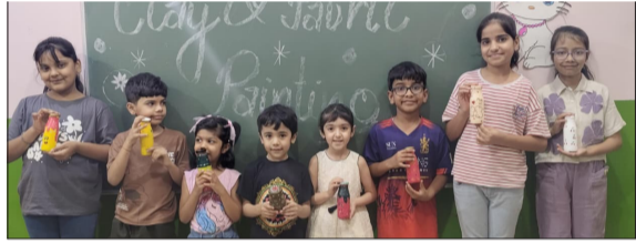
समर कैंप में प्रतिभाग्य कर रहे बच्चे।