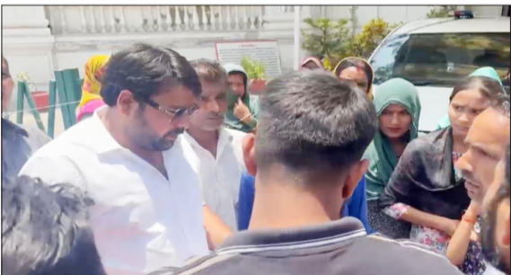
एसपी को ज्ञापन देते पदाधिकारी।