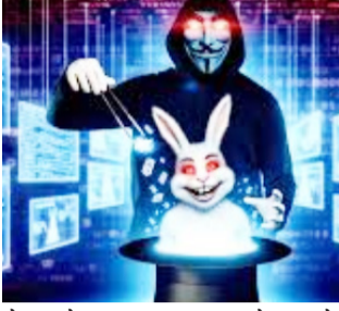
होटल के कंप्यूटर सिस्टम से फाइलें डिलीट कर गया, जिससे पूरे होटल प्रबंधन में हड़कंप मच गया। मामला

● सिस्टम से सबूत भी मिटाए, मैनेजमेंट में खलबली जागरण मोर्चा, कार्यालय