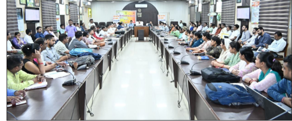
कलक्ट्रेट सभागार में जिला स्वास्थ्य समिति की बैठक लेते जिलाधिकारी।

संभल/बहजोई। कलक्ट्रेट सभागार में शुक्रवार को जिलाधिकारी अंकित खण्डेलवाल की अध्यक्षता में जिला स्वास्थ्य समिति (शासी निकाय) की मासिक समीक्षा बैठक आयोजित हुई। बैठक में आयुष्मान कार्ड निर्माण, एचपीवी टीकाकरण, आधा आईडी, जननी सुरक्षा योजना तथा अन्य स्वास्थ्य सेवाओं की प्रगति की विस्तृत समीक्षा की गई। बैठक में जिला कार्यक्रम प्रबंधक द्वारा जनपद में संचालित सीएचसी, पीएचसी, चिकित्सकों एवं स्वास्थ्य इकाइयों की स्थिति से अवगत कराया गया। साथ ही पिछली बैठक में दिए गए निर्देशों के अनुपालन की रिपोर्ट भी प्रस्तुत की गई। समीक्षा के दौरान 34 नए उपकेंद्र भवनों के निर्माण के लिए भूमि उपलब्धता पर चर्चा हुई। जिला पंचायत की ओर से बताया गया कि 10 उपकेंद्रों के लिए अभी भूमि उपलब्ध नहीं हो सकी है।