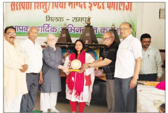
तहसील प्रभारी को सम्मानित करते पदाधिकारी।