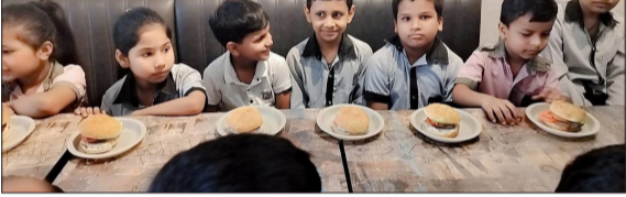
समर कैंप के दौरान पार्टी का आनंद लेते बच्चे।