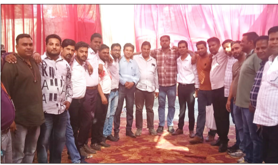
शाहबाद पत्रकार वेलफेयर एसोसिएशन के पदाधिकारी और सदस्य।

शाहबाद। 30 मई शनिवार को हिंदी पत्रकारिता दिवस के मौके पर शाहबाद पत्रकार वेलफेयर एसोसिएशन के पदाधिकारियों, सदस्यों ने संगठन के कार्यालय पर एकत्रित हुए हिंदी पत्रकारिता दिवस की एक दूसरे को बधाई दी। पत्रकारों के लिए हिंदी पत्रकारिता दिवस एक अहम दिवस माना जाता है जिसमें पत्रकार अपने विचारों का आदान-प्रदान एक दूसरे से कर सकते हैं। हिंदी पत्रकारिता दिवस हर साल 30 मई को मनाया जाता है। हिंदी पत्रकारिता दिवस के अवसर पर पत्रकारों, लेखकों, और साहित्यकारों को सम्मानित किया जाता है और हिंदी पत्रकारिता के विकास में उनके योगदान को याद किया जाता है। शाहबाद पत्रकार वेलफेयर एसोसिएशन द्वारा नई बाजार स्थित अपने कार्यालय पर