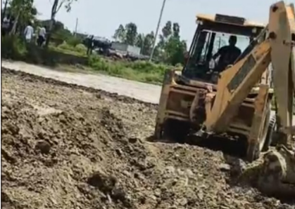
सरकारी भूमि को अतिक्रमण मुक्त कराने को चलता बुलडोजर।