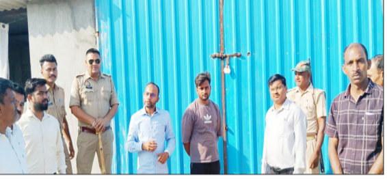
कार्रवाई के दौरान मौजूद अधिकारी।

पत्र के आधार पर निर्धारित नियमों के विपरीत अवैध रूप से बालू का भंडारण एवं विक्रय कर रहे थे। प्रकरण में नियमों का उल्लंघन पाए जाने पर प्रशासन द्वारा अवैध रूप से भंडारित उपखनिज (बालू) को सीज करने के साथ-साथ संबंधित परिसरों को भी सीज कर दिया गया। कार्रवाई के दौरान राजस्व एवं पुलिस विभाग की टीम उपस्थित रही। प्रशासन ने स्पष्ट किया है कि अवैध खनन, भंडारण एवं उप खनिजों के अवैध व्यापार के विरुद्ध अभियान निरंतर जारी रहेगा तथा नियमों का उल्लंघन करने वालों के विरुद्ध कठोर वैधानिक कार्रवाई की जाएगी।