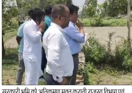
सरकारी भूमि को अतिक्रमण मुक्त करती राजस्व विभाग एवं विकास विभाग की संयुक्त टीम।