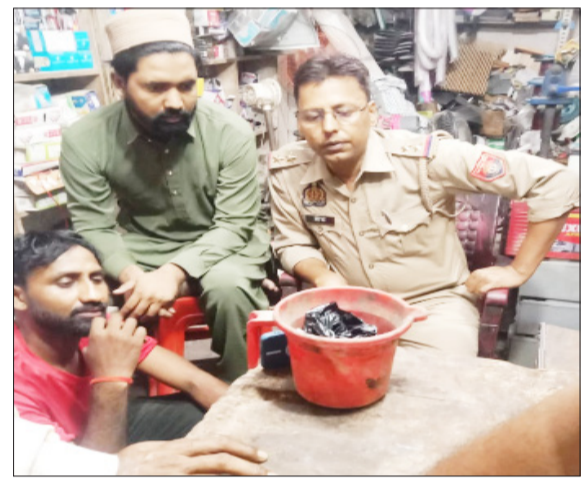
अपरहण के बाद छानबीन करती पुलिस।

मसवासी। दूध लेने जा रही 10 वर्षीय किशोरी को कथित रूप से बाइक सवार दो युवक अपने साथ ले गए। किशोरी के शोर मचाने पर उसे खुशहालपुर तिराहे के पास छोड़कर फरार हो गए। सूचना मिलने पर पुलिस मौके पर पहुंची और आसपास लगे सीसीटीवी कैमरों की जांच की। हालांकि पुलिस प्रथम दृष्टया मामले को संदिग्ध मान रही है।