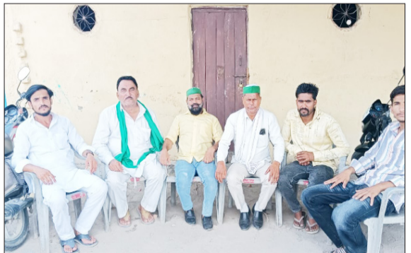
पदाधिकारियों से वार्ता करते जिलाध्यक्ष।