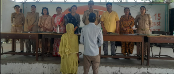
परिवार परामर्श सुलह समझौता केंद्र पर पति-पत्नी के विवाद को सुनते काउंसलर व पुलिस कर्मी।