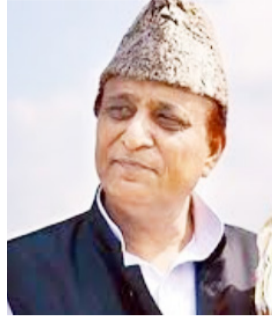
वायरल हो रहे हैं। दोनों नेताओं की मुलाकात को वर्ष 2027 के विधानसभा चुनाव से जोड़कर देखा जा सकता है।

रामपुर। सपा के कद्दावर नेता आजम खां से पूर्व मुख्यमंत्री अखिलेश यादव जेल में मुलाकात करने जल्द आएंगे। मुलाकात को लेकर सोशल मीडिया पर तेजी प्रचार हो रहा है साथ ही आजम खां-अखिलेश यादव की बातचीत के फोटो