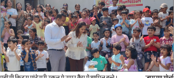
एबीसी किड्स मांटेसरी स्कूल में समर कैंप में शामिल बच्चे।

चन्द्रौसी। एबीसी किड्स मांटेसरी स्कूल में चल रहे समर कैंप का भव्य एवं उत्साहपूर्ण समापन समारोह शनिवार को संपन्न हुआ। इस समर कैंप में बच्चों ने शिक्षा, कला, खेल, व्यक्तिव विकास एवं रचनात्मक गतिविधियों से जुड़ी विभिन्न विधाओं का प्रशिक्षण प्राप्त किया। समापन समारोह के अवसर पर बच्चों द्वारा सीखी गई सभी गतिविधियों का आकर्षक ग्रांडंशो आयोजित किया गया, जिसने उपस्थित लोगों का मन मोह लिया। कार्यक्रम का शुभारंभ बच्चों की मनमोहक प्रस्तुतियों के साथ हुआ। विद्यालय परिसर बच्चों की हंसी, उत्साह, ऊर्जा और रचनात्मकता