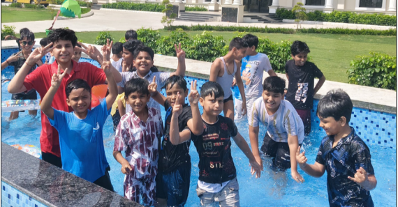
पूल पार्टी का आनंद लेते हुए बच्चे।