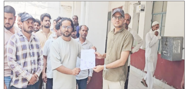
नायब तहसीलदार को ज्ञापन देते पदाधिकारी।