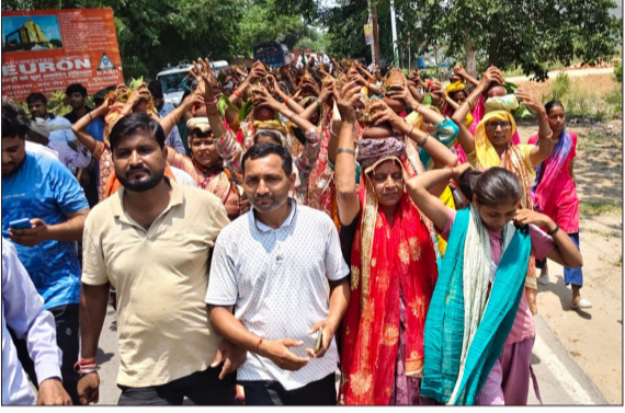
श्रीमद्भागवत कथा के समापन के बाद कलश विसर्जन को जाती महिलाएं।