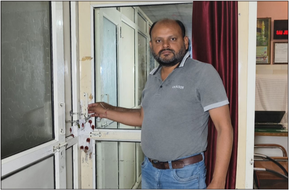
अस्पताल की ओटी को सील करते हुए सीएचसी प्रभारी।