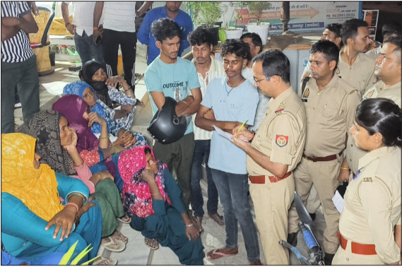
मृतका के परिजनो से वार्ता करते कोतवाल।