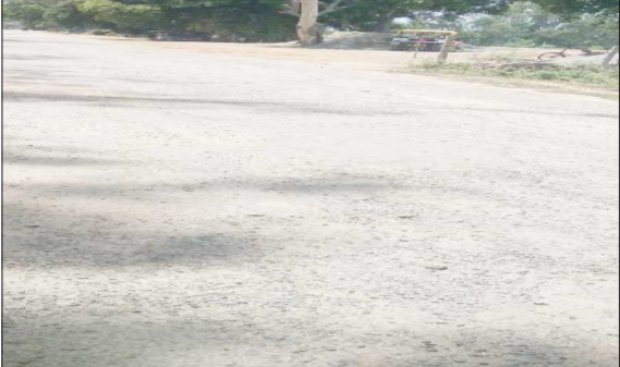
जर्जर हालत में घुंघचाई दियूरियाकला मार्ग।

पूरनपुर। लाखों रुपये की लागत से बना घुंघचाई-दियूरियाकला मार्ग टूटकर गड्ढे में तब्दील हो रहा है। यह सड़क 3.76 लाख रुपये की लागत से बनाई गई थी। यह सड़क करीब कुछ माह पहले ही बनकर तैयार हुई थी, लेकिन अब जगह-जगह से टूट चुकी है। जंगल के अंदर सड़क पानी के बहाव से कट गई थी। जिससे आवागमन में बाधित है।