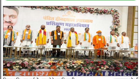
जिला प्रशिक्षण वर्ग में भाग लेते पदाधिकारी।