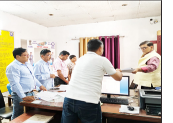
निरीक्षण करते डीएम व एसपी।

पीलीभीत। जिलाधिकारी ज्ञानेन्द्र सिंह एवं पुलिस अधीक्षक सुकीर्ति माधव ने शनिवार को जिला कारागार का औचक निरीक्षण किया। इस दौरान उन्होंने किशोर बैरक, अन्य बैरकों तथा जेल अस्पताल का निरीक्षण कर व्यवस्थाओं का जायजा लिया। अस्पताल में भर्ती बंदियों से बातचीत कर उनके स्वास्थ्य की जानकारी ली गई। जिलाधिकारी ने चिकित्सकों को निर्देश दिए कि बंदियों के उपचार में किसी प्रकार की लापरवाही न बरती जाए। डीएम ने बंदियों को उपलब्ध कराए जा रहे भोजन की गुणवत्ता और अन्य सुविधाओं की भी जानकारी ली। साथ ही जेल अधीक्षक को निर्देशित किया कि मानकों के अनुरूप सभी आवश्यक सुविधाएं उपलब्ध कराई जाएं। निरीक्षण के दौरान कारागार में साफ-सफाई व्यवस्था का भी जायजा लिया गया। इस अवसर पर जेल अधीक्षक, जेलर सहित अन्य अधिकारी मौजूद रहे।