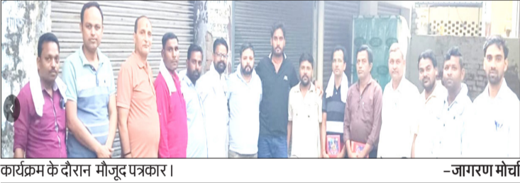
कार्यक्रम के दौरान मौजूद पत्रकार।