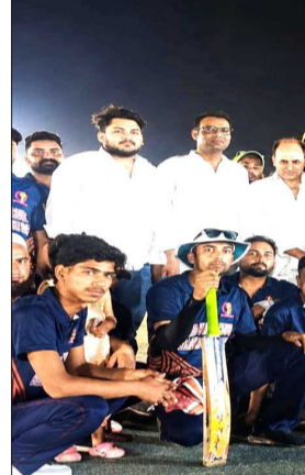
विजयी टीम के साथ मौजूद मुख्य अतिथि।