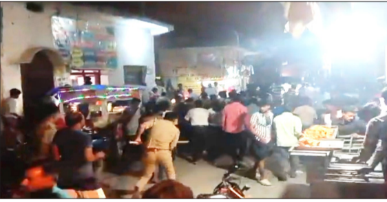
मारपीट कर रहे लोगों को दौड़ाती पुलिस।