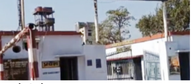
अभिलेखों में दर्ज किया गया।

केसर चीनी मिल पर किसानों का करोड़ों रुपये का गन्ना मूल्य बकाया है। वर्षों से भुगतान न मिलने के कारण किसान आर्थिक परेशानियों का सामना कर रहे थे। इसी को देखते हुए प्रशासन ने कुर्क की गई भूमि की नीलामी की प्रक्रिया आगे बढ़ाई। शनिवार को आयोजित नीलामी में विभिन्न पक्षों ने हिस्सा लिया और खुले मंच पर प्रतिस्पर्धी बोली लगाई गई। अंततः 28.05 करोड़ रुपये की सर्वोच्च बोली प्राप्त हुई, जिसे नियमानुसार