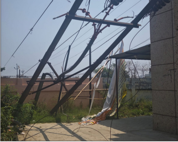
आंधी बारिश से तहसील परिसर में गिरा विद्युत पोल।

संभल। जिले में बदले मौसम ने जहां लोगों को भीषण गर्मी से राहत दिलाई, वहीं तेज आंधी, बारिश और ओलावृष्टि ने बिजली व्यवस्था को पूरी तरह चरमरा दिया। गुरुवार और शुक्रवार की रात अचानक मौसम बिगड़ने से बिजली विभाग को भारी नुकसान उठाना पड़ा। मगर बारिश होने से गर्मी से लोगों को राहत मिली है। तेज हवाओं और बारिश के कारण डिब्बीजन क्षेत्र के करीब 17 बिजली उपकेंद्रों की आपूर्ति पूरी तरह बाधित हो गई। आंधी की रफ्तार इतनी तेज थी कि 143 बिजली पोल टूटकर क्षतिग्रस्त हो गए, जबकि 26 ट्रांसफार्मर भी खराब हो गए। इसके चलते जिले के कई इलाकों में घंटों तक अंधेरा