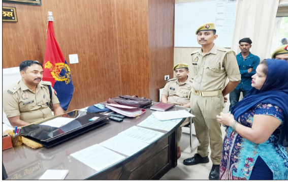
एसपी को सारी जानकारी देती महिला।