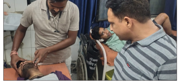
सीएचसी में एक्सिडेंट में घायल हुए युवक का उपचार करते चिकित्सक।