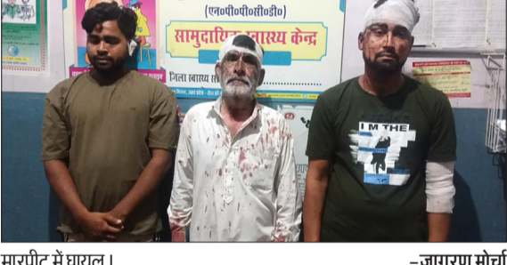
मारपीट में घायल।