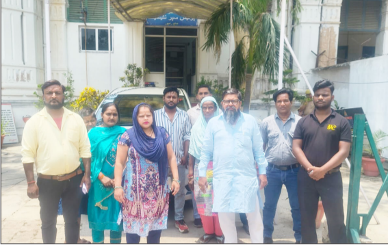
एसपी कार्यालय पर मौजूद पदाधिकारी।