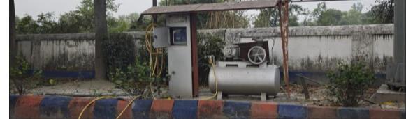
पेट्रोल पंप पर बंद पड़ी हवा भरने वाली मशीन।