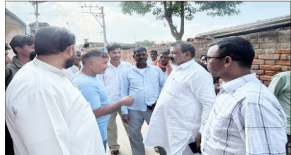
गांव बैरुआ में ग्रामीणों से बातचीत करते पूर्व राज्यमंत्री।