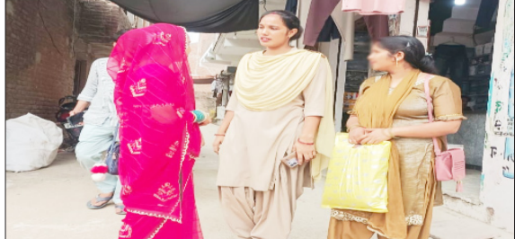
महिला को कानून का पाठ पढ़ाती महिला पुलिस कर्मी।