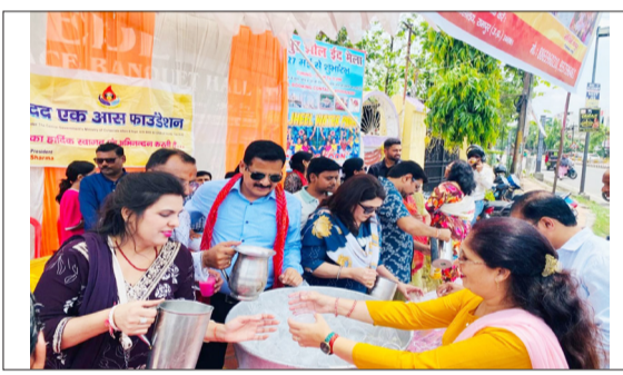
राहगीरों को शरबत बांटते पदाधिकारी।