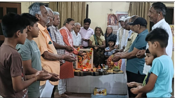
अहिल्याबाई होल्कर की जयंती मनाते पदाधिकारी।