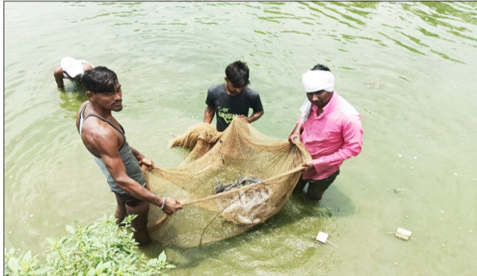
गांव हकीमगंज में मांगुर पकड़ने के लिए तालाब में जाल बिछाते कर्मचारी।