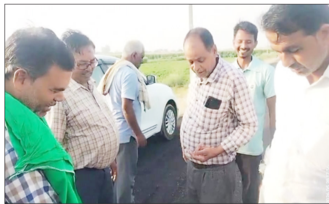
जागरण मोर्चा कार्यालय

बिल्सी। क्षेत्र के ग्राम पिण्डोल में ईट भट्टा से बड़नौमी के लिए तीन दिन पहले बने लगभग एक किलोमीटर मार्ग उदघाटन से पहले ही उखाड़ने लगा।