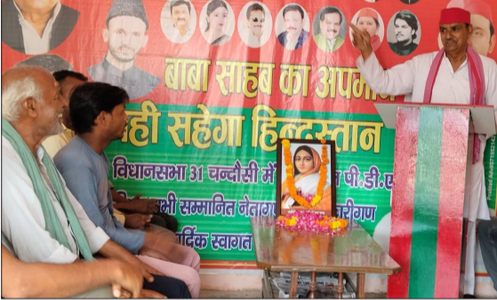
अहिल्याबाई होल्कर की जयंती कार्यक्रम में बोलते सपा पदाधिकारी।