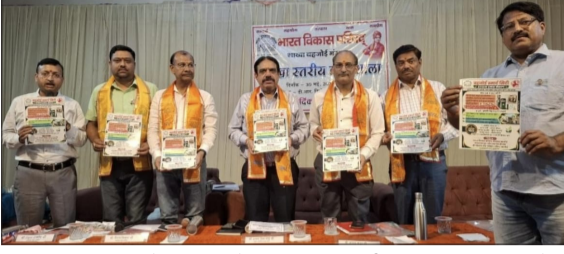
भारत विकास परिषद के कार्यक्रम में शामिल पदाधिकारी।