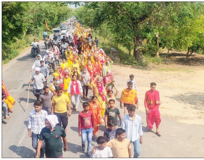
अमरोली में निकली भव्य कलश यात्रा निकालते भवत।