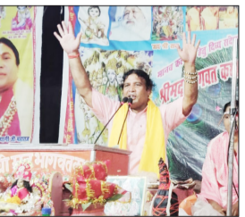
मिलक में कथा सुनाते वादक।

लीलाएं मानव जीवन को प्रेम, भक्ति और सदाचार का संदेश देती हैं। कथा के बीच-बीच में भजनों की प्रस्तुति से माहौल भक्तिमय