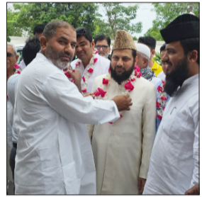
सांसद का स्वागत करते लोग।

रामपुर। सांसद मोहिबुल्लाह नदवी ने कैप कार्यालय पर जनता दरबार का आयोजन कर क्षेत्र की जनता की समस्याएं सुनीं। इस दौरान जनपद के विभिन्न गांवों, कस्बों और नगर क्षेत्रों से पहुंचे लोगों ने सड़क, बिजली, पानी, राजस्व, पेंशन, आवास, चिकित्सा और अन्य जनहित से जुड़े मामलों को सांसद के समक्ष रखा। सांसद ने प्रत्येक फरियादी की समस्या को गंभीरता से सुनते हुए संबंधित विभागों के अधिकारियों को त्वरित कार्रवाई के निर्देश दिए। जनता दरबार में कई ऐसे मामले भी सामने आए जिनका समाधान मौके पर ही करा दिया। जिससे लोगों को तत्काल राहत मिली। सांसद मोहिबुल्लाह