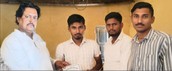
नए पदाधिकारियों को प्रमाण पत्र देते भाकियू (भानू) के राष्ट्रीय महासचिव।

चन्द्रौसी। भारतीय किसान यूनियन (भानू) की तहसील क्षेत्र के गांव मऊ अस्सू में एक महत्वपूर्ण बैठक का आयोजन किया गया। जिसमें किसानों की विभिन्न समस्याओं पर विस्तार से चर्चा के साथ उनके समाधान को लेकर विचार-विमर्श किया गया। इसके साथ कार्यकर्ताओं ने किसानों की समस्या के लिया सद्व्यवहार करने और किसान हित में एक मजबूत कदम उठाने का संकल्प लिया गया। इसके उपरान्त संगठन से जुड़कर किसानों की सेवा और उनके अधिकारों की रक्षा के लिए संकल्प भी लिया गया। इस दौरान संगठन के विस्तार के क्रम में नए कार्यकर्ताओं को जोड़ा गया व महत्वपूर्ण जिम्मेदारियां सौंपी गईं। जिसमें