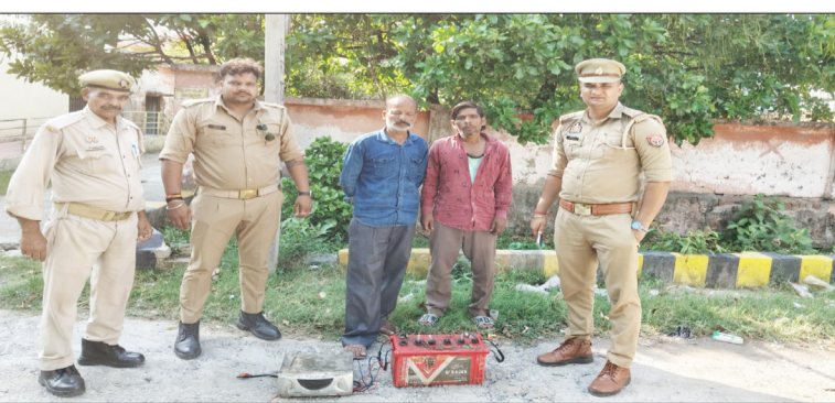
पुलिस की गिरफ्त में आरोपी।