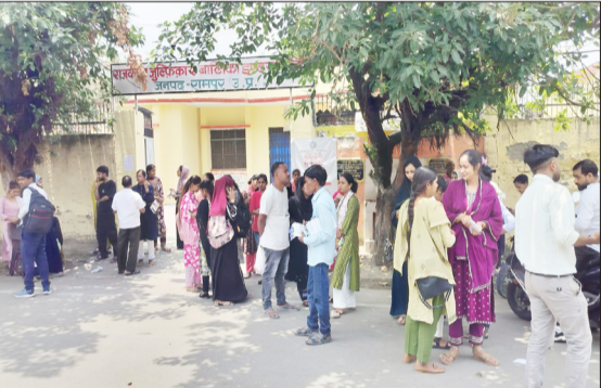
कॉलेज परिसर में खड़े परीक्षार्थी।

पहली पाली सुबह 9 से 12 तक दूसरी पाली दोपहर 2 से शाम 5 बजे तक हुई आरंभ