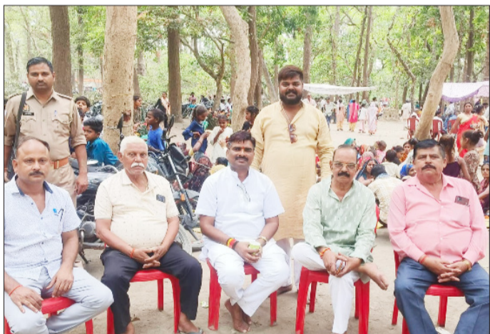
माला रेंज के सिद्ध बाबा पर मौजूद पूर्व भाजपा जिलाध्यक्ष।