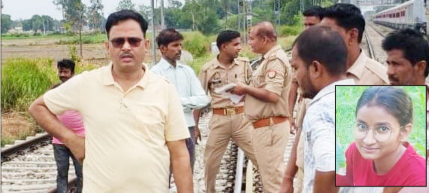
युवती के ट्रेन से कटने के बाद पहुंचे अधिकारी व छात्रा का फाइल फोटो।