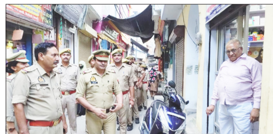
निरीक्षण करते डीएम और एसएसपी।