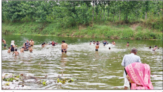
सैफनी रामगंगा तट पर स्नान करते श्रद्धालु।