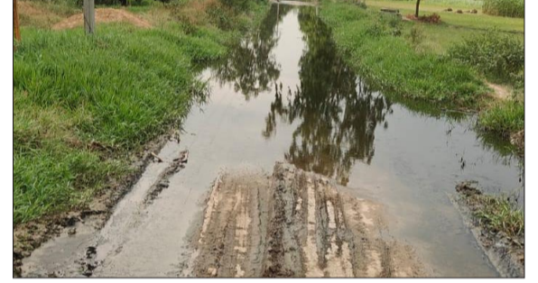
गांव के मुख्य मार्ग पर जल भराव एवं गंदगी।

हसनपुर। तहसील क्षेत्र के एक गांव में स्थित प्राइमरी स्कूल के पास काफी दिनों से जल भराव की समस्या होने से जहां ग्रामीणों को परेशानी उठानी पड़ रही है वहीं बच्चों को भी स्कूल आने-जाने में काफी दिक्कतों का सामना करना पड़ा था। वहीं ग्रामीणों द्वारा चेतावनी दी गई है कि अगर जल्द जल भराव की समस्या का निस्तारण नहीं किया गया तो वह जनपद के उच्च अधिकारियों के समक्ष अपनी शिकायत दर्ज कराएंगे। हसनपुर तहसील क्षेत्र के ग्राम अलावलपुर के ढक्का शेखपुरा झकड़ी मार्ग पर एक प्राइमरी स्कूल स्थित है, जिसके पास काफी समय से जल भराव की समस्या विकराल