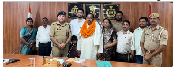
विदाई समारोह में शामिल पुलिस कर्मी व पुलिस अधिकारी।

संभल/बहजोई। विदाई समारोह का आयोजन किया गया। जिसमें अधिवर्षता आयु पूर्ण करने पर सेवानिवृत्त हुए पुलिसकर्मियों को सम्मानपूर्वक भावभीनी विदाई दी गई। इस सप्ताह का माहौल भावुक होने के साथ-साथ गौरवपूर्ण भी रहा। जहां अधिकारियों एवं कर्मचारियों ने सेवानिवृत्त कर्मियों के योगदान को याद करते हुए उन्हें शुभकामनाएं दीं।