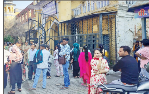
परीक्षा शुरू होने से पहले महिला डिट्री कॉलेज के गेट पर खड़े परीक्षार्थी।

जनपद में रविवार को बीएड संयुक्त प्रवेश परीक्षा रजा डिट्री कालेज, रजा महिला डिट्री कालेज, रजा इंटर कॉलेज, जुल्फिकार बालिका इंटर कॉलेज, जुल्फिकार इंटर कॉलेज में परीक्षा हुई।