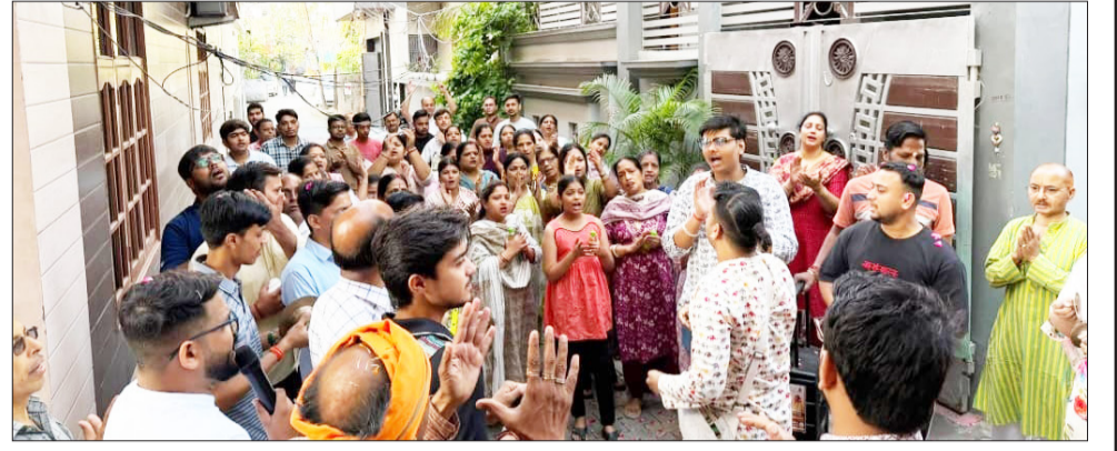
प्रभात फेरी में भजन गाते भक्त।

से कुछ समय निकालकर ईश्वर स्मरण, भजन-कीर्तन और धर्म के मार्ग पर चलने की प्रेरणा दे रही है। नगरवासियों ने भी इस पहल की सराहना करते हुए कहा कि ऐसे धार्मिक आयोजन समाज को एक सूत्र में पिरोने का कार्य करते हैं। प्रभात फेरियों के माध्यम से जिस प्रकार घर-घर तक श्रीनाथ जी का संदेश पहुंच रहा है, उससे नगर का वातावरण पूरी तरह भक्तिमय और आध्यात्मिक ऊर्जा से ओत-प्रोत हो गया है। यही कारण है कि आज नगर का चप्पा-चप्पा श्रीनाथ जी के जयकारों से गुंजायमान दिखाई दे रहा है।