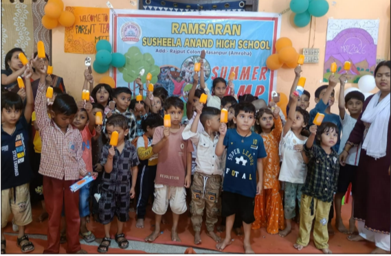
समर कैंप के दौरान मस्ती करते बच्चे।

हसनपुर। शासन के निर्देश पर नगर के मोहल्ला राजपूत कॉलोनी स्थित रामसरन एवं सुशीला आनंद हाई स्कूल के प्रांगण में स्कूल प्रशासन द्वारा चार दिवसीय समर कैंप के आयोजन में नर्सरी से लेकर कक्षा एक तक के विद्यार्थियों ने प्रतिभा किया। ग्रीष्मकालीन अवकाश के दौरान प्रतिवर्ष की भांति विद्यार्थियों के मानसिक एवं बौद्धिक विकास हेतु इस वर्ष भी समर कैंप का आयोजन किया गया। समर कैंप के दौरान छात्र-छात्राओं के द्वारा डॉस, आर्ट एवं कलर गैम्स शाहिद विभिन्न गतिविधियों में प्रतिभाग कर अपनी प्रतिभा का प्रदर्शन किया। समर कैंप के अंत में एक