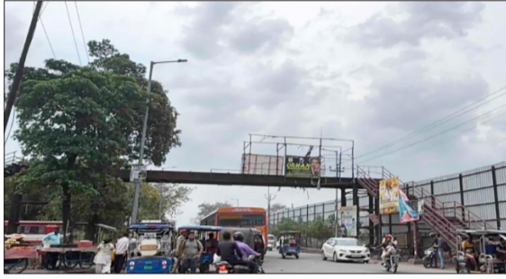
मौसम के बदलने से आसमान पर काले बादल।

मौसम विभाग ने चेतावनी दी कि कुछ स्थानों पर बिजली कड़कने के साथ मध्यम दर्जे का तूफान आ सकता है। हवा की गति 40 से 60 किलोमीटर प्रति घंटा रहने की संभावना है, जो कुछ स्थानों पर 70 किलोमीटर प्रति घंटा तक पहुंच सकती है। इसके साथ ही मध्यम से तेज बारिश होने की संभावना जताई गई है। आरंज