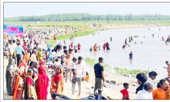
शाहबाद के रामगंगा घाट पर स्नान करते श्रद्धालु।