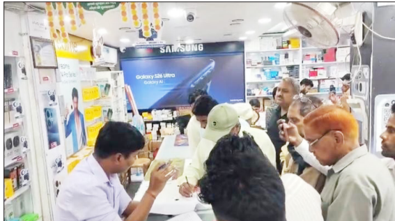
पारस मोबाइल पर जांच करते अधिकारी।