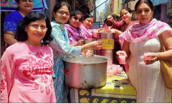
शरबत वितरण कार्यक्रम में शामिल वार्षिक महिला उत्थान समिति के पदाधिकारी।