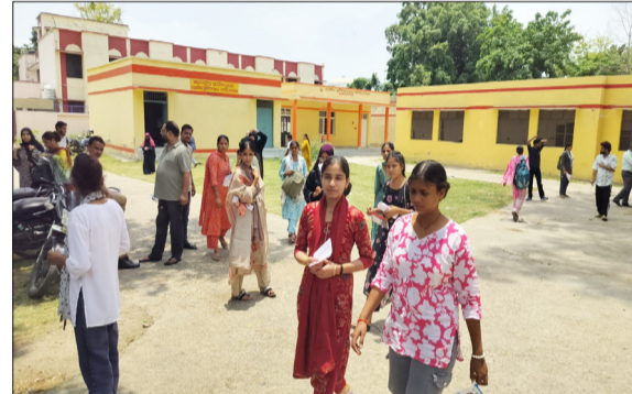
परीक्षा देकर जाती युवतियां।

जागरण मोर्चा, कार्यालय तैयारियां कई दिनों से आरंभ थी। परीक्षा शांतिपूर्ण ढंग से सम्पन्न कराए जाने के लिए अपर पुलिस अधीक्षक अनुराग सिंह ने विकास भवन में बैठक लेकर निर्देशित किया था। रविवार को जनपद में केंद्रों पर बीएड की परीक्षा दो पालियों में हुई। पहली पाली में 1745 पंजीकृत के सापेक्ष 565 ने परीक्षा दी। 1180 गैरहाजिर, दूसरी पाली में 1745 पंजीकरण के सापेक्ष 1564 ने परीक्षा दी। 181 परीक्षार्थी गैरहाजिर रहे। परीक्षा के दौरान किसी भी तरह की कोई दिक्कत न हो, इसके लिए मजिस्ट्रेट अपने