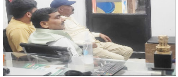
मन की बात कार्यक्रम सुनते भाजपा नेता।