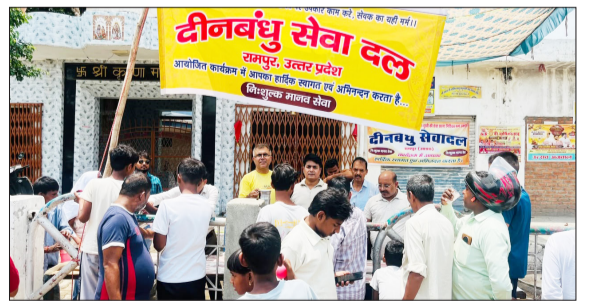
राहगीरों को शरबत बांटते हुए सेवा दल के सदस्य।