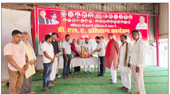
अहिल्याबाई होल्कर जयंती पर श्रद्धाजलि पेश करते कांग्रेस और सपा के कार्यकर्ता।