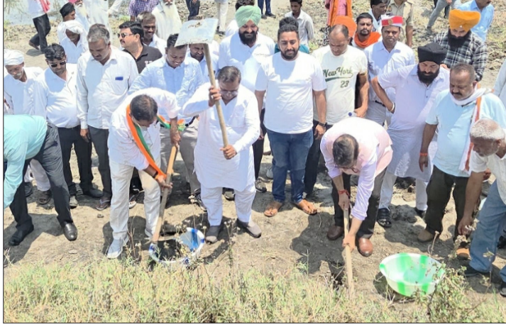
फावडा चलाकर श्रमदान करते जनप्रतिनिधि और अधिकारी।