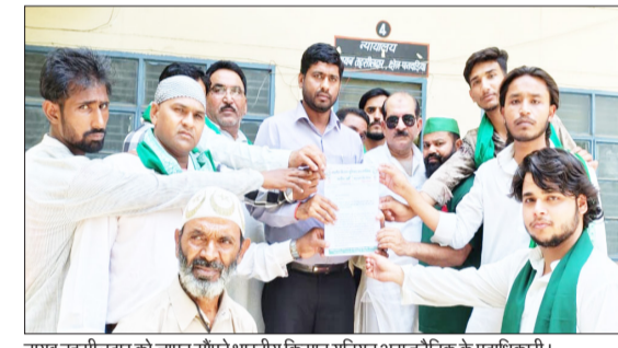
नायब तहसीलदार को ज्ञानपत्र सौंपते भारतीय किसान यूनियन अराजनैतिक के पदाधिकारी।

ध्वस्तीकरण के बावजूद उक्त भूमि पर भूमिकाओं द्वारा अवैध दाखिल-खारिज की