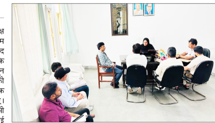
कर्मचारियों के साथ मीटिंग करती पालिकाध्यक्ष।

उद्देश्य साफ है कि बारिश में शहर में जलभराव की समस्या न हो और आम जनता को परेशानी से बचाया जा सके। अध्यक्ष ने उन वार्डों में युद्ध स्तर पर सफाई कराने के आदेश दिए जहां काम धीमा चल रहा है। साथ ही चेतावनी दी कि अगर मानसून में कहीं भी पानी भरता है