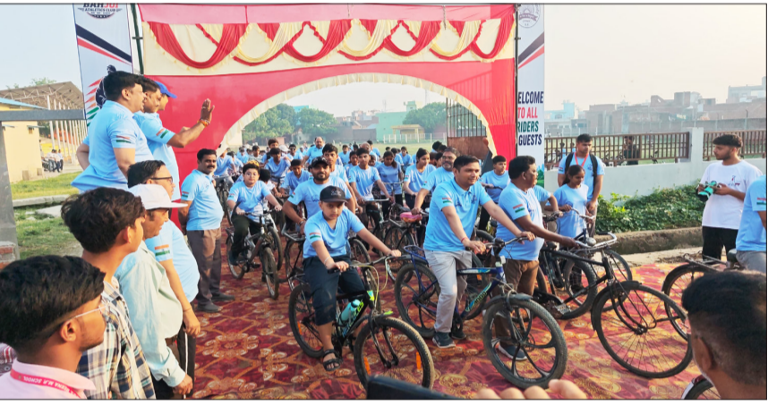
साइकिल मैराथन में भाग लेते प्रतिभागी।