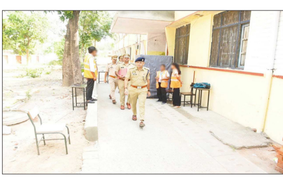
परीक्षा केंद्रों का निरीक्षण करते एसपी।

रामपुर। उत्तर प्रदेश शिक्षा सेवा चयन आयोग द्वारा प्रशिक्षित स्नातक शिक्षक टीजीटी के विभिन्न पदों के लिए जनपद में आयोजित लिखित परीक्षा का प्रथम दिन पारदर्शी, नकल विहीन एवं शांतिपूर्ण वातावरण में संपन्न हुई। परीक्षा 3, 4 को प्रतिदिन दो पालियों में आयोजित की जा रही है।