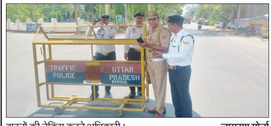
वाहनों की चेकिंग करते अधिकारी।