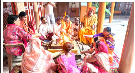
हवन में आहुति देते भक्त।