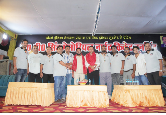
मुख्य अतिथि का स्वागत करते कमेटी के पदाधिकारी।

निगाहें 3 जून को होने वाले दो मुकाबलों पर टिकी हैं। पहला मैच रामपुर चैलेंजर्स और गोल्डन हॉक्स के बीच खेला जाएगा, जबकि रात्रि मुकाबले में चौबंस इलेवन और अजीतपुर इलेवन आमने-सामने होंगी।