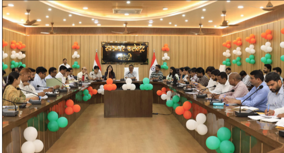
कलेक्ट्रेट सभागार में अधिकारियों के साथ बैठक करते जिलाधिकारी।

अभियान में जनप्रतिनिधियों, ग्राम प्रधानों, स्वयं सहायता समूहों, युवाओं, विद्यार्थियों, सामाजिक संगठनों, उद्यमियों तथा आमजन की व्यापक सहभागिता सुनिश्चित की जाए, ताकि इसे जन आंदोलन का स्वरूप दिया जा सके। जिलाधिकारी ने कहा कि पेड़ लगाए तो पानी देने की व्यवस्था भी करें। गौशालाओं में ट्रीगार्ड की व्यवस्था की जाए, जिससे आमजन का स्वरूप दिया जा सके। यह कार्यक्रम विकास खण्ड स्तर पर होंगे। सरकार की जनकल्याणकारी योजनाओं का प्रचार-प्रसार किया जाएगा और लोगों को योजनाओं के फार्म भरवाए जाएंगे। उन्होंने बताया कि 16 से 17 जून तक विकसित भारत संकल्प सम्मेलन में प्रबुद्धजनों-विषय विशेषज्ञों द्वारा विभिन्न विधाओं में व्याख्यान दिए जाएंगे। उन्होंने निर्देश दिए कि केंद्र एवं राज्य सरकार द्वारा स्वास्थ्य, शिक्षा, युवा सशक्तिकरण, किसान कल्याण, महिला सुरक्षा एवं सम्मान, गरीब कल्याण, रोजगार सृजन, निवेश, आधारभूत संरचना विकास, कानून-