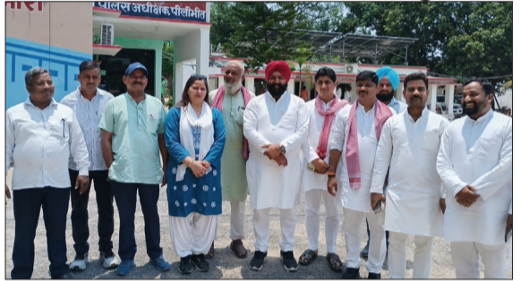
सपा नेता पर फर्जी मुकदमे को लेकर एसपी दफतर सफाई।