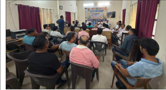
जीएसटी समस्याओं पर चर्चा करते सहायक आयुक्त राज्य कर।