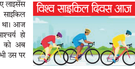
विश्व साइकिल दिवस आज

इंदौर की सड़कों पर सुबह के समय बड़ी संख्या में लोग साइकिल चलाते दिखाई देते हैं। कोई वजन कम करने के लिए पैदल मार रहा है, कोई हृदय को स्वस्थ रखने के लिए पैदल चला रहा है। गियर वाली, पहाड़ी और खेल प्रतियोगिताओं के लिए विशेष साइकिलें बाजार में उपलब्ध हैं। लेकिन विडम्वना यह है कि साइकिल जितनी आधुनिक हुई, उतनी ही आम जीवन से दूर भी होती चली गई। आज छोटी-सी दूरी तय करने के लिए भी लोग मोटर वाहन निकालते हैं। पैदल चलना या साइकिल से जाना मानो प्रतिष्ठ के विरुद्ध समझ लिया गया है। दूसरी ओर चिकित्सक, स्वास्थ्य विशेषज्ञ और पर्यावरणविद लगातार साइकिल अपनाने की सलाह दे रहे हैं। अब साइकिल का एक नया रूप सामने आया है। पहले यह मजबूरी का साधन थी, आज यह स्वास्थ्य का साधन बन गई है।