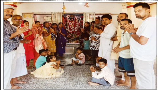
मंदिर में पूजा अर्चना करते भक्त।