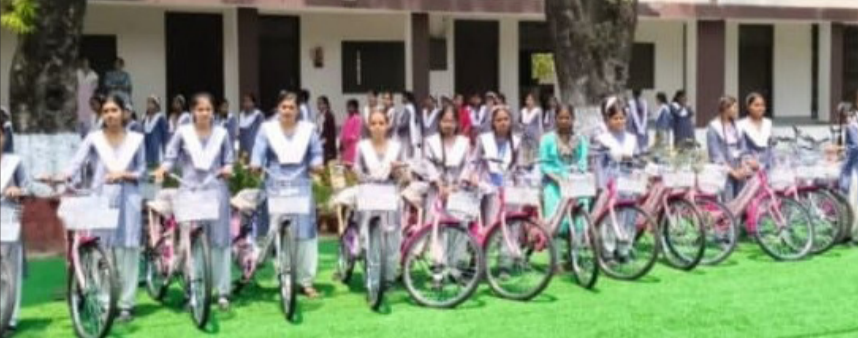
विश्व साइकिल दिवस पर छावनी परिषद में साइकिल के साथ छात्राएं।