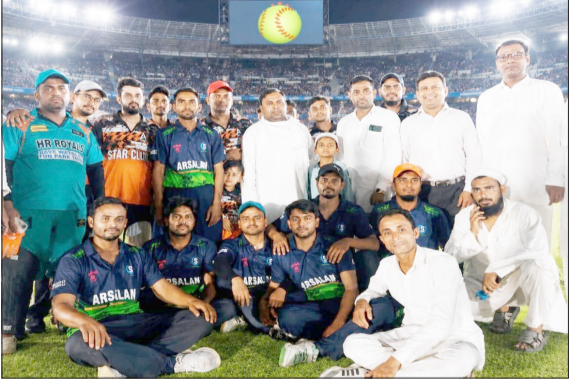
विजयी टीम के साथ मौजूद मुख्य अतिथि।