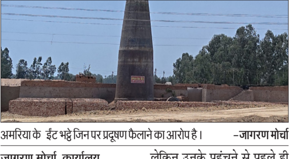
अमरिया के ईट भट्टे जिन पर प्रदूषण फैलाने का आरोप है।