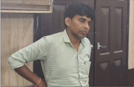
कोतवाली में पुलिस की हिरासत में आरोपी सॉल्वर।

बरेली। शहर में ट्रेड ग्रेजुएट टीचर (टीजीटी) परीक्षा के पहले ही दिन बड़ा फर्जीवाड़ा सामने आया है। इस्तामिया गल्स इंटर कॉलेज परीक्षा केंद्र पर एक युवक दूसरे अभ्यर्थी की जगह परीक्षा देता हुआ पकड़ा गया। आरोपी ने पूछताछ में खुलासा किया कि परीक्षा देने का सौदा डेढ़ लाख रुपये में तय हुआ था।