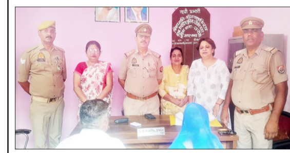
परामर्श केंद्र पर पति पत्नी से वार्ता करते पुलिस व काउंसलर।