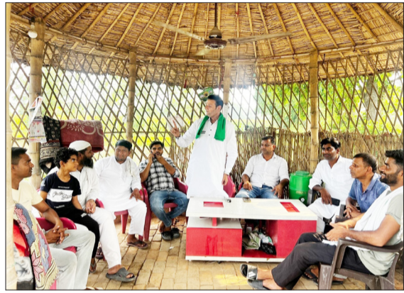
बैठक को संबोधित करते जिलाध्यक्ष।