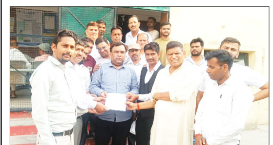
प्रशासनिक अधिकारी को ज्ञापन सौंपते अधिवक्ता।