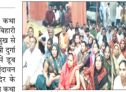
भागवत कथा में मौजूद भक्त।