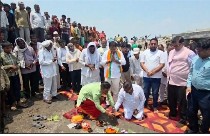
पूजन करते हुए।