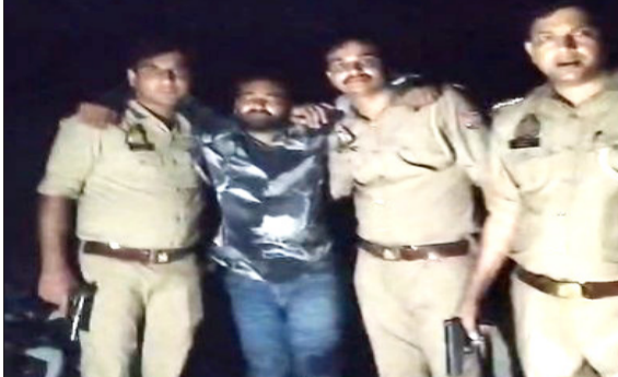
घायल को ले जाते पुलिस कर्मी।

रामपुर। शहजादनगर पुलिस की गोकश से मुठभेड़ हो गई। जिसमें पुलिस की गोली लगने से गोकश घायल हो गया। उसको अस्पताल में भर्ती कराया। पुलिस के उसके पास से तमंचा और कारतूस मिला।