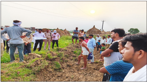
गांव देवापुर में अवैध कब्जा हटवाने पहुंची राजस्व विभाग की टीम।