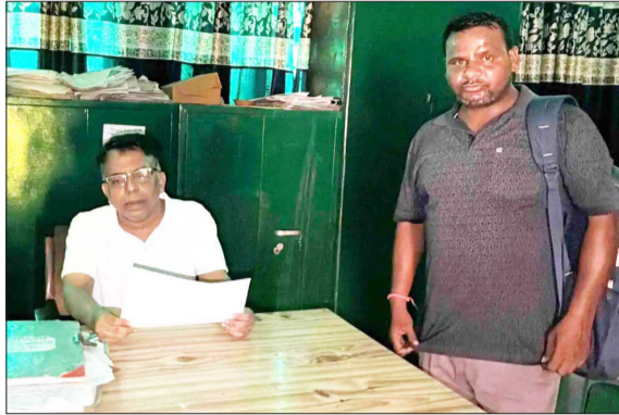
बीएसए ऑफिस में बैठे कर्मचारी।

बुधवार दोपहर 2 बजे कार्यालय के गेट पर लगा मीटर से अचानक धुआं उठने लगा। कुछ ही देर बाद पूरे कार्यालय की बिजली टप हो गई। बिजली नहीं आने पर कर्मचारियों में हड़कंप मच गया। बिजली बहाल