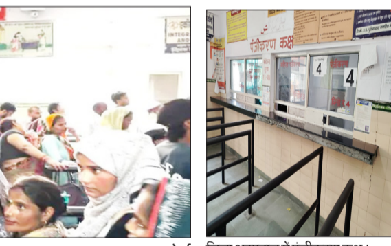
जिला अस्पताल में पंजीकरण कक्ष।