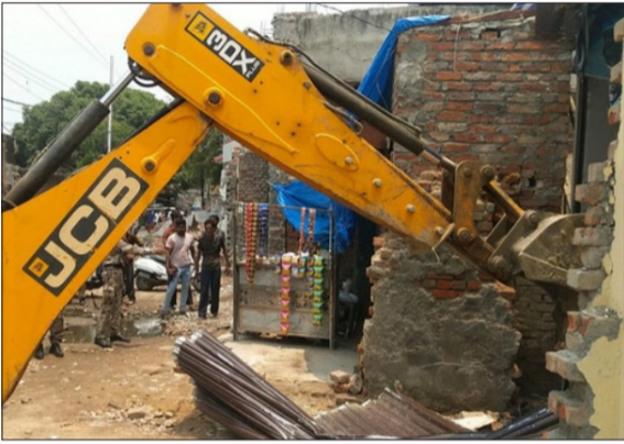
अतिक्रमण हटाती जेसीबी।

बरेली। शहर में सड़क चौड़ीकरण परियोजना को गति देने के लिए गुरुवार को बीडीए की प्रवर्तन टीम ने कोहाड़ापीर मार्ग पर बड़े पैमाने पर अतिक्रमण हटाओ अभियान चलाया। कार्रवाई के दौरान कई अवैध निर्माणों और कब्जों को बुलडोजर से ध्वस्त किया गया। पूरे अभियान के दौरान भारी पुलिस बल तैनात रहा, जिससे किसी प्रकार की अप्रिय स्थिति उत्पन्न न हो सके।