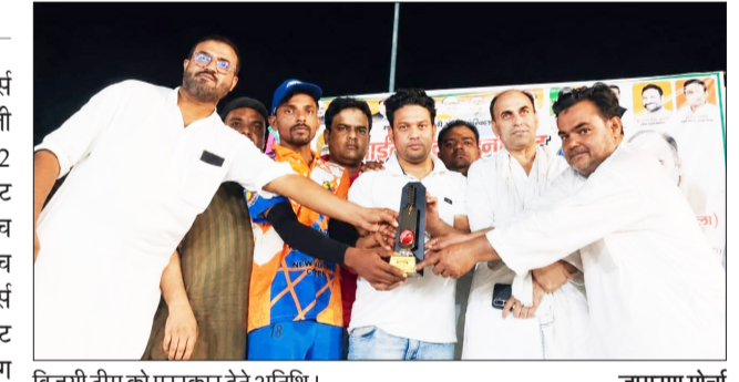
विजयी टीम को पुरस्कार देते अतिथि।