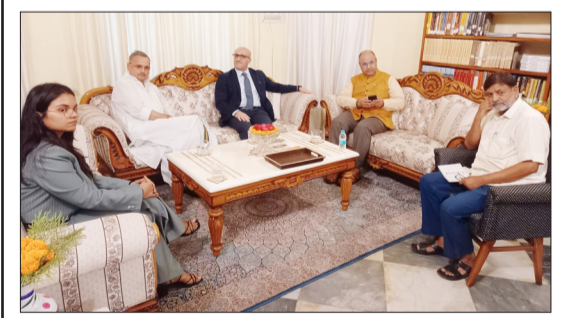
राजदूत से वार्तालाप करते रजा पुस्तकालय के निदेशक।