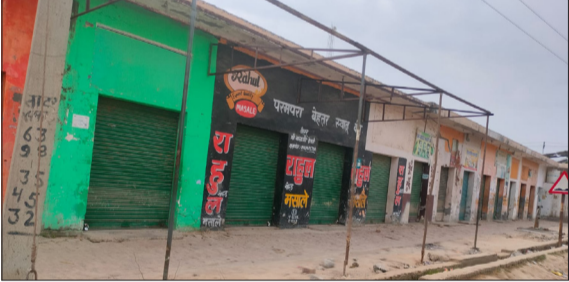
इन दुकानों पर होगी कार्रवाई।