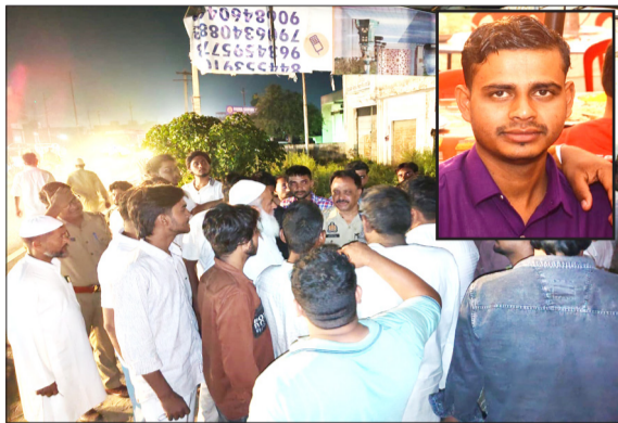
हादसे के बाद मौके पर लगी भीड़ व मृतक का फाइल फोटो।

थाना क्षेत्र के बड़ा गांव निवासी शहादत व उसकी