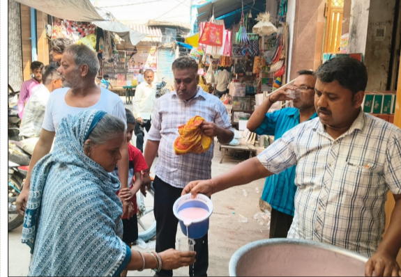
राहगीरों को लस्सी बाँटते समाजसेवी।