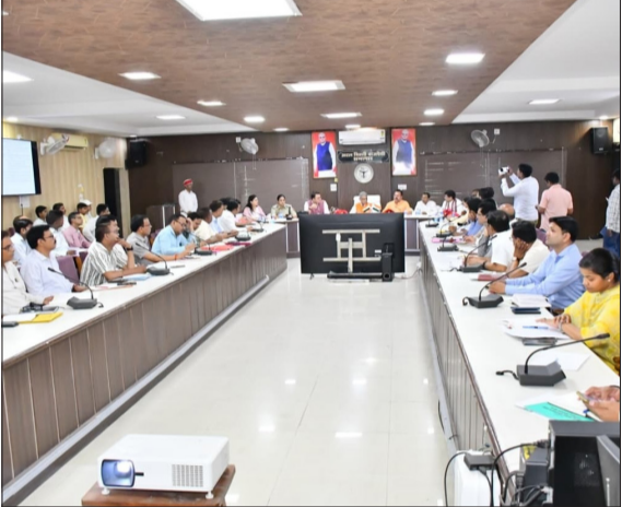
अधिकारियों के साथ बैठक करते प्रभारी मंत्री।