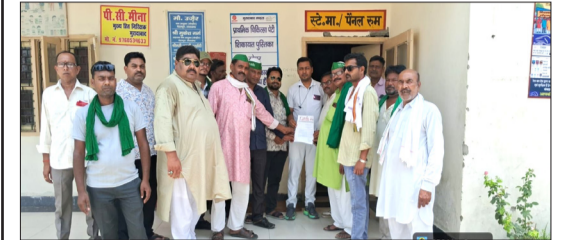
रेलवे के अधिकारी को ज्ञापन देते किसान।