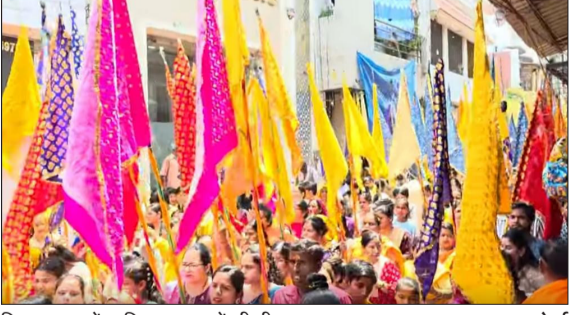
निशान यात्रा में शामिल श्रद्धालुओं की भीड़।

जागरण मोर्चा, कार्यालय रूप से सजाए गए बाबा श्याम के डोले और भजन गायकों की प्रस्तुतियां आकर्षण का केंद्र रहीं, जिन पर श्रद्धालु झूमते नजर आए। यात्रा के दौरान पूरे शहर में शक्तिमय माहौल बना रहा। बड़ी संख्या में उमड़ी भीड़ को देखते हुए पुलिस और प्रशासन ने सुरक्षा तथा यातायात के विशेष इंतजाम किए। यात्रा का समापन महाआरती, श्रद्धालुओं का स्वागत किया गया तथा शारबत, पानी और प्रसाद का वितरण किया गया। विशेष