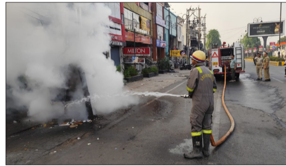
आग को बुझाते कर्मचारी।

दर्ज कराने का प्रयास किया, लेकिन पुलिस बल की मौजूदगी के चलते स्थिति नियंत्रण में रही।