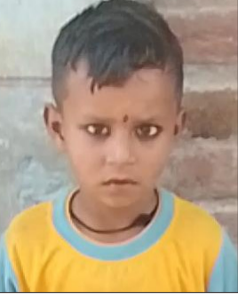
मृतक मिलन का फाइल फोटो।

न्यूरिया। मझोला बाजार में दर्दनाक सड़क हादसे में 4 वर्षीय मासूम की मौत हो गई, जबकि उसकी गर्भवती मां गंभीर रूप से घायल हो गई। हादसा उस समय हुआ जब परिवार अल्ट्रासाउंड कराने बाजार आया था और फल खरीदने के लिए सड़क किनारे रुका था।