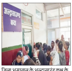
जिला अस्पताल के अल्ट्रासाउंड कक्ष के बाहर खड़े रोगी।

रामपुर। जिला अस्पताल में अल्ट्रासाउंड जांच के लिए मरीजों को दो से तीन दिन का इंतजार करना पड़ रहा है। बढ़ती भीड़ के कारण मरीजों को चिलचिलाती गर्मी में घंटों लाइन में खड़े रहना पड़ रहा है, जिससे उनकी परेशानी बढ़ गई है। अल्ट्रासाउंड रेडियोलॉजिस्ट डॉ. एस के राना का कहना मरीजों की संख्या बढ़ रही है रोजाना साठ से सत्तर अल्ट्रासाउंड हो रहे हैं सौ से अधिक मरीज आ रहे हैं। अस्पताल के अल्ट्रासाउंड सेंटर पर प्रतिदिन 100 से अधिक मरीज जांच कराने पहुंचते हैं। उपलब्ध यंत्रण और संसाधनों के चलते एक दिन में केवल 60 से 70 मरीजों का ही अल्ट्रासाउंड हो पाता है। इस वजह से मरीजों की लंबी कतारें लगा रही हैं। जांच के लिए कई दिनों का इंतजार करना पड़ रहा है। अल्ट्रासाउंड सेंटर के बाहर