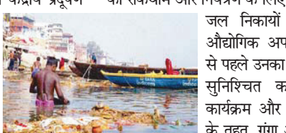
जल निकायों में सीवेज और औद्योगिक अपशिष्टों के निर्वहन से पहले उनका आवश्यक उपचार सुनिश्चित करें। नमामि गंगे कार्यक्रम और एनआरसीपी दोनों के तहत, गंगा और देश की अन्य

प्रतिदिन की सीवेज उपचार क्षमता का सृजन किया है। ज्ञात हो कि गंगा बेसिन 11 राज्यों में फैला हुआ है, जो भारत के 27 फीसदी भूमि क्षेत्र को कवर करता है और 47 फीसदी जनसंख्या को पोषण प्रदान करता है। दक्षिण भारत के तेलंगाना में मूसी नदी, गोदावरी, कृष्णा, नर्मदा, कावेरी, महानदी और पेरियार नामक छह नदी बेसिनों की प्रदूषण मुक्ति के लिए कार्य चल रहा है। नमामि गंगे कार्यक्रम के अलावा केंद्रीय प्रदूषण नियंत्रण बोर्ड (सीपीसीबी), गंगा नदी के पांच मुख्य धारा वाले राज्यों उत्तराखंड, उत्तर प्रदेश, बिहार, झारखंड और पश्चिम बंगाल में 112 स्थानों पर गंगा नदी की जल गुणवत्ता की मैन्युअल निगरानी करता है। केंद्रीय प्रदूषण नियंत्रण बोर्ड की प्रदूषित नदी खंडों (पीआरएस) पर वर्ष 2018 और वर्ष 2025 की रिपोर्टों के अनुसार गंगा नदी के मुख्य प्रवाह की जल गुणवत्ता में सुधार हुआ है। इसके अतिरिक्त वर्ष 2025 (जनवरी से अगस्त) के दौरान गंगा नदी के जल गुणवत्ता आंकड़ों (मीडियन वैल्यू) के आधार पर यह पाया गया है कि गंगा नदी के सभी स्थानों पर पीएच और युरीय ऑक्सीजन (डीओ) स्नान मानदंडों के लिए निर्धारित मानकों को पूरा करते हैं। तथापि, उत्तर प्रदेश में फर्रुखाबाद से कानपुर में पुराना राजापुर, रायबरेली में डलमऊ और मिर्जापुर अनुप्रवाह से तारीघाट, गाजीपुर के स्थानों व हिस्सों को छोड़कर उत्तराखंड, झारखंड, बिहार और पश्चिम बंगाल में गंगा नदी के पूरे प्रवाह में जैव-रासायनिक ऑक्सीजन मांग (बीओडी) मानकों के अनुरूप पाया गया है। वर्ष 2024-25 के दौरान गंगा