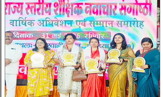
पुरस्कार के साथ मौजूद शिक्षिकाएं।