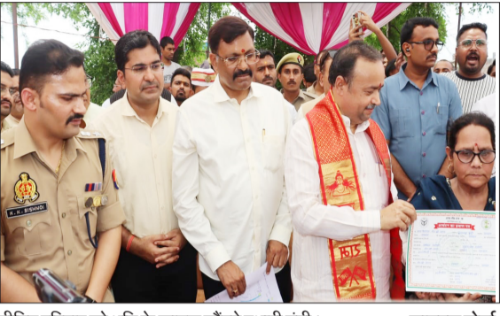
पीड़ित परिवार को भूमि के कागज सौंपते प्रभारी मंत्री। -जागरण मोर्चा की 100 वर्ग मीटर भूमि का पट्टा प्रदान किया गया। प्रभारी मंत्री एवं

● संभल में योगी सरकार की बड़ी पहल, गाटा संख्या 143 की 100 वर्ग मीटर भूमि का पट्टा पीड़ित परिवार को सौंपा