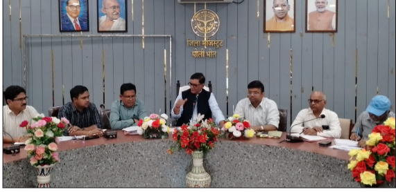
पौधारोपण को लेकर मीटिंग में भाग लेते डीएम व अन्य।

जागरण मोर्चा कार्यालय तहत पौधारोपण कराने के निर्देश दिए। उन्होंने पर्यावरण संरक्षण, जनजागरूकता और वृक्षारोपण कार्यक्रमों में युवाओं तथा स्कूली बच्चों की अधिकाधिक भागीदारी सुनिश्चित करने पर जोर दिया। बैठक में विभिन्न स्थानों पर वृक्षारोपण, प्लास्टिक उन्मूलन अभियान तथा पर्यावरण संरक्षण की शपथ दिलाने जैसे कार्यक्रमों की रूपरेखा को अंतिम रूप दिया गया। बैठक में मुख्य विकास अधिकारी सहित विभिन्न विभागों के अधिकारी उपस्थित रहे।