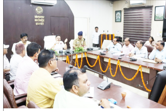
पुलिस अधिकारियों के साथ बैठक करते एसपी।