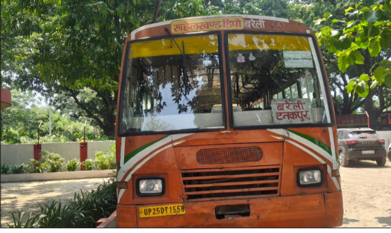
इसी बस ने मारी बाइक को टक्कर।