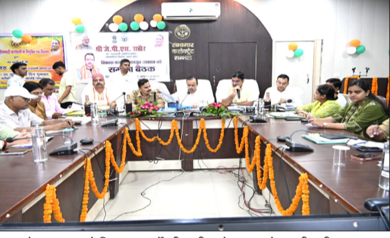
कलक्ट्रेट सभागार में विकास कार्यों की समीक्षा बैठक करते प्रभारी मंत्री।

● योजनाओं का लाभ हर पात्र तक पहुंचाने पर जोर