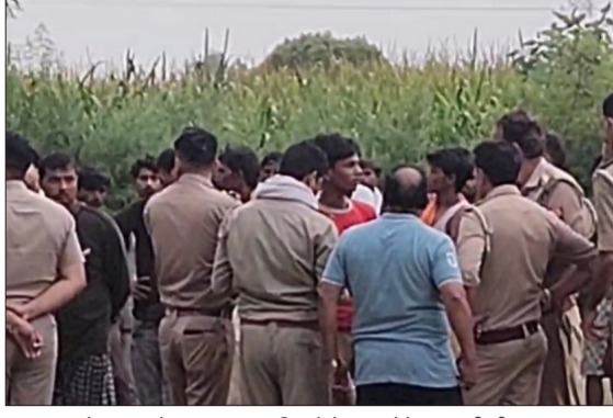
सहस्रवान के जंगल में युवक का शव मिलने के बाद मौके पर लगी भीड़।

बदायूं। सहस्रवान कोतवाली क्षेत्र में उस समय सनसनी फैल गई जब जंगल में एक युवक का शव पेड़ पर फंदे से लटका हुआ मिला। घटना की सूचना मिलते ही आसपास के ग्रामीणों की भीड़ मौके पर जमा हो गई और तुरंत पुलिस को इसकी जानकारी दी गई। सूचना पाकर पुलिस टीम मौके पर पहुंची और घटनास्थल का जायजा लेते हुए जांच शुरू कर दी।