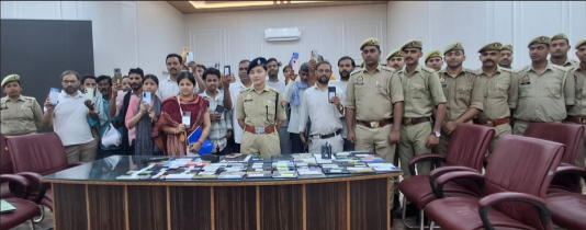
मोबाइल दिखाते पीड़ित।

बरेली। मोबाइल फोन गुम होने के बाद उसके वापस मिलने की उम्मीद अक्सर खत्म हो जाती है, लेकिन बरेली पुलिस ने एक बार फिर अपनी तकनीकी दक्षता और सक्रिय कार्रवाई से सैकड़ों लोगों के चेहरों पर मुस्कान लौटा दी। मई माह में चलाए गए विशेष अभियान के दौरान पुलिस ने 462 गुमशुदा मोबाइल फोन बरामद कर उनके वास्तविक मालिकों को सौंप दिए। बरामद मोबाइलों की अनुमानित कीमत करीब 95 लाख रुपये आंकी गई है।