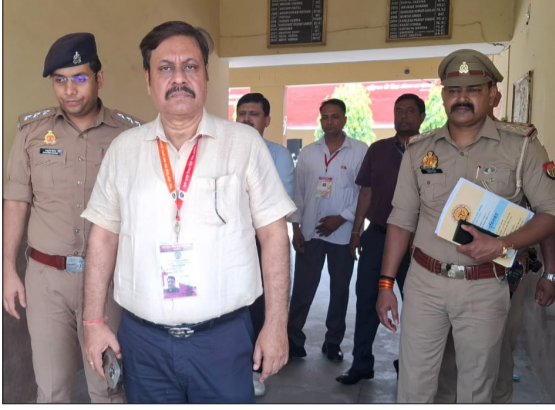
परीक्षा केंद्रों का निरीक्षण करते अधिकारी।