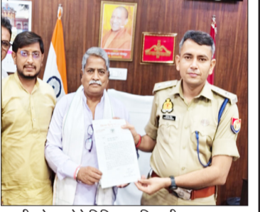
एसपी को पत्र देते विहिप पदाधिकारी।