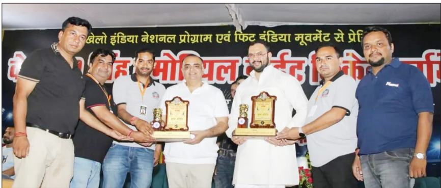
मुख्य अतिथि का स्वागत करते पदाधिकारी।