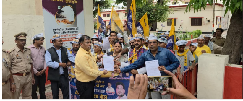
ज्ञापन देते आम आदमी पार्टी के कार्यकर्ता।