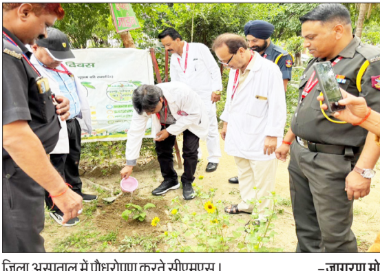
जिला अस्पताल में पौधरोपण करते सीएमएस।