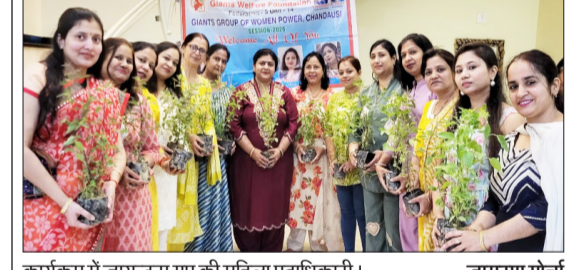
कार्यक्रम में जायन्ट्स ग्रुप की महिला पदाधिकारी।