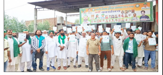
मनोनयन पत्र दिखाते किसान।