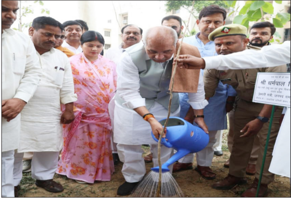
पौधरोपण करते प्रभारी मंत्री धर्मपाल सिंह एवं मौजूद लोग।

रामपुर। विश्व पर्यावरण दिवस के अवसर पर रामपुर जनपद में प्रकृति के संरक्षण और हरित आवरण को बढ़ाने के लिए एक महाअभियान का आगाज हुआ है। सरकार की महत्वाकांक्षी योजना और नमामि गंगे के तत्वावधान में एक पेड़ मां के नाम और एक कदम हरित भविष्य के नाम अभियान के तहत जिले भर में कुल 4 लाख 58 हजार पौधे रोपने का विशाल लक्ष्य निर्धारित किया गया है। प्रदेश के पशुधन एवं दुग्ध विकास मंत्री व जिले के प्रभारी मंत्री धर्मपाल सिंह ने ग्रुप केंद्र सीआरपीएफ में पौधरोपण कर इस महाअभियान का विधिवत शुभारंभ किया। शासन द्वारा प्रदेश भर में एक दिन में 5 करोड़ पौधे लगाने के तय किए गए वृहद लक्ष्य