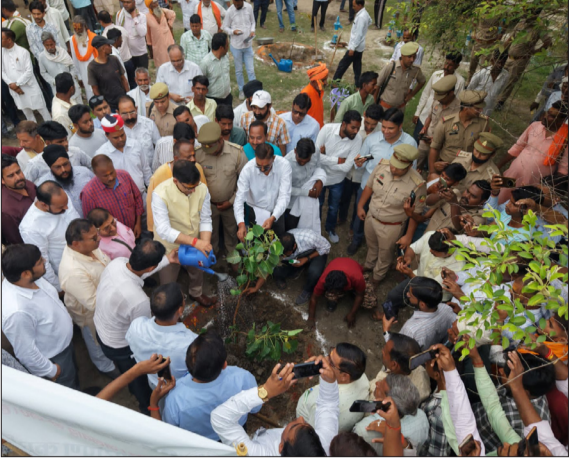
विश्व पर्यावरण दिवस पर एसीपी व अन्य संगठनों ने किया पौधरोपण।