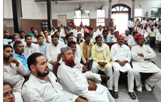
समीक्षा बैठक में मौजूद समाजवादी पार्टी के कार्यकर्ता।

कि जल्द ही बदमाशों को गिरफ्तार कर घटना का खुलासा किया जाएगा। वहीं, इस घटना के बाद क्षेत्र के लोगों ने पुलिस गश्त बढ़ाने की मांग की है, ताकि इस तरह की वारदातों पर अंकुश लगाया जा सके।