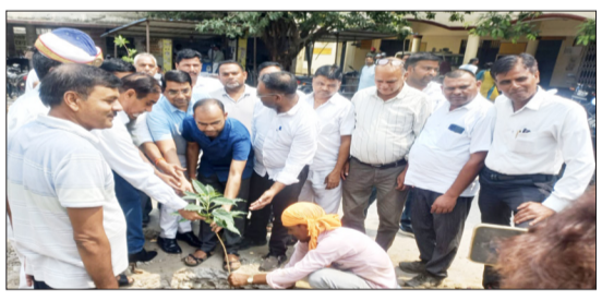
पौधरोपण करते अधिकारी।