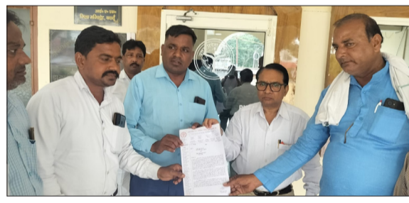
ज्ञापन सौंपते बिजली विभाग के संविदा कर्मचारी।