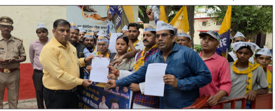
बिजली से जुड़ी समस्याओं को लेकर ज्ञापन सौंपते आम आदमी पार्टी के कार्यकर्ता।