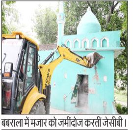
बबराला में मजार को जमींदोज करती जेसीबी।