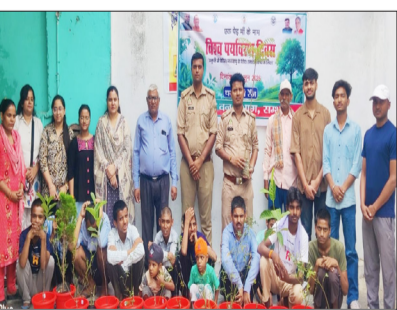
पौधारोपण करते आकांक्षा सोसायटी के पदाधिकारी।