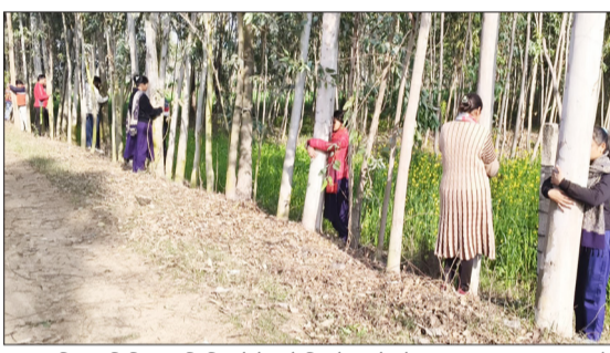
वृक्ष आलिंगन चिकित्सा शिविर में पेड़ से चिपके खड़े लोग। -जागरण मोर्चा

इसे जापानी संस्कृति में 'शिनरिन-योक्' या 'फॉरेस्ट वाथिंग' का हिस्सा माना जाता है। आयुर्वेद और प्राचीन भारतीय चिकित्सा पद्धति वृक्षारुच्युर्वेद के अनुसार, ट्री हग थेरेपी (वृक्ष आलिंगन चिकित्सा) मुख्य रूप से शरीर के तीन दोषों वात, पित्त और कफ के असंतुलन को ठीक करती है। आयुर्वेद के अनुसार, पेड़ जीवंत और सकारात्मक ऊर्जा के महासागर हैं। जब हम किसी बड़े