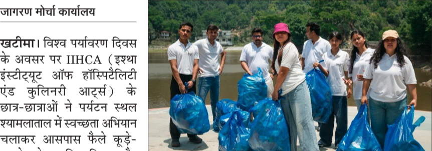
पर्यटक स्थल पर कूड़ा एकत्रित करते विद्यार्थी।

इस दौरान छात्र-छात्राओं ने श्यामलाताल क्षेत्र में बांज के पौधों का वृक्षारोपण भी किया तथा उनकी सुरक्षा और सिंचाई की व्यवस्था सुनिश्चित करने का संकल्प लिया। छात्र-छात्राओं ने कहा कि केवल पौधे लगाना ही नहीं, बल्कि उनकी देखभाल करना भी उतना ही आवश्यक है। छात्र-