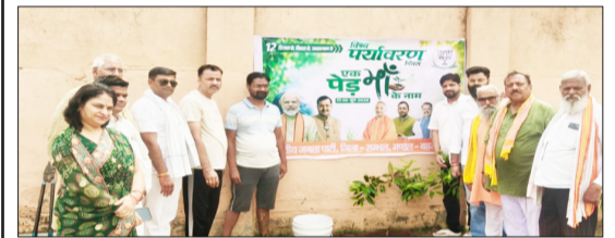
पौधारोपण कार्यक्रम में मौजूद भाजपाई।