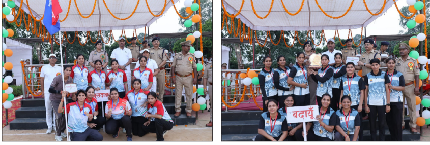
पुलिस प्रतियोगिता समापन के बाद पुरस्कार प्राप्त पाकर खुश होते प्रतिभागी।