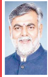
प्रह्लाद सिंह पटेल

(लेखक पंचायत एवं ग्रामीण विकास और श्रम मंत्री हैं)