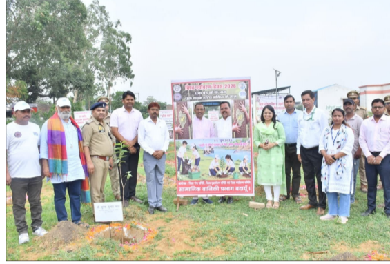
पर्यावरण दिवस पर मां के नाम एक पेड़ लगाते जनप्रतिनिधि व प्रशासनिक अधिकारी।