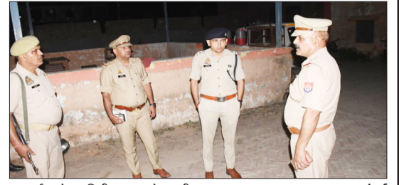
पटवाई थाने का निरीक्षण करते एसपी।