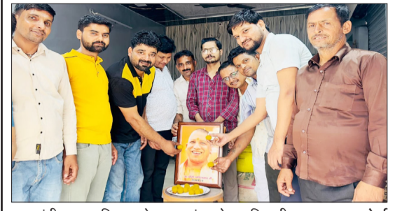
मुख्यमंत्री का जन्मदिन मनाते व्यापार मंडल के पदाधिकारी।