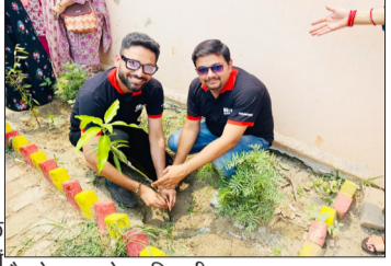
पौधरोपण करते पदाधिकारी।

रामपुर। विश्व पर्यावरण दिवस के अवसर पर सामाजिक संस्था मदद एक आस फाउंडेशन द्वारा पौधरोपण कार्यक्रम कोसी मन्दिर चौकी में आयोजन किया गया। इस अभियान के तहत संस्था के पदाधिकारियों और सदस्यों ने विभिन्न औषधीय और