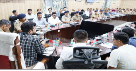
पुलिस लाइन में बैठक लेते डीएम-एसपी।

8,9 और 10 जून को दो पालियों में होगी परीक्षा