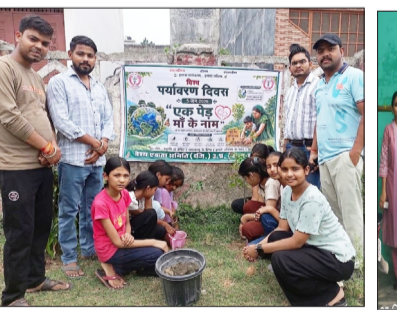
पौधारोपण करते वैश्य एकता समिति के पदाधिकारी।