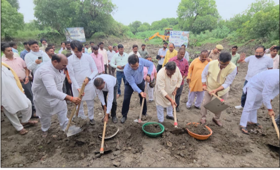
इकोत्तरनाथ मंदिर पर गोमती नदी की सफाई करते डीएम-विधायक।