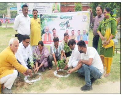
पौधारोपण करते भाजपाई।