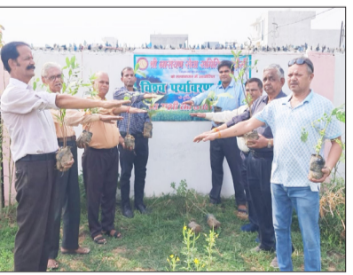
शपथ लेते श्री नारायण सेवा समिति के पदाधिकारी।