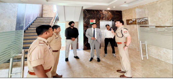
कोसी नदी स्थित होटल द रिवर साइड इन में जानकारी देते सीएफओ।