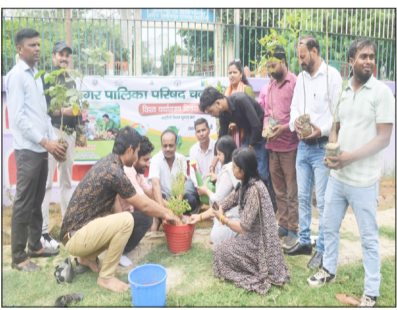
पौधारोपण करती पालिकाध्यक्ष व कर्मचारी।