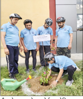
पौधारोपण करते बहजोई एथलेटिक्स क्लब के पदाधिकारी।

बहजोई। विश्व पर्यावरण दिवस के अवसर पर बहजोई एथलेटिक्स क्लब द्वारा पर्यावरण संरक्षण और जनजागरूकता को समर्पित एक प्रेरणादायी अभियान आयोजित किया गया। कार्यक्रम के अंतर्गत क्लब के पांच सदस्यों ने सुबह 5 बजे 5 किलोमीटर की साइकिल यात्रा कर पर्यावरण