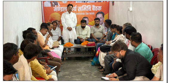
कार्यसमिति बैठक में भाग लेते पदाधिकारी।