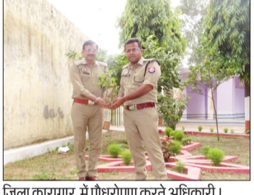
जिला कारागार में पौधरोपण करते अधिकारी।

रामपुर। विश्व पर्यावरण दिवस के अवसर पर जिला कारागार में वृक्षरोपण कार्यक्रम का आयोजन किया गया। कार्यक्रम में कारागार परिसर में विभिन्न प्रजातियों के कुल 150 पौधों का रोपण किया गया। इस अवसर पर कारागार प्रशासन द्वारा पर्यावरण संरक्षण, हरित