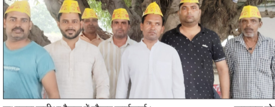
सुभासपा समीक्षा बैठक में मौजूद कार्यकर्ता।