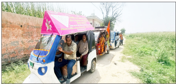
ई-रिक्शा व इलेक्ट्रिक वाहनों से 24 कोसीय परिक्रमा लगाते श्रद्धालु।

संभल। ऐतिहासिक एवं पौराणिक 24 कोसीय मासिक परिक्रमा इस बार आस्था, पर्यावरण संरक्षण और स्वच्छ ऊर्जा के अनूठे संगम के रूप में संपन्न हुई। 24 कोसीय मासिक परिक्रमा समिति के तत्वावधान में आयोजित परिक्रमा में सैकड़ों श्रद्धालुओं ने ई-रिक्शा, इलेक्ट्रिक स्कूटर, इलेक्ट्रिक कारों तथा पैदल यात्रा के माध्यम से भाग लेकर हरित परिवहन को बढ़ावा देने का संदेश दिया। प्रधानमंत्री नरेंद्र मोदी के स्वच्छ ऊर्जा और पर्यावरण संरक्षण संबंधी आह्वान से प्रेरित इस विशेष परिक्रमा का शुभारंभ प्रातः श्री वंशगोपाल तीर्थ, बेनीपुर से हुआ। श्रद्धालुओं ने तीर्थ पर स्थित शिवलिंग का जलाभिषेक कर पूजा-अर्चना की।