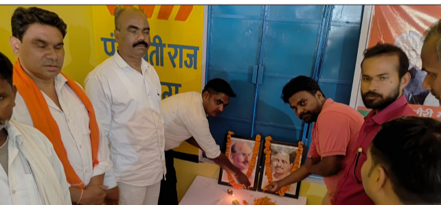
भाजपा कार्यसमिति बैठक में भाग लेते कार्यकर्ता।