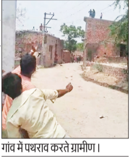
गांव में पथराव करते ग्रामीण।

हसनपुर। कोतवाली क्षेत्र के गांव बाटपुरा में पुरानी रंजिश को लेकर दो पक्ष आमने-सामने आ गए। विवाद इतना बढ़ गया कि दोनों ओर से जमकर पथराव हुआ। घटना का लाइव वीडियो सोशल मीडिया पर वायरल होने के बाद क्षेत्र में हड़कंप मच गया। सूचना मिलते ही कोतवाली पुलिस मौके पर पहुंची और स्थिति को नियंत्रित करने में जुट गई। पुलिस ने गांव में सुरक्षा व्यवस्था बढ़ा दी है और दोनों पक्षों के लोगों को समझाने का प्रयास किया जा रहा है। वायरल वीडियो के आधार पर भी मामले की जांच की जा रही है। पुलिस का कहना है कि हालात फिलहाल नियंत्रण में हैं और शांति व्यवस्था बनाए रखने के लिए आवश्यक कार्रवाई की जा रही है।