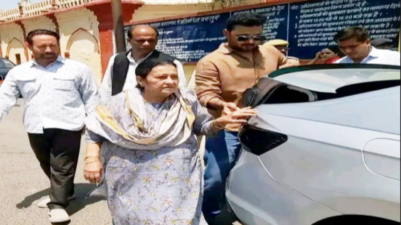
पति और बेटे से जेल में मिलने के बाद बाहर आती पूर्व सांसद एवं अन्य।

रामपुर। 17 नवंबर से दो पैन कार्ड मामले में सजा काट रहे सपा नेता आजम खा और उनके बेटे अब्दुल्ला आजम से पूर्व सांसद तजीन फात्मा ने जिला कारागार में जाकर उनसे मुलाकात की। जिसमें घर से लेकर अन्य तथ्यों पर वार्तालाप हुई। हालांकि पूर्व सांसद ने मीडिया से बातचीत नहीं की। सूबे में सपा सरकार जाने के बाद सत्ता में आई भाजपा सरकार ने आजम खां और उनके परिवार पर शिकंजा कसना शुरू कर दिया था जिसके बाद सपा नेता आजम खां और उनके परिवार के सदस्यों पर उनकी 200