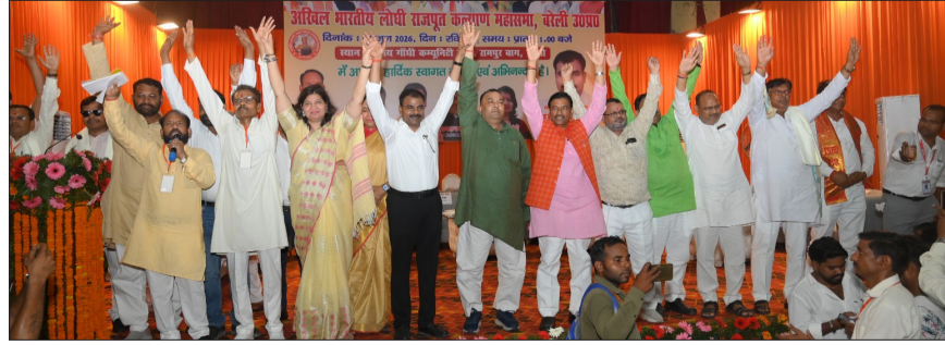
मंच पर मौजूद मुख्य अतिथि एवं पदाधिकारी।