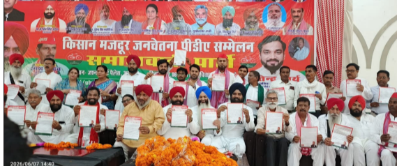
किसान-मजदूर जनचेतना पीडीए सम्मेलन में मौजूद कार्यकर्ता व पदाधिकारी।