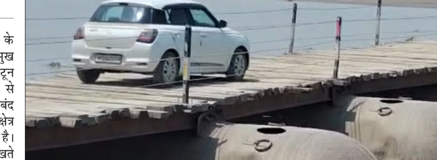
धनाराघाट पेंटून पुल।

पूरनपुर। क्षेत्र के लोगों के लिए आवागमन का प्रमुख साधन बने धनाराघाट पेंटून पुल को आगामी 15 जून से बंद किया जाएगा। पुल बंद होने की सूचना मिलते ही क्षेत्र के ग्रामीणों में चिंता बढ़ गई है। बरसात के मौसम को देखते हुए हर वर्ष की भांति इस बार भी पेंटून पुल को नदी में जलस्तर बढ़ने और तेज बहाव की संभावना के चलते प्रशासन द्वारा यह निर्णय लिया गया है। 15 जून के बाद पुल पर आवागमन पूरी तरह बंद कर दिया जाएगा। धनाराघाट पेंटून पुल के माध्यम से क्षेत्र के अनेक गांवों के लोग तहसील, ब्लॉक मुख्यालय, बाजार, स्कूल, कॉलेज और स्वास्थ्य सेवाओं तक आसानी से पहुंचते हैं। पुल बंद होने के बाद ग्रामीणों को कई किलोमीटर