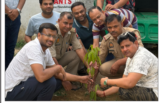
पौधारोपण करते संस्था के लोग।