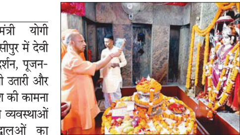
लोकार्पण-शिलान्यास के बाद मंदिर में रात्रि विश्राम किया। शनिवार सुबह दर्शन-पूजन के

गोरक्षपीठाधीश्वर एवं मुख्यमंत्री योगी आदित्यनाथ ने शनिवार सुबह तुलसीपुर में देवी शक्तिपीठ मां पाटेश्वरी मंदिर में दर्शन, पूजन-अर्चन किया। उन्होंने मां की आरती उतारी और सुखी, स्वस्थ एवं समृद्ध उत्तर प्रदेश की कामना की। मुख्यमंत्री ने मंदिर परिसर की व्यवस्थाओं का जायजा लिया और श्रद्धालुओं का अभिवादन भी किया। योगी शुक्रवार को बलरामपुर पहुंचे। यहां विकास कार्यों के