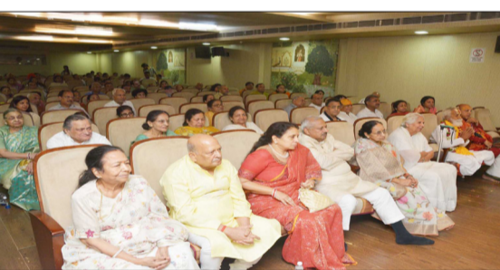
भागवत कथा सुनते भक्त।