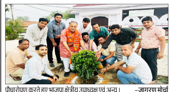
पौधारोपण करते हुए भाजपा क्षेत्रीय उपाध्यक्ष एवं अन्य।