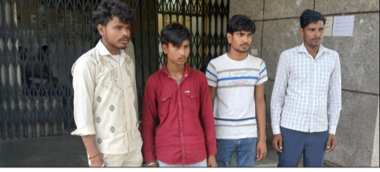
पोस्टमार्टम हाउस पर जानकारी देते परिजन।

मुसाझाग थाना क्षेत्र के गांव हथनीभूड़ की घटना, युवक की मौत से परिवार में मचा कोहराम