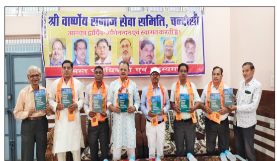
पुस्तक का विमोचन करते पदाधिकारी।