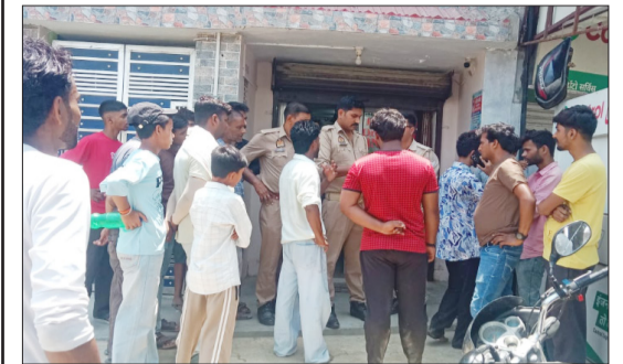
मसवासी के गांव बिजारखाता में मारपीट के बाद जमा भीड़ और पुछताछ करती पुलिस।