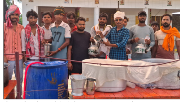
भौषण गर्मी के बीच राहगीरों को मीठा शरबत पिलाते ग्रामवासी।